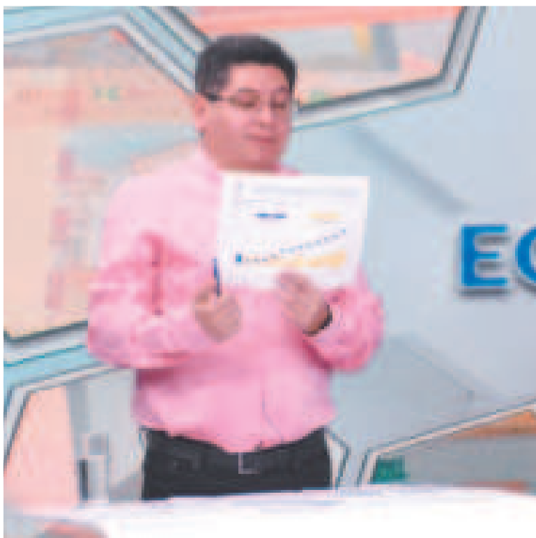
El ministro de Economía y Finanzas Públicas, Marcelo Montenegro, en entrevista.