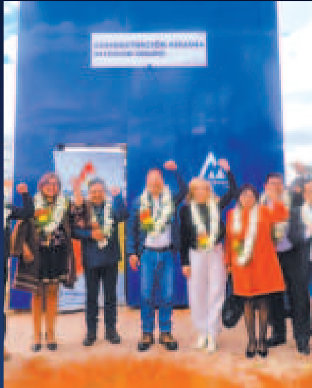
Autoridades nacionales en el acto de la Aduana Nacional.

“Hemos invertido para darles mejor calidad de vida aquí, a San Isidro, hermanas y hermanos (...) Hoy día, en esta presentación estamos dejando en obras para Oruro 36 millones de bolivianos, directamente en beneficio para las hermanas y hermanos orureños. Y lo hacemos en momentos en que no tenemos los recursos que teníamos antes, pero estamos trabajando justamente para que eso vuelva a tener Bolivia”, enfatizó el presidente Arce.