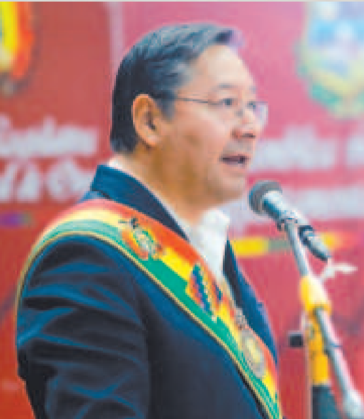
El presidente Luis Arce durante su discurso en la Sesión de Honor en Oruro.

Durante la Sesión de Honor por la efeméride de Oruro, el presidente Arce destacó inversiones estratégicas para transformar el potencial energético.