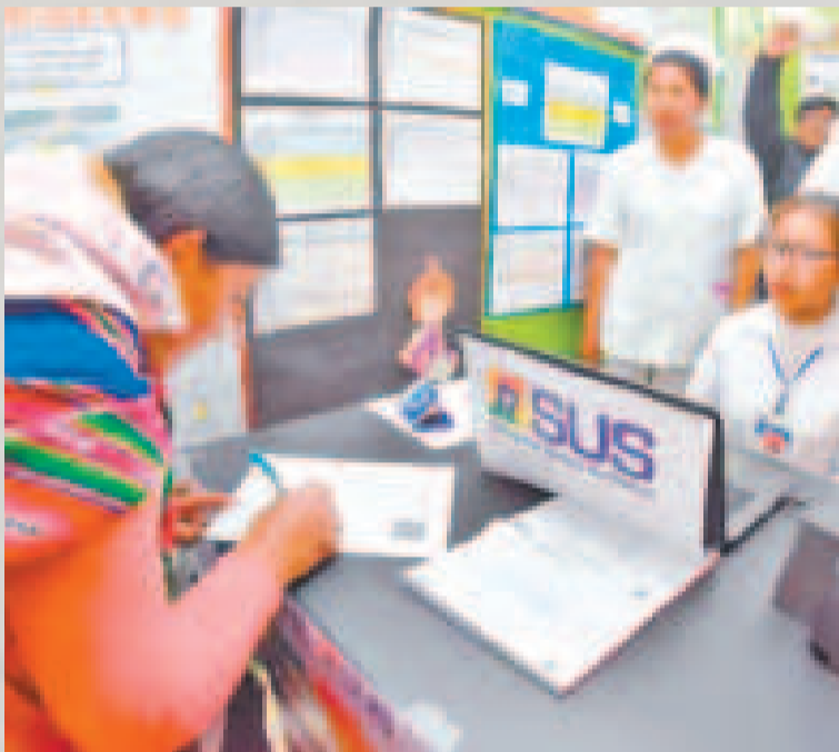
Filiación al Sistema Único de Salud.