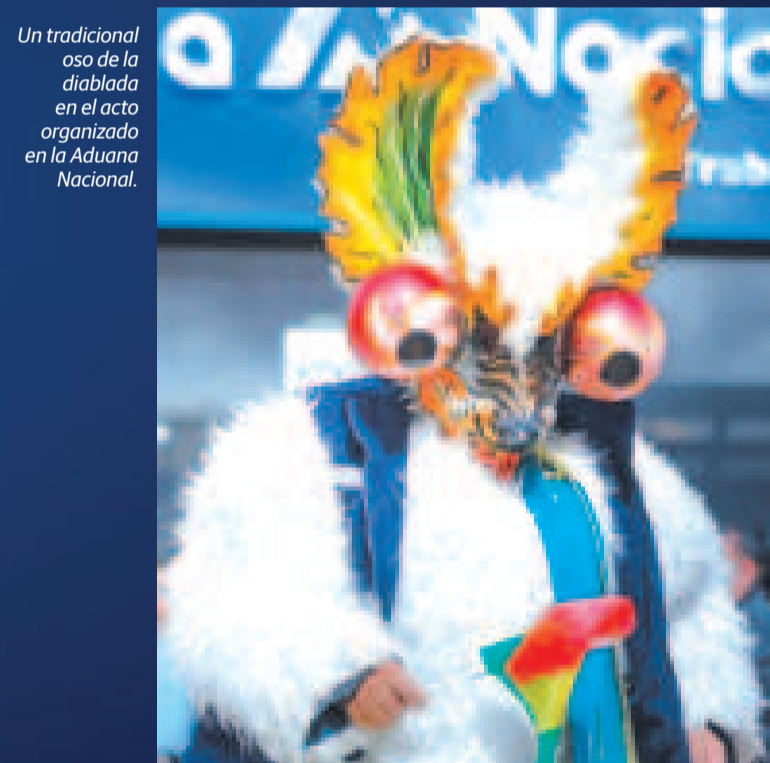
Un tradicional oso de la diablada en el acto organizado en la Aduana Nacional.