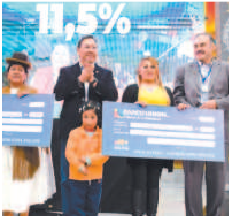
El presidente Luis Arce junto a gremialistas beneficiarias del CrediGremial.