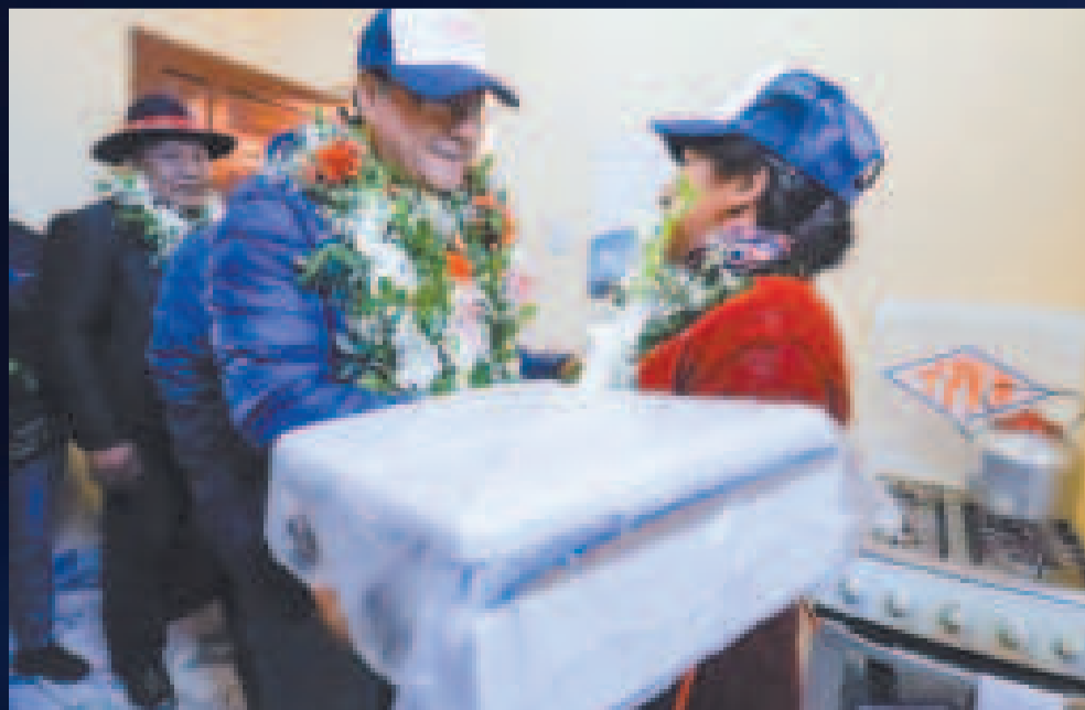
El presidente Luis Arce con una beneficiaria de las redes de gas.