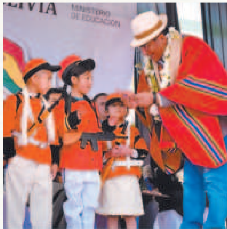
Entrega del Bono Juancito Pinto.

Luis Arce Catacora Presidente del Estado