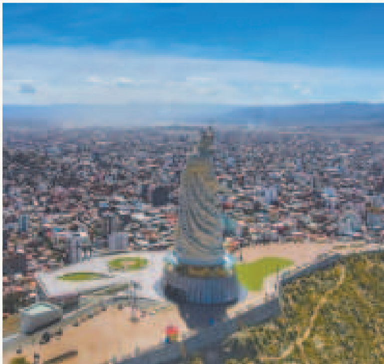
La ciudad de Oruro.