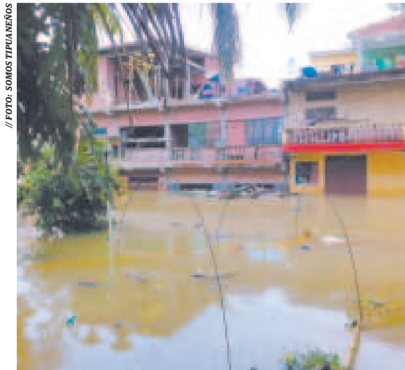
El agua inundó varias viviendas en Tipuani.

La comunidad enfrenta dificultades en las comunicaciones, ya que la señal telefónica en la zona es deficiente. No obstante, las autoridades mantienen contacto con los representantes locales, se informó desde la Alcaldía de La Paz.