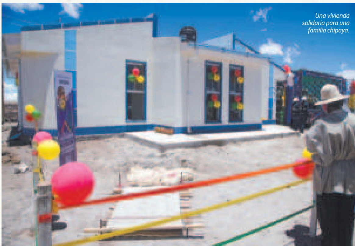
Una vivienda solidaria para una familia chipaya.