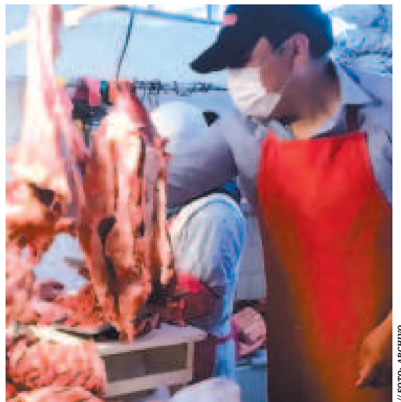
El comercio de carne de res en los mercados tiende a estabilizarse.

“Cuando dicen que el Gobierno está minando a los exportadores, queremos aclarar que no es el Gobierno el que lo hace, sino el propio sector ganadero. Hemos mostrado dónde está el error: el incremento del precio del kilogramo vivo, que pasó de 12 bolivianos a 21 bolivianos en el último año”, subrayó.