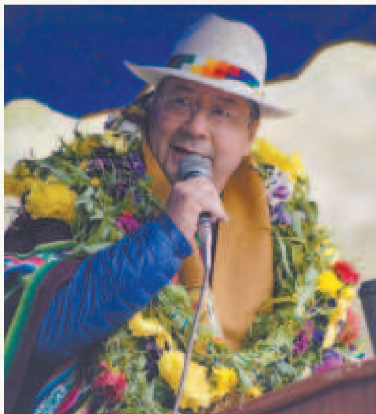
El presidente Luis Arce.

Luis Arce Catacora Presidente de Bolivia