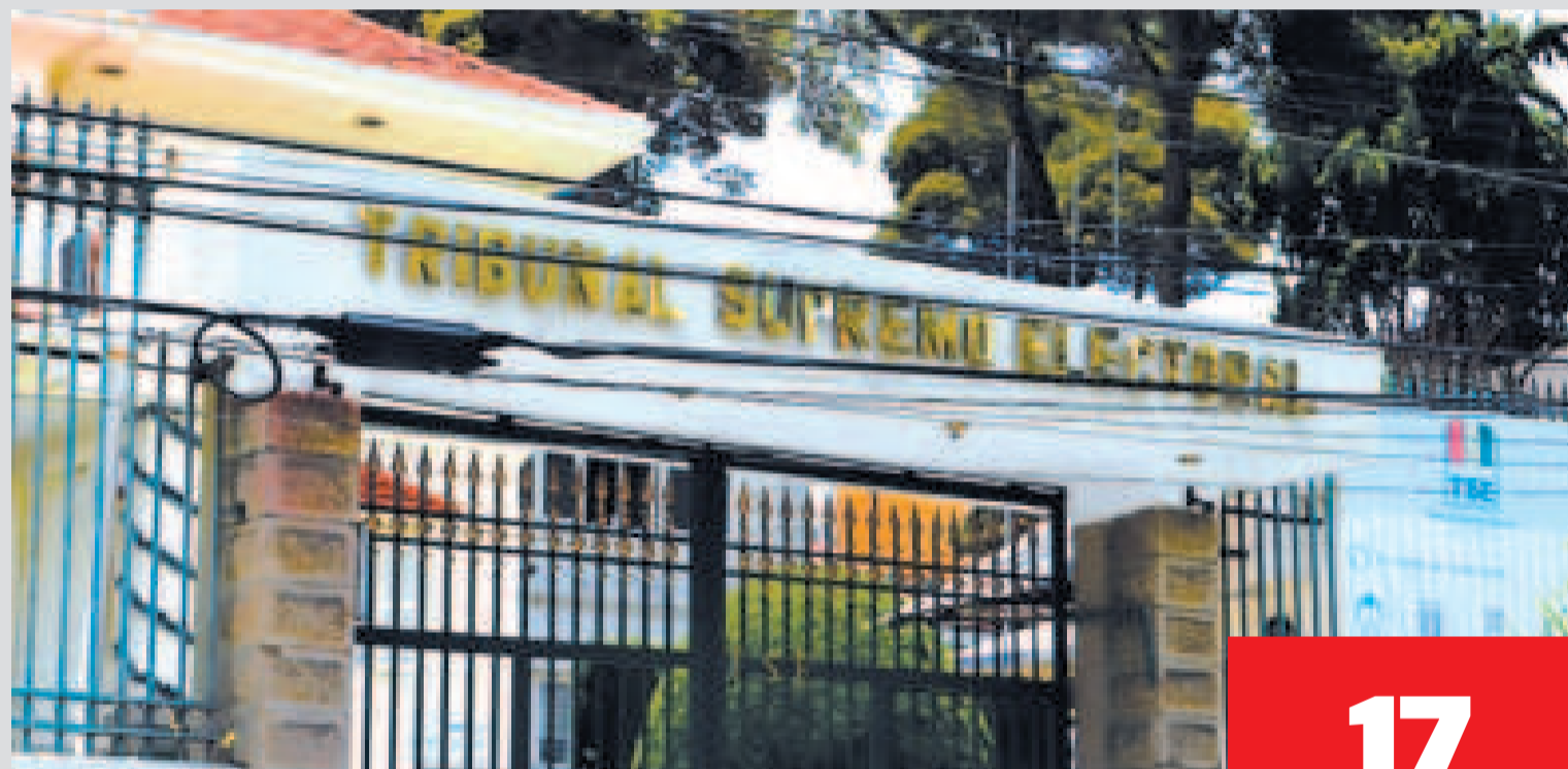
Frontis del TSE en La Paz.

Ante el anuncio de movilizaciones por parte del evismo para exigir la inscripción de Morales, el vocal Ávila expresó la necesidad de cuidar y respetar la democracia.