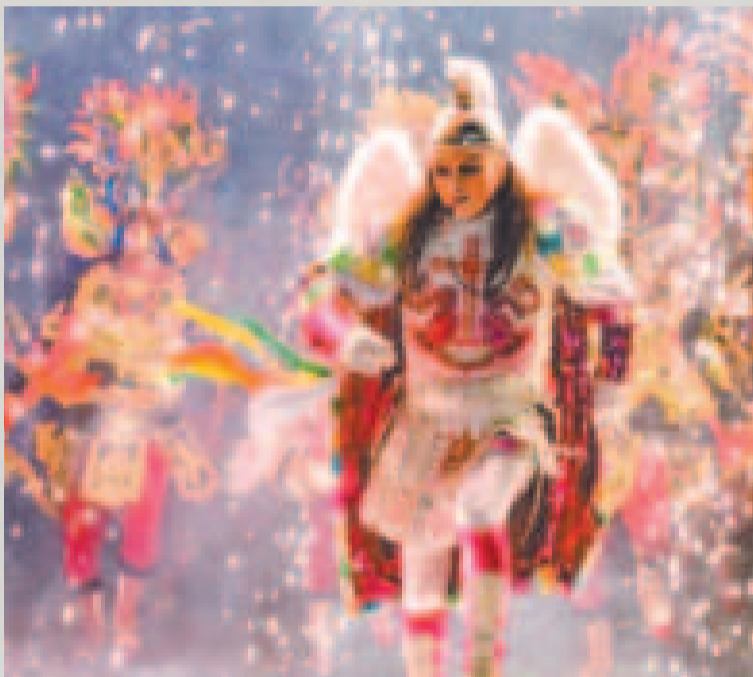
La danza de la diablada en el Carnaval de Oruro.