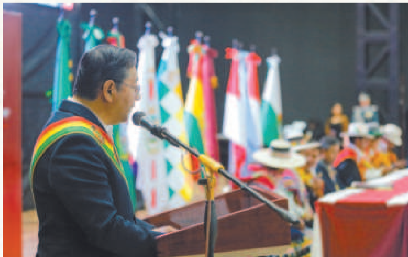
El presidente Luis Arce en la Sesión de Honor de Oruro.

“Para estas obras prevemos una inversión de 31 millones de bolivianos; el segundo distribuidor es el puente paso a desnivel de la avenida Villarroel con una inversión de 25 millones de