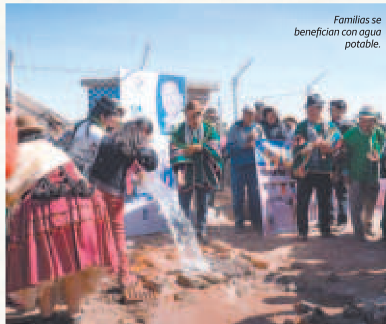
Familias se benefician con agua potable.

Actualmente, en ejecución se tienen 12 proyectos adicionales, con una inversión de más de