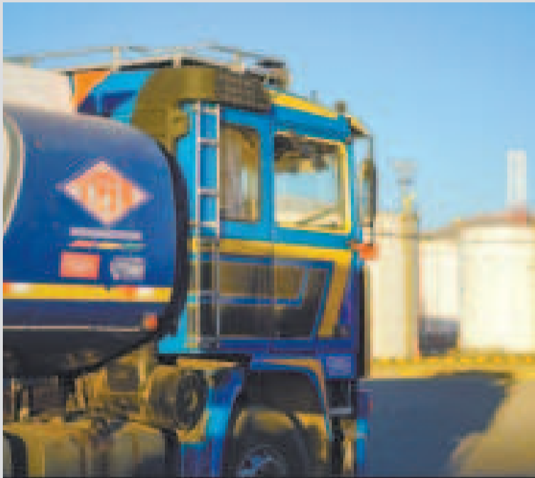
Un camión cisterna en una planta de almacenaje de YPFB.