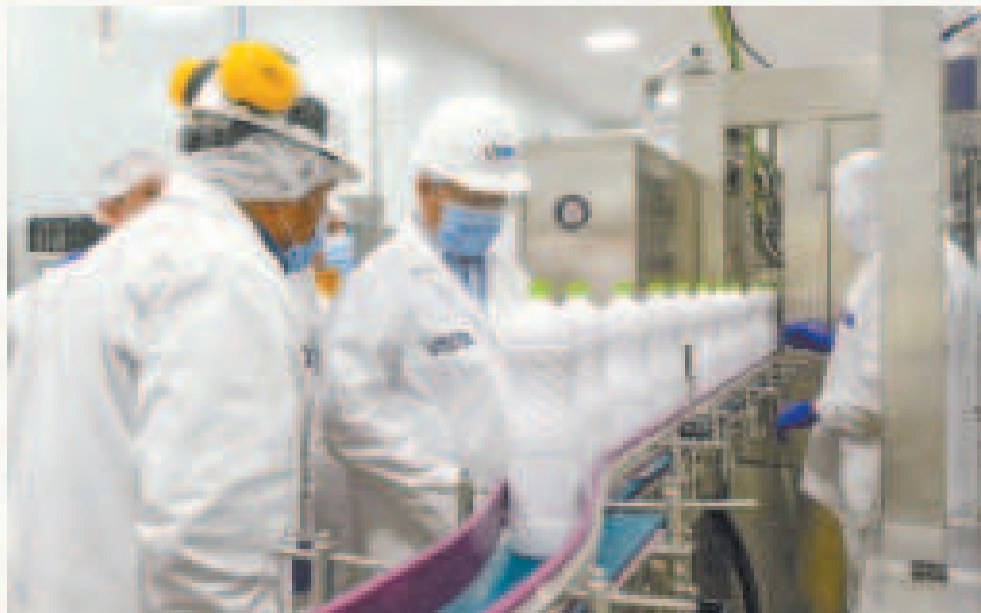
El presidente Luis Arce durante la inauguración del proyecto de ampliación de la Planta de Procesamiento de Lácteos, en Challapata.

La celebración del 244 aniversario de Oruro se convierte así en un punto de inflexión hacia un futuro próspero y autosuficiente, impulsado por la industrialización y el compromiso del Gobierno nacional.