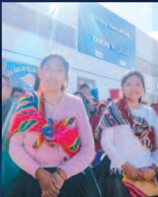
Jóvenes presentes en la entrega de la unidad educativa Carlos Villegas.