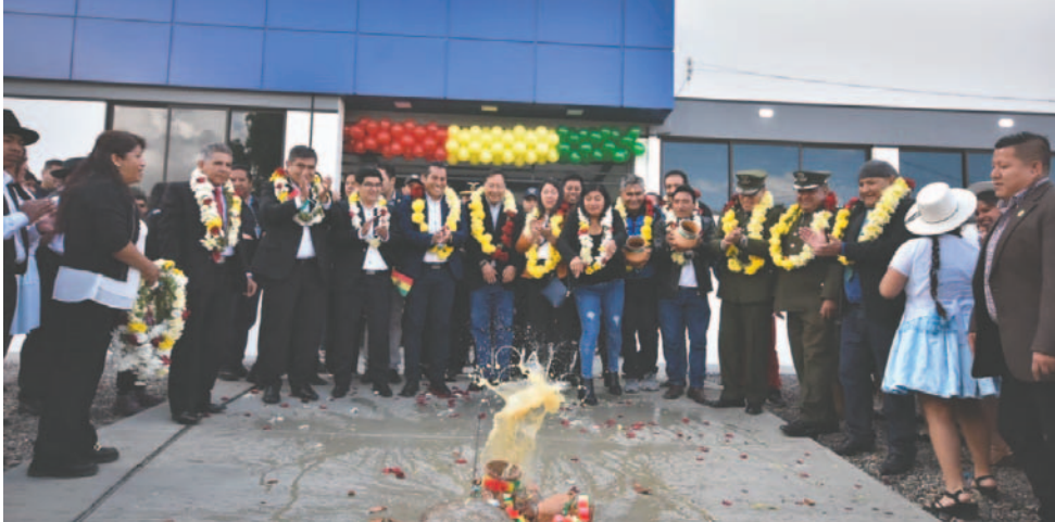
El Presidente Arce y otras autoridades en el inicio de las actividades educativas