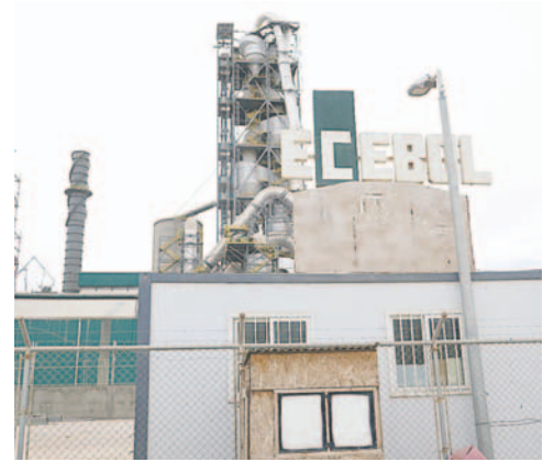
Circularon rumores sobre la paralización de actividades en Ecebol / LA PATRIA

“De un tiempo a esta parte se podría decir que la empresa ha ido en declive, hoy no produce cemento, no hay bolsas de cemento desde el mes de diciembre y creo que las empresas están perdiendo