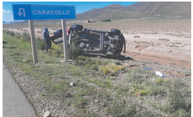
Dos ocupantes del coche fueron socorridos a un centro de salud

Uniformados remolcaron la vagoneta marca Suzuki de color rojo, con placa de control 2999-XYU, que presentaba daños materiales en su estructura.