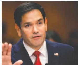
El secretario de Estado de Estados Unidos, Marco Rubio

El secretario de Estado de Estados Unidos, Marco Rubio, anunció su designación como director interino de la Agencia para el Desarrollo Internacional (Usaid), tras denunciar problemas de alineación entre los proyectos de la agencia y los intereses de la política exterior estadounidense. El anuncio se realizó durante un viaje oficial a El Salvador el lunes 3 de febrero de 2025.