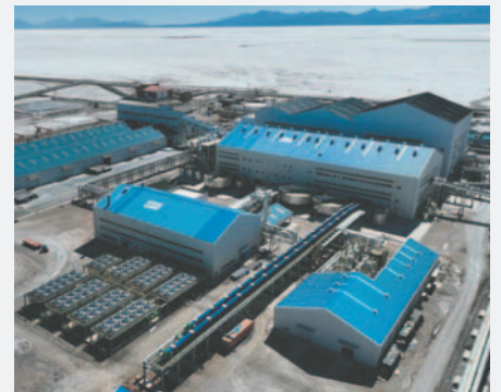
La planta industrial de litio en Uyuni