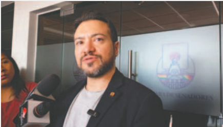
El diputado de Comunidad Ciudadana, Alejandro Reyes