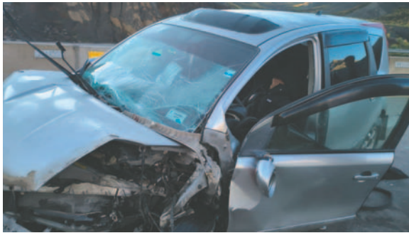
El impacto contra la baranda de seguridad dejó daños materiales en el coche

Agregó que los integrantes de la familia partieron de