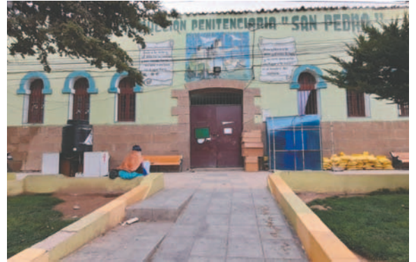
La justicia dispuso una detención preventiva por 30 días en el penal de San Pedro

Indicó que secuestraron el celular del involucrando hallando imágenes con contenido sexual, por lo que será sometido a una pericia informática del Instituto de Investigaciones Forenses (IDIF) para establecer si las imágenes corresponden a menores de edad. El implicado alegó que eran sus exparejas.