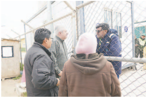
Legisladores de CC no pudieron ingresar a fiscalizar

Por su parte, los diputados que intentaron hacer la inspección aseguraron que los argumentos que les dieron en la puerta eran otros, y que la visita del 28 de enero se hizo mediante misivas envidas antes, pero que se les negó el ingreso y se los tuvo bastante tiempo esperando que saliera el superior.