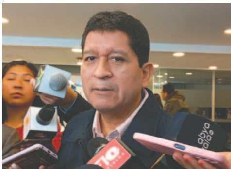
El senador del MAS, Adolfo Flores

Flores señaló que ya hubo acercamientos con tres o cuatro organizaciones políticas, pero se limitó a detallar el caso del MTS. "Entiendo que, por ejemplo, el Tercer Sistema ha pedido una cuota muy alta