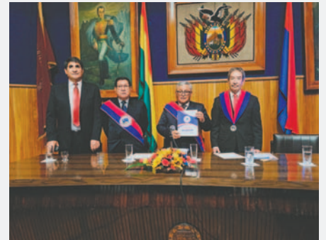
Las autoridades universitarias debatieron también otros temas /UTO