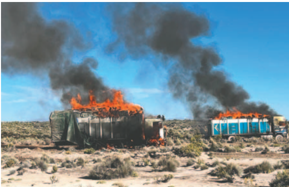
Militares queman dos camiones tras operativos contra el contrabando /VLCC

Sabaya, se comiso una camioneta Ford F-12 color blanco indocumentado que transportaba 25 fardos de ropa usada. Este vehículo fue incinerado para evitar que fuera recuperado por contrabandistas o pobladores de la zona, con una afectación aproximada al contrabando de Bs. 122.500.