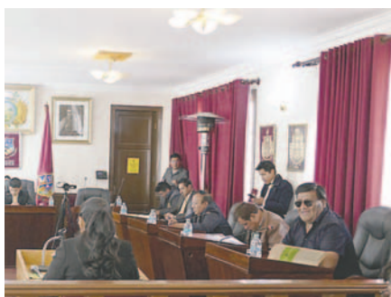
Concejo Municipal cumplió con la primera interpelación del año