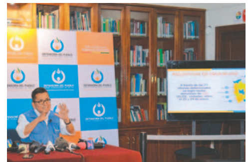
El titular de la Defensoría, Pedro Callisaya, informó las deficiencias en varias infraestructuras educativas /APG para su uso.

En Cochabamba, la escuela René Barrientos registró deficiencias en el sistema eléctrico y problemas estructurales en las aulas. En Santa Cruz, el Colegio 24 de Marzo registró techos en mal estado, aulas sin ventanas y baños sin condiciones adecuadas