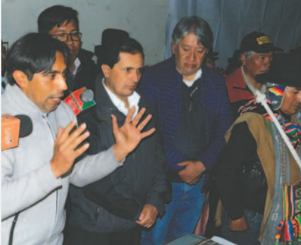
Tras varias horas se llegó a un acuerdo para realizar una reunión el viernes