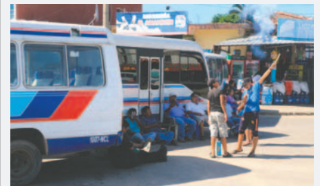
El transporte público en Santa Cruz detuvo sus actividades