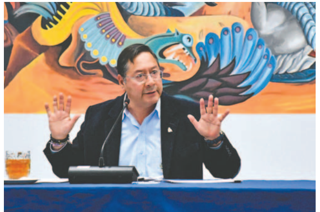
El Presidente de Bolivia, Luis Arce

El secretario de Estado de EE.UU., Marco Rubio, aprobó el viernes 31 de enero la reinstauración de la Lista Restringida de Cuba, una "lista negra" que veta ciertas transacciones con compañías bajo el control