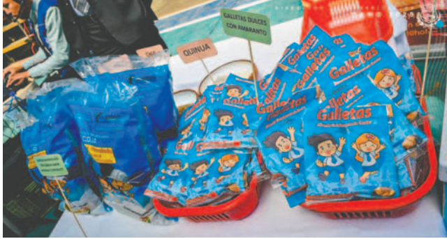
Se entregó el Alimento Complementario desde el primer día de clases

“Sabemos que en Oruro no se ha cumplido hace 20 años con la entrega del Alimento Complementario desde el primer día de clases. Hoy sí