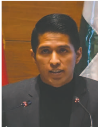
El presidente de la Cámara de Senadores, Andronico Rodríguez

mana, la autoridad, a través de sus redes sociales, expresó que Morales es el candidato y que él está cumpliendo una función pública. También agradeció a todas las organizaciones sociales que le dieron su respaldo.