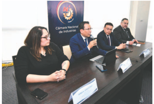
La CNI presenta proyecto de ley para derogar la disposición adicional séptima del PGE

El presidente de la Cámara Nacional de Exportadores de Bolivia