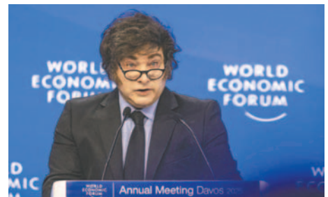
El presidente de Argentina, Javier Milei

Adorni respondió a un mensaje de Cristina Kirchner, quien publicó sobre la movilización: "Derecho a la prosperidad y a la felicidad son los límites que [Javier] Milei no solo no podrá violar, sino a los que, ade-