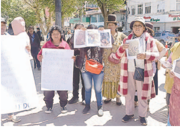
Comunarios de Toledo llegaron hasta la plaza principal de la ciudad para hacer conocer su reclamo

“La verdad hemos tenido muchas falencias en la provincia, desde 2022 hemos querido comprar una maquinaria de brazo largo para cavar nuestras vigiñas, porque allá es seco. Pero lamentablemente no se ha hecho la compra y la comunidad ha pedido tanto al Concejo como