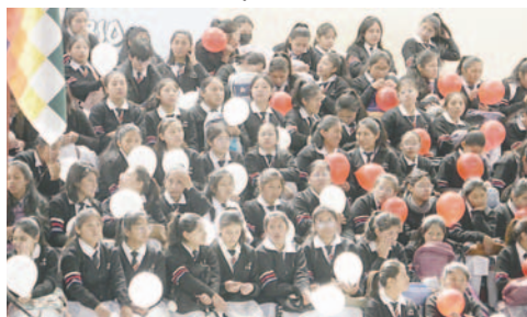
Estudiantes inician una nueva gestión escolar con mucho entusiasmo

Recomendó a los estudiantes aplicarse en materias como matemáticas y química, porque a través de la industria química básica Bolivia podrá abrirse al mundo con nuevos productos.