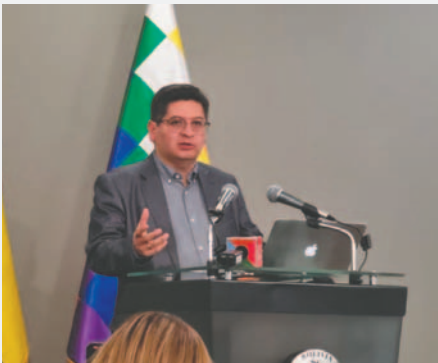
El ministro de Economía, Marcelo Montenegro, en contacto con los medios de comunicación