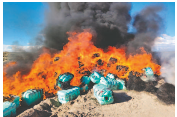
Incineran mercancía de contrabando

departamento de La Paz, en el sector de Ulloma, se comiso un camión F-12 con mercadería de contrabando de línea blanca, que al estar enfangado fue inutilizado y posteriormente incinerado, con una afectación al contrabando de cerca de Bs 910.000.