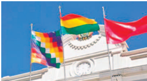
Desde el 6 de febrero toda institución, casa y autos deben portar la bandera rojo carmesí

banderamiento y uso de la bandera rojo carmesí, como símbolo cívico del departamento de Oruro, en todos los edificios públicos y privados, viviendas, establecimientos comerciales y vehículos”, detalló el asesor legal de