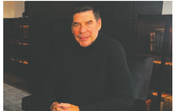
El empresario brindó ayer una entrevista a la Red Uno desde Nueva York vínculo con Bolivia.

Aseguró que él, en el plano personal, ya ha conseguido sus objetivos empresariales y de generar dinero, por lo que ahora solo lo mueve el interés de aportar al país. De hecho, expresó que quiere que en el futuro, sus hijas y nietos puedan tener un