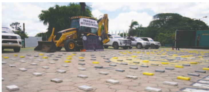
Los operativos afectaron el patrimonio del narcotráfico en un millón de dólares /EDUARDO DEL CASTILLO

El segundo caso se dio el 2 de febrero de 2025, luego de un trabajo de inteligencia y seguimiento, la Felcn aprehendió a cuatro personas, incautó cinco motorizados y un bien inmueble ubicado en la avenida Montero, camino al ingenio Guabirá en Santa Cruz, donde se tenían 301 paquetes de cocaína.