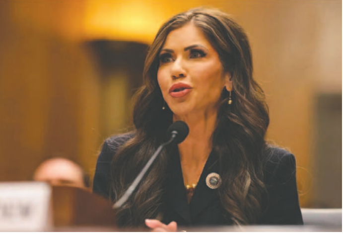
Kristi Noem, nueva secretaria de Seguridad Nacional de EE.UU.

El ahora expresidente Joe Biden amplió el programa TPS, que cubre a más de un millón de personas de 17 naciones. Muchos migran-