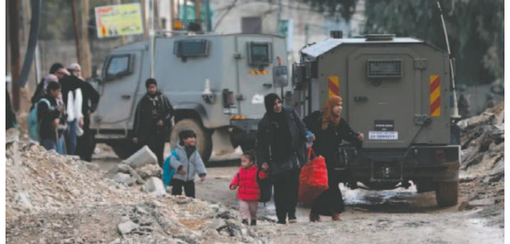
Palestinos llevan sus pertenencias, durante una operación militar israelí en Cisjordania

Bolivia se sumó al pedido palestino para que el Consejo de Seguridad asuma sus responsabilidades y brinde protección al pueblo palestino. El Gobierno de Bolivia reiteró su apoyo a la resistencia del pueblo palestino