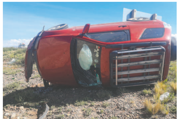
Después del vuelco, la vagoneta registró daños en su estructura