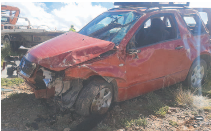
Remolcan el motorizado a instalaciones policiales