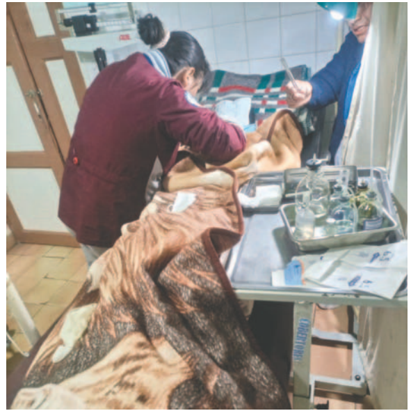
Cuatro ocupantes del vehículo fueron socorridos a nosocomios; el conductor falleció

La División Accidentes de Tránsito de Caracollo realiza los trabajos de campo para establecer las circunstancias del fatal accidente.