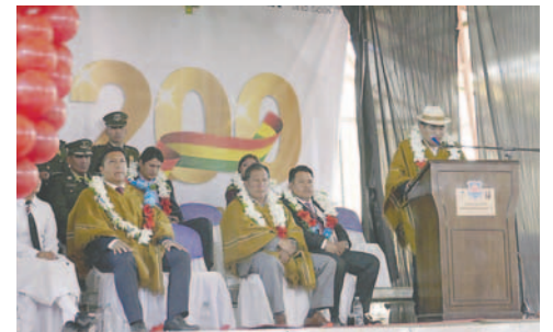
Ministro de Desarrollo Productivo y Economía Plural, Néstor Huanca, inauguró el año escolar en Oruro

“Debemos seguir consolidando el derecho a la educación de todos y todas, y no vamos a descansar hasta que cada bo-