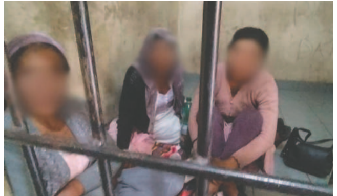
Las tres detenidas por la Policía en Cochabamba

La autoridad recordó los diversos bloqueos que acontecieron durante el gobierno de Arce en el tema económico, sobre los créditos varados en la Asamblea Legislativa Plurinacional, y social, sobre las manifestaciones de los diversos