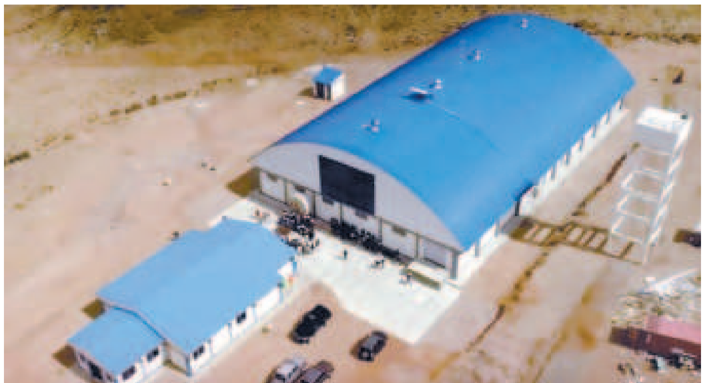
La planta tendrá la capacidad de procesar 30 toneladas de alimento.

La infraestructura productiva demanda una inversión de Bs 12,4 millones y se canalizó por medio del Fondo Nacional de Inversión Productiva y Social (FPS).