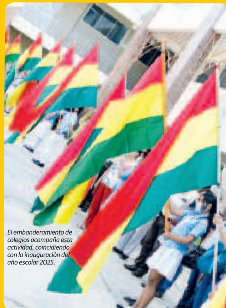
El embanderamiento de colegios acompaña esta actividad, coincidiendo con la inauguración del año escolar 2025.

En la primera semana del Año del Bicentenario, el Ministerio de Culturas, Descolonización y Despatriarcalización lanzó la convocatoria para embanderar y revalorizar los símbolos patrios en todo el país, con el objetivo de fortalecer el sentido de identidad nacional en este año histórico. La agenda completa de actividades está disponible en www.bicentenario.bo .