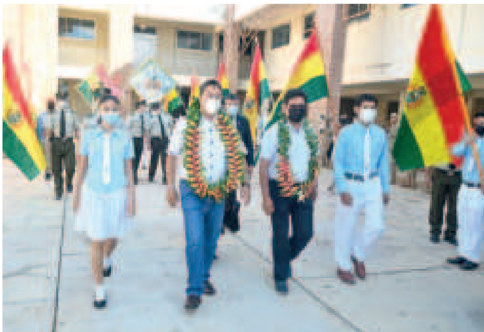
El presidente Arce estará en el colegio 26 de Febrero, en el municipio de Tiquipaya.

Véliz mencionó que existen denuncias de daños en infraestructuras escolares, particularmente en municipios como Santa Cruz y Cochabamba, donde algunas unidades educativas no han podido recibir el mantenimiento necesario. ▶