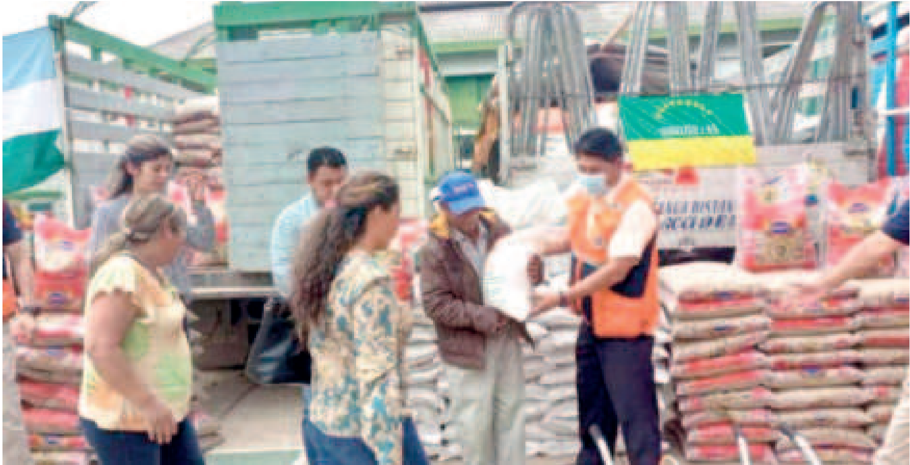
Ayuda humanitaria entregada por el Gobierno a las familias afectadas por las lluvias.