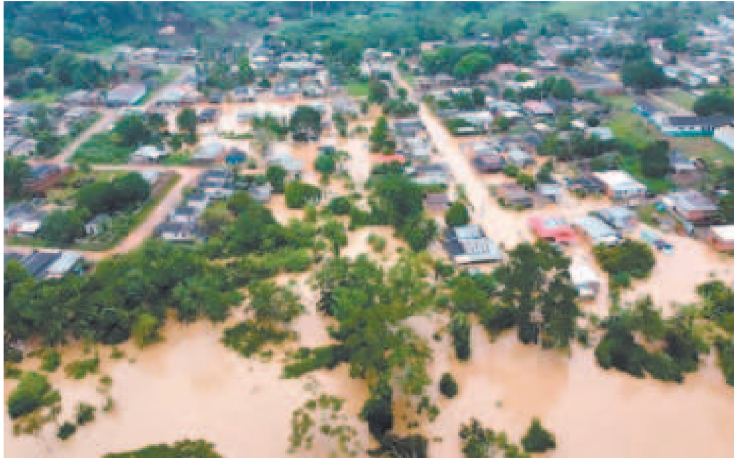
Una de las ciudades del oriente boliviano sufre el desborde del río.

En tanto, el viceministro de Defensa Civil, Juan Carlos Calvimontes, destacó la urgencia de la aprobación de los créditos debido a que “muchos municipios han manifestado que ya no cuentan con recursos económicos y algunas gobernaciones, como el caso de La Paz, por ejemplo, ya se ha declarado emergencia, eso quiere