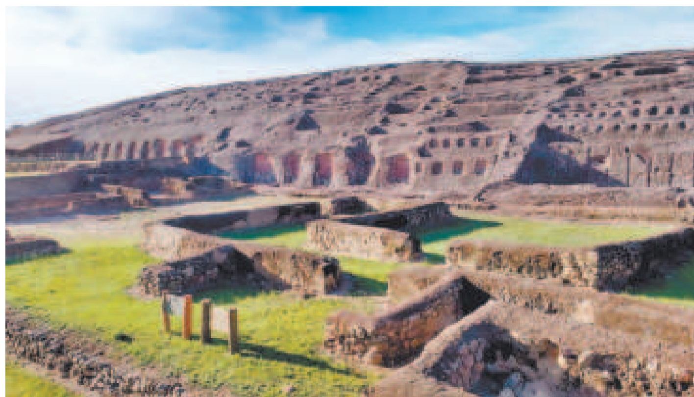
Vista general del Fuerte de Samaipata.

El Jefe de Estado resaltó el compromiso de su administración con la preservación y promoción de este importante patrimonio cultural.