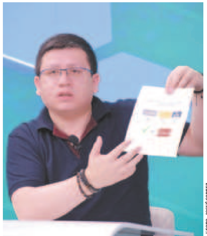
El ministro Sergio Cusicanqui.

“Centrar la evaluación de la economía boliviana únicamente en los niveles de reservas internacionales netas (RIN) omite la complejidad de un sistema económico dinámico”, aclaró el ministerio. La economía de un país no puede ser valorada adecuadamente sin considerar de manera integral indicadores clave, como el crecimiento del Producto Interno Bruto (PIB), el desempeño del sistema financiero, la inversión, el cumplimiento de la deuda externa, el empleo, la pobreza, entre otras variables, explicó.