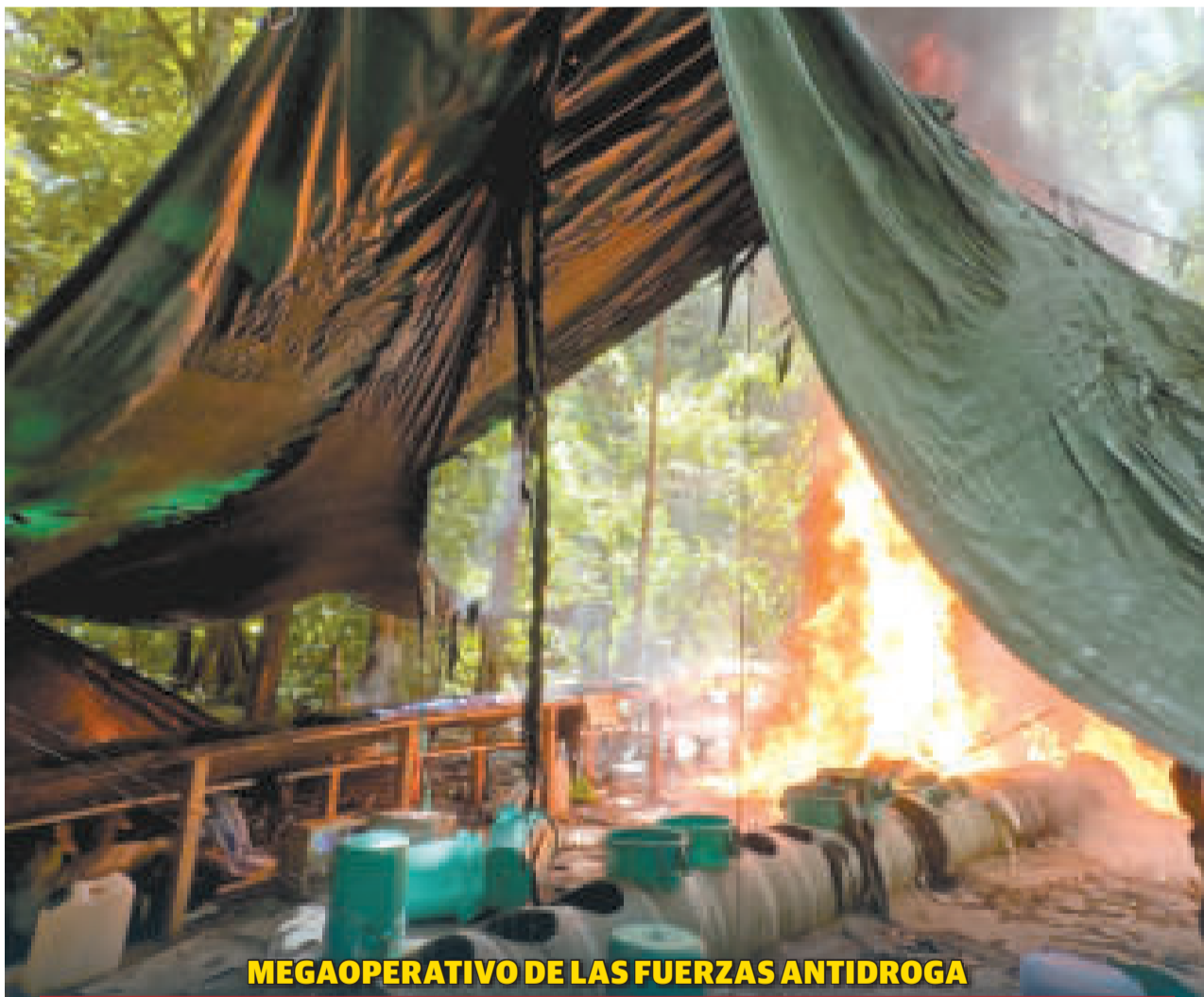
MEGAOPERATIVO DE LAS FUERZAS ANTIDROGA