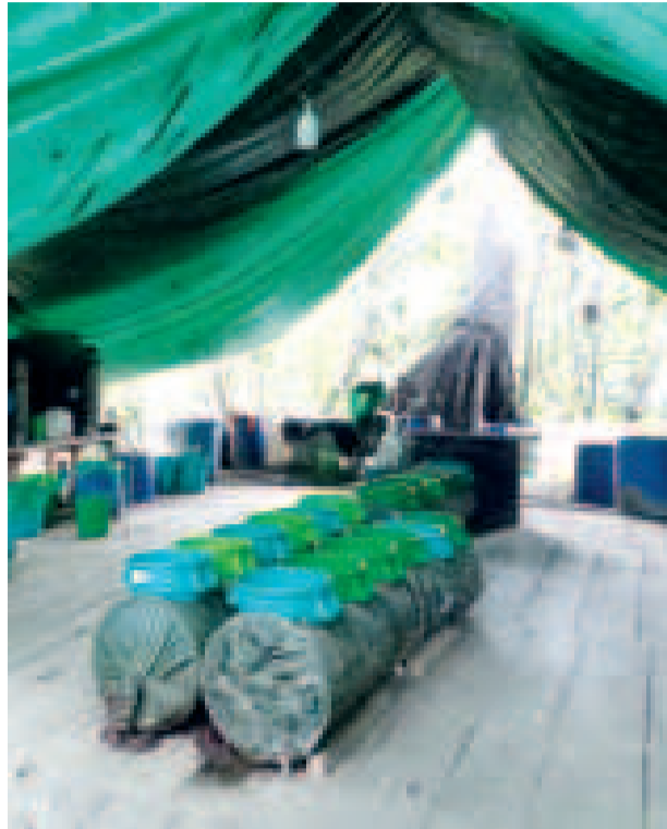
Laboratorio de cocaína con infraestructura para la producción de cocaína.

La Fuerza Especial de Lucha Contra el Narcotráfico es un organismo especializado de la Policía Boliviana.