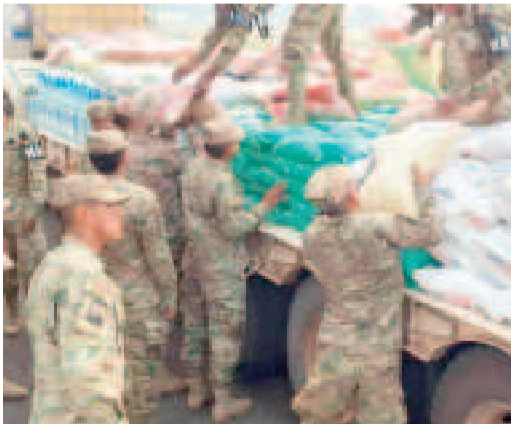
Militares colaboran en la entrega de la ayuda humanitaria.

De igual manera, 501 viviendas fueron afectadas por las lluvias e inundaciones, 324 viviendas están completamente destruidas y 20 personas fallecie-