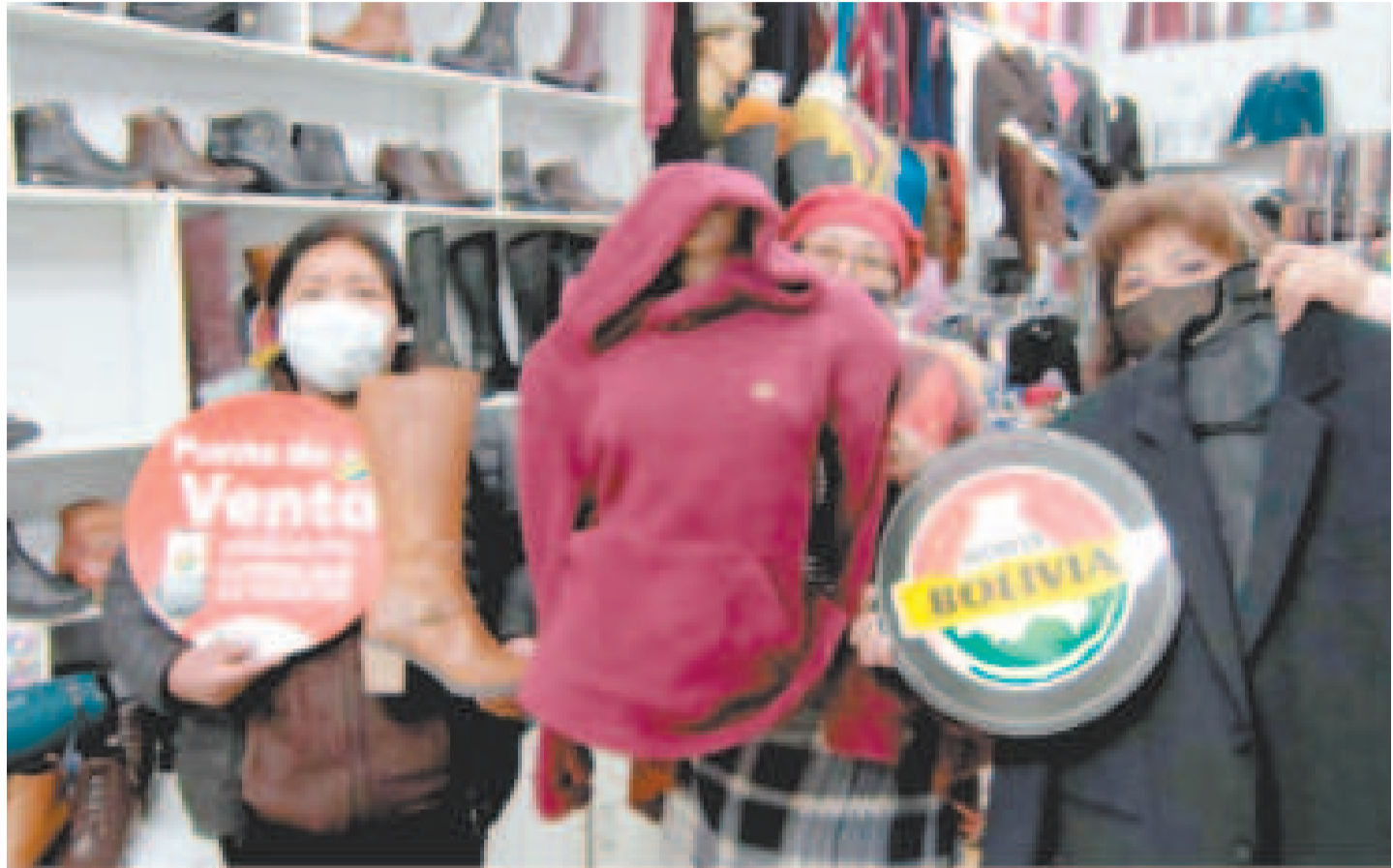
Venta de productos nacionales con la app Consume lo Nuestro.

Este esfuerzo se inscribe en una serie de políticas que buscan diversificar los sectores productivos y fomentar la sustitución de importaciones, mediante el fortalecimiento