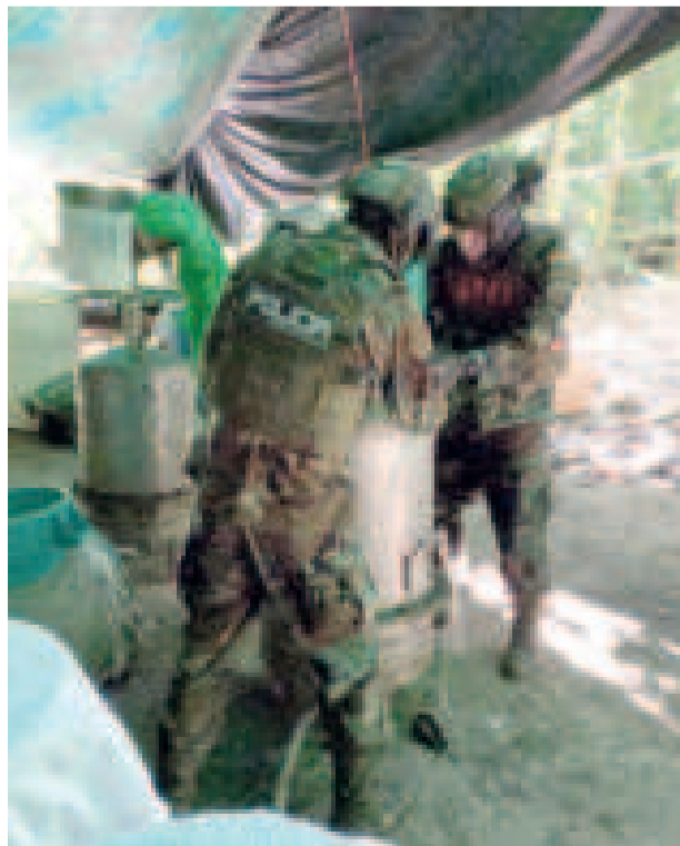
Efectivos de la FELCN desmantelan el laboratorio de cocaína.