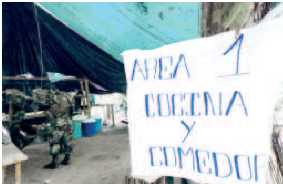
Área de cocina y comedor del laboratorio de droga.

“Estos laboratorios representaban una inversión significativa para las mafias transnacionales. Cada uno de ellos costaba entre ▶