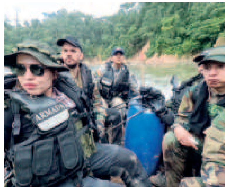
El ministro de Gobierno lidera el operativo antinarcóticos.