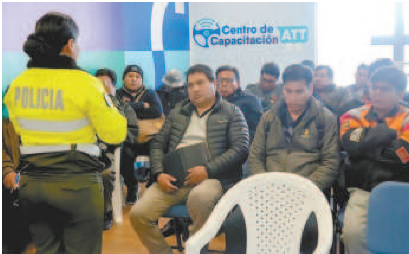
Capacitación a choferes sancionados por infringir las leyes de tránsito.