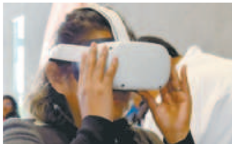
En la capacitación se recurre a la observación de videos en realidad virtual.

Los Centros de Capacitación ATT, cuyo primer espacio fue inaugurado en 2024 en la Terminal Metropolitana El Alto, buscan capacitar a los choferes de los buses para concientizarlos sobre la responsabilidad que tienen.