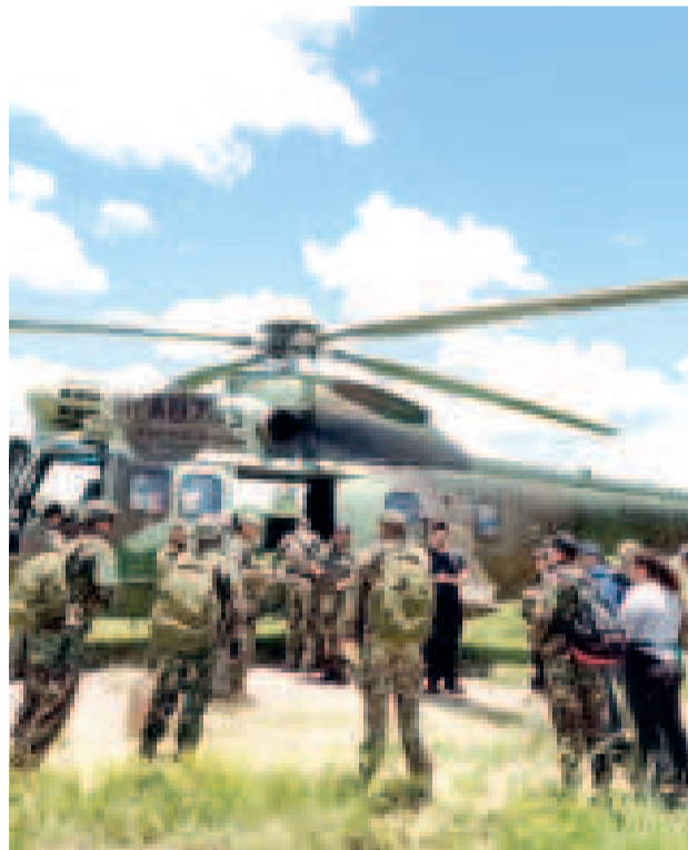
Efectivos antidroga utilizan el helicóptero Súper Puma para la interdicción.