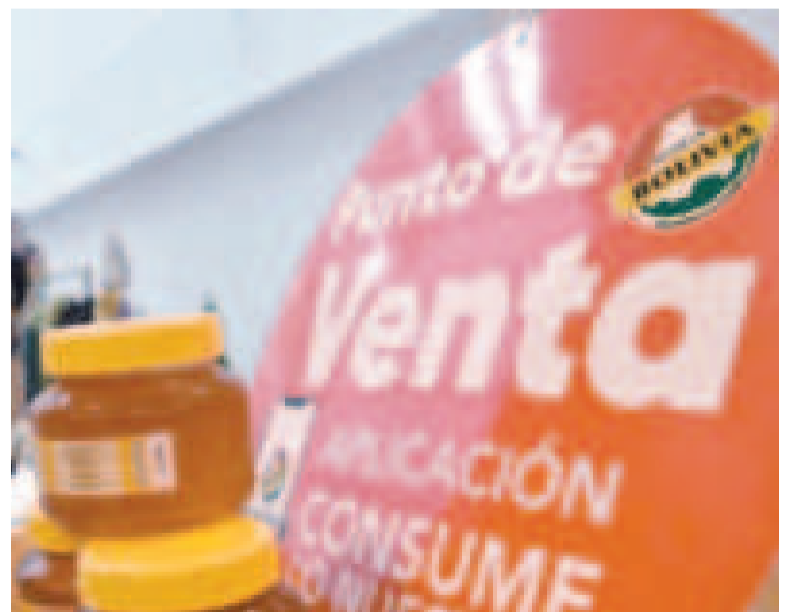
Cada vez más productores se suman a esta aplicación comercial.

Viceministra de Micro, Pequeña Empresa y Artesanía