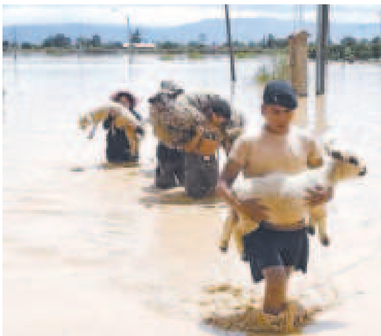
Efectivos militares rescatan animales de un río.