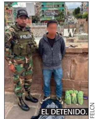
EL DETENIDO. FELCN

La Mescalina es una nueva droga en el mercado, un extracto de la planta de San Pedro (Wachuma), con propiedades psicoactivas y alucinógenas, derivadas de la mescalina, un potente alucinógeno natural.