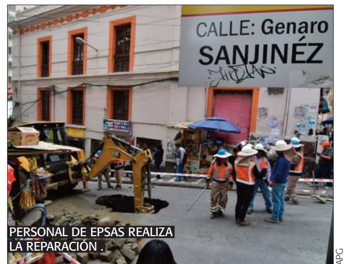
PERSONAL DE EPSAS REALIZA LA REPARACIÓN.

TRABAJO La Alcaldía de La Paz anunció que hasta que se concluyan los trabajos, la vía estará cerrada.