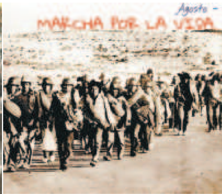
La marcha de mineros para evitar su relocalización en 1986.