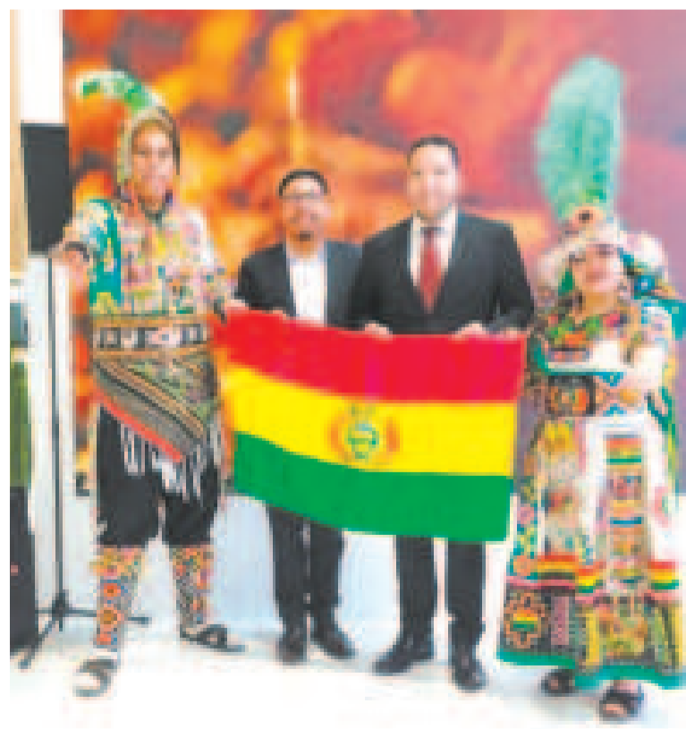
Parte de la delegación boliviana en el Fitur 2025, en Madrid, España.

Gracias a las gestiones del Ministerio de Desarrollo Productivo y Economía Plural, la delegación boliviana estuvo conformada por el Viceministerio de Turismo, el Programa de Dinamización del Salar de Uyuni y Lagunas de Colores, y diversas empresas turísticas legalmente constituidas que promocionan al país como un destino único.