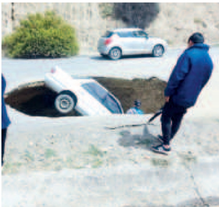
El vehículo se hundió como tres metros.