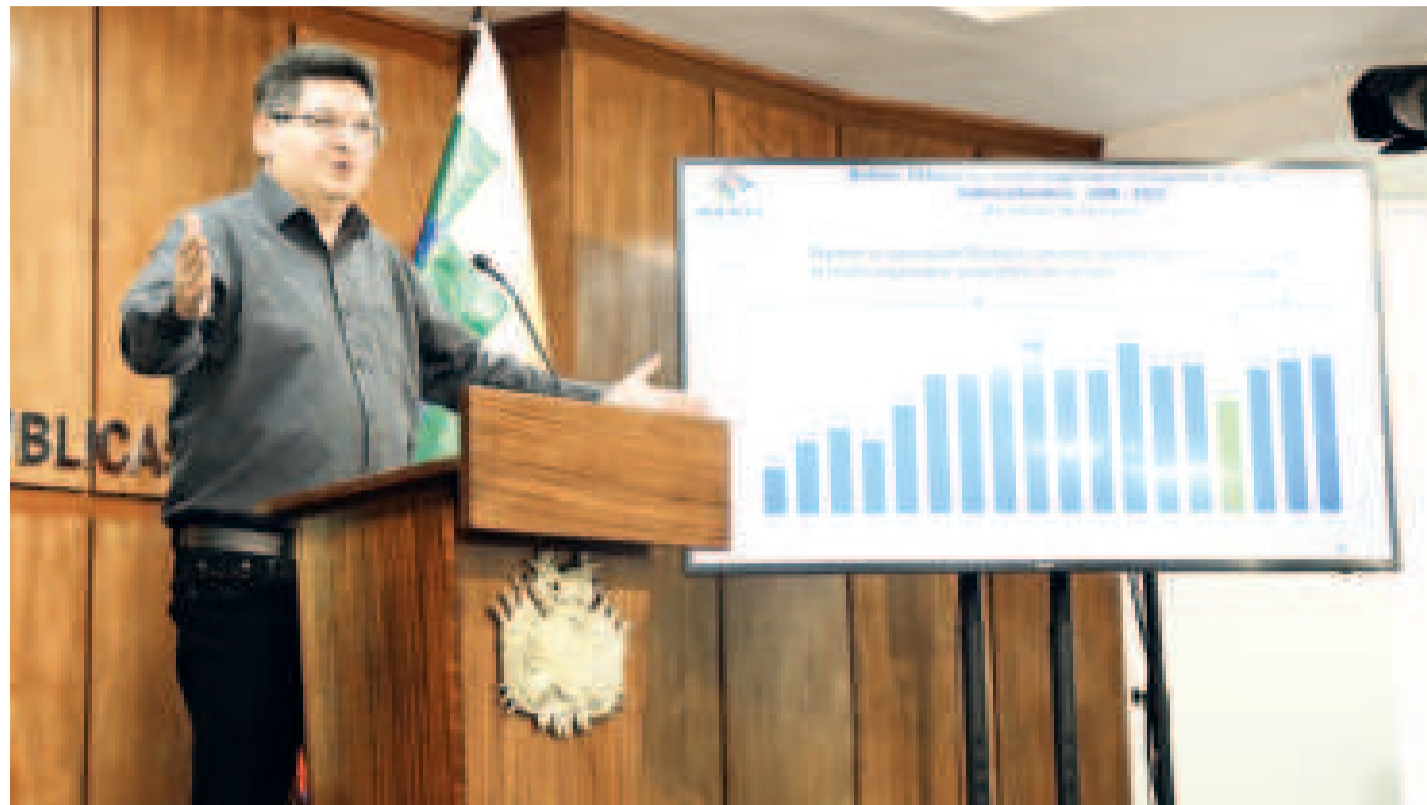
El ministro de Economía y Finanzas Públicas, Marcelo Montenegro, en conferencia de prensa.

El primero es que Bolivia registra crecimiento económico con una tasa positiva del 2,6% en el segundo trimestre de 2024, pese a problemas como