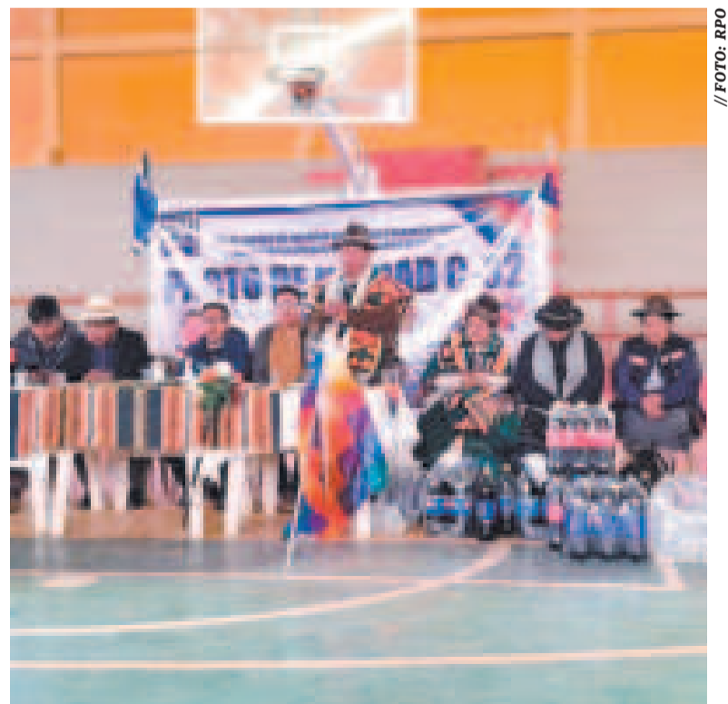
El dirigente del Pacto de Unidad de Oruro.

“Definimos una importante agenda de trabajo para celebrar al valiente pueblo orureño como mejor sabemos, con la entrega de obras e importantes proyectos de desarrollo económico y social”, dijo el Presidente.