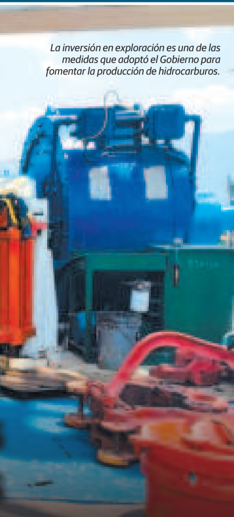
La inversión en exploración es una de las medidas que adoptó el Gobierno para fomentar la producción de hidrocarburos.