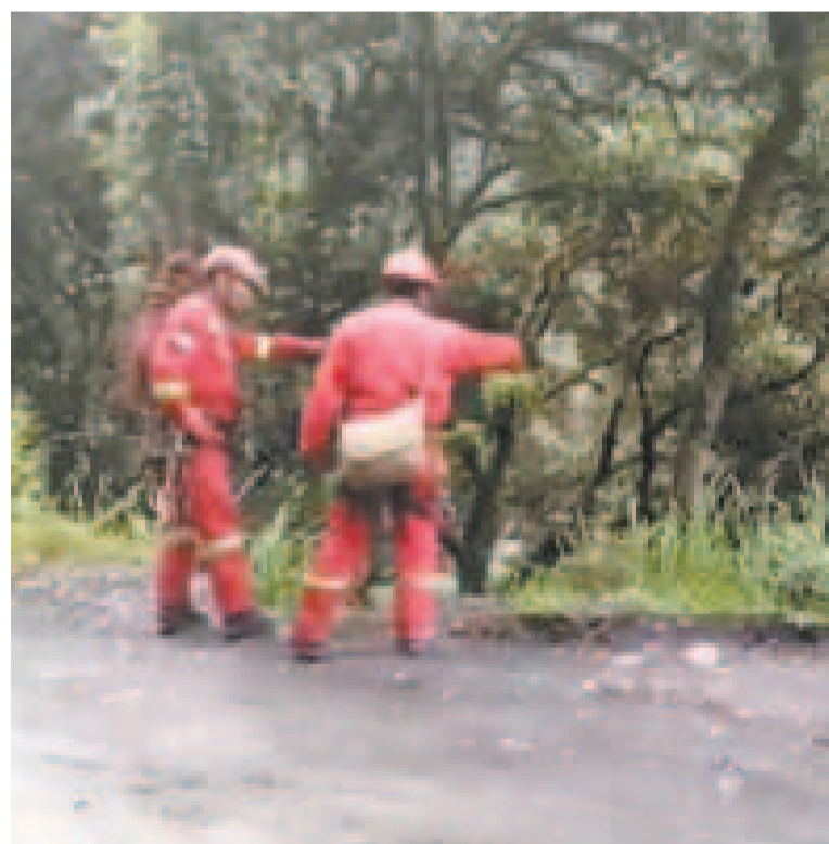
Efectivos de Bomberos durante las tareas de rescate de los cuerpos de los mineros.

fue hallado el viernes en la mañana, y el segundo, durante la tarde.