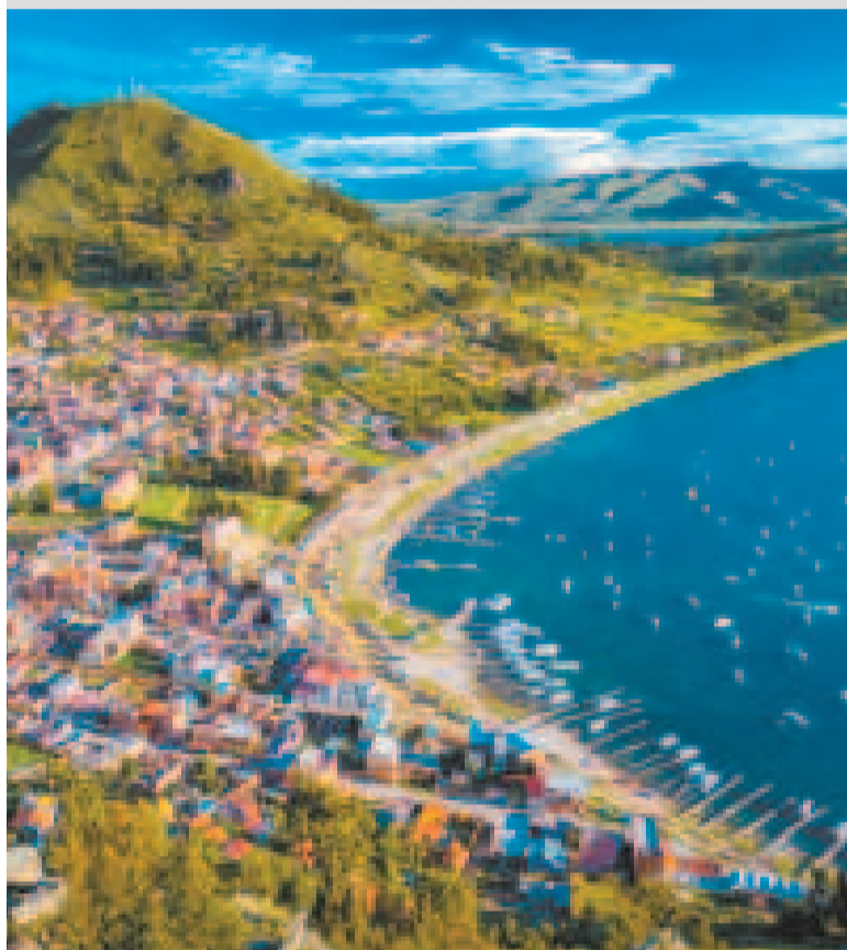
Copacabana, situada a orillas del lago Titicaca.