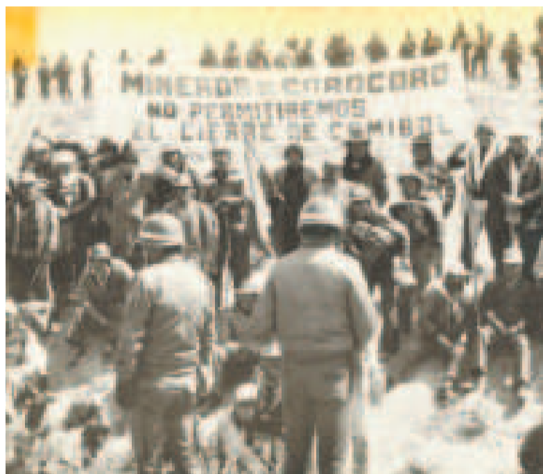
Mineros de Corocoro que lucharon para evitar el cierre de Comibol, en 1986.

La coalición de derecha busca retomar el plan de los años 80 y 90, cuando se relocalizó a miles de obreros para reducir el gasto público.