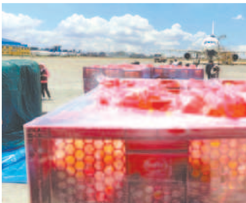
Los puentes aéreos que aplicó el Gobierno para garantizar los alimentos y estabilizar los precios.