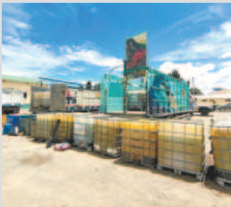
Mercadería decomisada en la lucha contra el contrabando.

En otro operativo, se comisaron 6.000 litros de diésel en Chaguaya, con una afectación al contrabando de aproximadamente Bs 22.320.