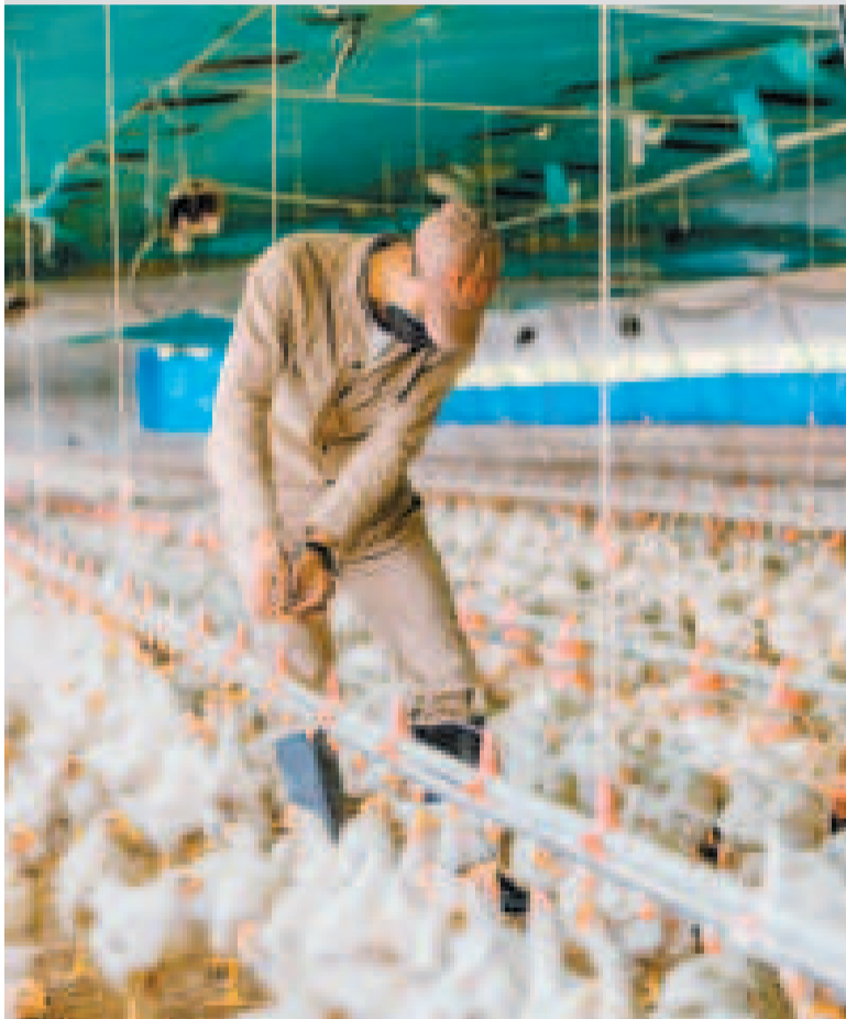
Un avicultor en pleno trabajo.