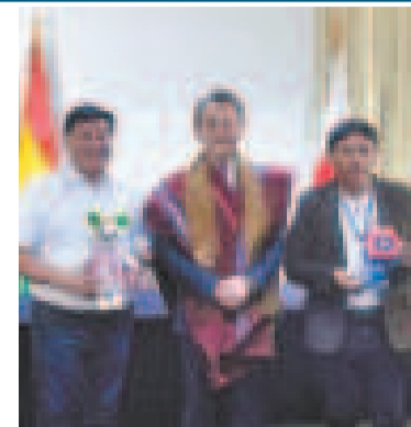
Acto de la firma del convenio de cooperación.

La planta ampliada atenderá la demanda de grupos vulnerables que requieren una mejor alimentación, garantizando el acceso a productos de calidad. Este avance fortalece la seguridad alimentaria en Bolivia y fomenta el desarrollo integral de las comunidades rurales.