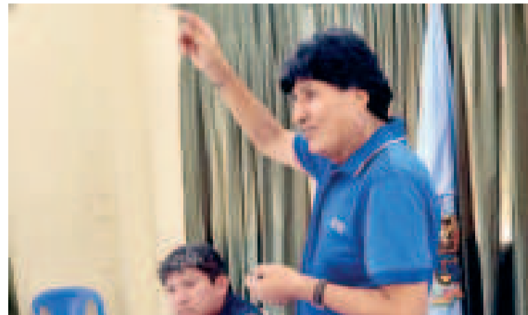
Evo Morales en el trópico de Cochabamba.

Jiménez explicó que el volumen de gasolina y diésel está garantizado para su traslado a las estaciones de servicio. En la misma línea, Joel Callaú, de YPFB, garantizó el despacho de carburantes.