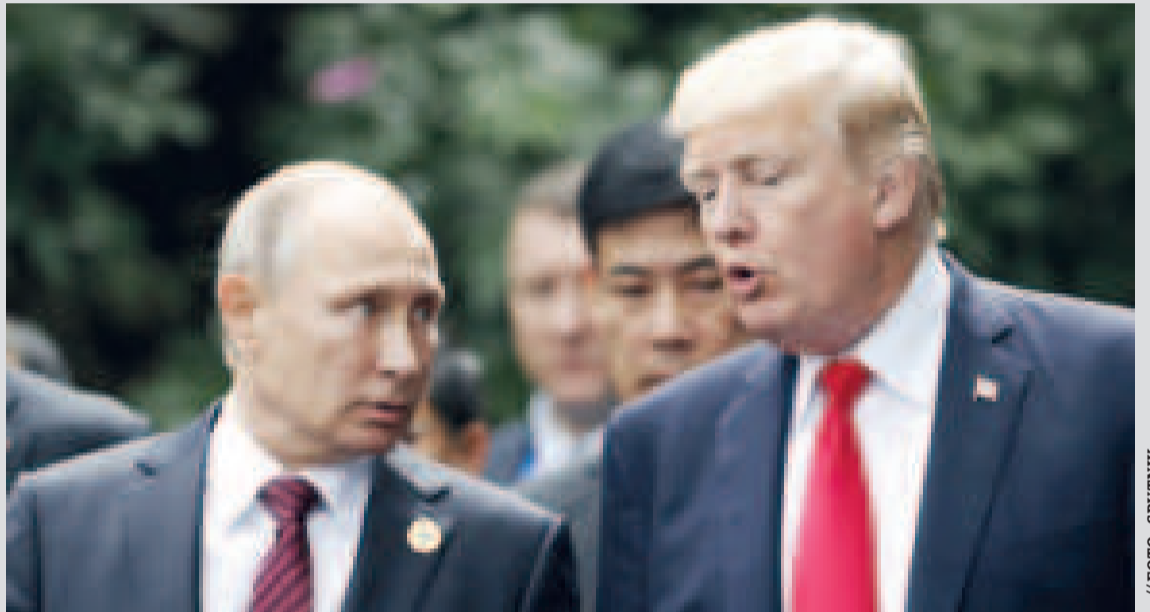
El presidente ruso, Vladimir Putin, y el mandatario Donald Trump.

La última ronda de conversaciones entre Moscú y Kiev para lograr un acuerdo de fin de las hostilidades se hizo el 29 de marzo de 2022, en la ciudad turca de Estambul, y desde entonces los países no han vuelto a retomarlas. Moscú, en repetidas ocasiones, se declaró dispuesto a reanudar el proceso negociador con Kiev, pero lo condicionó a la cancelación del decreto ucraniano que prohíbe retomar las negociaciones con Rusia.