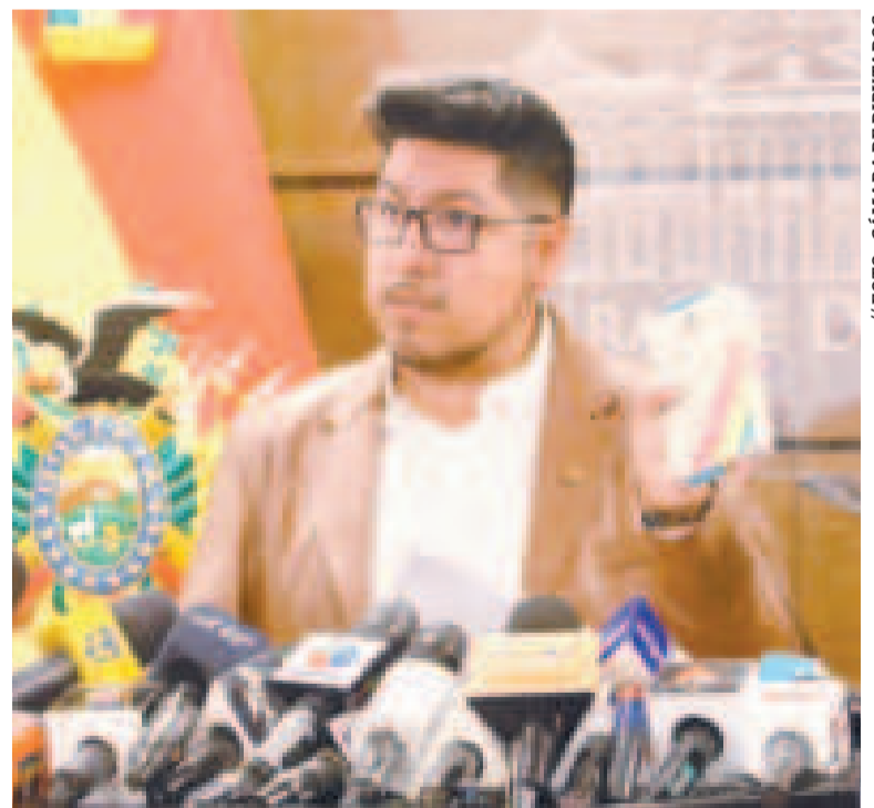
El presidente de Diputados, Omar Yujra.

“Estos contratos implican inversión en territorio boliviano, y a partir de aquello industrializar, eso es lo que se está buscando, sin entregar nuestros recursos naturales”, afirmó el presidente de Diputados en re-