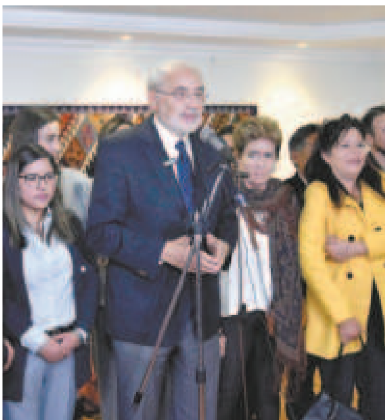
El expresidente Carlos Mesa con sus legisladores de CC.