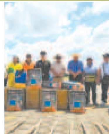
Equipamiento entregado por el Gobierno.

El ministro precisó que las recomendaciones fueron emitidas de manera verbal por los 98 países que participaron en el examen. Estas serán organizadas y consolidadas en un documento escrito por el Consejo de Derechos Humanos de la ONU, en coordinación con la misión permanente de Bolivia en Ginebra.