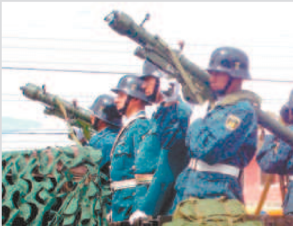
Los misiles chinos son exhibidos por efectivos militares.

Dichos armamentos fueron trasladados a Estados Unidos para su desactivación. El hecho vulneró gravemente la soberanía nacional.