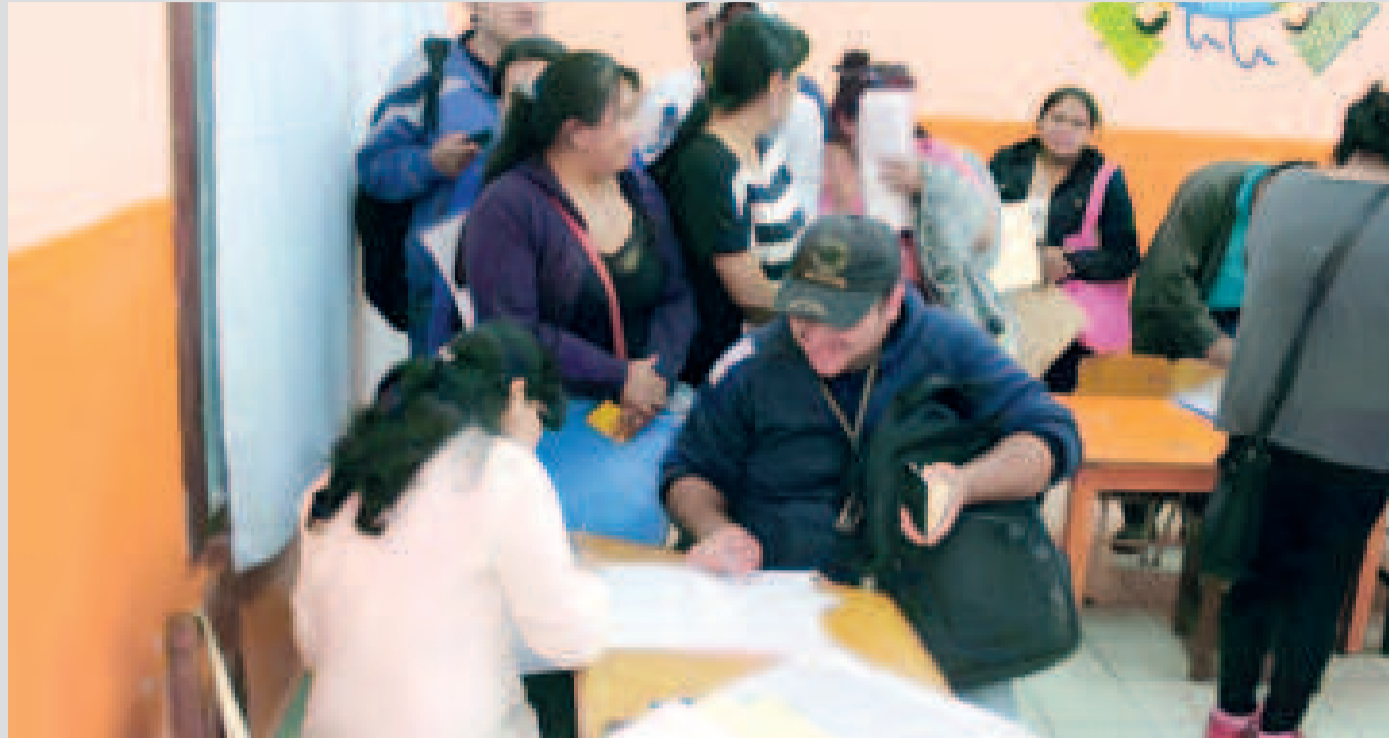
Las inscripciones escolares concluyeron ayer viernes en el país.