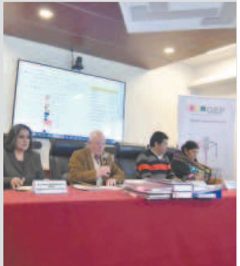
Vocales del TSE en una actividad.