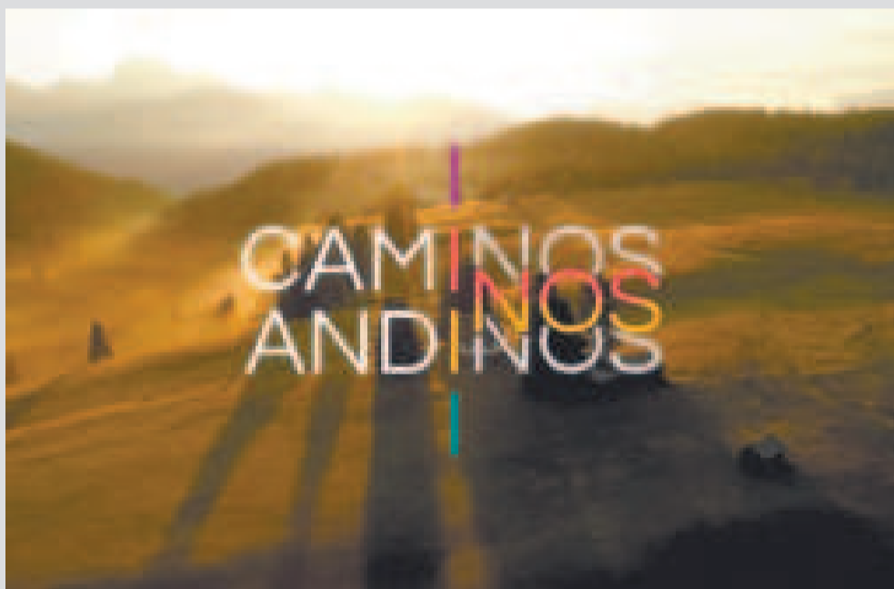
La propuesta de Caminos Andinos de la CAN.