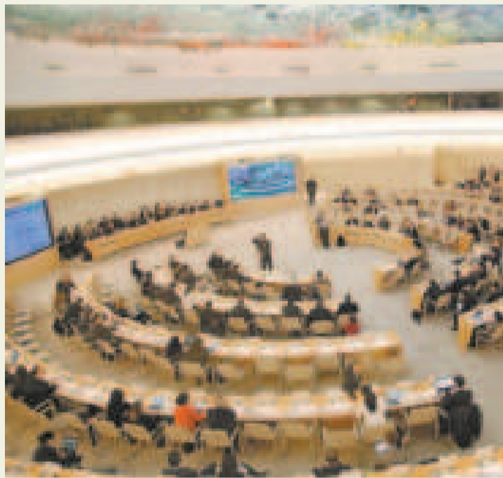
Examen Periódico Universal (EPU) de la ONU en Ginebra, Suiza.

mendaciones se centraron mayoritariamente en la justicia, en el acceso a la justicia, las elecciones judiciales y, especialmente, en el principio de independencia judicial. Aunque también hubo observaciones sobre otros temas importantes, el énfasis estuvo claramente en