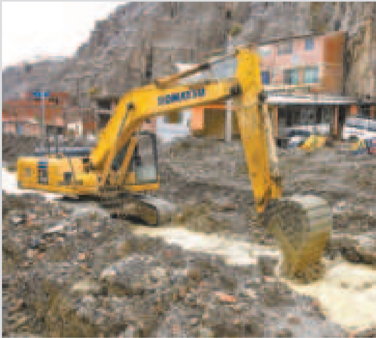
Maquinaria pesada en la zona Bajo Llojeta, afectada por las lluvias.