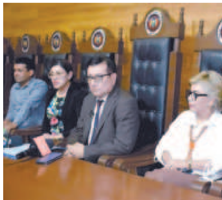
Magistrados del TCP.

Ahora se esperará que los denunciantes presenten las pruebas y posteriormente se emitirá un informe a la Comisión de Justicia.