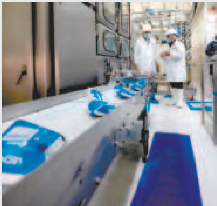
Parte de la industrialización de la leche en la planta de Achacachi.

“Con el firme propósito de beneficiar a más de 1.265 productores de leche de nuestra histórica provincia Omasuyos en La Paz, estamos a punto de concluir el Proyecto de Ampliación de la Planta de Procesamiento de Lácteos de Achacachi, que ya alcanzó un avance físico del 100 por ciento y un avance financiero del 92,4 por ciento. ¡La industrialización no se detiene!”, destacó