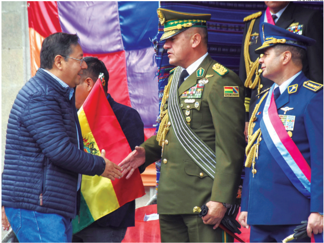
El presidente Luis Arce saluda a los jefes de la Policía y de las Fuerzas Armadas