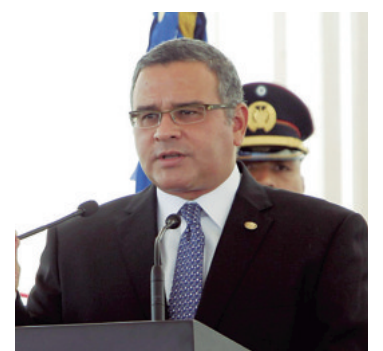
Foto de archivo del exmandatario

Funes llegó a Nicaragua en 2016 y, el 30 de julio de 2019, recibió la nacionalidad en Nicaragua, cuya Constitución establece que "los nicaragüenses no podrán ser objeto de extradición del territorio nacional". (EFE)