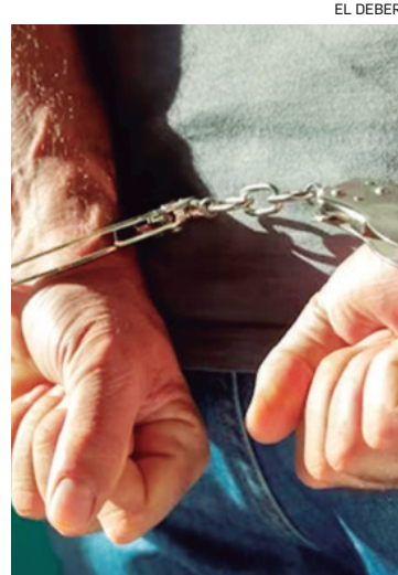
Un coronel imputado por violación será presentado ante un juez

La mujer pidió auxilio a gritos al no poder defenderse por su discapacidad. Cuando retornaron sus