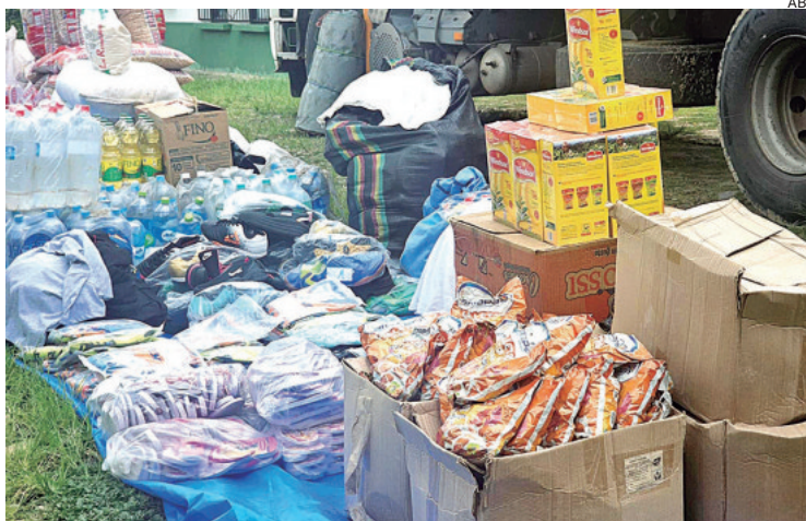
Parte de los alimentos que llevó el Gobierno a Chuquisaca