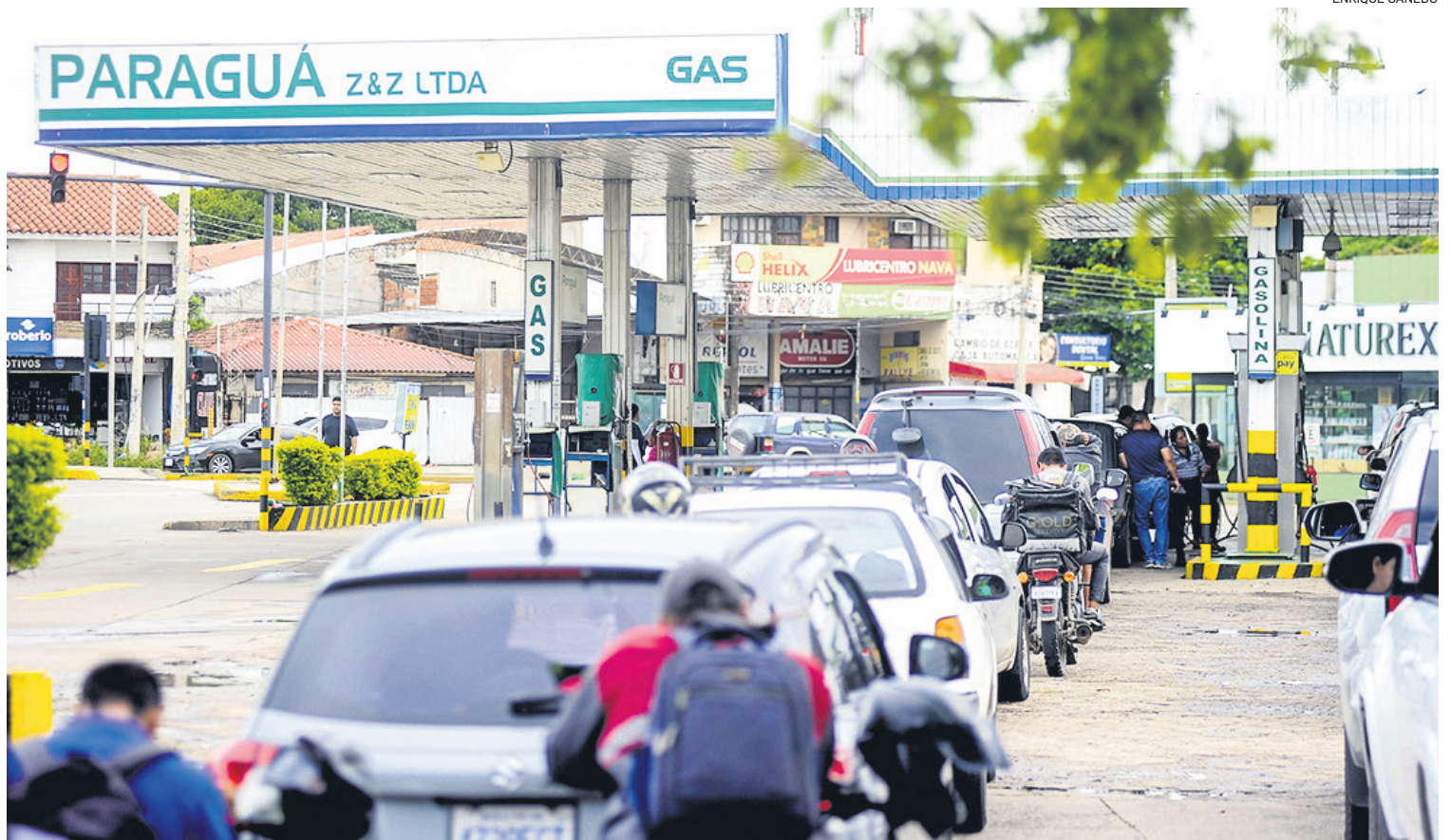
Vuelven las filas de motorizados en las estaciones de servicio de la capital cruceña en búsqueda de combustible

El mayor problema se presenta en los municipios cruceños de Gutiérrez, Lagunillas y Charagua, donde se concentra la mayor producción maicera del país y, en menor medida en Yacuiba (Ta-