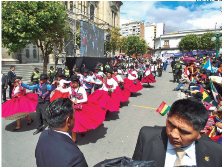
Mujeres aymaras pasan por el palco al ritmo de la Moseñada