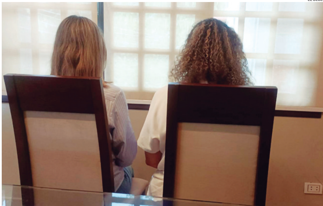
La madre del joven espera que sus argumentos sean tomados en cuenta para resolver estas acusaciones.

En la conversación con EL DEBER, recordó que todo comenzó en agosto de 2023. “A mi hijo lo separaron del caso porque era el único que tenía 18 años. Lo citaron a declarar como testigo el 23 de agosto de 2023, pero el mandamiento de apremio fue emitido el 21 y lo tenían listo desde el 14 de agosto. Ahí empezaron los atropellos, las