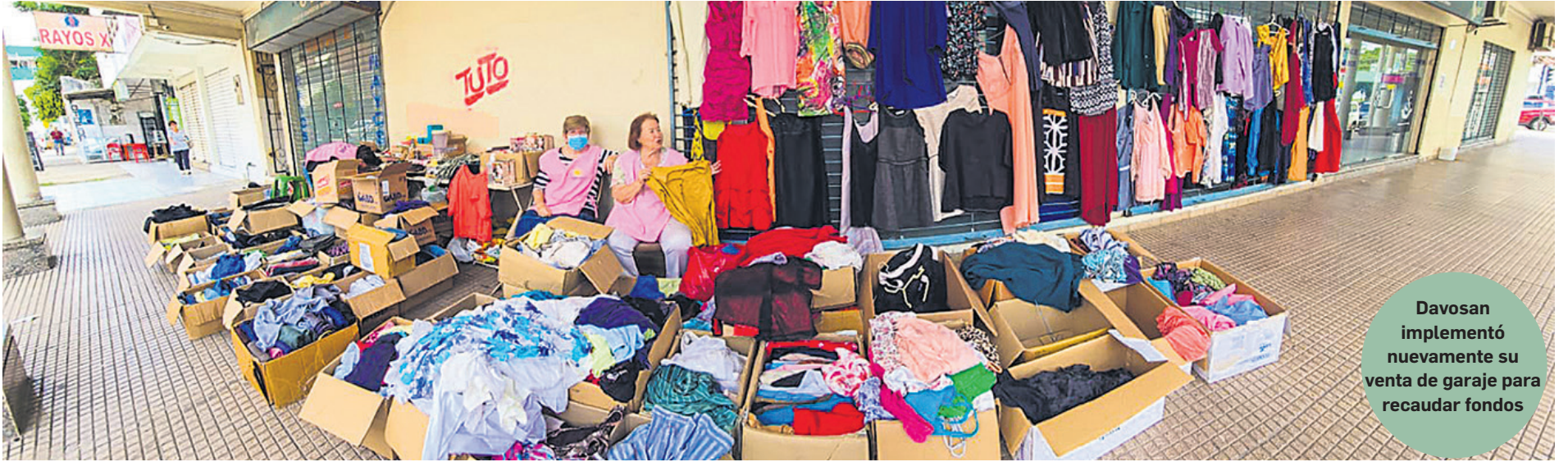
Davosan implementó nuevamente su venta de garaje para recaudar fondos