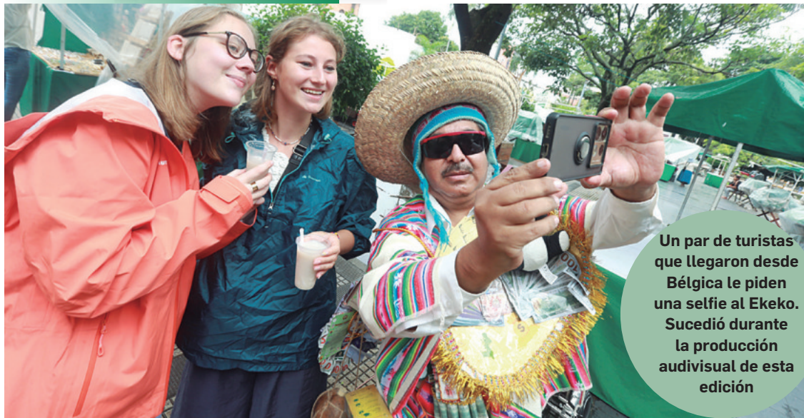
Un par de turistas que llegaron desde Bélgica le piden una selfie al Ekeko. Sucedió durante la producción audiovisual de esta edición