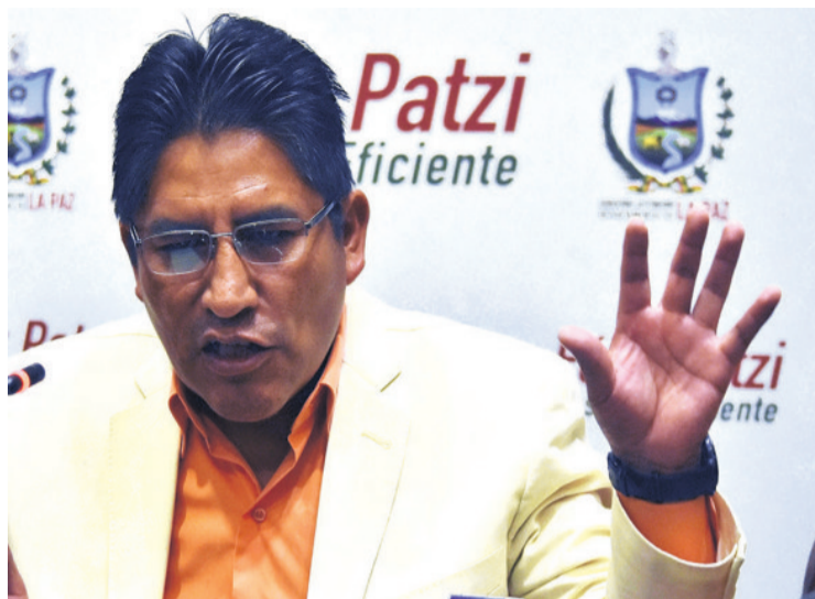
Félix Patzi admite que hubo contacto con Evo Morales hace tiempo.

al control de sus "legítimos" propietarios que son las organizaciones sociales, gracias a un fallo del Tribunal Constitucional Plurinacional (TCP) que reconoció a la dirigencia "arcista" de ese partido, elegida en un congreso a principios de mayo, en El Alto.