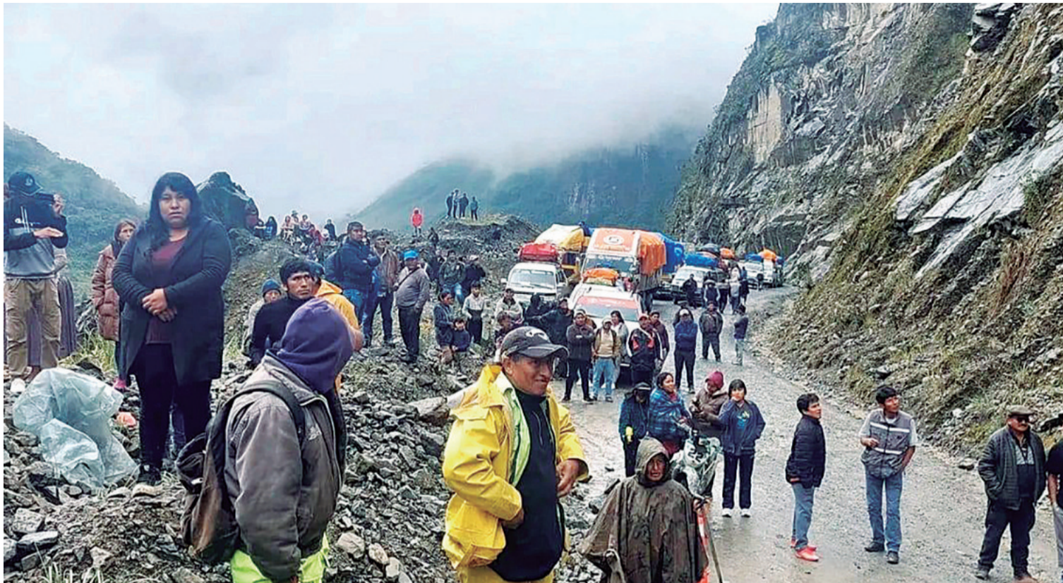
La ruta a Los Yungas es una de las afectadas por derrumbes. Los viajeros toman vías alternas para llegar a su destino

En Cochabamba están vigilantes para resguardar la pequeña y mediana producción, principalmente la de banana, porque tiene un mercado importante.