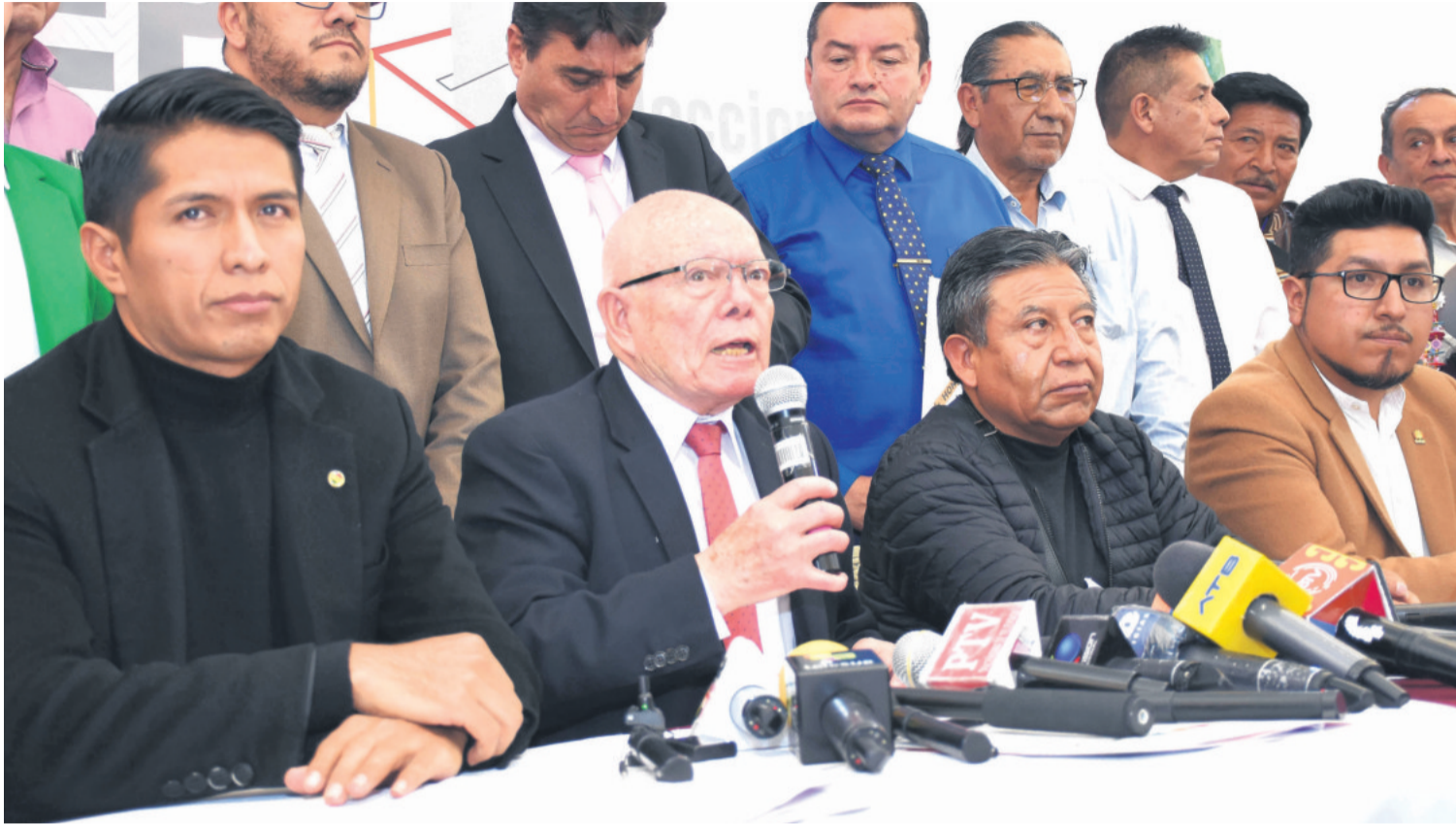
El 11 de noviembre de 2024, fue la última reunión entre el TSE, el Ejecutivo y Legislativo. Horas después, los arcistas le dieron la espalda

YA HUBO UNA PRIMERA REUNIÓN DE COORDINACIÓN CON EL TCP