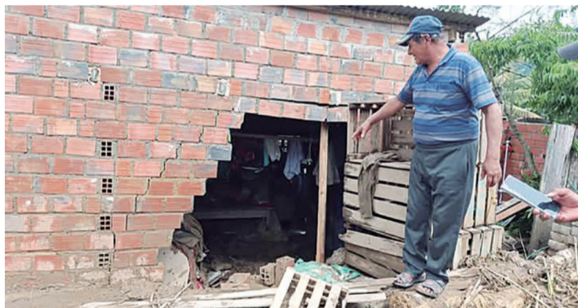
Las casas quedaron seriamente dañadas y la gente muestra los destrozos

Se monitorea constantemente el río Acre en Cobija.