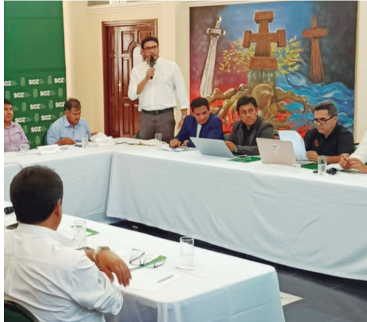
La reunión se realizará en Sucre. Será el primer encuentro en 2025

del Chaco. Si bien el tenor de la reunión será coordinar la agenda del Bicentenario, como dijo Ruiz, también se abrirá espacio para tocar otros temas de la coyuntura, como la iliquidez que enfrentan las entidades territoriales y los recortes presupuestarios. En su momento, el gobernador del Beni, Alejandro Unzueta habló de que estaban en bancarota, mientras que el gobernador de Tarija, Óscar Montes, pidió al Gobierno revisar