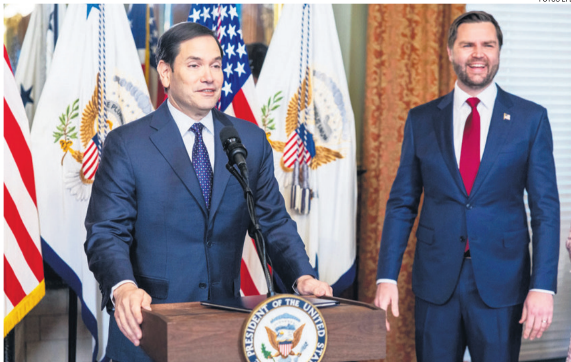
El nuevo secretario de Estado de EEUU (izq.) luego de ser posesionado por el vicepresidente AJ Vance