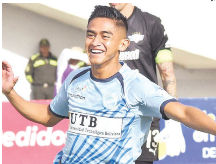
El futbolista cochabambino no se llama Gabriel, si no Diego. Lo reconoció hace una semana

Una semana después de reconocer su cambio de identidad en su declaración ante el Tribunal de Disciplina de la Federación Boliviana de Fútbol, Montaña renunció al juicio oral público, continuado y contradictorio, y optó por un procedimiento más rápido. Esta decisión se da tras la demanda presentada por la fiscalía de Cochabamba, que lo acusó de