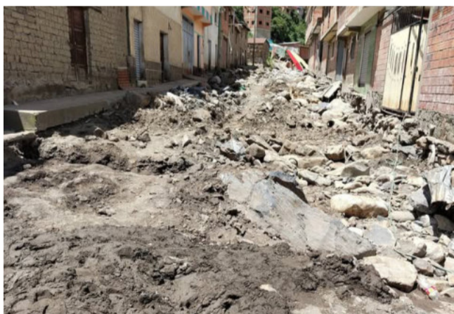
Las calles de Quime continúan con lodo y escombros