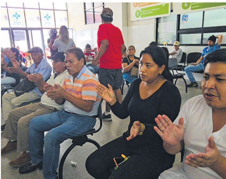
De varios centros llegan al San Juan de Dios para apoyar la protesta

Según ella, desde 2013, cuando la Gobernación asumió la competencia de los centros de tercer nivel, nunca antes estuvieron tan mal, no solamente en cuestión de derechos de los trabajadores y profesionales, sino en la precariedad y miseria en cuanto a la disponibilidad de insumos básicos para