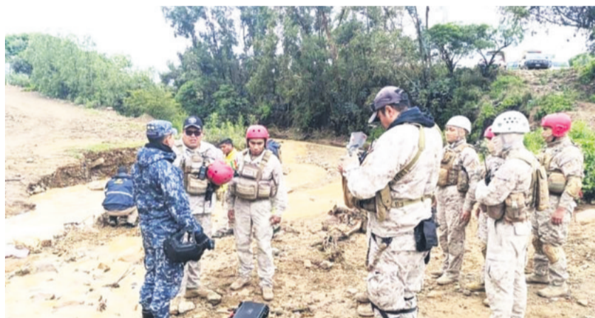
Brigadas se movilizaron para recuperar los cuerpos de dos hermanas en Sacaba