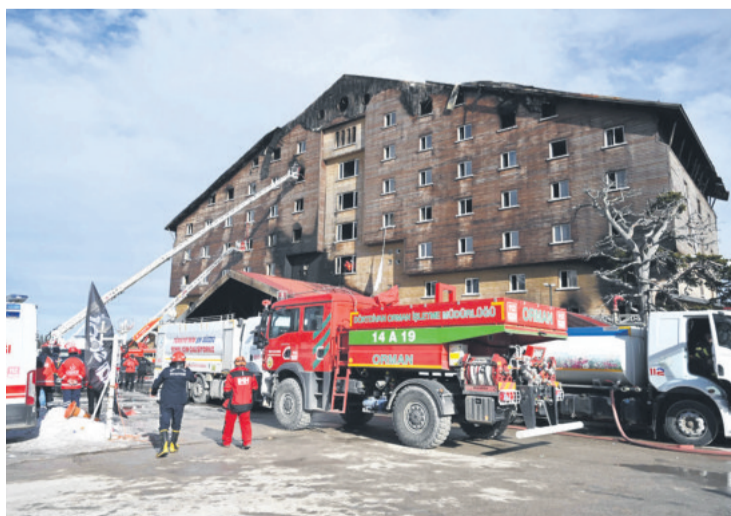
Los bomberos tardaron unas 10 horas en apagar las llamas

Según la emisora NTV, entre los arrestados se cuenta el propietario del establecimiento, ubicado en la estación de esquí de Kartalkaya, a medio camino entre