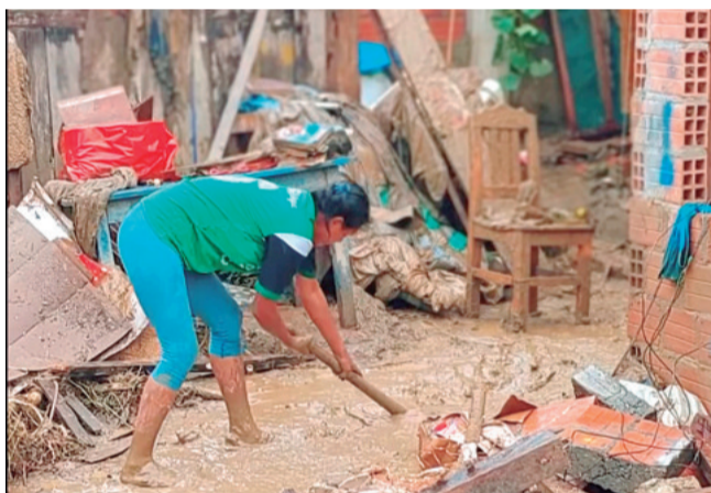
Con herramienta en mano, esta mujer intenta sacar el agua