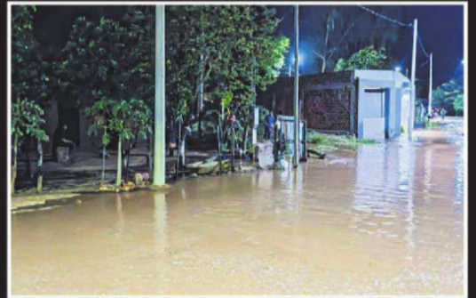
INUNDACIONES. Emergencia en la zona de Yungas

DESASTRE. EVALÚAN RECONSTRUCCIÓN DE VIVIENDAS