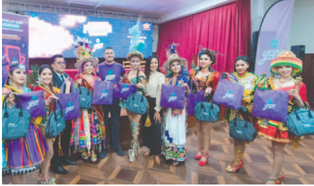
Firma de acuerdo pretende generar movimiento económico de forma digital

“Con Yape como nuestro auspiciador oficial, no solo fortalecemos