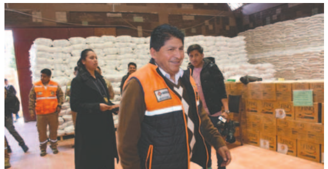
El Viceministro de Defensa Civil, Juan Carlos Calvimontes, realiza la entrega de la ayuda humanitaria

Arce destacó: "Estamos en alerta permanente y llevamos a cabo un