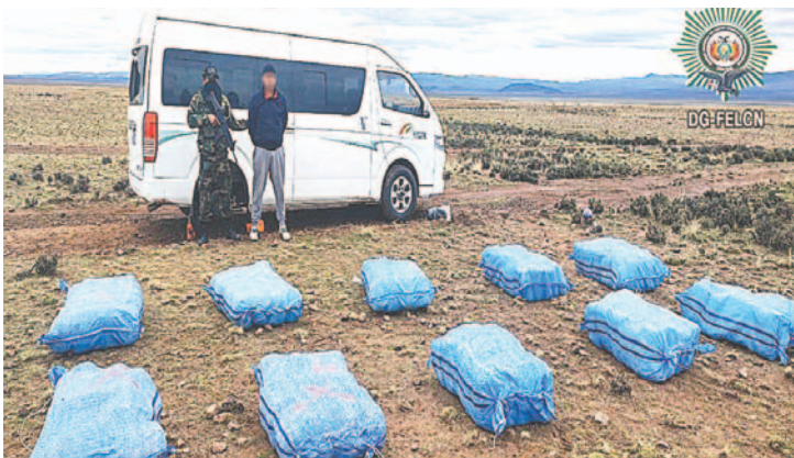
Un hombre fue detenido por agentes antinarcóticos transportando las bolsas de yute