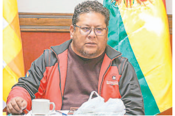
El ministro de Trabajo, Empleo y Previsión Social, Erland Rodríguez

“Tenemos un caso reciente del 8 de enero, una trabajadora del CIES, ha declarado que existía despido injustificado, el