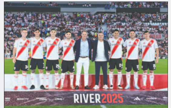
Los nuevos rostros en el equipo de River Plate

La presentación oficial del equipo conducido por Marcelo Gallardo será este sábado de visitante ante Platense por la primera fecha de la Copa de la Liga Profesional Apertura, mientras que el 5 de marzo tiene programada la Supercopa Internacional 2024 ante Talleres de Córdoba, en lo que podría ser el primer título desde el regreso del 'Muñeco' al club a mediados del año pasado.