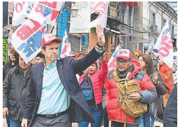
Jorge “Tuto” Quiroga durante su llegada a Oruro

“Hoy día no hay dólares, no ha diésel, gas, el país está en la quiebra y angustia ver en la calle gente que dice sálvenos, estamos desesperados. Hablé con la gente en Oruro y pregunté cómo fue la última Navidad y me indican