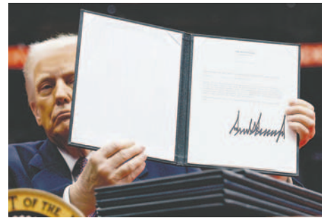
El presidente Donald Trump levanta una orden ejecutiva después de firmarla, en Washington, DC, EE. UU

No existen cifras exactas sobre el número de niños nacidos en EE.UU. de padres indocumentados. Según los datos más recientes del centro de investigación Pew, en 2022 había aproximadamente 1,3 millones de adultos estadounidenses cuyos padres carecían de estatus legal en el país.