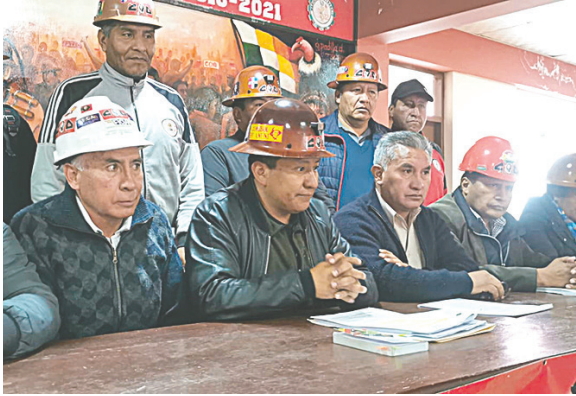
Directorio de la COD hace conocer resolución de ampliado

“Como trabajadores y dirigentes de Oruro tenemos esta preocupación en contra del ministro Erland Rodríguez, pedimos su destitución por ser