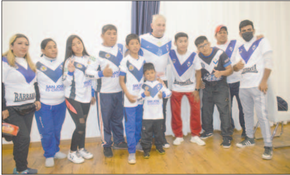
Un grupo de hinchas fue a recibir al estratega argentino

Señaló que la motivación para llegar al club fue que en un corto plazo se lograron buenos objetivos