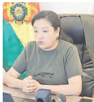
Senadora Daly Santa María en contacto con los medios de comunicación

Indicó que, durante sus primeros dos años de gobierno, Arce se presentaba ante el Legislativo para proporcionar informes; sin embargo,