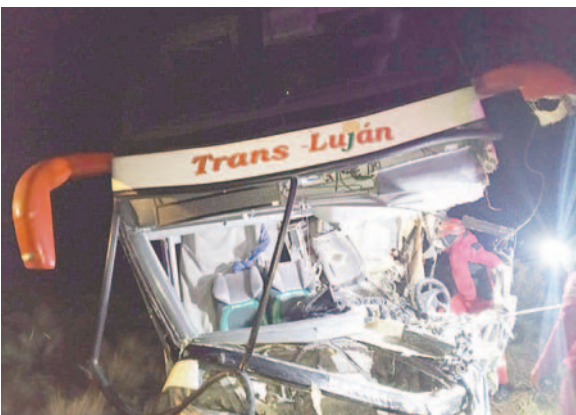
Ambos motorizados terminaron dañados

Rommel Valdez, informó que la vagoneta transportaba sacos de zapatos y bidones de lubricante, mercancía que quedó esparcida en la carretera y que aparentemente era de origen ilegal.