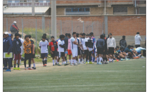
Buena cantidad de deportistas interesados en vestir la casaca "santa"