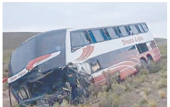
Dos ocupantes del ómnibus resultaron heridos

Las autoridades reiteraron el llamado a los conductores para extremar precauciones en las vías