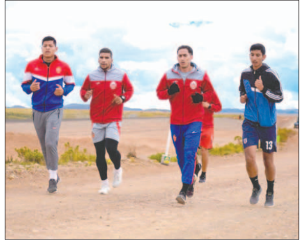
El recorrido de 10 kilómetros fue de mucha exigencia

En el primer recorte de jugadores que se realizó, varios orureños quedaron fuera y se espera que en próximos días más futbolistas puedan añadirse a la plantilla que por el momento realiza labores físicas en su preparación.