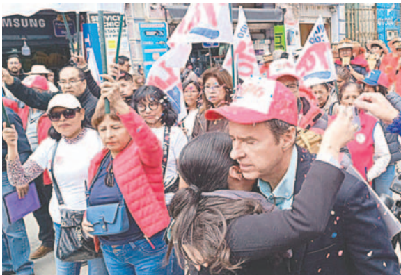
El candidato recorrió las calles de la ciudad y se acercó a la gente

“Queremos un país con libertad, estamos ya con la estructura no sólo territorial, sino jurídica, para inscribir la alianza y la gente se acerca porque entiende que tenemos la propuesta clara para salvar la economía, para estabilizarla y proyectar el futuro haciendo de Bolivia otra vez una potencia minera y no estancada como hace 20 años, hacer revoluc-