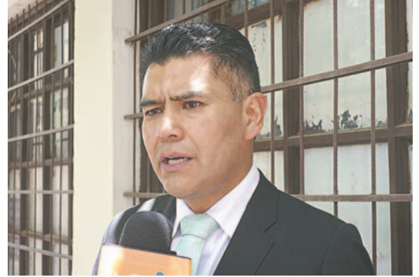
El fiscal Antezana precisó que el autor del crimen se sometió a un procedimiento abreviado que resultó en su sentencia

Según las investigaciones de la Fuerza Especial de Lucha Contra el Crimen (Felcc) y la Fiscalía, los amigos de colegio y camaradas de cuartel, antes del hecho de sangre,