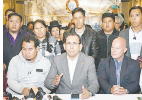
El segundo ampliado multisectorial de productores, empresarios, industrias, gremiales y transporte

"Nos declaramos en estado de emergencia y movilización permanente. Nuestro movimiento irá definiendo y tomando nuevas acciones en caso de que no se realice la derogación del artículo señalado, ya que este no afecta a los gremiales, solo a quienes oculten los productos a la población.