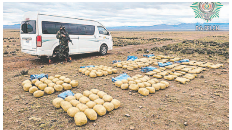
Incautaron 200 paquetes de marihuana durante operativo en la ruta Oruro-Uyuni

agentes antinarcóticos identificaron un minibús de color blanco, marca Higer. Tras la revisión, hallaron diez yutes con paquetes que contenían una sustancia verdusca que, a la prueba de