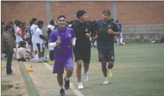
Varios jugadores del primer plantel también iniciaron su preparación

Por ahora el club está siendo administrado por el Tribunal de Ho-