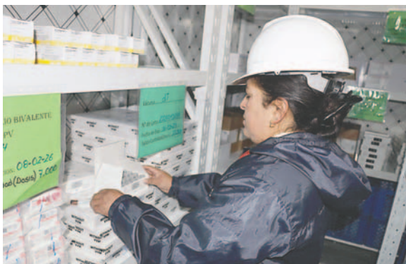
Oruro recibe un nuevo lote de vacunas contra el covid-19

“ahora que estamos en época de inscripción, los niños que tienen entre 12 y 15 años y que están en unidades educativas deberían hacerse vacunar”, considerando que en la resolución 001 de la gestión 2025 del Ministerio de Salud se establezca que deben cumplir y completar el esquema vacunal.