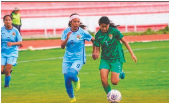
Beni aprovechó los momentos precisos para revertir el marcador

A Oruro se le hace cuesta arriba el torneo. Este miércoles, desde las 13:30 horas, en la cancha auxiliar del estadio Patria, deberá buscar una victoria por cualquier resultado ante el combinado de Tarija. De perder ese encuentro, complicará en demasía su clasificación a la próxima instancia.