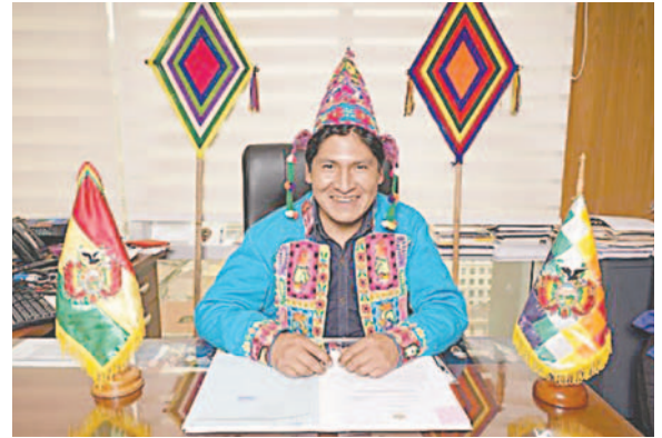
El viceministro de Descolonización y Despatriarcalización,