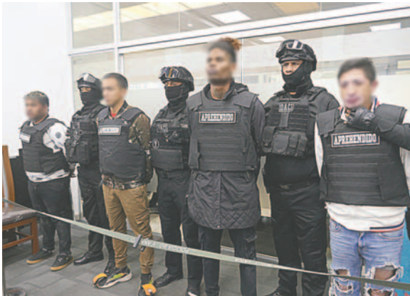
Tres de los cuatro capturados fueron enviados a la cárcel

Los cuatro sujetos fueron aprehendidos como parte de las investigaciones de la Fuerza Especial de Lucha Contra el Crimen (Felcc) tras