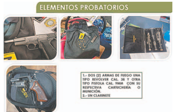
La fuerza anticrimen secuestró armas de fuego utilizadas por los implicados

Tras este último episodio, la Felcc inició las investigaciones, logrando en primera instancia