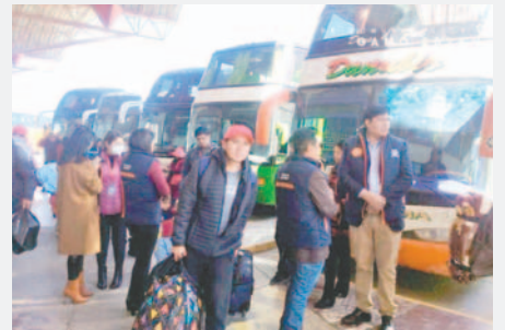
Control de viaje de menores se intensificará