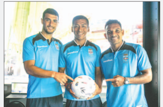
La entidad cruceña probará a sus nuevos refuerzos en el partido del domingo

El primer partido entre Blooming y El Nacional será el 6 de febrero (20:30) y la revancha en Quito se llevará adelante una semana después. El ganador de esta llave avanzará a la segunda fase, donde Barcelona (Ecuador) espera por conocer a su oponente.