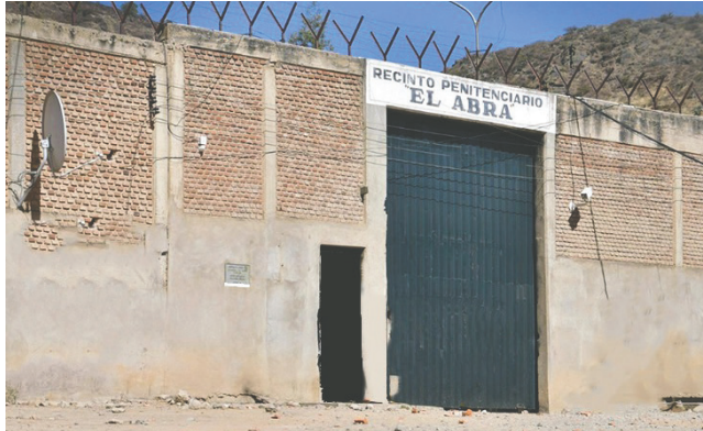
La justicia dispuso que la condena sea cumplida en el penal de El Abra /REFERENCIAL

indicó que Félix acudía frecuentemente al domicilio de la joven para profesar su culto junto a su familia. Aprovechaba momentos en que ella iba al baño o se encontraba sola para agredirla sexualmente. Este comportamiento se habría repetido en varias ocasiones hasta que los vecinos aler-