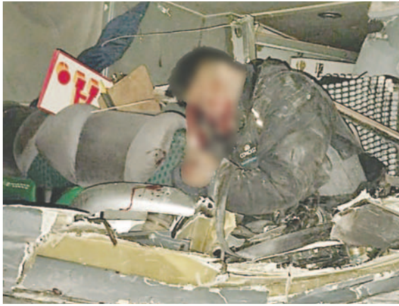
El conductor del ómnibus murió atrapado entre los fierros de su coche

El jefe de la División de Accidentes de Tránsito de Oruro,