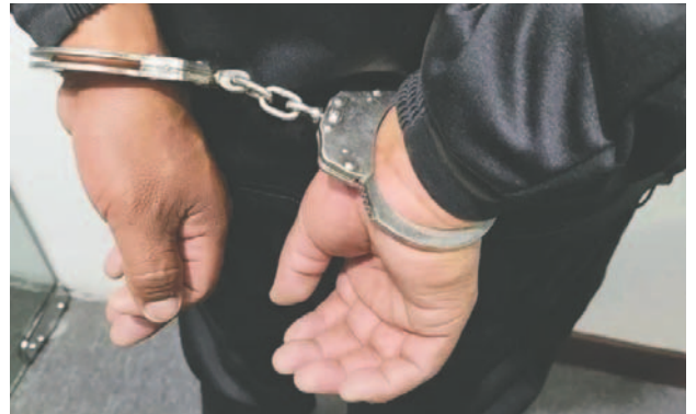
La sentencia debe ser cumplida en el penal de Palmasola /REFERENCIAL