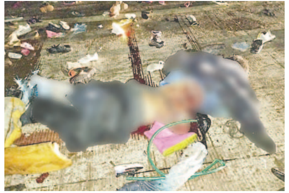
El chofer de la vagoneta no fue reconocido. Sus restos fueron trasladados a la morgue judicial

El caso fue remitido al Ministerio Público para que se desarrollen las investigaciones correspondientes y se determinen responsabilidades.