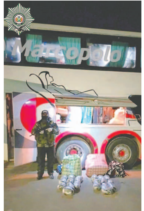
Buscan identificar a la persona que tenía que retirar la narcoencomienda