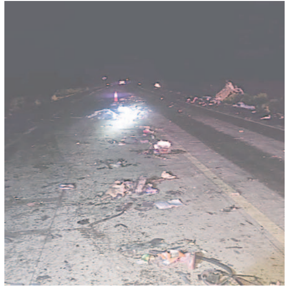
De esta manera terminó la carretera, tras la colisión frontal