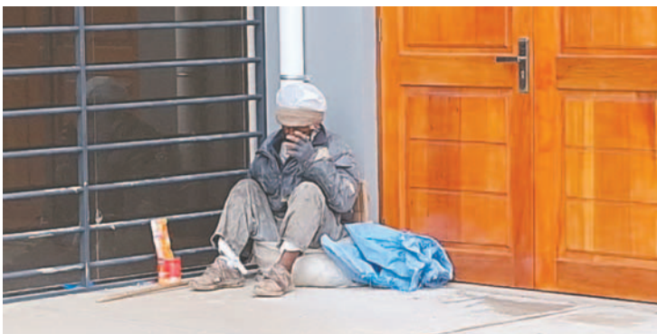
El adulto mayor llevaba más de un día en situación de abandono

Defensorial de Oruro se ratificó que el compromiso con la defensa de los derechos de las personas adultas mayores y se agradeció la colaboración ciudadana para identificar y reportar situaciones de vulnerabilidad.