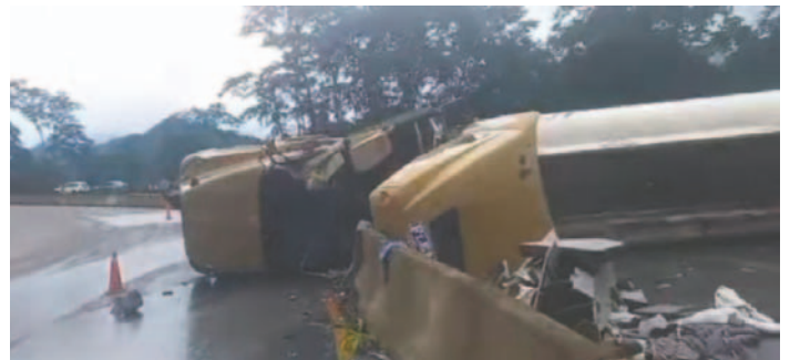
Un vuelco de cisterna en Villa Tunari resultó en la muerte del conductor y dejó a cuatro personas heridas

El conductor quedó atrapado entre los fierros del vehículo tras el vuelco. La situación ha llevado a las autoridades locales a revisar las condiciones de seguridad en esa sección de la carretera.