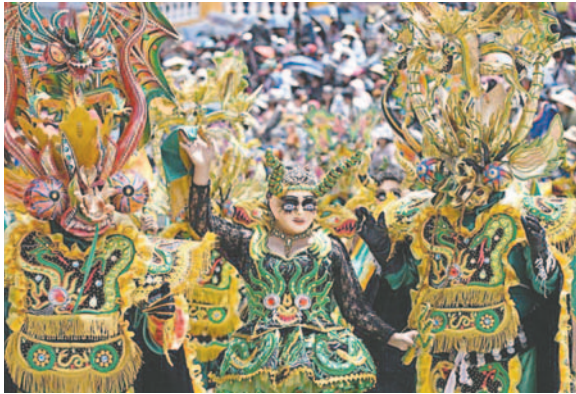
ACFO compromete solucionar denuncias de discriminación