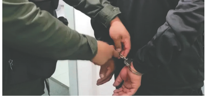
La Fuerza Especial de Lucha Contra la Violencia detiene a un juez, acusado de corrupción de menor y abuso /REFERENCIAL

Mientras tanto, el juez se encuentra en celdas policiales y en las próximas horas será conducido a una audiencia de medidas cautelares.