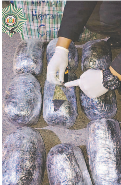
Prueba de narcotest dio positivo para marihuana

La guía utilizada por la empresa de transporte solo contenía el nombre del destinatario en Tupiza. Esto limita las posibilidades de rastrear a quien envió la marihuana desde Oruro. Las autoridades continúan trabajando para esclarecer los detalles del caso y determinar responsabilidades.