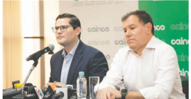
Directivos de la Cainco piden claridad al Gobierno sobre la economía del país

Cuestionó el modelo económico defendido por el Gobierno y planteó si este dejó de ser efectivo o nunca fue sostenible. Además, señaló que la industrialización, propuesta como solución, no benefició a los pequeños