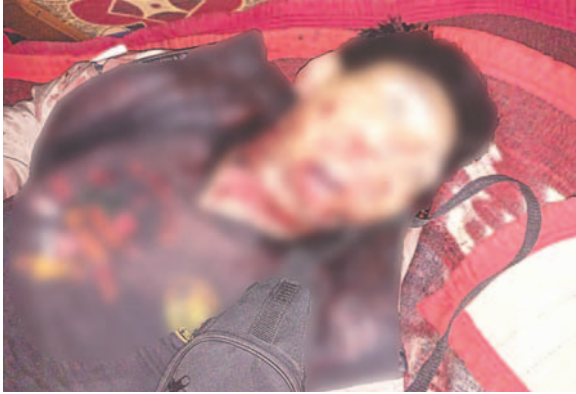
La víctima recibió 17 puñaladas por su amigo tras consumo de alcohol

Entre las pruebas presentadas, el fiscal enumeró la presentación de los informes policiales que reflejan la cronología del crimen, la entrevista a