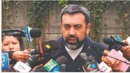
El exviceministro de Autonomías, Álvaro Ruiz