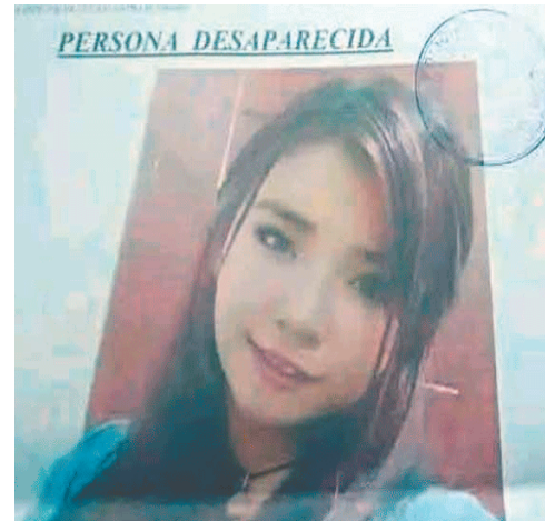
Foto del afiche de la madre reportada como persona desaparecida

Neme anunció que, como parte de las investigaciones, se llevará a cabo un rastillaje con canes en el interior del inmueble identificado, además de pruebas químicas de luminiscencia para detectar posibles restos de sangre u otros indicios que puedan aportar información relevante sobre la desaparición.