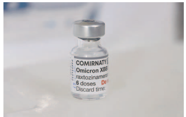
Dosis Pfizer fueron distribuidas a centros de salud de todo el departamento /SEDES

Todas las dosis fueron distribuidas a todos los centros de salud, no solo del área urbana, sino también del área rural. Según explicó Rozo, aquellas personas que no tienen un esquema vacunal deben acceder a la dosis única, mientras que quienes ya tienen un esquema vacunal deben recibir la vacuna