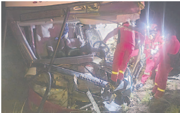
Personal de Bomberos realiza el rescate al cadáver del conductor