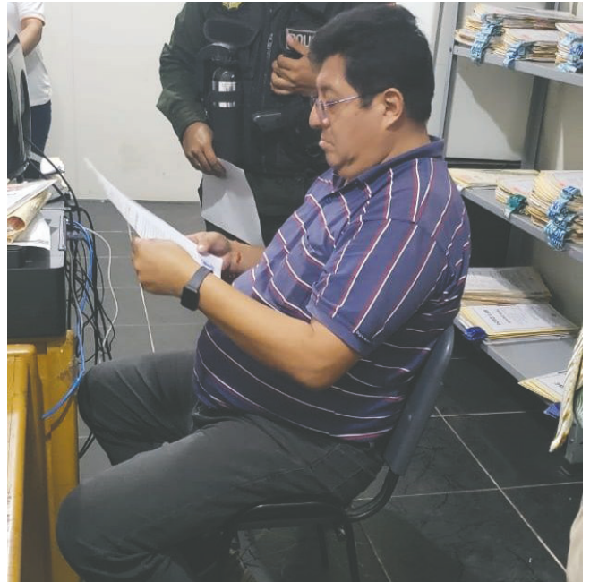
El implicado en instalaciones de la Policía tras ser aprehendido /EDUARDO DEL CASTILLO

En esa línea, el jefe policial declaró que se presentó en el Ministerio Público para ayudar con la investigación. “Me estoy presentando voluntariamente a la Fiscalía para poder defenderme en el proceso por todas estas mentiras que están sucediendo. Quiero decir que no me han aprehendido, me he presentado voluntariamente (...) todo