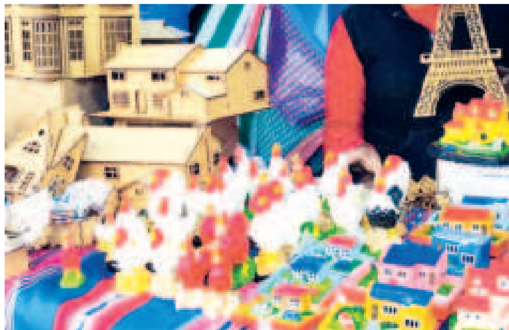
Los artesanos exponen sus productos en yeso y madera.