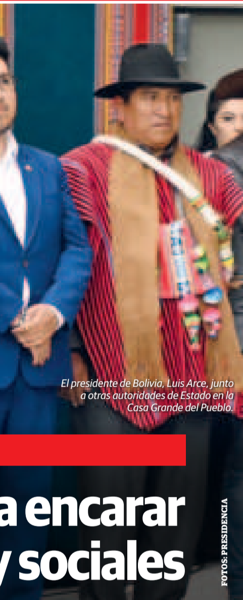
El presidente de Bolivia, Luis Arce, junto a otras autoridades de Estado en la Casa Grande del Pueblo.