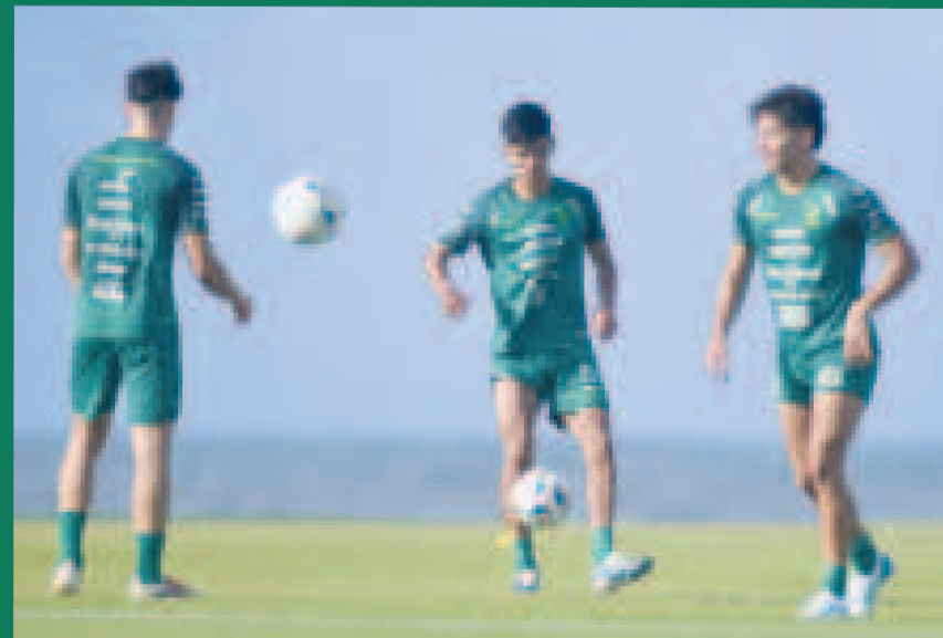
Jugadores de la Selección Sub-20 en plena tarea de dominio de balón, en Valencia.