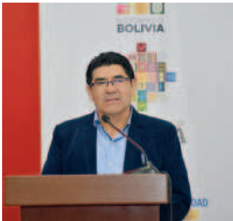
Las denuncias contra el ministro Véliz están en investigación.