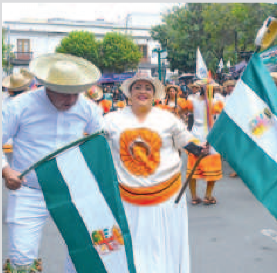
La ministra María Nela Prada, vestida con el traje de la danza típica del oriente boliviano.

Por ello expresó la importancia de este pacto que busca "consolidar no solamente un Estado Plurinacional, sino una estabilidad política y económica" en el territorio nacional.