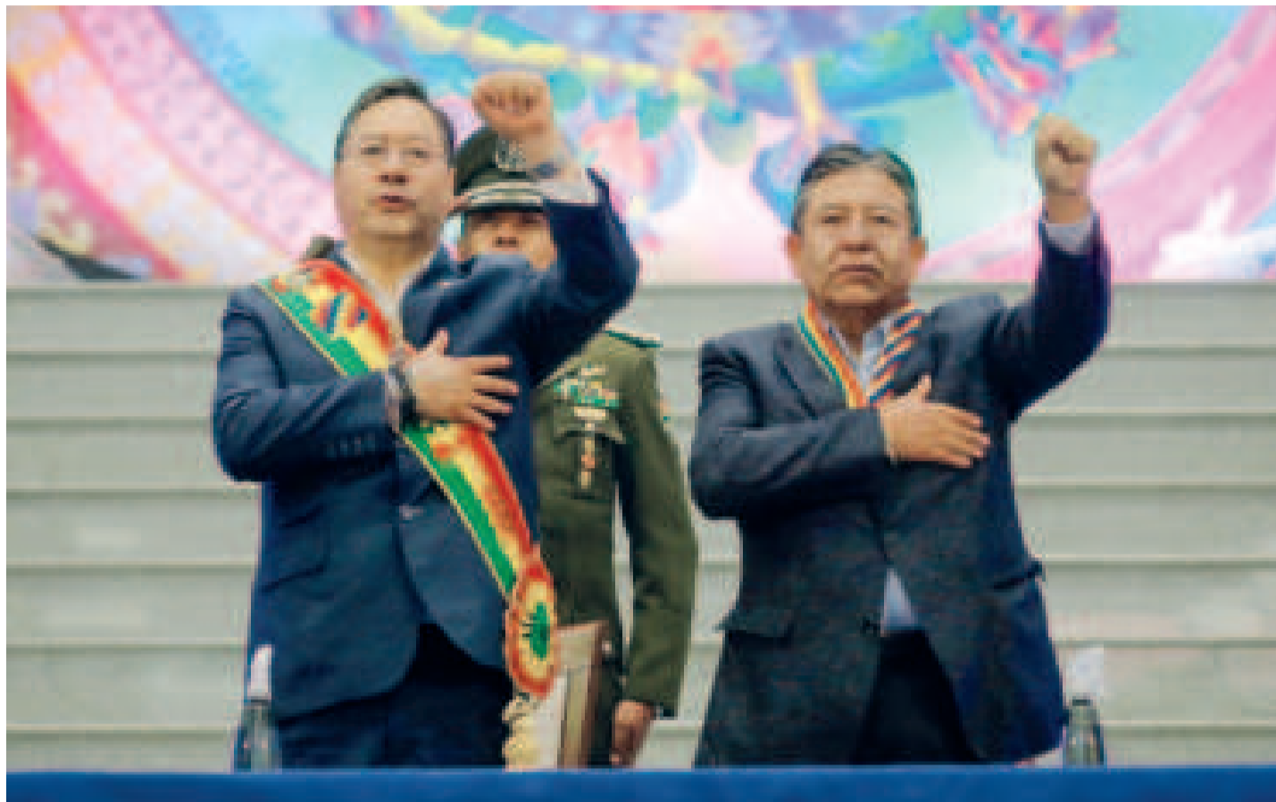
Una mujer baila la danza saya afroboliviana.