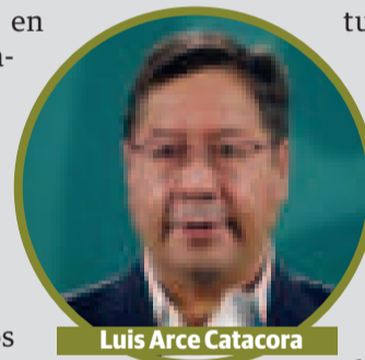
Luis Arce Catacora

Ante las intensas lluvias se desbordó el río San Miguel del Bañado, en Monteagudo, generando diversos problemas.