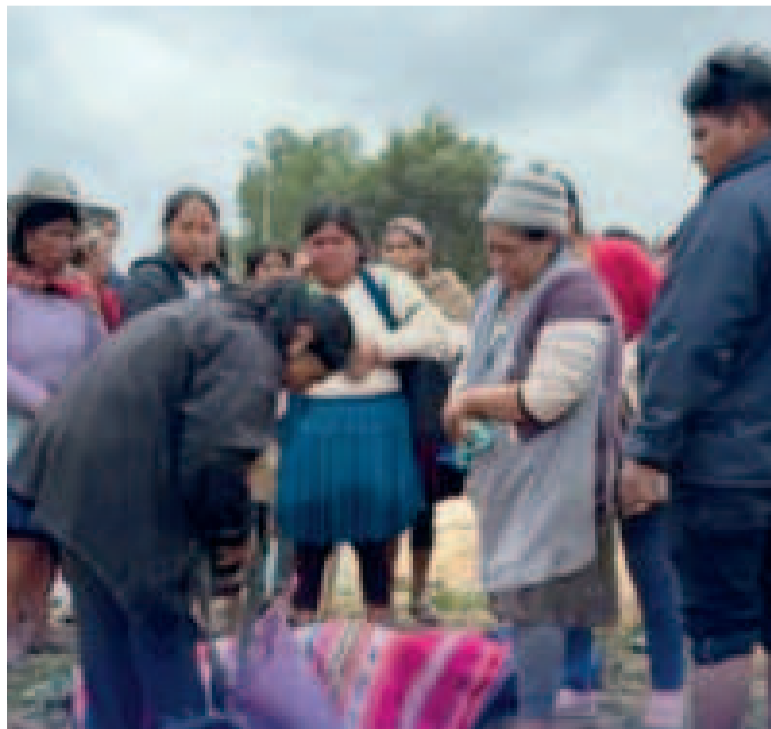
Encuentran sin vida los cuerpos de las hermanas arrastradas por un río en Sacaba.