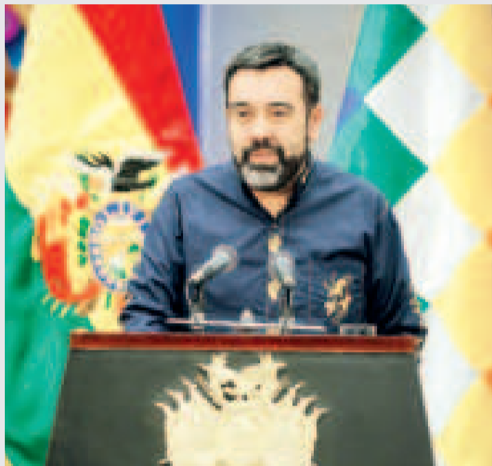
Álvaro Ruiz jura como nuevo Ministro de Medio Ambiente y Agua.

“Hoy (ayer) en Casa Grande del Pueblo posesionamos al hermano Álvaro Ruiz como nuevo ministro de Medio Ambiente y Agua, que tiene la misión de acelerar los proyectos del sector porque son importantes obras que nuestras hermanas y hermanos