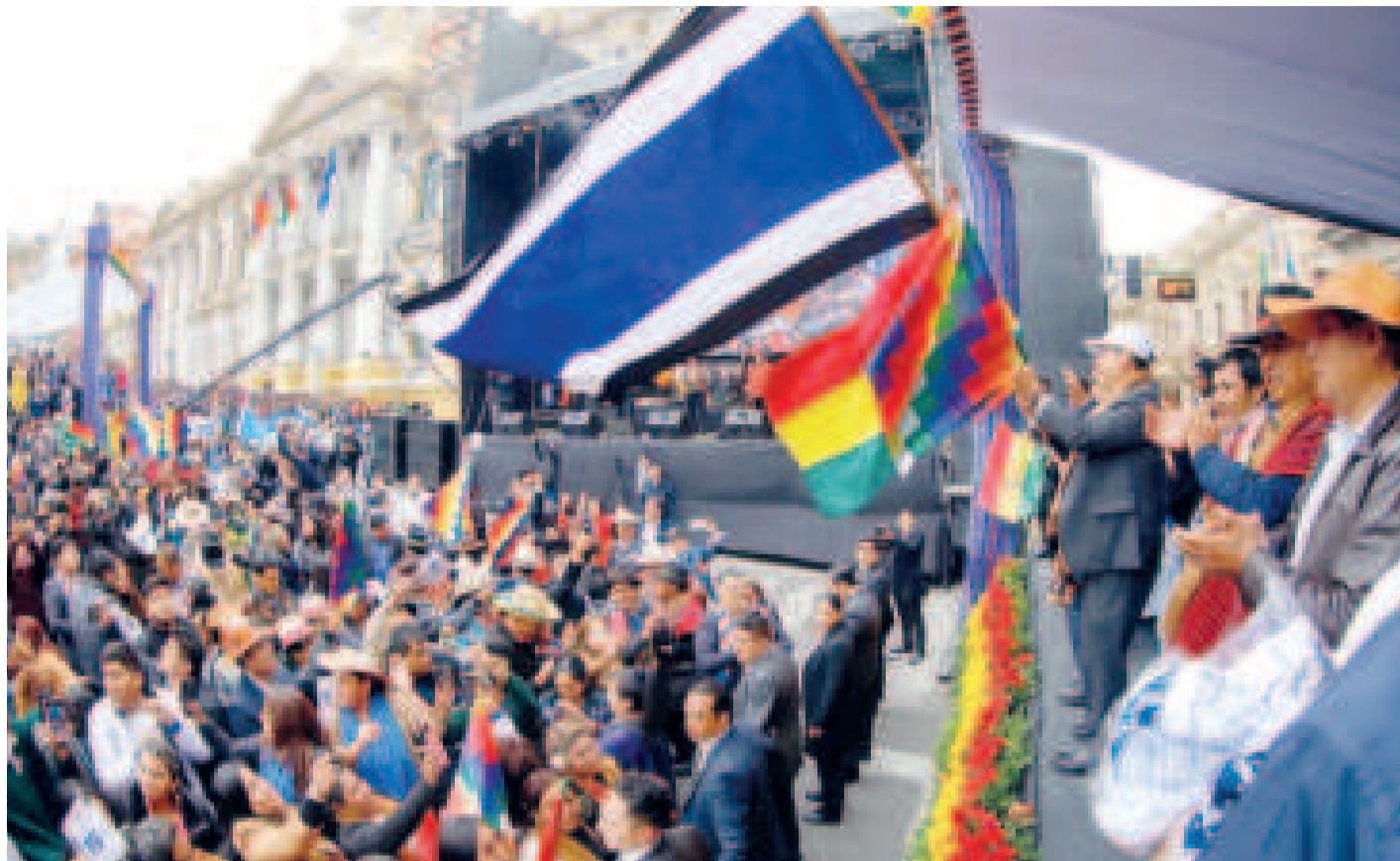
El acto de celebración del Estado Plurinacional en la plaza Murillo, en 2024.

Hay al menos otros 10 avances que tienen que ver con temas educativos; de acceso a la salud; en derechos de las mujeres, de la niñez y adolescencia; inclusión financiera; igualdad de género; lucha contra la discriminación; reducción de la pobreza; índices de deserción escolar; soberanía de la producción alimentaria,