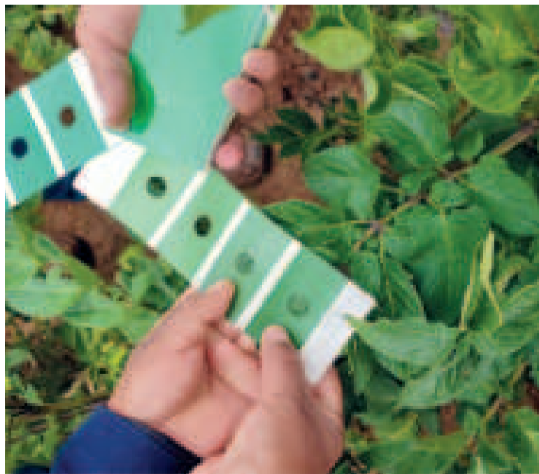
Las mediciones y evaluaciones en las plantas de papa.