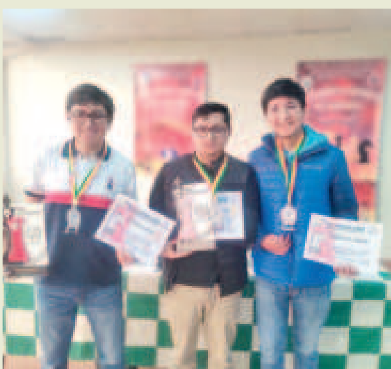
Los ganadores de la rama masculina del Grand Prix de Ajedrez.