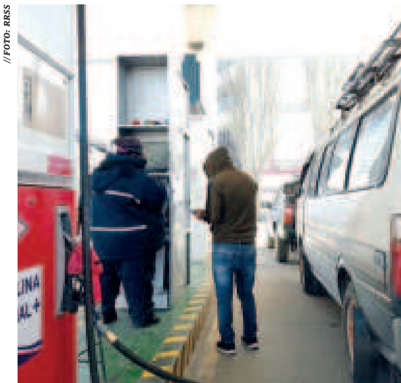
Las estaciones registran el normal abastecimiento de combustibles.