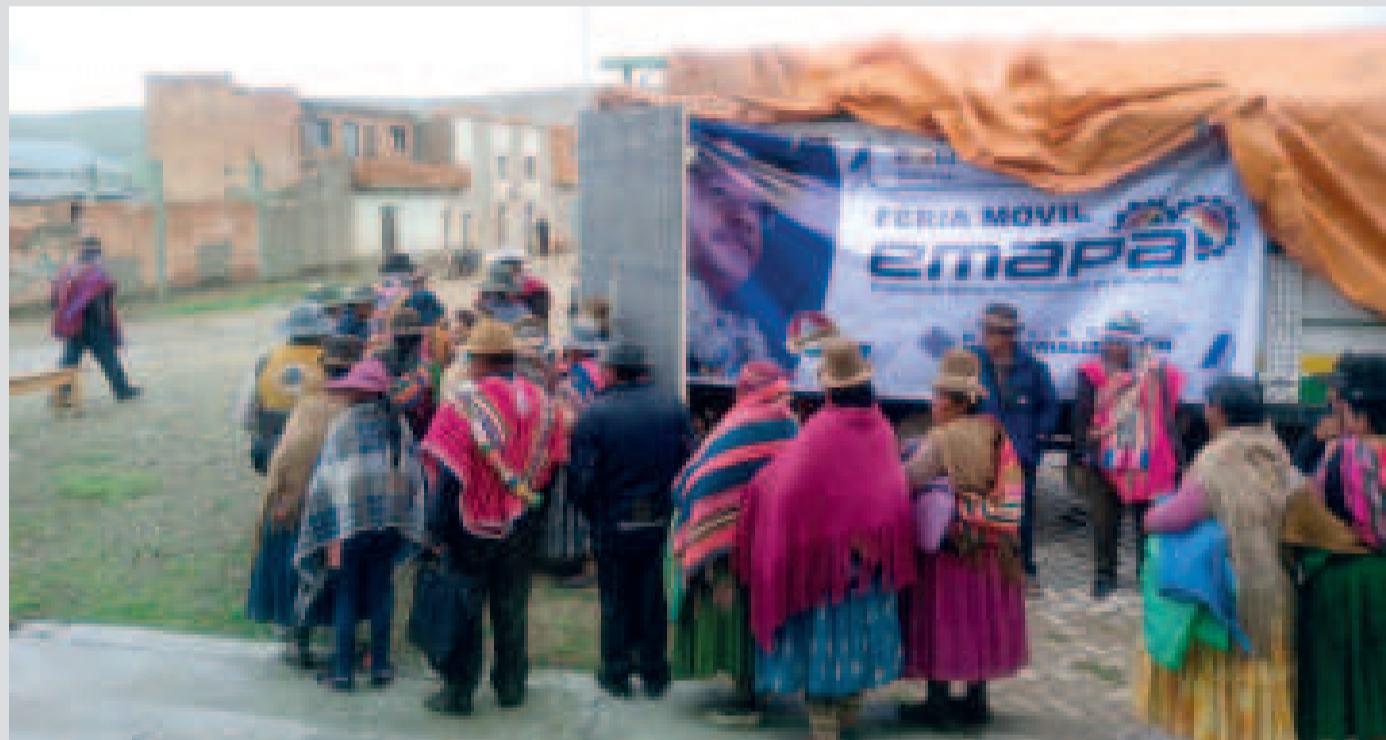
La visita de los camiones de Emapa al municipio de Corocoro, en la provincia Pacajes del departamento de La Paz.

En su primer recorrido, los camiones de la estatal llegaron a nueve municipios de La Paz con la oferta de alimentos a precios justos.