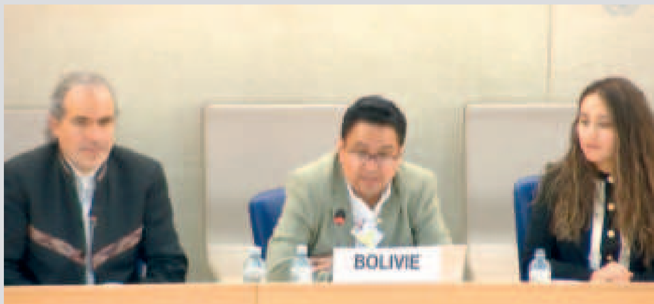
El ministro de Justicia, César Adalid Siles Bazán, presenta el informe.

El informe, presentado ayer en Ginebra, subraya la implementación de políticas clave y el compromiso con los DDHH en el año del Bicentenario.