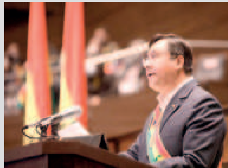
El presidente de Bolivia, Luis Arce.

También remarcó “la validez del principio de la no injerencia”.