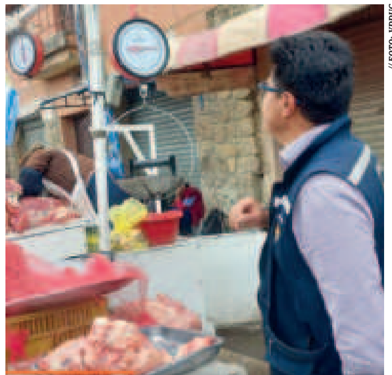
Verificativos en las balanzas durante el operativo.

Estos representan un esfuerzo conjunto entre instituciones locales y nacionales para fortalecer la confianza de los consumidores en los mercados y promover prácticas comerciales justas en el municipio de Quillacollo.