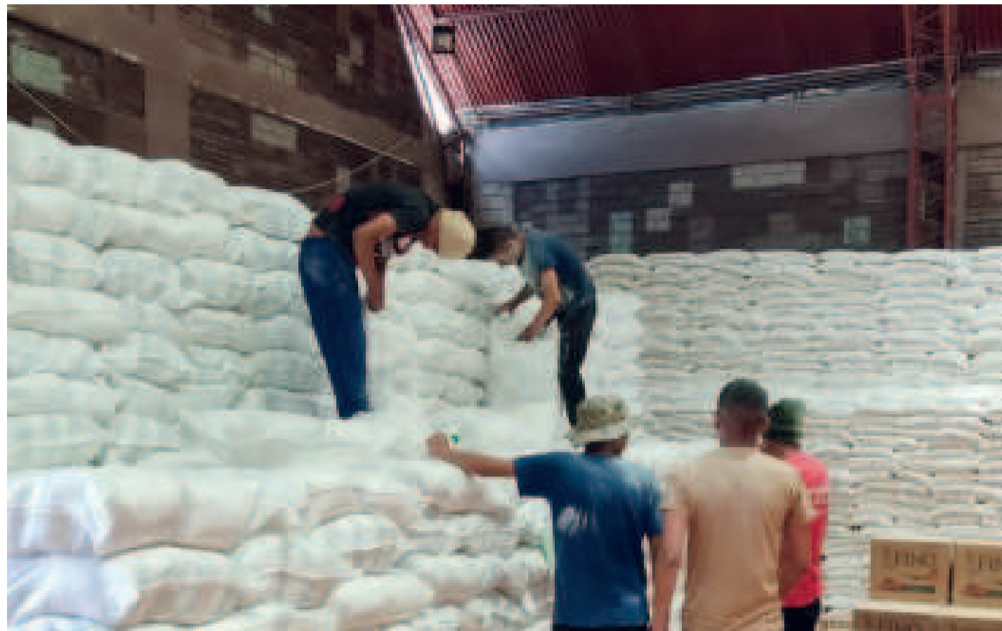
Envío de 3,2 toneladas de ayuda humanitaria a Taipiplaya, La Paz.

“Estamos cumpliendo el mandato del presidente Luis Arce de asistir de forma inmediata a los municipios donde se registran eventos adversos y en esta oportunidad para atender a las familias damnificadas por la riada en el municipio de Ca-