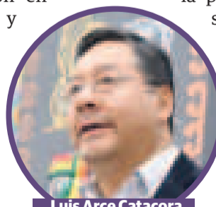
Luis Arce Catacora

El presidente Arce aseguró que en esta línea de gestión es importante el respaldo de las organizaciones sociales del país.