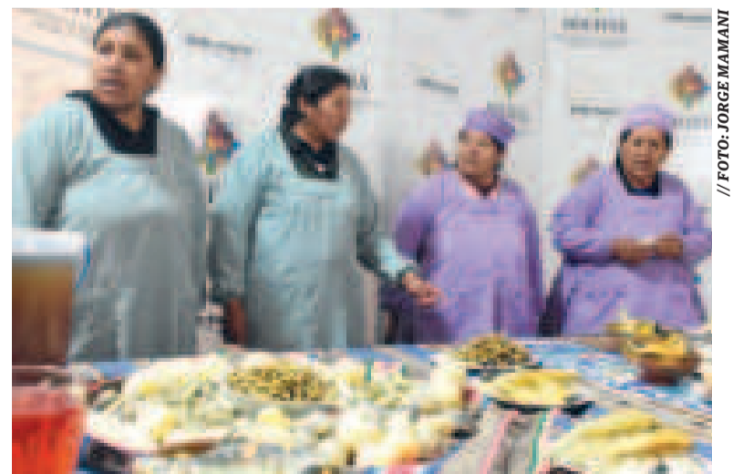
Parte de la gastronomía que promete la cuarta versión de la Feria del Pescado.

Además de los platos típicos, el evento contará con una exposición de la IPD-PACU sobre producción primaria de alevines y reproductores en el Centro Piscícola de Tiquina. La Armada Boliviana también