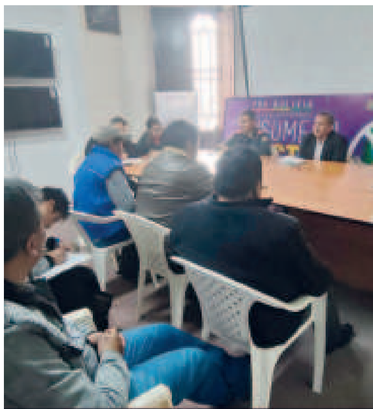
Autoridades nacionales en Charaña, junto a transportistas.

Al menos 8 mil militares en todo el territorio nacional desarrollan los controles en frontera, en coordinación con las Fuerzas Armadas (FFAA), para combatir el contrabando, con el objetivo de obtener mejores resultados y neutralizar puntos en los que se cometen ilícitos que perjudican al país.