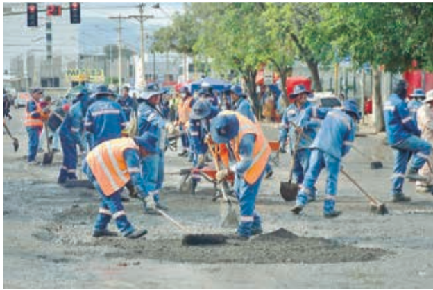
El trabajo de bacheo en la avenida Ayacucho. CARLOS LÓPEZ

“Estos trabajos debían haberse realizado en los meses de noviembre y diciembre, pero la falta de combustible, agregado y cemento asfáltico, no se logró cumplir con lo que