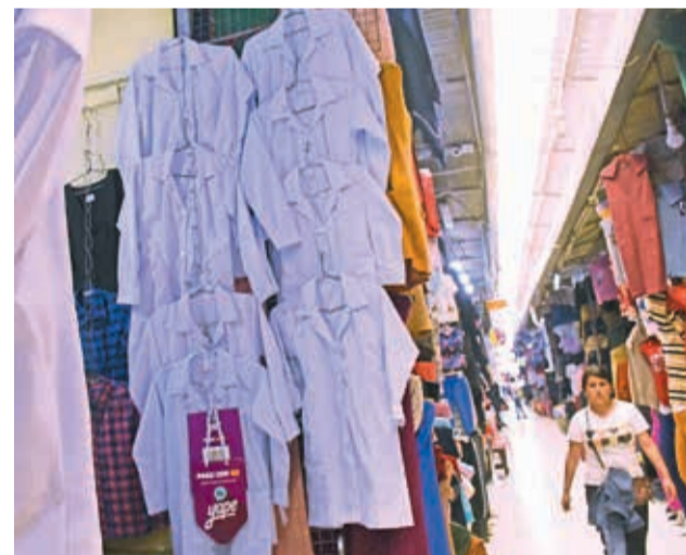
La venta de guardapolvos y uniformes.