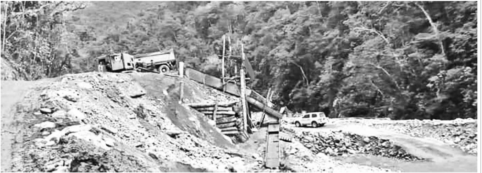
Explotación de oro en el Parque Nacional Madidi, una de las áreas protegidas de Bolivia. ALEX VILLCA