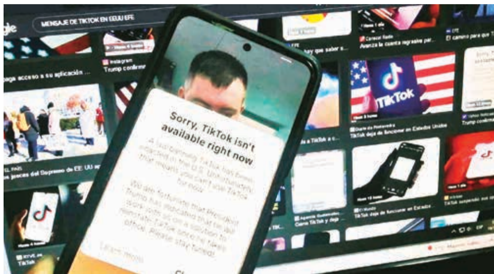
El mensaje de despedida de la aplicación a sus usuarios en Estados Unidos.

En un comunicado, TikTok agradeció la intervención del presidente. "Trabajaremos con el presidente Trump para encontrar una solución sostenible que permita que TikTok continúe operando en Estados