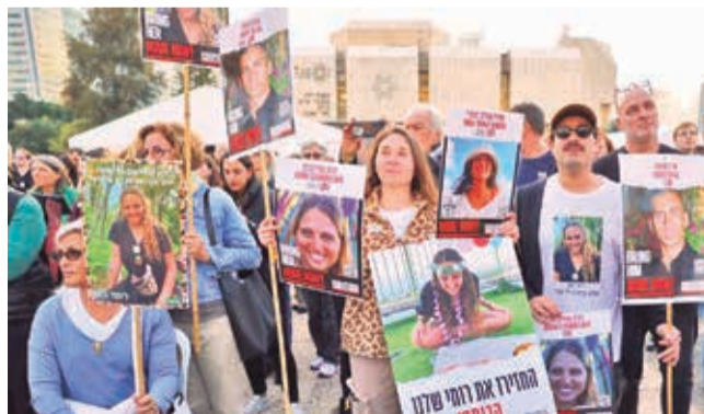
Israelíes esperan la liberación de sus familiares.

Apronte. A pesar de la tregua, el jefe del Estado Mayor del Ejército israelí, Herzl Halevi, aseguró que las tropas permanecen en alerta