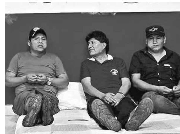
Evo Morales permanece atrincherado en el trópico. RKC

"No solo son poco éticos, sino también una falta de respeto hacia el pueblo y a los médicos que realizan su labor con profesionalismo, siguiendo las normativas y protocolos establecidos", escribió Castro en sus redes sociales.