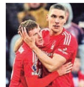
Celebración de los jugadores de Nottingham Forest.