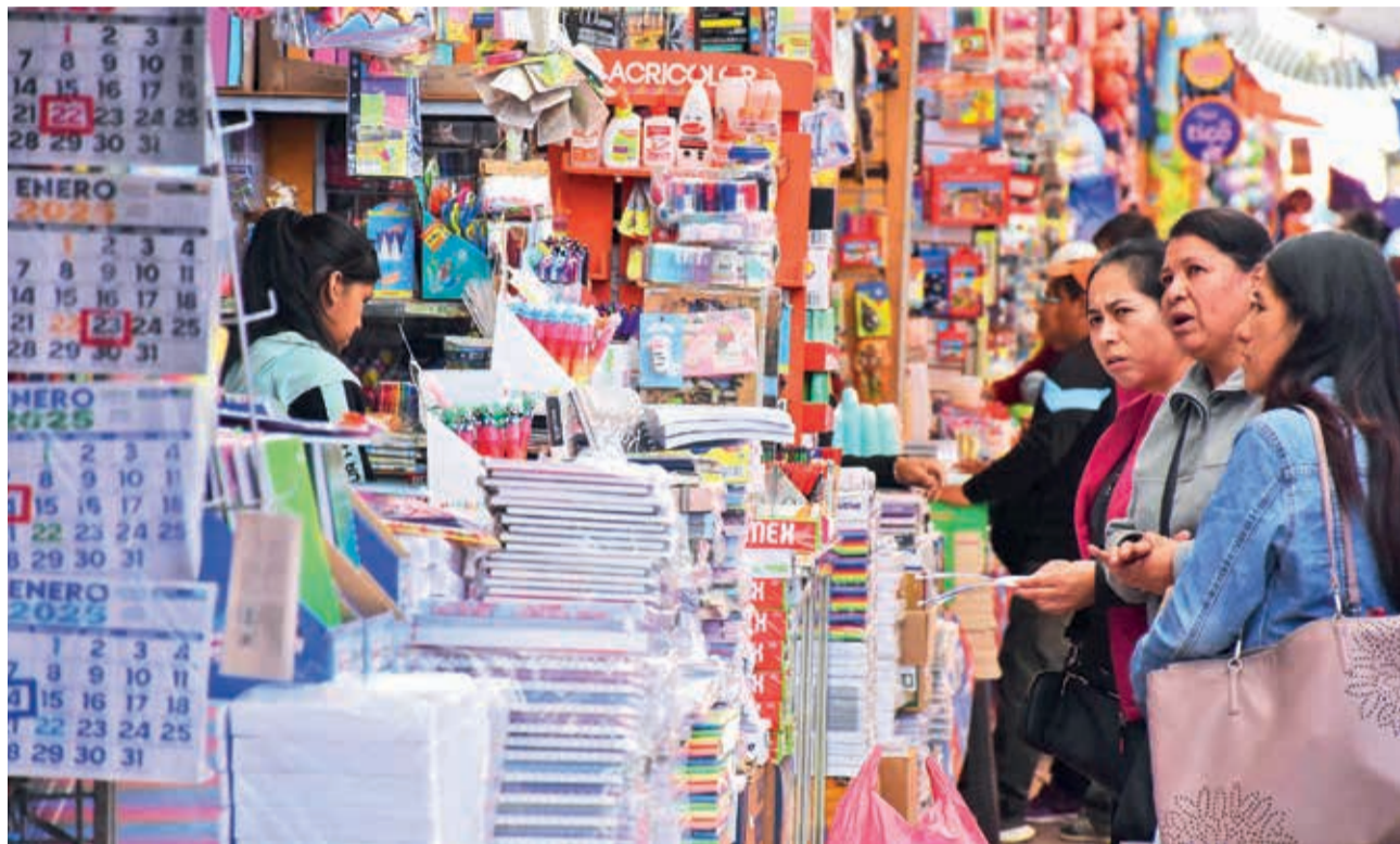
La venta de material escolar por mayor y unidad en La Cancha en Cochabamba.

La crisis redujo la demanda de prendas. Alconz contó que en otros años los confeccionistas elaboraron hasta 500 prendas, en 2024 la demanda bajó a 50, pero ahora se limitarán a trabajar a pedido por la crisis.