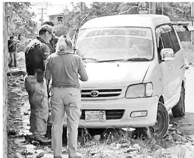
El motorizado en el que fue asesinado un hombre.