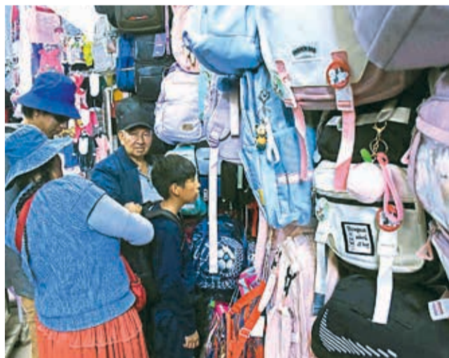
Un padre preguntan por la oferta de mochilas.