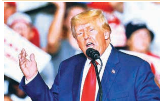
El presidente electo de EEUU, Donald Trump.

Desde el inicio de las hostilidades en octubre, el conflicto ha dejado miles de muertos y desplazados en la Franja de Gaza. Las fuerzas israelíes han informado de la muerte de cerca de 3.000 combatientes de Hamás en la región norte del enclave.