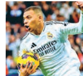
Kylian Mbappé, autor de un doblete para Real Madrid, ayer.