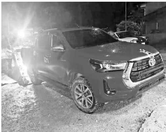
La camioneta que recibió 38 disparos. LT