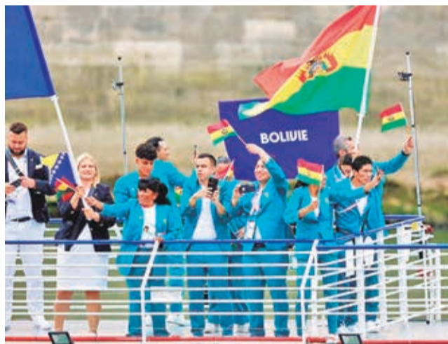
La delegación nacional en los últimos Juegos Olímpicos París 2024. MIN DEPORTES