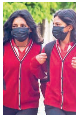
Estudiantes con medidas de bioseguridad.