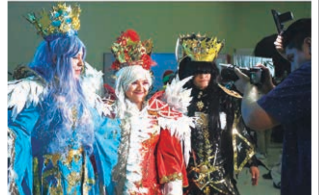
Así se desarrolló el Overload, ayer.

Según el intendente, Enrique Navia, el grupo de jóvenes no salió de un local de la zona. Una familia fue víctima de los antisociales, que fueron capturados y llevados a la Policía.