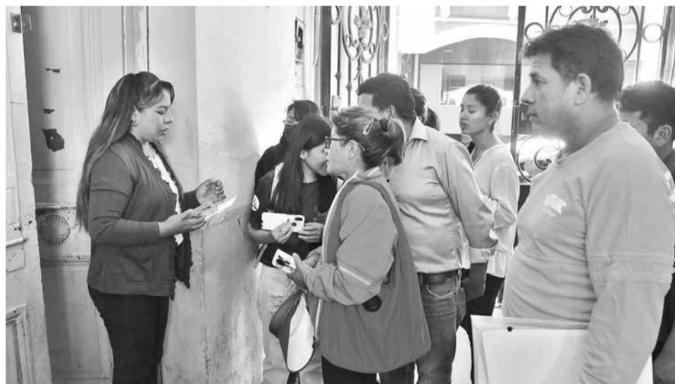
Padres de familia hacen fila para inscribir a sus hijos.

1. Incremento de pensiones: Las unidades educati-