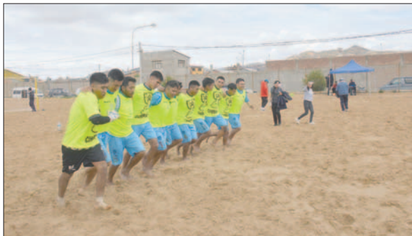
Durante la vuelta olímpica de los campeones (sin trofeo)