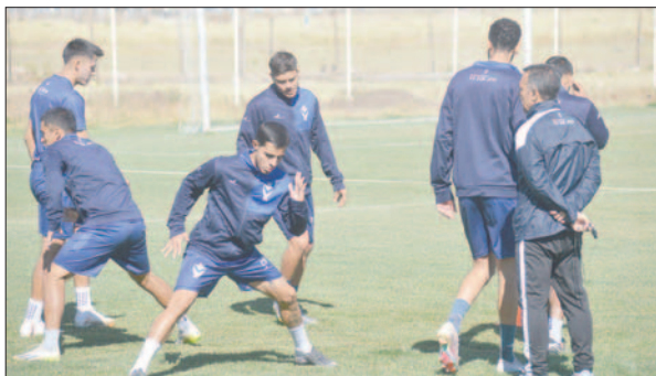
La pretemporada en GV San José arranca a más tardar este miércoles

GV San José terminó el año 2024 cosechando un torneo internacional y la premisa de este año será mejorar dicho logro, algo que el nuevo estratega deberá tomar en cuenta para planificar de la mejor manera la pretemporada y así llegar en las mejores condiciones al campeonato nacional.