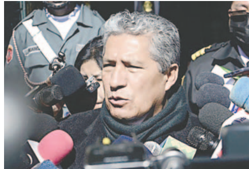
El ministro de Defensa, Edmundo Novillo

"La mentira y la difamación del `evismo`, utilizada de forma sistemática, continuada y perversa, busca manipular la sensibilidad humana victimizándose con el único fin de ganar adhesiones y apoyo político electoral. Es