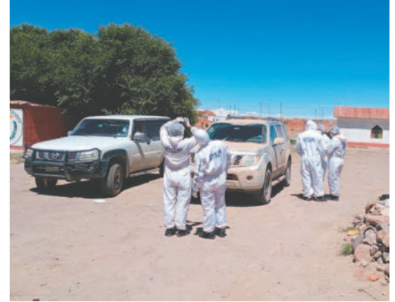
Tareas de investigación realizadas en el vehículo

El vehículo afectado, una camioneta Hilux con placa 5722-DFA, fue trasladado a la Fiscalía Departamental en Oruro, mientras que el cuerpo de la víctima fue enviado a la morgue del Cementerio General de la ciudad. La investigación continuará para esclarecer los hechos y determinar responsabilidades.