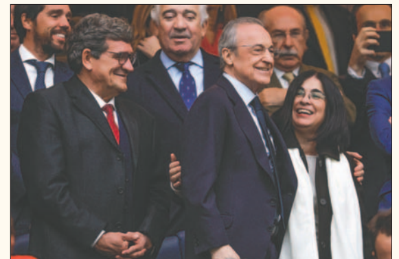
Florentino Pérez continuará de presidente en Real Madrid hasta 2029

En el año 2000 se inició la etapa del que Pérez se ha convertido en el presidente con más títulos de la historia del Real Madrid, superando a Santiago Bernabéu. Ha logrado 65 títulos entre las secciones de fútbol y baloncesto, incluidas siete Copas de Europa de fútbol y tres de baloncesto.