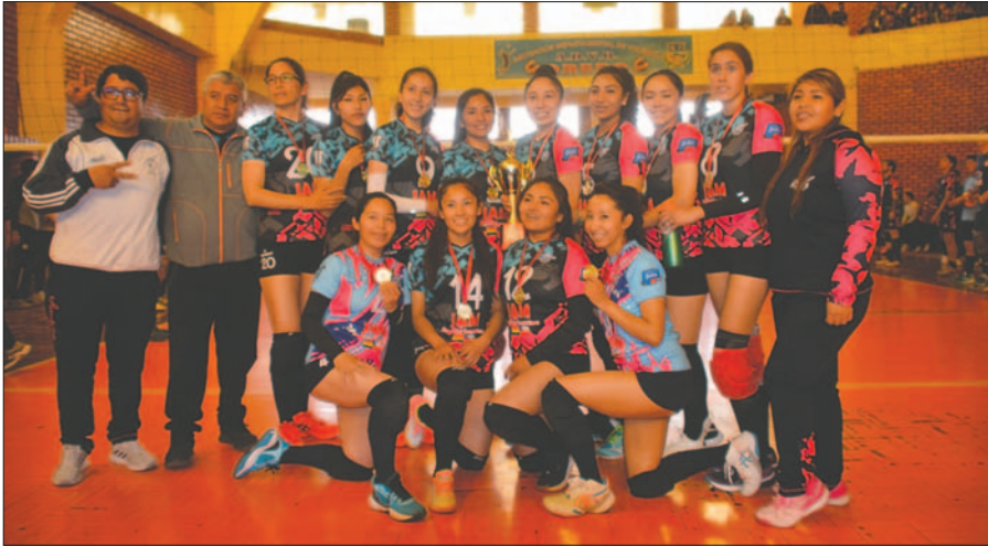
América buscará ser protagonista en el torneo clasificatorio a Liga Superior