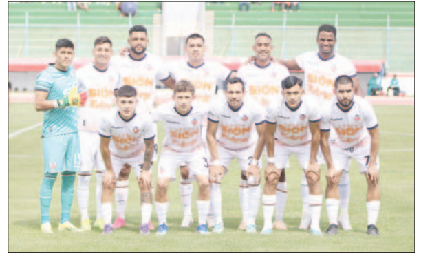
Royal Pari apela a todas las posibilidades para seguir en la División Profesional / APG

Se agregó que en este momento lo que se está peleando es levantar la dura sanción impuesta a dos jugadores del club, lo cual representa no solo una afectación a la mermada cantidad de futbolistas, sino también a las arcas del club por los montos económicos adicionales que se deben cancelar. Se está en busca de apelar la determinación del Tribunal de Disciplina Deportiva de la AFO, para así tratar de minimizar las sanciones.