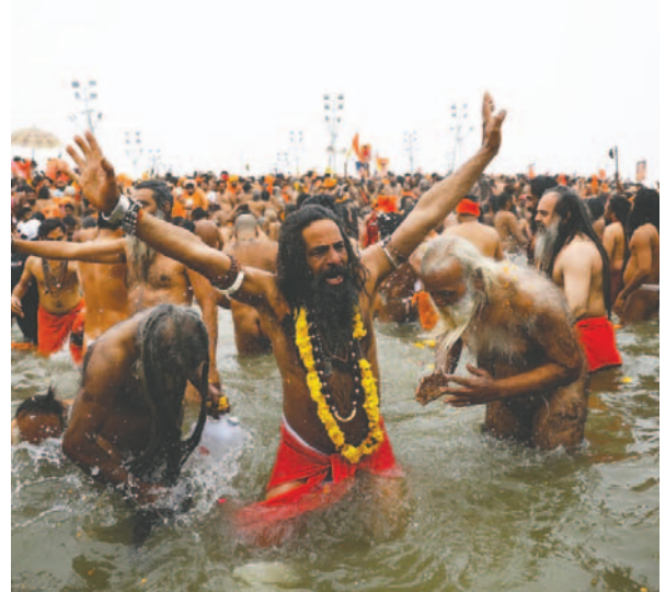
Más de 50 millones de personas ya han participado del festival