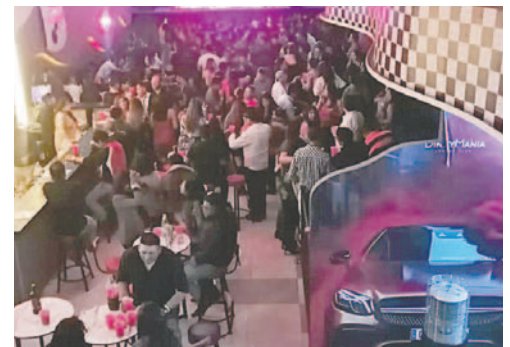
Concejal defiende ley sobre locales de expendio y consumo de bebidas alcohólicas /LA PATRIA

Flores afirmó: "Si digamos el nuevo directorio decide que esto vaya o no, es un tema del pleno, pero yo digo que hay grandes intereses de estos locales clandestinos que esta ley les afecta. Si el Consejo no promulgara, Oruro va a ser la tierra del crimen; el índice de delincuencia ha crecido mucho y todo lo