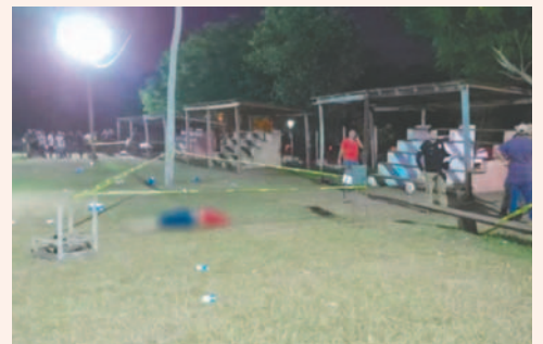
Tres fallecidos y dos agentes policiales heridos tras tiroteo en una cancha de fútbol

Uno de los agentes recibió un disparo en la espalda y fue trasladado a Asunción, donde se encuentra estable. El otro sufrió una herida en el brazo