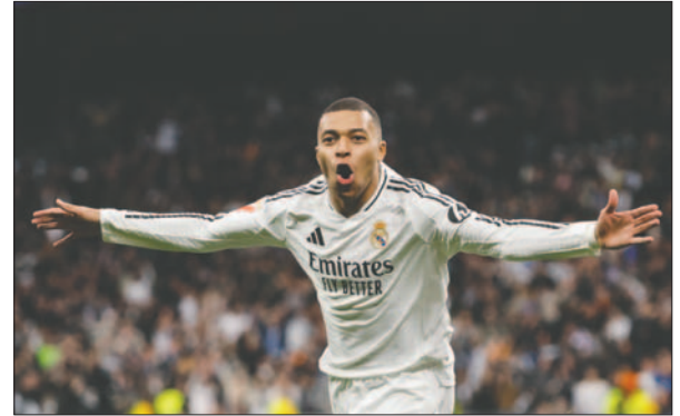
Doblete de Kylian Mbappé para el triunfo del Real Madrid

Resultados fecha 20: Espanyol 2-1 Valladolid, Girona 1-2 Sevilla,