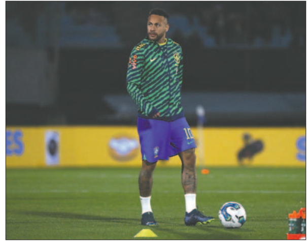
Es muy probable que Neymar vuelva al Santos de Brasil

No obstante, en una entrevista con Romário divulgada esta semana, Neymar afirmó que existía la posibilidad de "continuar" en el Al-Hilal, aunque "en seis meses puede pasar de todo".