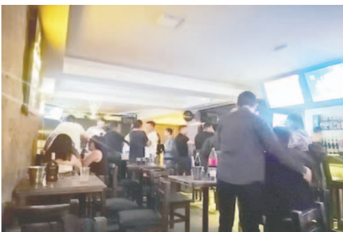
Ley busca ordenar el funcionamiento de locales

Esta normativa busca regularizar los establecimientos existentes y garantizar un control más efectivo sobre su operación. La propuesta ha generado controversia entre diferentes sectores ciudadanos debido a su impacto potencial en la seguridad pública y en las dinámicas sociales del municipio.