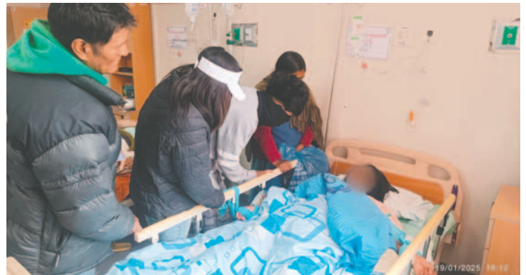
Menor de edad se reencontró con su familia /DIO

Según se informó desde la DIO, la salud de la menor es inestable, por lo que no fue posible el abordaje psicosocial por parte del personal. En ese sentido, se estableció que una vez se tenga el reporte médico favorable, se procederá con los actuados a cargo del equipo de turno.