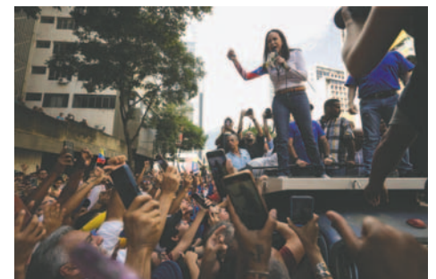
Fotografía de la líder antichavista María Corina Machado

Hasta ahora, alrededor de un centenar de personas consideradas presos por motivos políticos han salido de las cárceles. El Gobierno cubano no ha hecho pública la lista completa de las 553 personas que serán excarceladas progresivamente; sin embargo, ha reconocido que hasta el jueves un total de 127 han recibido algún tipo de beneficio extra-penal.