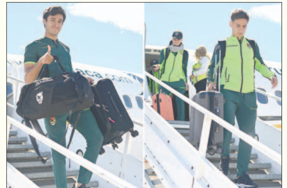
Durante el arribo de la selección boliviana a Valencia (Venezuela)

La Sub-20 todavía tendrá días de trabajo y ambientación en la ciudad de Valencia, donde Perrotta trabajará la parte táctica y un repaso a los videos de los rivales, en particular a los movimientos de las individualidades.