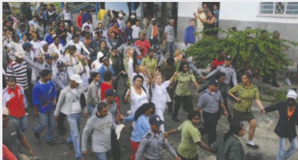
Fotografía de archivo de miembros de las Damas de Blanco durante una protesta en Cuba