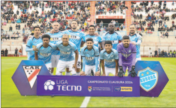
Muchos clubes apuntan a que Aurora debe perder puntos y descender