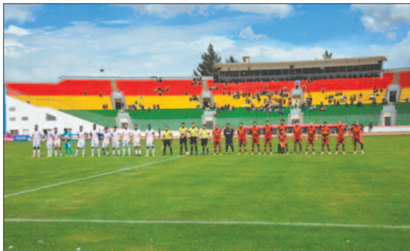
El estadio de Oruro tendrá mucha actividad este año

fesional, el gramado tendrá una mayor exigencia, por lo que es necesario realizar las mejoras necesarias en el “gigante del barrio Norte”.