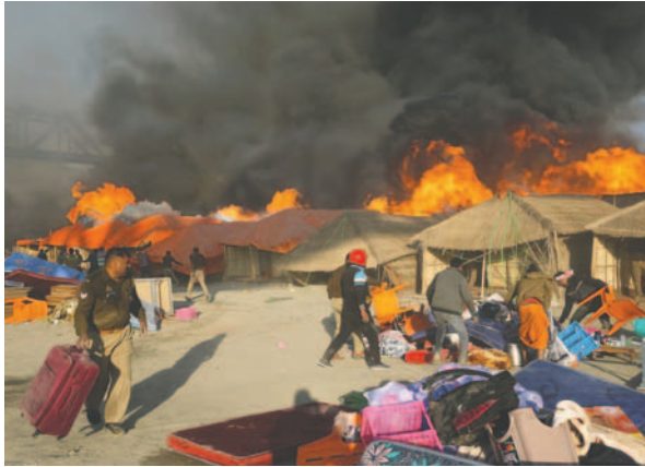
Incendio en el sector 19 del festival

Para dar cabida a esta marea de peregrinos, que acuden a bañarse en la confluencia de los ríos Ganges, Yamuna y el mítico Sarasvati —todos ellos sa-