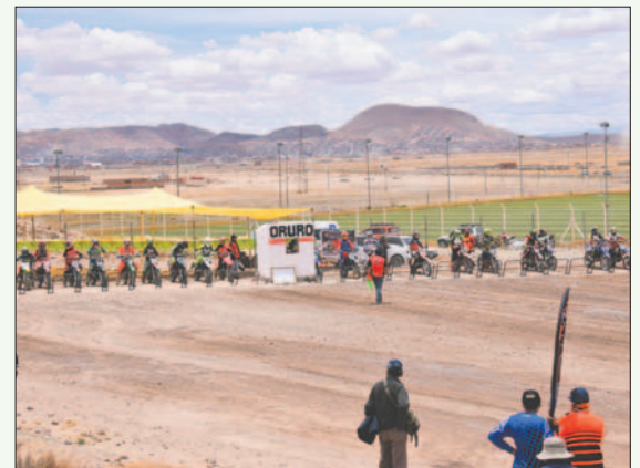
Las ocho competencias de este año ya tienen sede, ninguna se realizará en Oruro / LA PATRIA

la designación de sedes y fechas en el calendario de competencias de la temporada 2025.