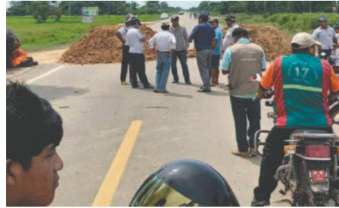
Un anterior bloqueo de sector

Entre los principales puntos del pliego petitorio, los productores de San Julián exigen al Gobierno central el cumplimiento de los cupos de diésel y gasolina asignados a los surtidores locales, debido a la constante escasez de combustible que ha generado largas filas y perjuicios a