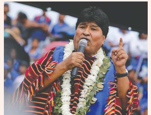
El expresidente Evo Morales

El 17 de enero, el juez de Instrucción Penal, Anticorrupción y Contra la Violencia hacia la Mujeres Quinto de Tarija, Nelson Alberto Rocabado, declaró a Morales en rebeldía, ordenó su búsqueda y aprehensión, congelar sus cuentas bancarias y la anotación preventiva de sus bienes.