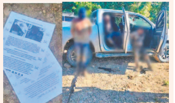
La imagen del panfleto que circula en redes /RR.SS.

Además, piden al ministro de Gobierno, Eduardo Del Castillo, que intervenga para evitar más muertes en esta disputada entre presuntos narcotraficantes.