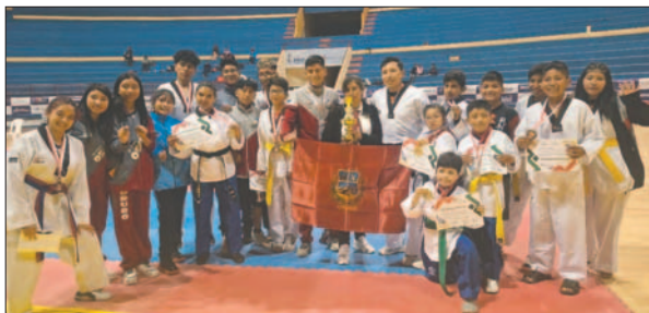
Delegación de Oruro en el torneo nacional realizado en Sucre

En la jornada del domingo se llevó a cabo la segunda jornada de competencia en la modalidad de Kyorugi, donde Oruro tuvo una buena actuación, acercándose a los primeros puestos. En el balance global, fue un buen inicio para el combinado orureño a través de sus clubes que estuvieron compitiendo en la capital del Estado Plurinacional de Bolivia.