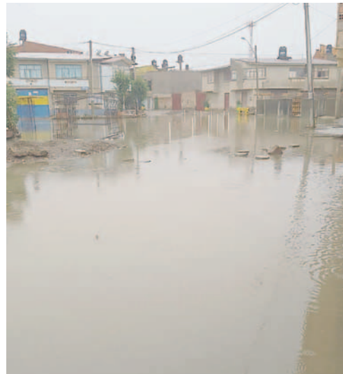
Lluvias provocaron inundaciones en varios puntos de la ciudad

En los recientes días, se realizó una inspección a varios distritos que fueron golpeados por las lluvias, en la cual se evidenció que en el Distrito 4 había uni-