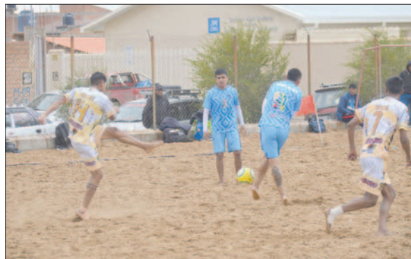
Pumas batalló pero no pudo superar la cerrada defensa de Garmar