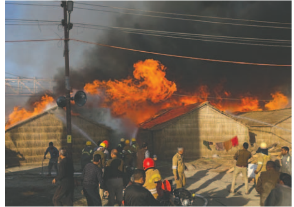
Las llamas fueron controladas rápidamente

Además de un gran dispositivo policial de 50 mil agentes para velar por la seguridad y controlar estampidas, con la ayuda de cámaras, las autoridades también han desplegado medios para combatir los posibles incendios que se puedan dar durante las seis semanas de festival.