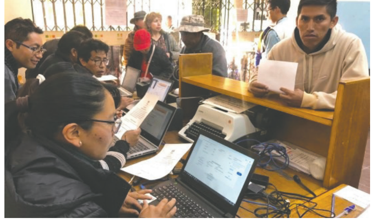
La solicitud debe hacerse de forma escrita /TED ORURO

El TED Oruro expidió certificaciones a quienes estuvieron en tránsito el