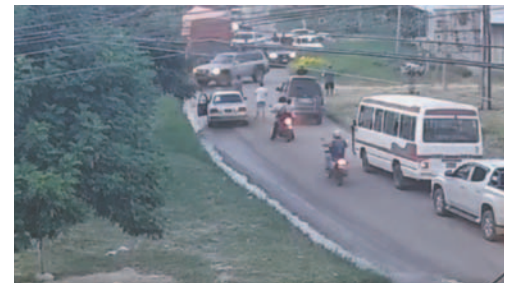
Imágenes del incidente que también causó interrupción al tráfico /RR.SS.

El enfrentamiento también generó interrupciones en el tráfico de la avenida por algunos minutos, ya que el camión quedó atravesado en la vía. Algunas versiones de medios locales indican que el vehículo fue secuestrado por las autori-