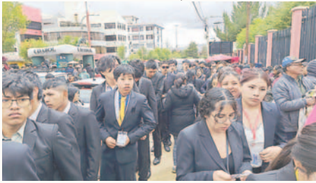
Alumnos ingresando al examen de admisión directa en Medicina /UTO