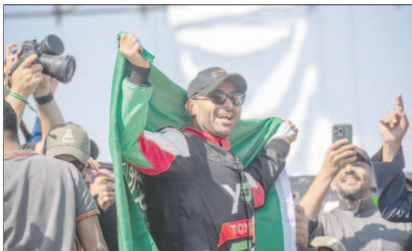
Yazeed Al Rajhi ganador del Rally Dakar en coches

El brasileño Lucas Moraes, también con Toyota, se impuso en la duodécima y última etapa de 61 kilómetros con salida y llegada en Shubaytah.