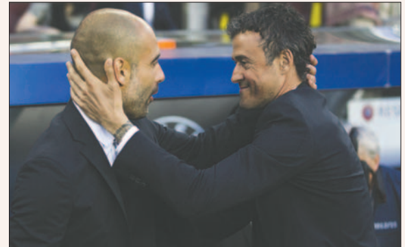
Pep Guardiola y Luis Enrique Martínez volverán a enfrentarse este miércoles

Solo dos partidos faltan a cada equipo para completar este tramo y solo el Liverpool y el Barcelona, primero y segundo en la clasificación, tienen asegurada su continuidad, aunque aún tienen que amarrar matemáticamente un lugar entre los ocho primeros y el acceso directo a octavos que pueden oficializar esta semana.