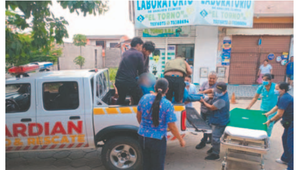
Traslado de la persona más afectada

Según el reporte, no hubo personas heridas y todos los miembros de la familia, incluidos dos menores, fueron rescatados a salvo. Los rescatistas lograron poner a salvo a