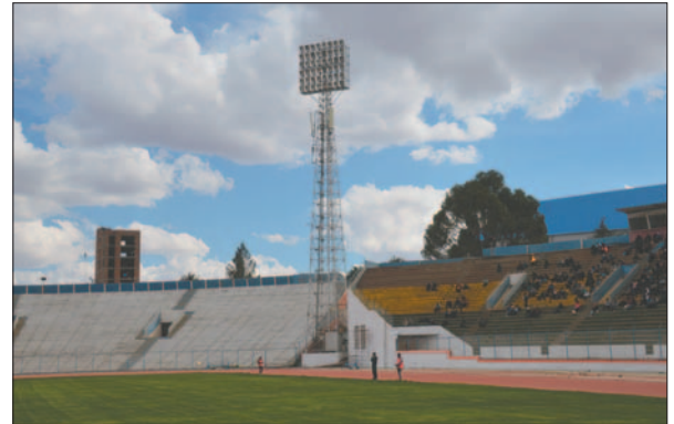
La FBF intervendrá en el tema de luminarias en el “Bermúdez”

En el año 2024, el estadio “Jesús Bermúdez” tuvo diversas ob-