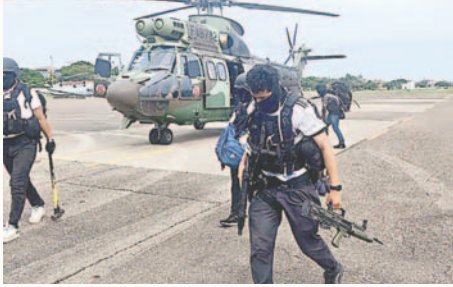
Imagen publicada por el expresidente junto a su denuncia