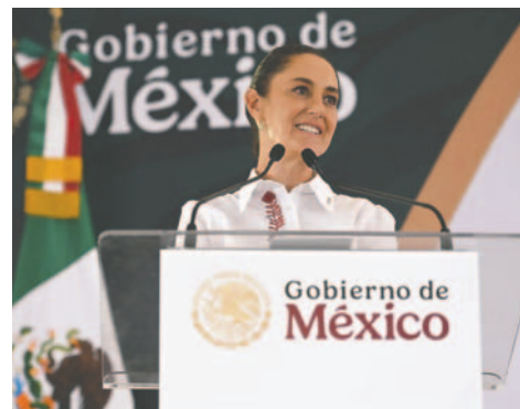
Claudia Sheinbaum, durante una gira de trabajo en el municipio de Chinantla este domingo

Sheinbaum subrayó el compromiso de su Gobierno de defender la soberanía nacional y los derechos de los mexicanos dentro y fuera del país. También abordó el inicio del nuevo Gobierno de Trump, expresando su disposición al diálogo para lograr un "buen entendimiento", similar al alcanzado durante la gestión de su predecesor, Andrés Manuel López Obrador.