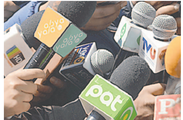
La Ley de imprenta cumplió 100 años defendiendo la labor periodística /REFERENCIAL

Existen ciertas características que no constituyen delitos ni faltas, como las críticas constructivas (Art. 12). Estas permiten señalar defectos de la Constitución, criticar actos legislativos, administrativos o judiciales, siempre y cuando no contengan ofensas de otro género.