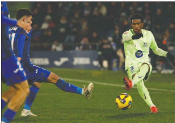
Alejandro Balde (derecha) jugador del Barcelona recibió muchos insultos

Asimismo, el dirigente, en relación a los hechos denunciados por el propio Balde en los micrófonos de Movistar+ a la conclusión del choque, indicó: "El racismo es un flagelo contra el cual debemos mantenernos unidos para combatirlo y derrotarlo. No al racismo. No a ninguna forma de discriminación".