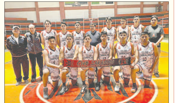
Saracho oficiará de local en la primera fase de la Libobásquet U-25

En el caso de la rama femenina, la entidad federativa dio a conocer que la sede del grupo "A" será Santa Cruz y el certamen se disputará entre el 30 de enero y el 2 de febrero. Los elencos que son parte de esta serie son: Carl A-Z, Alemán de Oruro, Mariknoll de Cochabamba, Universitario de La Paz y Santa Cruz Básquet de la capital oriental.