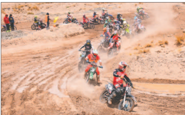
La nueva dirigencia hará los esfuerzos para recuperar la plaza nacional / LA PATRIA