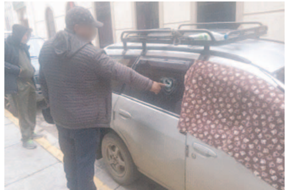
Una de las víctimas refleja el disparo en su coche