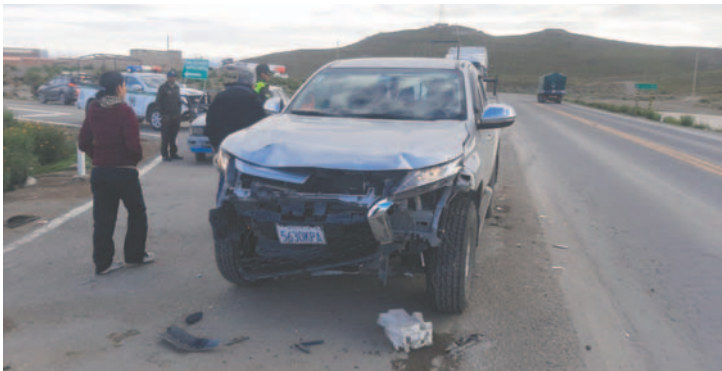
La camioneta reportó daños materiales tras el impacto

El violento impacto provocó que una mujer resultara herida, siendo trasladada a la Clínica Natividad para su revisión médica. “La misma indicó que se encontraba bien, pero para precautelar su salud ha sido evacuada a la Clínica”, expresó.