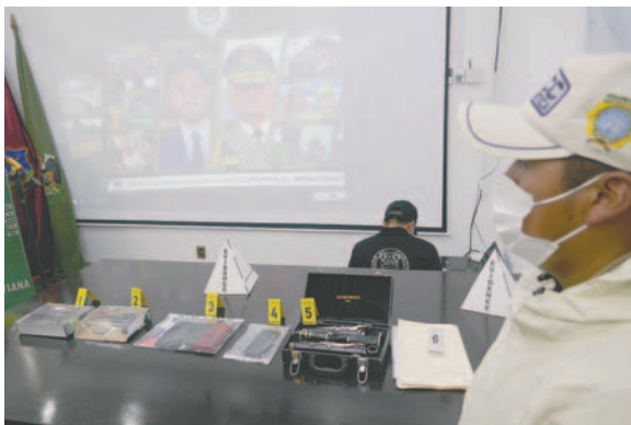
Las evidencias son exhibidas tras el exitoso operativo