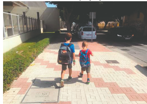
La Policía localizó a dos menores en Valle Hermoso, quienes huyeron de un hogar marcado por presuntos actos de violencia /REFERENCIAL

El comandante Agudo destacó la importancia de la intervención oportuna y aseguró que se continuará con las diligencias necesarias para garantizar la protección de los menores y determinar las responsabilidades correspondientes.