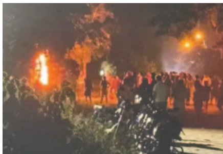
El aprehendido es acusado por el delito de robo agravado, lesiones graves y leves, asociación delictuosa y deterioro de bienes del Estado / ABI

El aprehendido está acusado de robo agravado, lesiones graves y leves, asociación delictuosa y deterioro de bienes del Estado / ABI