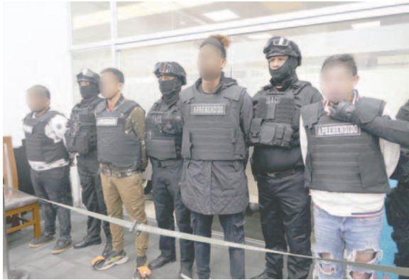
La banda criminal fue presentada ante los medios de prensa

"Hacen el seguimiento correspondiente y los identifican plenamente en el interior de estos lenecios, piden apoyo de la unidad Delta de reacción inmediata y proceden a la aprehensión de cuatro personas", precisó la autoridad policial y agregó que serían parte