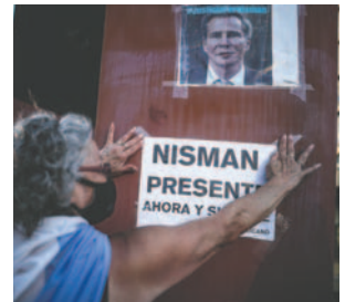
Fotografía de archivo de una manifestación por la muerte del fiscal argentino Alberto Nisman

La Fiscalía que investiga su muerte ratificó hace pocos días que Nisman