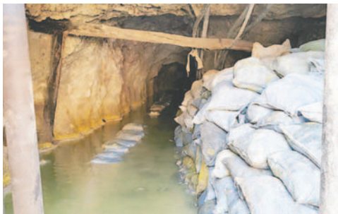
Mineros del sector privado piden apoyo y respaldo para mejorar exportaciones

El sector reclama principalmente el agregado de