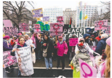
Miles de personas tomaron este sábado las calles de Washington para avisar al presidente electo estadounidense, Donald Trump, que lucharán por los derechos de las mujeres y de los colectivos menos favorecidos y que, a dos días de la investidura, ese nuevo combate no ha hecho más que empezar

Esta manifestación surgió en las redes sociales justo después de las elecciones