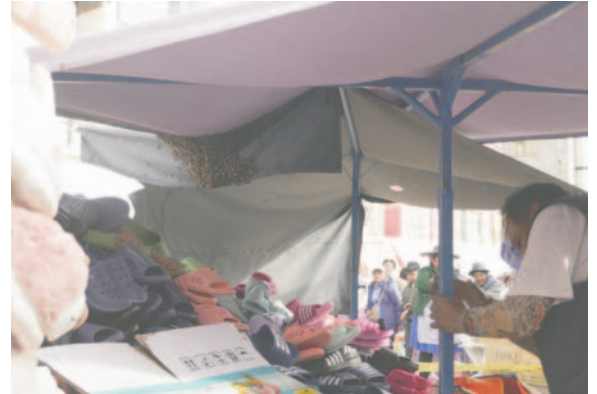
Momento en que terminan de colocar en un saco de yute a las abejas para trasladarlas

Las autoridades del área, reiteraron que se tuvo que levantar a las abejas por la emergencia, ya que estaban en un lugar muy concurrido de la ciudad, pero que se prevé la continuidad del monitoreo y la atención por especialistas del Bioparque Municipal.