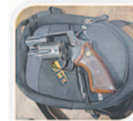
Incautaron dos armas, municiones y recuperaron un clarinete robado a un joven de 18 años