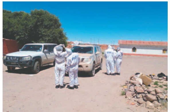
El homicidio del joven de 22 años ocurrió la madrugada del miércoles 15 de enero

Ayer por la mañana se instaló la audiencia para definir la situación jurídica de los cinco militares; no obstante, se presentaron incidentes que debían ser resueltos por el juez antes de dar inicio a la cautelar. A lo largo del día, el juez dictó cuartos intermedios, por lo que se aguarda que hoy se informe sobre la situación jurídica de los militares.