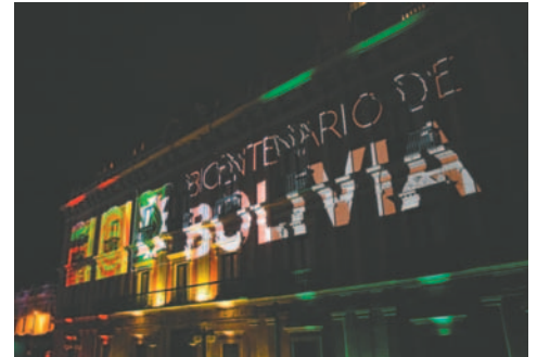
El acto que tuvo lugar en la plaza Murillo de La Paz

El llamado a la unidad llega en un contexto de desafíos económicos y tensiones políticas, a medida que el país se acerca a las elecciones presidenciales de 2025.