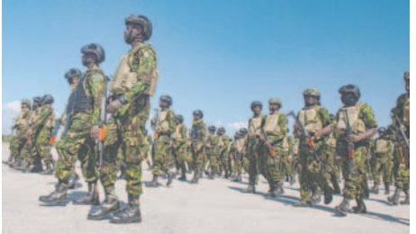
Policías kenianos forman a su llegada al aeropuerto internacional Toussaint Louverture este sábado, en Puerto Príncipe (Haití)

Russell, "es un momento horrible para ser niño en Haití, donde la violencia trastoca vidas y obliga a más niños y familias a abandonar sus hogares". De acuerdo con los últimos datos de la Organización Internacional para las Migraciones (OIM), el número de desplazados en Haití se ha triplicado en solo un año y ha superado el millón de personas, de las cuales más de la mitad son menores que, subraya Unicef, necesitan asistencia humanitaria urgente.