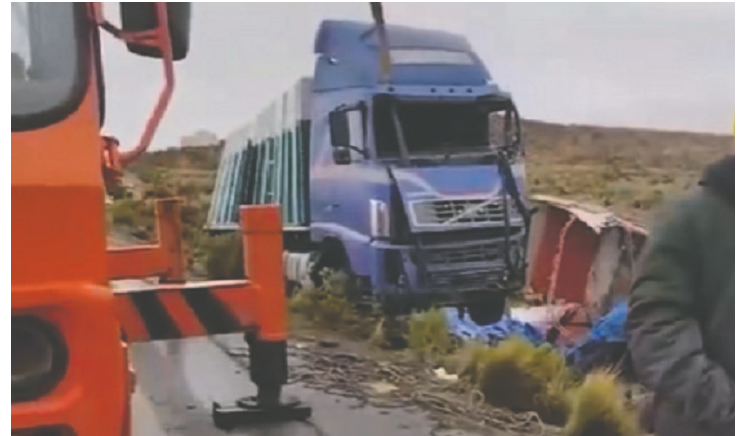
Al menos cinco personas fallecieron y otras resultaron heridas

“Tenemos la información inicial de que en horas de la madrugada hubo una colisión múltiple de varios vehículos en la carretera Patacamaya-Tambo Quemado. Inicialmente se conoce que hay varias personas lesionadas, así como también fallecidos”, indicó Agudo.