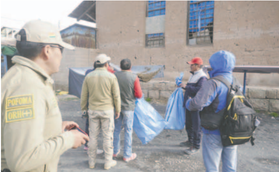
Enjambre de abejas se asentó en el toldo de un puesto de venta