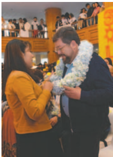
Doria Medina fue respaldado por la agrupación Sol.bo

se encuentra refugiado en Brasil. Doria Medina lo calificó como un perseguido político y expresó su esperanza de que pronto regrese al país. Durante el evento, los asistentes corearon en apoyo: “Lucho, no estás solo”.