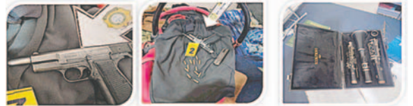
1.- DOS (2) ARMAS DE FUEGO UNA TIPO REVOLVER CAL. 38 Y OTRA TIPO PISTOLA CAL. 9MM CON SU RESPECTIVA CARTUCHERÍA O MUNICIÓN. 2.- UN CLARINETE