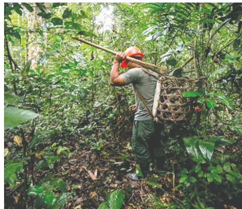
Zafra en Pando

ventiva está generando un clima de incertidumbre y violencia entre los bolivianos, lo que no puede seguir ocurriendo", manifestó el asambleísta. Además, advirtió que si no se actúa con celeridad, los problemas derivados de la zafra podrían continuar escalando, con consecuencias más graves para la seguridad en la región.