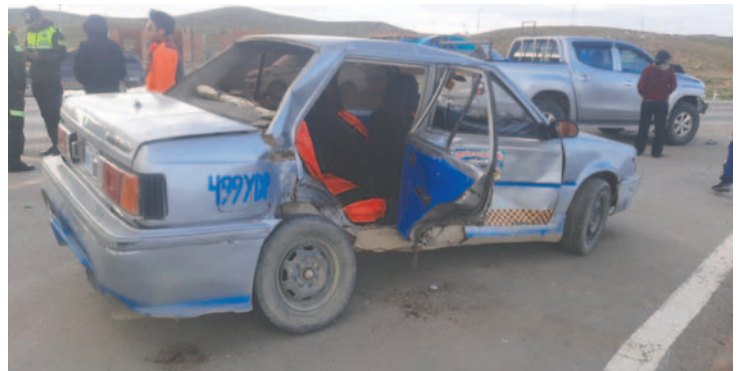
El impacto se registró en el ingreso a Capachos