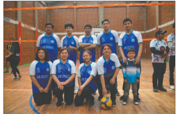
Los trabajadores y sus familias forman parte de los planteles

Luego de cumplir con la promesa deportiva, se dio curso a los encuentros, donde no solo se vio a los trabajadores, sino también a sus familias, quienes fueron incursionando en este novedoso torneo que busca unir más a la familia de los trabajadores gráficos.