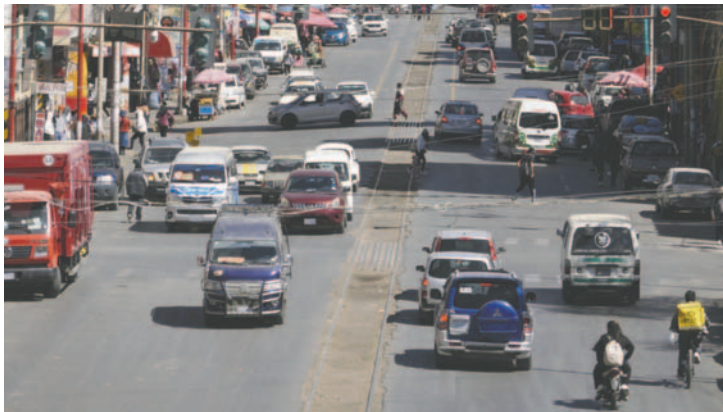
Comerciantes rechazan incremento de pasajes del transporte

La federación anunció planes para socializar su postura con la Federación Departamental de Juntas Vecinales de Oruro (Fedjuve), comités cívicos y otras instituciones para expresar su desacuerdo con el incremento de pasajes.