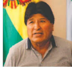
El expresidente Evo Morales

gistratura, presidido por el autoprorrogado y protegido del gobierno de Arce Catacora: Marvin Molina Casanova”, escribió Morales en su cuenta de X. El expresidente es investigado por presuntamente haber mantenido una relación con una menor de edad durante su mandato presidencial, con quien aparentemente tuvo una hija en 2016. Ante la determinación judicial, el exmandatario expresó que los jueces no respetan el debido proceso y que las decisiones judiciales obedecen a intereses políticos. La defensa de Morales calificó el proceso como