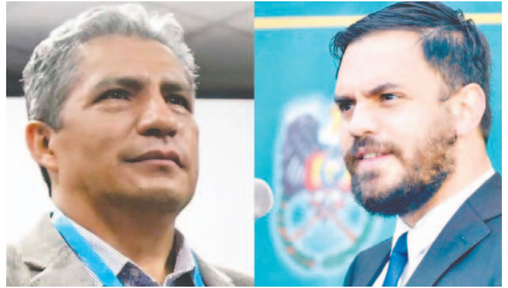
El ministro de Gobierno, Eduardo Del Castillo(d); y, su par de Defensa, Edmundo Novillo (i)

La designación de Novillo como ministro interino también forma parte de una serie de cambios recientes en el gabinete, entre los que se destacan la destitución del exministro de Medio Ambiente, Alan Lisperguer, y el nombramiento de María Nela Prada como ministra interina en su reemplazo.