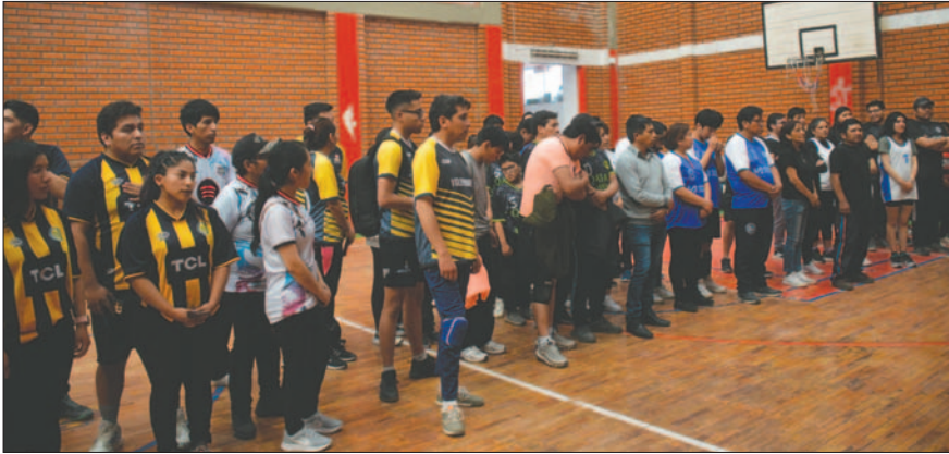
Son 14 equipos los que forman parte de este torneo