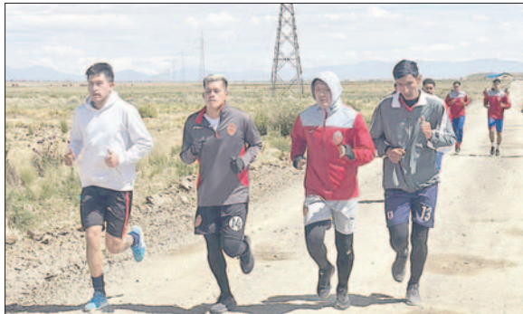
Cada día el trabajo es más exigente en el campamento carmesí

El Club Deportivo Totorá Real Oruro busca ser uno de los protagonistas del campeonato profesional y, para ello, mantiene una pretemporada a doble turno para que los jugadores tengan un buen resto físico en el desarrollo del certamen.