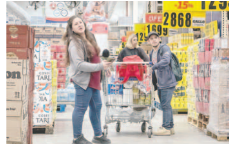
Personas comprando en una tienda, en Caracas (Venezuela)

Así, más allá de los "ajustes fiscales" que implemente América Latina, el panorama para 2025 va a depender también del