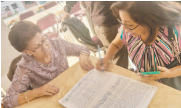
Los orureños que residen en Cochabamba ejercieron su voto

Cerca de un centenar de ciudadanos orureños que viven en Cochabamba, eligieron a la nueva directiva del Centro de Residentes Orureños, que