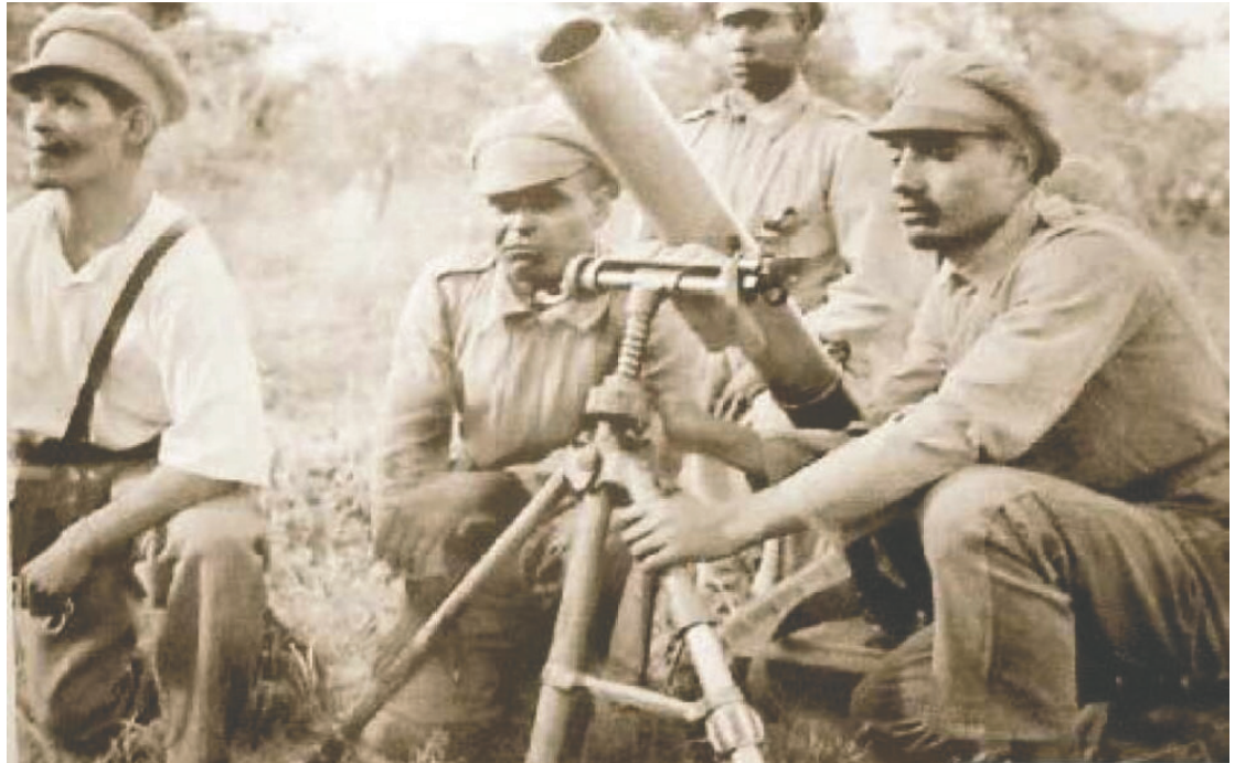
Medios de comunicación durante la Guerra del Chaco

Aunque originalmente fue concebida para publicaciones impresas como periódicos y revistas, la Ley de Imprenta ha demostrado su capacidad de adaptación. Actualmente, su aplicación se realiza por interpretación extensiva y por analogía, abarcando medios digitales, portales web, blogs informativos, redes sociales y