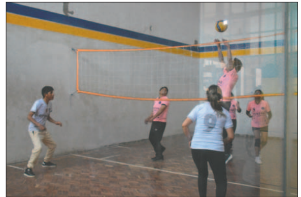
Los trabajadores gráficos comenzaron con sus actividades deportivas / LA PATRIA