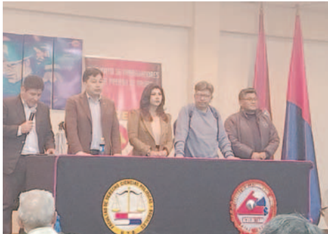
Representantes de instituciones periodísticas de Oruro /COLEGIO DE COMUNICADORES

La centenario normativa fue promulgada el 19 de enero de 1925, por este motivo, las instituciones del periodismo orureño