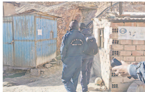
Reclaman por exceso de controles y sanciones

Peñafiel reclamó que este tema ocasionó sancio-