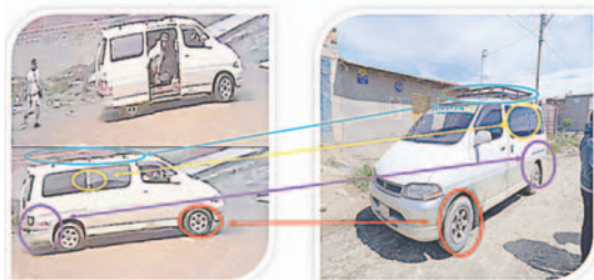
Vehículo que habrían utilizado para cometer los hechos delictivos.