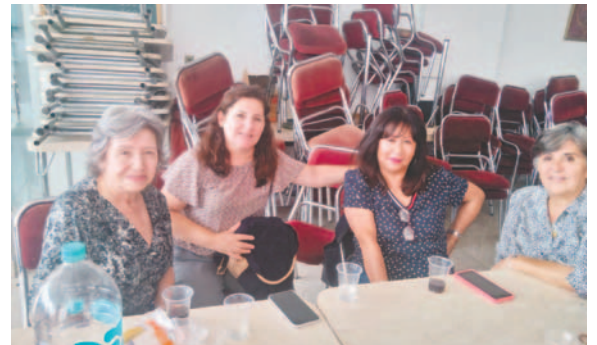
La oportunidad sirvió para confraternizar entre orureños

La posesión de la nueva directiva se realizará el próximo sábado 25 de enero, en la sede del Centro de Residentes Orureños.