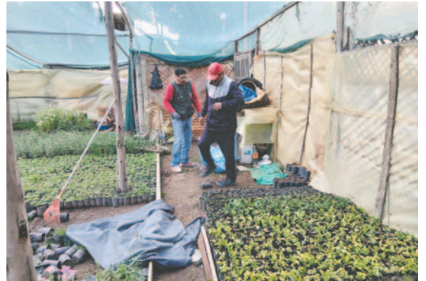
Se trasladó a las polinizadoras al Parque Ecológico / DIRECCIÓN DE SALUD AMBIENTAL