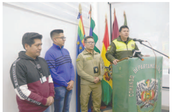
Autoridades de la Policía y Fiscalía en la conferencia de prensa