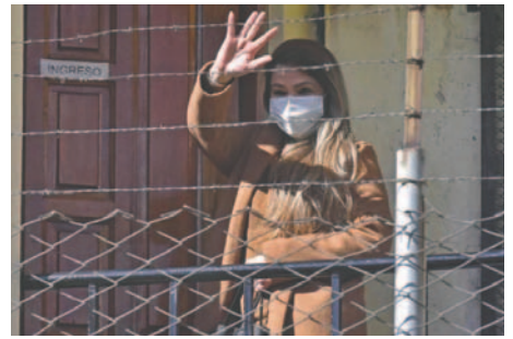
Expresidenta Jeanine Áñez

Áñez también afirmó que Morales convirtió el tráfico de influencias y los privilegios en un modus operandi para delitos como la trata de menores. Expresó su confianza en que Morales pagará pronto por