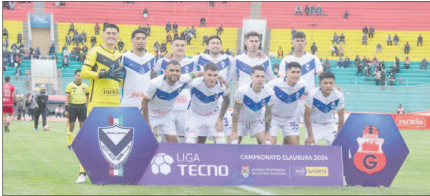
De a poco el cuadro de GV San José va tomando forma / LA PATRIA