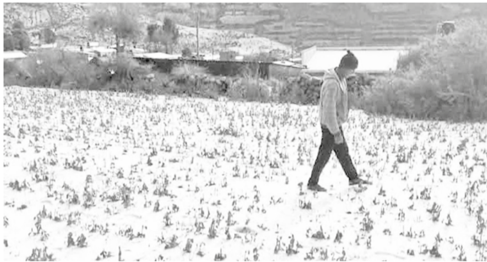
Efectos de una granizada en el municipio potosino de Cotagaita, la semana pasada.

Hay 10 municipios que se han declarado en desastre, pero sólo cuatro de ellos tienen ley municipal.