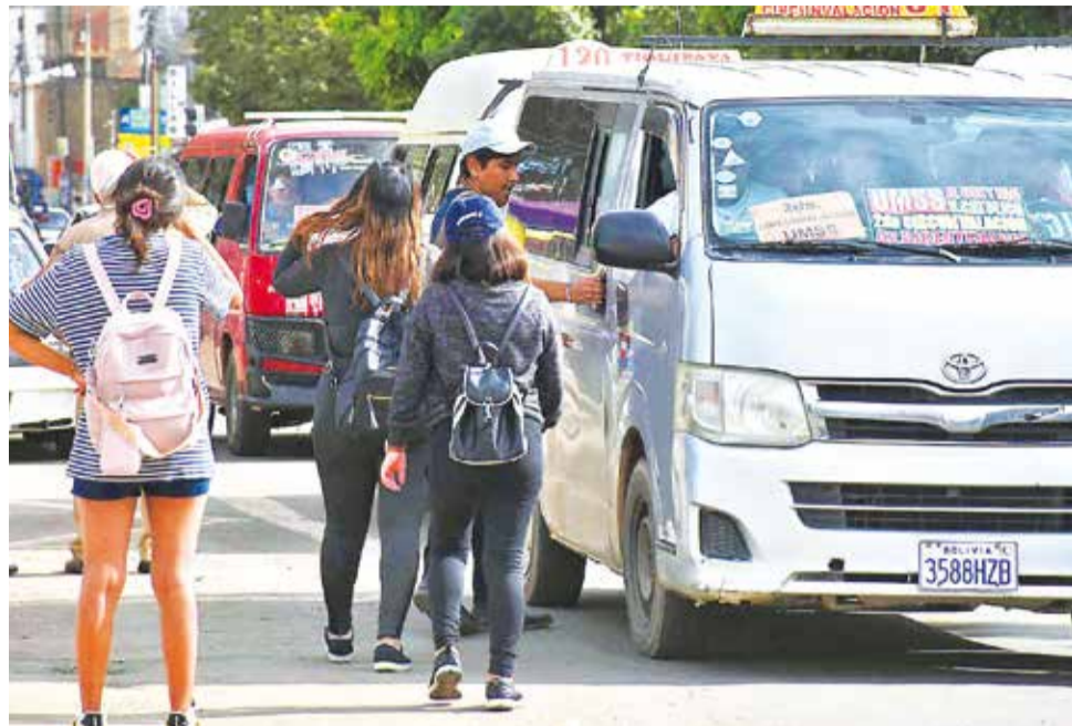
El servicio del transporte público por inmediaciones de la UMSS ayer.