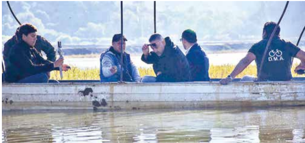
La inspección de autoridades al nivel de la laguna Alalay tras las lluvias ayer.