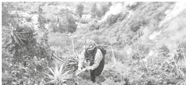
Un bombero lucha contra uno de los incendios en California.

Peligro. Los bomberos luchan contra nuevas amenazas mientras los vientos aúllan en las regiones afectadas por las llamas