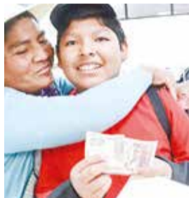
El pago del bono Juancito Pinto. H. ANDIA