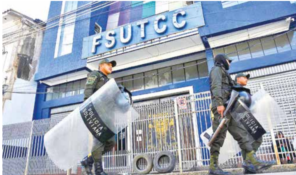
Las instalaciones de la Fsutcc permanece con resguardo de efectivos ayer.