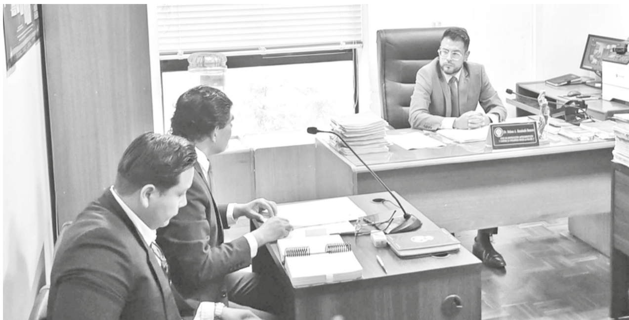
Audiencia cautelar en contra del expresidente Evo Morales (ausente), por caso de trata de personas, ayer en Tarija.