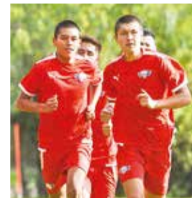
Entrenamiento del plantel de aviador. J.R.