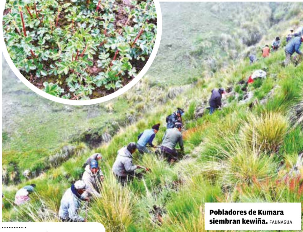
Pobladores de Kumara siembran kewiña.

Reforestación. Faunagua, con el apoyo de pobladores, sembró 66 mil plantines en las comunidades de Chiaraje, Kumara y Palca Palca