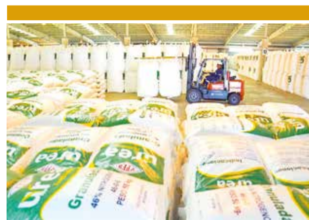
La producción de urea en el trópico. YPFB

Explicó que, con el Presupuesto General del Estado (PGE) 2025, se asegura 478 millones de bolivianos para el pago del Bono Juancito Pinto en favor de más de 2.340.000 estudiantes.