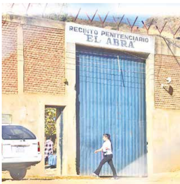
La fachada de la cárcel de El Abra en Sacaba.