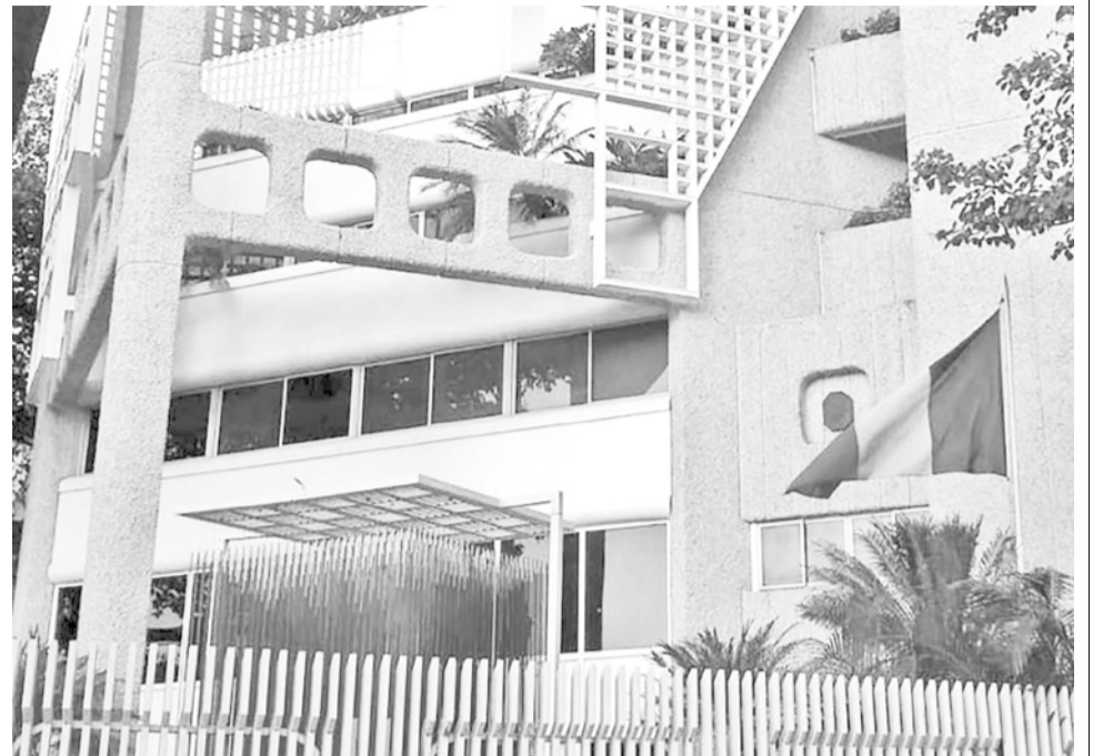
La embajada de Francia en Caracas, Venezuela. CAMPUS FRANCE

“Los diplomáticos deberán contar con autorización escrita de nuestra Cancillería para desplazarse a más de 40 kilómetros desde la Plaza Bolívar de Caracas, garantizando el estricto cumplimiento de sus funciones”, informó el ministro de Relaciones Exteriores, Yván Gil, antes de