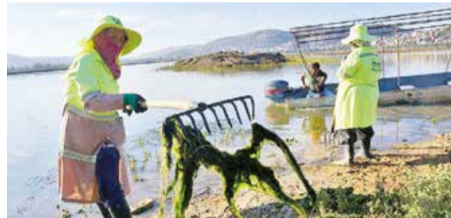
La limpieza en una de las orillas del vaso de agua.

“Hemos solicitado a la Alcaldía que nos informen si se completará el dragado, cuán-