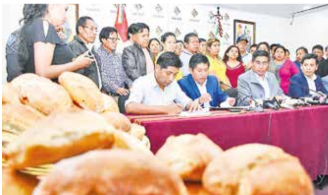
Autoridades y panificadores firmaron el acuerdo. H.A.

Acuerdo. El Gobierno se comprometió a subvencionar la harina y más productos que se utilizan en la elaboración del este alimento