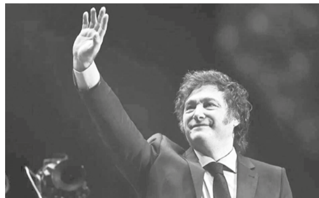
El presidente de Argentina. Javier Milei.