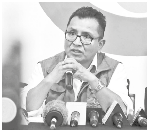
El defensor del pueblo, Pedro Callisaya.

mental la implementación del Acuerdo de Escazú en Bolivia.