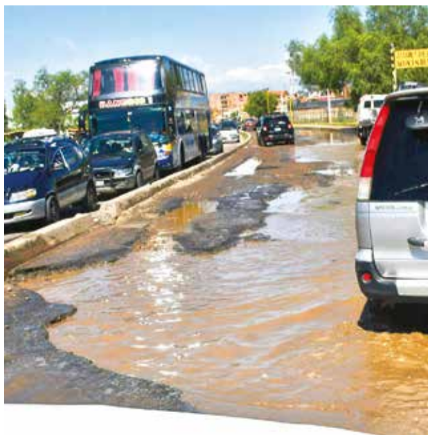
Los baches en la av. Killman y Rafael Pabón. D. JAMES

Por su parte, el gerente del Servicio de Agua Potable y Alcantarillado (Semapa), Luis Prudencio, señaló que la avenida 6 de Agosto, luego de realizar la compactación del carril sur, se generó nuevos hun-