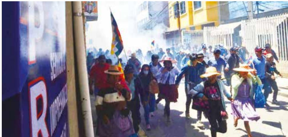
Policías gasifican a sectores evistas en inmediaciones de la Sede de la Fsutcc. HERNÁN ANDÍA

El enfrentamiento dejó varios daños materiales, entre ellos, un vehículo de la Policía con los vidrios rotos y en similar