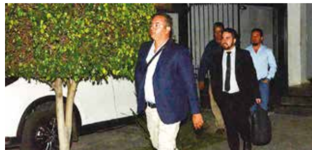
Los miembros del Tribunal de Disciplina Deportiva (TDD) salen del edificio de la FBF, ayer.

Fútbol. El procedimiento fue radicado y se inició la toma de declaraciones. Se abrió un proceso sumario contra el jugador