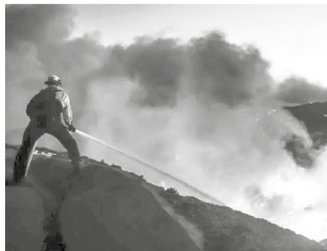
Bomberos luchan contra los incendios.