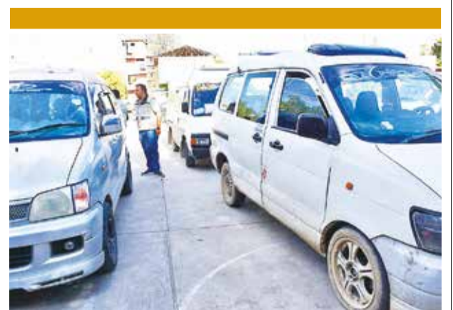
Los vehículos retenidos por carguío ilegal.

"Nosotros hemos adquirido cada bolsa de harina de 50 kilos con 300 bolivianos, la diferencia es la subvención, es el recurso que cubre el Gobierno", remarcó Flores.