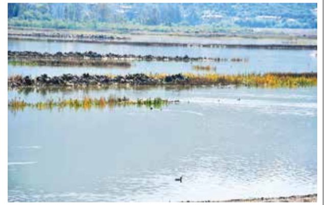
El nivel de la laguna aumentó tras las lluvias.

cio sostuvo que el personal trabaja en el sector para evitar mayores problemas con el tráfico vehicular y atribuyó el problema también a las conexiones cruzadas y a la acumulación de basura