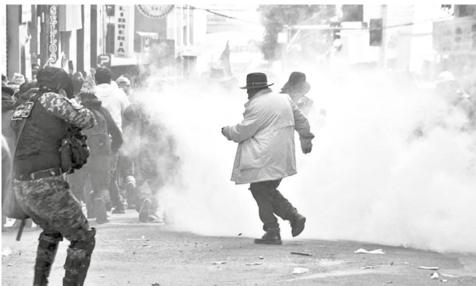
Enfrentamientos entre policías y marchistas evistas, ayer en La Paz.

Tres policías y dos turistas resultaron heridos ayer tras una emboscada por parte de sectores evistas que marchaban rumbo a La Paz, según denunció el ministro de Gobierno, Eduardo del Castillo. “No solamente ha quedado en un atentado en contra de la vida de los policías, sino que también han realizado al menos 10 disparos a dos flotas que procedían a trasladar turistas desde la región de Uyuni hacia el departamento de Oruro”, detalló Del Castillo. Los heridos son atendidos en diferentes hospitales.