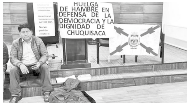
El senador por Chuquisaca, Santiago Ticona. RRS5

Al filo. El TSE dio hasta el 15 de enero como plazo fatal para aprobar la norma. Un asambleísta rechaza la ley e inicia huelga