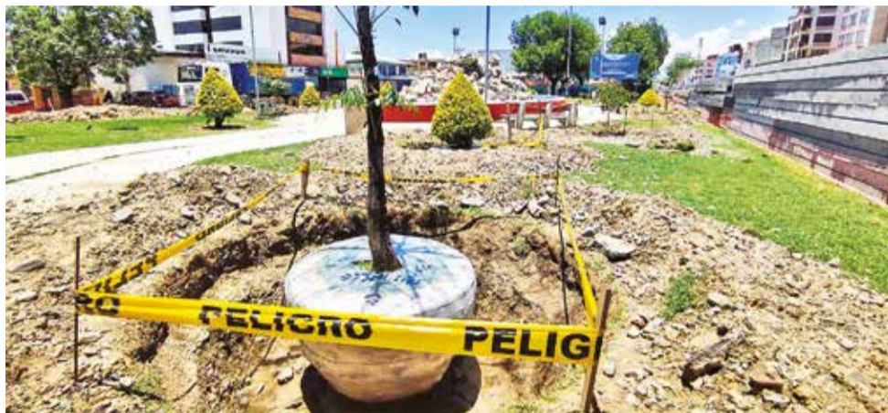
Uno de los árboles precintado para su traslado en la Blanco Galindo y Perú. DANIEL JAMES

bunal Agroambiental de Cochabamba aprobó el traslado de los árboles de la rotonda para la construcción del distribuidor, luego de un proceso penal que presentó un grupo de ambientalistas y vecinos del lugar. En ese entonces, se resolvió que el traslado sería por especies y temporadas.