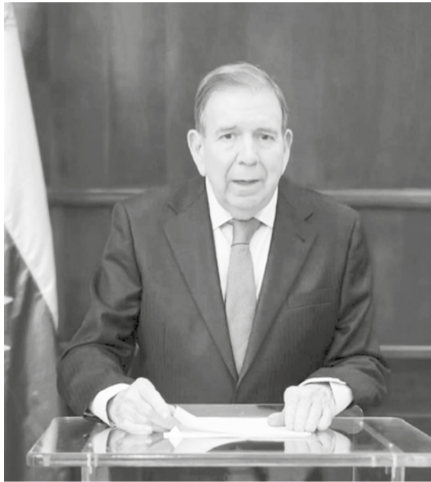
El líder opositor venezolano Edmundo González Urrutia.

González Urrutia se encontró desde el miércoles pasado