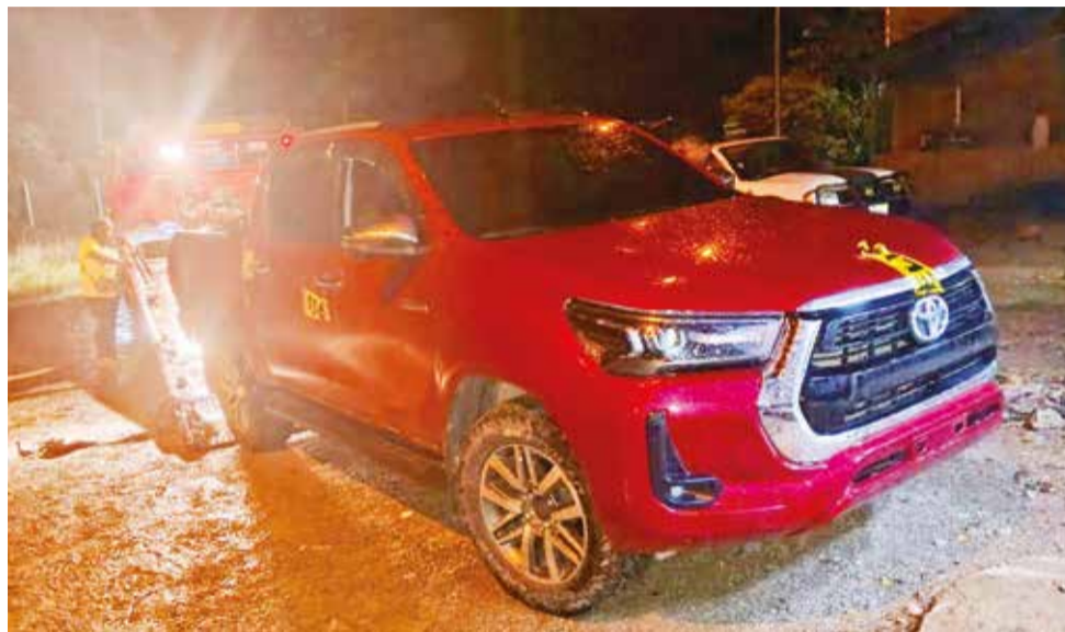
La camioneta de la familia que recibió 38 disparos en Entre Ríos.

“Yo pido justicia, ¿cómo pueden hacer esto a personas inocentes? ¡Qué está pasando! Mi niña era inocente, dónde está el sentimiento de esas personas, no tienen corazón, mi hijita era cariñosa. En qué tiempo estamos”, declaró la abuela a un medio televisivo.