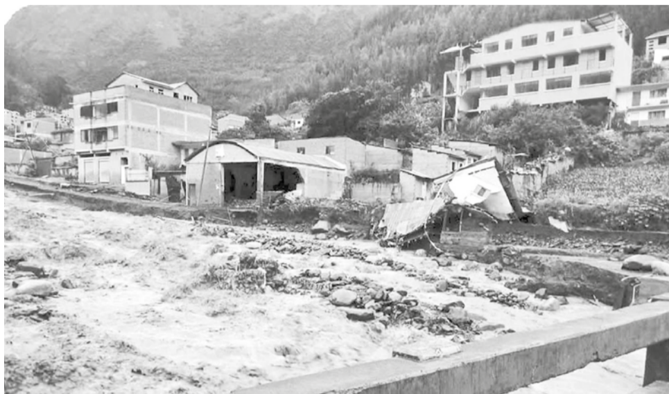
Las viviendas afectadas por la lluvia en Quime, el fin de semana.

Este reporte aún no incluye la evaluación de Quime, en la provincia Inquisivi de La Paz, donde se analiza el estado de 40 inmuebles. De acuerdo con el último reporte, los fenómenos climáticos han causado la muerte de 16 personas desde el inicio de las lluvias en noviembre de 2024.