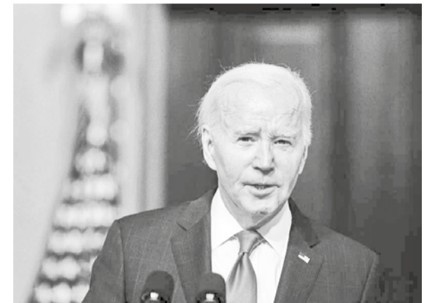
Joe Biden, presidente de Estados Unidos.