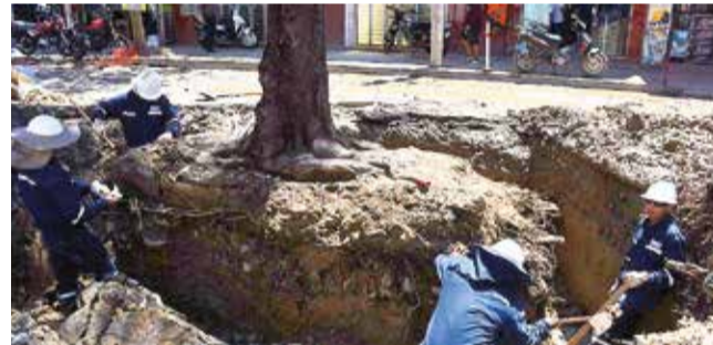
La excavación de las raíces de una de las especies. J.ROCHA

Sin embargo, el retiro reciente de las ocho especies