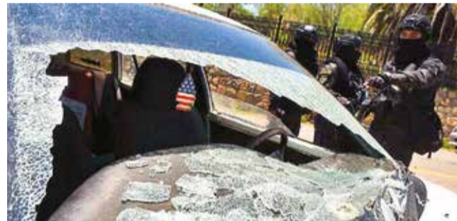
Uno de los vehículos dañados por el conflicto. JOSÉ ROCHA

Ayer, la Policía apprehendió y detuvo a 21 personas, 14 hombres y siete mujeres. Los dirigentes de la Fsutcc