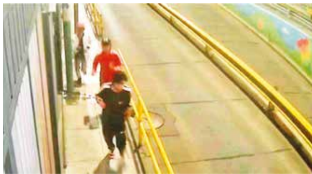
Una imagen de la pelea en el pasaje Boulevard. POLICIA BOLIVIANA

Antecedentes. Los involucrados serían parte de un grupo que se dedica a actividades irregulares. Ambos vivían en la zona sur