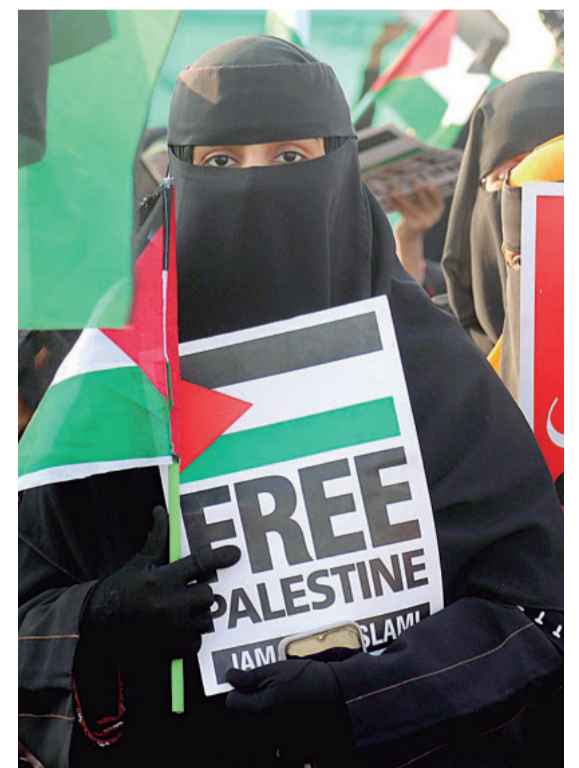
UN PEDIDO DE LIBERTAD Los palestinos anhelan un gobierno soberano. Los ataques de Israel han provocado miles de muertos entre la población

ARTÍFICES DEL ACUERDO. Benjamín Netanyahu (Israel) y Steve Witkoff (delegado de Estados Unidos) participaron en la negociación.