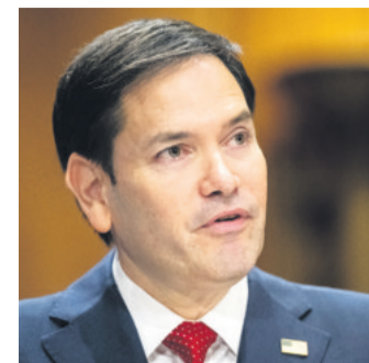
Es hijo de exiliados cubanos

“Todavía creo en la idea por la que esta nación existe, una nación donde la fortaleza de nuestras instituciones y el carácter de nuestra gente importan y deben perdurar”, agregó.