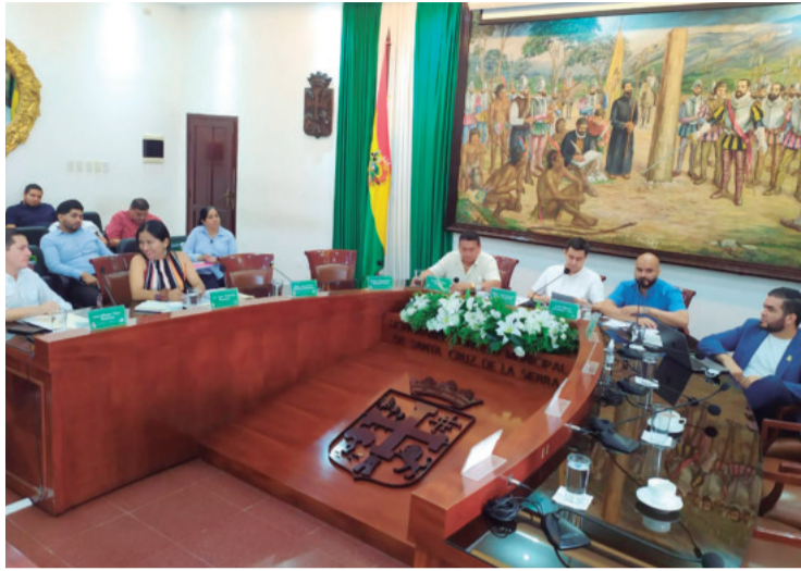
La sesión de ayer en respuesta a la Petición de Informe Oral (PIO)