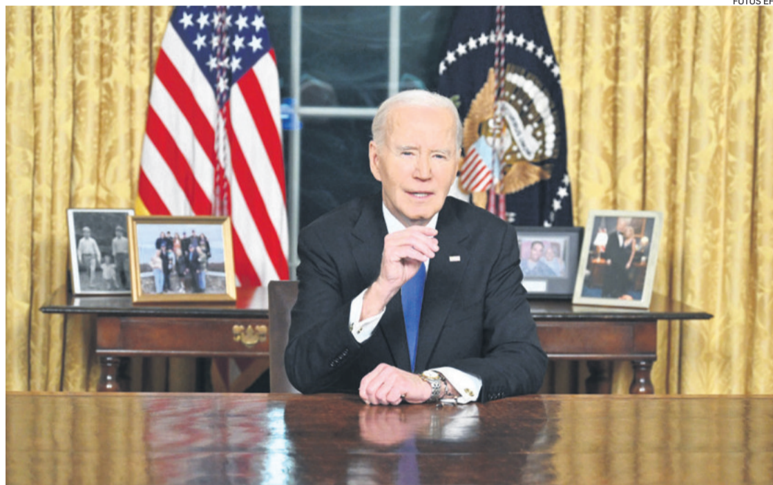
El presidente estadounidense se dirigió ayer a la nación desde el Salon Oval de la Casa Blanca

“El poder del presidente no es ilimitado, no debe serlo, y en una democracia, la concentración de