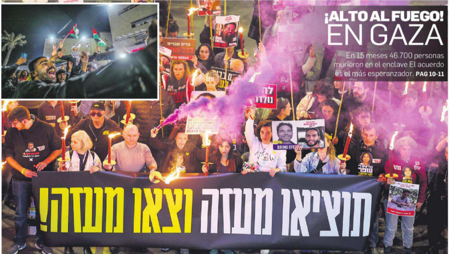
ESPERANZA. Israelíes y palestinos salieron a las calles a celebrar el entendimiento tras una negociación mediada por varios países, incluido Estados Unidos.

social que reúne a los que desarrollan comunidades nuevas. Además, hay varias denuncias contra el Sernap. TEMA DEL DÍA A2-3