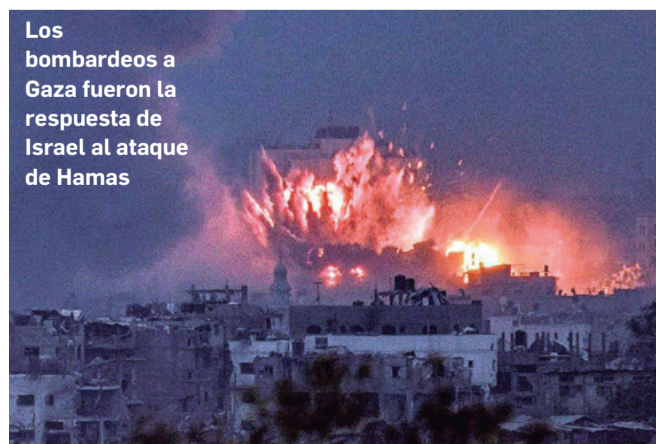
Los bombardeos a Gaza fueron la respuesta de Israel al ataque de Hamas