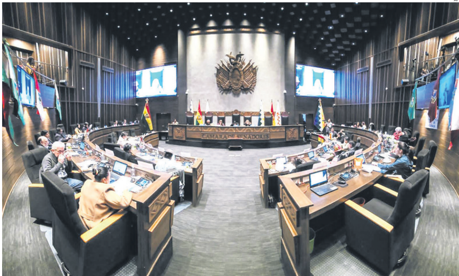
La Cámara de Senadores validó ayer a filo del plazo electoral la ley que aplica los resultados del censo que se aplicó en marzo de 2024.

El presidente del Senado, Andrónico Rodríguez, destacó que la distribución de escaños se aprobó con más de dos tercios y dijo que ya no hay excusas para no convocar a elecciones.