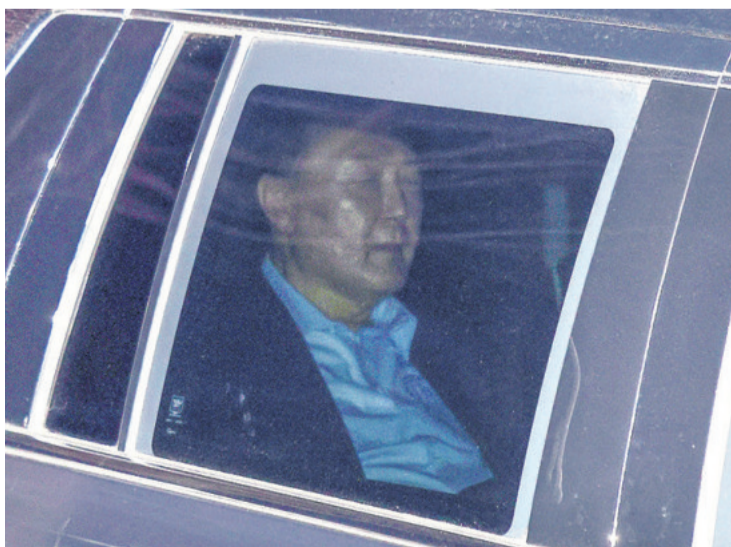
El suspendido mandatario surcoreano luego de ser detenido

El aún mandatario fue entonces trasladado a la sede de la Oficina para los Casos de Corrupción de Altos Funcionarios (CIO), uno de