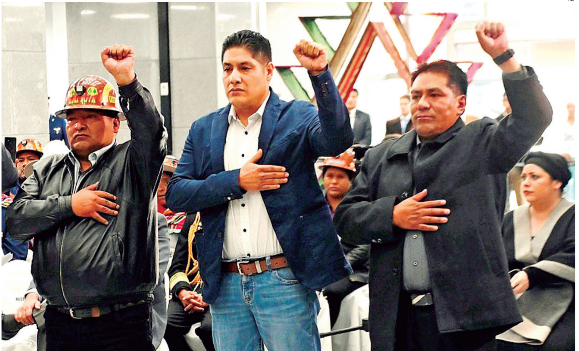
Fue en marzo de 2024. El ministro que fue destituido ayer (centro) toma juramento de su cargo tras la salida de su antecesor que fue observado por sectores afines al Gobierno.