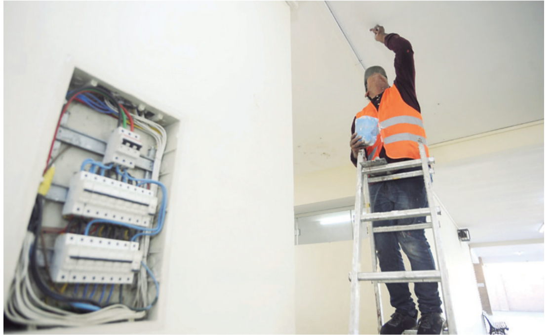
La Alcaldía inspeccionó los trabajos que se realizan en el colegio Mirette Sciaroni