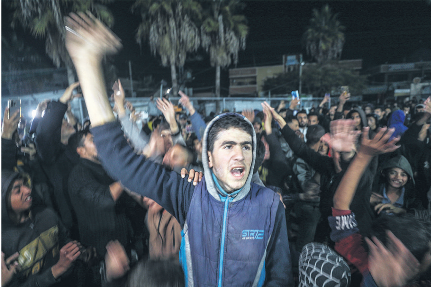
Miles de palestinos salieron a celebrar, en Gaza, el acuerdo de paz alcanzado entre Israel y Palestina que pone fin a 15 meses de bombardeos