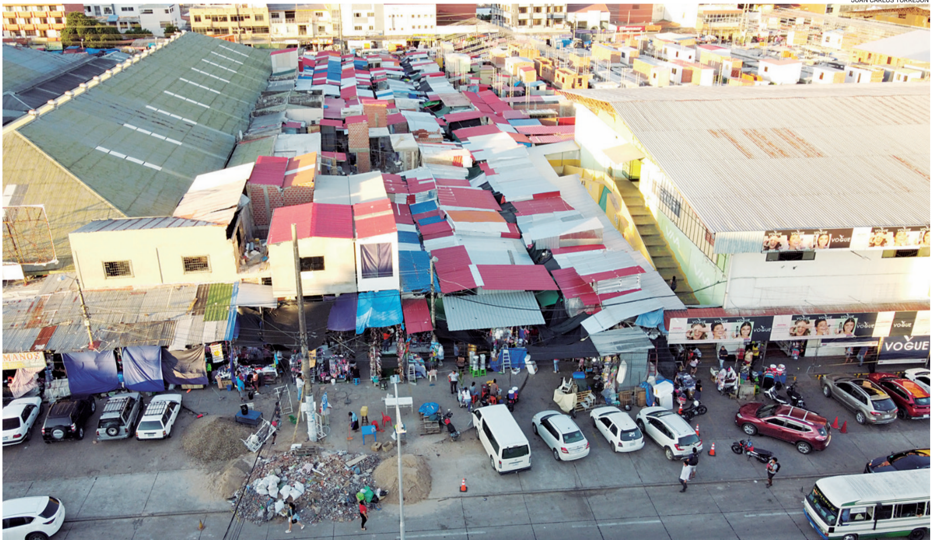
El litigio es por casi cinco hectáreas dentro del tercer anillo de la ciudad. Tras el incendio del mercado, se desató la batalla legal por la propiedad de los terrenos