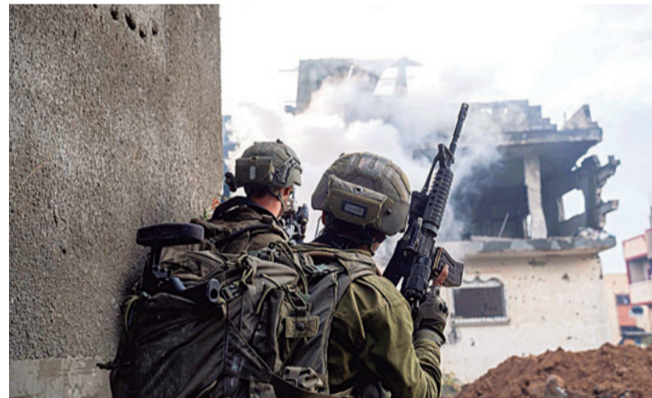
GUERRA SIN DESCANSO. El ejército de Israel mantuvo un asedio constante sobre Gaza. También atacó otros asentamientos.

El acuerdo contempla un alto el fuego desde el domingo. Suman más de 46.000 fallecidos