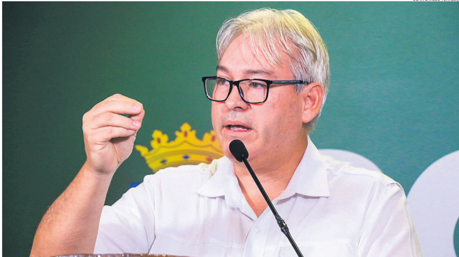
El ahora exsecretario de Hacienda se despidió del cargo argumentando temas personales. Aguilera dice que el sucesor debe ser de la "casa".

EL EXFUNCIONARIO APUNTÓ A LA GESTIÓN DE CAMACHO