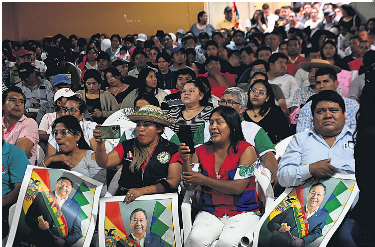
Militantes del MAS que apoyan al Gobierno de Luis Arce portan afiches del mandatario en señal de respaldo a su gestión.

En tanto, el evismo, recurre a sus acciones tradicionales como son largas caminatas para defender la repostulación de Morales, quien con mandamientos de aprehensión, se mantiene atrincherado en el Chapare.