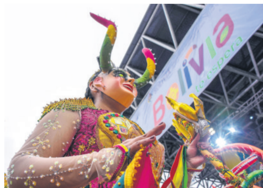
IDENTIDAD E INTEGRACIÓN. El folklore boliviano, extendido en los cuatro puntos cardinales del país contribuye a la integración social y cultural

Proveniente de Tarabuco, la danza de los Pujllay recupera la mística milenaria a través de sus vestimentas y su música singular