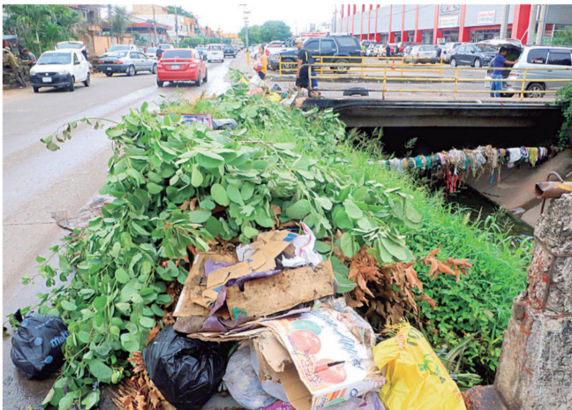
La gente coloca basura al borde de los canales sin respetar los horarios ni frecuencias establecidos

este tiempo fue ampliado debido a los problemas ocasionados por el precio del dólar en el mercado paralelo.