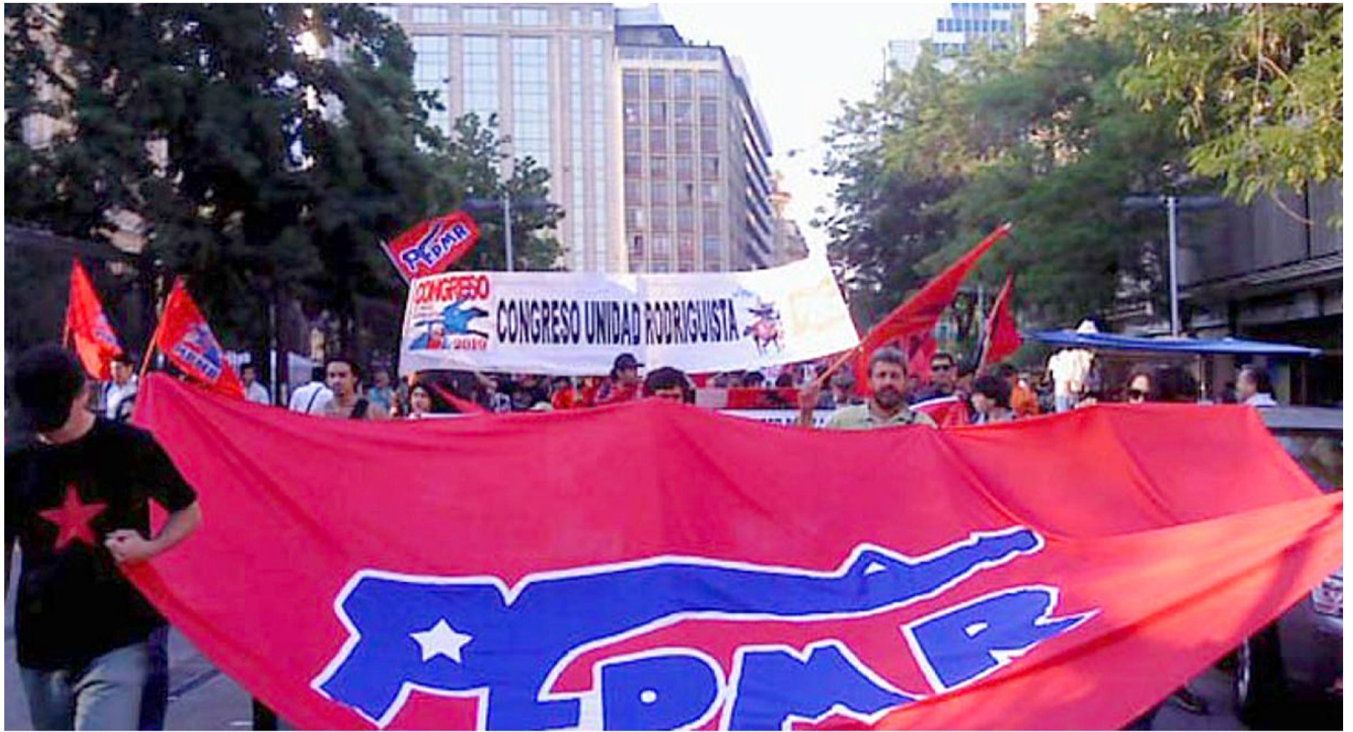
Miembros del FPMR están vigentes en la política chilena. Cuando Gabriel Boric hacía campaña lo criticaron por reunirse con algunos frentistas, a quienes llaman 'terroristas'.