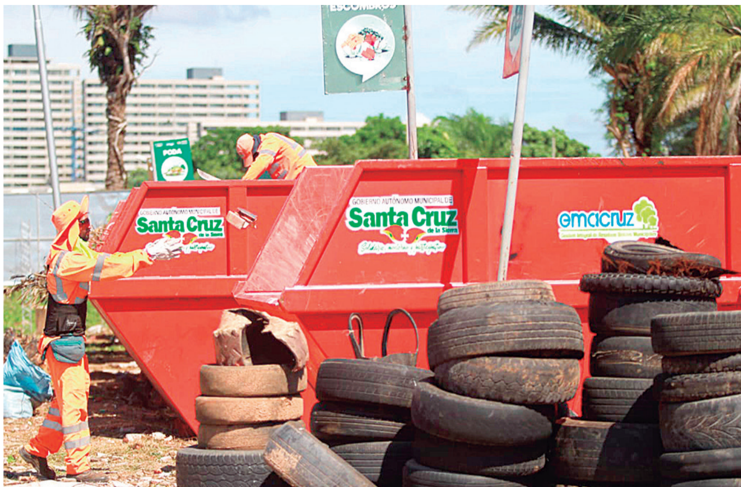
Se han colocado puntos para la acumulación de residuos y llantas para evitar que sigan incrementando los microbasurales

En diciembre de 2022, la Asociación Accidental Piraí se adjudicó el servicio de aseo del sector A por un periodo de ocho años, con un contrato de Bs 1.293.043.070. Se estableció un plazo de 180 días para que el operador realice el servicio utilizando maquinaria nueva o subcontratada. Al finalizar este plazo, debía contar con el 100% de equipos nuevos. Sin embargo,