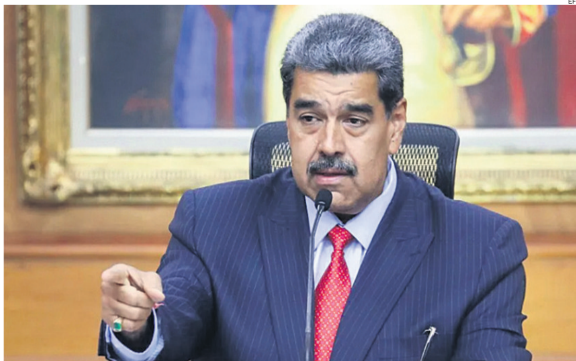
Nicolás Maduro busca el respaldo de sus aliados para defender su presidencia de un “ataque exterior”

La ascensión de Maduro a su tercer mandato presidencial está envuelta en protestas internas y críticas desde el exterior. Buena parte