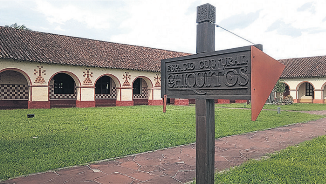
El Centro Cultural de San José permite al visitante un viaje a las raíces cruceñas y todas sus tradiciones.