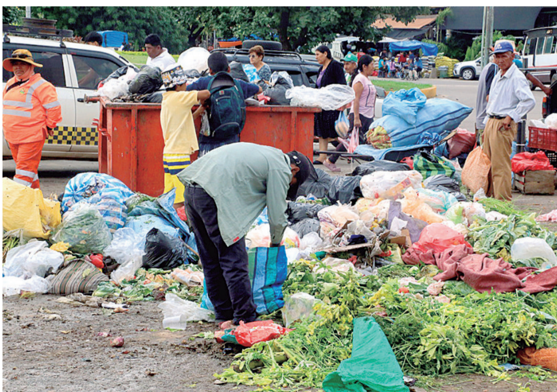
La limpieza en los mercados se realiza hasta cuatro veces al día, dependiendo de la acumulación de residuos

“Estamos justamente en la evaluación de las empresas y hemos invitado a las especializadas en aseo urbano”, dijo al indicar que hasta la próxima semana se conocerá al nuevo operador, por-