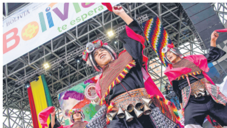
LA MÍSTICA DE UN PUEBLO PLURICULTURAL

Proveniente de Tarabuco, la danza de los Pujllay recupera la mística milenaria a través de sus vestimentas y su música singular