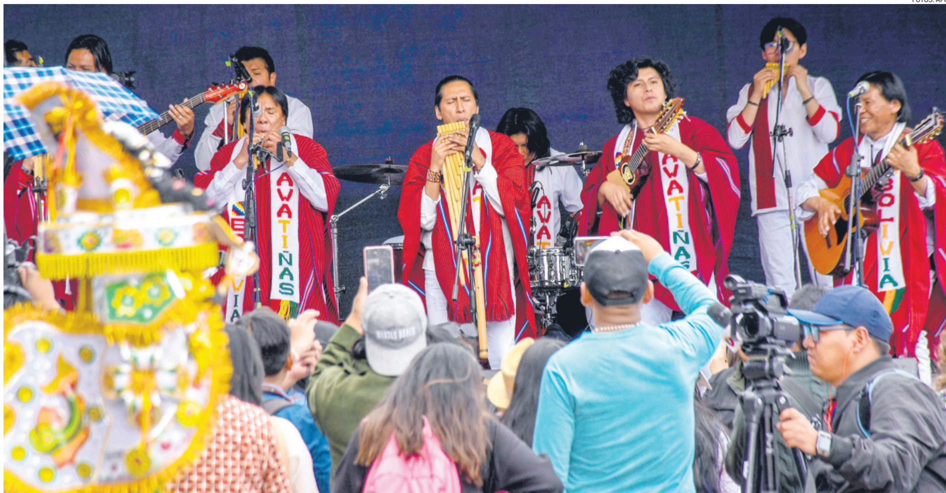
EL LENGUAJE DE LA MÚSICA. Al son de las zampoñas y las guitarras del grupo Awatíñas, los asistentes al Día Nacional del Turismo cantaron y bailaron en la antesala de los actos oficiales