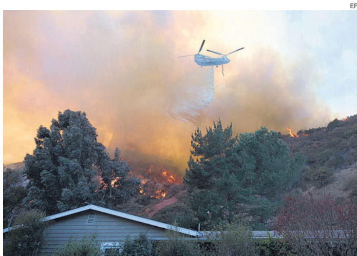
Siete incendios afectan al área de Los Ángeles, California

Los fuegos han arrasado al menos unas 15.000 hectáreas, destruido unas 12.000 estructu-