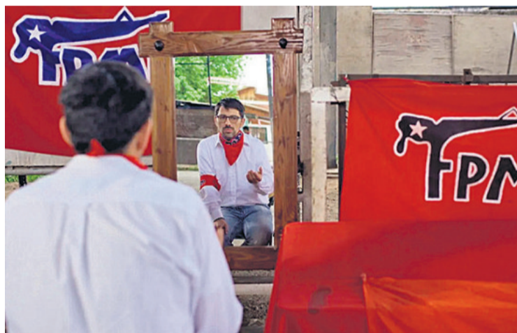
El caso del FPMR llegó hasta el cine y también a documentales.