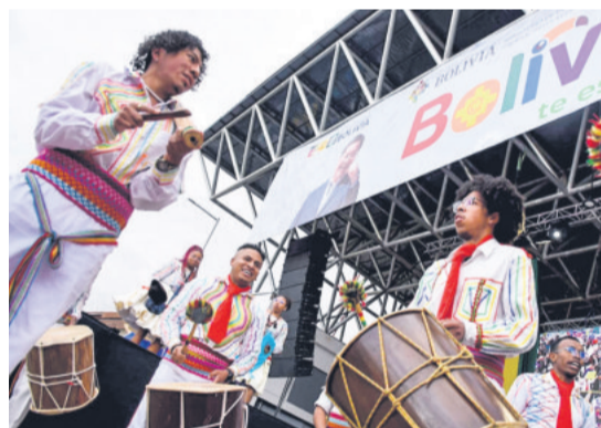
UN RITMO DE CORAZÓN Entre la gran variedad de expresiones culturales, los afrobolivianos han conquistado un lugar propio.

El carnaval de Oruro se ha convertido en una de las principales cartas de Bolivia para mostrarse al mundo. Su vitalidad, su tradición y su valor histórico y cultural son orgullo nacional.