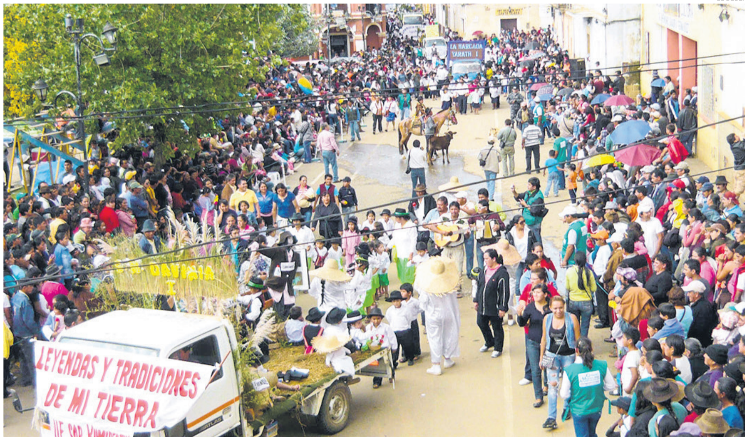
La población de Vallegrande, zona de los valles cruceños, es uno de los cinco municipios que recibió más visitantes en la gestión pasada.

Buena Vista con 9% y un presupuesto base de Bs 750, y Vallegrande 6% y un presupuesto de Bs 930, ocupan los dos puestos restantes. Este presupuesto base incluye: transporte, hospedaje,