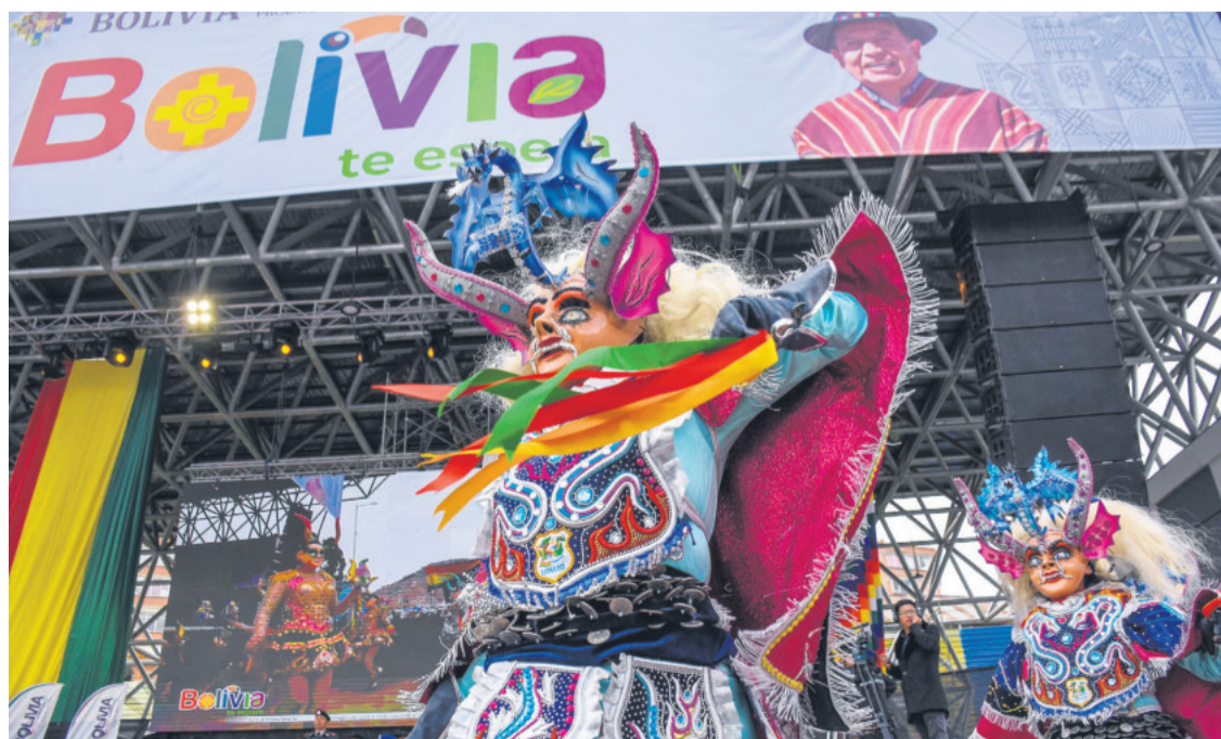
LA FUERZA DE LA DIABLADA.

El Día Nacional del Turismo enfatizó el Bicentenario como una oportunidad para el país. Música y cultura marcaron el acto