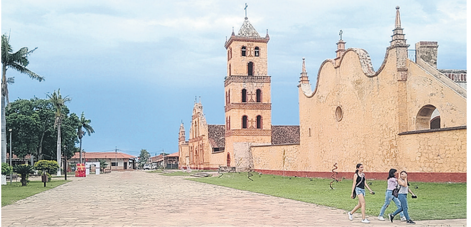
La Iglesia de San José de Chiquitos es la única de las misiones de Chiquitos que fue construida con piedras. La infraestructura es imponente.