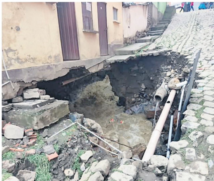
Enormes huecos se abrieron en el centro de esa localidad

Advierten de lluvias y posibles desbordes de ríos