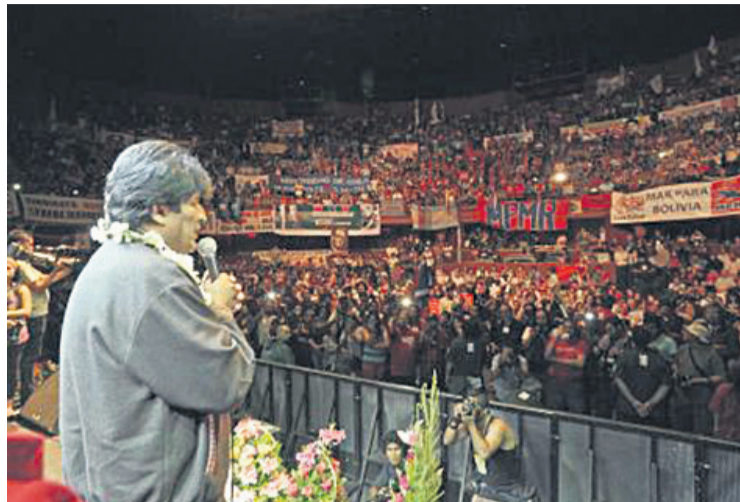
La causa marítima tuvo el respaldo de varios sectores de Chile.