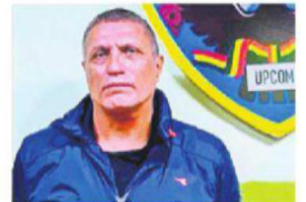
Buscan a Muñoz Hoffman

Entre tanto, los evistas intentan articular un movimiento político sin descartar alianzas. Marchan a La Paz. POLÍTICA A5