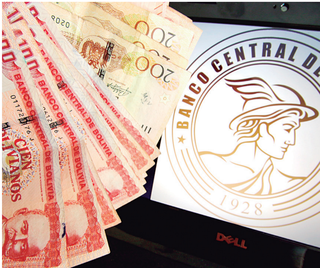
La deuda interna subió por que la Asamblea no aprobó créditos externos, señalan desde el Gobierno

No es la primera vez que el endeudamiento interno se dispara, convirtiéndose en uno de los indicadores más preocupantes. Por ejemplo, en 2019, el Estado obtuvo créditos del Banco Central de Bolivia (BCB) por Bs 16.000 millones, pero en 2023 esta cifra se elevó a Bs 101.000 millones, lo que repre-