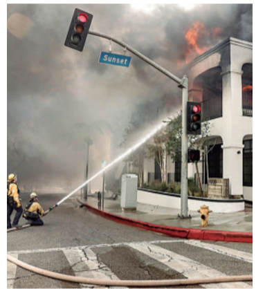
Son diversos incendios, algunos incluso en la ciudad misma

Autoridades han pedido la evacuación a más de 180.000 personas mientras más de 7.500 bomberos trabajan incansablemente para controlar los seis incendios