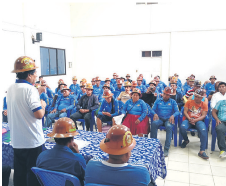
Evo Morales se atrincheró en Lauca Ñ donde se reúne con sectores.

La movilización de los evistas levantó cuestionamientos.