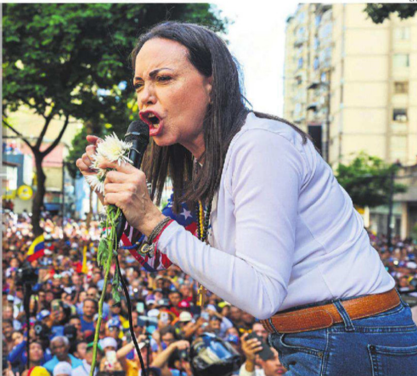
LA ESPERANZA. Las gestiones diplomáticas de Edmundo González Urrutia y la valentía contagiosa de María Corina Machado, son la esperanza para Venezuela