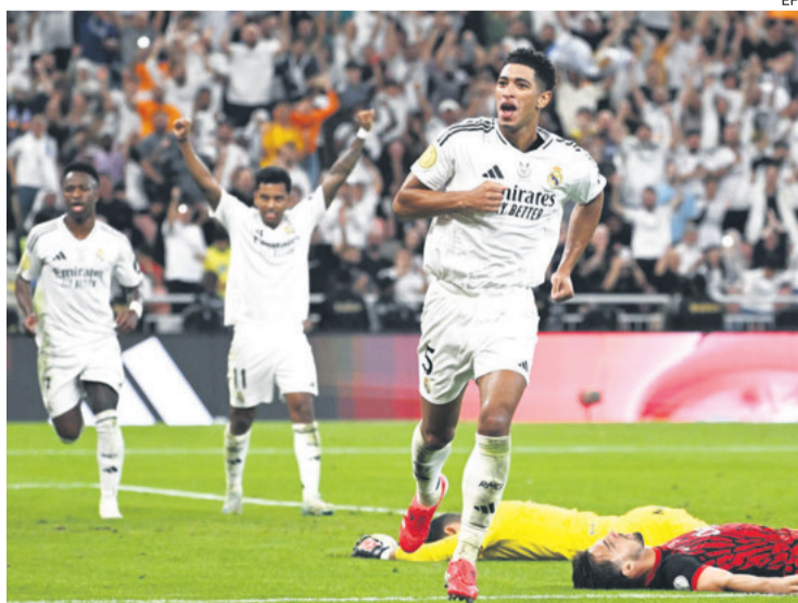
El festejo de Jude Bellingham que marcó el primero de los tres goles del equipo blanco

Sin sorpresas en los onces de ambos contendientes, el partido nació como se esperaba, con el Madrid luciendo artillería y el Mallorca agazapado para tapan agujeros. En dos minutos, Mbappé, en conexión con Vinicius, ya había hecho dos incursiones, la