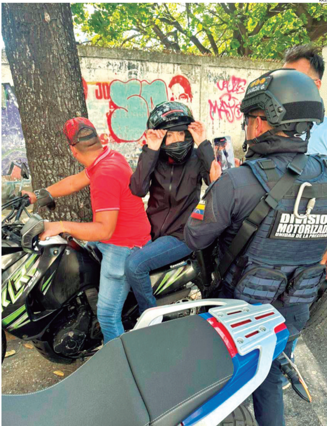
La opositora Machado poco antes de su retención cuando se trasladaba en una moto en Caracas

“Se la llevaron retenida por la fuerza. Durante su secuestro fue forzada a grabar varios videos y luego fue liberada”, indicó el partido Vente Venezuela. Gobierno dice que ha sido un plan para alarmar al país. Maduro jura hoy para un nuevo periodo