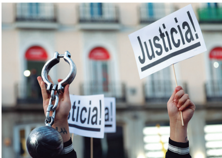
Miles salieron a las calles a pedir justicia y libertad por los presos,