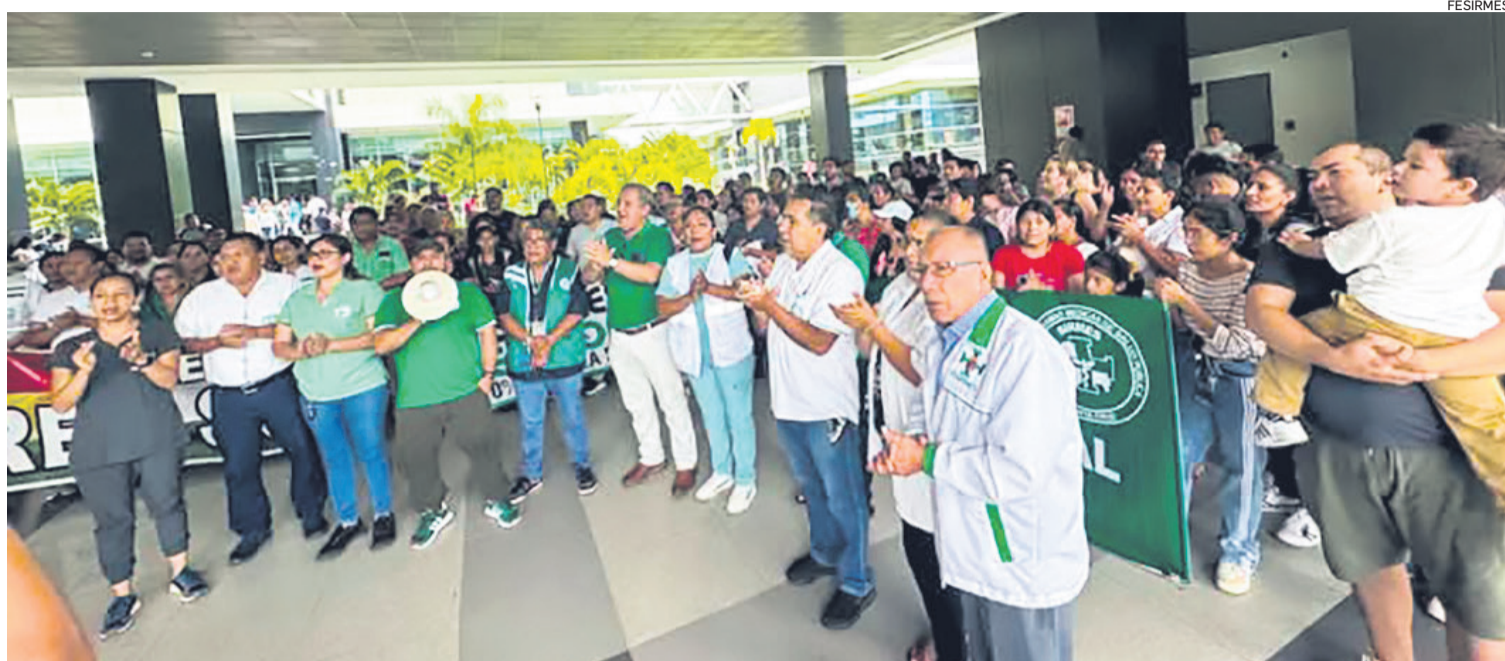
Los profesionales de salud se movilizaron en puertas de la Quinta Municipal, exigiendo la recontractación de 40 médicos