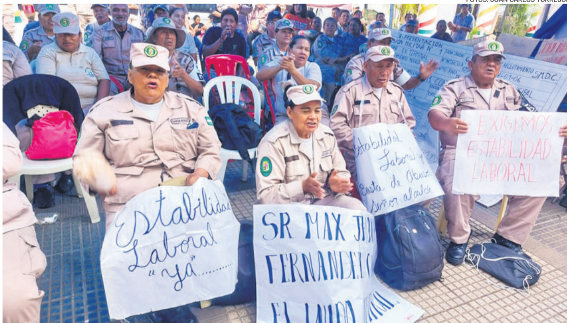
Guardias municipales, bomberos y personal de alerta temprana exigen estabilidad laboral