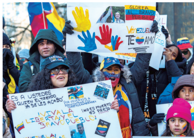
“Venezuela te amo”. “Venezuela libre” los gritos de las protestas.

clima de tensión y temor entre los ciudadanos.