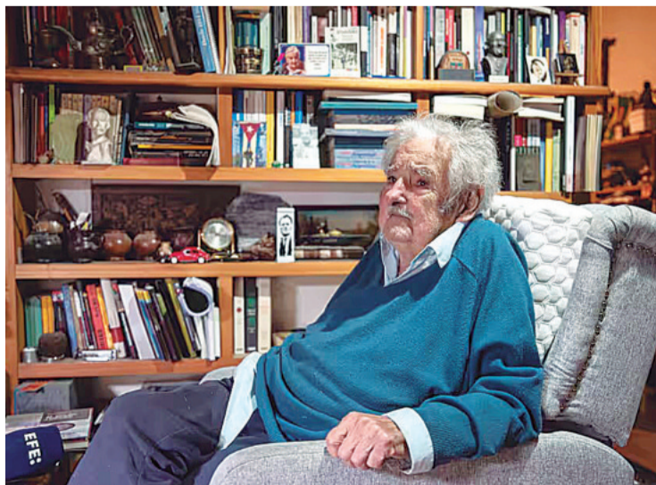
El expresidente de Uruguay, José Mujica, descansa en su casa

“Lo que pido es que me dejen tranquilo. Que no me acosen con entrevistas al pedo ni nada más. Se terminó mi ciclo hace rato. Sinceramente, me estoy muriendo y el guerrero tiene derecho a su