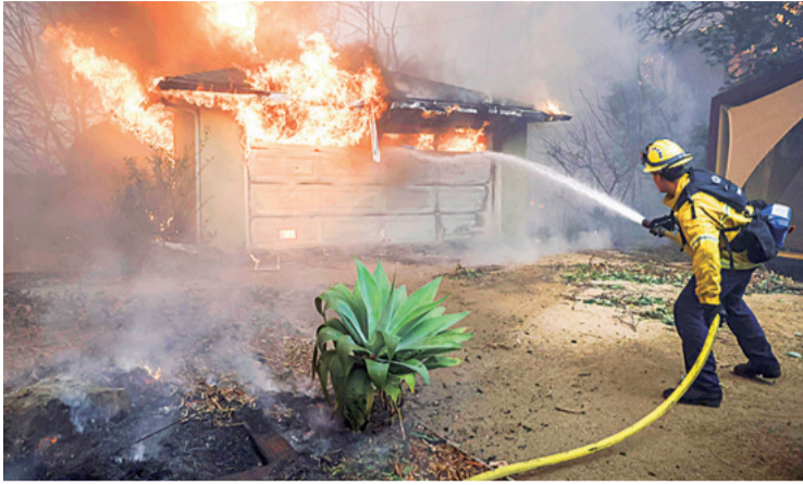
Más de 7.500 bomberos combaten las llamas en Los Ángeles