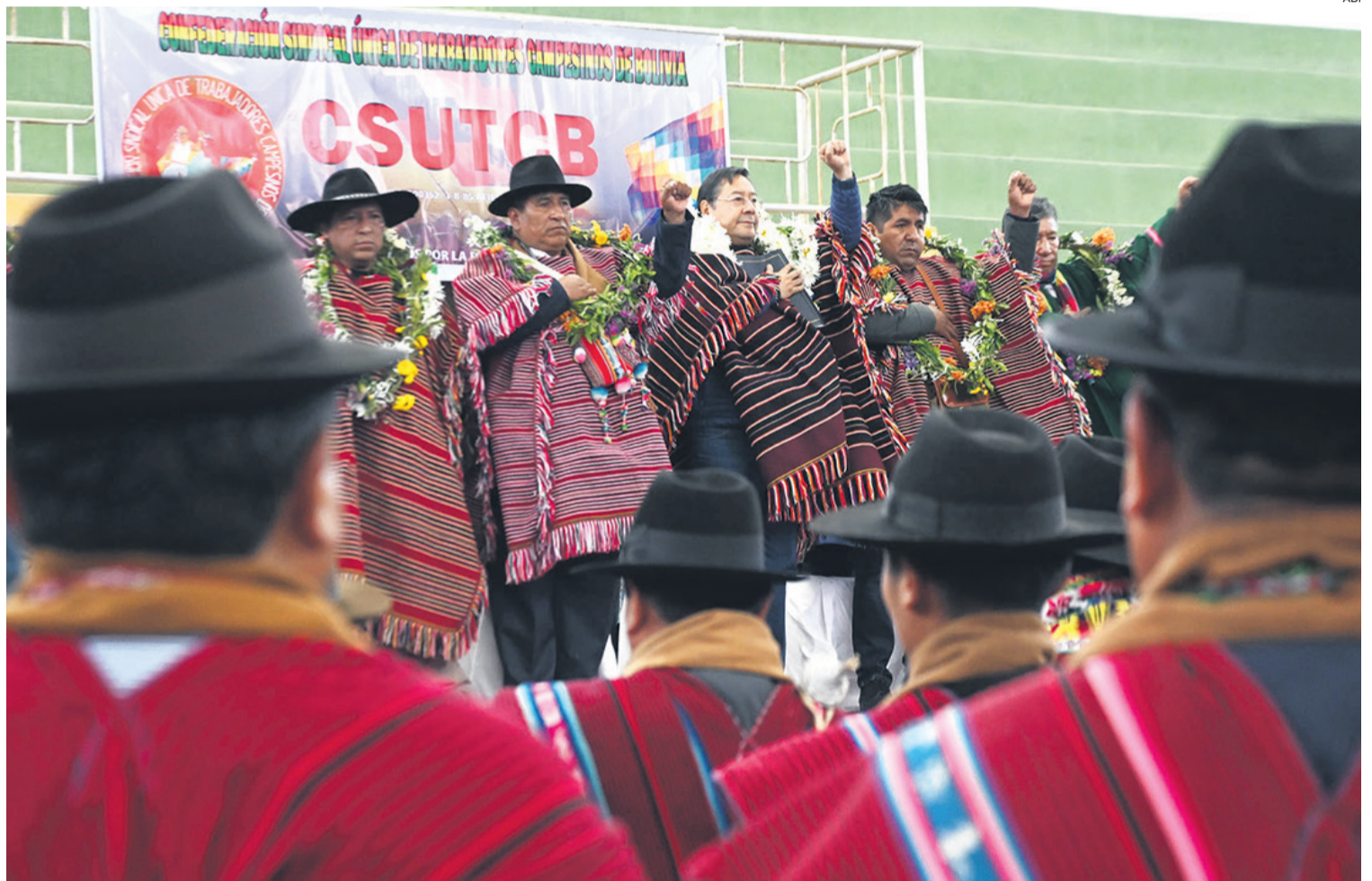
Luis Arce participó de un ampliado del sector campesino en la ciudad de Sucre. Ahí apuntó contra Evo Morales, Carlos Mesa y Camacho.

El mandatario participó en un ampliado campesino y apuntó contra Evo Morales, Carlos Mesa y Luis Fernando Camacho, a quienes los identificó como la “troika” que perjudica a su gestión. Desde el evismo le piden que se dedique a trabajar.