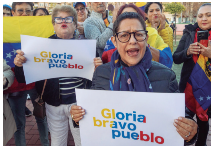
En varias ciudades del mundo se dieron manifestaciones por Venezuela