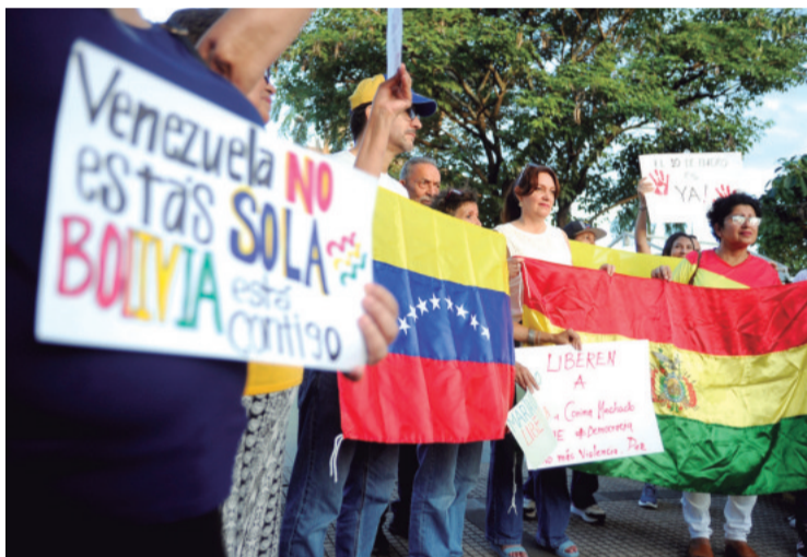
Manifestantes en Manzana Uno de Santa Cruz de la Sierra.