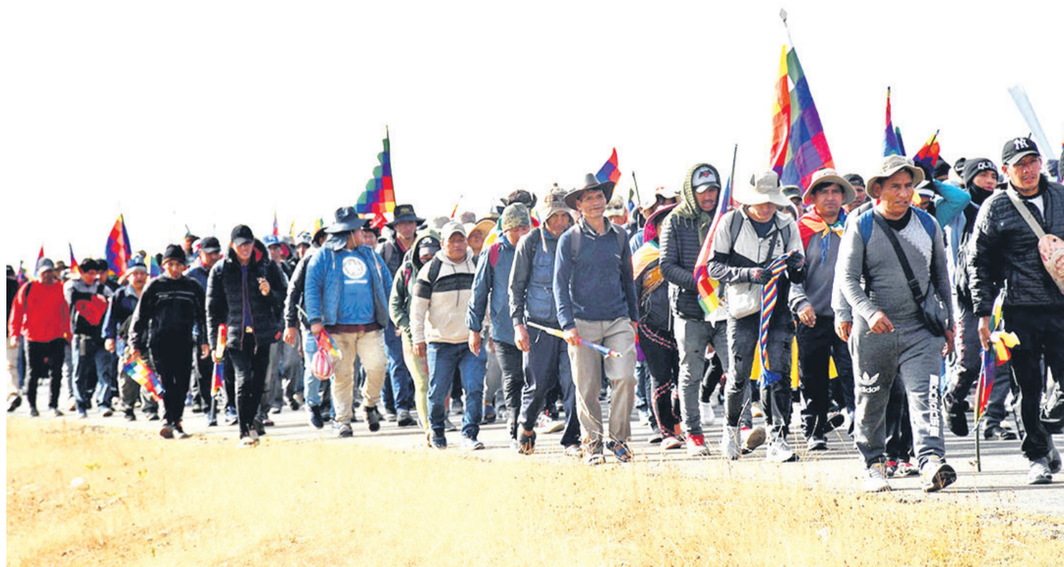
La movilización de los evistas partirá desde el municipio de Patacamaya y tiene previsto llegar a la ciudad de La Paz en cuatro días.

Ayer, Morales mantuvo reuniones en Lauca Ñ con concejales de Sacaba y con la dirigencia de los Regantes de Cochabamba. El exmandatario se atrincheró en el Chapare por la orden de aprehensión en su contra.