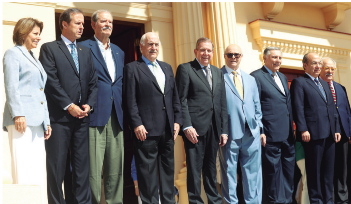
González está rodeado por varios exmandatarios de la región y su anfitrión de República Dominicana.

En tanto, en Venezuela, el panorama sigue siendo incierto. Las fuerzas de seguridad han intensificado su presencia en Caracas, mientras las manifestaciones opositoras crecen en magnitud y frecuencia. Las denuncias sobre detenciones arbitrarias y desapariciones de activistas opositores generan un