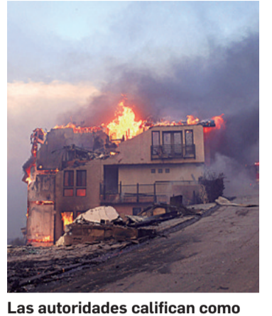
Las autoridades califican como devastador el avance del fuego