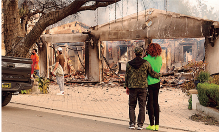
Desolados. El incendio destruyó el hogar de cientos de familias