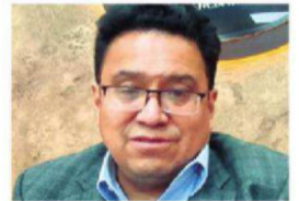
Se reunió con los prorrogados

comunidades están bajo el agua. Los pronósticos alertan de más lluvias y tormentas y hay carreteras intransitables A2Y3