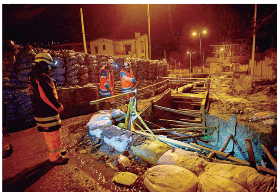
Los trabajos que se realizan en la zona de Bajo Llojeta, en la ciudad de La Paz