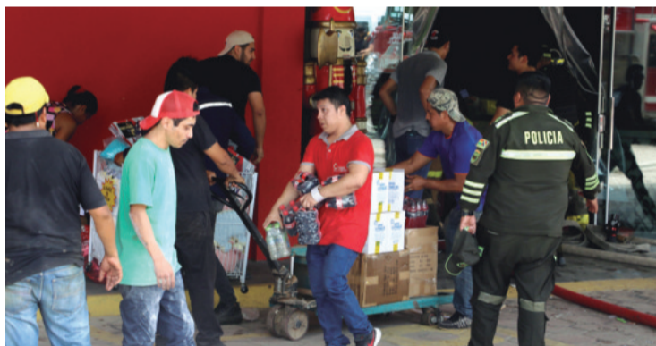
Se requirió ayuda para retirar los productos almacenados en el local.