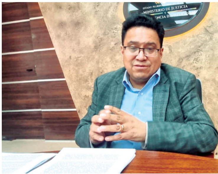
La autoridad explica los alcances de los autos constitucionales.

Desconocía hasta el día de ayer (lunes) los motivos por los cuales no asistieron los magistrados electos a esta convocatoria, que reitero, tenía por objeto la inauguración del año constitucional. Sin embargo, ya por los medios de co-