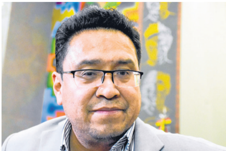
Siles asumió como ministro de Justicia en septiembre de 2024