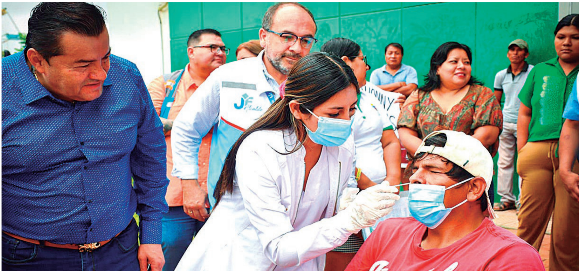
Los hospitales móviles recorrerán los barrios para brindar atención a las personas que presenten síntomas. El alcalde acompañó la habilitación del primero en el Plan Tres Mil