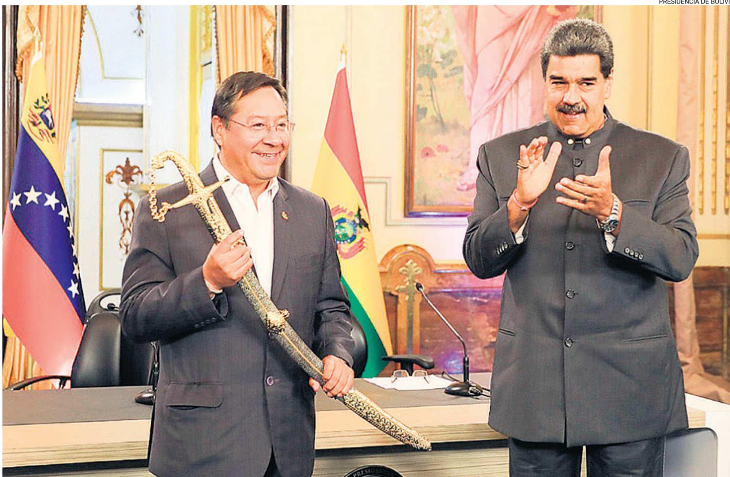
Luis Arce fue el único presidente de la región que reconoció la supuesta victoria de Nicolás Maduro. Ahora, decidió no ir a su posesión.

Los embajadores de la UE en Caracas no estarán en la posesión de Maduro.