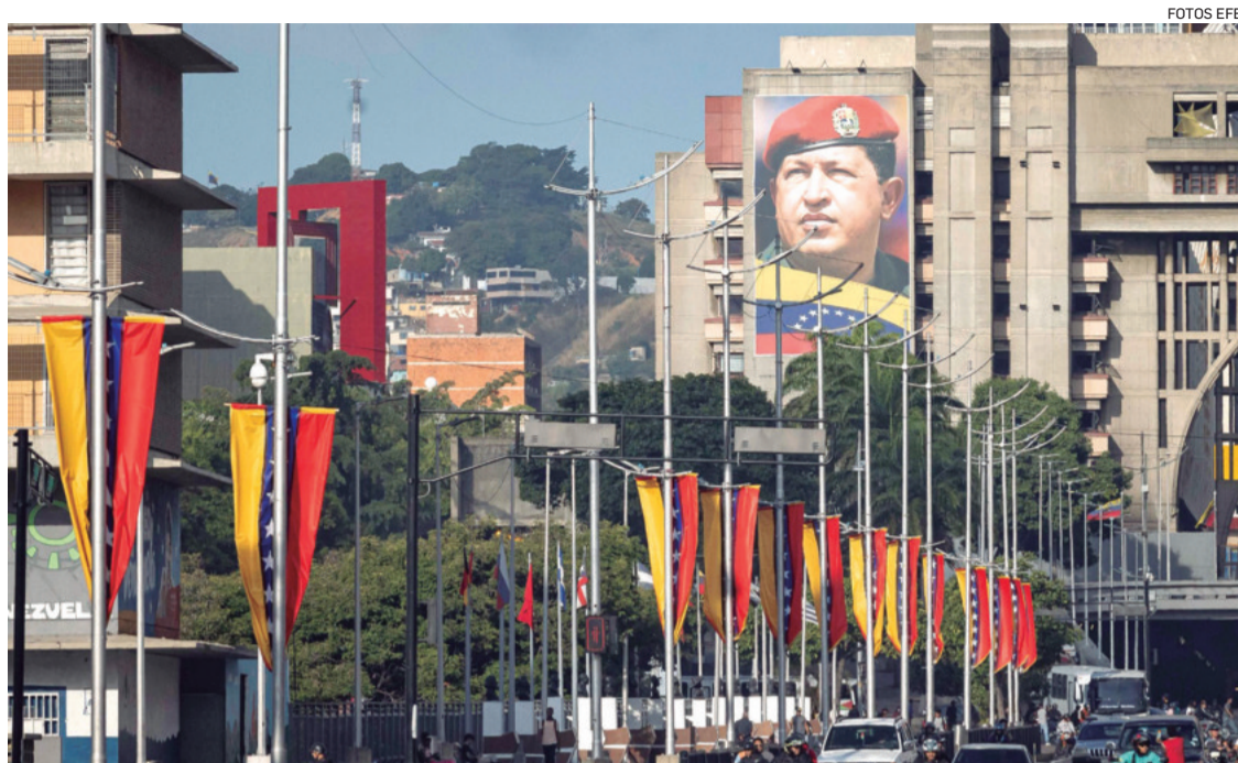
La capital venezolana se encuentra blindada con miras a la posesión de Nicolás Maduro este viernes