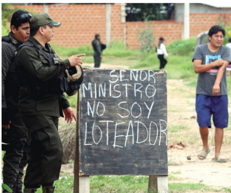
Algunos antes de salir expresaron su malestar contra el ministro