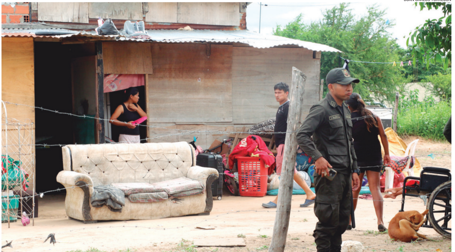
Una familia sacó sus muebles y enseres para irse a buscar dónde vivir. Los asentados aseguran que fueron víctimas de estafa por loteadores

Romero aseguró que se tiene un proyecto aprobado para la construcción de un complejo penitenciario para una cárcel productiva y el próximo paso será lanzar la licitación para iniciar las obras. Palmasola es la cárcel más po-