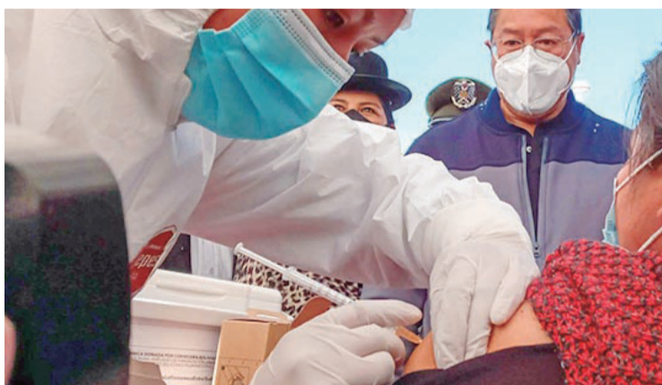
Los centros de salud están aplicando las vacunas de forma gratuita