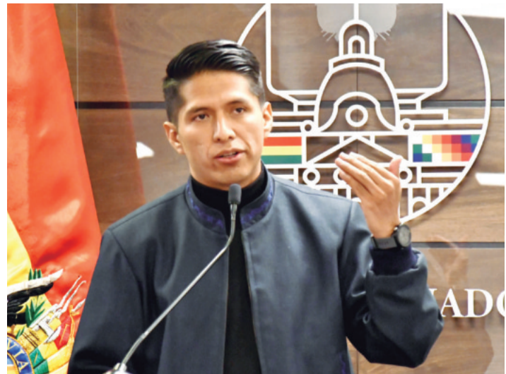
Andrónico Rodríguez, presidente del Senado de Bolivia.

Este miércoles en Sucre habrá sala plena del TCP para definir su directiva