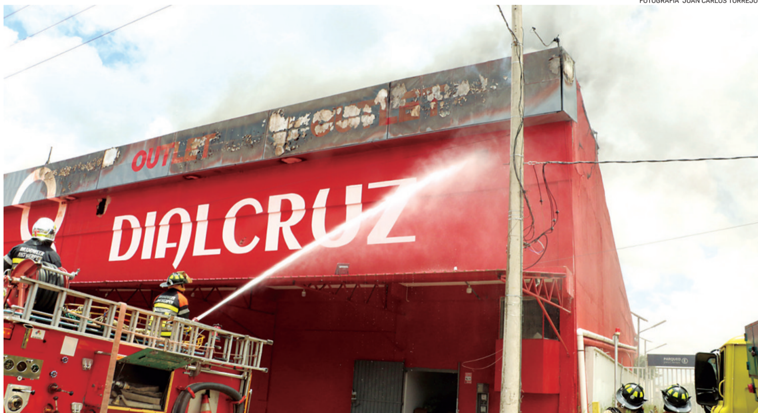
Bomberos desplazados hasta el lugar trabajaron arduamente para controlar el fuego y evitar que se expanda a otros edificios cercanos

total y del control del siniestro que inicialmente amenazaba con dañar seriamente la estructura del inmueble y afectar otros inmuebles colindantes.