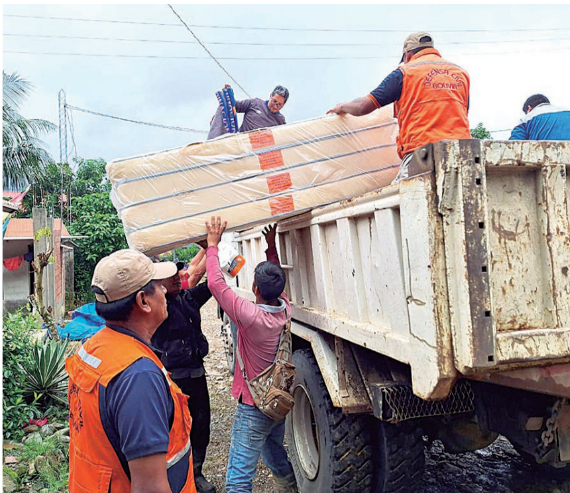
Defensa Civil lleva ayuda humanitaria a las zonas que reportan daños por las precipitaciones