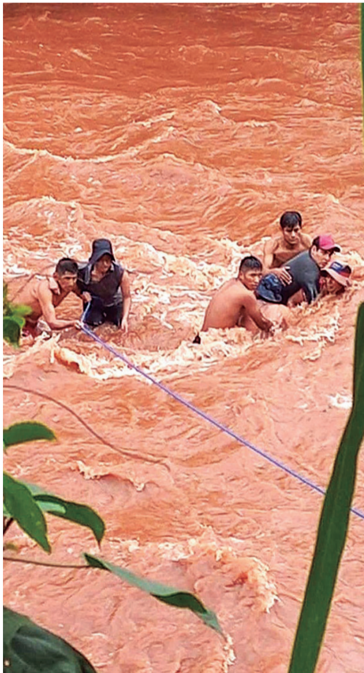
Buscan al bebé de ocho meses, en el municipio de Alto Beni

Rosales informó que realizan seguimiento especialmente en la serranía Takoloma, donde este domingo hubo un deslizamiento en el punto de mayor inclinación, donde existe una falla geológica.