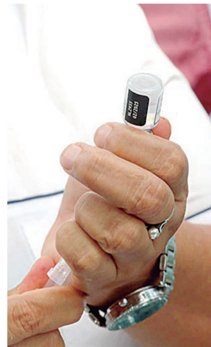
El Ministerio de Salud anunció la llegada de más 500.000 dosis al país

de 8:00 a 14:00. Se habilitarán dos puntos adicionales en las zonas norte y sur de la ciudad, mientras que los hospitales móviles llegarán a los distritos 6, 8 y 12, áreas con mayor incidencia de casos.