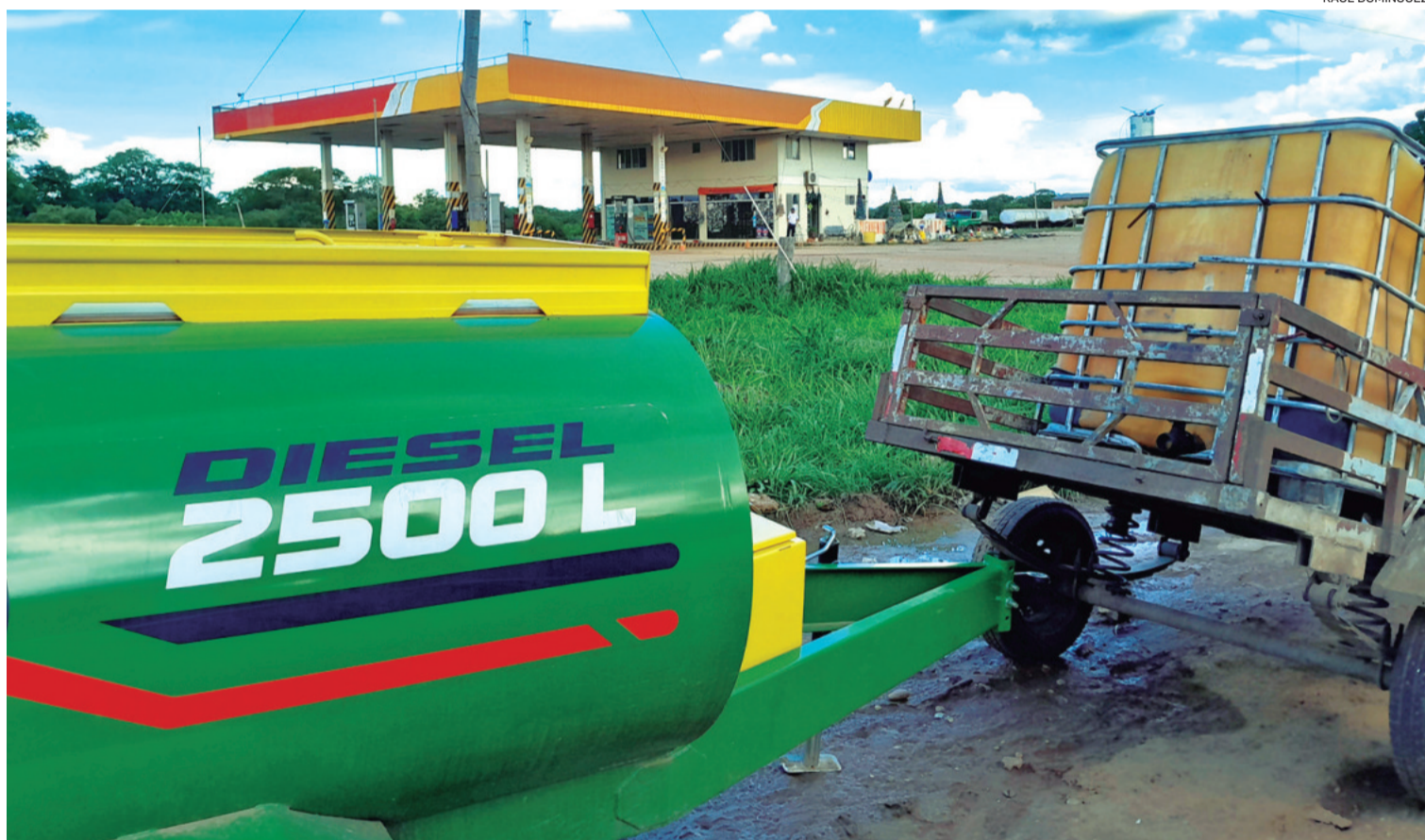
En el surtidor de ingreso a San José de Chiquitos, los remolques forman fila a la espera de diésel. La figura es generalizada en la región

La Agencia Nacional de Hidrocarburos informó que el país cuenta con un stock de combustible de cinco días en las diferen-