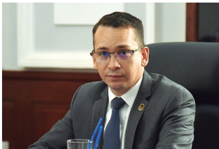
El chiquitano Romer Saucedo, preside el TSJ.

Se trata del primer cargamento descubierto en lo que va de esta gestión. Por los informes, la droga fue transportada por tierra, no en avioneta como sucedió de manera frecuente en otras oportunidades.