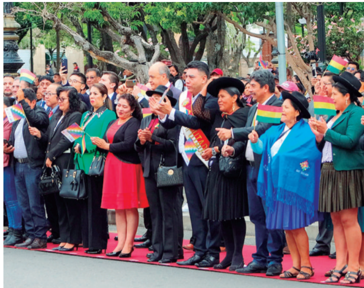
Autoridades locales estuvieron en el acto oficial en la ciudad de Sucre.

proyectos de integración caminera (dobles vías, túneles, puentes, carreteras), mejoramiento de aeropuertos, hospitales, industrialización, entre otras que serán entregadas en 2025 por los diferentes ministerios.