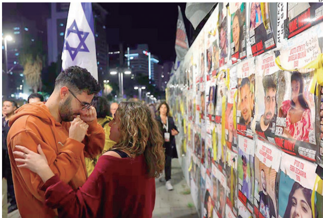
Hamas anunció la liberación de 34 ciudadanos de Israel secuestrados. Familiares piden acelerar acuerdo

Hamás, por su parte, ha pedido una semana de calma, sin que aviones israelíes sobrevuelen Gaza, para comunicarse con los captores y confirmar dónde y en qué estado están estos rehenes, ya que algunos están en manos de