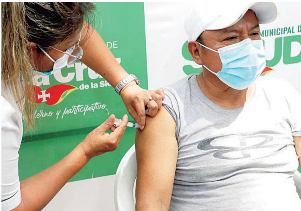
Piden que la gente acuda a recibir la dosis anual y evitar complicaciones de la enfermedad