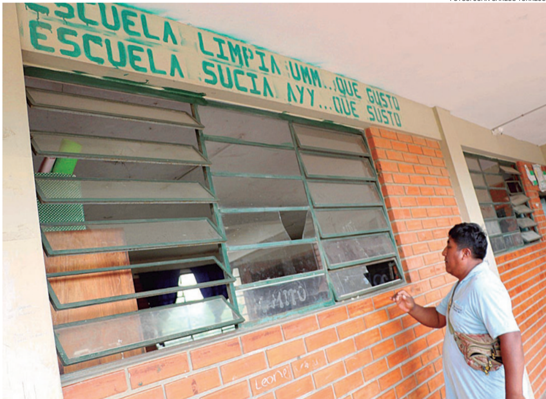
Hay ventanas que tienen vidrios rotos y necesitan el mantenimiento correspondiente

Situaciones similares se registran para otras zonas. En el Dis-