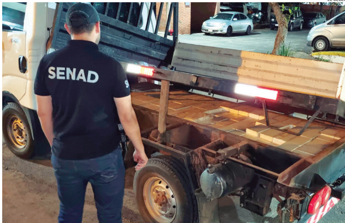
El camión transportada la droga desde Bolivia hasta el Paraguay donde fue descubierta en doble fondo

Los nuevos magistrados del TCP no participaron de los actos de los autoprorrogados