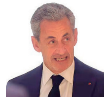
Nicolás Sarkozy, expresidente

Delegaciones de Israel y Hamás retomaron este fin de semana las negociaciones en Catar y el jefe del Mosad, David Barnea -que lidera el equipo negociador israelí- viajó a Doha para continuar el diálogo; después de que anoche Netanyahu se reuniera con los principales ministros de su Gobierno.