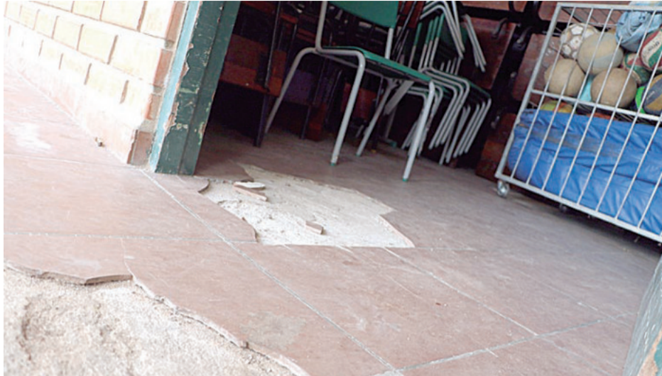
Hay pisos que están deteriorados y piden que la Alcaldía haga los arreglos