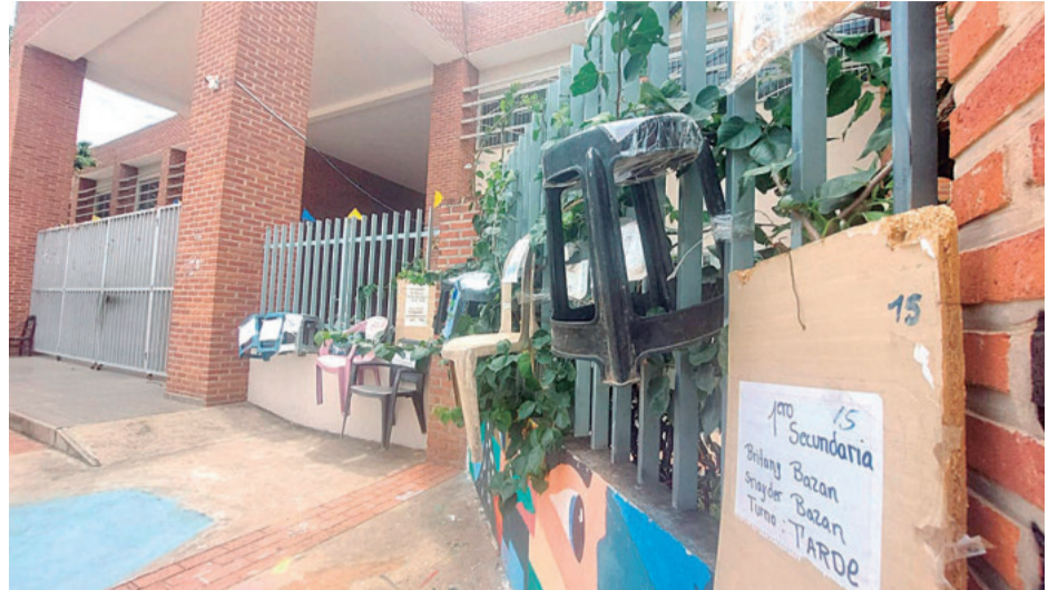
Estas sillas fueron colocadas en el centro educativo Santa Ana, en la av. Virgen de Luján