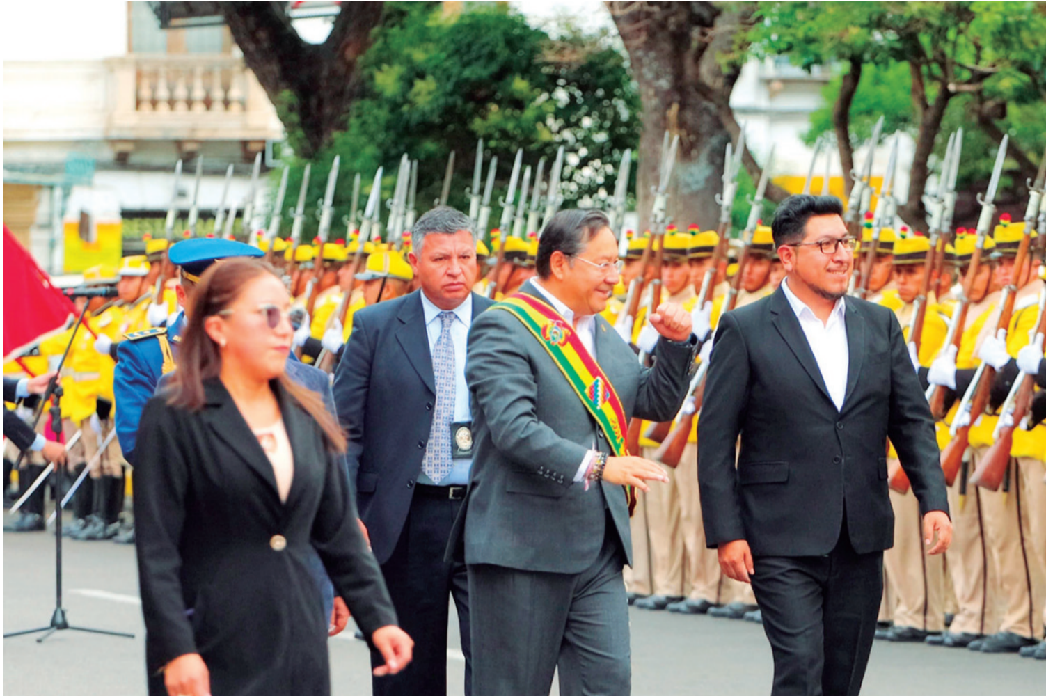
Luis Arce inició los actos oficiales del año del Bicentenario en la ciudad de Sucre. En la capital del Estado pidió al país que prevalezca la unidad.