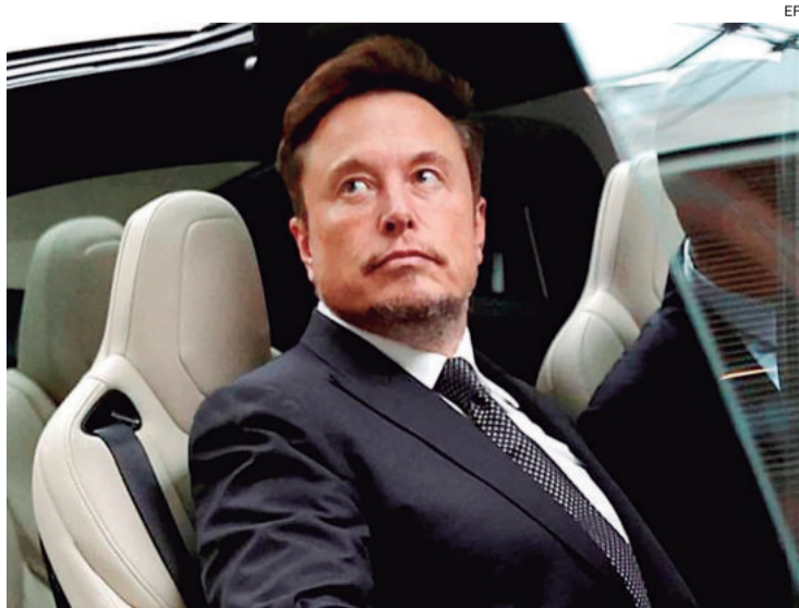
Líderes europeos observan el uso de X, manejada por Elon Musk

La Comisión Europea (CE) insistió este lunes en que Musk tie-