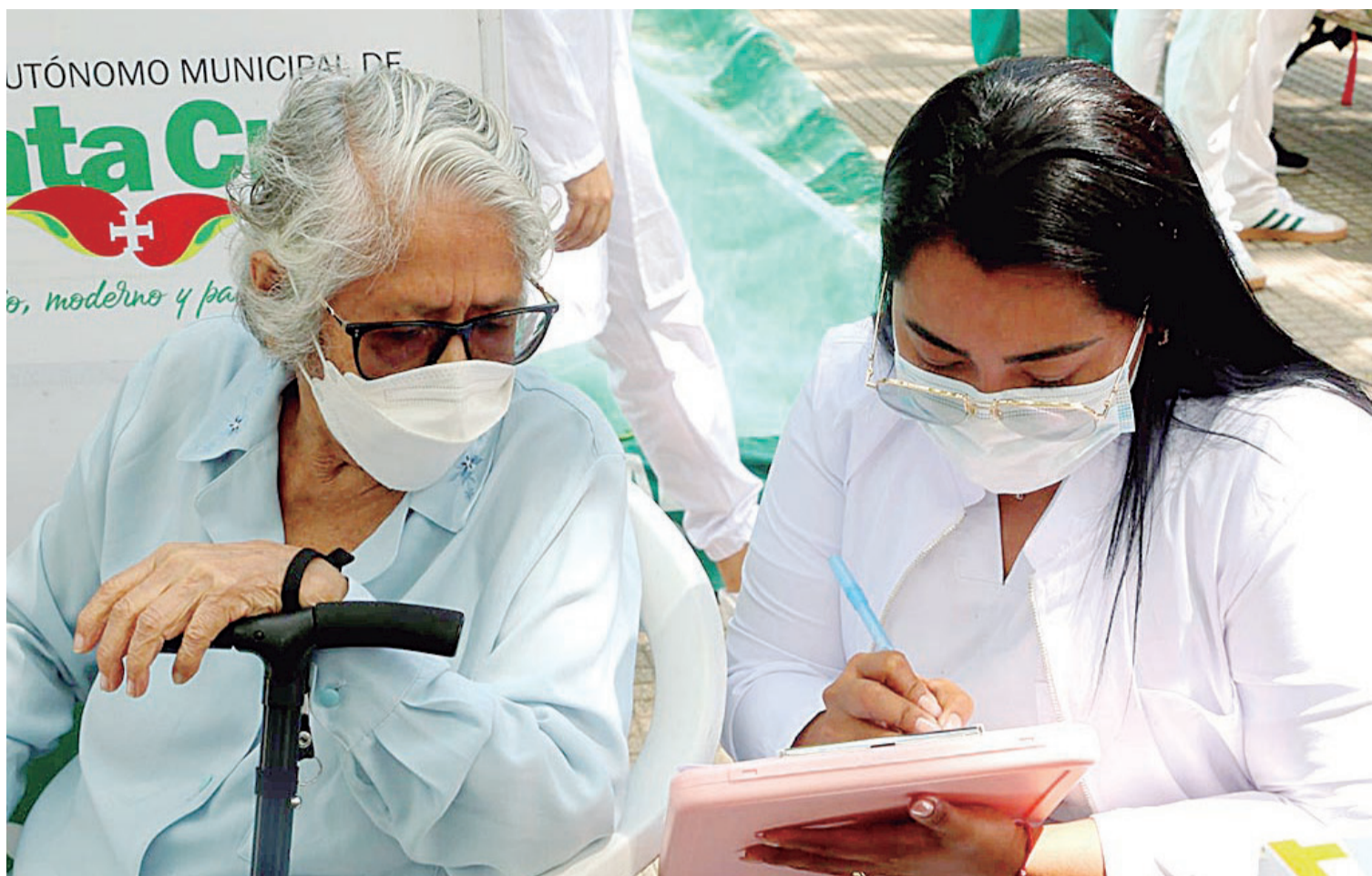
Recomiendan que los grupos de riesgo, como son las personas de la tercera edad, se vacunen para estar protegidos