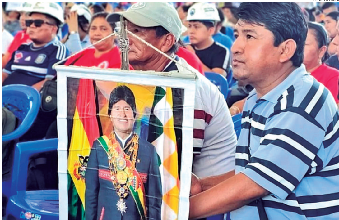
Evo Morales y Luis Arce mantienen su larga división y llevaron al MAS a ser un partido quebrado.

Según el exmandatario, en 2010 la subvención de los hidrocarburos costaba 1.000 millones de dólares, cifra que hoy asciende -dijo- a 4.000 millones y podría llegar a 6.000 millones en 2030.