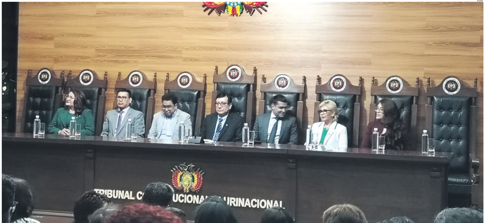
El ministro de Justicia está en la testera con el grupo de magistrados que de manera unilateral decidieron extenderse en sus cargos más allá del límite constitucional de seis años

LOS MAGISTRADOS ELECTOS ASUMEN EN MANDO DEL ÓRGANO JUDICIAL