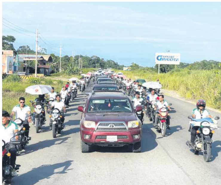
La seguridad sindical que resguarda a Evo Morales en el Chapare.

El dirigente cocalero aseguró que correrá sangre si la Policía ingresa a la localidad de Lauca Ñ a aprehender a Morales.