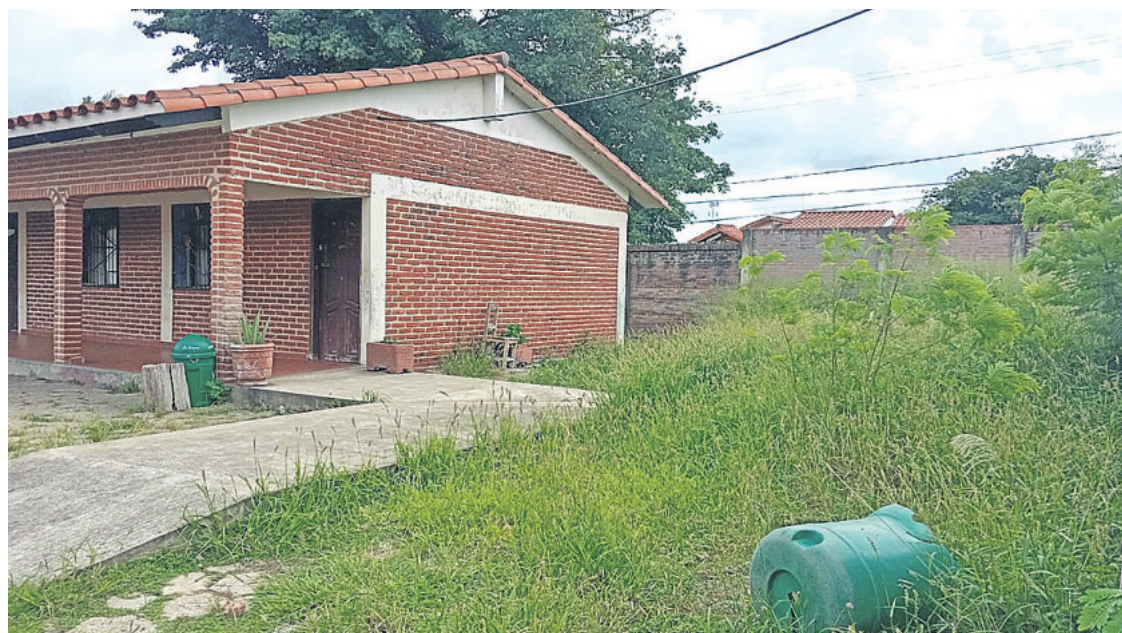
El colegio Humberto Egüez Roca necesita que corten la hierba que ha cubierto el patio