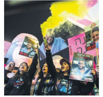
Clamor por rehenes en Tel Aviv

Para muchos de sus partidarios, el hecho de que la dirigente fuera acogida y elogiada por Trump en su residencia es otra muestra de su papel ascendente como socio de referencia entre los países de la Unión Europea ante el nuevo Gobierno del magnate estadounidense, que tomará posesión de su cargo el 20 de enero.