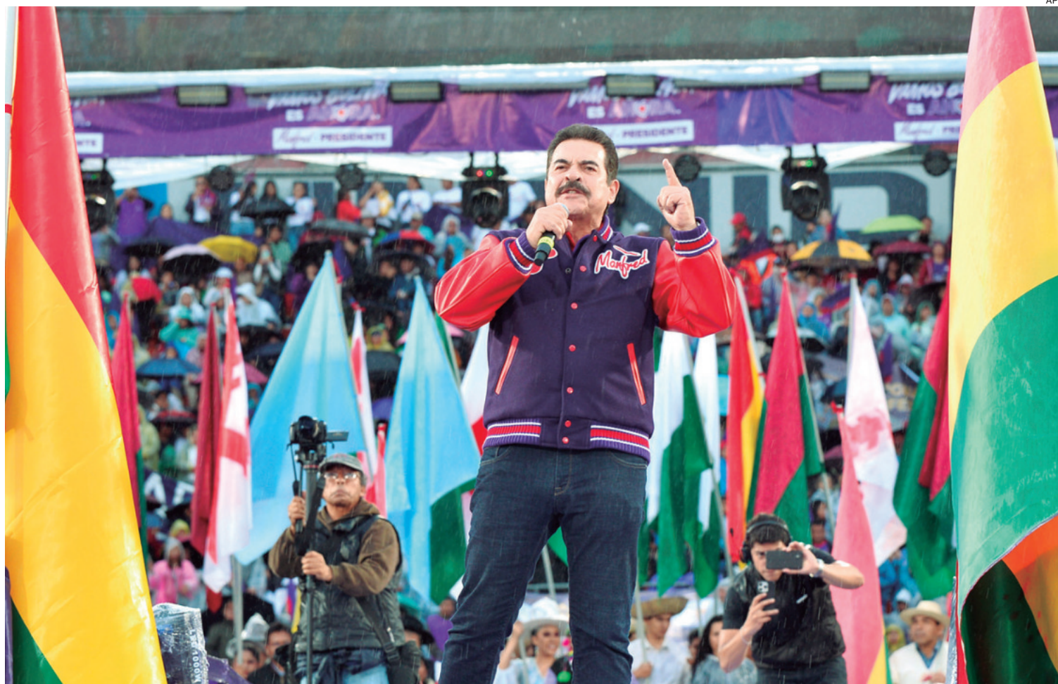
El alcalde cochabambino fue proclamado ayer candidato a la Presidencia del país por los militantes de Súmate-Autonomía Para Bolivia