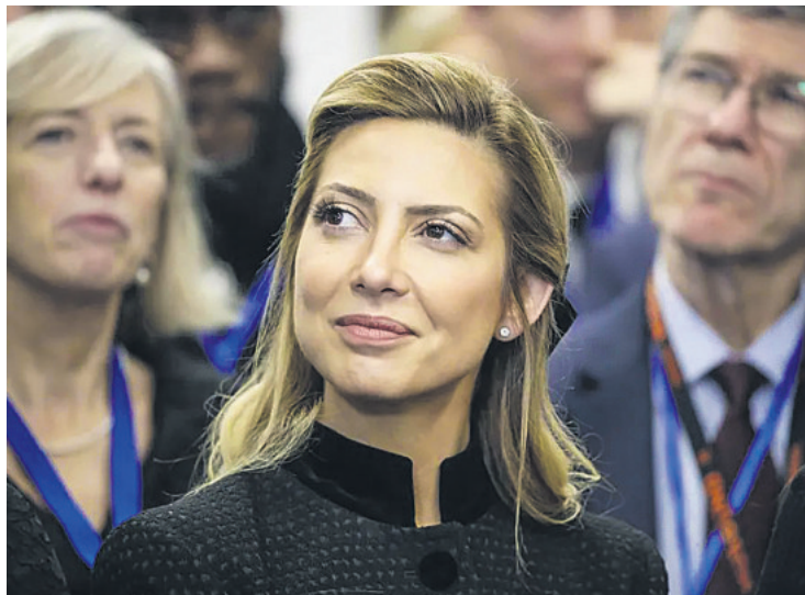
La primera dama reside desde hace más de un año en Madrid

Tras la difusión de esas imágenes, el presidente argentino, Javier Milei, reclamó a la Justicia que le quitara a Yáñez la custodia de efec-