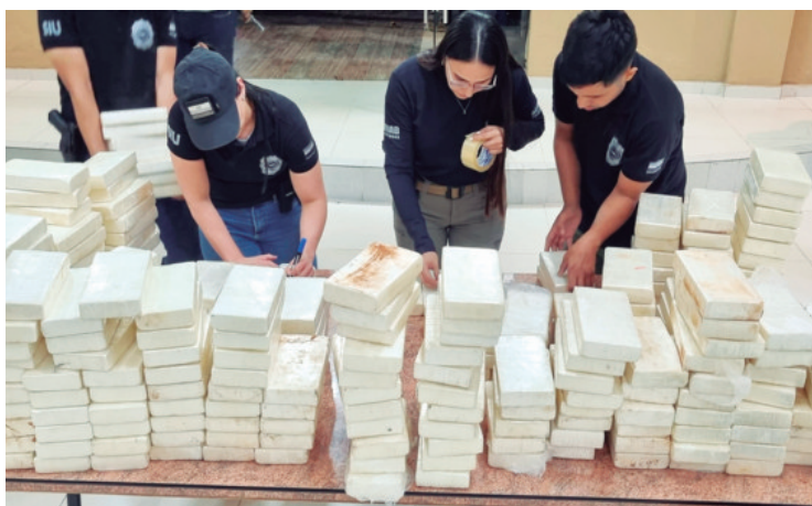
La cocaína es de alta pureza y se intensifican las investigaciones