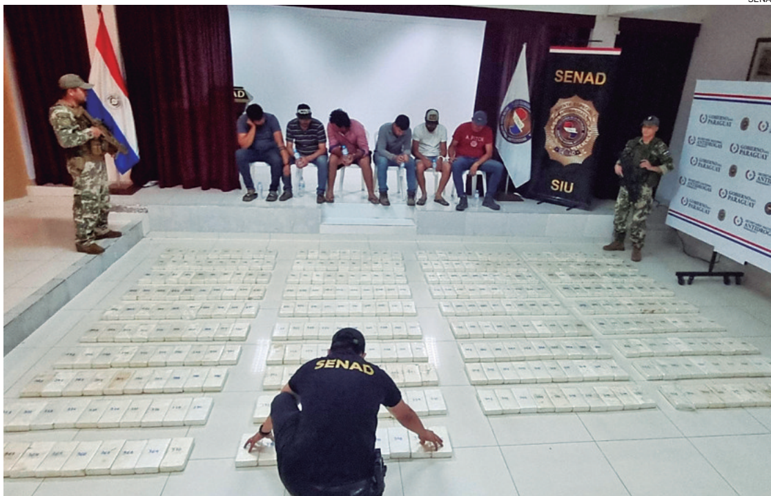
Agentes de la Senad procedieron al conteo de la cocaína frente a los seis hombres aprehendidos