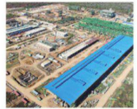
El proyecto tiene avance del 95%

liquidez para reinvertir en otros proyectos o responder a necesidades inmediatas de financiamiento A8