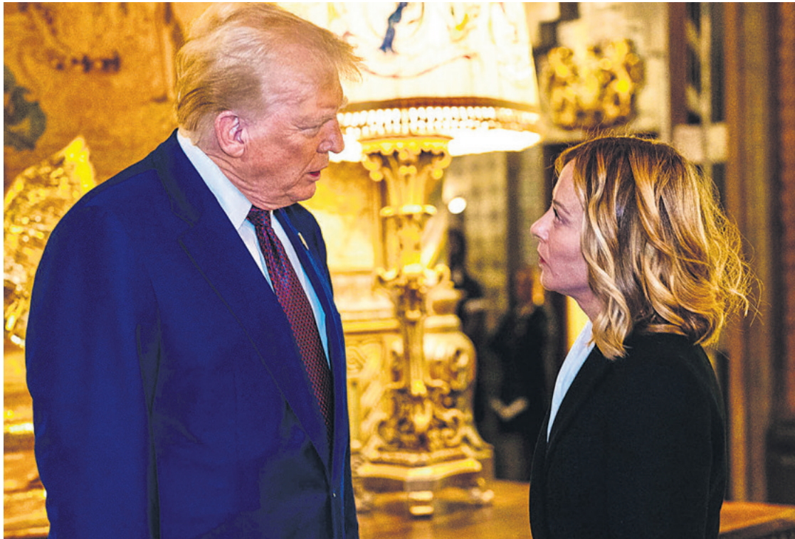
El mandatario electo de EEUU recibió en su residencia de Mar-a-Lago a la primera ministra italiana