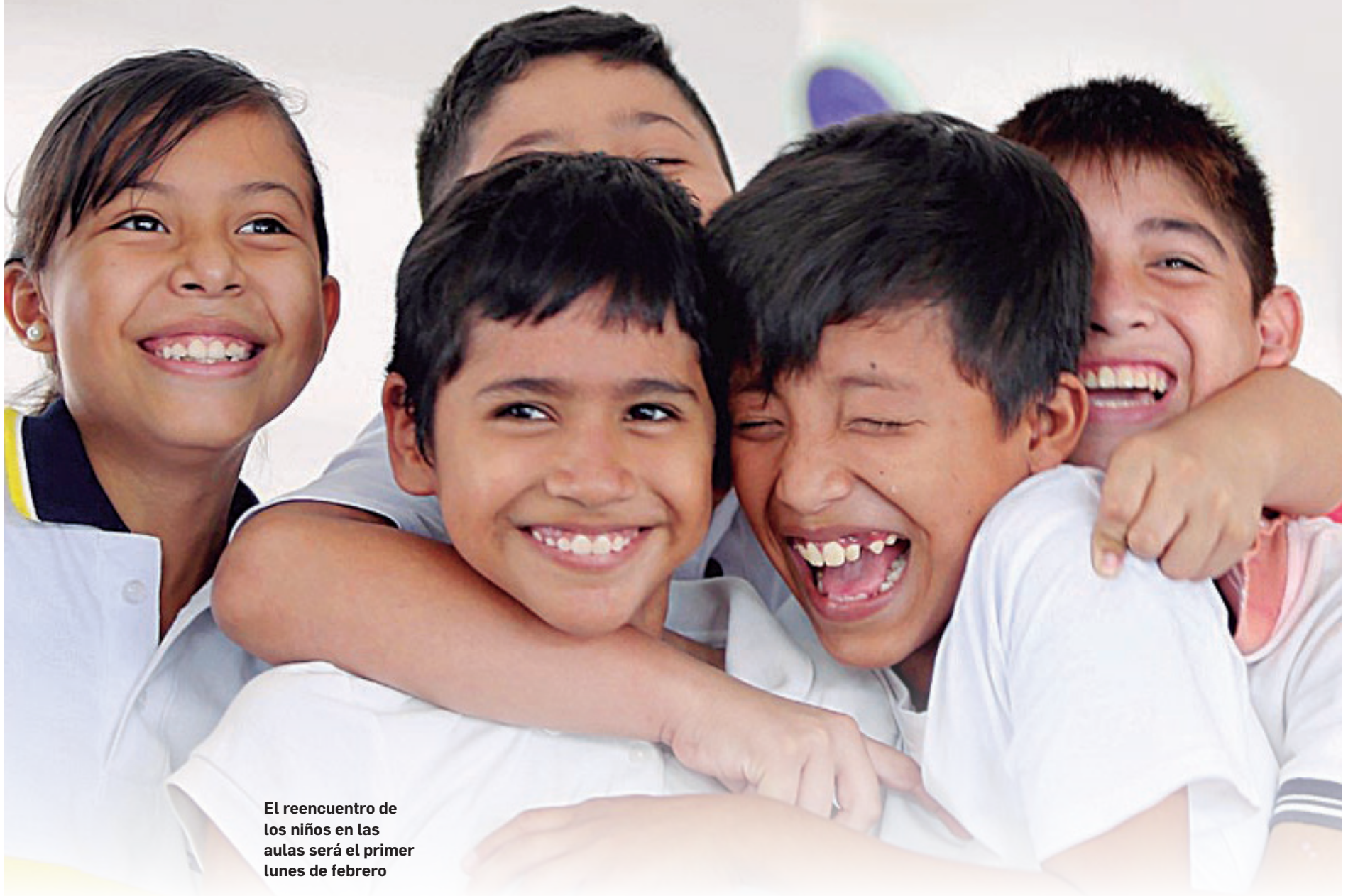
El reencuentro de los niños en las aulas será el primer lunes de febrero

Las clases comienzan el 3 de febrero y los procesos de contratación para el mantenimiento recién están en marcha