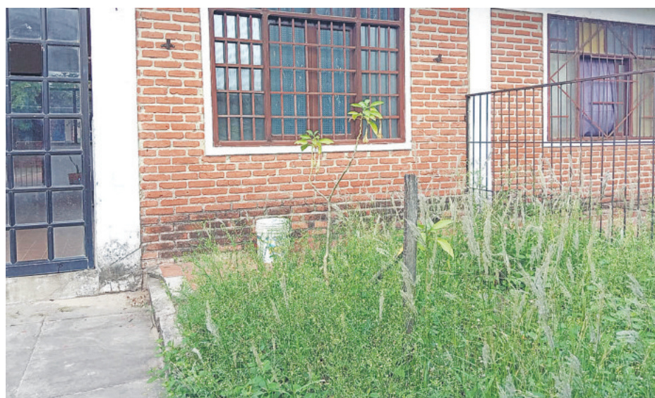
La escuela San Silvestre, inicial y primaria, tiene vidrios rotos y el pasto crecido

educativos por distritos recién a finales del año pasado, según consta en el Sistema de Contrataciones Estatales (Sicoes). Una de ellas es la licitación para el mantenimiento y mejoramiento de módulos educativos en el Distrito 11, cuya convocatoria fue publicada por tercera vez el 31 de diciembre por Bs 604.582.