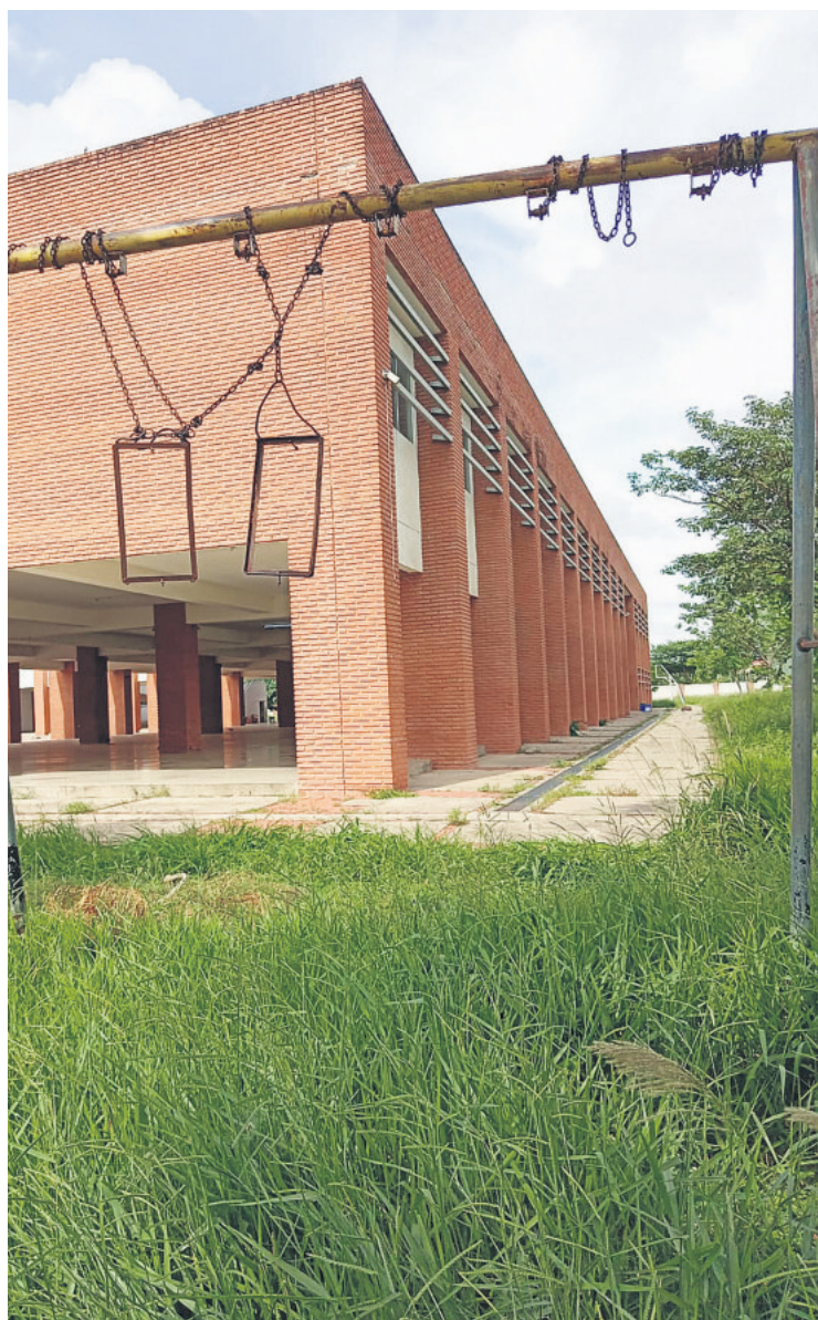
En el módulo educativo San Silvestre estas hamacas necesitan ser repuestas, porque están completamente deterioradas

altos y vidrios rotos en las ventanas, algunos cubiertos con telas o cartón. En el módulo contiguo, que también lleva el nombre de San Silvestre, el pasto está crecido y las hamacas del patio cuelgan deterioradas.