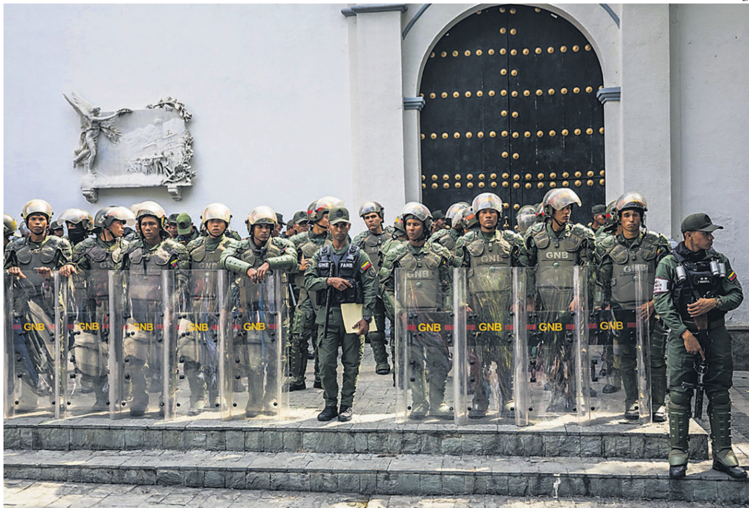
Miembros de la Guardia Nacional Bolivariana apostados en las afueras de la Asamblea Nacional Venezolana. Existe una estricta custodia