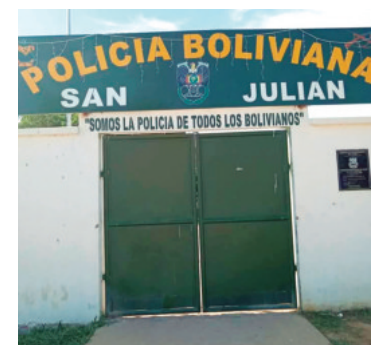
Cerrada la Policía en San Julián

Ante cualquier emergencia las autoridades aseguran que los policías de Cuatro Cañadas, que está cerca, podrán acudir al lugar para brindar atención.