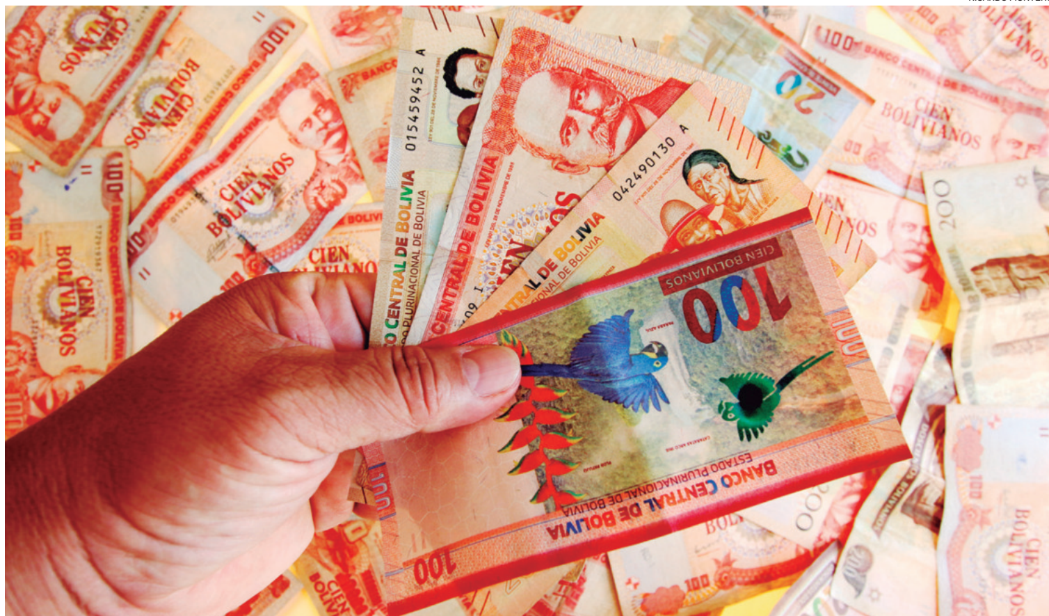
La medida fue aplicada por lo menos en los últimos nueve años, llegando alguna vez a una instrucción de capitalización del 100% de las utilidades

capitalización de utilidades incrementa el capital regulatorio, “fortaleciendo la capacidad de las entidades para absorber pérdidas potenciales y aumentando la confianza de los depositantes y reguladores”.