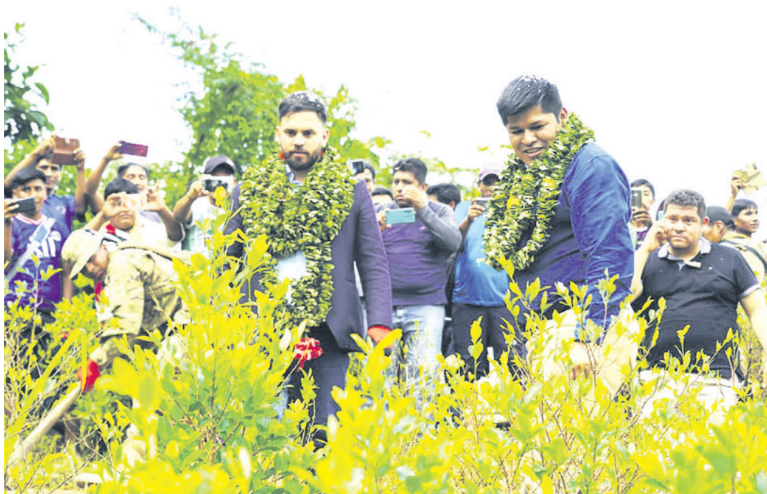
Los afines a Evo Morales apuntan al ministro Del Castillo de armar el proceso contra el líder cocalero

Los afines a Morales ayer marcharon en el municipio de Chimoré y culparon al ministro Eduardo Del Castillo de “montar” el proceso legal contra el expresidente Morales.