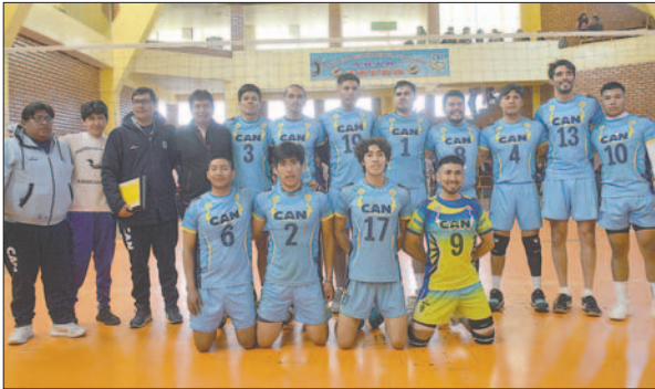
El equipo de CAN gallardo campeón de la temporada 2024