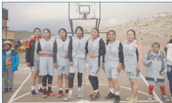
Persistencia y unidad en Racing de Oro campeonas en baloncesto

esto no afectó el desempeño de las jugadoras de Gran Tunari y Racing de Oro. El encuentro fue tan parejo que se tuvo que ir a un tiempo extra para definir al campeón. Finalmente, Racing de Oro se consagró campeón ganando por 26 a 23.