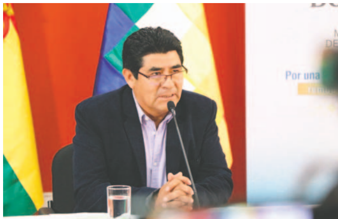
El ministro de Educación, Omar Veliz Ramos

Según el artículo 93 de la Resolución del Ministerio de Educación 001/2025, se establece que no exis-