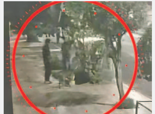
Momento en el que las víctimas son interceptadas

De acuerdo a la denuncia, los ladrones se llevaron celulares y otros objetos de valor. El caso es conocido por la Fuerza Especial de Lucha Contra el Crimen (Felcc), instancia que investiga el hecho. Aún no se da con el paradero de los delincuentes involucrados en este ataque.