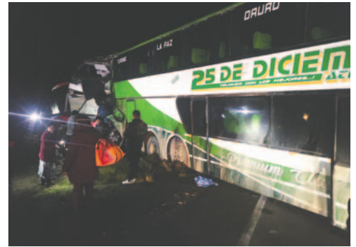
El accidente se registró la madrugada del jueves 9 de enero /TRÁNSITO

El Ministerio Público continúa recopilando información para esclarecer los hechos y determinar responsabilidades. Ventura afirmó que se busca garantizar que el conductor responsable enfrente el proceso judicial, por lo cual la audiencia de medidas cautelares se lleva-