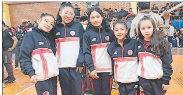
Economía uno de los clubes que recibió más galardones