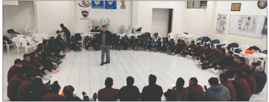
Durante el curso realizaron diferentes dinámicas motivacionales

Indicó que, si bien en este primer curso se tuvo cupos limitados, a futuro se espera continuar con este tipo de talleres e incrementar la cantidad de participantes para que más personas abocadas al ám-