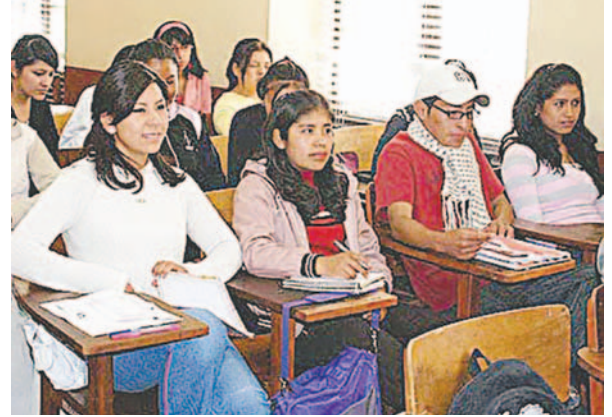
El cupo para estudiantes nuevos depende de cada facultad

La autoridad aseguró que el examen será diseñado el mismo día de su aplicación. Explicó que cada facultad conformará tres comisiones: una para elaborar la