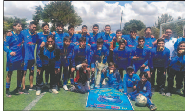
Gran campaña de Futuro FC en el fútbol orureño

ta de 10 a 2 al conjunto de Bolívar Nimbles, resultado que de momento deja a Hermandad en el cuarto puesto con 27 unidades. JTR es el cuadro que está en tercera casilla con 28 unidades, lo cual le dará la posibilidad de clasificar a la Primera de Ascenso.