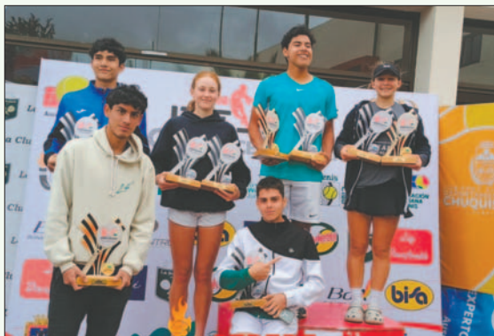
Los ganadores de la competencia internacional de tenis

Bejarano tuvo un camino complicado para ganar el torneo de singles masculino.