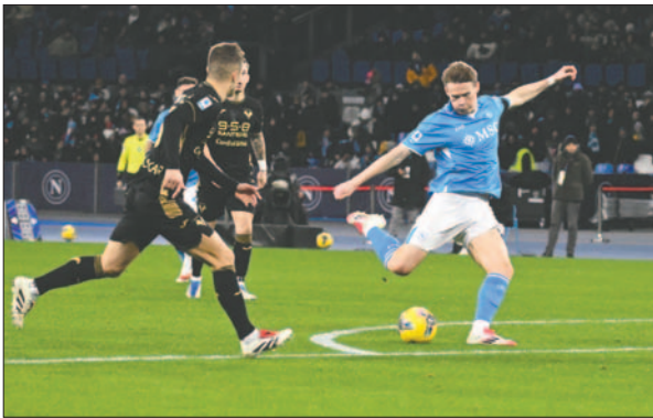
Napoles con este triunfo se mantiene líder en el fútbol italiano

Resultados fecha 20: Lazio 1-1 Como, Empoli 1-3 Lecce, Udinese 0-0 Atalanta, Torino 1-1 Juventus, Milan 1-1 Cagliari, Genoa 1-0 Parma, Venezia 0-1 Inter, Bologna 2-2 Roma, Napoli 2-0 Hellas Verona; lunes: Monza-Fiorentina.