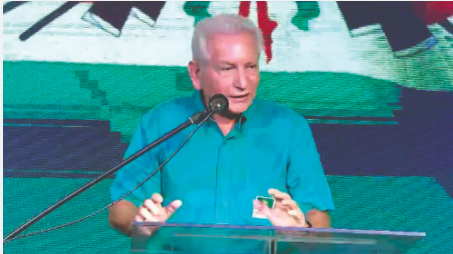
Líder de los demócratas, Rubén Costas