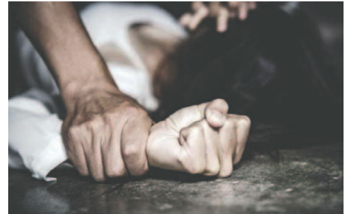
Las autoridades investigan el caso para determinar el grado de la agresión y las responsabilidades /REFERENCIAL

Las autoridades solicitaron la declaración psicológica de la víctima, que se llevará a cabo la mañana de este lunes. Asimismo, esperan el informe completo del médico forense