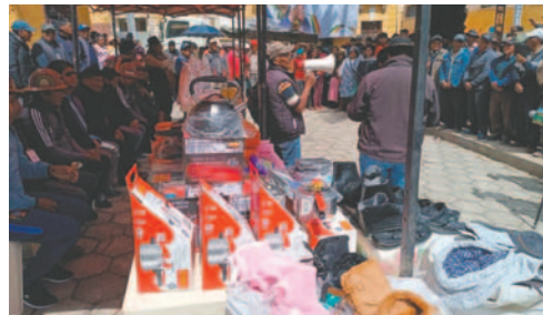
El Gobierno hizo llegar varios insumos a los afectados

Se ha dispuesto el envío inmediato de alimentos y otros suministros esenciales para las personas afectadas. Además, el Gobierno ha desplegado maquinaria pesada y personal militar para co-