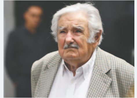
El expresidente uruguayo José Mujica