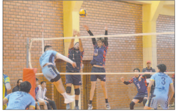
Los mates de CAN fueron letales para el triunfo ante Economía

En el tercer set, CAN nuevamente bregó desde atrás. Fue un periodo batallado punto por punto, los jugadores arriesgaron el físico para salvar cada pelota. El fuerte de Economía fue la defensa y el contrataque, mientras que CAN basó su juego en