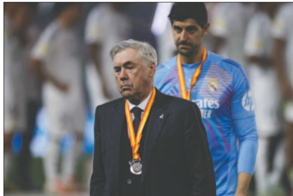
Carlo Ancelotti entrenador del Real Madrid

A pesar de la derrota, pidió olvidar rápido la derrota, “mirar hacia adelante y recuperar la buena dinámica” con la que el equipo llegó a Arabia Saudí.