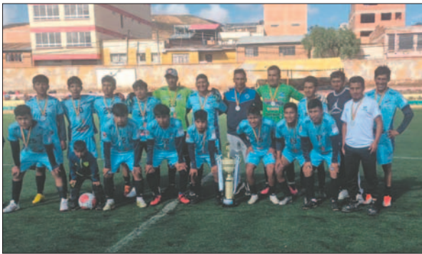
Felap consigue el segundo lugar y sube a Primera de Ascenso

En el tercer encuentro de la fecha, el representativo de Atlético Hermandad goleó por la cuenta