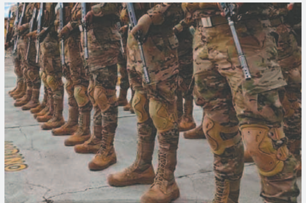
Ya son tres los detenidos por este caso

El hecho ocurrió el 20 de diciembre, durante el consumo de bebidas alcohólicas en una k'oa (ofrenda a la Pachamama) al interior del Batallón Riosinho 6to. de ingeniería en Pando.