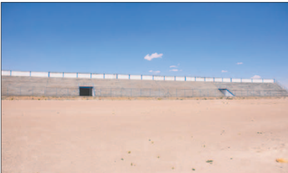
Nuevas trabas impiden el colocado del pasto sintético en el estadio de la AFO

Por otro lado, en días pasados, personal federativo llegó a Oruro para hacer entrega de material en favor de la comisión seleccionadora de la asociación, con el fin de que los implementos puedan servir en las prácticas de las preselecciones y selecciones del departamento, y así seguir fomentando la práctica de esta disciplina.