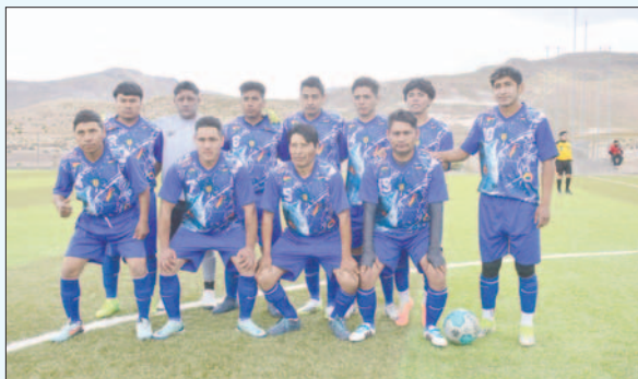
Cándor Andino un plantel con mucho talento quedó segundo en fútbol

Gran Tunari en fútbol, Cóndor Andino en fútbol y Racing de Oro en básquetbol son los campeones