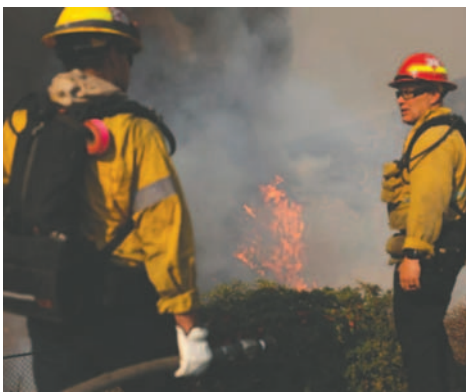
Los bomberos despliegan estructuras de defensa contra el incendio forestal Palisades en Los Ángeles / EFE

LA PATRIA / EFE El número de fallecidos por los incendios desatados a comienzo de esta semana en el área de Los Ángeles, en el Sur de California (EE.UU.), ha aumentado a 16, según la oficina del médico forense local. De acuerdo con la última actualización hecha por el médico forense del Condado de Los Ángeles, 11 de esos fallecidos se deben al incendio Eaton, ubicado al Noreste y cerca de las ciudades de Pasadena y Altadena. Los otros cinco corresponden al incendio Palisades, el más grande y extenso hasta el momento, contenido solo en un 11%. La nueva cifra de fallecidos se da en momentos en que las cuadrillas de cientos de bomberos siguen bregando contra los incendios que se originaron el pasado martes, en anticipación a la previsión de un aumento de los vientos a partir de esta noche que obstaculizarán su labor. Los fuegos han arrasado al menos 15.000 hectáreas, destruido unas 12.000 estructuras, incluidos automóviles, de acuerdo con el alguacil del condado de Los Ángeles, Robert Luna. Según informó hoy Luna, los socorristas incluso han empleado perros expertos en hallar cadáveres. El incendio Palisades, el más devastador de los focos activos, se desplaza hoy hacia el Este, amenazando barrios residenciales como Brentwood, donde tienen