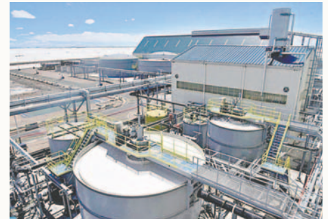
La Planta de Carbonato de Litio, en el salar de Uyuni