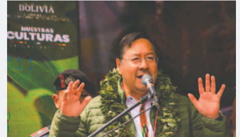
El Presidente de Bolivia, Luis Arce, durante el Día Nacional del Acullico