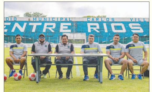
El equipo de San Antonio ahora está al mando de Julio César Baldivieso