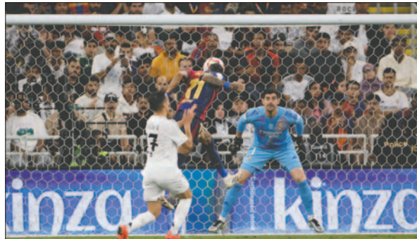
El delantero del Barcelona Raphinha anota el tercer gol de su equipo