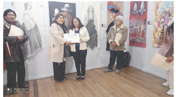
Certificaciones fueron entregadas durante la inauguración