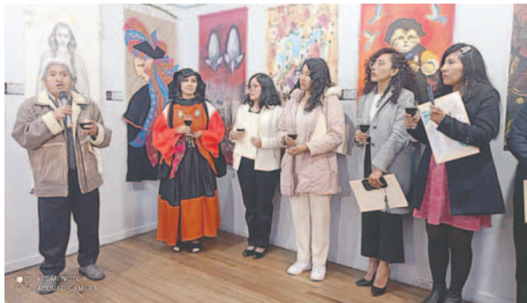
Las cinco artistas peruanas del Colectivo de Mujeres Artistas “Killari”