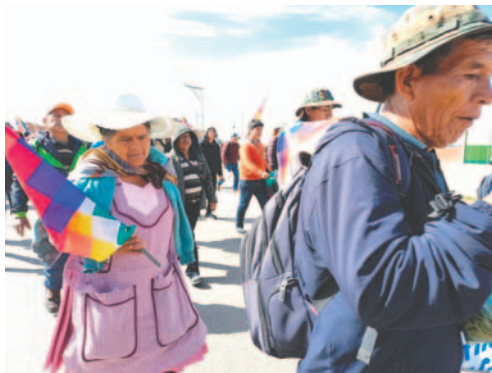
Una de las integrantes de la marcha que se dirige a La Paz

García cuestionó la decisión de Morales al afirmar: “Como ha visto que 30 bolivianos eran