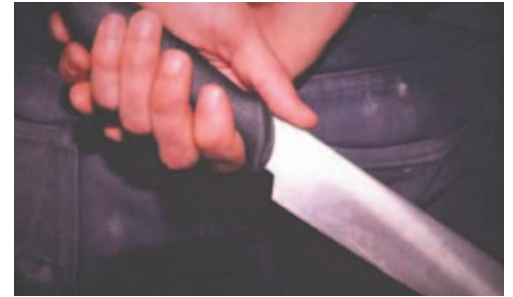
Varios pasajeros resultaron heridos en el acto delictivo /REFERENCIAL

La situación actual ha llevado a un aumento en las demandas ciudadanas para mejorar las condiciones de seguridad en el transporte público.