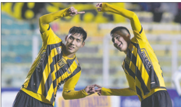
El cuadro "atigrado" tiene la esperanza de armar un buen equipo para este 2025

“El club The Strongest da la bienvenida al profesor Antonio Carlos Zago, director técnico de amplia trayectoria en clubes y con pasado en la Selección Boliviana ¡Vamos por todo profe!”, así el club "atigrado" anunciaba la contratación del profesional brasileño.