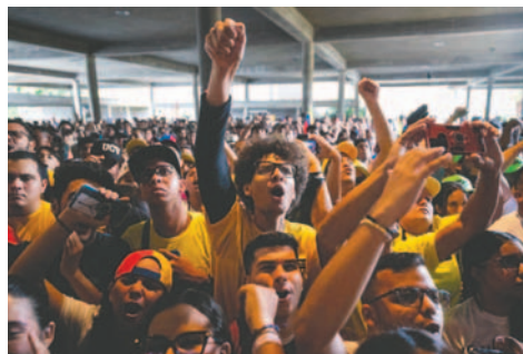
Estudiantes de la Universidad Central de Venezuela (UCV) que gritan en un acto de campaña del entonces candidato a la presidencia de Venezuela, Edmundo González

En este contexto pos-electoral, según el comunicado suscrito por el rector