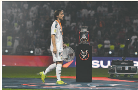
Luka Modric a pesar de jugar bien no pudo evitar la derrota de su equipo

“Es una derrota complicada. El Barcelona ha sido mejor y hay que felicitarle. Para nosotros es bueno el hecho que viene otro partido muy pronto en la Copa y no tenemos mucho tiempo para lamentarnos. Hay que corregir lo que hemos hecho mal, olvidarlo y seguir porque queda mucha temporada”, comentó.