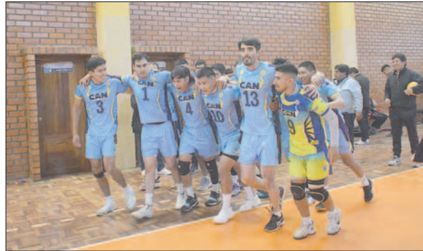
Durante la vuelta olímpica de los integrantes de CAN