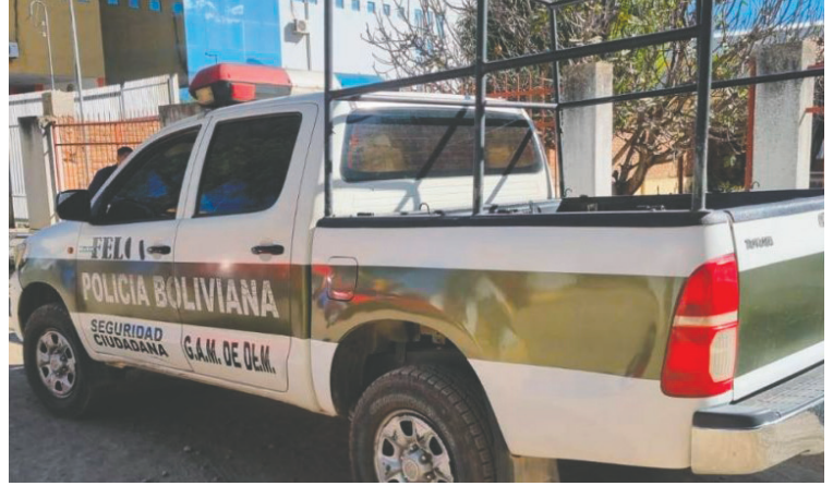
La Policía busca a los autores

Ambos jóvenes quedaron tendidos en el suelo y malheridos. Al ver que ninguno de los apuñalados reaccionaba, los tres sujetos huyeron, dejando