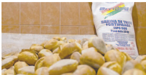
El Gobierno garantiza evitar el incremento de precio del pan

Siles informó que se entregarán inicialmente 1.000 toneladas de harina subvencionada, descartando argumentos técnicos para incrementar el precio del pan a 0.70 centavos o 1