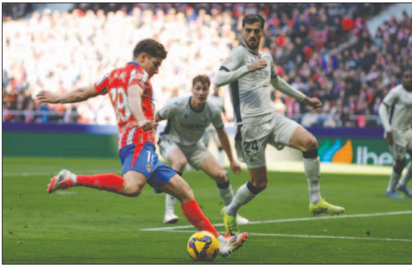
El cuadro de Diego Simeone a pesar de no jugar bien, ganó el partido

El decimotercer gol de ‘La Araña’ en esta temporada entre todas las competiciones. Y el impulso para la octava victoria seguida en el campeonato del Atlético, que soportó los ataques posteriores de Osasuna, sin ninguna parada de Oblak, con el aliento de la grada que reclamaba Simeone y con una ocasión final de los locales al poste, para confirmarse