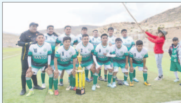
Gran Tunari se consagró campeón en fútbol

El certamen de baloncesto se realizó en la cancha tradicional de la población. Los encuentros finales tuvieron que retrasarse debido a una lluvia torrencial; sin embargo,