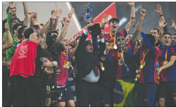
Festejo de los jugadores de Barcelona por el título obtenido

El cajón de las sorpresas volvió a abrirse nada más regresar los jugadores del vestuario. Una volea de Rodrygo a una escuadra pareció resucitar al Real Madrid, pero fue un espejismo. A la jugada siguiente, Raphinha retrató de nuevo a un ofuscado Tchouameni para poner