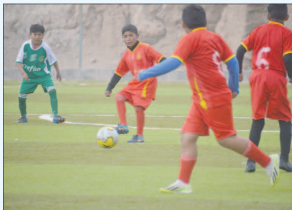
Los niños también demostraron su talento en este certamen

El campeonato deportivo interayllus se desarrolló del 6 al 10 de enero en el municipio de Carangas, donde los clubes Cándor Andino, Gran Tunari, Racing de Oro y Alianza compitieron en fútbol, fútbol y baloncesto, premiando a los mejores equipos de cada disciplina.