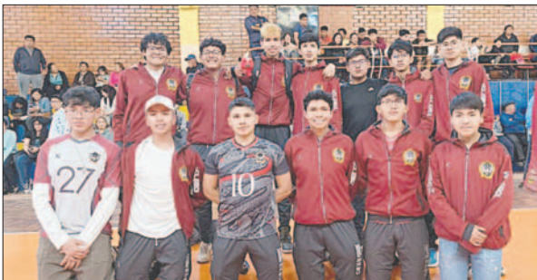
10 de Febrero logró títulos en las categorías Menores y Juvenil

Tercera de Ascenso varones: 1. Juan Pablo, 2. CAN Oruro y 3. San Luis; Segunda de Ascenso varones: 1. Bolívar, 2. Oruro Thevenet y 3. Sporting Vóley.