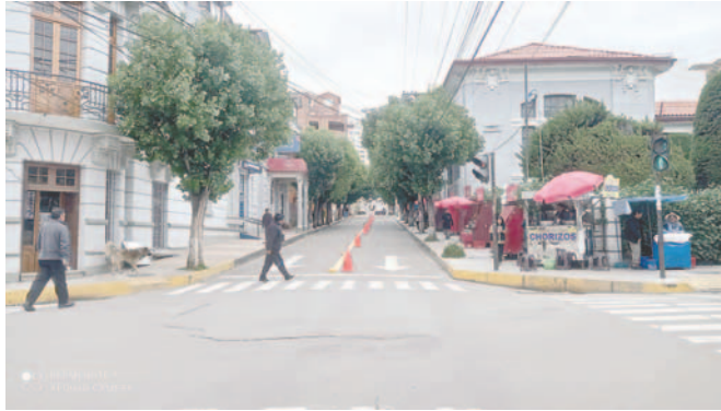
La calle La Plata será de doble vía para evitar el congestionamiento vehicular

Ramírez indicó que la medida permitirá una circulación más fluida, especialmente hacia la zona Sur, evitando que los vehículos que