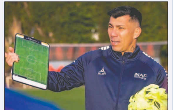
El chileno Gary Medel polémico en la cancha, ahora tiene título de entrenador