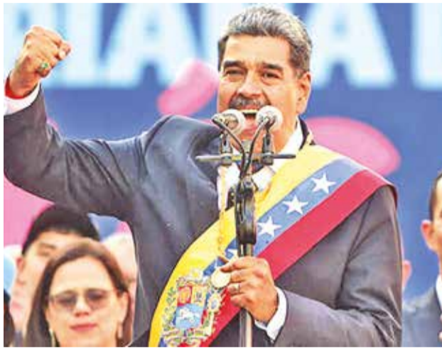
Nicolás Maduro, presidente venezolano.

“Que nadie se engañe que ese escenario pudiera presentarse otra vez. Ochenta años