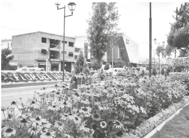
El Prado de Quillacollo se convirtió en una zona roja.