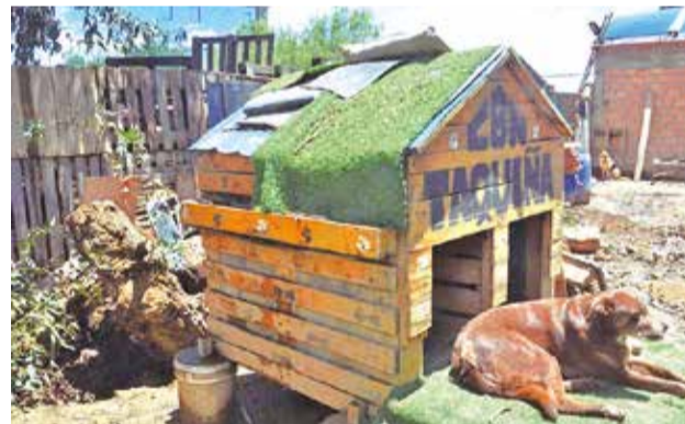
El árbol que cayó ayer en el refugio Gamaliel.

El hecho que se suscitó el pasado 1 de enero durante las primeras horas de la madrugada terminó con el desenlace fatal y el deceso de dos personas en la parte este del Boulevard de la Recoleta.