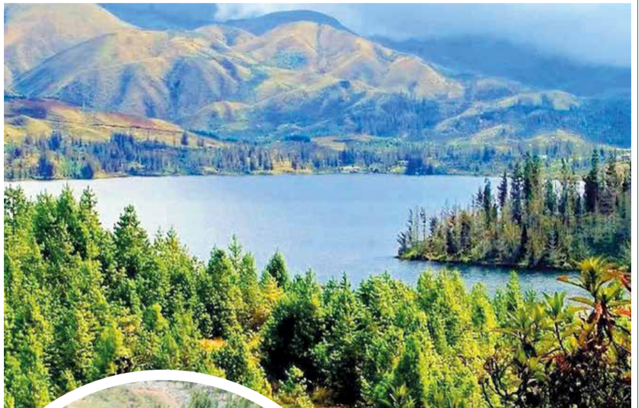
La laguna de Corani.