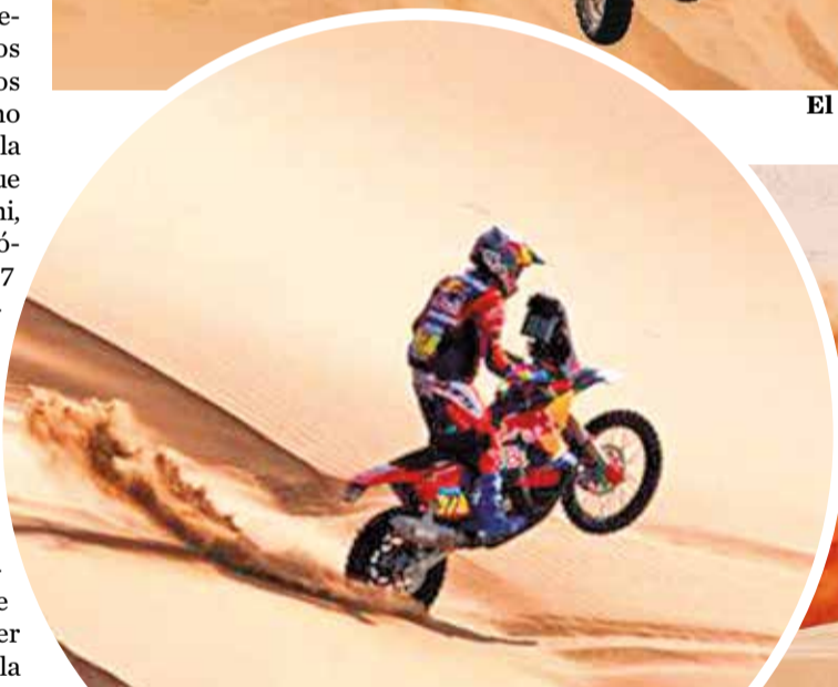
El piloto argentino Luciano Benavides (KTM) en acción. RALLY DAKAR