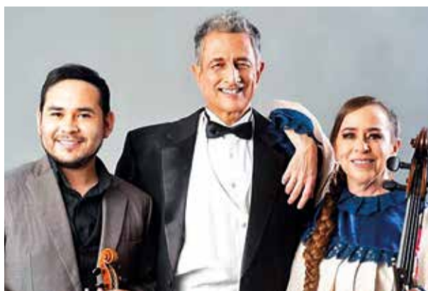
Expectativa. Los personajes que animarán la semana cultural cochabambina.