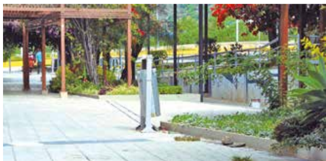
El lugar donde dos jóvenes fallecieron el 1 de enero. H.A.

Investigación. La Felcc señala que los arrestados mantienen contacto con los presuntos autores del hecho.