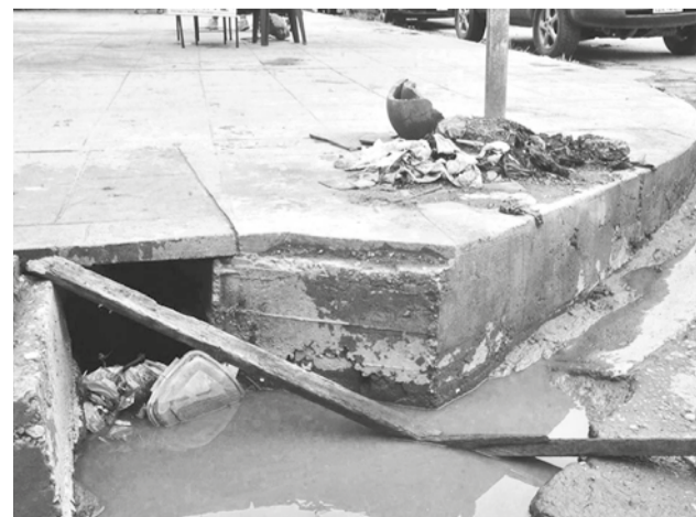
La basura depositada en una calle de la Zona Central.