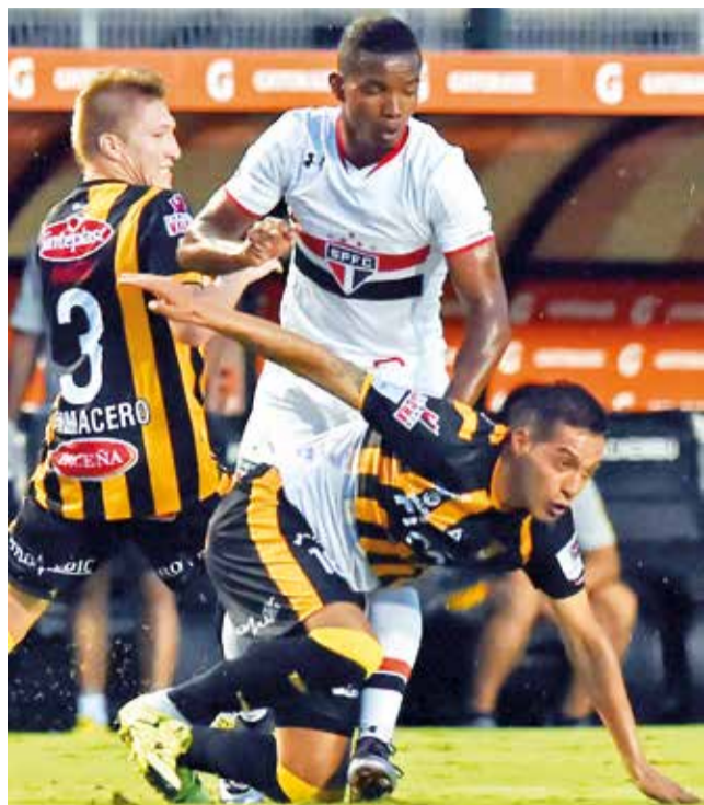
Partido Sao Paulo 0-1 The Strongest, en el mítico estadio Morumbí, por Copa Libertadores 2016.