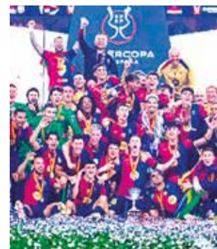
Festejo de los integrantes de Barcelona.

El Barcelona conquistó su decimoquinta Supercopa de España y es el equipo más laureado de la competición con dos galardones más que el Real Madrid, al que goleó por segunda vez esta temporada (2-5), remontando un tanto temprano de Kylian Mbappé con un doblete de Raphinha y goles de Lamine Yamal, Robert Lewandowski de penalti y Balde.