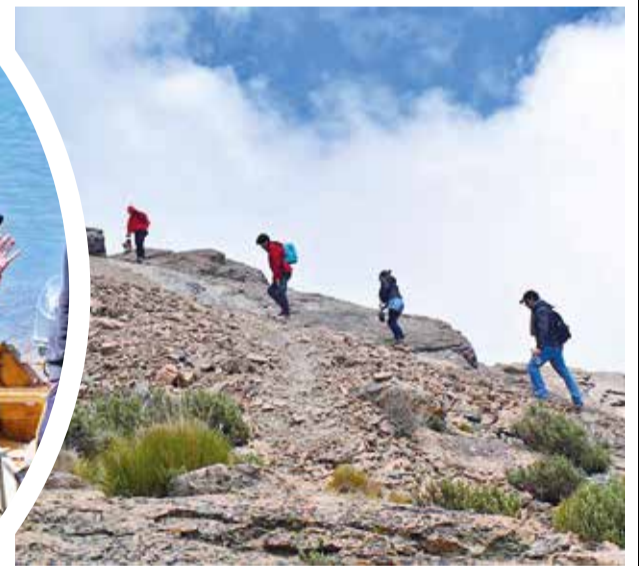
Turistas suben al Pico Tunari.

rístico cultural y de naturaleza inmenso. La región reúne a 12 municipios: Aiquile, Mizque, Omereque, Pasorapa, Pocona, Tiraque, Totora, Pojo, Vacas, Villa Eufronio Viscarra (Vila Vila), Araní y Alalay. Las atracciones de este destino cochabambino se centran en la actividad productiva, cultural, su historia colonial y arqueológica, arete rupestre, paisajes, bosques, museos y gastronomía.