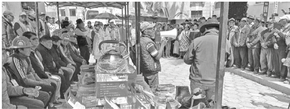
Entrega de ayuda a los afectados por la riada en Quime. ERBOL