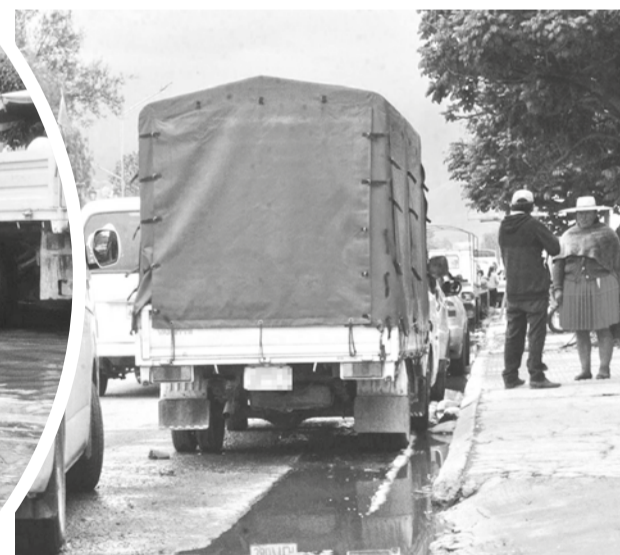
Una vía repleta de vehículos estacionados.