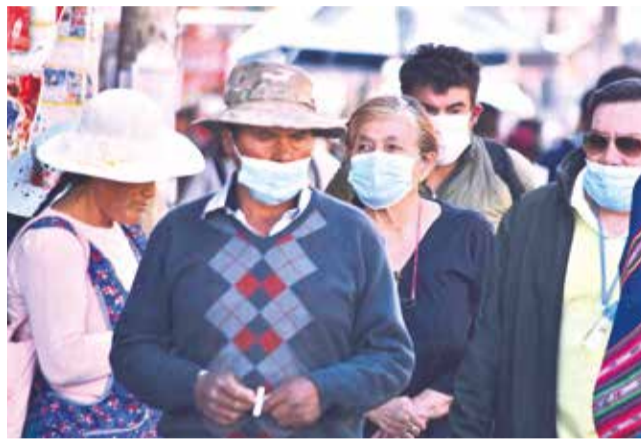
El uso de barbijo es una medida primaria contra la Covid-19.