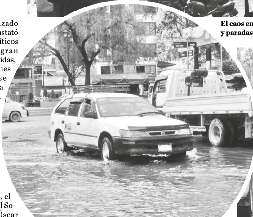
La acumulación de aguas servidas por falta de desagüe.