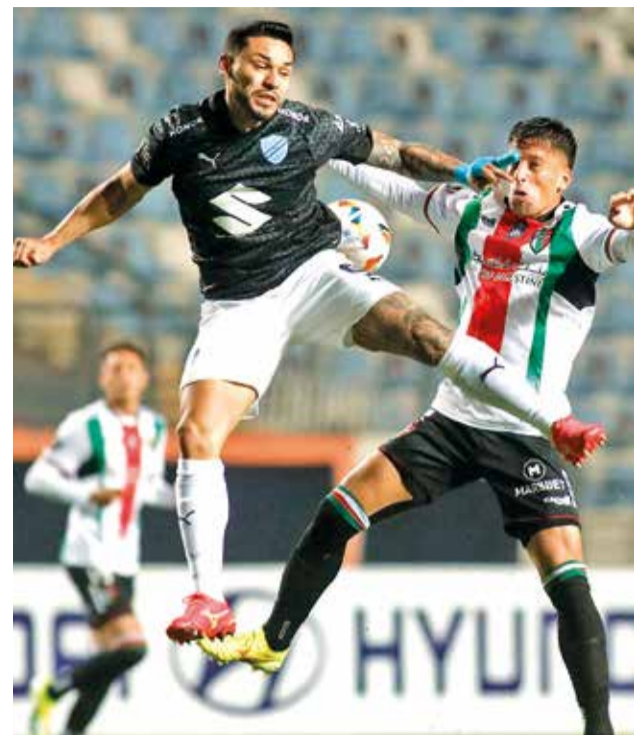
Última victoria boliviana en el exterior: Palestino 0-4 Bolívar, en la Copa Libertadores 2024.