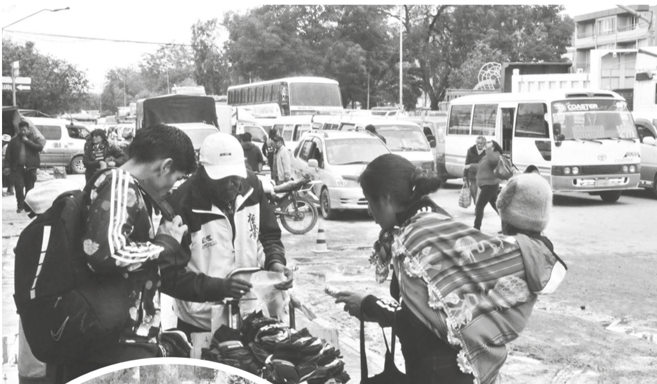
El caos en el centro de Quillacollo invadido por comerciantes y paradas del transporte público.

Este medio buscó sin éxito comunicarse con el alcalde Héctor Cartagena y otras autoridades municipales.