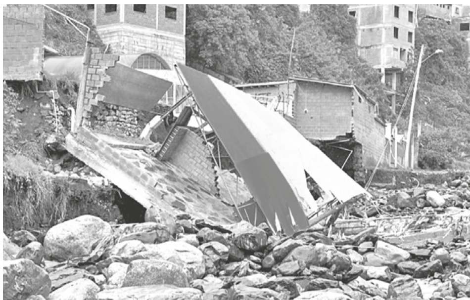
Casas destruidas por el desborde de ríos en Quime.

En el municipio de Cliza, en el valle alto, una riada afectó al menos 50 hectáreas de maíz y hortalizas en la comunidad de Khochi Lázaro. El reporte indica que el hecho ocurrió la madrugada de ayer. Los comunarios pidieron ayuda y señalaron que la situación podría empeorar porque las lluvias continúan.