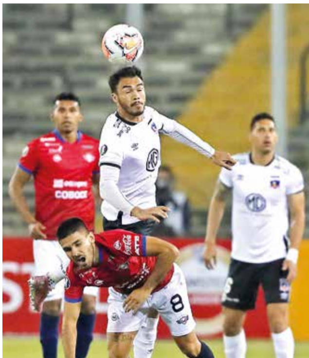
Colo Colo vs. Wilstermann, triunfo del Rojo en suelo chileno en 2020, por Copa Libertadores.