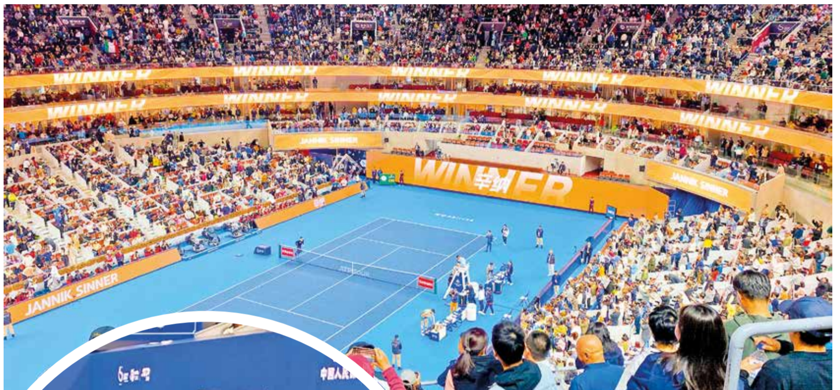
El escenario Diamond Court del Centro Nacional de Tenis de Beijing con capacidad para 15 mil espectadores.

Vibrante. El país anfitrión aprovechó la "Semana Dorada" y potenció la acogida de este torneo internacional con récords de participación de residentes y turistas.