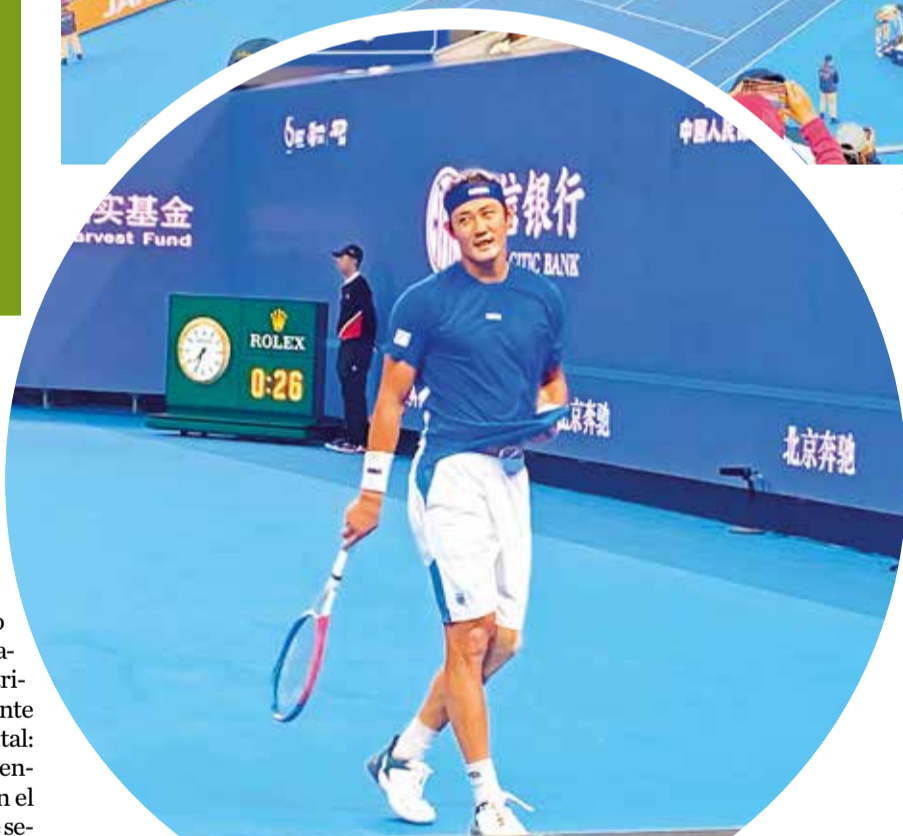
El tenista Zhang Zhizhen, considerado el mejor tenista chino de la historia, durante los play offs.

pregnada está la gente con el segundo juego de pelota más grande del mundo. Algunos, afanados con encontrar a las estrellas mundiales de este deporte y correr la suerte de poder recibir un autógrafo, o simplemente disfrutar los espacios externos de entretenimiento que ofrecían las marcas patrocinadoras mientras esperaban el partido de su preferencia.