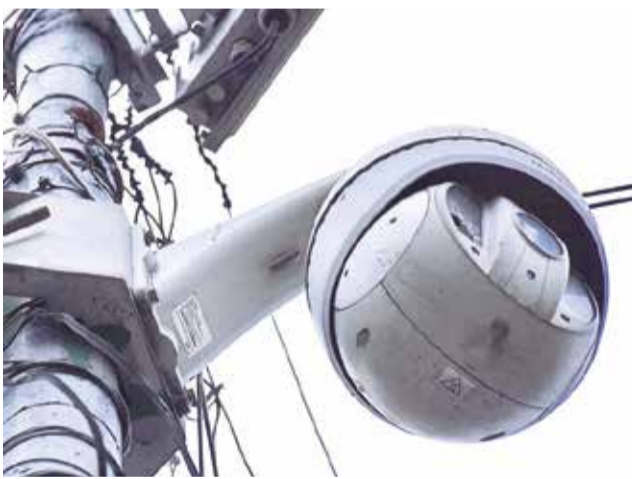
Una de las cámaras de seguridad en pleno centro.

al margen de las personas en situación de calle y drogodependientes, existen pandillas que cometen delitos por las noches.