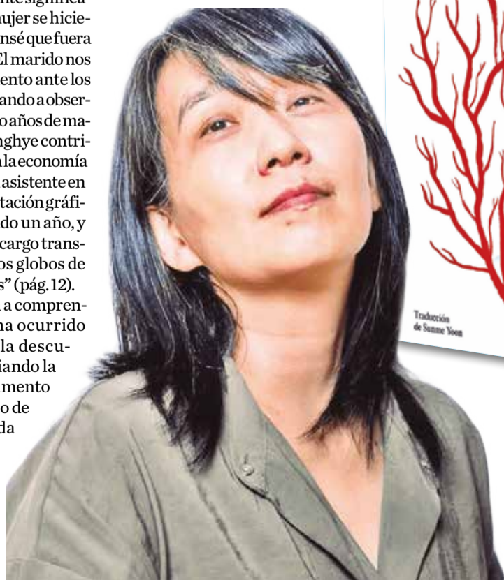
La escritora Han Kang y su libro La vegetariana.

Nunca había leído un libro de un autor coreano y la experiencia ha sido muy gratificante. En mi caso, el Premio Nobel ha servido para descubrirme a una potente escritora. Ya estoy leyendo otra de sus novelas, La clase de griego .