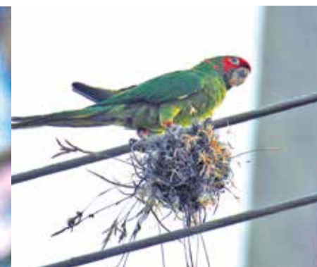
El lorito cara roja ( Psittacara mitratus ).