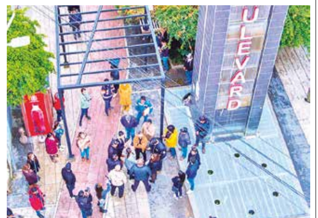
El pasaje Boulevard, una de las zonas turísticas. GAMC