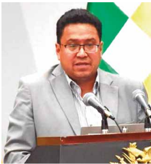
El ministro de Justicia, César Siles.

También está un nuevo Código de Comercio y la ley de acción de repetición, además de mecanismos alternativos de solución de controversias.