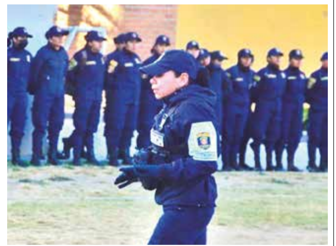
El despliegue de guardias municipales. DANIEL JAMES

El director de Turismo y el de Seguridad Ciudadana señalaron que se tiene guardias en el pasaje Boulevard, en la Coronilla, en el Cristo de la Concordia y otros sitios.