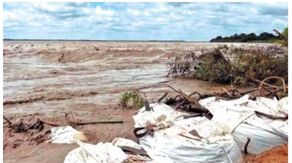
El caudal del río Grande en Santa Cruz se ha incrementado de manera significativa. VISIÓN 360