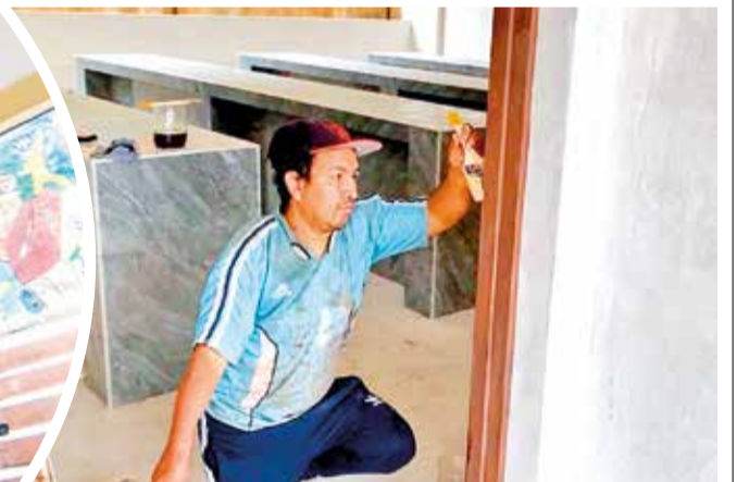
El personal de trabajo ejecuta obras de mejoramiento en el colegio Taquiña A-B. D. JAMES