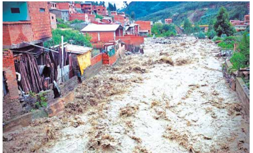
La crecida de uno de los dos ríos que pasa por Quime, provincia Inquisivi de La Paz.

“En el caso del maíz es donde hay un mayor desfase y donde creemos que posiblemente no se vaya a recuperar el área que estaba proyectada. En principio estimábamos sembrar unas 100.000 hectáreas de maíz; sin embargo creemos que las mismas van a estar por unas 70.000-80.000 hectáreas en lo que es el departamento de Santa Cruz”, dijo.