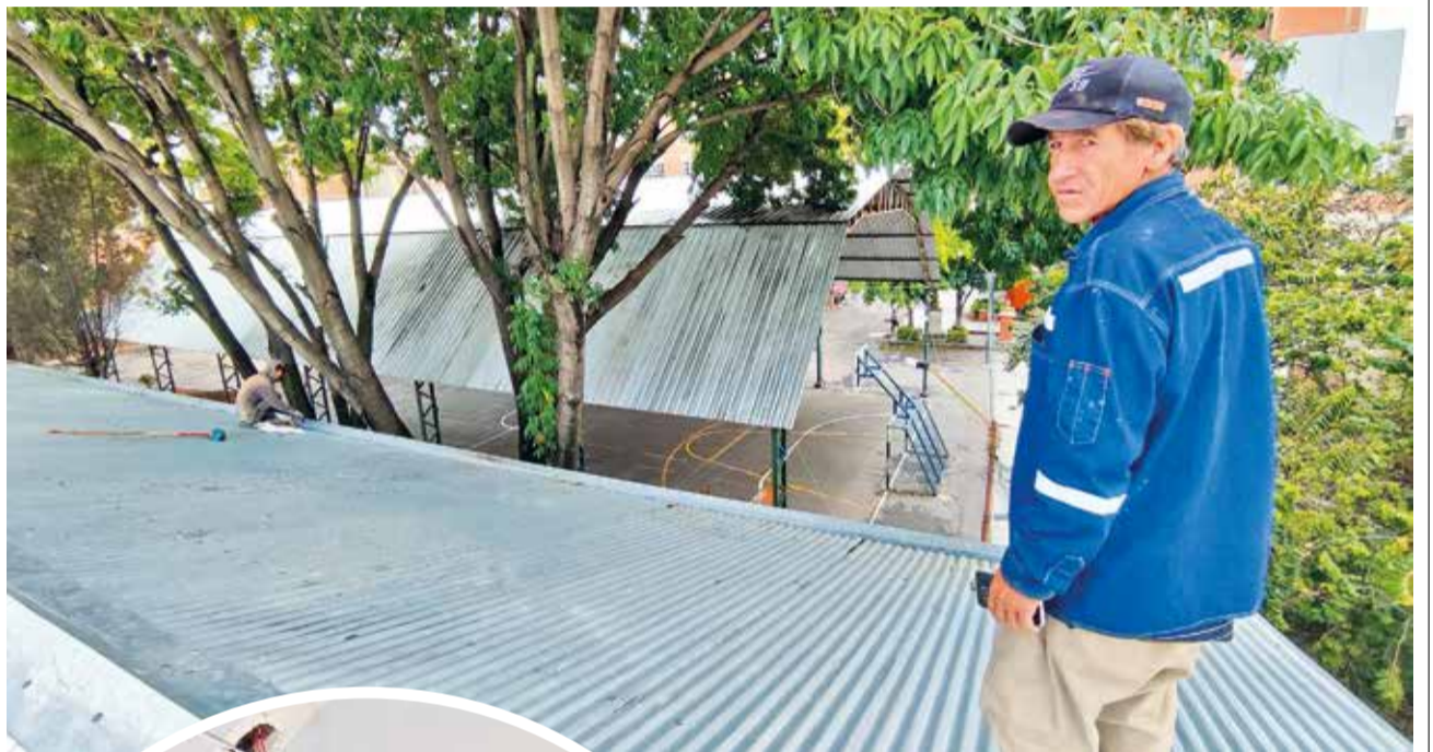
La limpieza de cubiertas en la unidad educativa Carrillo, en el centro de la ciudad. DANIEL JAMES

Asimismo, sobre las observaciones realizadas acerca de los daños en algunas unidades educativas, Quiroga dijo: “Es de no creer el daño que se causa”. Sin embargo, la representante de los padres de familia afirmó que se pide a la Alcaldía que adquiera materiales e insumos para uso de alto tráfico.