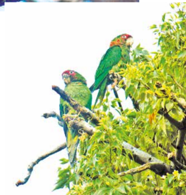
El loro cara roja, uno de los más comunes en la ciudad.

Como el resto de las aves, los loros no están libres de peligros. “Las mayores amenazas en la ciudad serían un poco gente que las atrapa para mascotas o les lanza piedras con flechas. Además, las podas de árboles como las palmeras que deben realizarse fuera de la época reproduc-