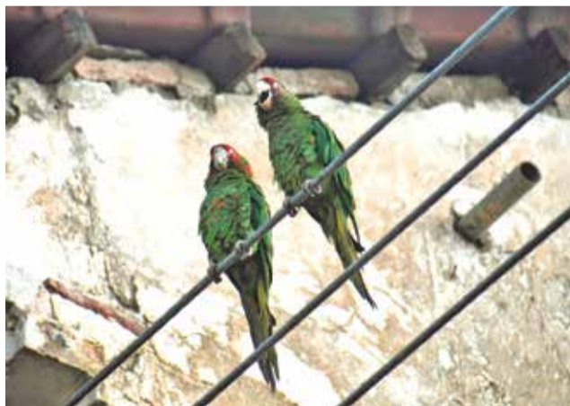
Una pareja de loritos cara roja sobre unos cables.

“Muy rara vez es posible ver, especialmente al sur de la zona sur, un loro endémico de Bolivia, la cotorrita boliviana ( Myiopsitta luchsii ), que es típica de los valles bolivianos. También y más antiguamente, porque ya no hay registros muy recientes, se veía al lorito cabeza azul ( Thectocercus acuticaudatus ), por ejemplo, en serranías de la laguna Alalay”, explicó el biólogo y ornitólogo José Balderrama.