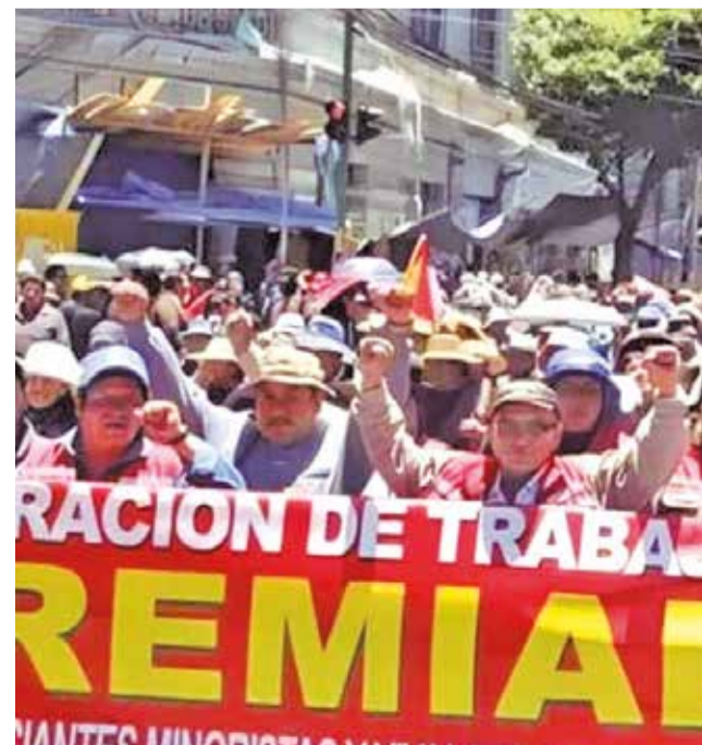
Marcha de gremiales contra el PGE (Archivo). ANF

Economía. El Gobierno señaló que la disposición no entrará en vigencia mientras no se apruebe el reglamento.