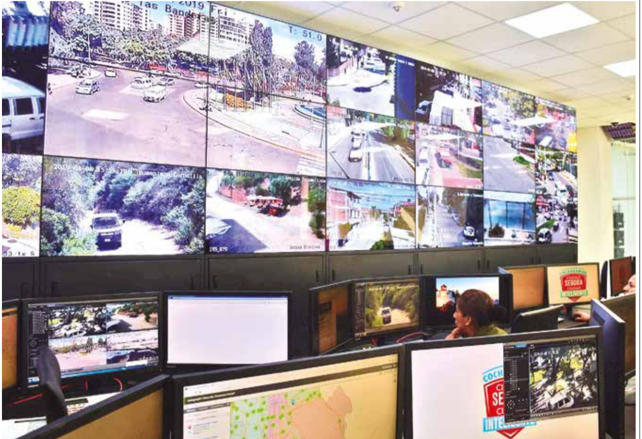
El centro de monitoreo que está a cargo de la Policía Boliviana en Cochabamba.