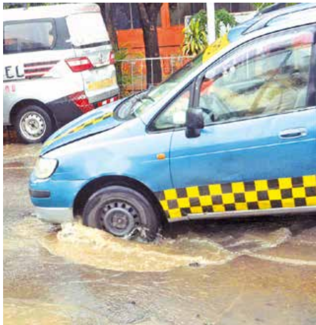
El daño en la capa asfáltica en la 6 de Agosto.

Prudencio dijo que tras la recompactación del terreno esperan que "vayan asentando" porque el proceso tarda