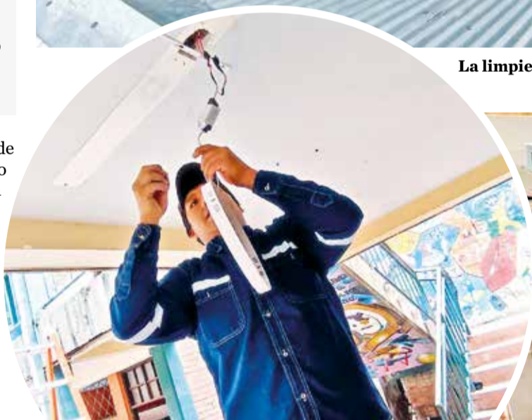
La intervención en el sistema eléctrico del colegio René Barrientos. C. LÓPEZ