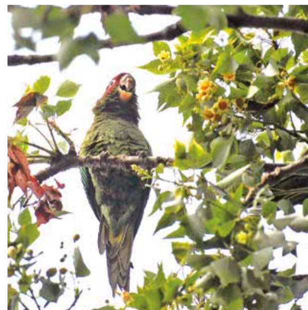
El loro se alimenta de frutas y semillas.