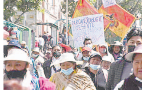
Una anterior movilización de los gremiales

su preocupación por el aumento en el costo de la canasta familiar y anunciaron que los transportistas planean aumentar los pasajes a nivel nacional. “Lo que decimos al señor Luis Arce