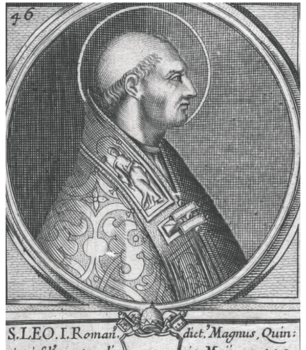
El papa León I fue quien confirmó en el siglo V la fecha del 25 de diciembre como la fecha de conmemoración del nacimiento de Cristo