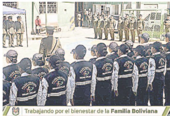
130 menores participaron de las brigadas de seguridad ciudadana por la EPI 1 /COMANDO DE POLICÍA

personas. “Fueron instruidos en cómo cuidarnos, cómo cuidar nuestras casas, cómo proteger a nuestros amigos en la escuela, qué no deben hacer y qué deben hacer cuando un extraño les ha-