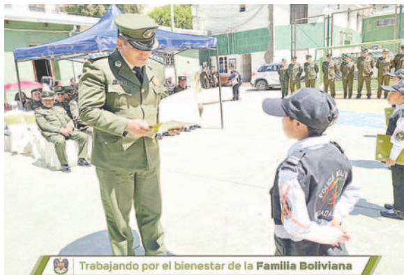
El subcomandante Ortega entrega un certificado y felicita a un brigadista

mero de 130, fueron instruidos en la Estación Policial Integral (EPI) 1. Durante su formación, asimilaron temas sobre educación vial, primeros auxilios y prevención de trata y tráfico de