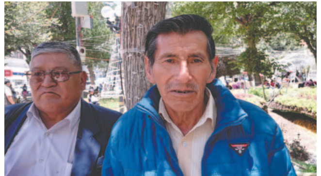
Vecinos de Salinas de Garci Mendoza presentaron un recurso de acción popular