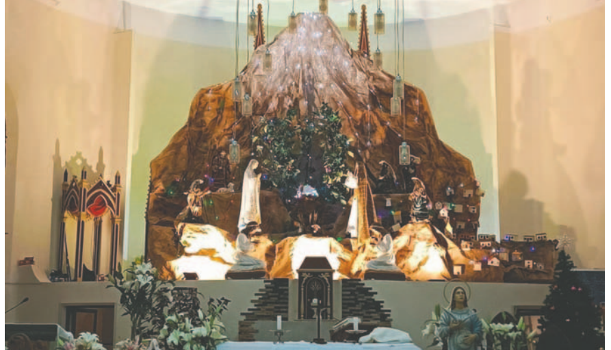
Parroquia Señor de la Paciencia "La Rotonda" celebra el nacimiento de Jesús

La fecha exacta del nacimiento de Jesús no se menciona en la Biblia; sin embargo, se considera que se eligió el 25 de diciembre para coincidir con festividades paganas romanas. Desde un enfoque religioso, esta celebración es una oportunidad para reflexionar sobre el mensaje central que trajo Jesucristo: amor y redención.