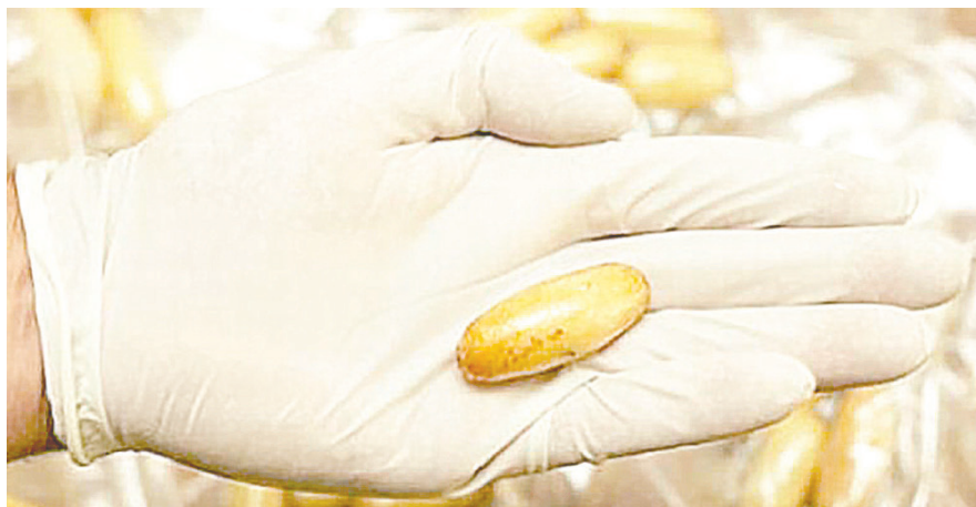
La ahora occisa había ingerido al menos 107 cápsulas de droga /REFERENCIAL