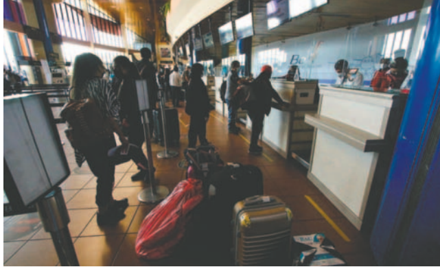
Según la ATT, estos problemas se deben al mantenimiento de aeronaves y otros factores

“No nos han dicho nada, simplemente han cambiado el horario”, denunció un pasajero afectado. Otros relataron casos de vuelos que debían salir a las 20:00 horas, pero fueron