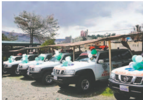
Vehículos entregados a diferentes regionales