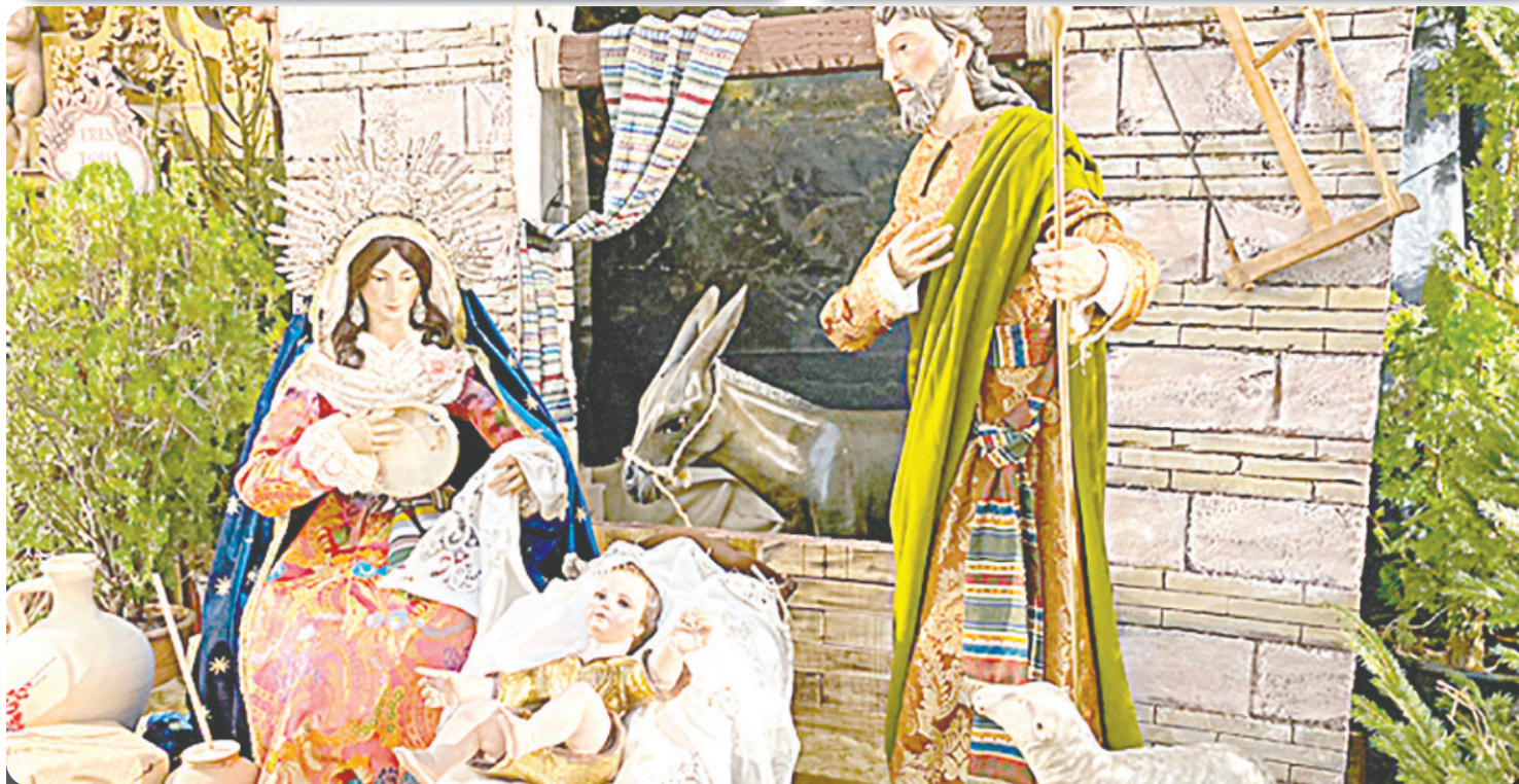
La Navidad: De festividad pagana a una celebración global Pág. 2