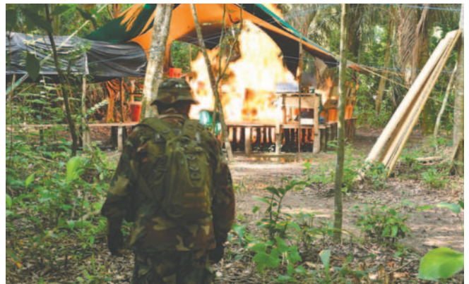
La afectación al patrimonio del narcotráfico ascendió a 250 mil dólares

"Una vez más, con estos resultados, demostramos que somos la mejor gestión en materia de lucha contra el narcotráfico, superando estadísticamente a todas las gestiones de otros gobiernos", remarcó el viceministro.