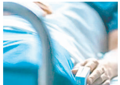
Los síntomas de la adolescente no fueron evidentes y por eso se retrasó la consulta /REFERENCIAL