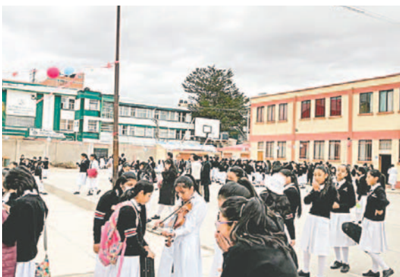
Actividades educativas se realizaron con normalidad, según la DDEO

escolar, Cardozo informó que se presentaron varias denuncias respecto a la retención de libretas escolares y cobros irregulares, situación que fue atendida por el equipo de la DDEO que se desplazó a las unidades educativas para dar una solución.