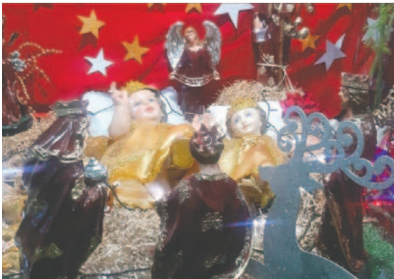
Los católicos arman los pesebres en sus hogares para celebrar la llegada del niño Dios /LA PATRIA