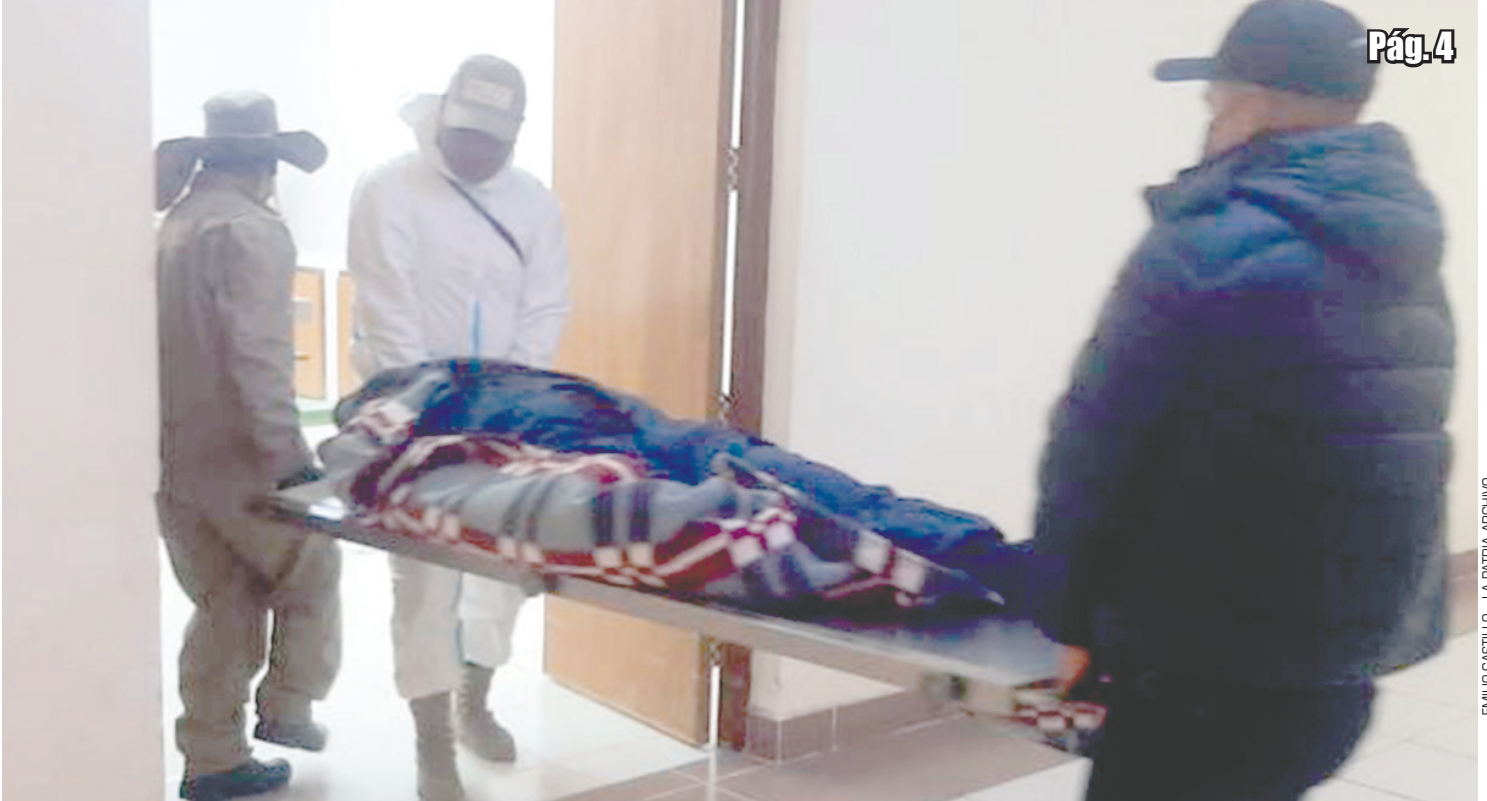
EMILIO CASTILLO - LA PATRIA ARCHIVO