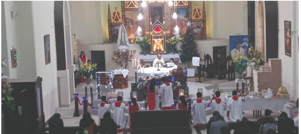
Misa del Gallo celebrada el 24 de diciembre conmemora el nacimiento de Jesús