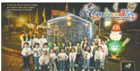
Captura del video "Los Animalitos Visitan a Jesús"