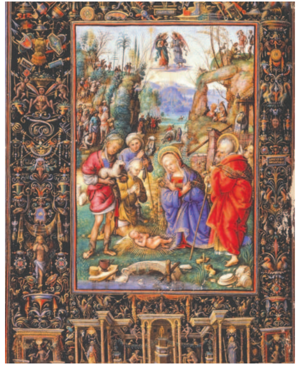
Representación de la Navidad, el nacimiento de Cristo, en una obra del año 1500

Aunque conserva su significado cristiano para muchos, la Navidad también es una festividad marcada por la reunión familiar, el intercambio de regalos y el espíritu de solidaridad.