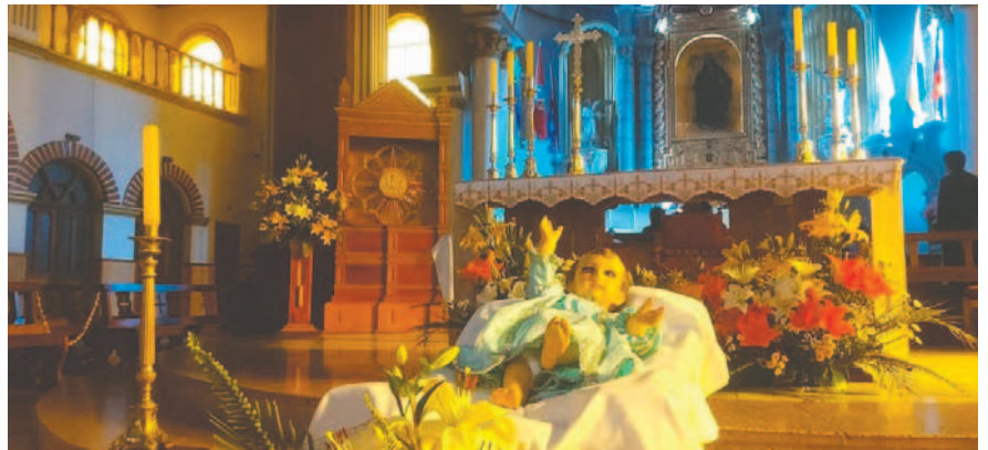
Navidad es una oportunidad para reflexionar sobre la encarnación de Dios en Jesucristo