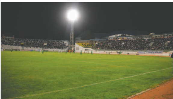
El costo para renovar el aspecto de iluminación es elevado

A la par de esto, en el caso de las casamatas ya se tiene un convenio firmado con la empresa de seguros Univida, pero aún no hay fecha de inicio de obras. Lo propio pasa con el gramado que, si bien tenía el apoyo de la Federación Boliviana de Fútbol a través del proyecto "siempre verde", no se ven muchos avances en una mejora integral del césped natural, trabajos que se deben cumplir con la celeridad necesaria para no tener dificultades a futuro.