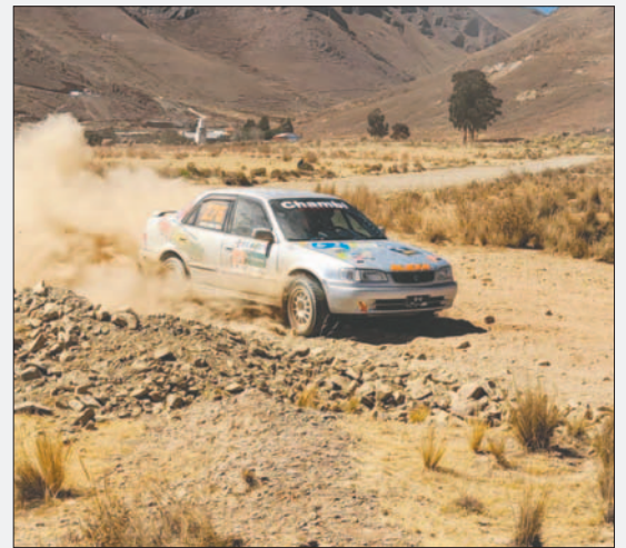
Todo listo para la undécima fecha del automovilismo orureño en Poopó

La prueba como tal tendrá lugar el domingo veintinueve en el trazado previsto en los alrededores de la población minera de Poopó, primero con las vueltas de clasificación y luego con la realización de las mangas finales.