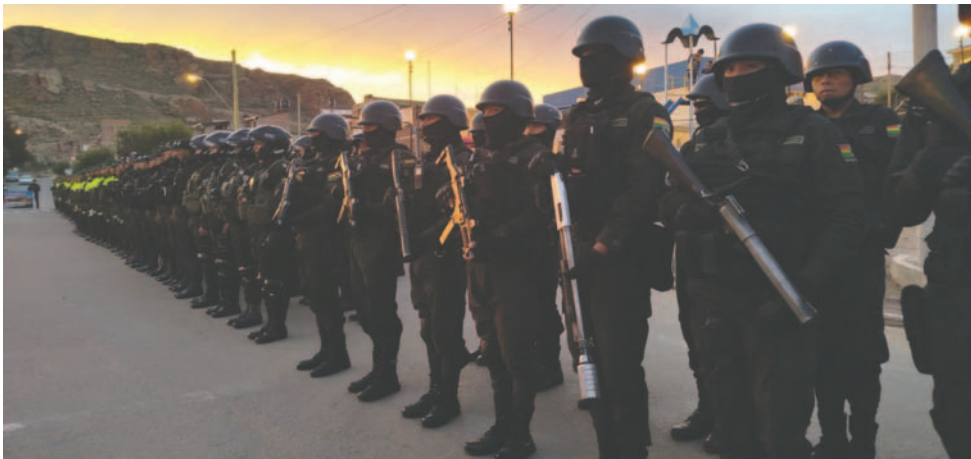
Diariamente despliegan 300 efectivos policiales en la ciudad de Oruro