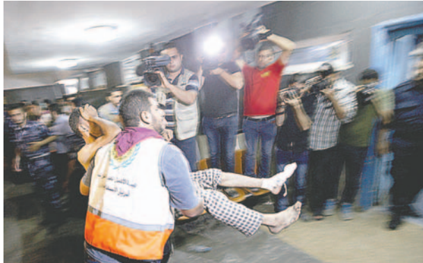
El traslado de un joven herido al hospital Al-Shifa, norte de la Franja de Gaza