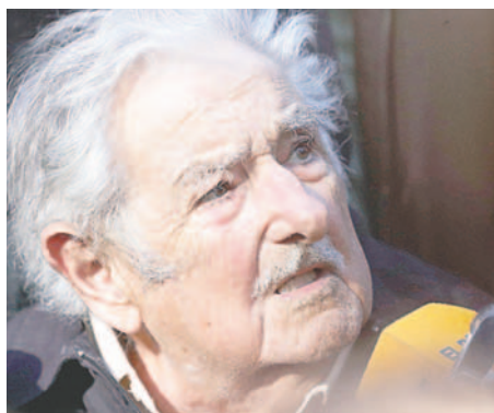
Fotografía de archivo del expresidente uruguayo José Mujica

En septiembre, Mujica fue intervenido quirúrgicamente y le hicieron una gastrostomía para alimen-