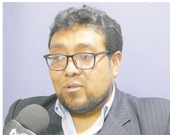
El fiscal Casanova explicó que se inició con las investigaciones tras la muerte de la mujer

“De manera urgente se ha procedido a una intervención quirúrgica de esta ciudadana, habiendo extraído del interior de su organismo 107 cápsulas que al interior de las mismas contenían sustancia controlada que, en este caso, tras prueba de campo se ha determinado que se trataba de pasta base de cocaína”, detalló el fiscal anti-narcóticos Alexander Casanova.