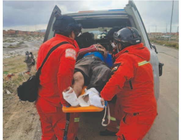
Tránsito lanza la campaña "Soy un conductor, un peatón y un pasajero consciente, prudente e inteligente"

Zegada remarcó que las personas pueden realizar la denuncia en cualquier terminal u operadora para evitar accidentes. Asimismo, la Dirección Nacional de Tránsito seguirá desarrollando la campaña para dar una educación vial adecuada.