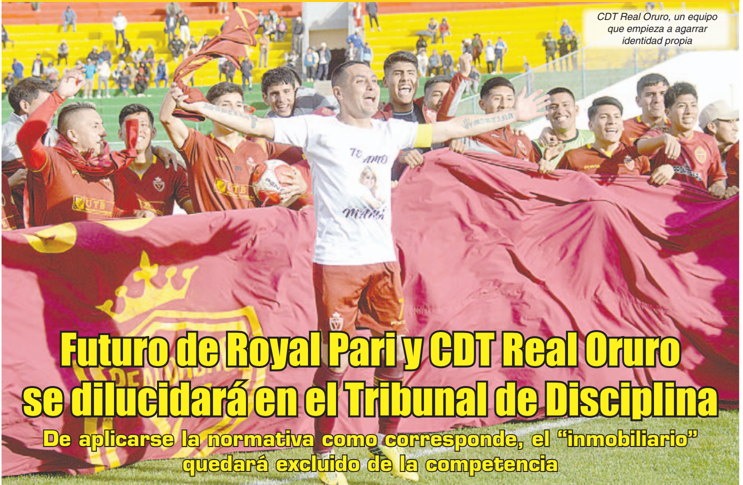
CDT Real Oruro, un equipo que empieza a agarrar identidad propia