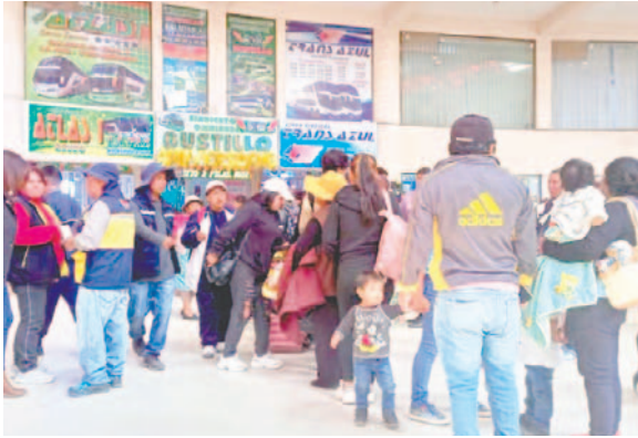
Piden a los pasajeros denunciar cobros excesivos /ESTACIÓN DE AUTOBUSES ORURO

Con base en el tarifario publicado por la ATT, el precio de los pasajes desde Oruro hasta La Paz en un bus normal debe ser de Bs 28; en semicama de Bs 38 y en bus cama de Bs 61.