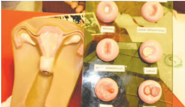
Resaltan la importancia de la prevención del cáncer cervicouterino

Se realizó el seguimiento de las pacientes y se hizo la referencia a los hospitales correspondientes para un mejor tratamiento. A la fecha se han obtenido buenos resultados,