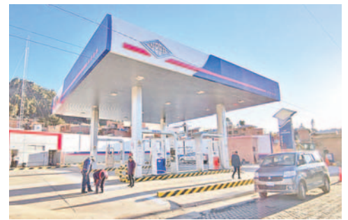
Se incrementó el despacho de combustible desde YPFB /ABI

“No existe desabastecimiento y se están garantizando los despachos desde planta”, aseveró Colque.