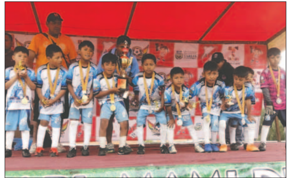
Sajama FC primero en la categoría 2017 / COPA LINDA TARIJA