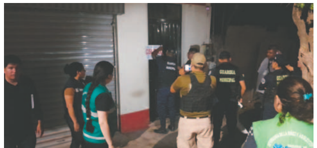
Operativo conjunto logró identificar extranjeros indocumentados y rebeldes de la justicia

Mientras tanto, en Yacuiba se identificó a una mujer argentina y un hombre uruguayo que no contaban con los respectivos permisos de ingreso al país. Esta situación fue puesta en conocimiento de Migraciones en esa ciudad.