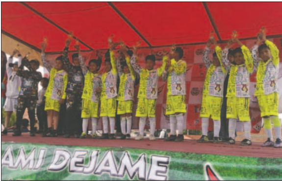
Quiroziños celebra el título de la categoría 2014 / COPA LINDA TARIJA

En un torneo de estas características, es importante resaltar la entereza de los jugadores, quienes pueden asimilar la exigencia de los partidos contra otros equipos y jugadores que, en algunos casos, tienen una mayor envergadura física. Sin duda, es un torneo que fomenta la práctica del talento deportivo y donde las escuelas de fútbol de Oruro, demuestran que hay talento en el balompié regional, así como la necesidad de más trabajo y apoyo para lograr mejores resultados.