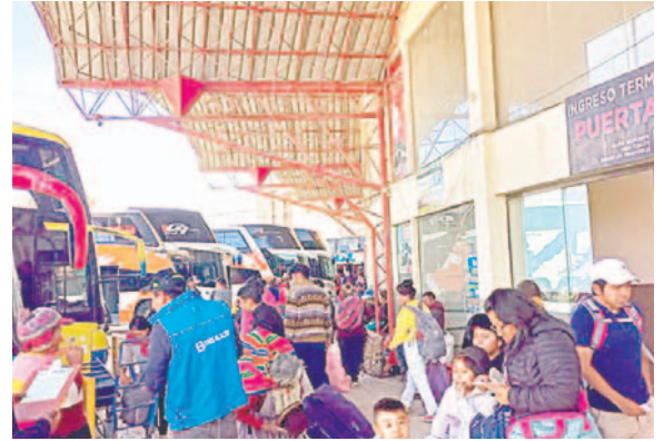
La ATT habilitó números para realizar las denuncias /ESTACIÓN DE AUTOBUSES ORURO

Las autoridades de la ATT establecieron números de contacto para las denuncias por cobros excesivos a la línea gratuita del 800-10-6000; al Chat Bot 71599208 (WhatsApp) o la