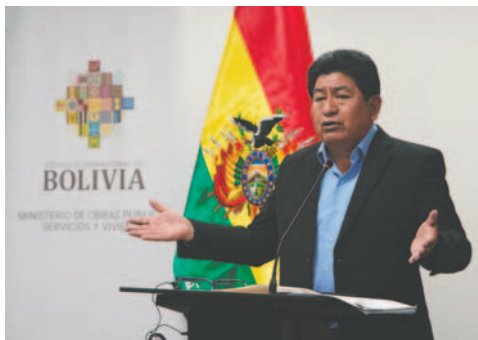
El ministro de Obras Públicas, Edgar Montaña

“están tratando de denigrar, de mentir, de que BoA estaría en una situación mala económicamente, lo cual es totalmente falso”. En la actualidad, hay