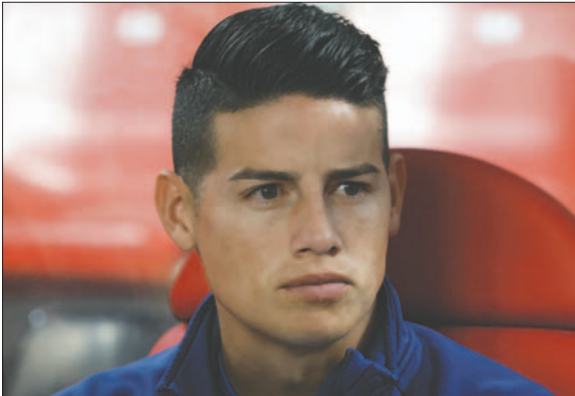
James Rodríguez en la actualidad juega en el Rayo Vallecano

Los rumores sobre su salida no han tardado en aparecer y sin sitio en el equipo su futuro podría estar lejos de Vallecas. Su condición de estrella le está haciendo ser el centro de todos los debates mediáticos en el Rayo, algo que no gusta en el club.