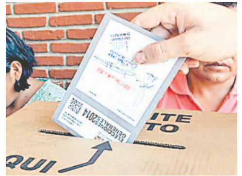
Los tribunales departamentales hicieron llegar las actas de cómputo /REFERENCIAL

El último amparo constitucional 0770/2024 determinó la suspensión parcial de las elecciones judiciales para el Tribunal Supremo de Justicia (TSJ) y Tribunal Constitucional Plurinacional (TCP) en cinco departamentos del país. Es decir, las elecciones para el TSJ se realizaron