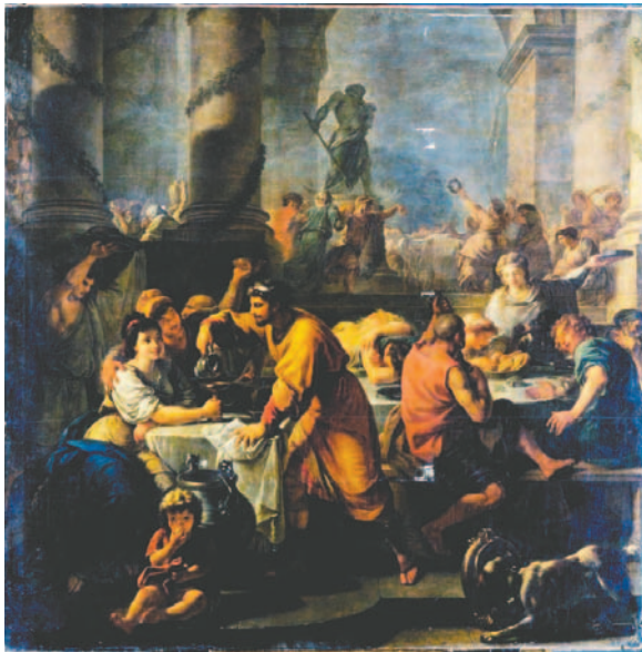
Las Saturnales, eran unas fiestas paganas que celebraban los romanos en honor a Saturno

En la antigua Roma, por ejemplo, la Saturnalia era una de las festividades más populares. Esta celebración en honor al dios Saturno, protector de la agricultura, tenía lugar entre el 17 y el 23 de diciembre. Durante esos días, las jerarquías sociales se desvanecían temporalmente: los esclavos cenaban con sus amos, se intercambiaban regalos y la alegría reinaba en las calles.