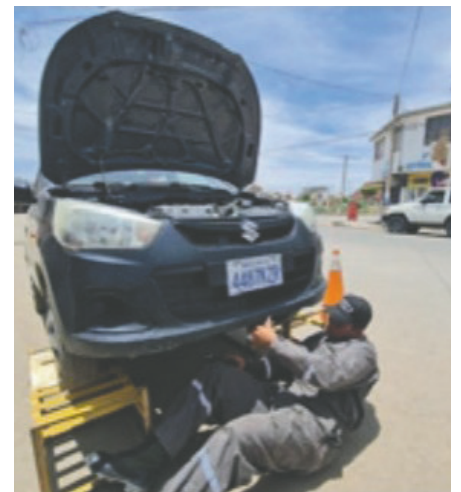
La Policía dispuso ocho puntos autorizados en la ciudad de Oruro

La Policía dispuso puntos de ITV en la avenida Circunvalación y Héroes del Chaco, cerca del Casco del Minero; en el Estadio Jesús Bermúdez; en la avenida Villarroel y Brasil; en la Santa Bárbara y Circunvalación; en el Distribuidor Tagarete; en el mercado Abaroa, Roberto Young y en la Estación Policial Integral 5 en la zona Sur.