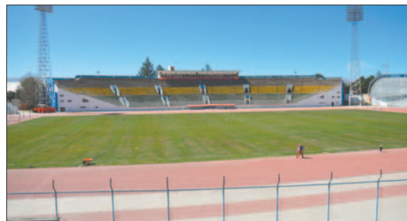
El estadio "Bermúdez" no está avalado para partidos internacionales