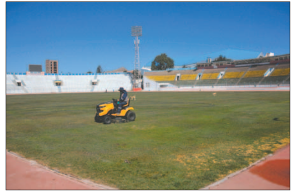
El gramado del estadio "Bermúdez" necesita un nuevo tratamiento

Los aprietos hubiesen sido mayores para el Sedede si GV San José lograba una mejor colocación. De momento, las autoridades departamentales tienen un respiro porque el encuentro de Copa Sudamericana se jugará en Cochabamba en marzo entre Aurora y GV San José. Será un encuentro único, por lo que los