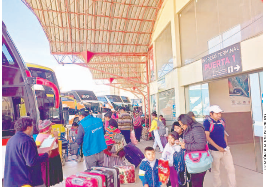
ESTACION DE AUTOBUSES ORURO