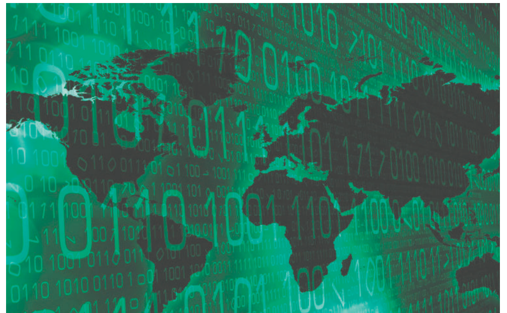
La cooperación entre países es vital para combatir amenazas como guerras cibernéticas