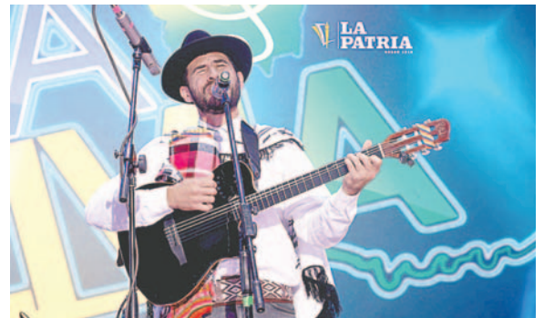
El nuevo galardón será implementado desde el siguiente año

“Se ha tenido la participación de grupos internacionales, pero no sólo nos hemos quedado con Sudamérica, también Europa, con Francia y España. En 2025, el año del Bicentenario, queremos implementar los Faros, en relación a que por primera vez se ha flameado la tricolor nacional en Oruro, se tendrán el Faro de Oro, plata, bronce y diamante”, complementó.