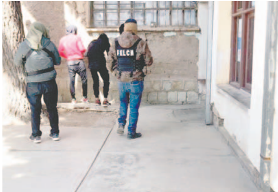
La Felcn aprehendió a tres involucrados en la narcoencomienda y la Fiscalía investiga a otros implicados

controlada se reportó el 16 de diciembre de 2024 en un punto de control en Oruro, tras la revisión de un ómnibus de servicio público, lo que derivó en un trabajo de inteligencia de la Felcn y la Fiscalía.