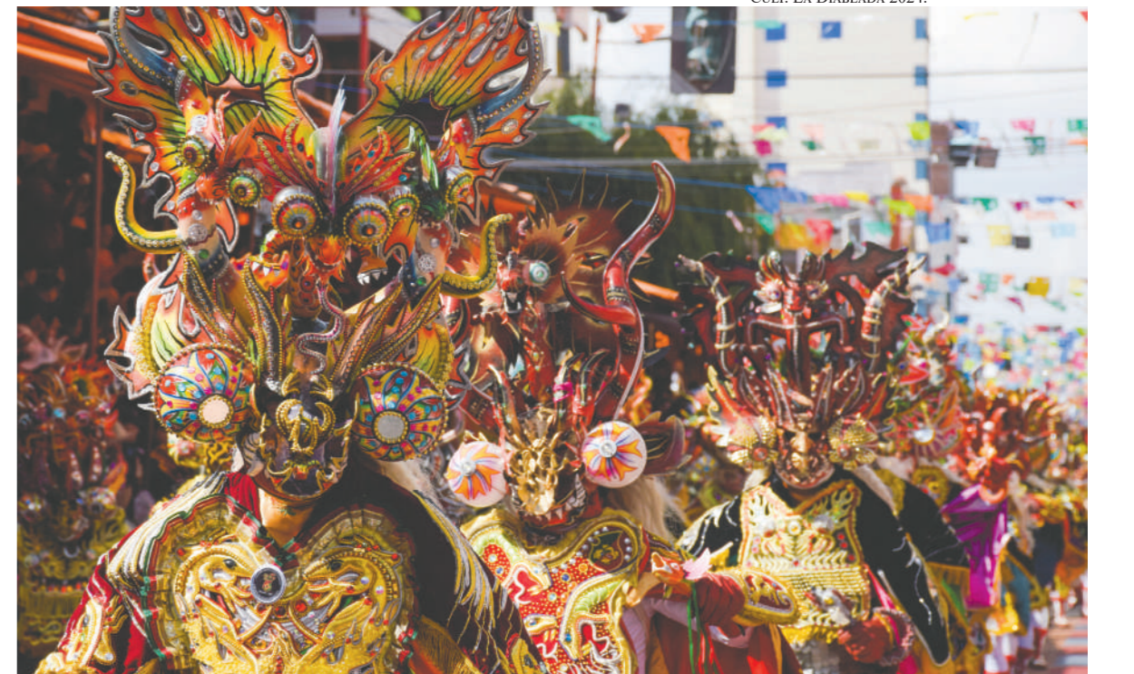
La diablada, una de las muestras artísticas más importantes del Carnaval de Oruro / LAURA PONCE