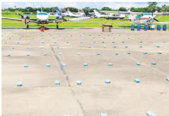
Incautaron avionetas y sustancias controladas en Beni

La nave tenía matrícula falsa de Brasil, lo que motivó a realizar un rastillaje en una zona de la provincia Iténez, donde se