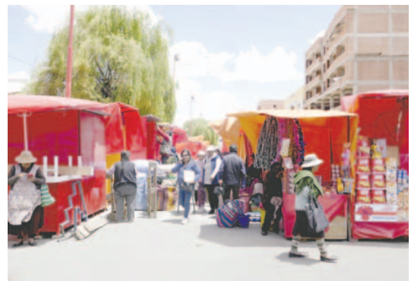
Controles en ferias se intensificarán /LA PATRIA

Según él, dichas tareas no tienen la finalidad de perjudicar a las personas que pretendan realizar la actividad económica, sino que buscan generar un ordenamiento en el Casco Viejo