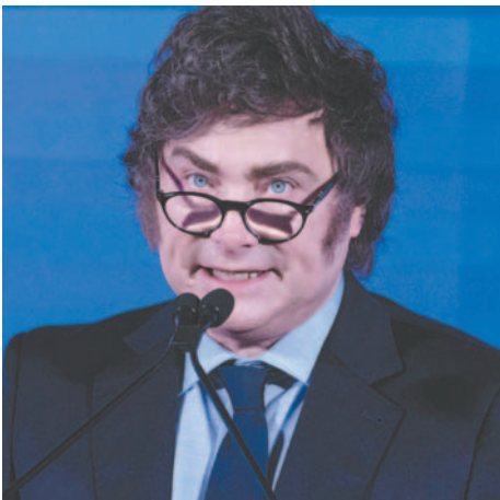
El presidente de Argentina, Javier Milei

Con este plan, Argentina busca posicionarse como un "líder global en el uso pacífico de la energía atómica", mientras avanza hacia su objetivo de convertirse en un hub de IA. El Gobierno está interesado en desarrollar la IA en territorio argentino aprovechando las grandes extensiones de tierra y el clima frío de la Patagonia. Sin embargo, Milei reconoció que "el potencial de desarrollo en IA es tan inmenso que con la energía convencional no va a alcanzar para abastecer esta nueva demanda".