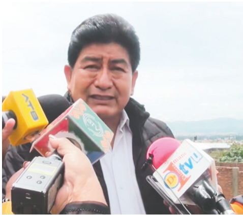
Ministro de Obras Públicas, Edgar Montaño

El ministro también cuestionó que Morales se niegue a presentarse ante las autoridades judiciales: “Es decir, lo están cuidando, lo están resguardando a Evo Morales, cuando