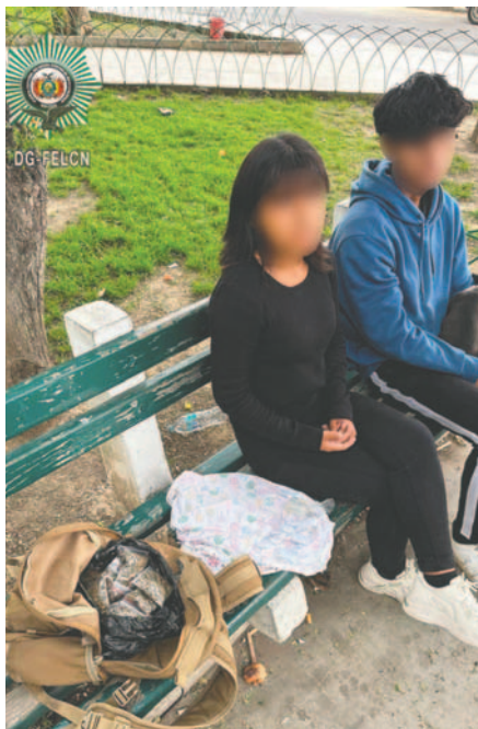
Dos personas fueron aprehendidas por microtráfico de marihuana y cocaína

Este tipo de operativos busca no solo desarticular redes de tráfico, sino también prevenir el consumo entre los jóvenes.