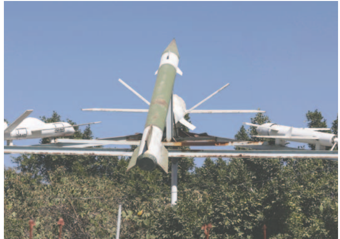
Misiles y drones de fabricación hutí se exhiben en una plaza en Sana'a, Yemen, 21 de diciembre de 2024

hutíes, no han reaccionado ante esta información. Los rebeldes, por su parte, atacan desde el año pasado a barcos vinculados con Israel en el mar Rojo y Arábigo en "solidaridad" con el pueblo de la Franja de Gaza por la guerra del Estado judío en el enclave palestino, y lanzan proyectiles contra territorio israelí, aunque la mayoría de ellos son interceptados. Sin embargo, ayer los hutíes, respaldados por Irán, reivindicaron el lanzamiento de un misil balístico contra Tel Aviv, que impactó en la ciudad israelí y dejó más de una decena de heridos.