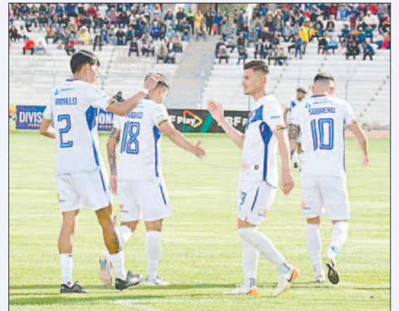
GV San José tiene dos meses y dos semanas para alistarse para jugar contra Aurora

Finalmente, Blooming, se quedó con el último boleto a un torneo internacional, en este caso, jugará en Copa Libertadores desde la primera fase, su rival será, El Nacional de Ecuador, de vencer esa llave, se medirá con otro equipo ecuatoriano, en este caso, Barcelona.