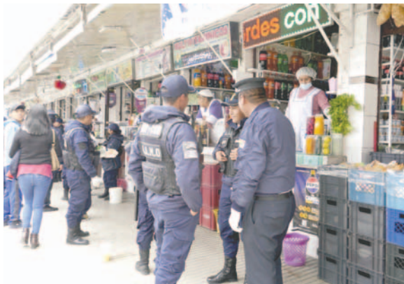
Guardia Municipal se desplegará por distintos puntos de la ciudad

“Se ha detectado en varios sectores de la ciudad y se hizo el decomiso de los mismos para que no puedan realizar este trabajo; se hará un constante trabajo en el centro de la ciudad con funcionarios”, indicó Aruquipa.