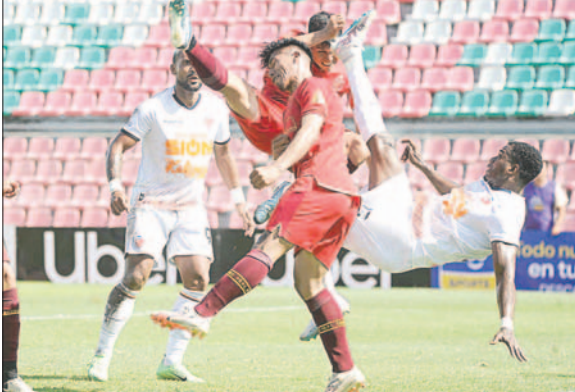
El partido se jugó con mucho rose

categoría frente a Club Deportivo Totorá Real Oruro, la tarde del sábado en el estadio "Ramón Aguilera Costas", ampliando la superioridad