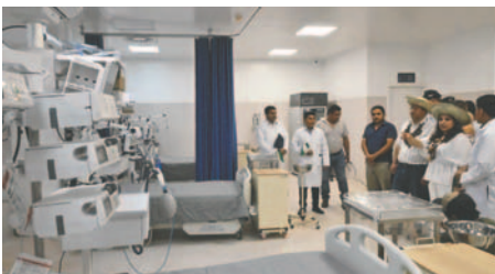
Acto de inauguración del hospital en Cobija

La situación ha generado un creciente malestar en la región, que ve en esta decisión un acto de discriminación y racismo que vulnera los derechos de sus habitantes. Las organizaciones y sectores afectados exigen al Ministerio de Salud que revierta esta medida y otorgue los ítems a los profesionales locales, asegurando una gestión justa en los servicios de salud para Pando.