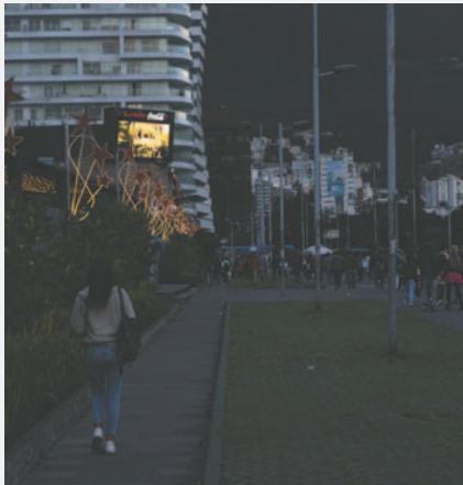
Personas caminan por una calle este viernes, en Quito (Ecuador)