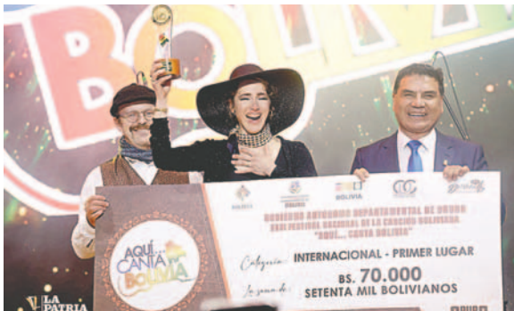
Gobernador ratifica que para 2025 se mantendrá categoría internacional

“La Gobernación ha demostrado que sí puede realizar este evento nacional e internacional y lo hemos hecho, muchas gra-