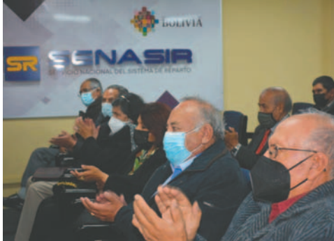
Senasir asegura pago de rentas

La Ley 065 de Pensiones, promulgada el 10 de diciembre de 2010, establece que la Gestora es responsable de la administración de las prestaciones del Sistema Integral de Pensiones (SIP). Desde