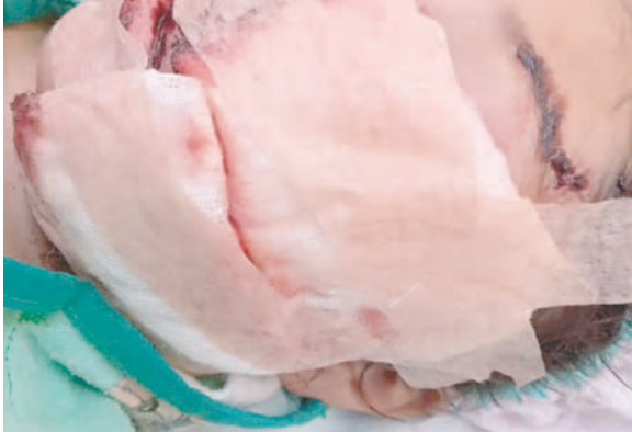
Las lesiones provocadas por ataques caninos son muy graves

Al recibir una respuesta, el Sedes y el Programa de Enfermedades Zoonóticas tuvieron