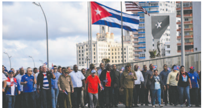
El presidente de Cuba Miguel Díaz-Canel (3-i), junto al General de Ejército Raúl Castro (4-i), asisten a una marcha frente a la embajada de Estados Unidos este viernes, en La Habana (Cuba)

En menos de tres semanas, en octubre y noviembre, estos dos huracanes afectaron a la isla, generando la afectación de miles de viviendas y daños en la infraestructura eléctrica,