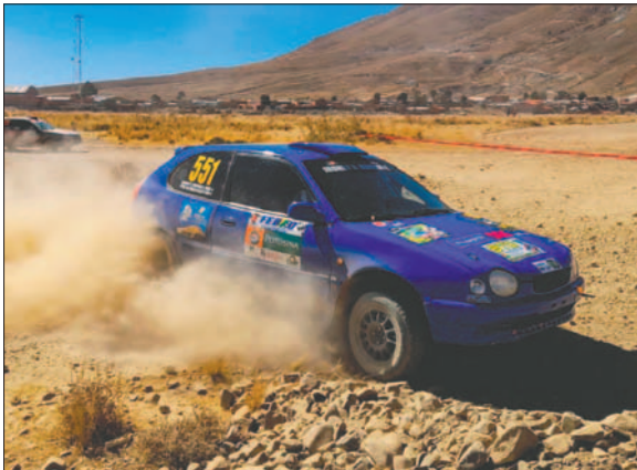
Poopó prepara su circuito para la última prueba de esta temporada

De momento, no se ha mencionado si en esa fecha se dará a conocer a los ganadores de la temporada o si se aguardará la realización de un acto especial para cumplir con esta actividad, ya que se tiene la otorgación de cuatro motorizados a los primeros puestos de cada clase, algo que ha puesto el campeonato en una riña especial que salió de la pista para enfriarse incluso en algunas impugnaciones.