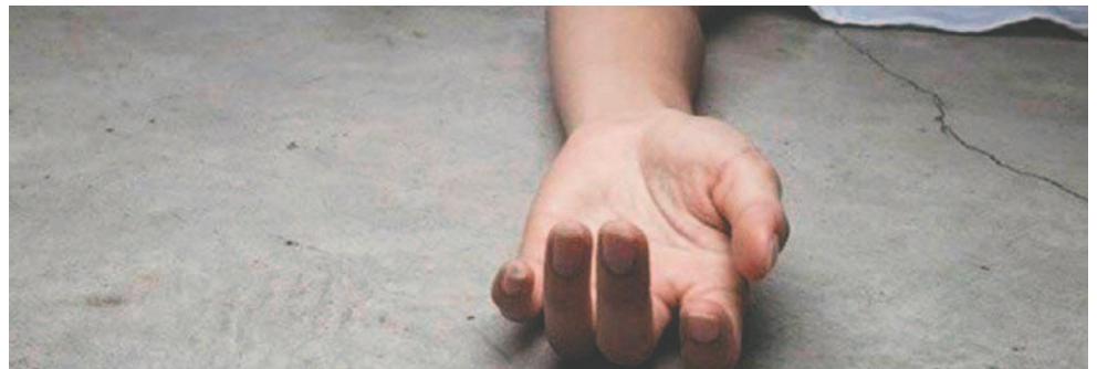
Se investiga las circunstancias de la muerte /REFERENCIAL

Ante ello, los vecinos llamaron a la Policía y a personal de la Secretaría Municipal de Seguridad Ciudadana de Cochabamba para que realice la verificación. De esa manera, las autoridades confirmaron que el sujeto estaba sin vida.