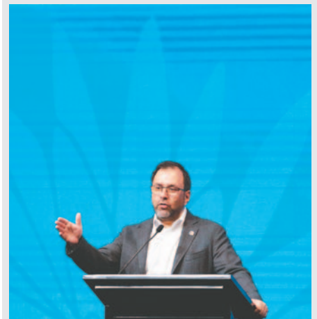
Fotografía de archivo del canciller venezolano, Yván Gil