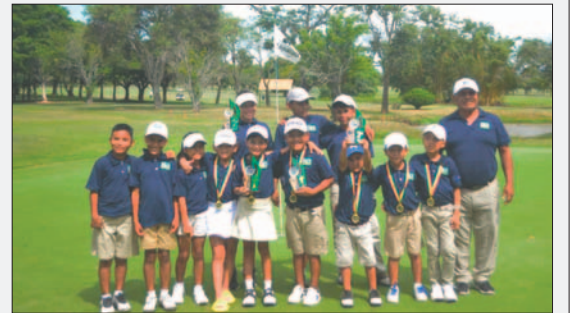
Jóvenes deportistas beneficiados con el proyecto de Hándicap

"La importancia de este aporte es muy relevante para el crecimiento del golf en Bolivia, y para apoyar el proyecto social de la federación. Gracias a los golfistas por sus aportes, y por qué a través de su participación, están logrando todo lo mencionado. ¡Sigamos fomentando a nuestros niños y jóvenes, alcanzar sus sueños a través del golf!", señaló Genaro Sanjinés, presidente de la FBG.