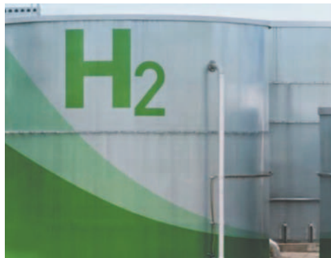
Para 2025, Caracollo podría tener su planta de hidrógeno verde

“La planta piloto que va a iniciar su implementación el 2025, va a producir 36 kilos de hidrógeno por día y con eso vamos a iniciar. La planta grande que pensamos se obtiene en un tiempo útil de 30 años, además habrá unas inver-