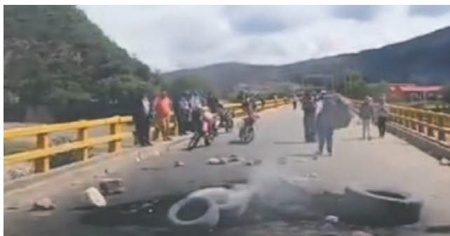
Punto de bloqueo en Parotani entre octubre y noviembre