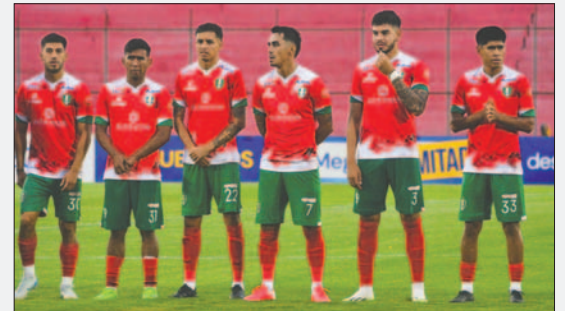
Real Tomayapo no pudo clasificar, pero se despidió con un triunfo