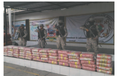
Parte de la mercadería decomisada /RR.SS.

Las Fuerzas Armadas ejecutan el Plan Soberanía, que consiste en instalar comandos operacionales para la lucha contra el contrabando en el país. “En la zona estamos hablando del Comando Estratégico Operacional del Chaco, la unidad militar acantonada en el lugar que pertenece a la Armada Boliviana, y también las patrullas móviles que se desplazan a lo largo del sector”, aseveró el viceministro.