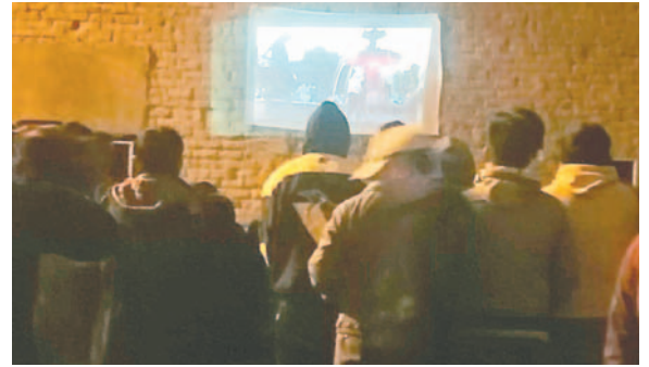
Una de las obras proyectadas en la clausura

“Los resultados fueron positivos porque en la elaboración de cada video se ha podido observar mucho talento, desenvolvimiento, habilidad y especialmente contenido positivo para que la sociedad también pueda concienciarse en varias cosas. Re-