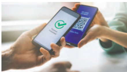
El pago con QR ha crecido exponencialmente en Bolivia /REFERENCIAL

El uso del QR es fundamental para las transacciones financieras sin billetes ni monedas. Las cifras muestran que casi la mitad (49%) se realizaron por montos de hasta Bs 50; algo más de una cuarta parte fue en operaciones entre Bs 101 y Bs 520. La cifra agregada indica que el impacto del QR facilita el acceso a productos y servicios financieros: el 87% (más de 252 millones) fueron por montos menores a Bs 520.