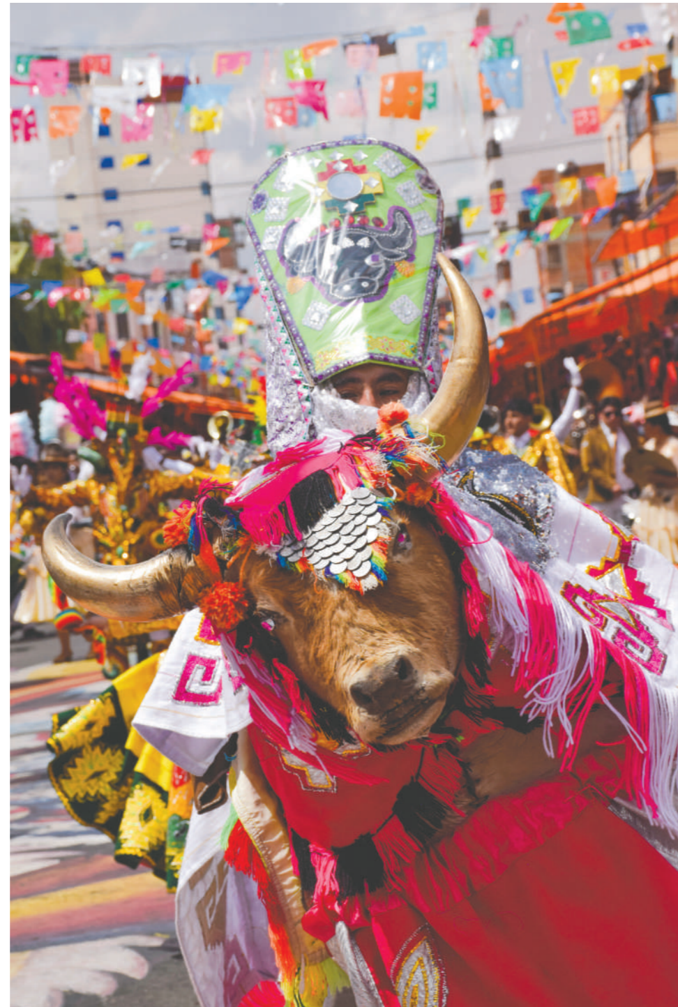
Diversos factores permitieron al Carnaval de Oruro ser proclamado como Patrimonio