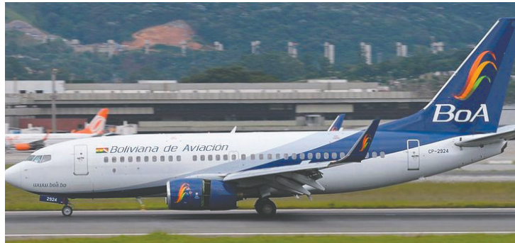
Una aeronave de la empresa estatal /ABI

Camargo consideró que la aerolínea estatal