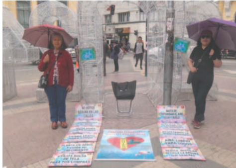
Los activistas expresaron su mensaje en la plaza principal

“Así, teniendo un lugar donde dejar los escombros, se sancionará a los infractores. El Reglamento de la Ley 160 de prohibición de plásticos debe priorizarse