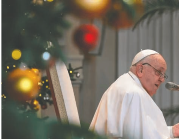
El papa Francisco durante su saludo navideño

El augurio fue que "cuanto antes haya un cese del fuego y la liberación de los rehenes" israelíes en manos del grupo Hamas. La nota vaticana destacó la importancia de alcanzar una solución para los dos estados, solo