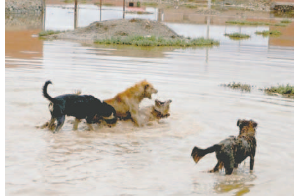
Preocupación por gran cantidad de canes en situación de calle

“Hacemos esto porque vemos una gran cantidad de perros que están poniendo en zozobra en las calles a niños y a personas mayores. Prácticamente, cuando son