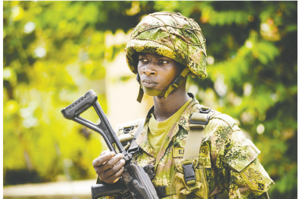
Las mujeres son cada vez más importantes en este proceso

En un mundo cada vez más interconectado, la cooperación regional es no solo una necesidad, sino una estrategia imprescindible para garantizar la estabilidad y el desarrollo sostenible de la región.