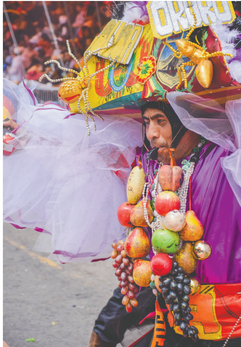
Cada danza del Carnaval tiene un legado histórico invaluable / LAURA PONCE

BIBLIOGRAFÍA: CARPETA DE POSTULACIÓN CARNAVAL DE OROURO UNESCO; APUNTES DE CHALY GUZMÁN; MATUTINO LA PATRIA, PUBLICACIONES 2001; TEXTO "DEL FOLKLORE A LA IDENTIDAD", EDUARDO BARRIOS, 2004; TEXTO "FICCIONES Y REALIDADES", WALTER ZAMBRANA B. 2013; ARTÍCULOS CARLOS GUZMÁN; TEXTO FRATER. ARTIST. CULT. LA DIABLADA 2024.