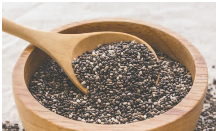
Semillas de chía /QUAKER

De ese volumen, entre enero y septiembre, el 36% tuvo como destino principal México, el 9% Alemania, el 8% Reino Unido, el 7% España, el 5% Estados Unidos, el 5% Colombia, el 5% Chile, el 4% Dinamarca, el 3% Australia, el 3%