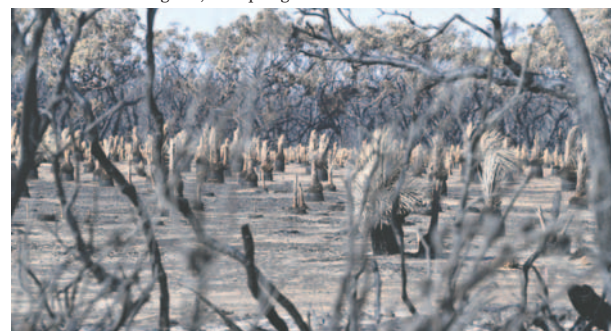
Fotografía de archivo de terreno calcinado durante el conocido como "Verano Negro" en Australia

La temporada de incendios en Australia varía según la zona y las condiciones meteorológicas, aunque ge-