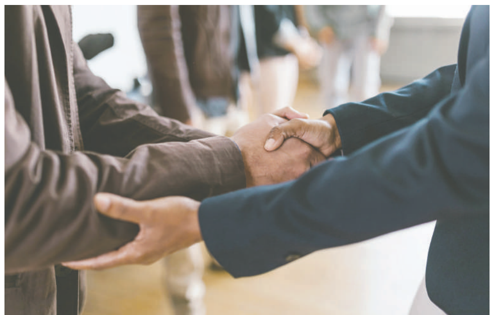
La cooperación tiene varios retos para que sea efectiva