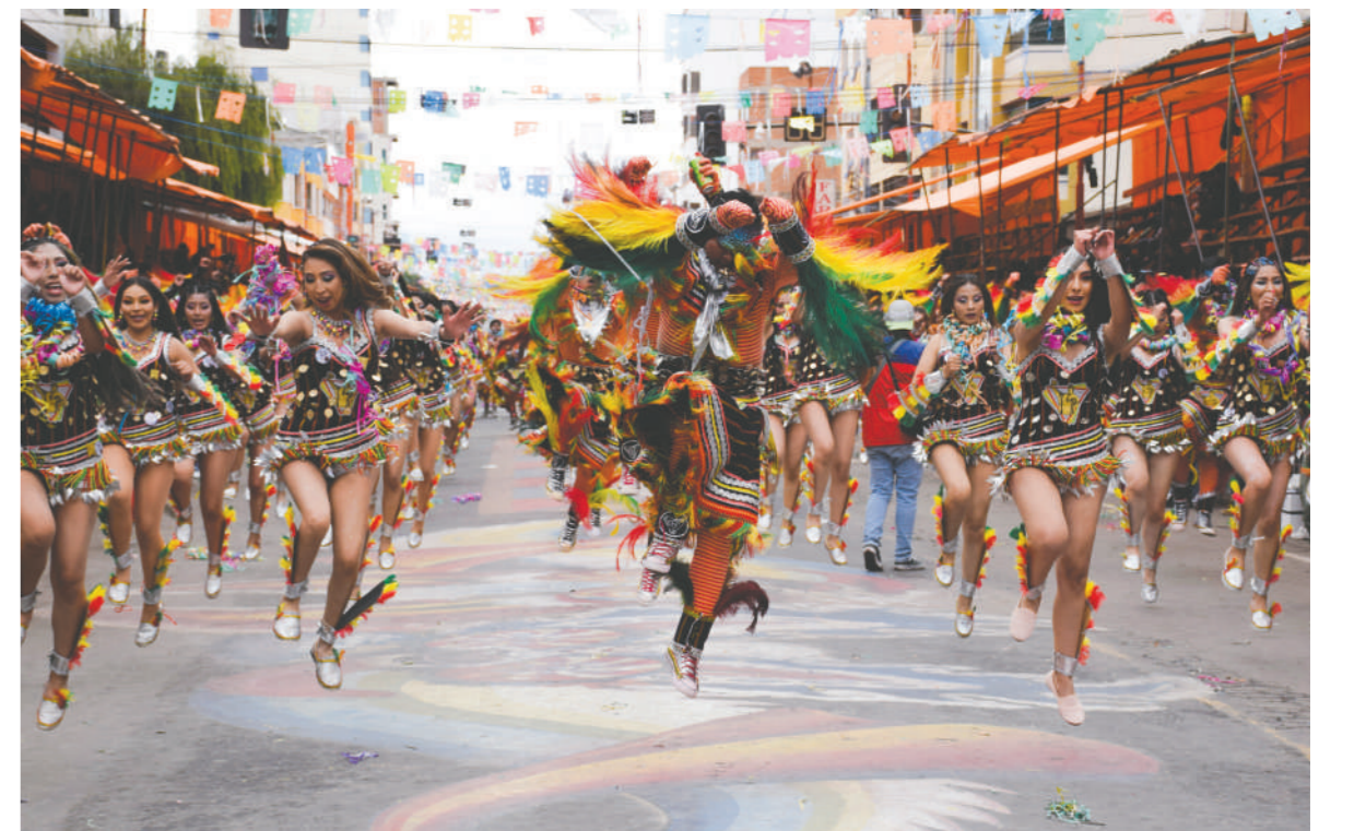
La identidad de toda Bolivia se refleja en el Carnaval de Oruro