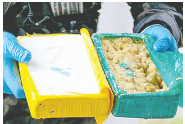
La afectación al patrimonio del narcotráfico oscila en 2,4 millones de dólares

"Entre el precio del predio que fue secuestrado por el Ministerio Público, el precio de la sustancia controlada y el precio de la aeronave Beechcraft, se logró una afectación al narcotráfico de 2,2 millones de dólares