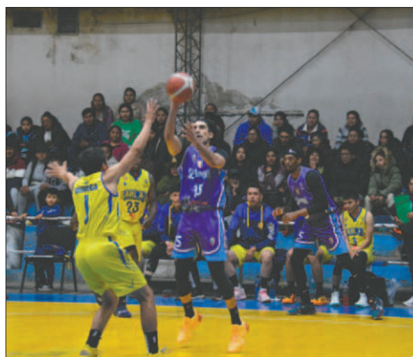
La temporada 2025 en el baloncesto comenzará con la categoría U-25

Los planteles deben estar conformados por jugadores comprendidos entre dieciocho y veinticinco años, siendo veinticinco años la edad