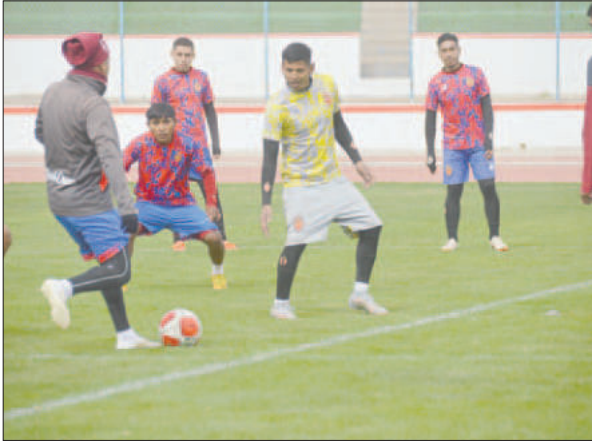
Una vez que se tenga claro el panorama el equipo volverá a los entrenamientos

No menos importante será la realización del próximo congreso federativo, que está planificado