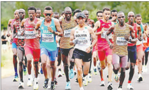
Argentina será la próxima parada del deportista orureño (centro)