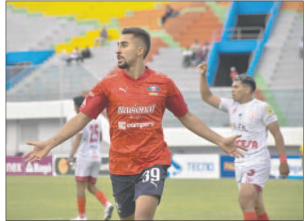
Wilstermann es uno de los que se opone al torneo único para este año

Sin embargo, ésta última idea tiene el problema de que dejará poco espacio en la agenda, sin olvidar que las elecciones presidenciales están programadas para el domingo 10 de agosto y en caso de ser necesaria una segunda vuelta, ésta se efectuará el domingo 12 de octubre, dejando dos fines de semanas sin fútbol.