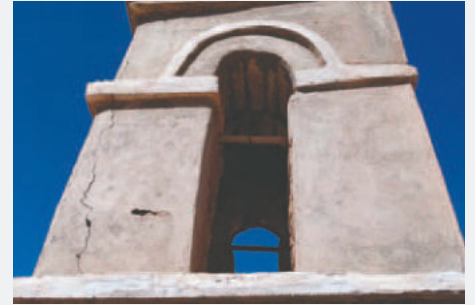
Los campanarios sufrieron daños de consideración en sus estructuras tras el robo