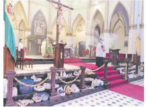
Celebración de la Solemnidad de la Epifanía del Señor