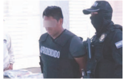
El sujeto fue aprehendido /REFERENCIAL

Una de las víctimas denunció el hecho, lo que llevó a la investigación policial y al hallazgo de varios elementos que res-