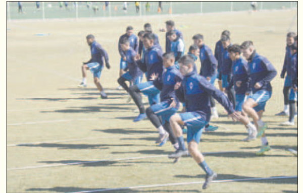
El cuadro orureño aún no tiene fecha de inicio de la pretemporada