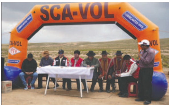
Paso un año del inicio de obra y de momento el proyecto no avanza

Se espera que en este 2025 el proyecto pueda ser reencaminado y que, de una vez por todas, se pueda ingresar a la fase de construcción del escenario deportivo que, al margen de ser una nueva opción para la práctica deportiva, traerá otras alternativas de desarrollo económico a la región de Soracachi.