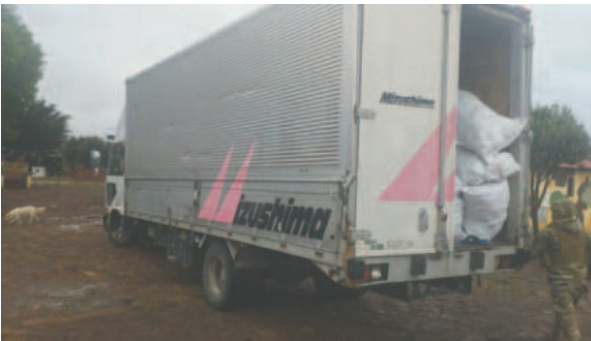
El camión fue secuestrado con fines investigativos