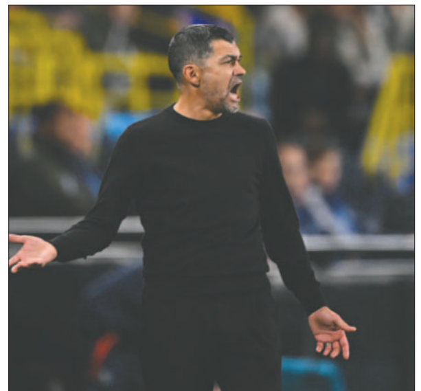
Sergio Conceicao, es el entrenador del Milan

en el derbi a su máximo rival a principios de temporada y Conceicao quiere repetir la hazaña para sumar su primer título tras solo una semana en el cargo.