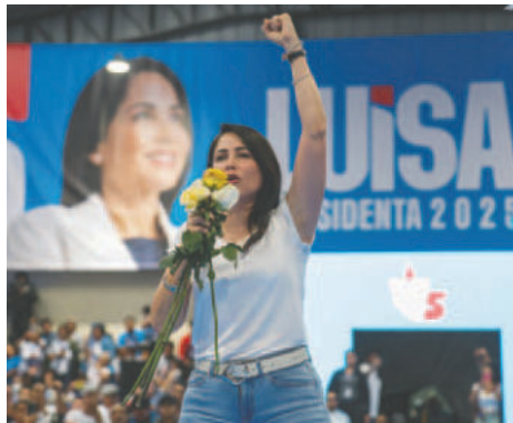
La candidata a la presidencia, Luisa González, habla a sus simpatizantes durante un acto de campaña este domingo, en Quito (Ecuador)

Aseguró que Noboa no cumplió sus ofertas de campaña, como evitar la crisis energética que, en sus peores momentos del año pasado, obligó por el estiaje a apagones de hasta 14 horas diarias. Agregó que subió