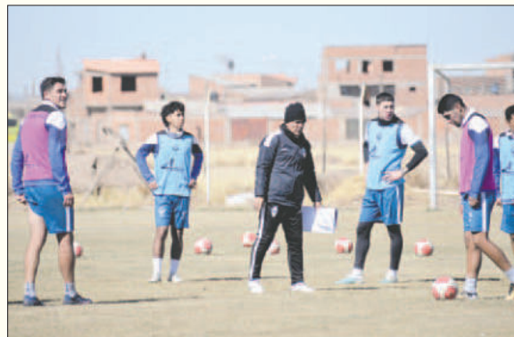
El cambio de entrenador fue una constante en GV San José el 2024