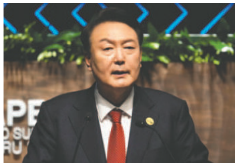
El presidente de Corea del Sur, Yoon Suk-yeol, en una foto de archivo

Un representante policial contó a la agencia Yonhap que la Policía está