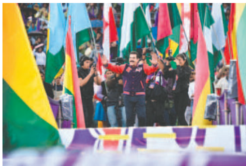
El alcalde de Cochabamba tuvo un masivo acto

Durante su discurso, el líder de Súmate sugirió la reestructuración del aparato estatal, reduciendo los ministerios a 12, de los