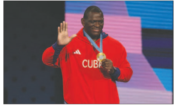
El luchador cubano Mijain López al celebrar la obtención de la medalla de oro

El año que termina fue inolvidable para la de Nuevo Brunswick pues estableció dos récords mundiales en los 400 metros vallas, con 50.65 y luego 50.37. Suficiente todo para ser proclamada Atletista de Pista Femenina del Año por World Athletics.