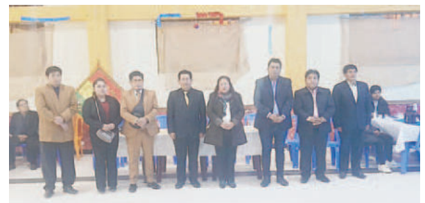
Nueva directiva 2025 - 2026, de la Asociación de Bordadores en Arte Nativo

La asociación celebró su aniversario con un programa lleno de actividades. La jornada comenzó con una misa de acción de gracias en el Santuario del Socavón. Por la tarde, la celebración continuó con el acto central en