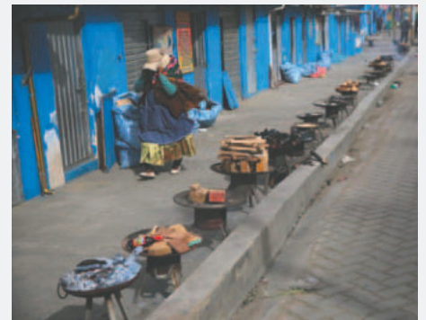
Un grupo de "yatiris" se resiste a abandonar sus negocios en la avenida Panorámica, aun sabiendo que el terreno podría colapsar debido a las lluvias