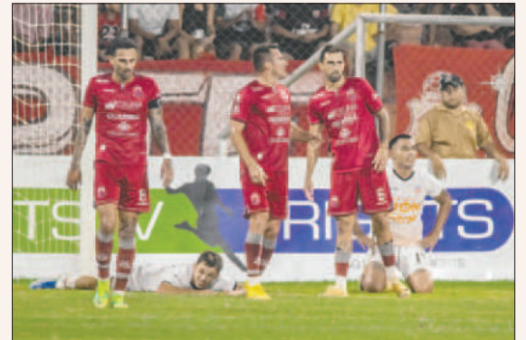
El cuadro de Montero, pretende ser protagonista este 2025

El presidente del club Guabirá, Rafael Paz, recordó que durante la temporada 2024 el pago a los jugadores fue en moneda nacional, establecido en los contratos, tanto de los bolivianos como de los foráneos, aclarando que el cambio del dólar será a 6.97 Bs. El equipo aceptó estas condiciones, entendiendo la crisis frente a la ausencia de dólares estadounidenses. Y para este año, se mantendrá este sistema de remuneración.