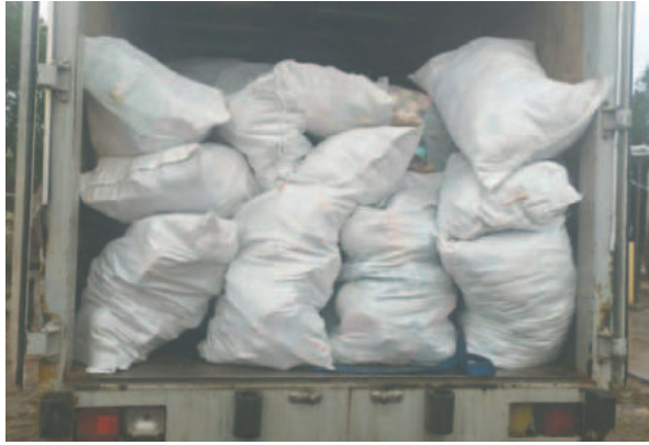
Se confiscó un camión cargado con juguetes y cosméticos valorados en Bs. 390,000 / VICEMINISTERIO DE LUCHA CONTRA EL CONTRABANDO

La Fuerza de Tarea Conjunta "Bravo" comiso un camión furgón con placa 3120-EAK, que transportaba fardos de juguetes y cajas de cosméticos, con una afectación al contrabando aproximada de Bs. 350.000. El vehículo fue depositado momentánea-