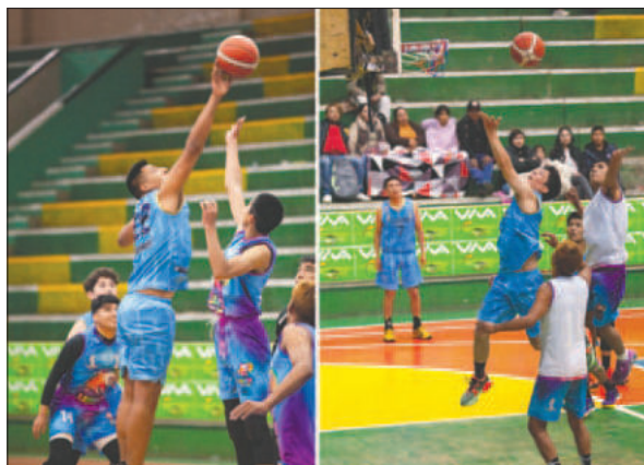
CAN se encaminó a la final jugando buenos partidos / CAN