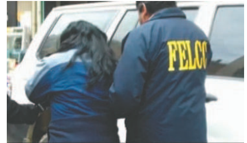
Se presume que la mujer realizaba este tipo de hechos en distintas fiestas

La mujer no tiene antecedentes policiales; en las próximas horas, un juez definirá su situación legal.