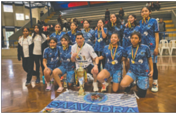
Saavedra listo para los primeros lugares en esta fase final

Los elencos orureños ya emprendieron el viaje hasta la ciudad de Tarija y están a la espera de conocer a sus primeros rivales a vencer y buscar la oportunidad de avanzar a la etapa final para quedarse con el título de esta categoría. No se tuvieron dificultades con los jugado-