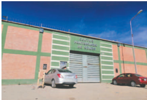
Gestiones buscan la construcción de nuevos pabellones en el Centro Penitenciario La Merced

Para este año, aún no se tiene fijada una fecha exacta para la primera visita carcelaria de este 2025; sin embargo, el presidente del Tribunal de Justicia señaló que se realizará lo antes posible para buscar esa labor de descongestionar los recintos penitenciarios de Oruro.