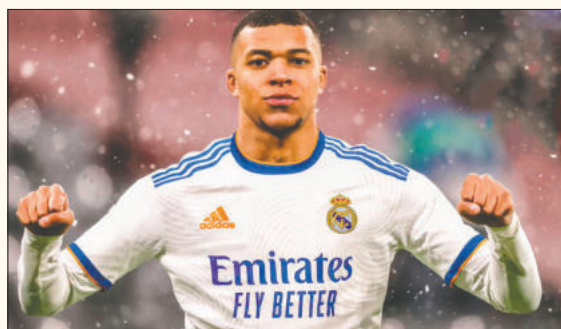
Kylian Mbappé, delantero del Real Madrid

"Muchas gracias a la afición por votarme, es importante. Diciembre fue un gran mes para mí y para el equipo porque ganamos un título, muchos partidos en la Liga y un encuentro importante de Champions. Ahora toca afrontar la Copa del Rey y después la Supercopa de España", señaló.