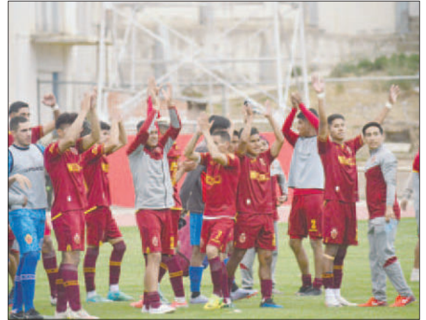
El abandono de Royal Pari le da la posibilidad a CDT Real Oruro subir a la División Profesional

para el 13 de enero, encuentro donde se debe dar la bienvenida a los nuevos clubes que forman parte de la División Profesional, en este caso ABB de La Paz y CDT Real Oruro, además de conocer cuál será la modalidad de campeonato que se tendrá en esta gestión y cómo se encarará el tema de los derechos televisivos.