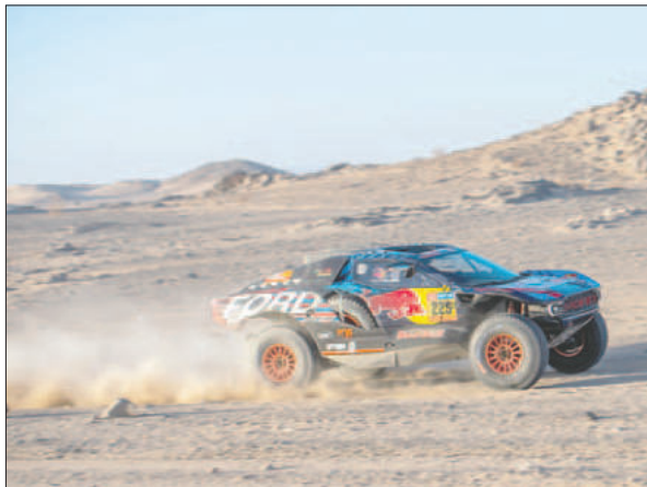
Poco a poco la competencia empieza a cobrar el interés de los seguidores de este deporte