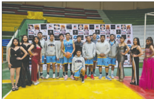
CAN estuvo a un paso de retener el título de este campeonato