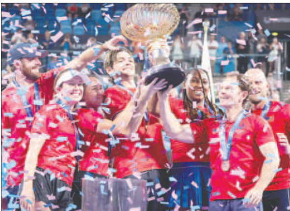
El equipo estadounidense celebra el título conseguido en la United Cup

La representación norteamericana se impuso a la de Polonia en la final de la competencia internacional de tenis