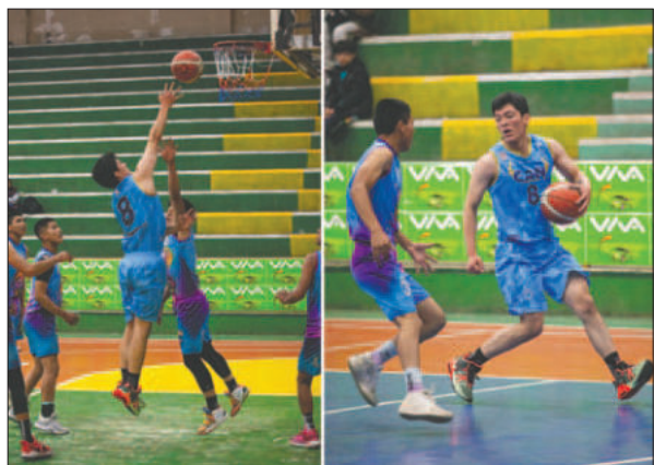
El cuadro orureño demostró buen nivel de juego en el torneo / CAN

El resultado final fue de 78 a 50 a favor del plantel de Gorilaz, con parciales de 17-11, 25-10, 16-17 y 20-12. El conjunto llallagueño cobró revancha de la primera edición, donde perdió en la final ante el cuadro celeste que, a pesar de la derrota, cumplió una buena campaña en este torneo que tiene por objetivo potenciar el baloncesto de esta región minera y, a futuro, tener elencos a nivel nacional.