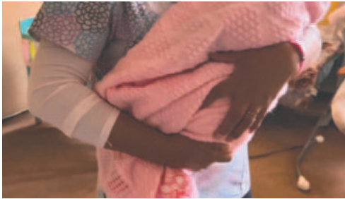
Bebé recibe cuidados permanentes /GADOR

El menor fue abandonado en vía pública y encontrado por vecinos en las inmediaciones de