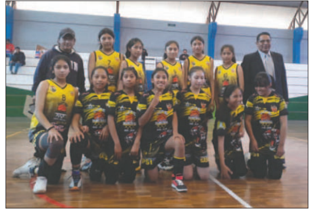
Jupsi quiere ser la revelación en esta fase final del torneo

ras, quienes están motivadas para lograr un buen desempeño en esta instancia decisiva.