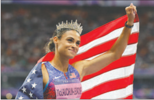
La atleta estadounidense Sydney McLaughlin-Levrone