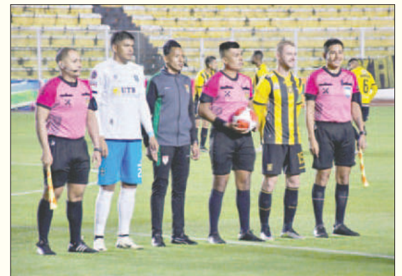
Sin duda será una reunión importante entre capitanes y árbitros

Cabe mencionar que, para esta temporada, el fútbol boliviano cuenta con 42 árbitros con insignia FIFA, con 11 árbitros centrales, 13 árbitros asistentes, seis VMO's (operadores VAR), seis árbitros de futsal y siete árbitros de fútbol de playa.