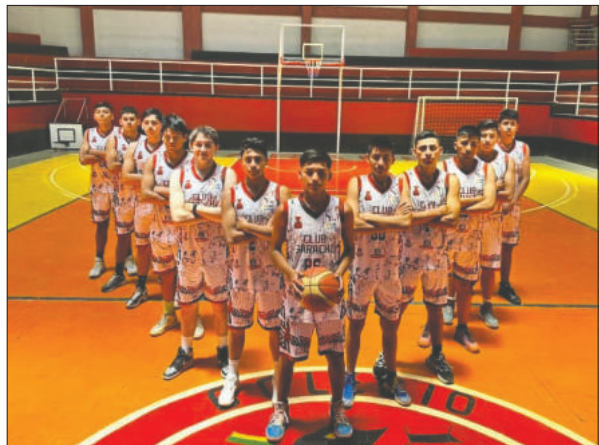
Saracho será uno de los cuadros que apostará por fomentar a sus juveniles

Oruro tuvo una buena representación en la edición 2024 de este torneo, con jóvenes jugadores que cumplieron las expectativas de sus entrenadores y de sus clubes. Este año se espera contar con una buena representación a nivel de clubes que deseen formar parte del torneo nacional.