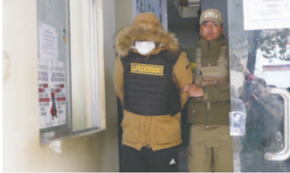
Envían al Penal de San Pedro a sargento que agredió a su expareja

“Estimamos que esto nos va a llegar en el curso de una semana, donde el Ministerio Público, a