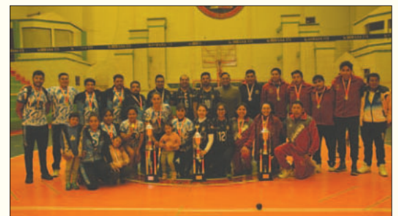
Varios equipos orureños sobresalieron en torneos nacionales

Actualmente, la Adapo lleva adelante el torneo dentro de la disciplina de fútbol de salón en sus diferentes categorías, con encuentros que son bastante llamativos por el nivel deportivo que se expone. De la misma manera está en curso el torneo de baloncesto en damas y varones.