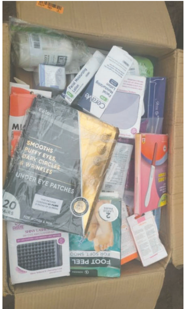
Parte de la mercadería hallada

Ambas acciones forman parte del esfuerzo continuo por combatir el contrabando en la región, donde las autoridades han intensificado sus operativos para frenar esta actividad ilegal que afecta la economía local.