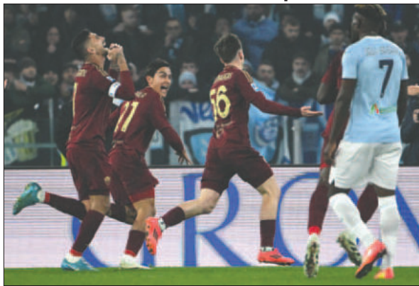
Jugadores de la Roma celebran el triunfo ante Lazio

En concreto, entre el diez y el dieciocho, cuando Pellegrini y Saelemaekers dieron en la diana. El primero, firmó un gran gol, tras recoger al borde del área de Saelemaekers desde la banda derecha. La gran novedad en el once de Claudio Ranieri se sacó de la chistera un disparo certero que entró por la escuadra izquierda de la portería de-