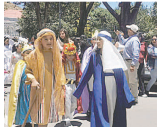
Niños salen en procesión por las calles para representar la llegada de los Reyes Magos a Belén

sonas acostumbran entregar juguetes y servir una chocolatada con su buñuelo a personas de escasos