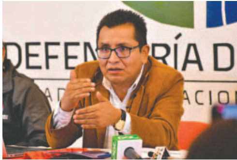
El Defensor del Pueblo, Pedro Callisaya, comparte su preocupación por el papel del Tribunal Constitucional Plurinacional en las próximas elecciones generales de 2025

Callisaya señaló que espera que el TCP no se convierta en un "actor nocivo" como ocurrió en las elecciones judiciales, cuando se produjeron retrocesos