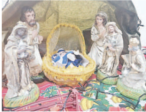
El espíritu del Día de Reyes se centra en la adoración, la gratitud, la unidad, la renovación y la esperanza

Para la Solemnidad de la Epifanía del Señor o fiesta de los Tres Reyes Magos, los templos y parroquias