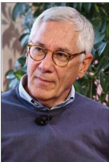
Eduardo Rodríguez Veltzé.

El expresidente señaló que la imposibilidad de votar para conformar plenamente el TCP y el Tribunal Supremo de Justicia en varios departamentos dejó a más de 4.1 millones de ciudadanos sin la posibilidad de ejercer este derecho.