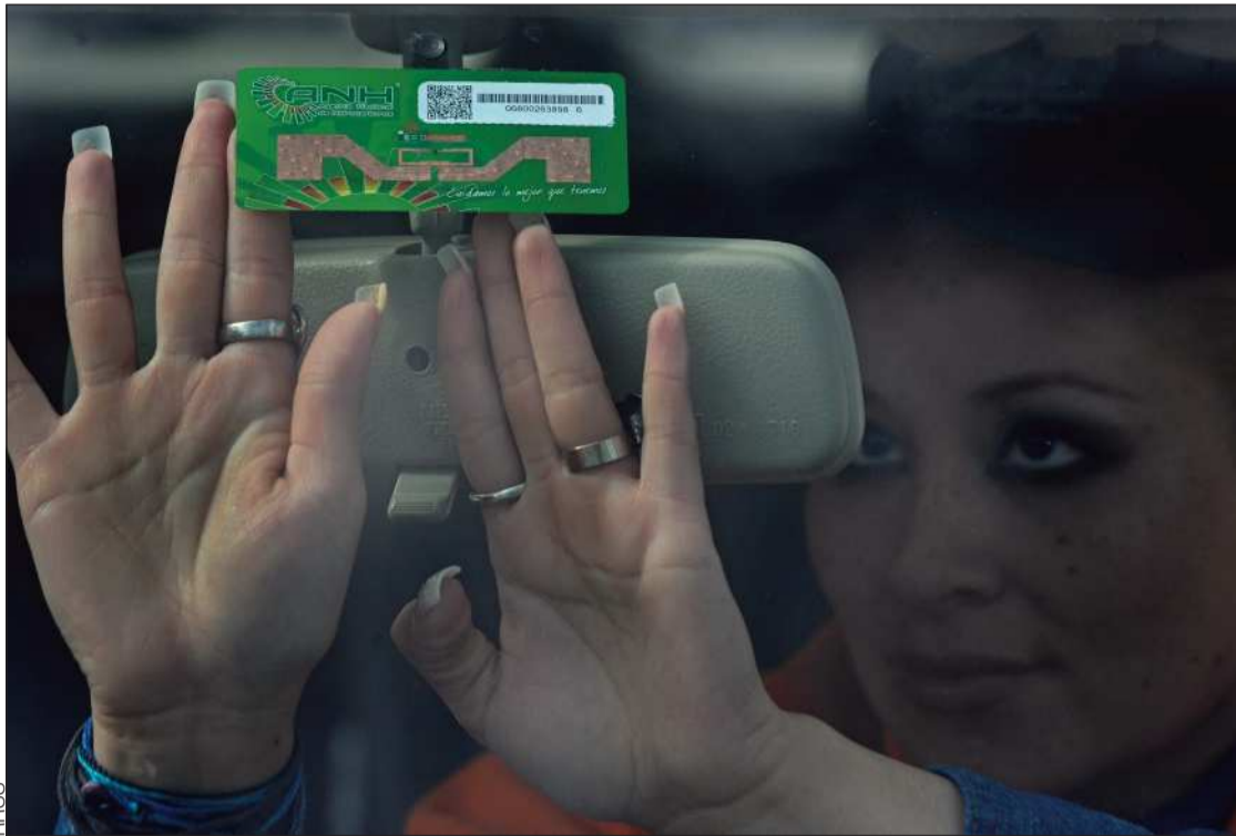
CONTROL. Una funcionaria de la ANH coloca la tarjeta B-Sisa a un vehículo de transporte público.