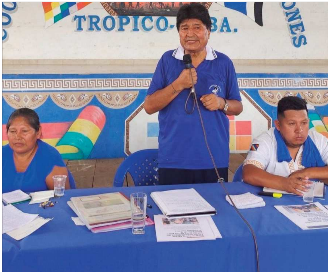
INVESTIGACIÓN. La Fiscalía de Tarija informó que existe una orden de aprehensión contra Morales.

Asimismo, se indica que se desconoce el paradero actual de los imputados, como también, en antecedentes, se desconoce el paradero de la víctima. Por lo