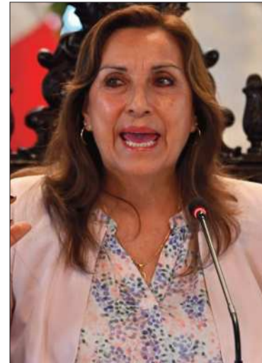
La presidenta Dina Boluarte