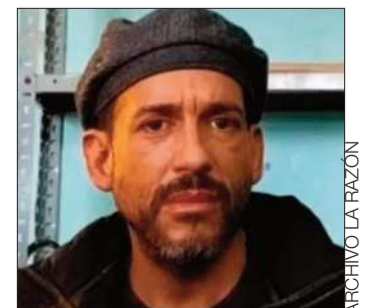
Luis Fernando Camacho.

Luego de eso, escoltado por policías de grupos especiales, Camacho fue trasladado en un vuelo hasta La Paz. En la sede de gobierno, un juez determinó, luego de una audiencia de medidas cautelares, su detención preventiva en el penal de Chonchocoro, mientras duren las pesquisas del caso Golpe I.