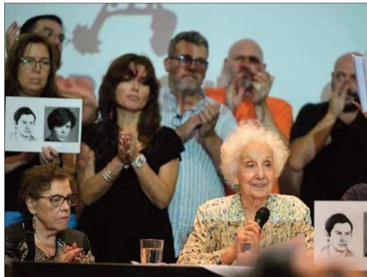
ARGENTINA. Abuelas de Mayo informa sobre el hallazgo.