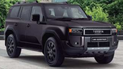
2024 Toyota Land Cruiser Prado Híbrido