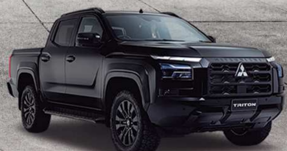
2024 Mitsubishi L200 GLX