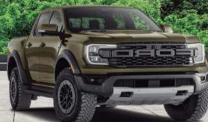
2024 Ford Ranger Raptor