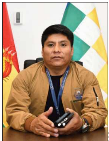
El senador evista Leonardo Loza.

El senador dijo que se resguarda al expresidente dentro del Trópico