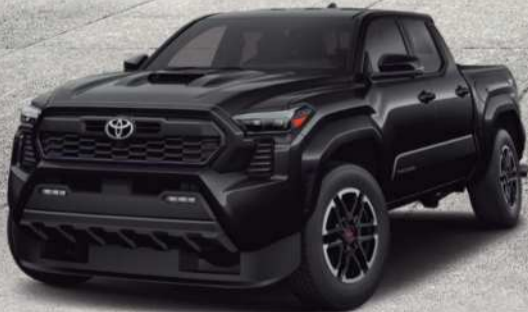
2024 Toyota Tacoma Híbrido