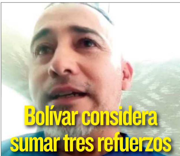
CAPTURA DE IMÁGEN