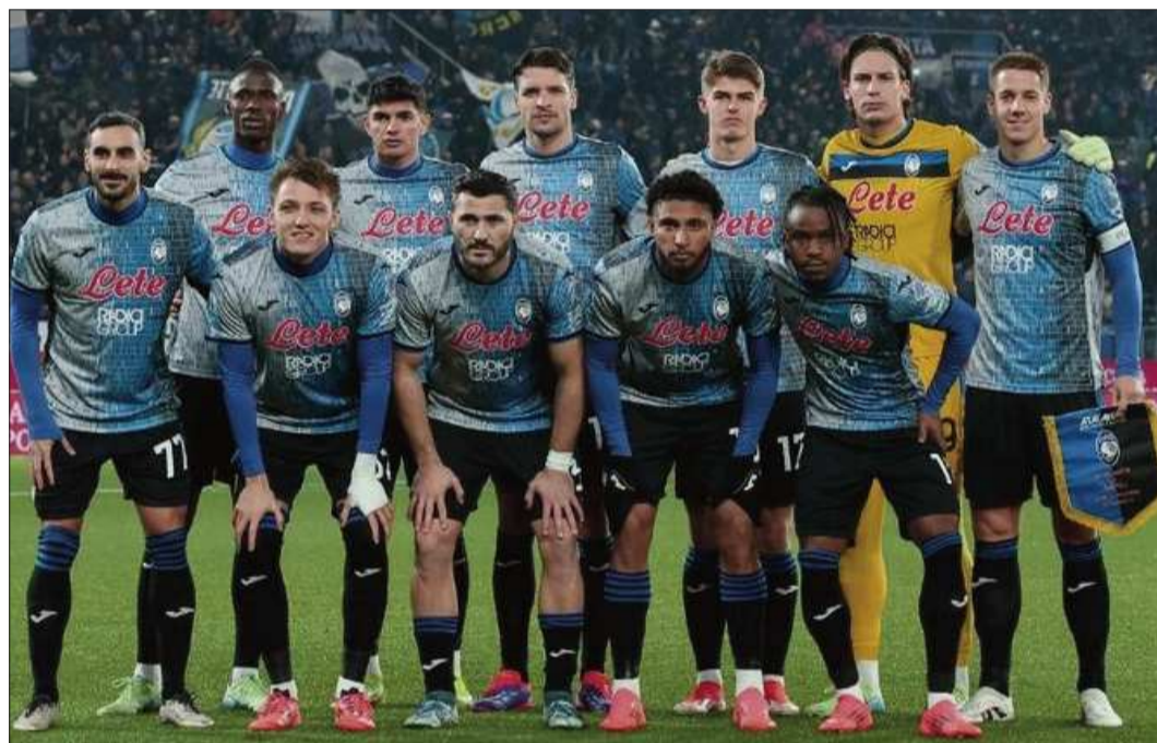
IMPARABLE. La formación del Atalanta que marcha con una racha implacable en el calcio.