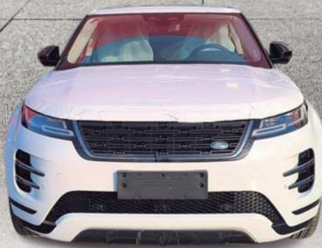
2024 Land Rover Range Rover