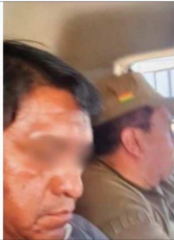
APREHENDIDOS. Los subalcaldes de Cotahuma y Achocalla fueron aprehendidos por el caso Bajo Llojeta.

mó la segunda aprehensión del funcionario de la Alcaldía de Achocalla.