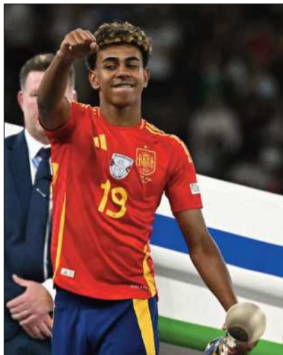
La joya española Lamine Yamal.

El jugador de Barcelona se recupera de una lesión en el tobillo derecho