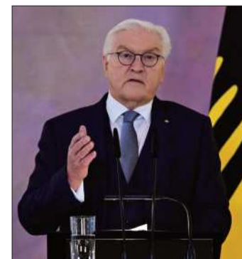
Steinmeier se dirige al país.

Walter Steinmeier hizo un llamamiento a que la campaña electoral que se aproxima sea llevada a cabo "con todo el respeto y decencia posibles".