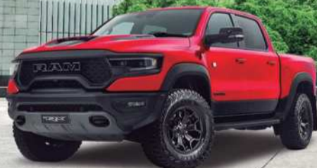
2024 RAM 1500 TRX Final