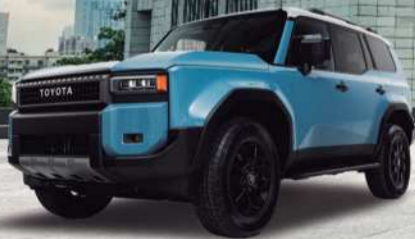
2025 Toyota Land Cruiser Prado

¡NO TE PIERDAS LA OPORTUNIDAD DE ESTRENAR EL AUTO DE TUS SUEÑOS!