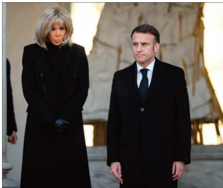
PARÍS. Macron y la primera dama, Brigitte, durante un acto.

"Emergencia ecológica, emergencia social, desarrollo de nues-