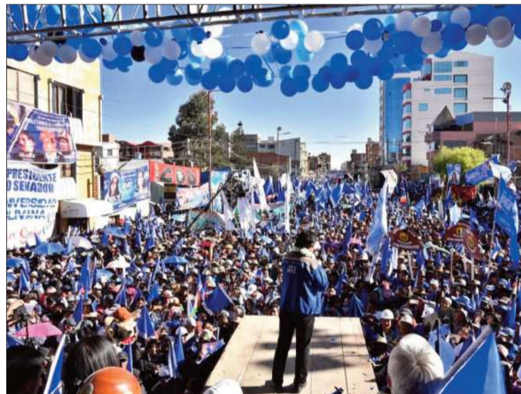
CAMPAÑA. El expresidente Evo Morales en un acto en 2019.

"Lo que ocasiona el golpe de Estado de 2019 es justamente su repostulación (de Morales), porque le dimos a la derecha el mejor argumento para atacarnos y