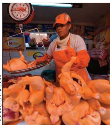
Venta de la carne de pollo.

El sector advierte sobre una crisis en la producción del producto