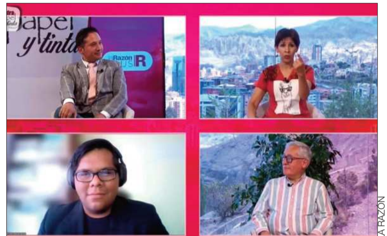
ENTREVISTA. Analistas hablan en PPyT sobre la economía del país.

-La reducción y diferimiento a 0% del Gravamen Arancelario (GA) de diferentes productos.