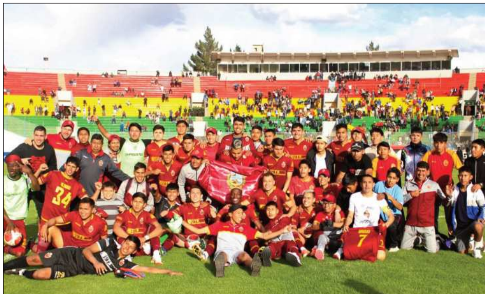
CELEBRACIÓN. La plantilla de CD Totora Real Oruro posaron en el Jesús Bermúdez.