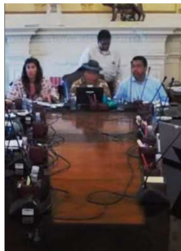
Una sesión del Concejo Municipal.