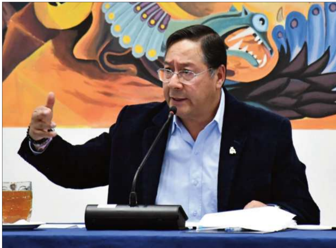
BALANCE. El presidente Luis Arce en diálogo con los periodistas, en la Casa Grande del Pueblo.

Asimismo, el Presidente se refirió a los bloqueos de carreteras