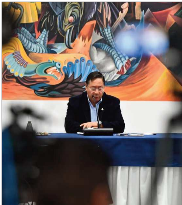
CONFERENCIA. El presidente Luis Arce en conferencia de prensa.

Por lo tanto, “hay inflación hasta en dólares. Estados Unidos estuvo cerca de tener una inflación muy grande en dóla-