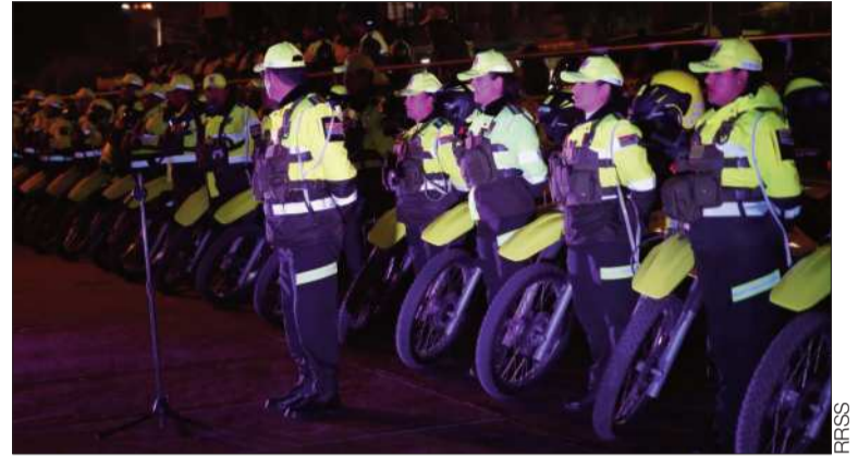
POLICÍA. La patrulla motorizada que realizará controles en El Alto.

El plan Navidad Segura y en Familia se extenderá hasta después de las festividades de fin de año, con el objetivo de proteger a la ciudadanía y reducir los índices de criminalidad en este período crítico.