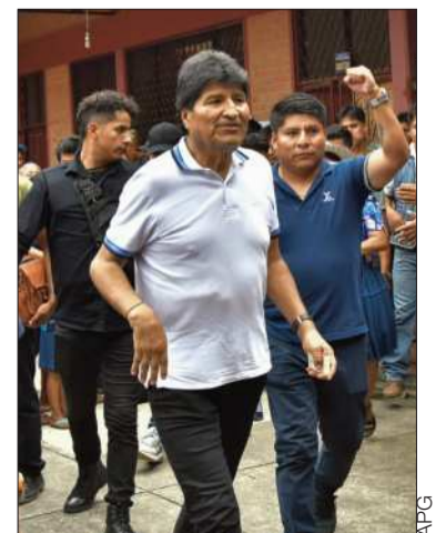
El expresidente Evo Morales.

"El primer paso es establecer un diálogo abierto entre todos los sectores, donde actores políticos y sociales se reúnan para construir soluciones a este escenario crítico", propuso el expresidente del Estado.