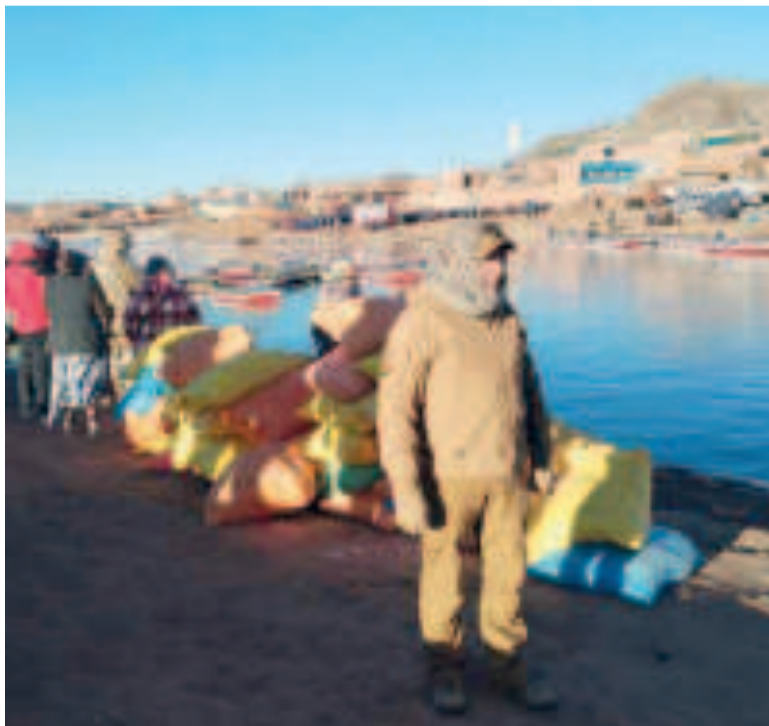
Productos nacionales son destinados al contrabando a la inversa en Desaguadero.