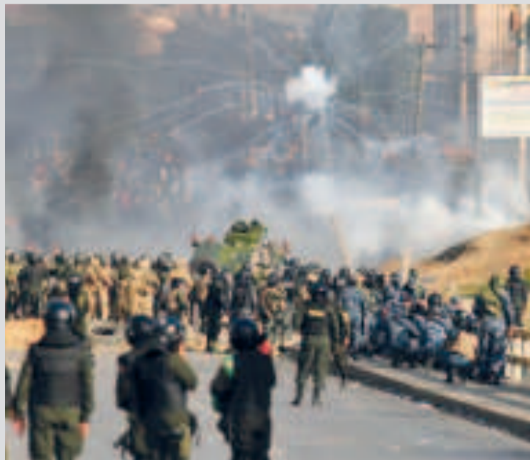
Militares y policías arremetieron contra el pueblo boliviano.