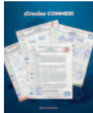
Documento de apoyo al presidente Arce.

Las extremas medidas de presión no solo generaron un desfase en el suministro de carburantes, sino también el incremento en el precio de varios alimentos que hasta este momento se mantienen, como en el caso de la carne de pollo.