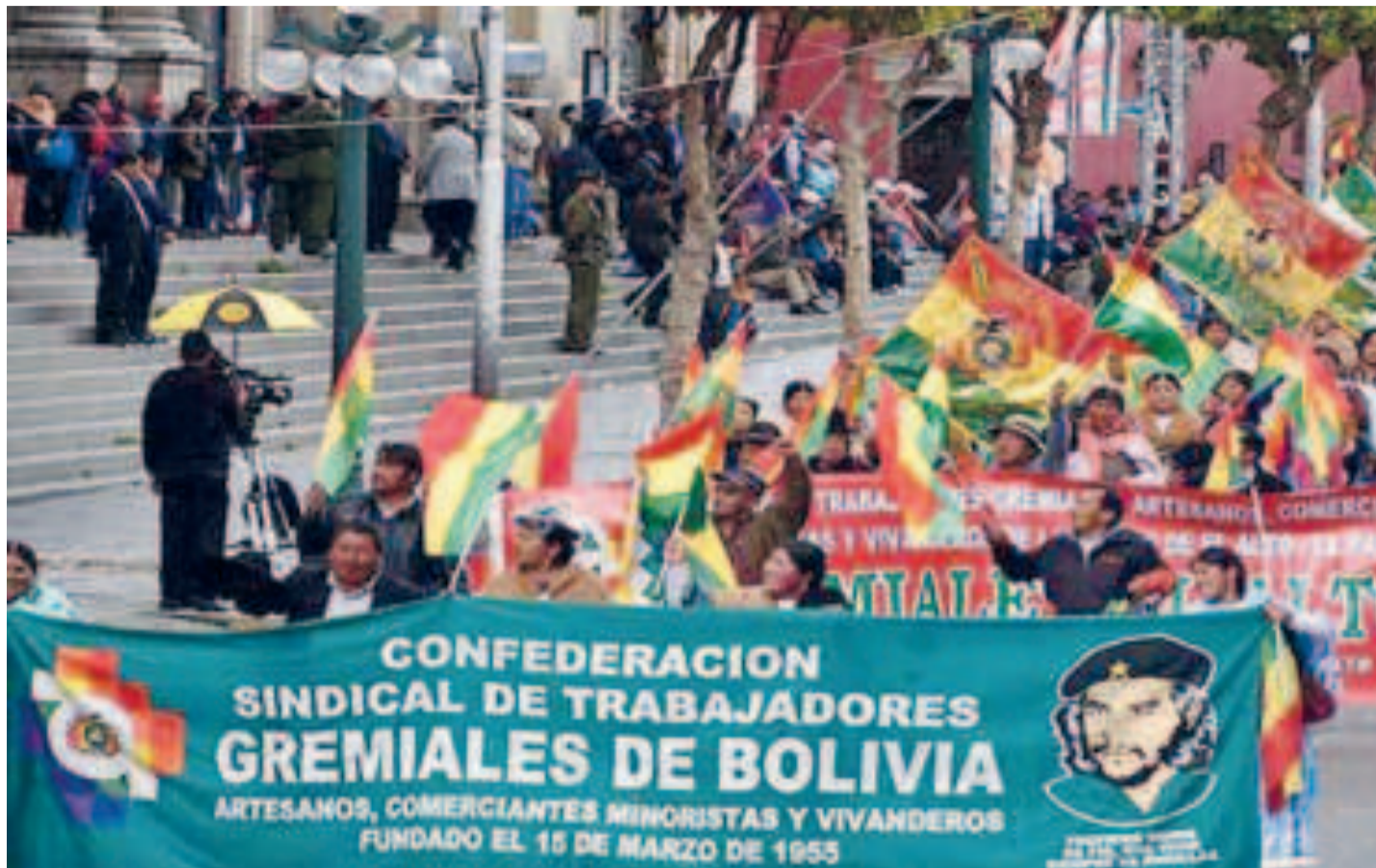
Confederación de Gremiales de Bolivia durante una manifestación.