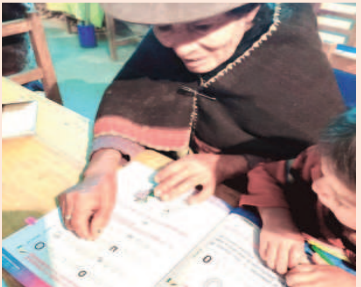
El programa llegó a varios lugares de todo el territorio boliviano.