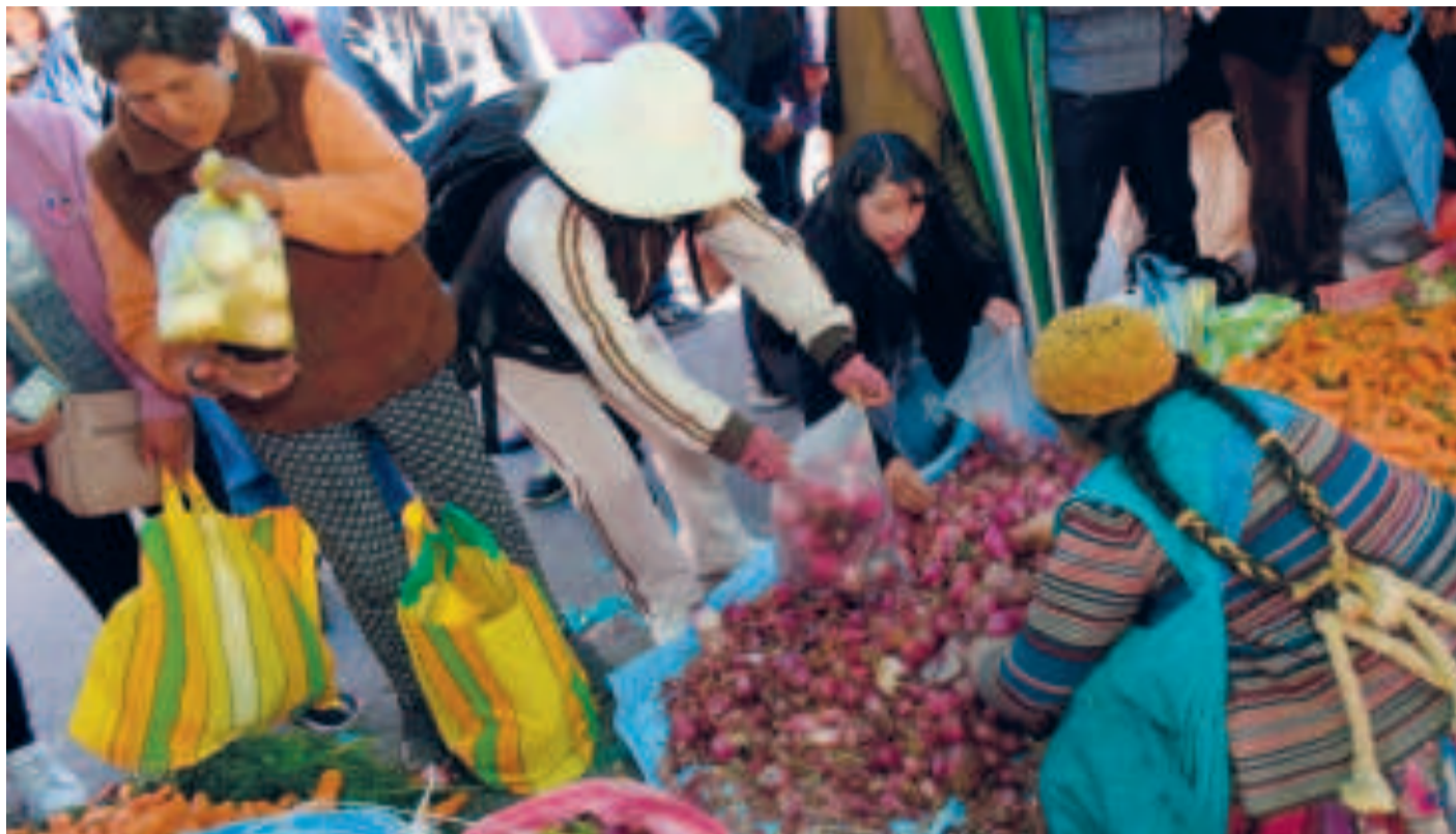
La feria Del Campo a la Olla facilita el acceso directo de los consumidores a productos agrícolas frescos a precios justos.