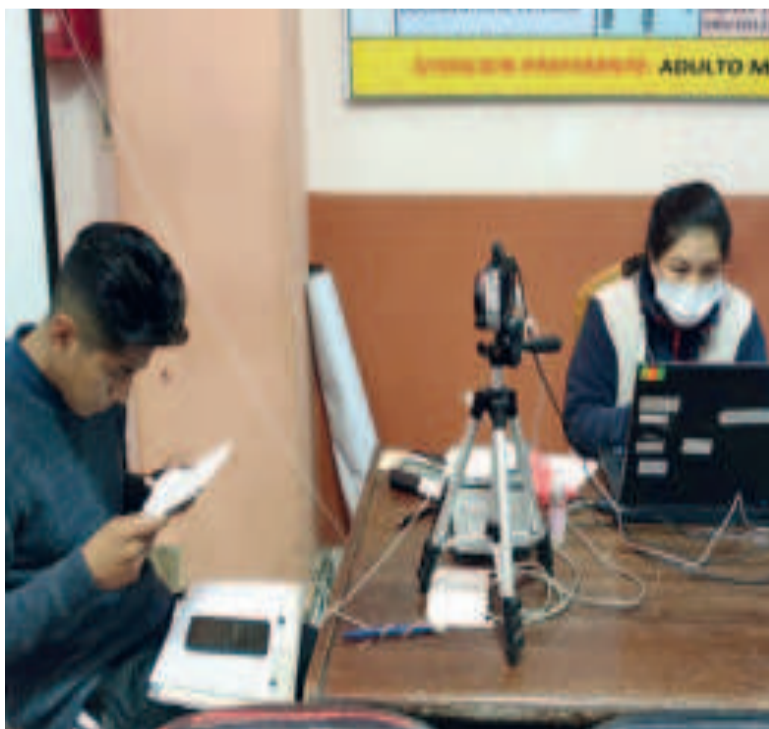
Un ciudadano se inscribe en el padrón electoral biométrico.

Esto se hará, dijo, en el tiempo más pronto posible.