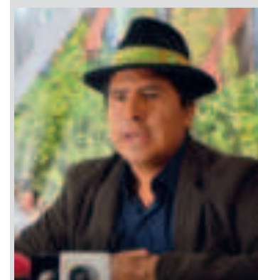
El viceministro Álvaro Mollinedo.

“Esperamos que, con la implementación de estos programas, podamos minimizar los impactos del cambio climático y asegurar la disponibilidad de alimentos a precios accesibles para las familias bolivianas”, agregó.