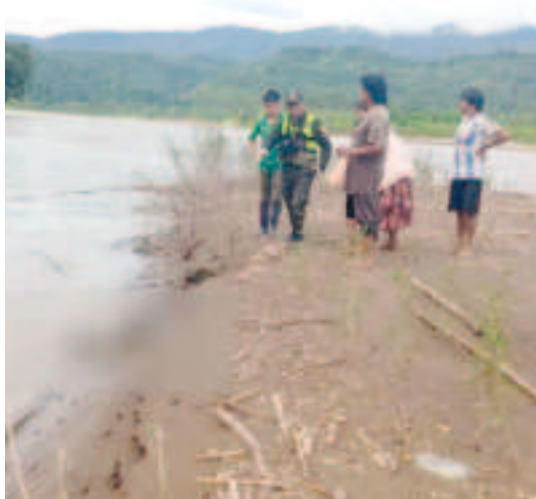
El cuerpo de la menor de edad fue hallado a las orillas del río Alto Beni.