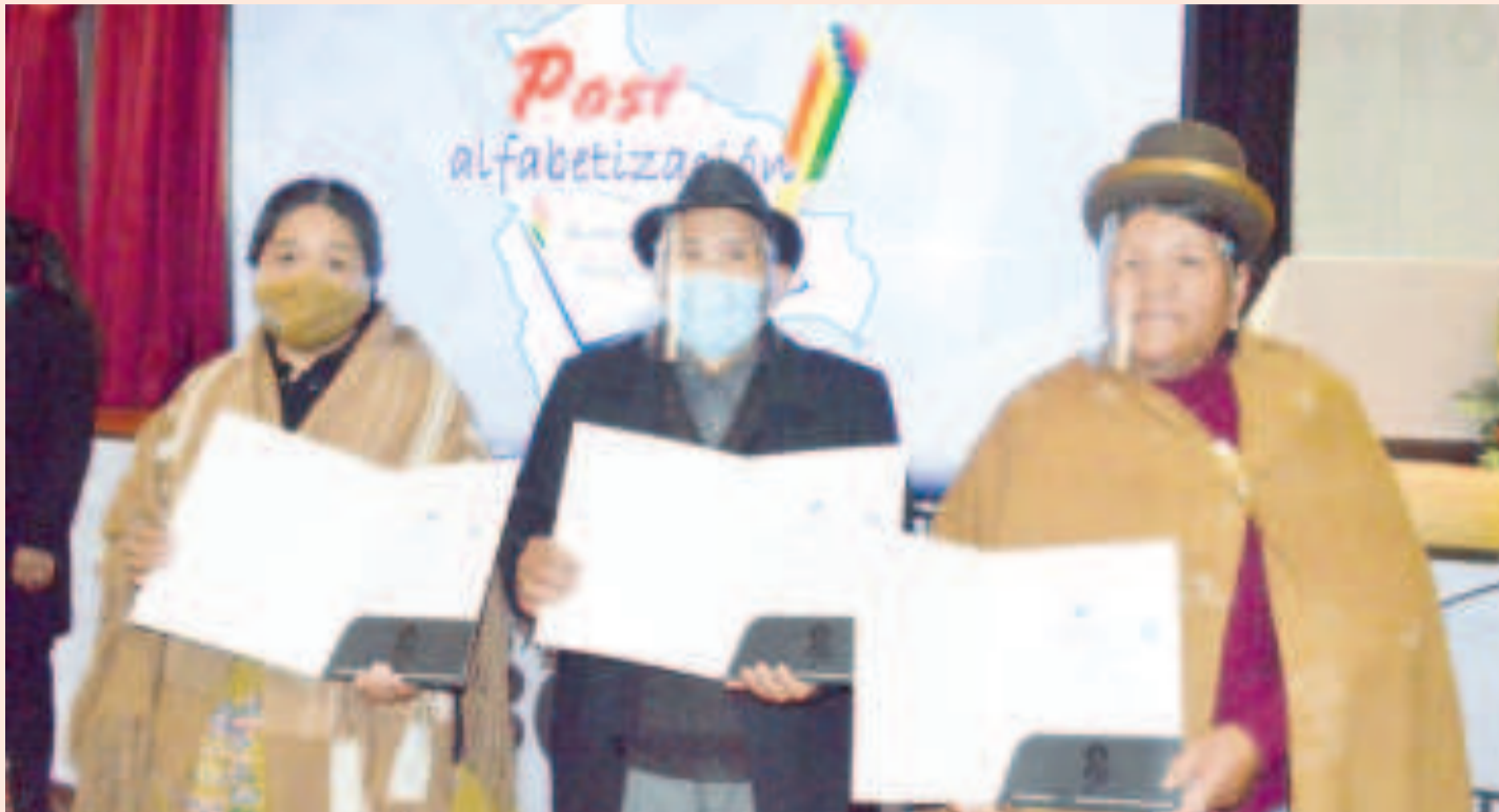
Entrega de certificados a personas adultas mayores que finalizaron sus estudios en posalfabetización.