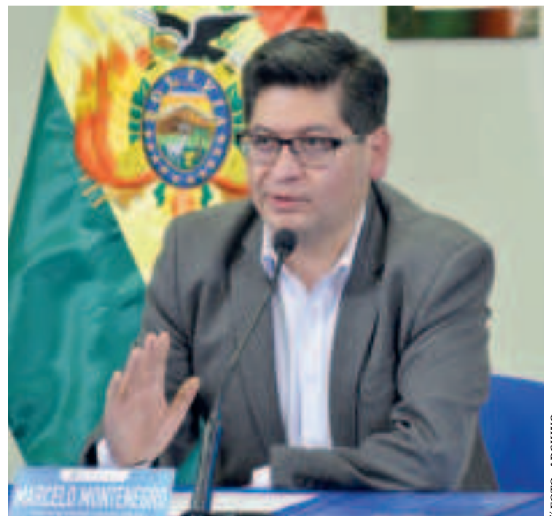
El ministro de Economía, Marcelo Montenegro.

También proyecta un crecimiento del 3,51%, una tasa de inflación del 7,5%, un precio promedio del barril de petróleo de $us 75,3 y el mantenimiento de la subvención a los carburantes, entre otras medidas para fortalecer el aparato productivo, apuntalar la industrialización y cuidar la economía de los bolivianos.