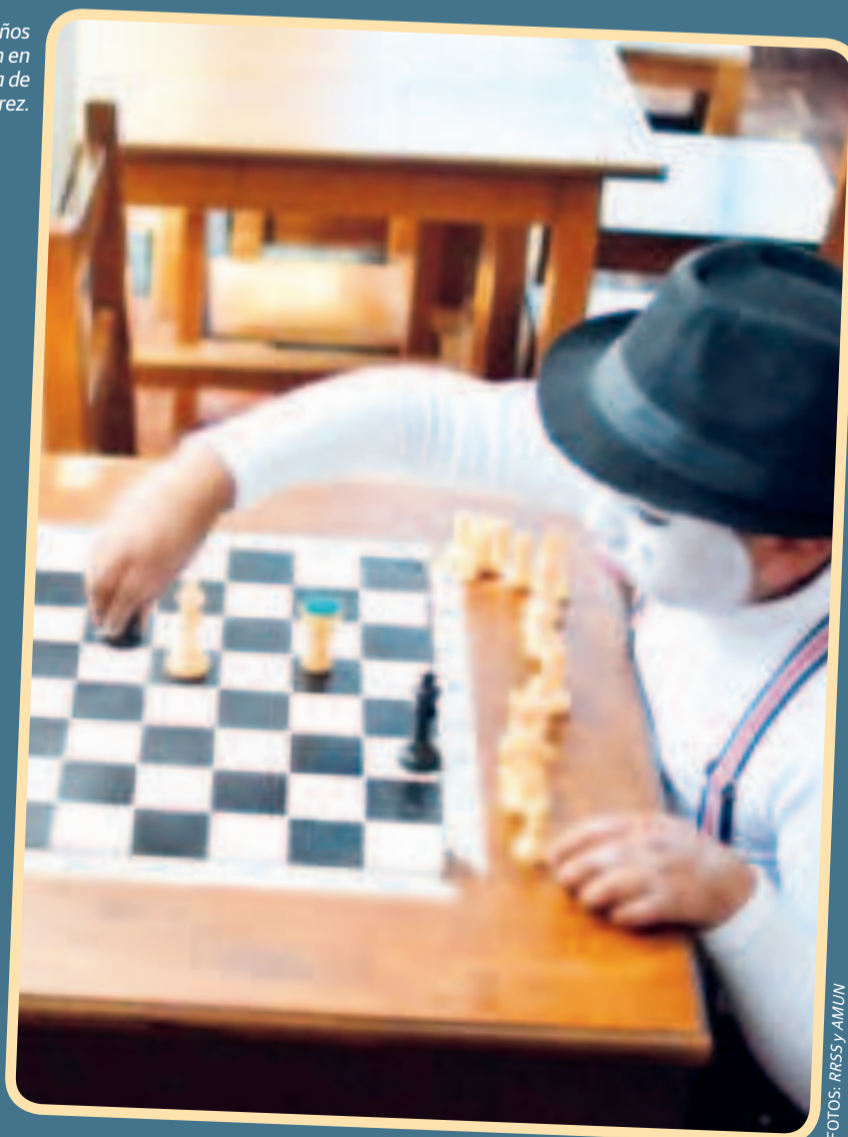
Niños participan en una partida de ajedrez.

Para más detalles e inscripciones, los interesados pueden comunicarse a los números proporcionados o acercarse a la Biblioteca Municipal Andrés de Santa Cruz.