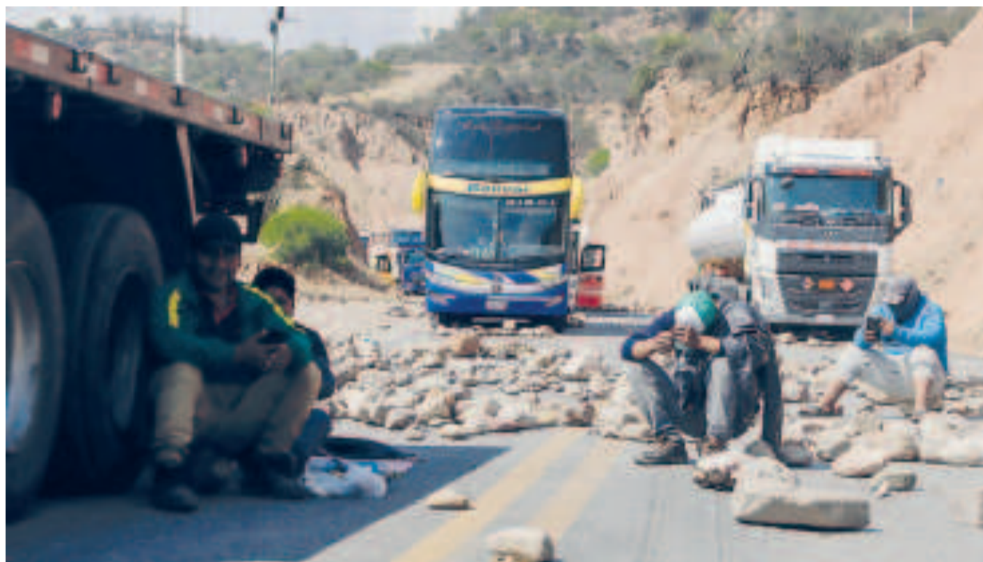
Los bloqueos de los seguidores de Morales en enero y diciembre de 2024 generaron una afectación superior a los $us 3.000 millones.

A pesar de los aumentos, Bolivia mantiene la canasta básica más económica de la región, con un costo de $us 19,40, significativamente menor al de países vecinos.