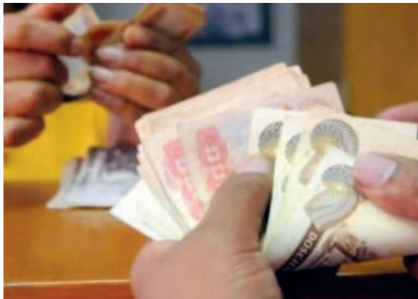
El modelo económico será modificado y adaptado a los desafíos actuales.

“El modelo económico tiene que ser ajustado para mejorar la