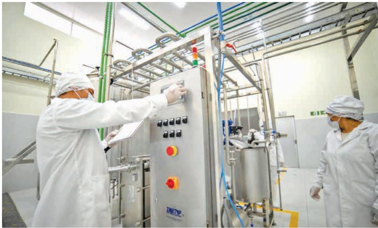
Planta de lácteos implementada por el FPS en Cochabamba. FPS

Cruz y Tarija: plantas de procesamiento adaptadas a las necesidades específicas de las regiones, como productos agrícolas y pecuarios.