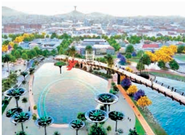
La maqueta del proyecto de la playa Turquesa. GAMC