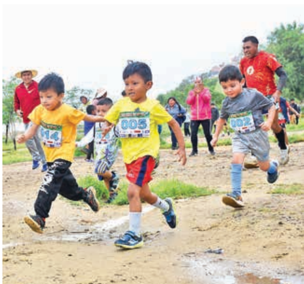
Los pequeños corredores de la categoría Estrellitas.

“Ahora nos enfocaremos en nuestra preparación para las pruebas de pista corta, donde queremos clasificar al Sudamericano y ahí lograr una medalla de oro, para ir al Mundial”, manifestó Parra, quien señaló que ambos competirán en las pruebas de 1.500 y 3.000.