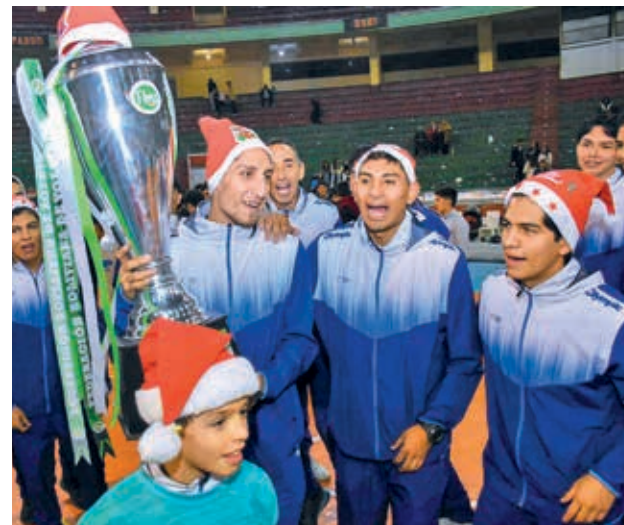
Olympic, campeón de la Liga Superior masculina 2024. APG