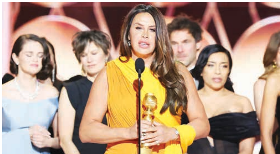
El equipo de la película “Emilia Pérez”, en los Globos de Oro.

Demi Moore reafirmó su valor como actriz tras ganar este domingo con su primer Globo de Oro a mejor actriz en una película de comedia o musical por su interpretación en el suspense “La Sustancia”.