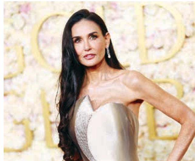
La actriz Demi Moore, Mejor Actriz de Comedia.

“Baby Reindeer” recibió el Globo de Oro a la mejor mini serie de televisión.