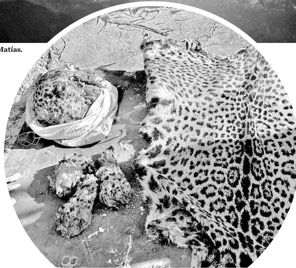
Tráfico de animales silvestres en las áreas protegidas.