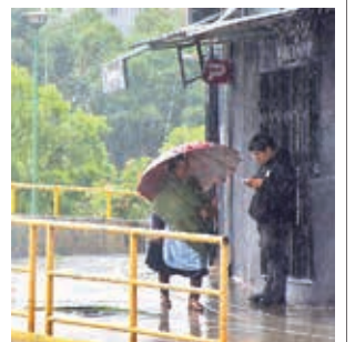
La lluvia en Cochabamba ayer.