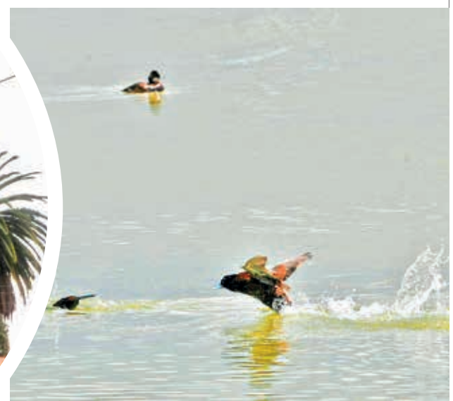
Algunas aves en la laguna Alalay. DANIEL JAMES