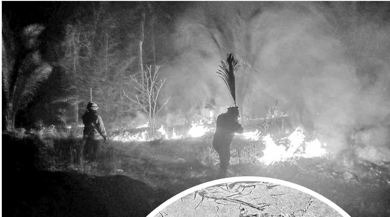
Incendios forestales en San Matías.

La denuncia fue presentada en San Matías con el respaldo de fotografías y de escuchas telefónicas que