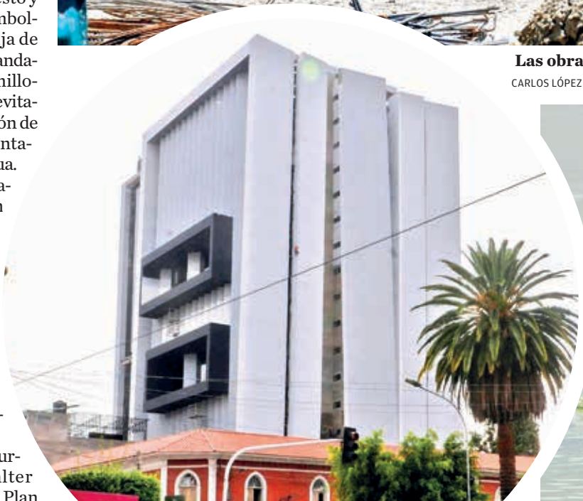
La inspección al edificio municipal en diciembre. H. ANDIA