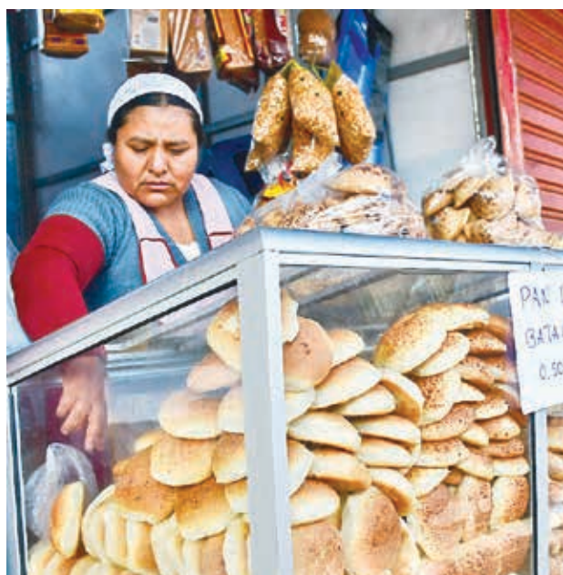
La venta de pan de batalla en la ciudad.