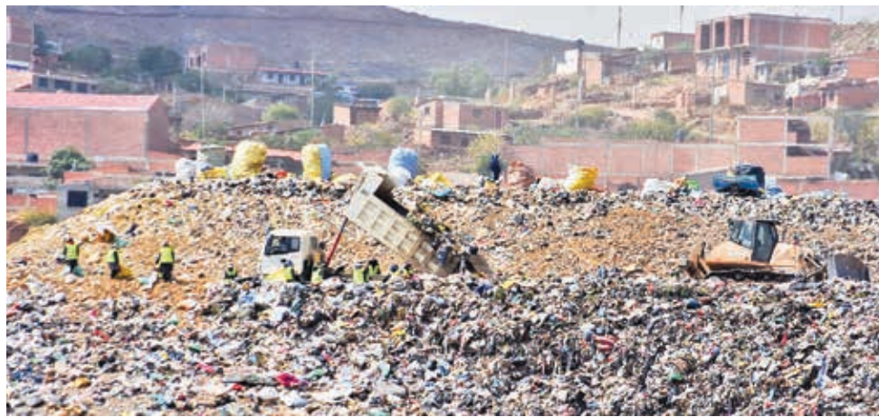
El manejo de la basura en el relleno sanitario de K'ara K'ara, al sur de la ciudad.

Quispe mencionó que la empresa Concordia se hizo cargo del tratamiento de la basura en el relleno desde la primera semana de enero de este año y sostuvo que se alista una inspección al trabajo que realiza para que cumpla con el manejo de los residuos de acuerdo a lo que