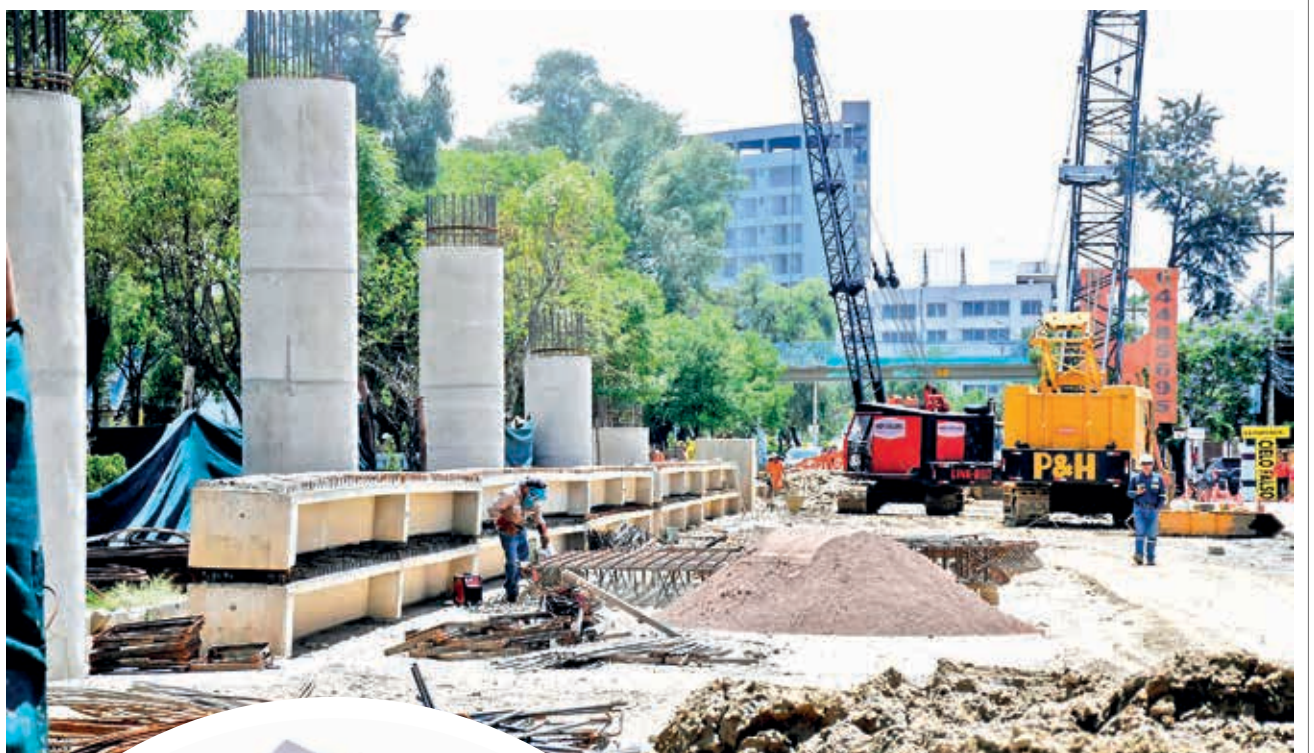
Las obras del distribuidor de la Perú y Blanco Galindo.