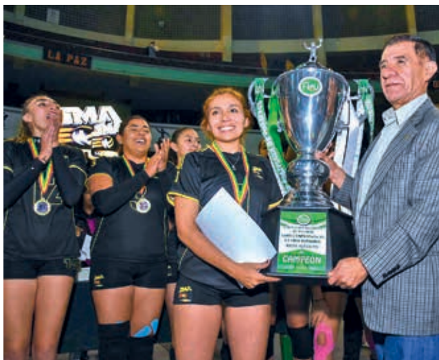
San Martín de Cochabamba, vigente campeón de la Liga Superior femenina 2024.