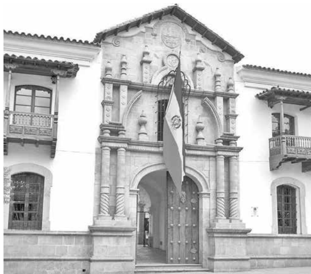
Actividades rumbo al Bicentenario en Sucre.