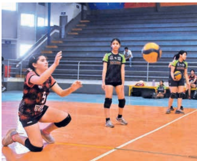
Prácticas de diversas categorías de vóleybol en Cochabamba. JOSE ROCHA