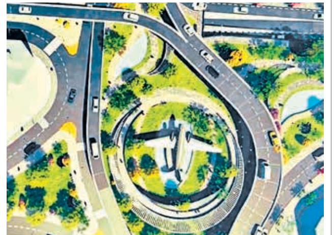
La maqueta del distribuidor vehicular del avión. GAMC