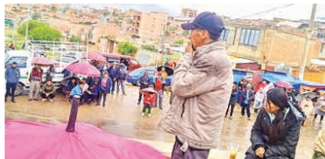
La asamblea de vecinos de la mancomunidad ayer.

El dirigente de la zona indicó que los vecinos se encuen-