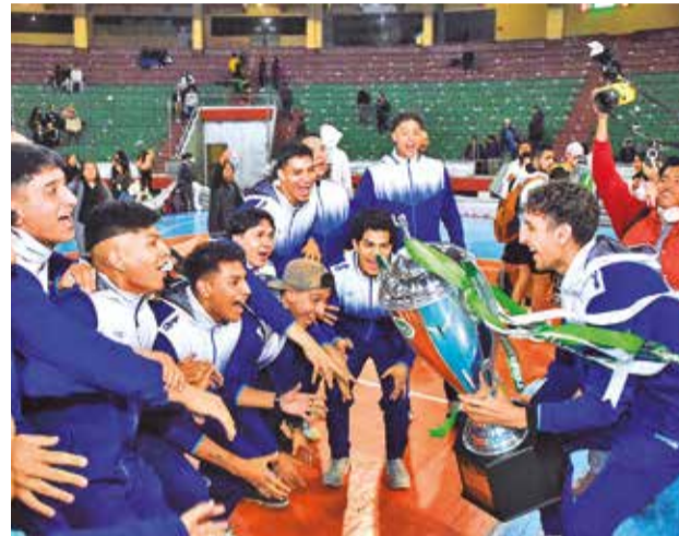
Festejo del club Olympic, campeón nacional de la Liga Superior rama masculina.

Producto de esa competitividad, Cochabamba ha copado las ligas Promocional (juvenil)