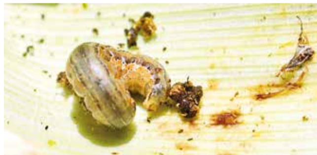
Un ejemplar del gusano cogollero en estado larval.

“Estamos haciendo pruebas para controlarlo. Lo que