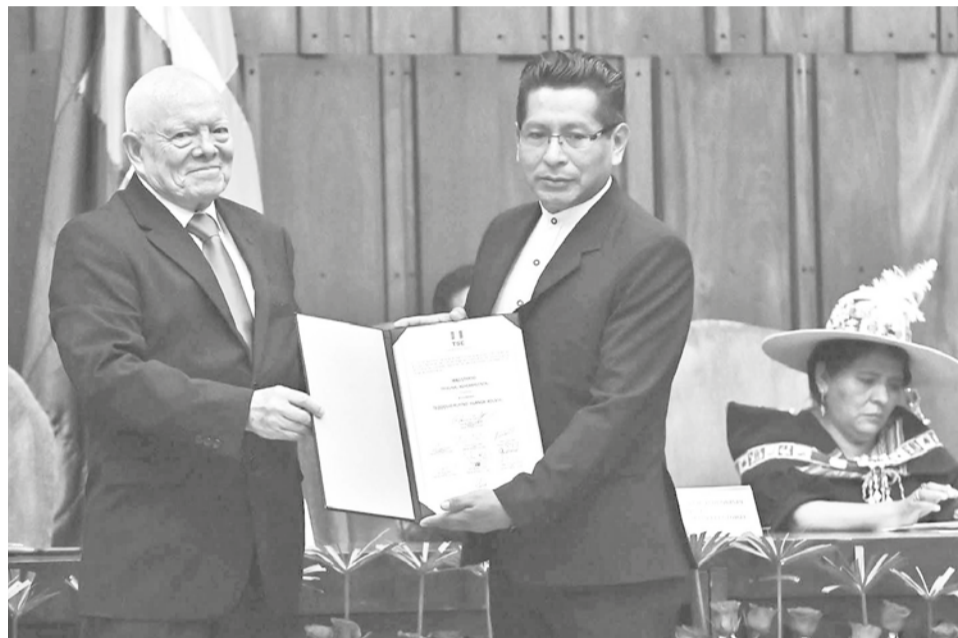
El presidente del TSE, Óscar Hassenteufel, entrega credencial a un magistrado, ayer. APG

"Pasan casi dos meses de la sentencia constitucional referida y no avanzamos ni un milímetro. Lo único que hemos escuchado todo este tiempo han sido cuestionamientos al TSE por no haber desconocido o rechazado la Sentencia Constitucional 0770/2024. Nadie en el país escuchó un pronunciamiento final de la Asamblea, un pronunciamiento firme respecto esa sentencia. Ni siquiera se dio curso a un proyecto de ley corta propuesta por TSE", declaró.