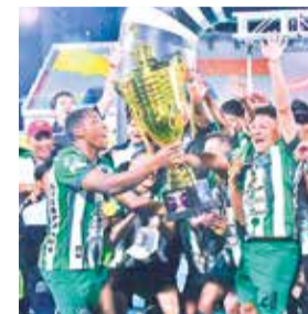
Celebración de Municipal Tiquipaya. D.J.