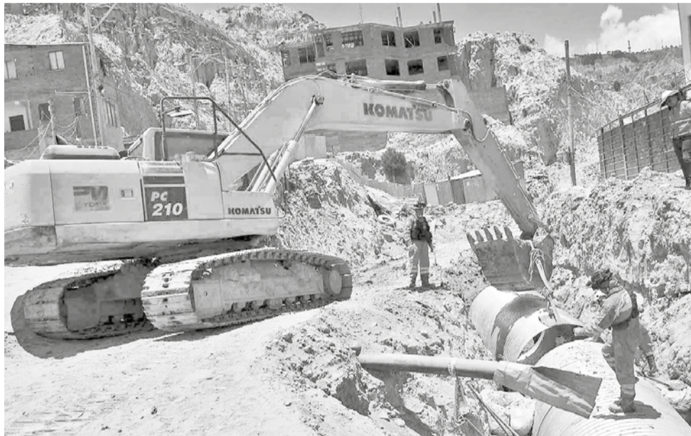
Trabajos de limpieza en la zona afectada por la mazamorra en Bajo Llojeta.

El Servicio Nacional de Meteorología e Hidrología (Senamhi) informó que para el inicio del año 2025 se esperan lluvias en al menos seis departamentos del país. Según el informe brindado, para este miércoles 1 de enero se esperan lluvias y tormentas eléctricas en Cochabamba, Pando, Beni, Chuquisaca, Potosí y Tarija. Sin embargo, de acuerdo al reporte, en Cochabamba los próximos días las temperaturas se mantendrán elevadas, incluso superando los 30 grados.