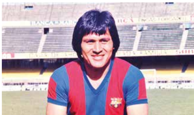
El exfutbolista Hugo "Cholo" Sotil (+).

1947) fue uno de los principales referentes del fútbol incaico de los años 60 y 70, destacando además en la selección peruana que fue campeona de la Copa América 1975 y animadora en los Mundiales México 1970 y Argentina 1978, este último con presencia de la Blanquirroja en instancias decisivas.