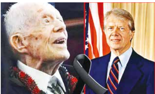
Jimmy Carter poco antes de su muerte y hace 40 años.

El primer ministro japonés, Shigeru Ishiba, como el Gobierno surcoreano resaltaron también el trabajo de Carter.