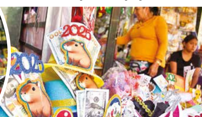
Capibaras y bitcoins destacan entre las novedades.

najes de películas, escudos de equipos de fútbol, entre otros, destacan en la oferta variada de cotillones que vende en las tiendas de la calle 25 de Mayo, donde se concentra la comercialización de estos elementos tradicionales para recibir el Año Nuevo.