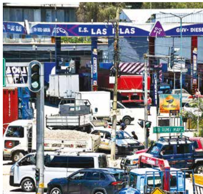
Fila de vehículos en un surtidor en Cochabamba. C. LÓPEZ

“Estas acciones son parte de un compromiso integral por proteger el mercado interno y fortalecer nuestra seguridad alimentaria frente al contrabando y la especulación”, concluyó Mollinedo.