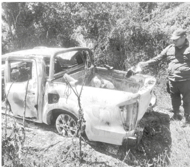
La camioneta donde hallaron los tres cadáveres. RR55

confirmó que las tres personas vivían en Santa Cruz, pero no se logró confirmar el tipo de actividad laboral que tenían.