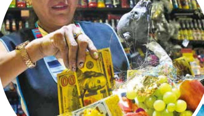
La preparación de una q'oa con frutas y figuras blancas.