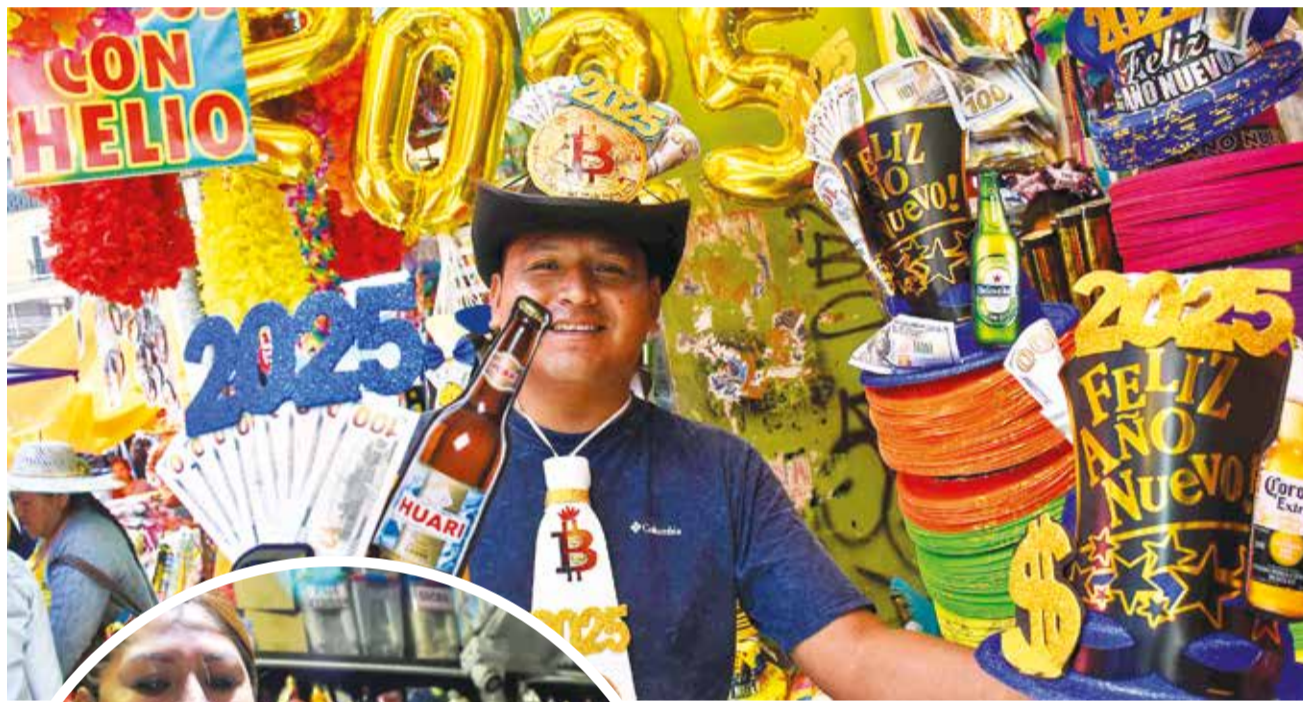
Cotillones son elementos para atraer la prosperidad.

Celebración. Las tradiciones se mantienen para recibir el Año Nuevo. Las fiestas atraen por la presencia de grupos musicales de moda