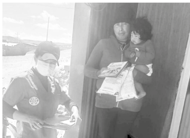
Campaña contra la meningitis. MIN SALUD

Según Bilbao, el menor llegó con un cuadro de sepsis, lo que hizo sospechar a los médicos que se trataba de meningitis. Ante ello, se activaron los protocolos de profilaxis para los familiares cercanos.