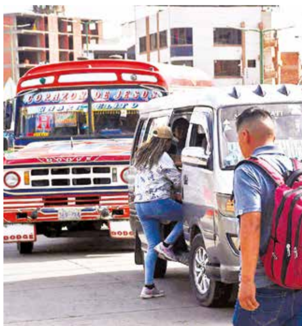
El servicio de transporte público en la ciudad.