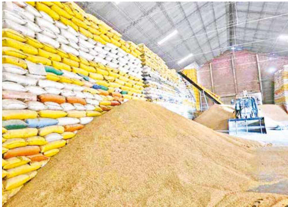
Acopio de arroz en un ingenio ubicado en el municipio cruceño de Montero.

El control abarcará todas las etapas de la cadena productiva, desde el traslado del grano a los silos e ingenios hasta su distribución en mercados. Además, el Comando