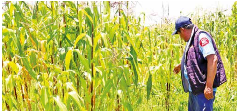
Un productor muestra la afectación de la plaga en las plantaciones de maíz. GAM DE CLIZA

“Estamos viviendo una situación crítica, toda la zona sur de Cliza ha sido afectada por este gusano cogollero en estado larval. La presencia de esta plaga hasta ahora es en 100 hectáreas y en tres distritos, pero está avanzando al