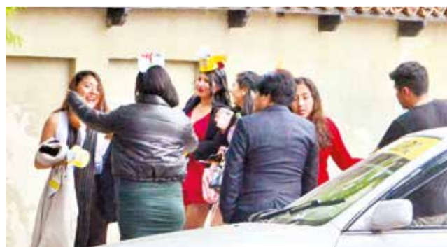
Guardias municipales controlan una fiesta.

El intendente municipal de Cochabamba, Enrique Navia, informó ayer que el incumplimiento del horario estableci-