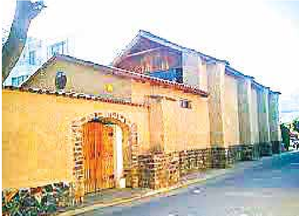
La Troje Arte y Cultura, en la avenida Víctor Uztariz.