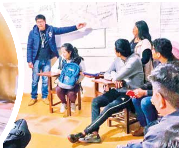
El maestro se traslada a las provincias para impartir los contenidos del plan de estudios.