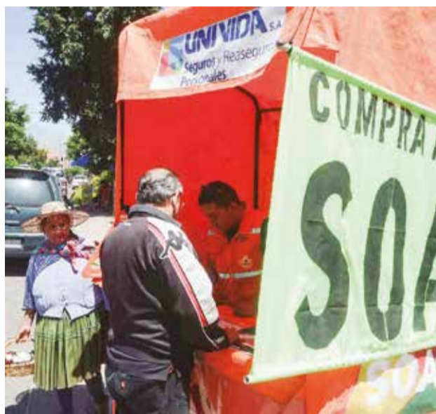
Personal de Univida realiza venta del SOAT, ayer.

El SOAT 2025 ofrece una cobertura de Bs 24.000 por persona accidentada para gastos médicos y Bs 22.000 en casos de fallecimiento o incapaci-