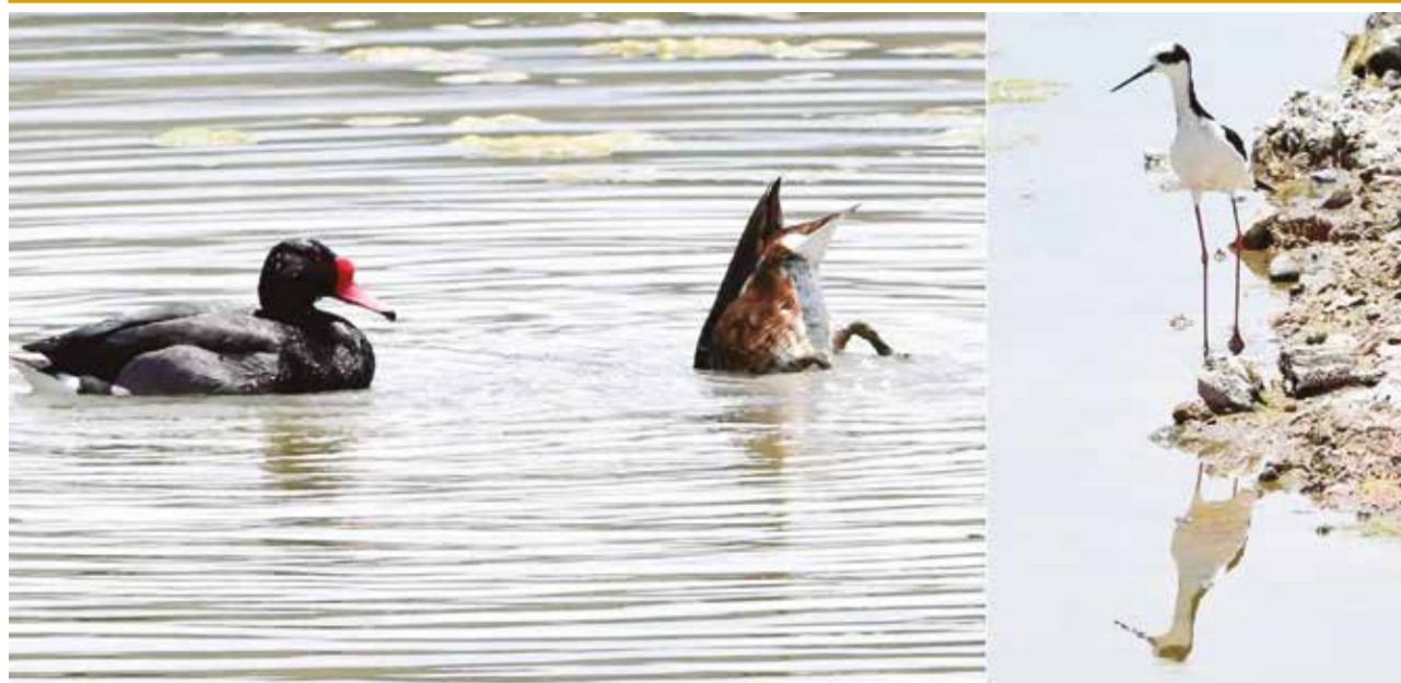
Una pareja de patos picazo (Netta peposaca) y una cigüeñuela en la laguna Alalay, ayer. DANIEL JAMES