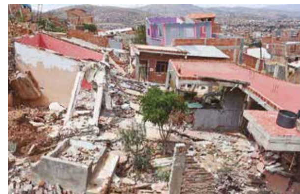
Casas afectadas por en Takoloma. JOSE ROCHA