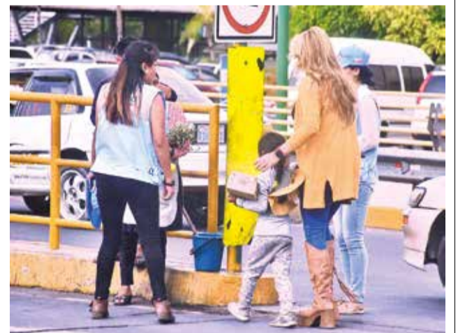
La atención en oficinas de la Defensoría de la ciudad.