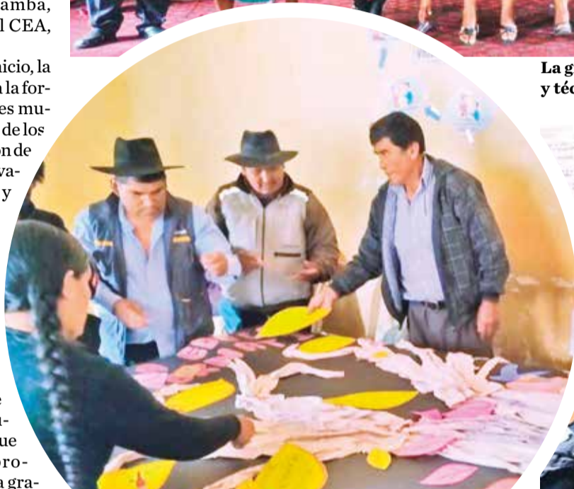
Las clases se pasan una o dos veces en la semana en ambientes municipales.