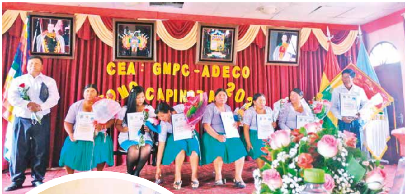
La graduación de autoridades y líderes como bachilleres y técnicos medios en Capinota.

El director del CEA destacó que cada gestión se titulan un promedio de 20 a 30 autoridades mujeres, quienes aprovechan los conocimientos que aprenden sobre liderazgo, normativa, planificación y administración de recursos económi-