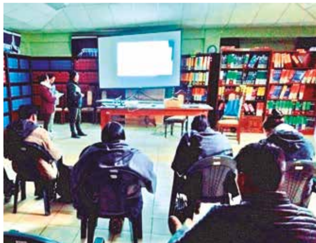
El aula y materiales son garantizados por municipios.

Graduados. El Centro de Educación Alternativa gradúa cada año un promedio de 20 a 30 estudiantes mujeres. Las clases se pasan en horarios y días que permiten alternar el estudio con el trabajo