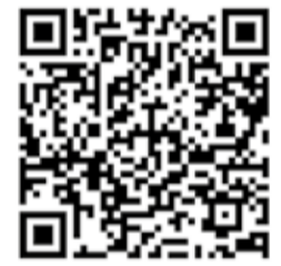
Más información en este enlace

El objetivo de este proyecto es reducir la brecha digital en Bolivia a través de los CCIT, asegurando el acceso equitativo a las TIC, promoviendo la inclusión digital y fortaleciendo la independencia tecnológica, con el objetivo de fomentar la igualdad, el desarrollo y la integración tecnológica en las regiones más vulnerables del país.