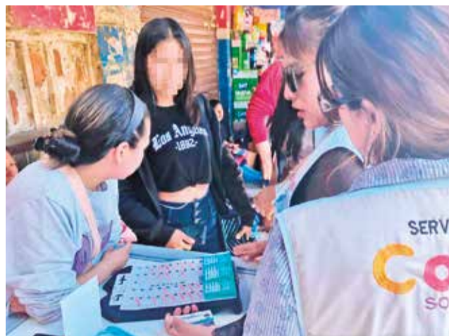
Un operativo realizado por personal de la DNA. LOS TIEMPOS

El informe de casos atendidos por la Defensoría de la Niñez y Adolescencia (DNA) en 2024. LOS TIEMPOS