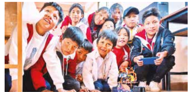
Niños de Jarana, Potosí, se divierten con un autorrobot.

La Agencia de Gobierno Electrónico y Tecnologías de Información y Comunicación (Agetic) ha implementado en total de 26 Centros de Capacitación e Innovación Tecnológica (CCIT) en todo el territorio de Bolivia, con el 90 por ciento de los centros ubicados en áreas rurales.