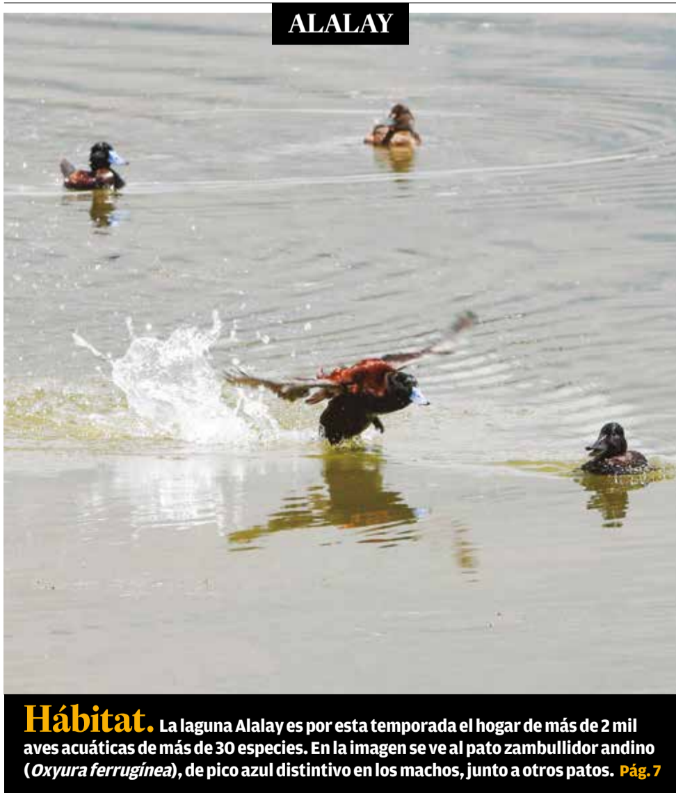
Hábitat. La laguna Alalay es por esta temporada el hogar de más de 2 mil aves acuáticas de más de 30 especies. En la imagen se ve al pato zambullidor andino ( Oxyura ferrugínea ), de pico azul distintivo en los machos, junto a otros patos. Pág. 7

Los menores de edad, de 4 a 10 años, son los que más sufren agresiones físicas y psicológicas. En tanto, los adolescentes son vulnerables a la violencia sexual. Pág. 6