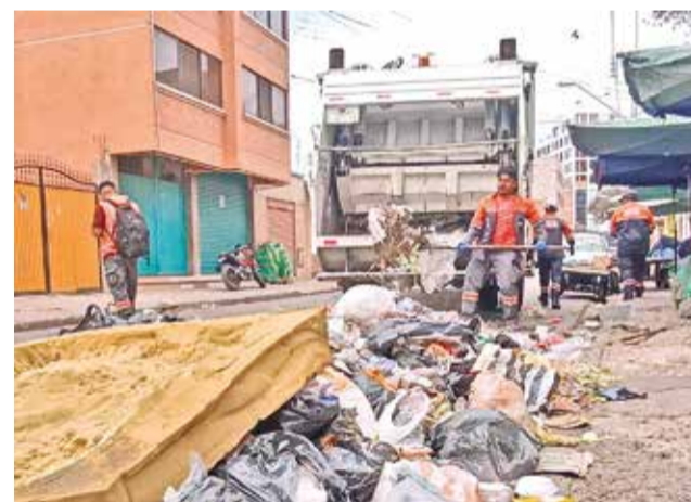
El recojo de basura a cargo de EMSA.