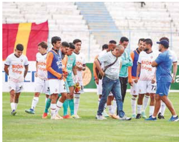
Salida de los jugadores de Royal Pari de la cancha del estadio Jesús Bermúdez.

En el reglamento por los partidos del ascenso/descenso indirecto, el tribunal asignado para estos temas es el TD, pero el Código Disciplinario menciona al TDD. También está contemplado el TRD, pero este solo en cuanto controversias de contratos y otros de jugadores.