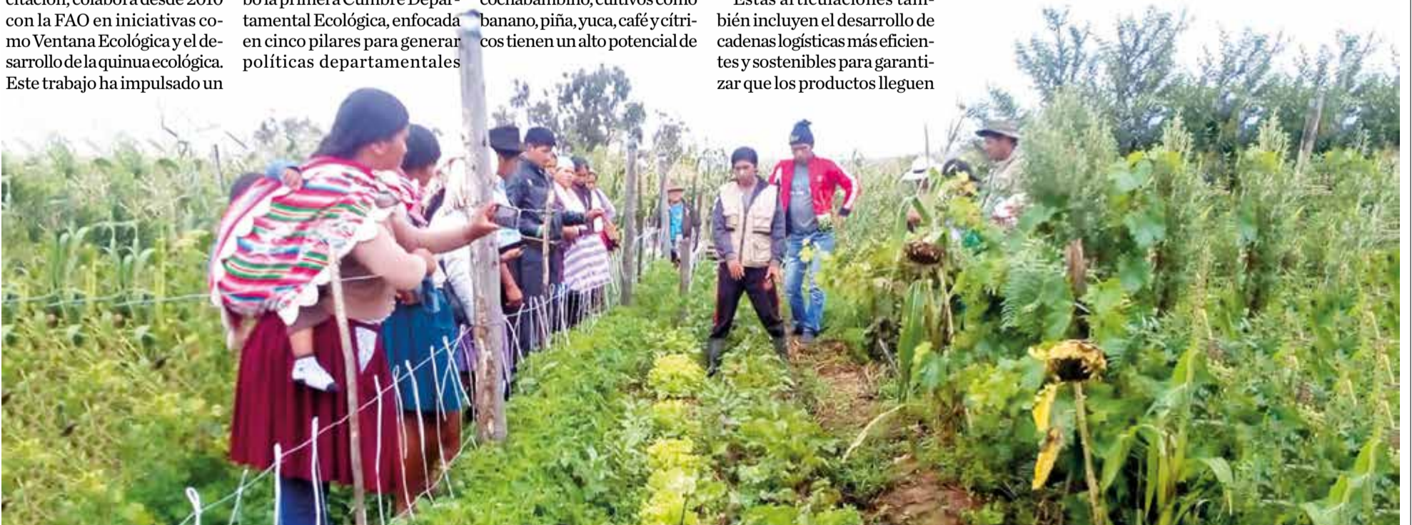
Un huerto agroecológico en el valle bajo del departamento de Cochabamba. FUNDACIÓN AGRECOL ANDES

Estos esfuerzos también incluyen proyectos de investigación aplicada para desarrollar nuevas variedades de cultivos adaptados a las condiciones locales, aumentando la resiliencia del sector ante el cambio climático. La inclusión de tecnologías como drones para monitoreo de cultivos y sensores de humedad también está en consideración para modernizar las prácticas agrícolas.