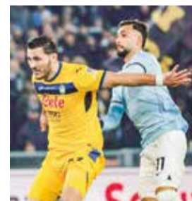
Cotejo Lazio vs Atalanta, ayer.