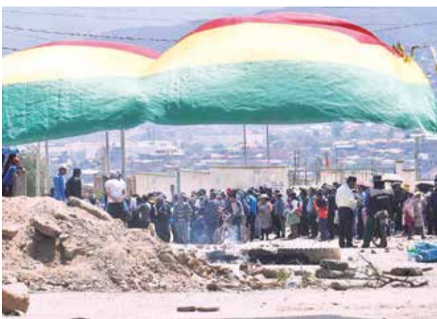
Un bloqueo de los vecinos de la zona de K'ara K'ara.

Componente 1 Cierre Técnico en Kara Kara, el concesionario se hace responsable en el corto plazo de la reconformación de las celdas de residuos y de la reconformación final transitoria en Kara Kara hasta la estabilización e inicio de la cobertura de cierre técnico. También, de manera similar el concesionario se hace responsable del cierre técnico de las celdas en Kara Kara y del manejo de los pasivos ambientales, del mantenimiento de la infraestructura existente y la que se implemente durante la vigencia del contrato de concesión. También, se tiene como objetivo principal el convertir del sitio en un espacio que promueva la sostenibilidad y la innovación ambiental, mediante la creación de un Parque Tecnológico Ambiental, en el que se debe considerar el uso de suelo de bosque forestal urbano, las condiciones establecidas del PED-T33 y los espacios disponibles, entendiendo que las macroceldas han llegado a su vida útil (en cuanto a volumen y altura).