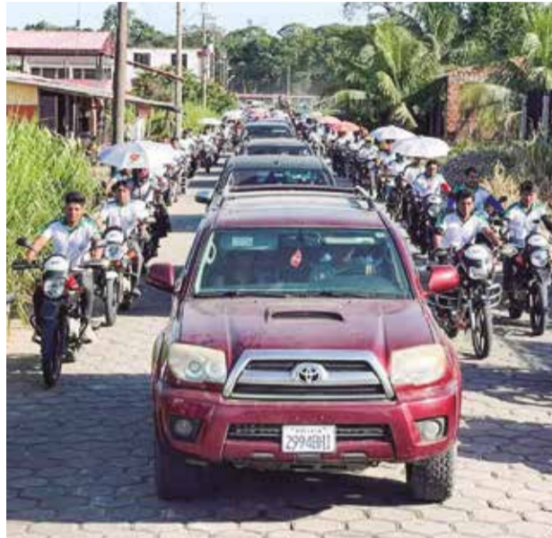
La caravana de vehículos que escolta a Evo Morales. RKC

"Solo están desgastando al hermano Andrés, no cometan ese error. Hemos tenido varias reuniones pequeñas y se ha aclarado muy bien", expresó Morales, al tiempo que reafirmó su intención de liderar el proyecto político del Movimiento Al Socialismo (MAS).