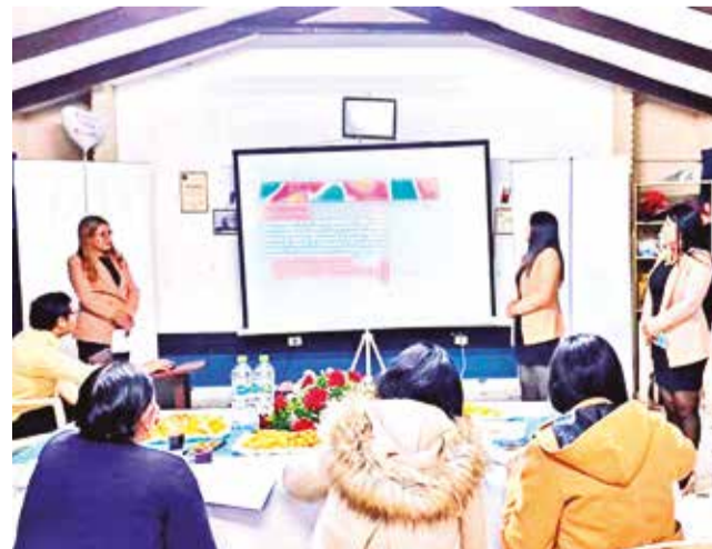
La defensa de un trabajo para salir técnico medio. CEA

cos para mejorar el ejercicio de sus funciones en sus municipios.