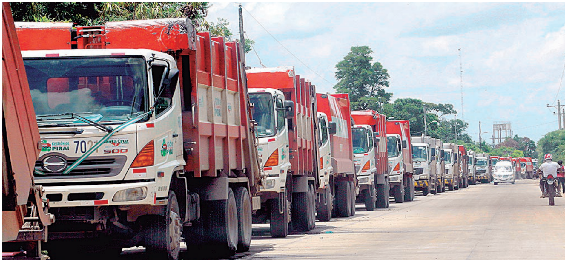
Durante la gestión 2024 se han registrado bloqueos en el vertedero municipal San Miguel de los Junos, lo que dificultó el ingreso de camiones recolectores

nanciero del Gobierno Municipal, como también el ordenamiento del transporte y su transformación a un sistema integral.