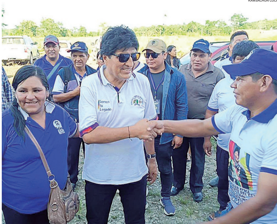
El expresidente reside en el trópico de Cochabamba donde está su base política más leal