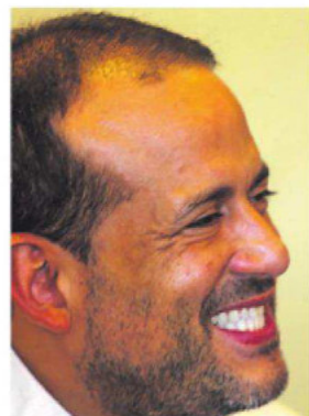
Luis Fernando Camacho, uno de los artífices de la unidad opositora