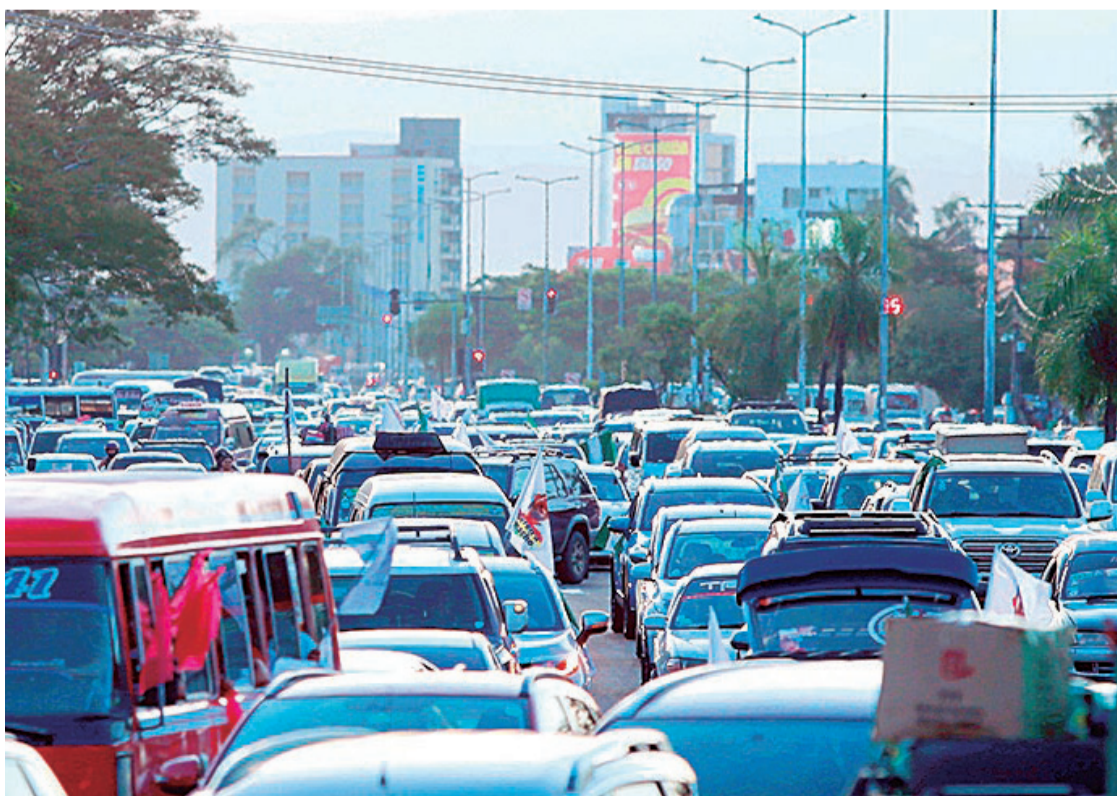
El caos vehicular que se genera en distintos puntos de la capital cruceña

El burgomaestre adelanta que se prevé reducir personal y eliminar al menos dos secretarías para poder