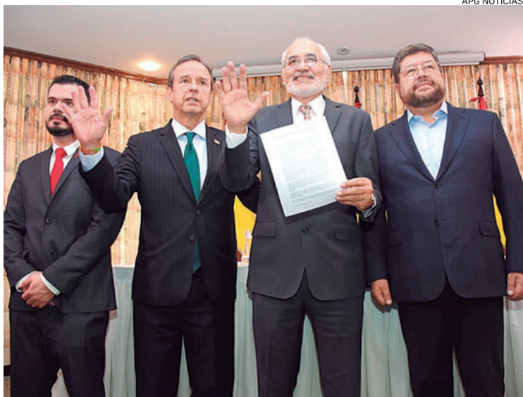
Suárez firmó el acuerdo de "unidad" a nombre de Camacho

Camacho sufrió un deterioro rápido debido al estrés físico y emocional del encarcelamiento.