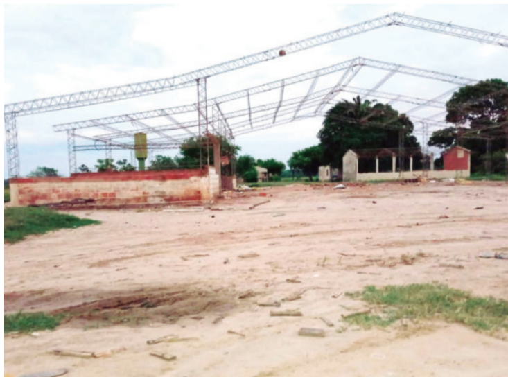
La propiedad San Fernando, en el municipio de Guarayos, fue avasallada

La Policía inició las investigaciones y presume que por detrás figuran los cabecillas de los ava-