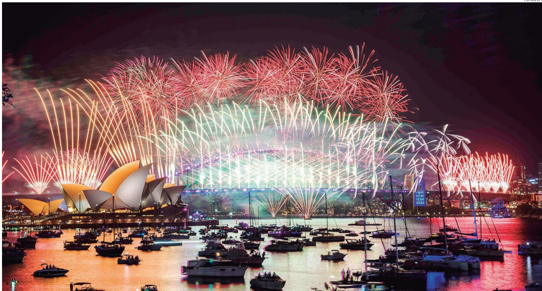
Australia dio la bienvenida al Año Nuevo 2025 con un espectacular show de fuegos artificiales junto a la Ópera de Sídney. Miles de turistas estuvieron presenciando el espectáculo