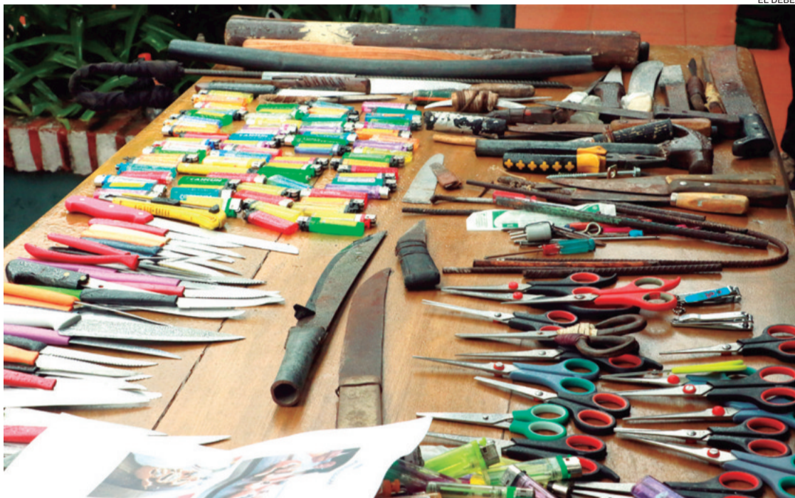
En anteriores requisas, la policía intervino numerosos cuchillos y elementos punzocortantes

La Policía anunció que se dará a conocer un informe detallado