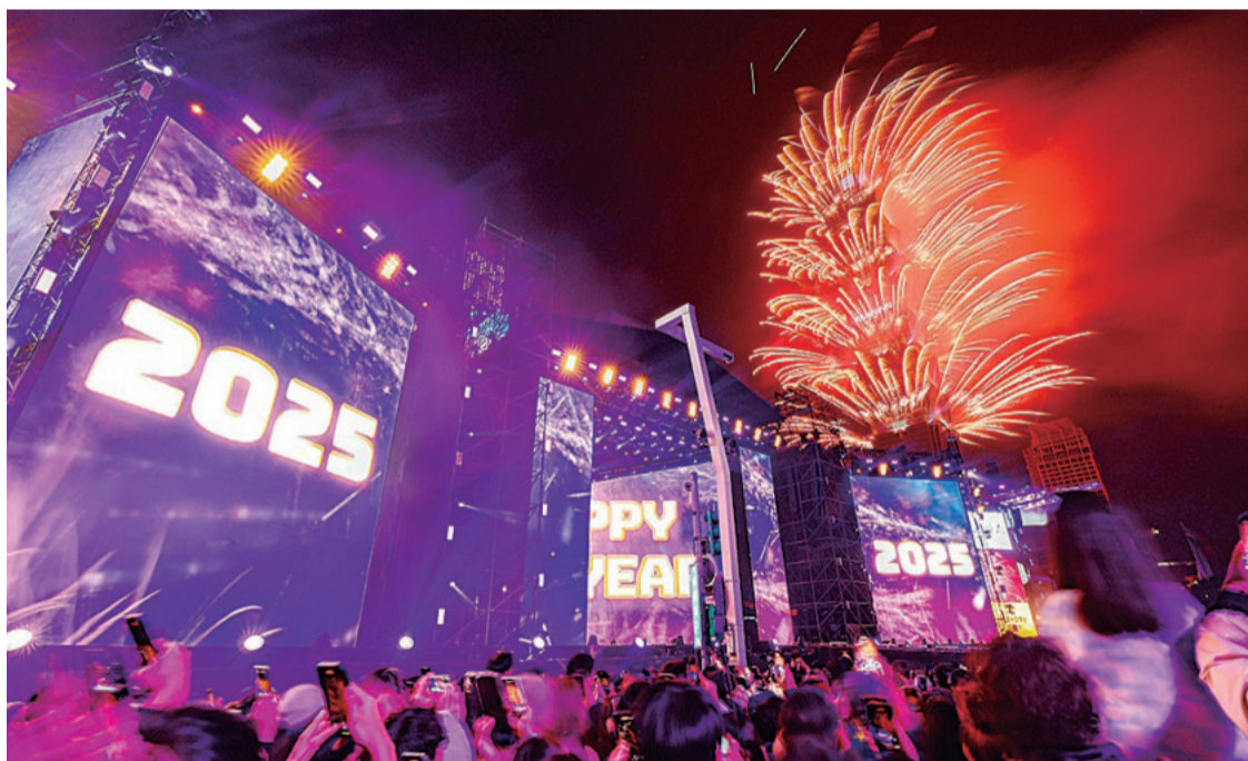
Una multitud celebra la llegada del nuevo año en Taipéi (Taiwán)

El mundo comenzó los festejos de Año Nuevo, con espectáculos de fuegos artificiales en Nueva Zelanda y Australia