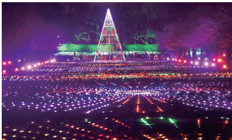
Millones de luces multicolores encendidas esperando el nuevo año en Nueva York