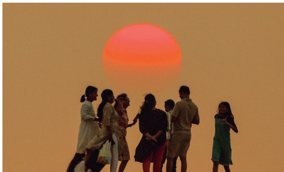
Jóvenes dan la bienvenida al 2025 en una playa de Mumbai (antigua Bombai)