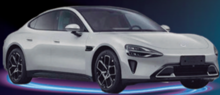
2024 XIAOMI SU7 AUTONOMÍA 800 KM