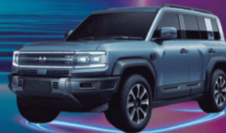
2025 BYD LEOPARD 8 VEHÍCULO HÍBRIDO