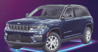
2023 JEEP GRAND CHEROKEE 4XE VEHÍCULO HÍBRIDO