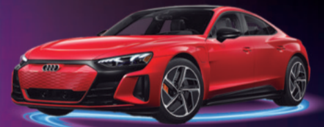
2023 AUDI E-TRON GT AUTONOMÍA 488 KM