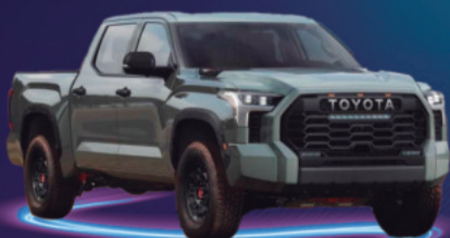
2024 TOYOTA TACOMA VEHÍCULO HÍBRIDO