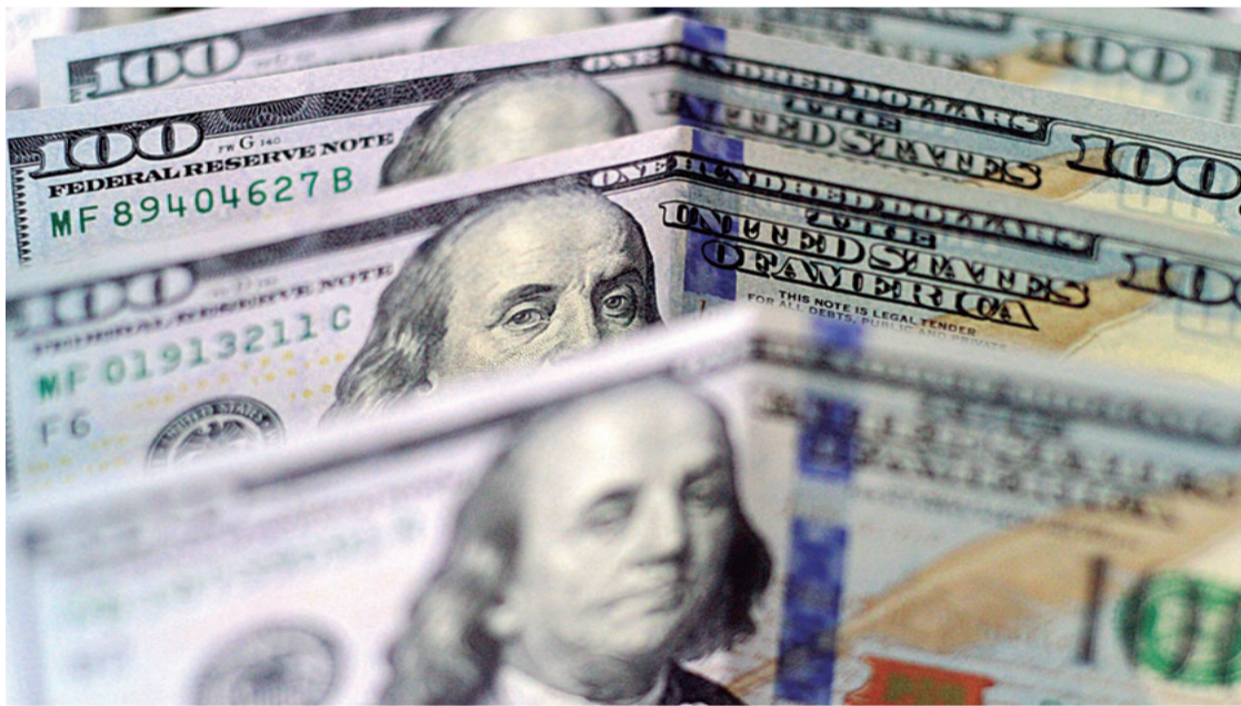
En 2024, el mercado paralelo del dólar se fue consolidando. En agosto llegó a cotizar alrededor de Bs 15