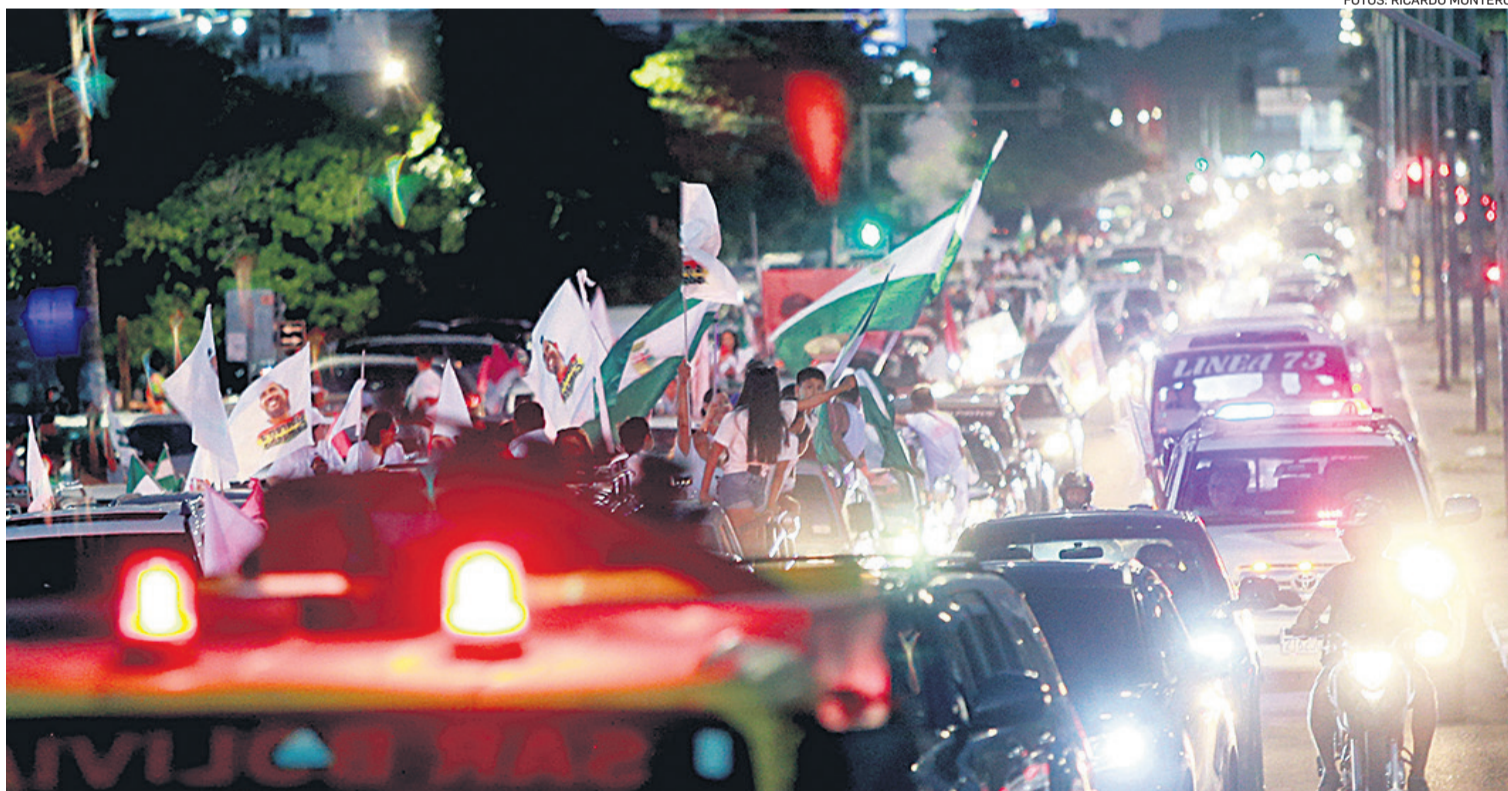
La caravana avanzó hasta llegar al lugar donde hace dos años detuvieron a Camacho