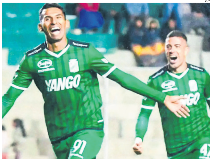
Oriente Petrolero tuvo un 2024 para el olvido. Los hinchas esperan mejores días en 2025

Hace unos días, el actual directorio frenó una quinta de tres puntos para el 2025 por una demanda realizada por el DT Víctor Hugo Antelo; se le canceló el 50% de los meses de febrero y marzo,