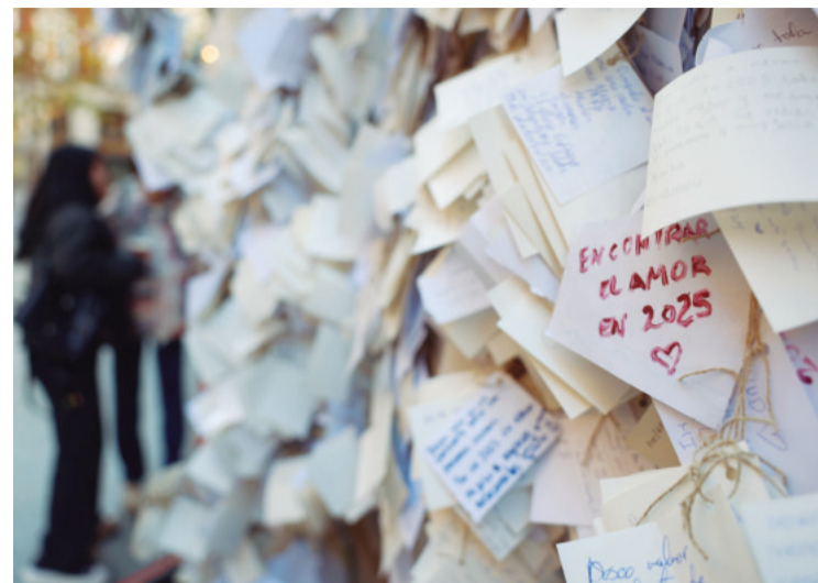
El Año Nuevo llega cargado de buenos deseos en todo el mundo