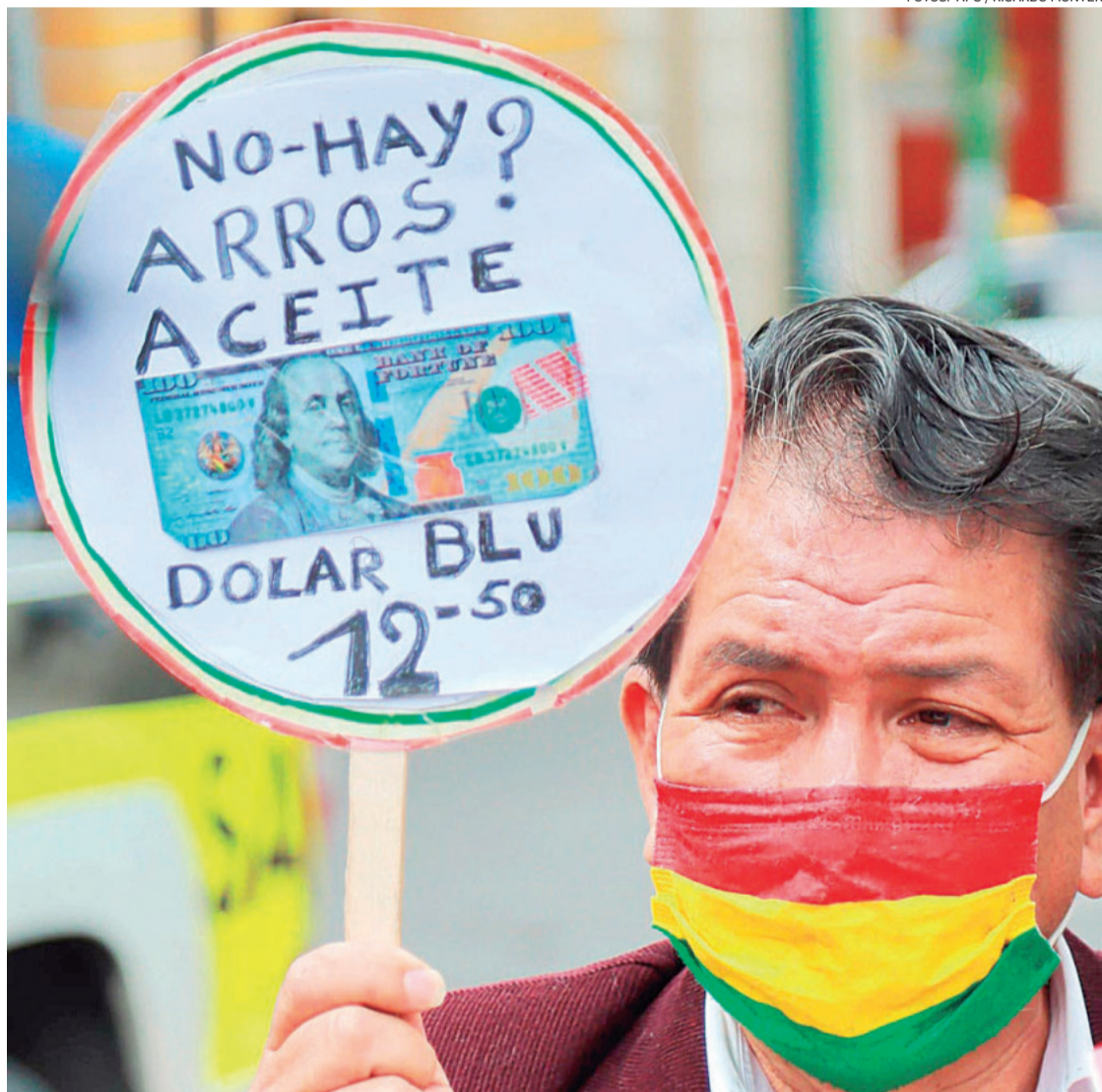
La falta de la divisa estadounidense ya se hace sentir en las finanzas personales de la población

“En 2023 la devaluación del boliviano estuvo por el orden del 9%, hablo del tipo de cambio paralelo. Se arrancó con un dólar 6,96 para cerrar a Bs 7,50 y Bs 7,70. Durante este año se empezó con ese valor y lo estamos cerrando con Bs 11,10 y Bs 11,30, eso significa una devaluación de un 48%. Y que en algunos momentos puntuales se su-