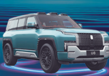
2024 YANG WANG U8 VEHÍCULO HÍBRIDO