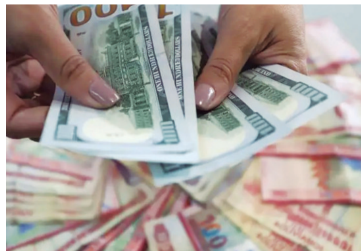
Recomiendan planificar gastos para que alcance para el ahorro

manifiesta que el inicio de año puede ser oportuno para trazar metas personales, como un posgrado, una profesión, un viaje, y hasta un cambio en los hábitos o bajar de peso. Para ello, necesario trazar un plan que aterrice en objetivos concretos, alcanzables, cuantificables y medibles para tener resultados.