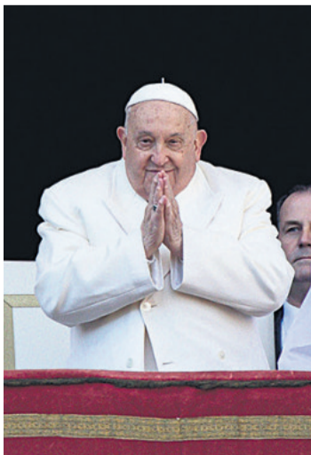
El pontífice le habló a los peregrinos que acuden a Roma

"La esperanza y la bondad tocan el corazón mismo del Evangelio y nos indican el camino a seguir en nuestro comportamiento. Un mundo lleno de esperanza y bondad es un mundo más bello", dijo el papa./EFE.