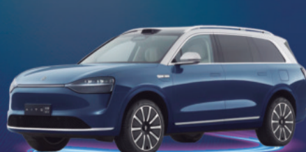
2025 HUAWEI AITO M9 VEHÍCULO HÍBRIDO