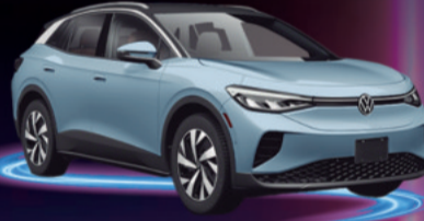
2024 VOLKSWAGEN ID.4 AUTONOMÍA 600 KM