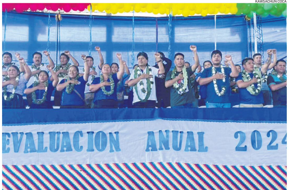
Andrónico Rodríguez participó de la evaluación de fin de año de las seis federaciones del trópico

La radio Kawsachun Coca publicó imágenes de la salida de Evo Morales desde la localidad de Lauca Ñ a Chimoré. Morales subió a una vagoneta guinda y por delante y detrás había varios vehículos acompañando al exmandatario. A ambos costados se organizó la guardia sindical que seguían el camino del líder cocalero en motocicletas. Cuando llegó a la sede del evento, Morales descendió del motorizado y fue ovacionado por sus bases. Se vio también a los senadores Andrónico Rodríguez y Leonardo Loza.