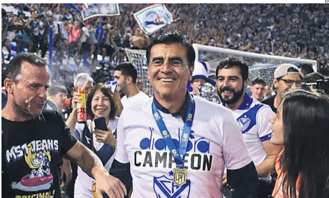
Gustavo Domingo Quinteros viene de coronarse campeón del fútbol argentino. También fue campeón en Bolivia, Ecuador y Chile

Antes de dirigir a Vélez este año, entrenó al chileno Colo Colo por cuatro temporadas. También pasó por Tijuana en México, Universidad Católica en Chile, Al Nassr de Arabia Saudita y Al Wasl de Emiratos Árabes Unidos, Emelec en Ecuador y varios