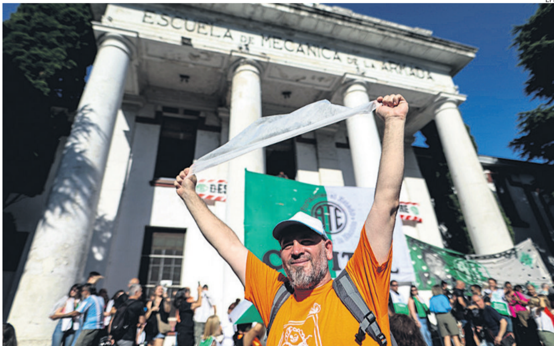
Activistas se manifiestan en frente de lo que fue un centro de tortura durante la dictadura

Las Abuelas de Plaza de Mayo se sumaron a la protesta al anunciar este viernes que encontraron al "niño 138" apropiado ilegalmente durante la última dictadura militar argentina, al señalar que los organismos que integran la Secretaría de DDHH "fueron instrumentos indispensables" para resolver