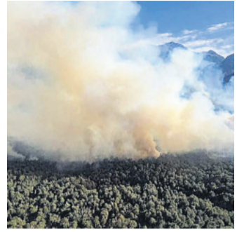
Un incendio en la Patagonia

El Juicio a las Juntas de 1985 condenó a los mayores jefes de la dictadura.