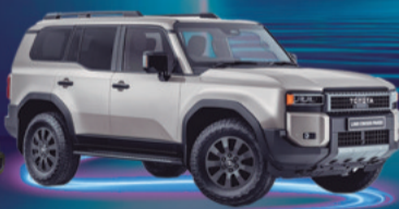
2024 TOYOTA LC PRADO VEHÍCULO HÍBRIDO