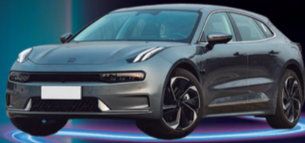
2024 ZEEKR 001 AUTONOMÍA 705 KM