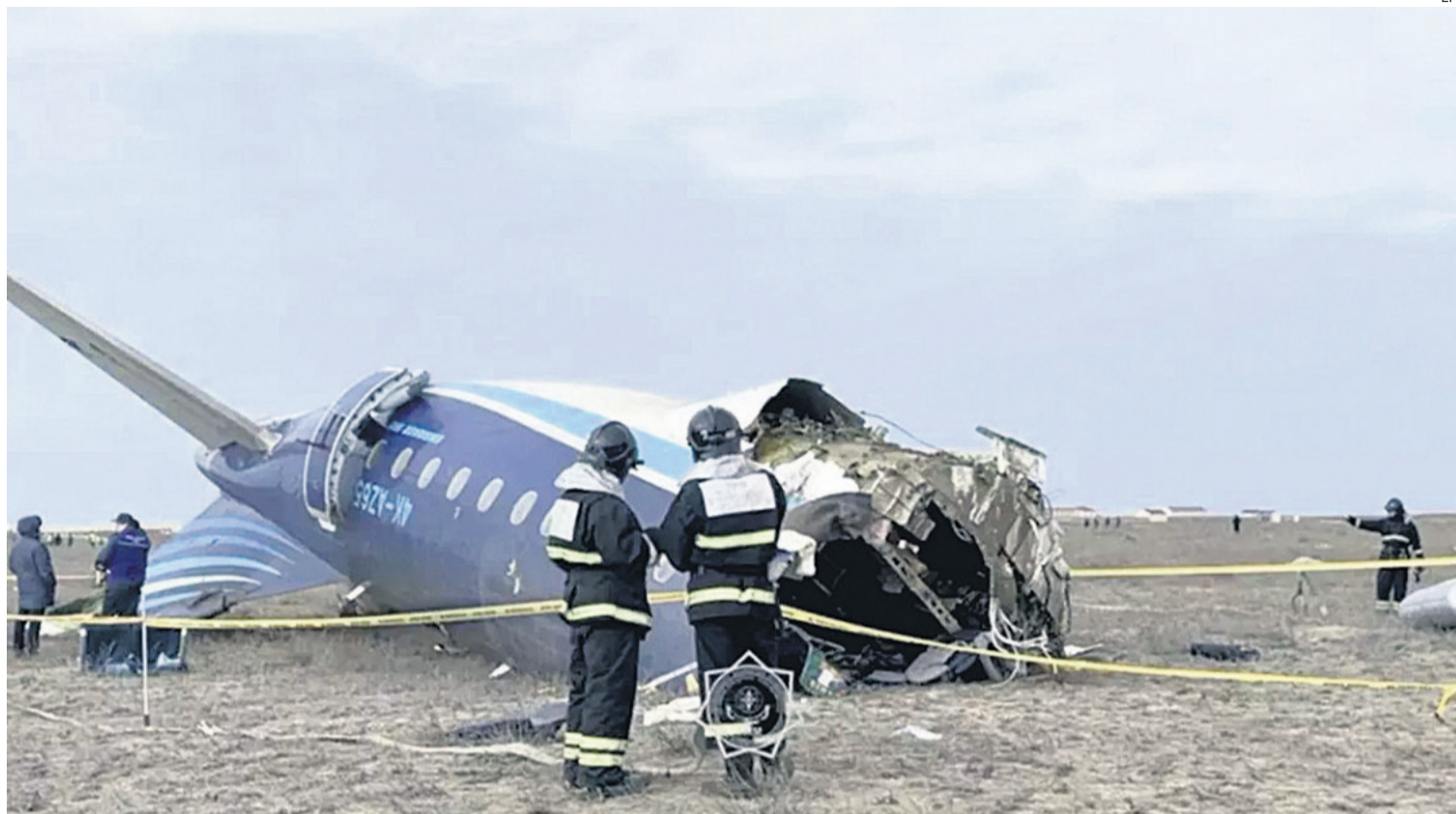
El vuelo J2-8243 viajaba desde Bakú a Grozni, la capital regional de la república rusa de Chechenia, cuando giró hacia Kazajistán y se estrelló