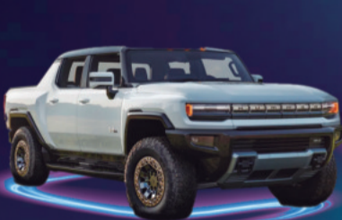
2025 GMC HUMMER EV AUTONOMÍA 600 KM