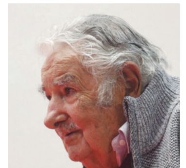
Se recupera de forma favorable

para explicar el funcionamiento del stent. “Es una prótesis. Un dispositivo que se coloca dentro del esófago, que se autoexpande. Ese dispositivo, que es metálico, se adhiere a las paredes del esófago y queda allí ampliando la luz del esófago y permitiendo el pasaje de alimentos”, detalló./EFE