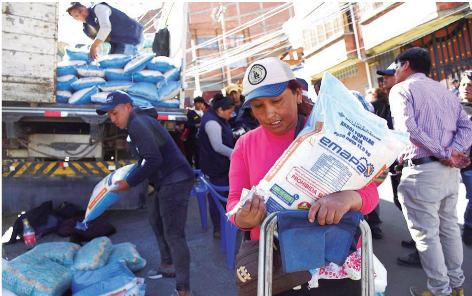
El aumento de precio de algunos alimentos generó largas filas en Emapa donde la población acudió en busca de productos más baratos

“El sector advirtió que el producto se encarecería, debido a que los costos para su producción subieron. Es inexplicable que desde el Gobierno siempre se amenaza y se intimide al sector, eso demuestra que no conocen la ca-