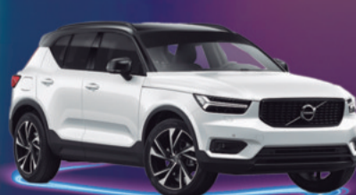
2022 VOLVO XC-40 R-DESIGN VEHÍCULO HÍBRIDO