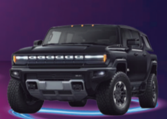
2025 GMC HUMMER EV AUTONOMÍA 600 KM