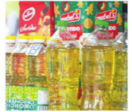
Los precios siguen elevados

de su detención y habrá una marcha protagonizada por Samuel Doria Medina, 'Tuto' Quiroga y Carlos Mesa. A2-3