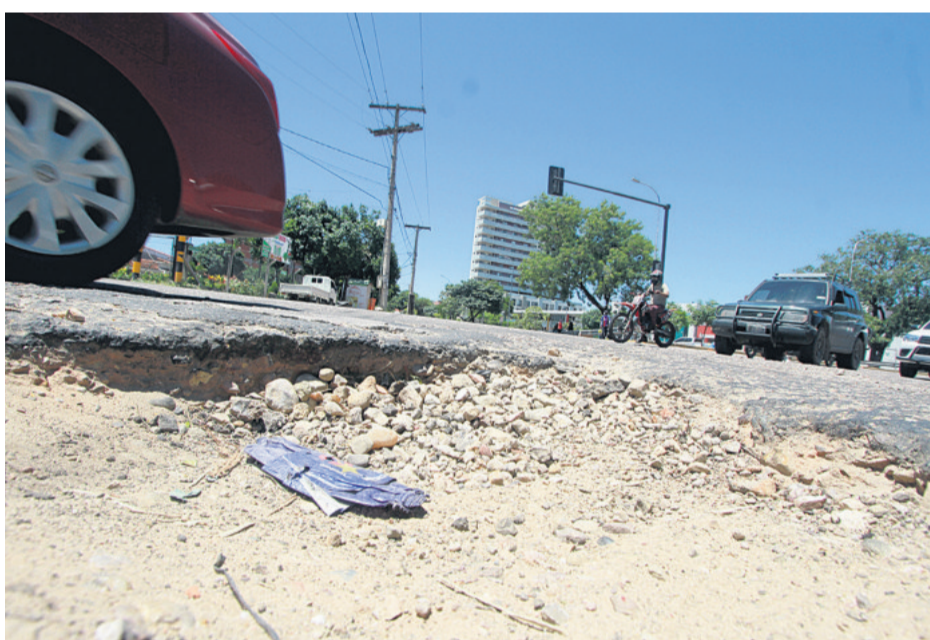
Uno de los baches que se formó en el séptimo anillo de la avenida Cristo Redentor