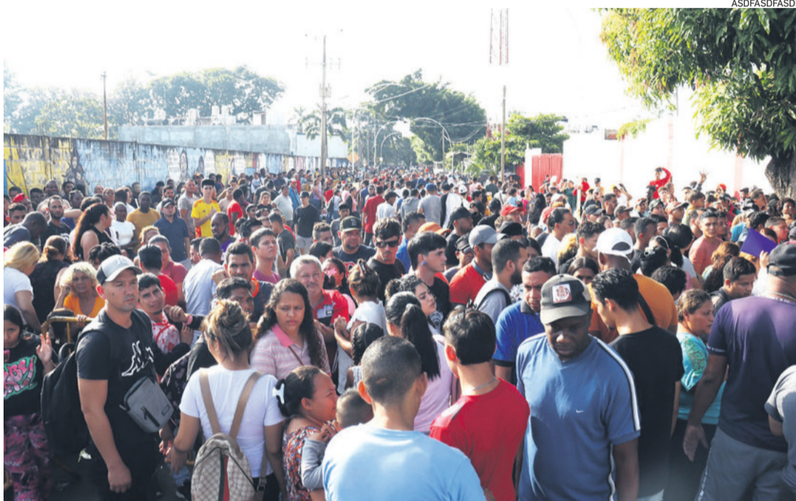
Migrantes en el albergue Jesús el Buen Pastor en Tapachula, México, límite con Centroamérica

El Gobierno de Joe Biden cerró en 2021, poco después de su llegada al poder, los centros de detención para familias migrantes que operaban en Estados Unidos con cerca de 3.000 camas y que fueron abiertos durante el Gobierno de Barack Obama (2009-2017). "Vamos a tener que construir instalaciones para familias. El número de camas que necesitaremos dependerá de lo que indiquen los datos", dijo.