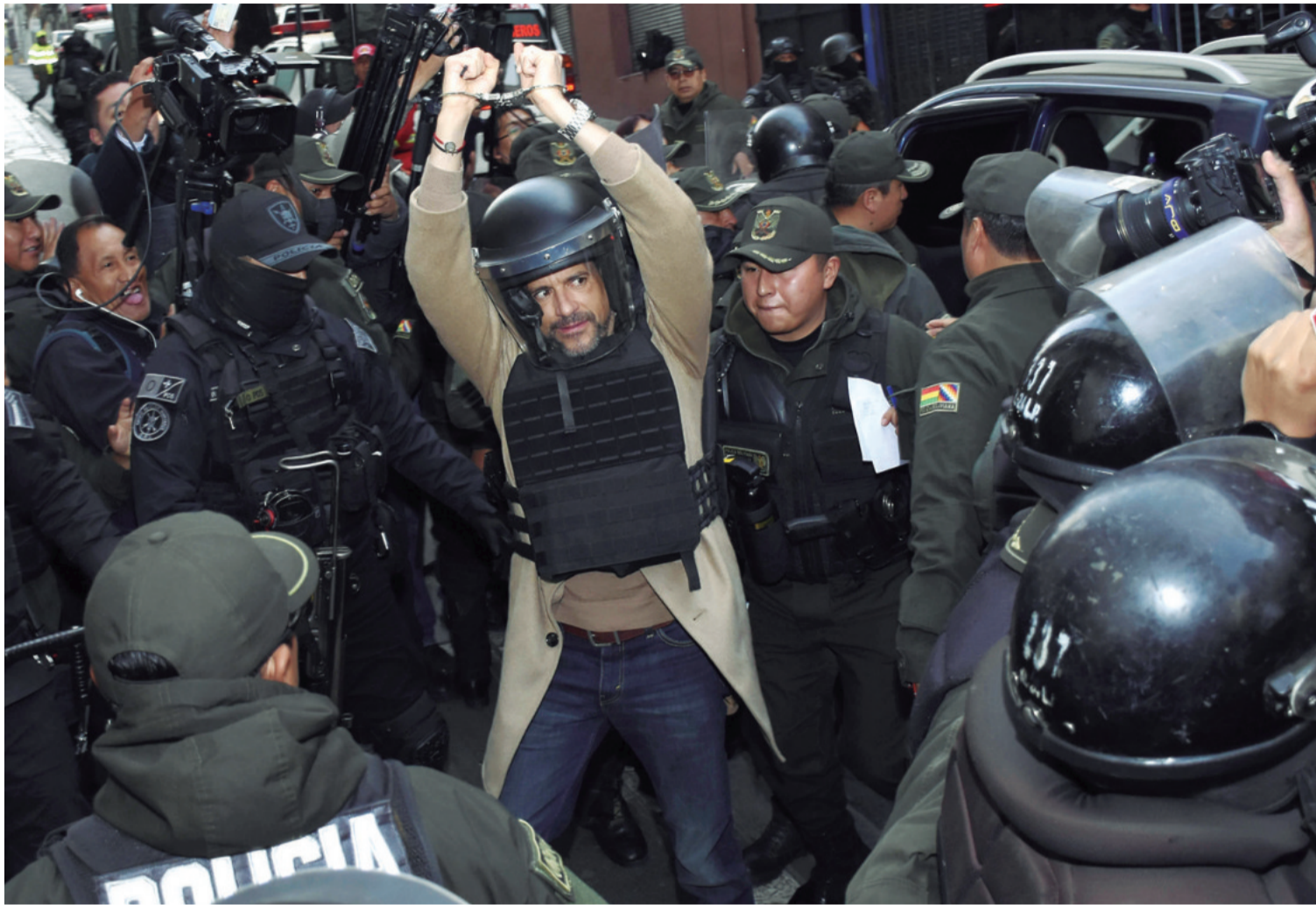
En octubre de 2024, el gobernador de Santa Cruz fue trasladado con casco y chaleco desde Chonchocoro para el juicio oral por el caso Golpe I.

TRES LÍDERES OPOSITORES PARTICIPARÁN DE LA CARAVANA