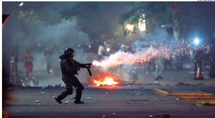
Una refriega policial se desató tras la aprehensión de Luis Camacho