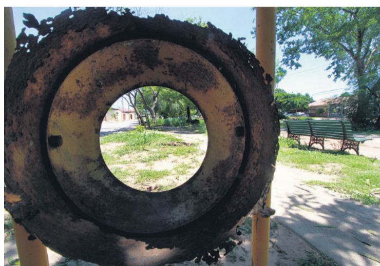
Solo queda una parte del basurero que fue colocado en este sector del quinto anillo de la avenida Alemania