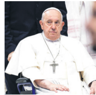
Durante el rezo del ángelus

En el refugio hay ahora 1.300 migrantes, el 70 % hondureños, lo que ha llevado al colapso de sus instalaciones.