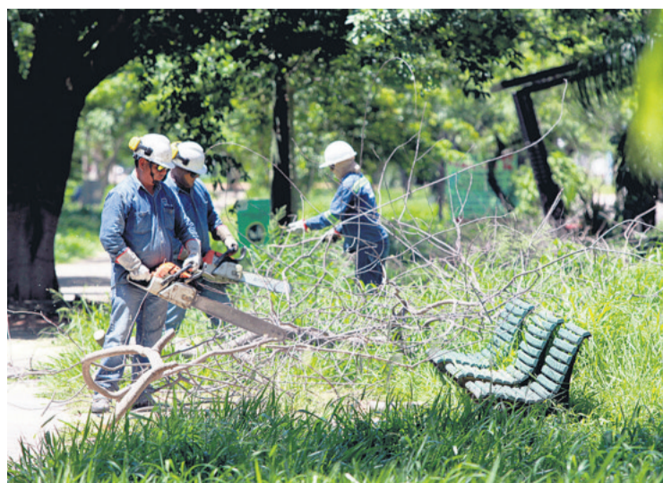
Continúa la limpieza de los árboles caídos durante el temporal del martes. Este trabajo se realiza en distintos puntos de la ciudad