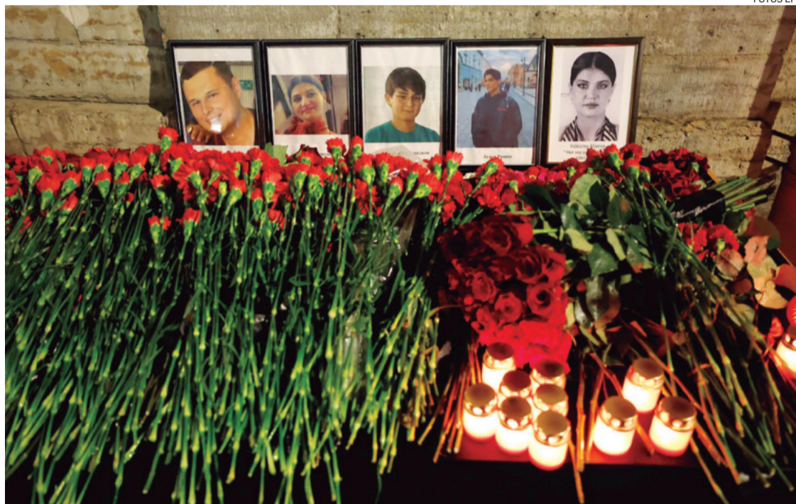
Fotografías de algunos de los pasajeros muertos en el avión que sufrió un accidente en Kazajistán

El Kremlin llamó ayer a no apresurarse con conclusiones sobre las