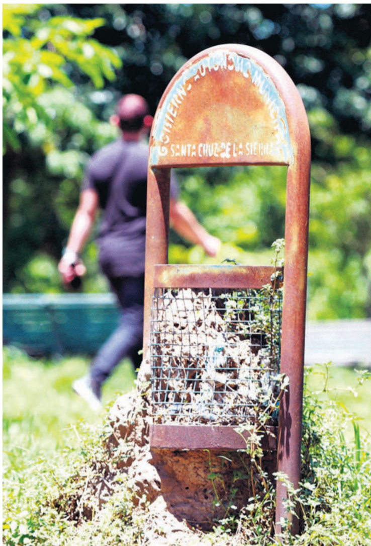
Este basurero muestra el abandono en algunos sectores. La gente cuestiona la falta de mantenimiento que se observa en distintas áreas

“Tenemos un plan de mantenimiento preventivo y correctivo del asfalto que se lo lanzará en el primer trimestre del año, que aproximadamente ronda los Bs 25 millones. Es para terminar de bachear los lugares más complejos y colocar el micropavimento sobre el asfalto. Esto ya se realizó en el segundo anillo y radiales, pero ahora se lo hará en el cuarto anillo y otros sectores”, adelantó el secretario.