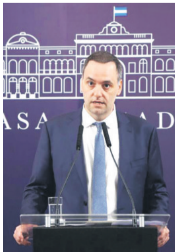
El vocero presidencial Manuel Adorni en rueda de prensa

El SMVM fijado a octubre pasado era de 271.571,22 pesos (271 dólares), por lo que el aumento decidido por el gobierno fue nulo en noviembre en términos mensuales, 3 % en diciembre; 2,5 % en enero; 2 % en febrero y 1,5 %