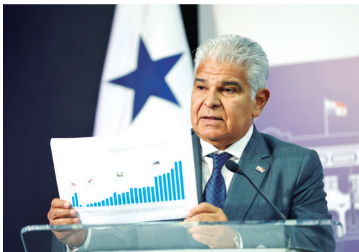
El mandatario panameño se refirió ayer a las declaraciones de Trump

Desde el pasado fin de semana, Trump se ha estado quejando de que las tarifas del canal interoceánico son una "estafa" que afecta a EEUU, su principal usuario, y sobre una influencia china en vía, y ha amenazado con pedir que se devuelva la administración de la ruta a su país, que lo construyó y operó entre 1914 y 1999.