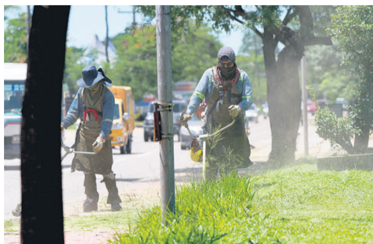
Brigadas realizan el mantenimiento de las áreas verdes en distintas zonas. El municipio asegura que intensificó las tareas