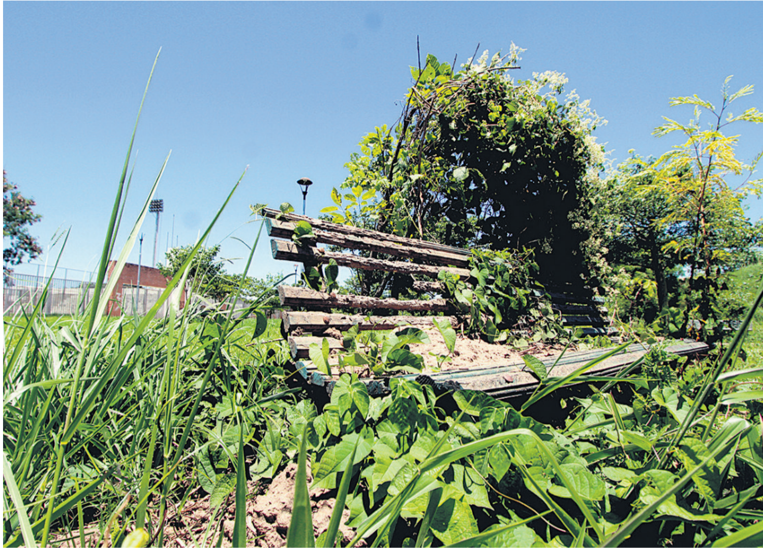
En estas condiciones se encuentra esta plazuela que está en la zona del hospital El Remanso, donde los matorrales cubrieron hasta los bancos