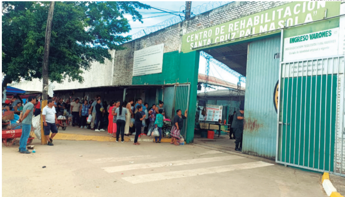
En Palmasola, así como en todos los recintos carcelarios del país, se relizan permanentes controles

El cuerpo del reo fue trasladado a la morgue, donde luego de la