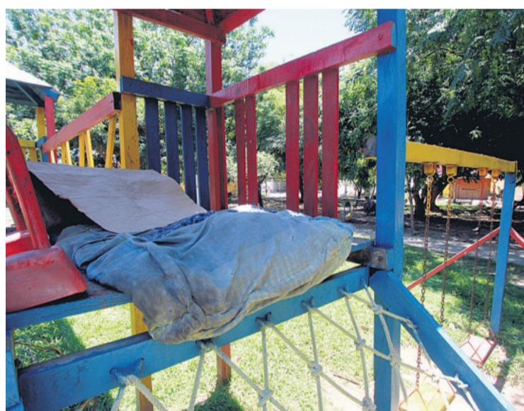
El parque infantil de la plaza Los Ángeles, en el barrio del mismo nombre, tiene este colchón, lo que impide jugar a los niños