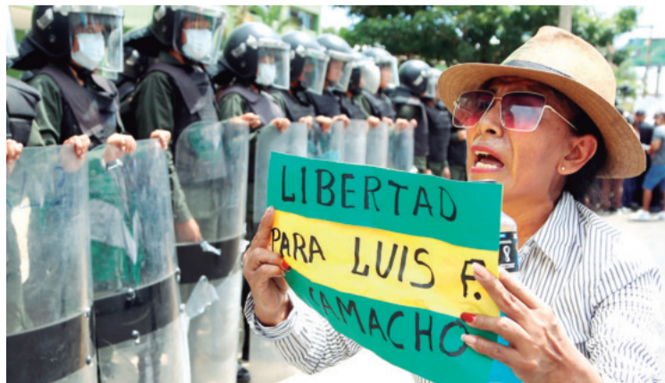
Una mujer sostiene un letrero exigiendo la liberación del gobernador.