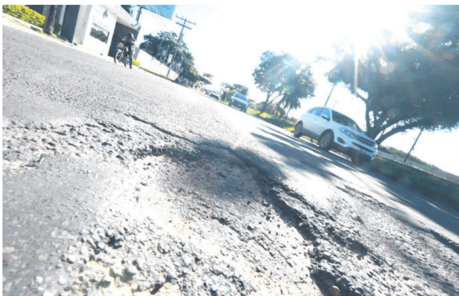
En el quinto anillo de la doble vía a La Guardia se formó un hueco. Hay brigadas que están haciendo el bacheo