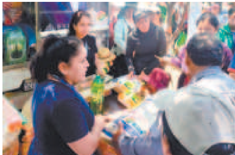
La población tarijeña accede a los alimentos a precio justo.

La llegada de Emapa a estas comunidades no solo asegura