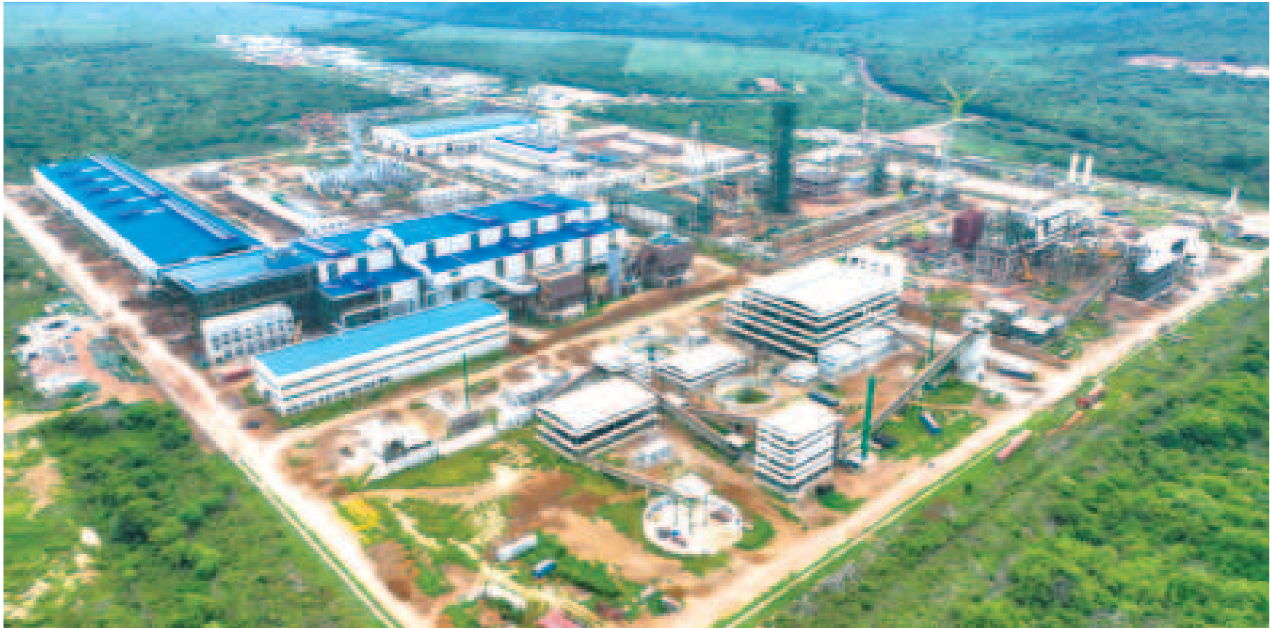
La edificación del complejo siderúrgico del Mutún, en Santa Cruz, registra un importante avance.