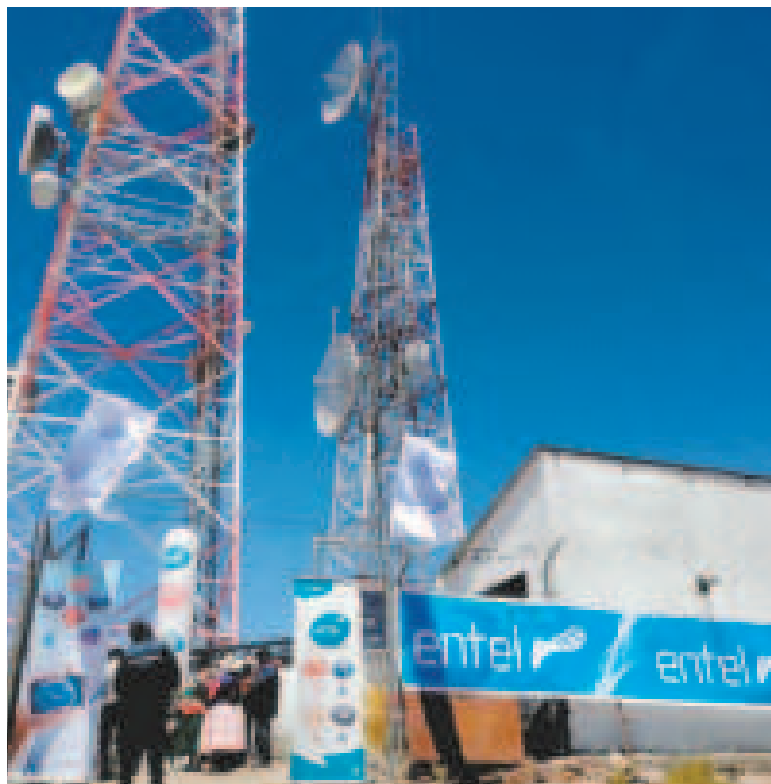
La apuesta de Entel es reforzar la cobertura de la red móvil y mejorar la calidad del servicio.