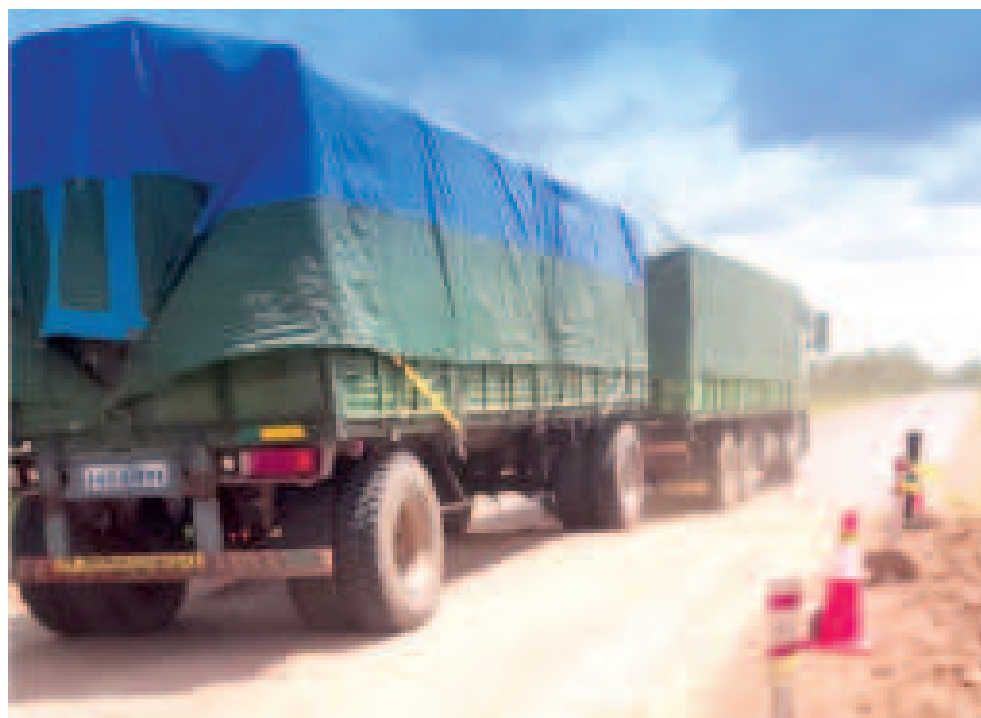
Un camión en una carretera del oriente boliviano.

En época de lluvias, la prioridad de la ABC es garantizar rutas seguras para que el usuario llegue a su destino.