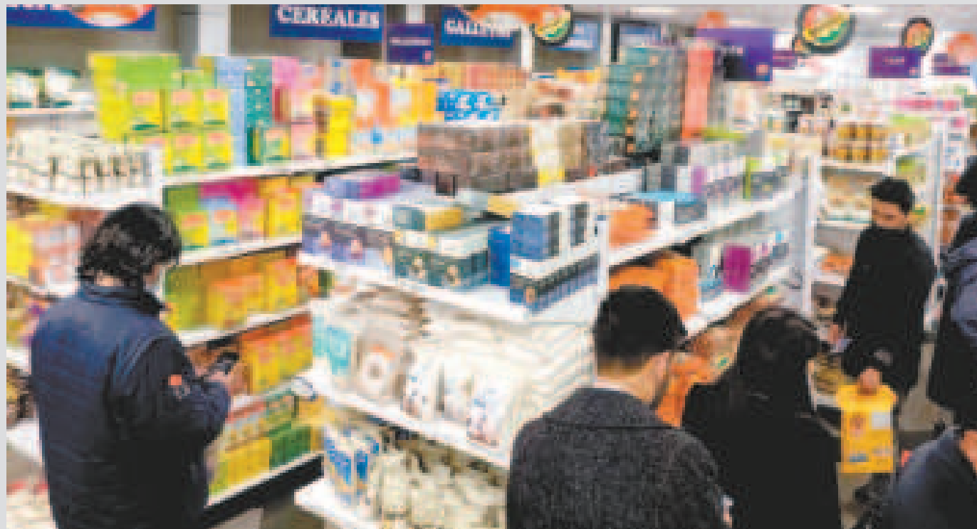
Con más de cien sucursales en todo el territorio, Emapa apoya la comercialización de la producción nacional.

A través de diversas acciones, la estatal afirmó que vigorizará sus esfuerzos para la gestión venidera con el objetivo de garantizar la seguridad alimentaria del país.