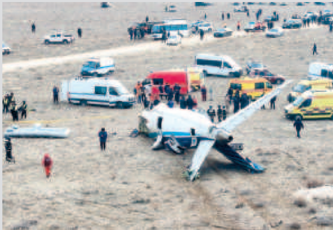
Parte del avión que se estrelló en Kazajistán.

Autoridades evalúan las causas del siniestro y se reportó que hay heridos de gravedad. Entre las personas que se salvaron hay niños.