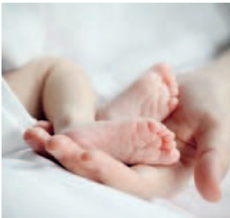
El nacimiento de bebés alegró a muchas familias en las vísperas navideñas.