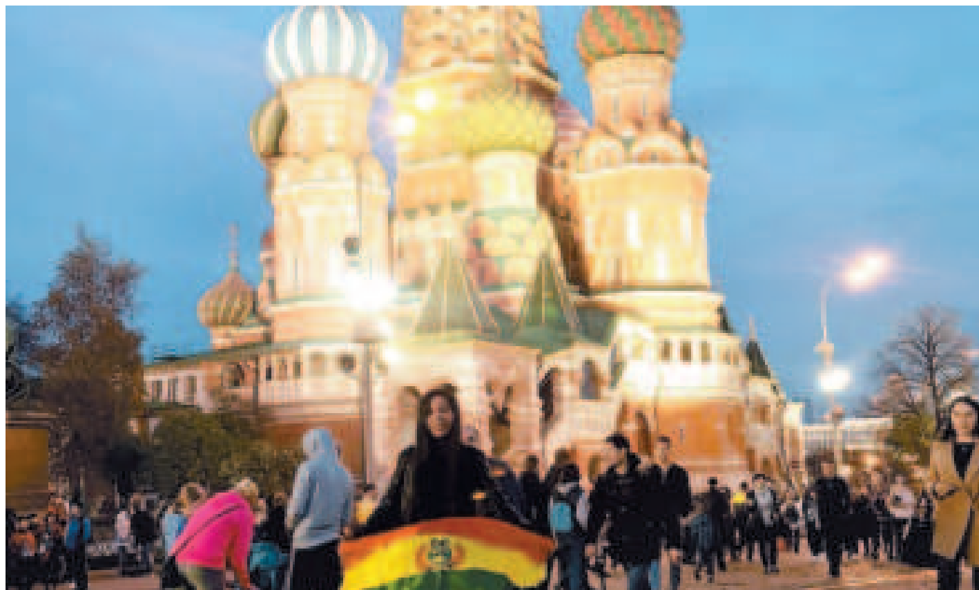
Una becaria en Rusia enseña la bandera boliviana.

El presidente Arce Catacora detalló que son 10 subsidios académicos que incluyen estipendios mensuales, seguro médico y pasajes de ida y vuelta.