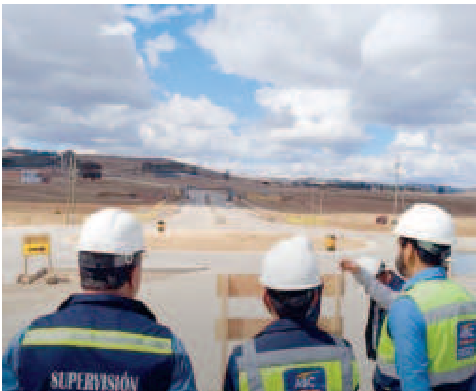
Supervisión de obra en el departamento de Oruro.

► El objetivo del Plan Lluvias es atender, de manera oportuna, las eventualidades climatológicas que afectan la RVF, como deslizamientos, inundaciones, incremento en los caudales en alcantarillas, socavaciones por erosión acelerada, entre otros.