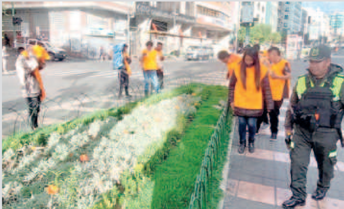
Los infractores en El Prado, con tareas de aseo bajo vigilancia policial.

En la ciudad de La Paz, 39 personas fueron arrestadas por infringir la Ley 259; fueron llevadas a inmediaciones de El Prado para labores de limpieza.