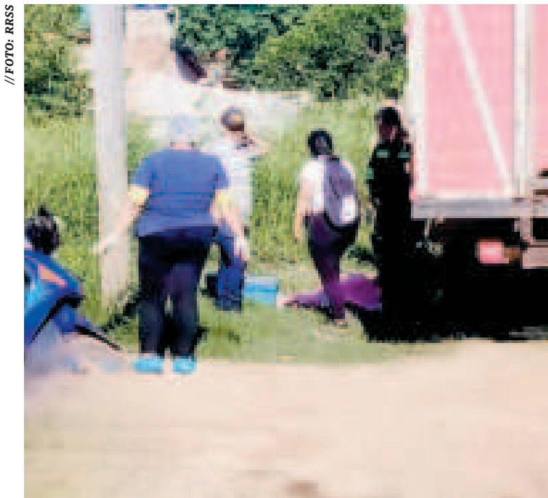
Una persona muerta en el suelo luego de la balacera en Riberalta.