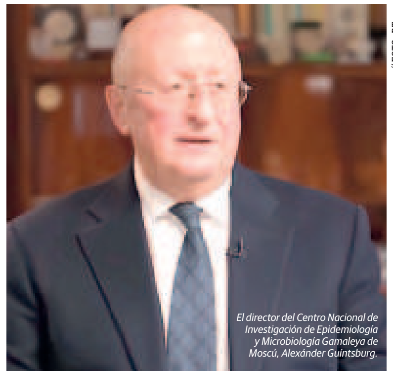
El director del Centro Nacional de Investigación de Epidemiología y Microbiología Gamaleya de Moscú, Alexander Guíntsburg.

Algunas enzimas crearán agujeros en las células afectadas, mientras que otras penetrarán por ellos y destruirán las proteínas tumorales. Gracias a este mecanismo, no se inicia la inflamación y se destruye no solo el tumor, sino también las células que hacen metástasis, explicó.