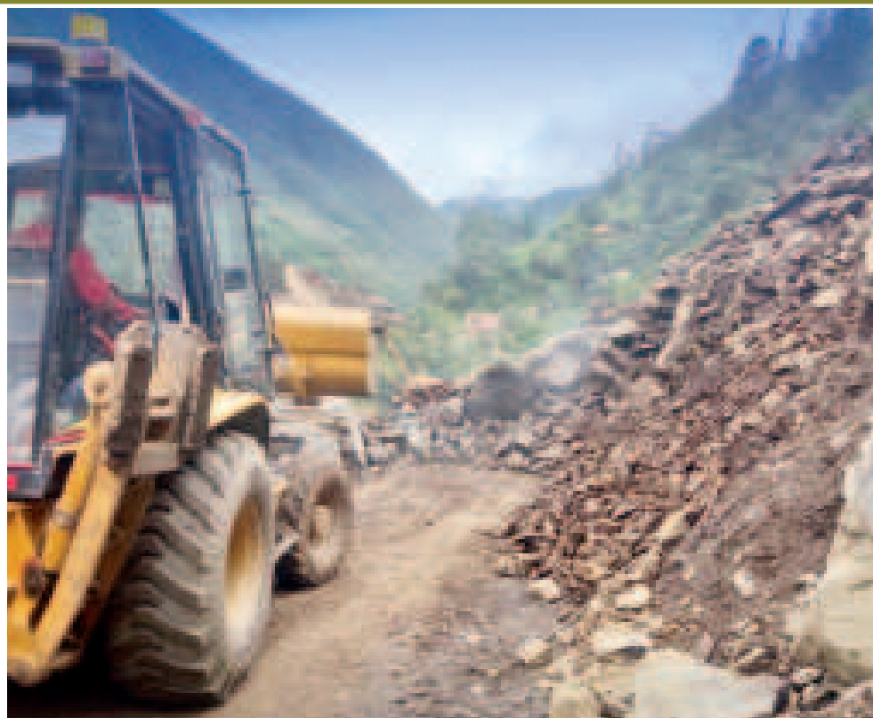
Maquinaria pesada en los Yungas durante un trabajo para habilitar la plataforma vial.

Luis Arce Catacora Presidente del Estado