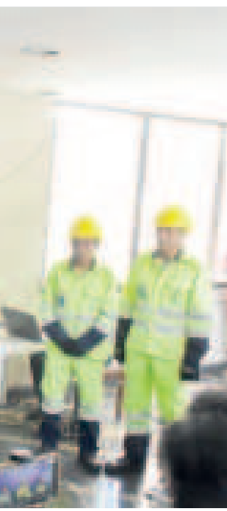
Lanzamiento del Plan Lluvias, en noviembre de este año.