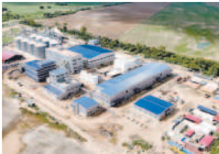
La Planta de Transformación de Subproductos de Soya en San Julián, Santa Cruz.

Otra planta lista para su inauguración es la de derivados de almendra EBA en Viacha,