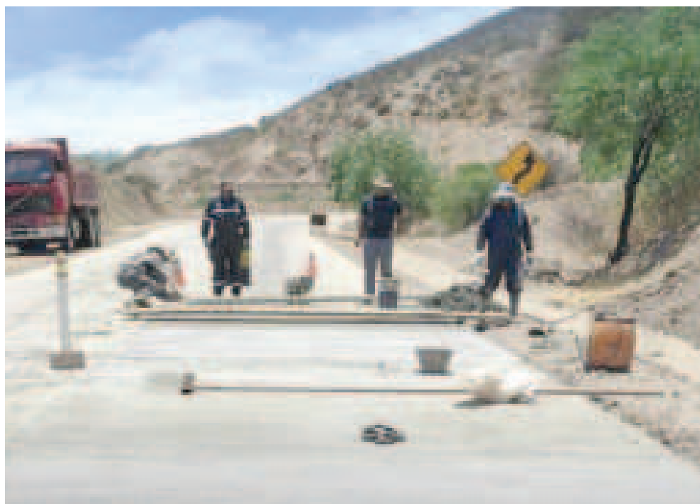
Reparación de una plataforma en el departamento de Potosí.

Explicó que, además, se tiene contemplado desplegar a 1.866 trabajadores y se contará con 500 microempresas para el mantenimiento y limpieza de los 83 tramos de los nueve departamentos. ▶