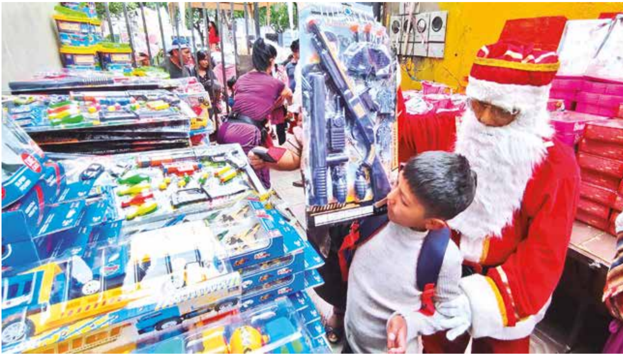
La entrega de chocolatada y regalos a niños por Navidad en la plaza 14 de Septiembre ayer