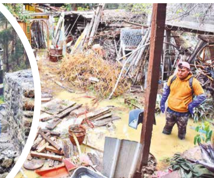
La inundación del río Chijllawiri.