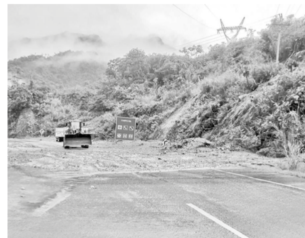
Derrumbes en la zona de El Sillar.

La Policía no descartó que los agresores pertenezcan al Primer Comando de la Capital (PCC), una de las organizaciones criminales más peligrosas de Brasil, pero aún no dieron con ellos.