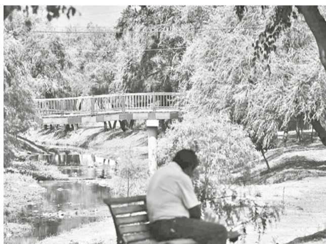
La gran cantidad de árboles en el río Rocha, en la ciudad.