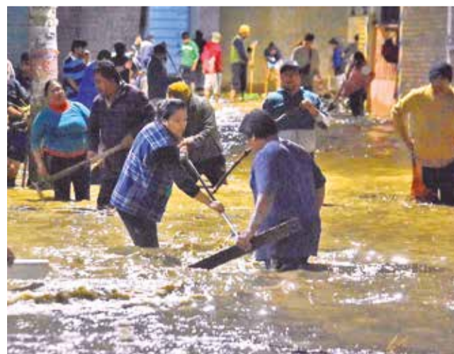
La emergencia en Colcapirhua por el desborde.