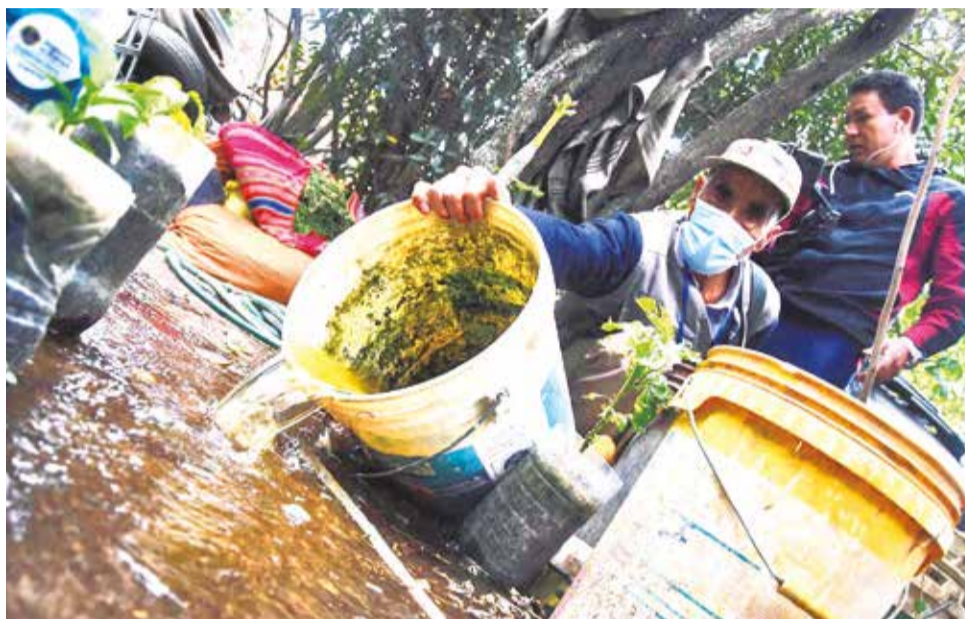
La destrucción de criaderos de Aedes aegypti en la zona sur de la ciudad. DANIEL JAMES

Sostuvo que este 2024 al menos 22 municipios del departamento reportaron casos diagnosticados por laboratorio, por lo que se reforzó la prevención.