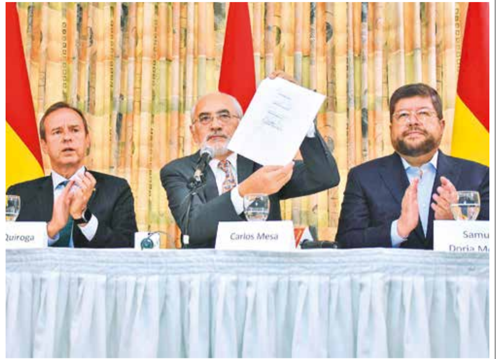
Líderes lanzan bloque opositor rumbo a los comicios nacionales.

las críticas del Gobierno porque es una muestra de preocupación ante la conformación de la propuesta política. "Este 2024 la oposición cierra positivamente el año político", añadió.