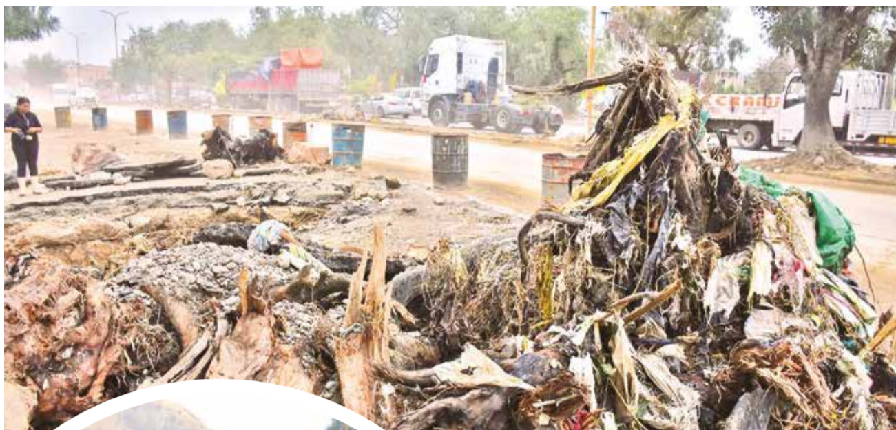
Troncos y basura en el río Chijllawiri.

Pereira dijo que enviaron una comunicación a la Asociación de Gobiernos Autónomos Municipales de Cochabamba (Amdeco) para alertar sobre esta situación y recomendar que se actúe de forma preventiva; sin embargo, aseguró que