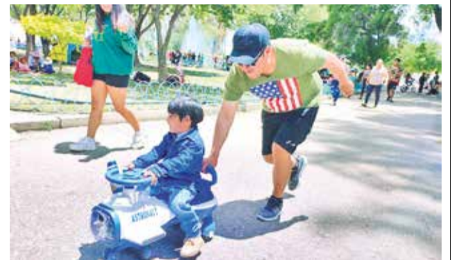
La afluencia en el parque Mariscal Santa Cruz.