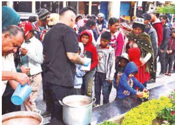
Familias y organizaciones se solidarizan con niños.