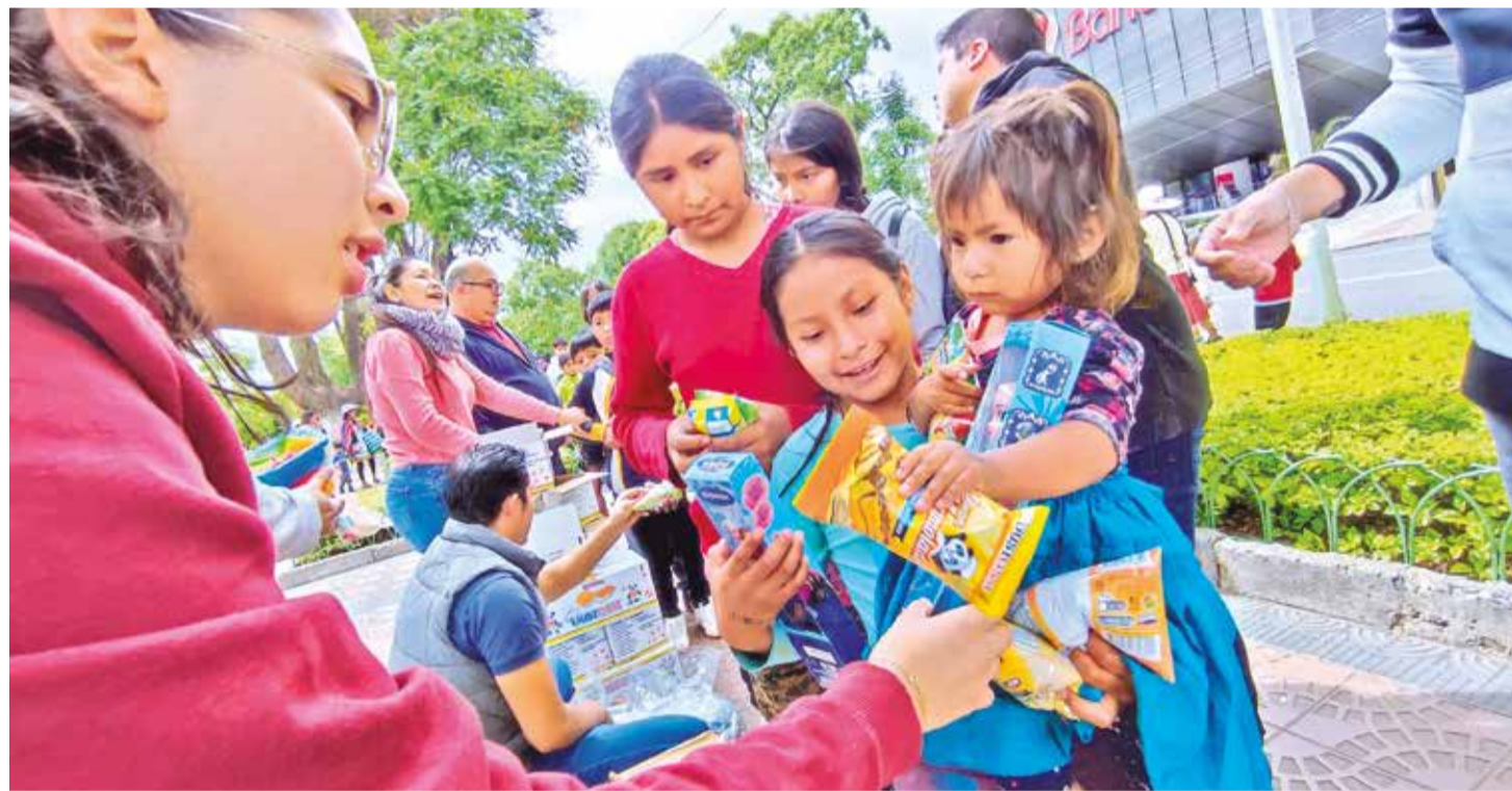
Un grupo de niños recibe juguetes y alimentos de regalo de parte de voluntarios que ayer recorrieron las calles de Cochabamba.

Celebración. En su homilía, Francisco mencionó a varios países que sufren guerras. En Cochabamba la Navidad se vivió con muestras de unidad y solidaridad. Págs. 6 y 10