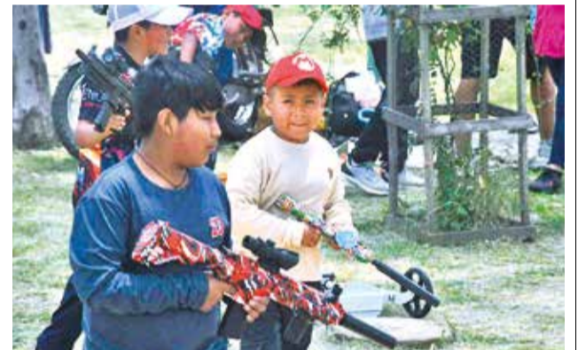
Los niños aprovecharon el feriado para divertirse.