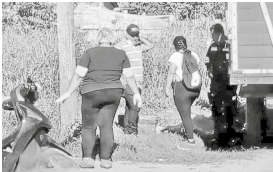
Policía llega al lugar del crimen de uno de los dos fallecidos.

Varios hombres dispararon contra las víctimas y se estima