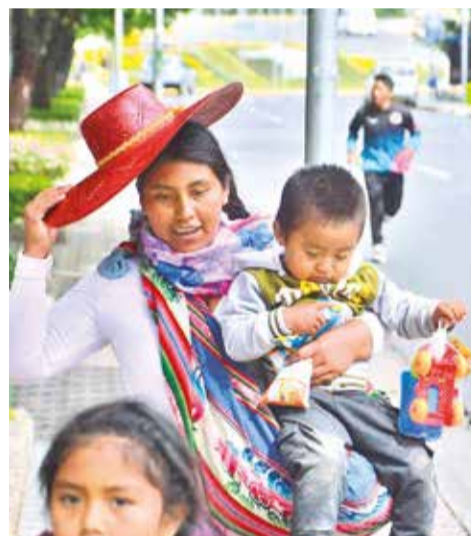
Varias familias llegaron de provincias a la ciudad por obsequios.