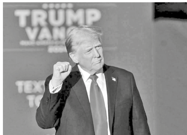
El presidente electo de EEUU, Donald Trump.

ciales, Marino Cabrera dijo estar “muy honrado y agradecido” por la nominación: “¡Manos a la obra!”, agregó.