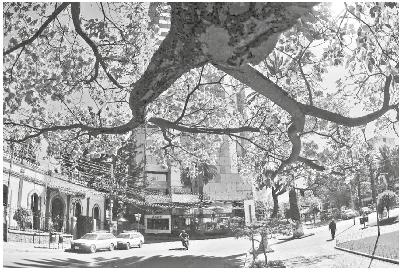
La plaza Colón es uno de los espacios con las especies arbóreas más importantes de la ciudad.

Los árboles urbanos proporcionan múltiples beneficios para las ciudades y sus habitantes: aumentan la biodiversidad urbana; pueden absorber hasta 150 kilos de gases contaminantes por año, mejoran la calidad del aire y hacen de las ciudades lugares más saludables; son excelentes filtros para contaminantes urbanos y partículas finas como el polvo y humo; su ubicación estratégica puede ayudar a enfriar el aire entre 2 y 8 grados centígrados; vivir cerca de espacios verdes urbanos y