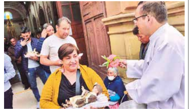
Feligreses en la misa de la catedral Metropolitana.