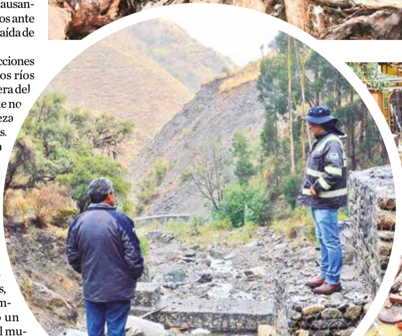
Inspeccionan la cuenca de Taquiña, en Tiquipaya.