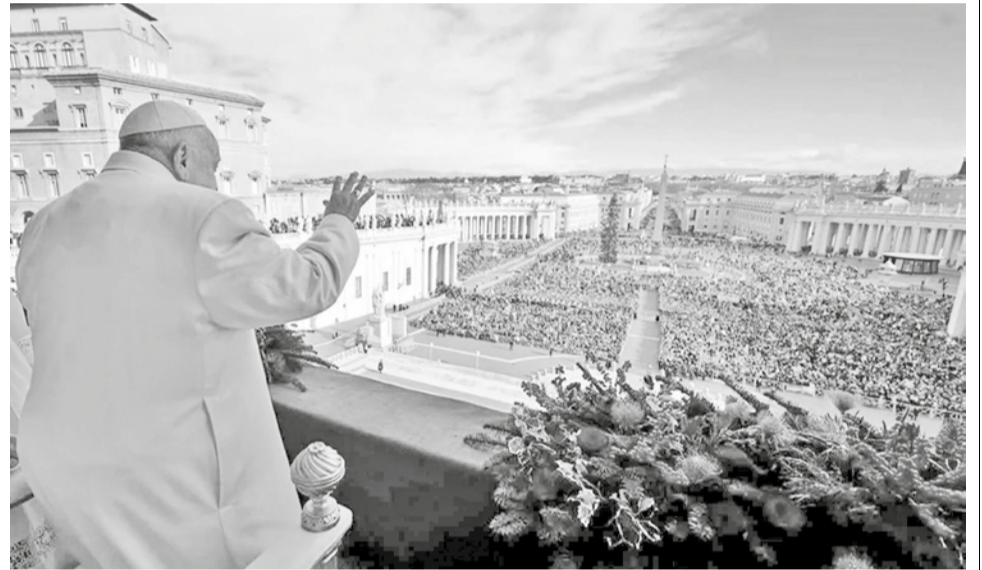
El papa Francisco durante su mensaje navideño, ayer en Ciudad del Vaticano.

Y deseo que “el Jubileo sea ocasión para derribar todos los muros de separación: los ideológicos, que tantas veces marcan la vida política, y los materiales, como la división que afecta desde hace ya cincuenta años a la isla de Chipre.