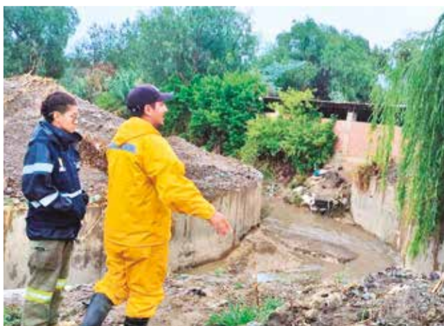
Funcionarios de la Gobernación inspeccionan el río Chijllawiri, días después del desborde.

Dejadez. El desborde del río Chijllawiri, el 1 de diciembre, se convirtió en un nueva alerta de los trabajos que debe priorizar las alcaldías