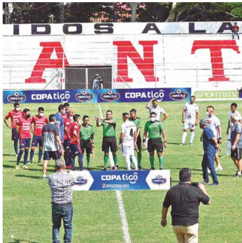
Jugadores de Real Santa Cruz y Wilstermann, en la previa de un partido de 2021 que no se jugó (foto izq.); futbolistas de Royal Pari, sentados en señal de protesta en ese mismo año. DANIEL JAMES

Sin estas medidas de presión, los clubes fueron acumulando deudas con sus plantillas, que hoy en día llegan, por ejem-