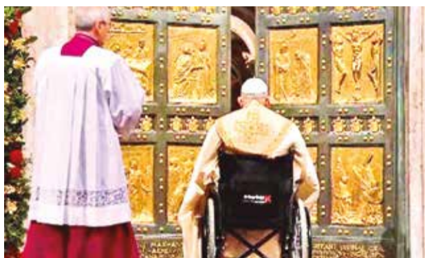
Francisco frente a la Puerta Santa, ayer en el Vaticano. RRS5

“En la Navidad del Señor, luz de luz, esperanza inextinguible, nos disponemos a entrar con fe por la Puerta Santa. Los pasos de nuestro camino son los pasos de toda la Iglesia, peregrina en el mundo y testigo de la paz”, dijo el papa antes de abrir la puerta y continuó: “Cruemos el umbral de este templo santo y entremos en el tiempo de la misericordia y del perdón, para que se abra a cada hombre y a cada mujer el camino de la esperanza que no defrauda”.