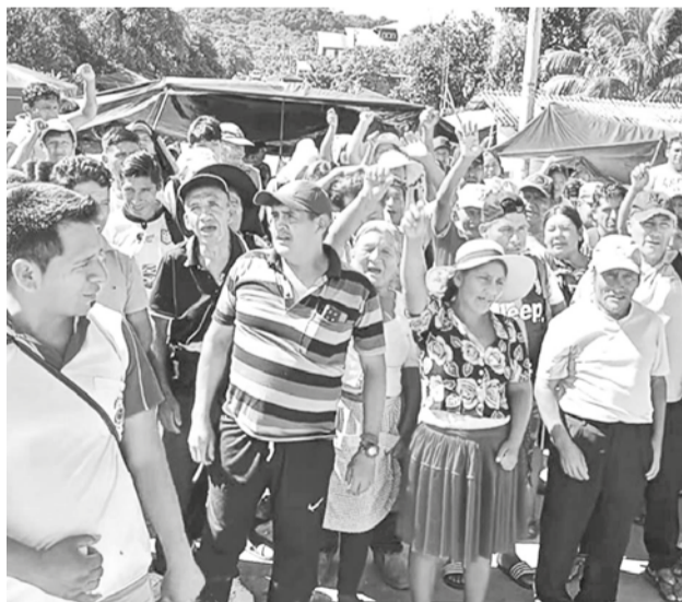
Pobladores del trópico en vigilia en Lauca Ñ. RKC

otras organizaciones también que se van sumando a lo largo de estos días para prestar la seguridad correspondiente", añadió en el mismo portal Kawsachun Coca.