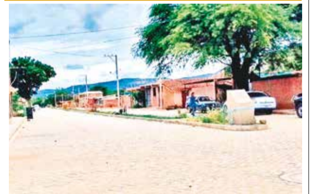
Enlosetado de calles en el municipio de Aiquile. LT

“El turismo está en terapia intensiva”, advirtió la representante de Canotur, quien hizo un llamado a las autoridades nacionales y a la sociedad para trabajar conjuntamente en la recuperación de un sector que es crucial para la economía boliviana.