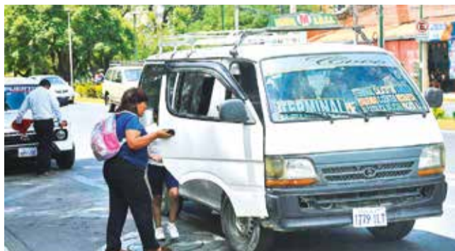
El servicio del transporte público en la ciudad. CARLOS LÓPEZ

Plazos. Se prevé que el proyecto de ley sea remitido la primera semana de enero al Concejo para su análisis y aprobación