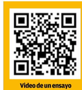
Video de un ensayo

Deseos de Navidad es un programa colorido y muy de época y para disfrutarlo puede adquirir sus entradas por WhatsApp al 78333855.