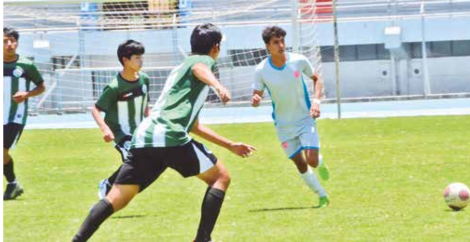
Pasaje del partido Oruro Royal vs Chacacollo, por la última de la Primera "B" de la AFC, ayer. HERNAN ANDIA

En cuanto a los descensos de la Primera "B" a Primera de Ascenso, bajaron los clubes Libertad,