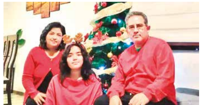
Que el amor y la paz iluminen cada rincón de tu hogar.