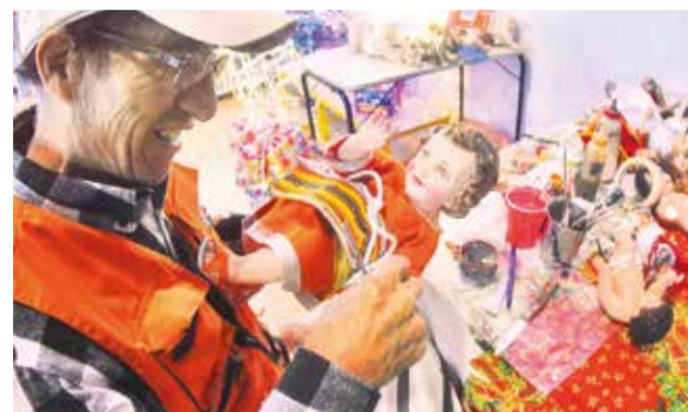
Algunos "niños navideños" para ser restaurados.