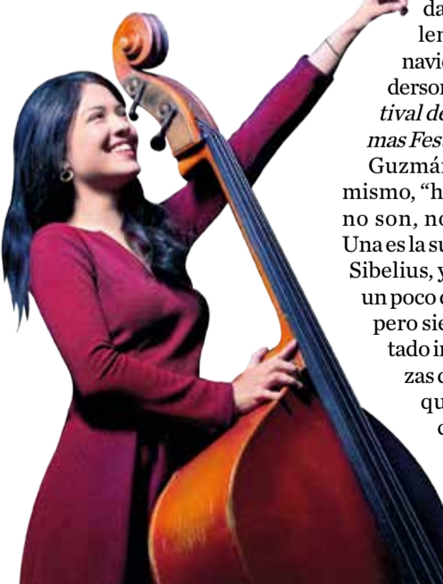
Estelar. Una de las artistas integrantes de la Orquesta Filarmónica de Cochabamba. ofc