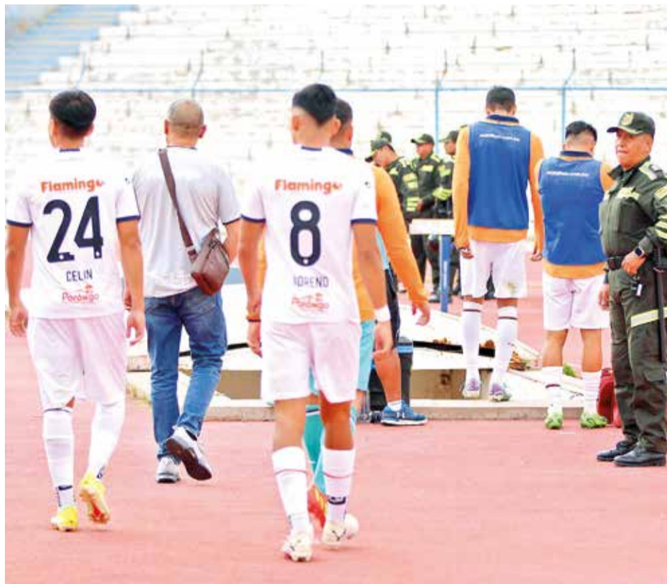
Jugadores de Royal Pari increpan al juez Gabriel Mendoza, la tarde del lunes en Oruro.

Al final del partido, el club CDT Real Oruro dio por hecho su inminente ascenso an-