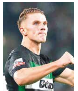
El sueco Viktor Gyokeres, de Sporting de Lisboa.

El top 10 lo completan: el portugués Cristiano Ronaldo (Al Nassr), con 43 goles en 51 partidos; el chi-