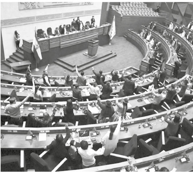
Sesión del pleno del Legislativo.

Sobre el conteo rápido de votos, el senador mencionó que es indispensable su implementación y es uno de los nueve puntos aprobados en la Cumbre Política convocada por el TSE. Añadió que reiterarán su pedido de una nueva reunión para evaluar el