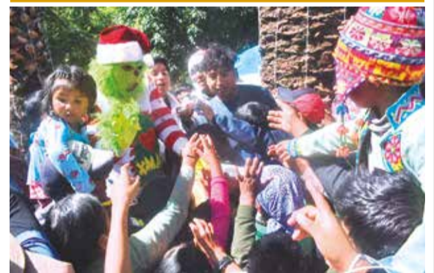
El agasajo en la plaza 14 de Septiembre, ayer.

Una vez que se apruebe el proyecto, pasará al ejecutivo municipal que tiene un plazo de 10 días para aprobar la normativa y ponerla en vigencia, según algunos legisladores.