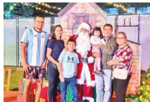
La familia Zambrana les desea felices fiestas.