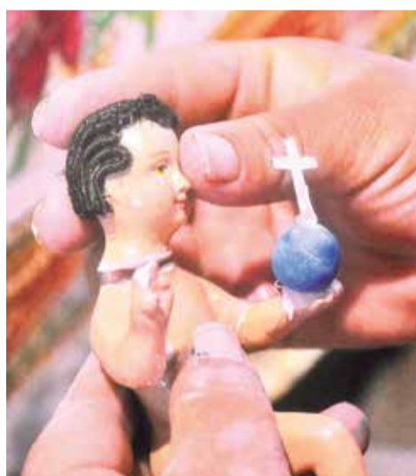
Un detalle del trabajo especializado.