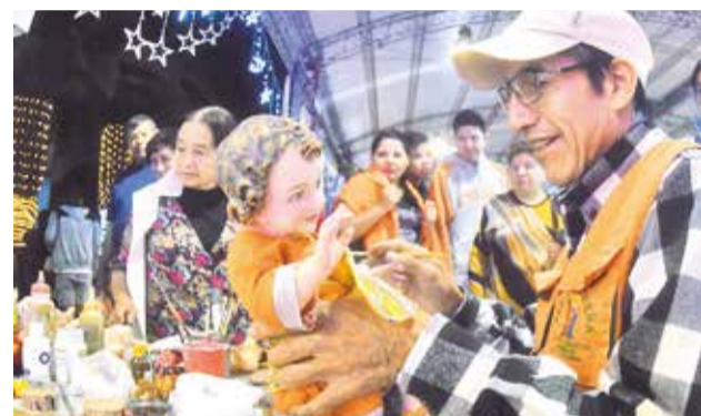
Feligreses buscan a restauradores en la Feria Navideña.