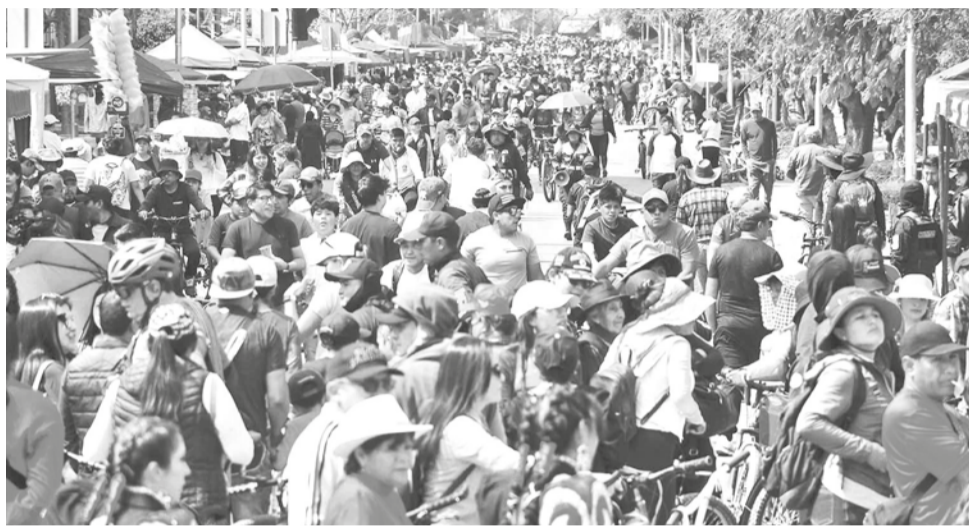
Un grupo de ciudadanos bolivianos durante una concentración pública. CARLOS LÓPEZ

En promedio, el 52% de los entrevistados en los 17 paí-