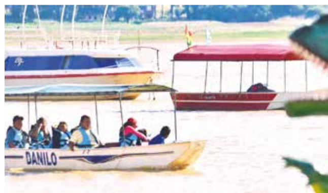
Turistas en La Angostura, valle alto de Cochabamba. J.R.

Panorama. Uno de los factores que ha agravado la crisis es la escasez de dólares en el sistema bancario boliviano, afirma Canotur