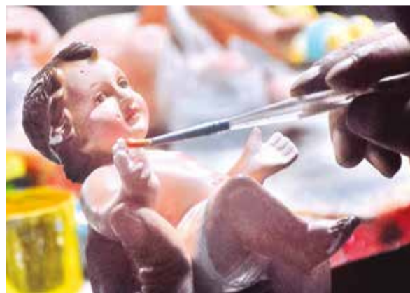
El retoque de los dedos de una escultura.