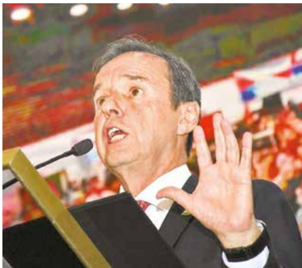
El expresidente Jorge "Tuto" Quiroga.

Quiroga anunció por primera vez su candidatura presidencial por la alianza Libre, el pasado martes luego de ha-