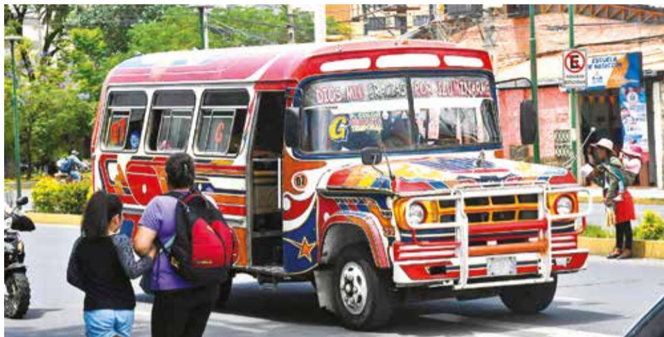
La circulación de micros en el centro de la ciudad de Cochabamba.

En anteriores ocasiones, los representantes señalaron que algunas líneas cobraban 1,50 bolivianos, pese a que la tarifa era de 1,90. Tras la reunión del Comité de Transporte y la determinación de aumentar la tarifa, aún no definen cuál será la decisión que asuman.