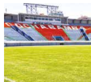
Vista del estadio Félix Capriles.

de entradas, se ha coordinado la logística que realizará la Federación Boliviana de