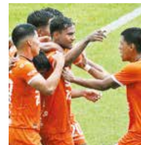
Festejo de los jugadores de Royal Pari, ayer.