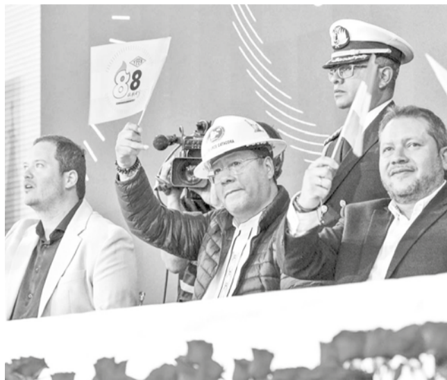
El presidente Luis Arce en el aniversario de YPFB, ayer. YPFB

Arce describió el 2023 como “un año nefasto” en términos de deuda externa y anticipó un 2024 aún más adverso, con una proyección de salida neta de más de $us 900 millones. Al considerar el déficit acumulado, las pérdidas netas superarían los $us 1.400 mi-