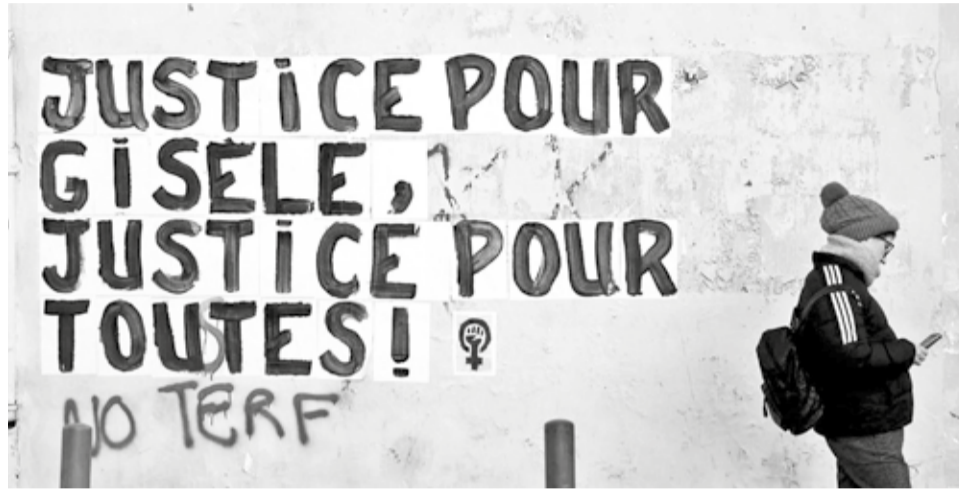
Un grafiti de apoyo a Gisèle Pelicot en Aviñón, Francia, donde tuvo lugar el juicio.

Esta mujer decidió exponerse públicamente "para que la vergüenza cambie de bando". Las maniobras de su entonces marido, del que se divorció posteriormente, se descubrieron en 2020, tras ser detenido por grabar bajo las faldas de mujeres en un supermercado.