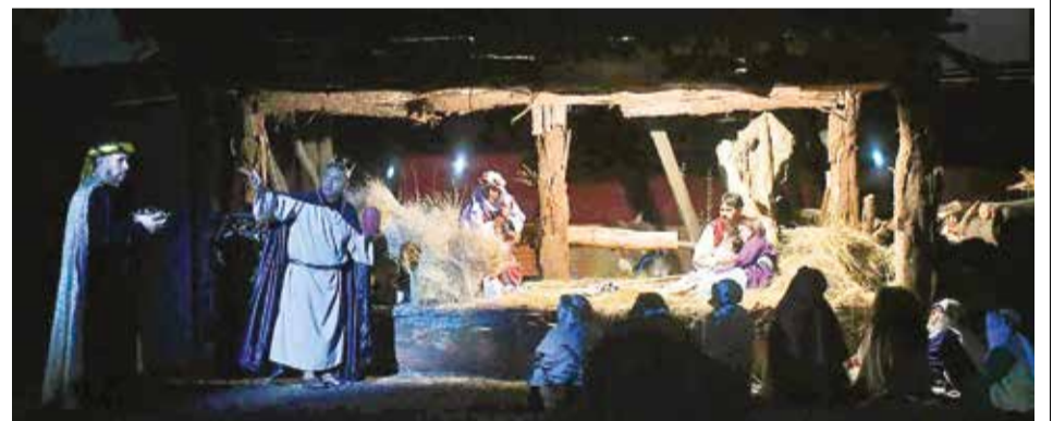
La presentación de la obra “Belén viviente”, en el seminario San José. JOSÉ ROCHA

La Alcaldía procedió a realizar el resguardo.