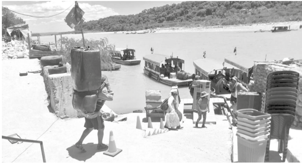
Un boliviano transporta una bolsa con mercadería para trasladar a Argentina. TARIJA ECONOMÍA