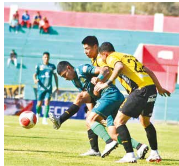
Duelo entre Real Tomayapo y The Strongest, el pasado 18 de agosto en Tarija.