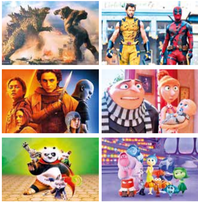
Algunas de las películas más taquilleras de la gestión 2024.

Durante los últimos 50 años, las secuelas han formado parte crucial de los estrenos más exitosos año tras año. No obstante,