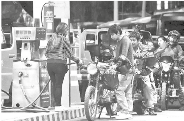
Venta de combustible en un surtidor de Cochabamba. C.L.

Arce aprovechó la ocasión para reconocer el esfuerzo del personal de YPFBy la Agencia Nacional