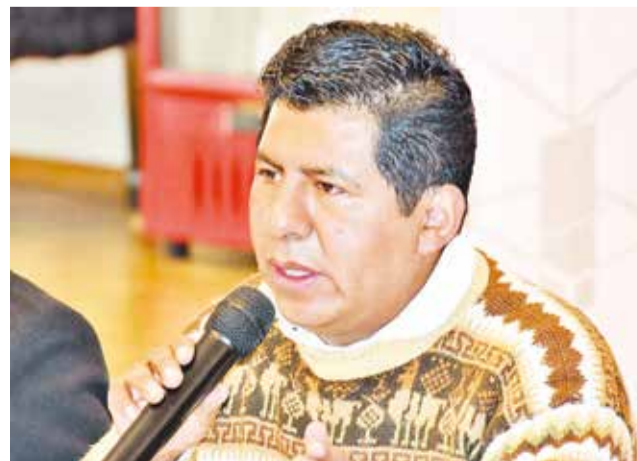
El vocal del TSE, Tahuichi Tahuichi Quispe. TSE

Mencionó la importancia de transparentar la información y generar la confianza