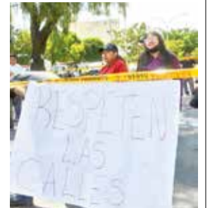
La protesta de vecinos y comerciantes. H. ANDIA