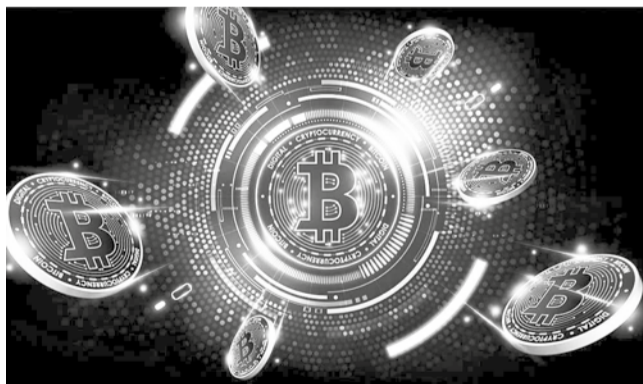
Las criptomonedas ya son reguladas en Bolivia.

Apunte. Esta regulación busca fortalecer un entorno financiero más seguro y alineado con los estándares internacionales