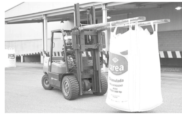
Un montacargas transporta una bolsa con urea.

La reactivación de la planta ha permitido cubrir el 99,99 por ciento de la demanda interna de urea. El departamento de Santa Cruz lidera el consumo nacional del fertilizante, seguido por Cochabamba, La Paz y Tarija.