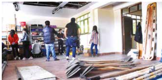
El resguardo del inmueble municipal, ayer. JOSÉ ROCHA

Inventario. En una inspección se encontraron herramientas y material de ferretería con costos pegados