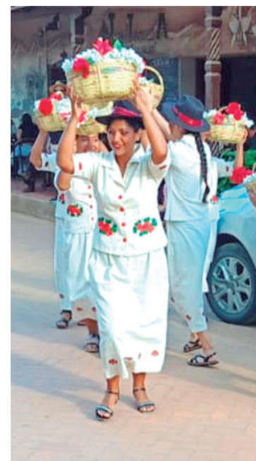
Con tradición y baile se celebró la segunda fiesta de la uva.