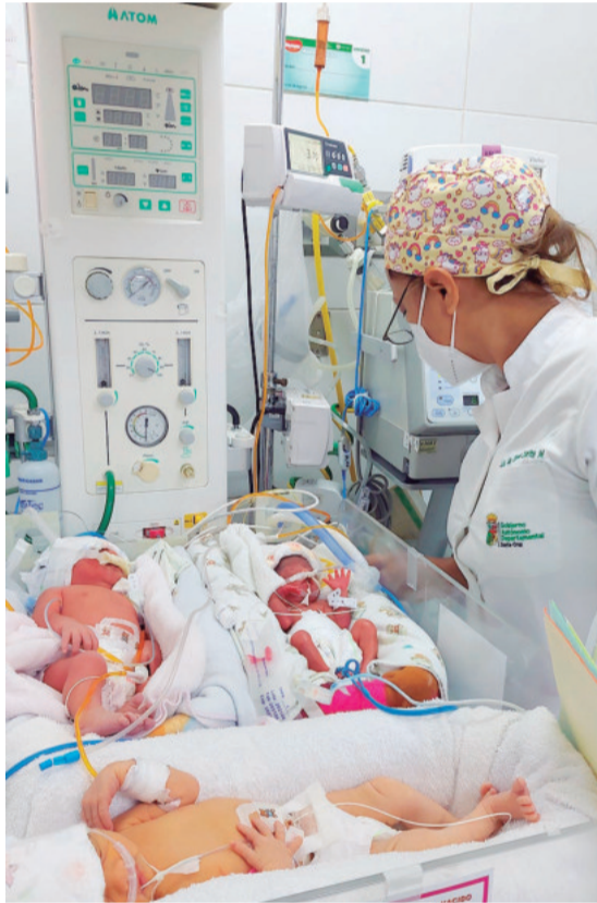
El hacinamiento es una de las constantes quejas