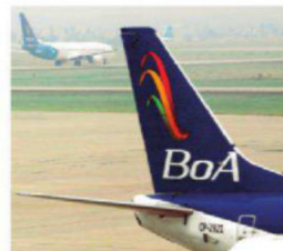
La aerolínea estatal boliviana

hospitales y clínicas. El 2024 cierra, además, con en saldo de movilizaciones y huelgas constantes en el sector TEMA DEL DÍA A2-3