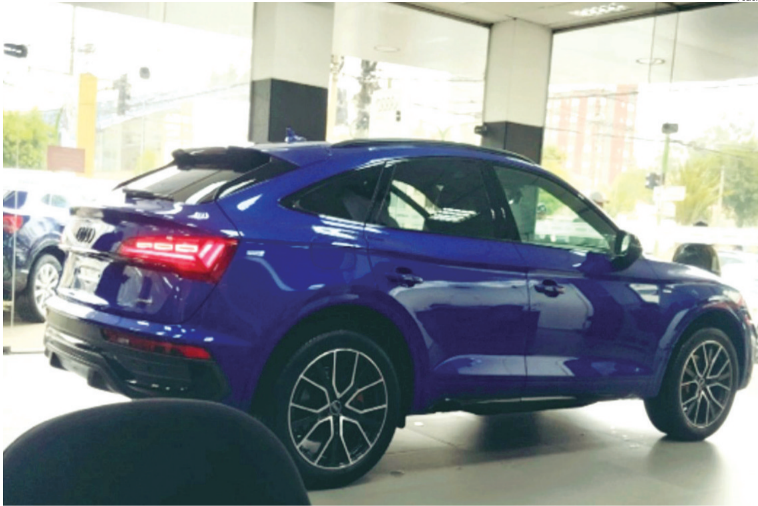
El auto marca Audi que, de acuerdo a informes de la Felcc, fue comprado en 95.000 dólares por el abogado para regalarle a la 'linda chiquilla'-

ES UN CASO DE LEGITIMACIÓN DE GANANCIAS ILÍCITAS