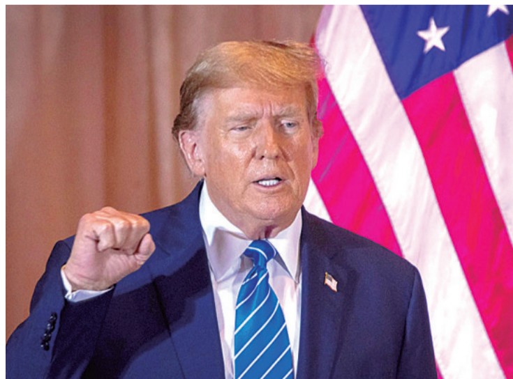
Donald Trump se quejó por los altos costos en las tarifas del canal

El republicano denunció que las tarifas que cobra Panamá son “sumamente injustas” y no tienen