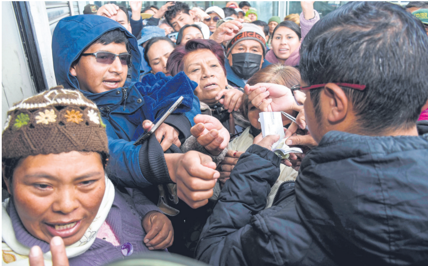
La población en las puertas de la estatal Emapa se agolpa para entrar y comprar aceite, arroz y azúcar. Pasó en La Paz.