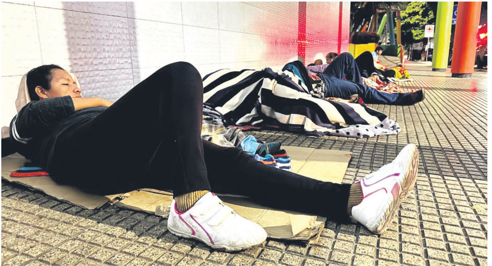
Familiares y pacientes duermen en las puertas de los hospitales para conseguir una ficha. Esta es una de las noches que se vivió en el Mario Ortiz