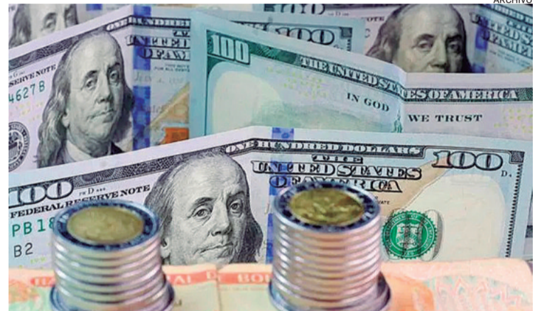
La cotización paralela del dólar es parte de la realidad económica.