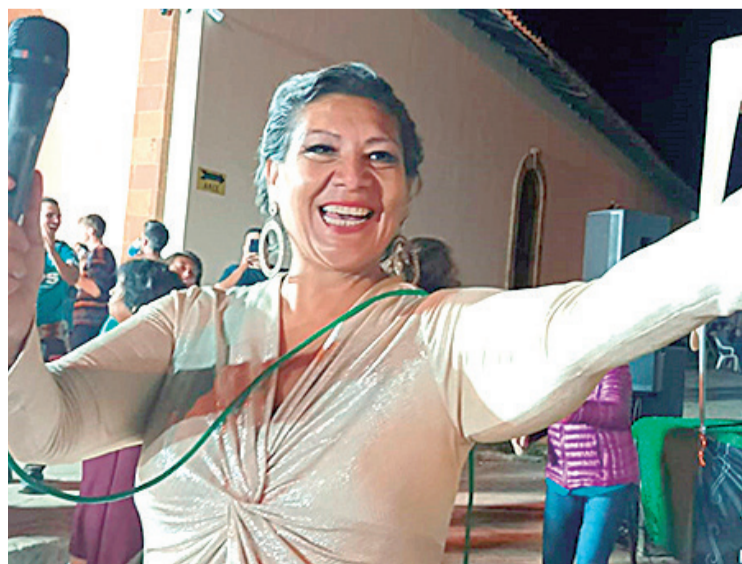
La fiesta de la cosecha del vino estuvo marcada por música