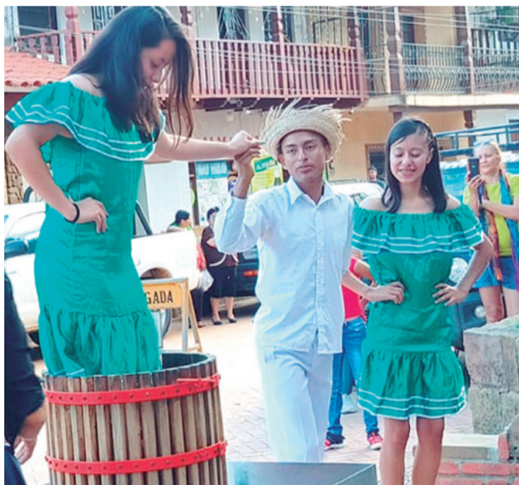
La vendimia comenzó con el pisado de la uva recién cosechada.

El festival es una vitrina del esfuerzo de los viticultores y una oportunidad para el turismo