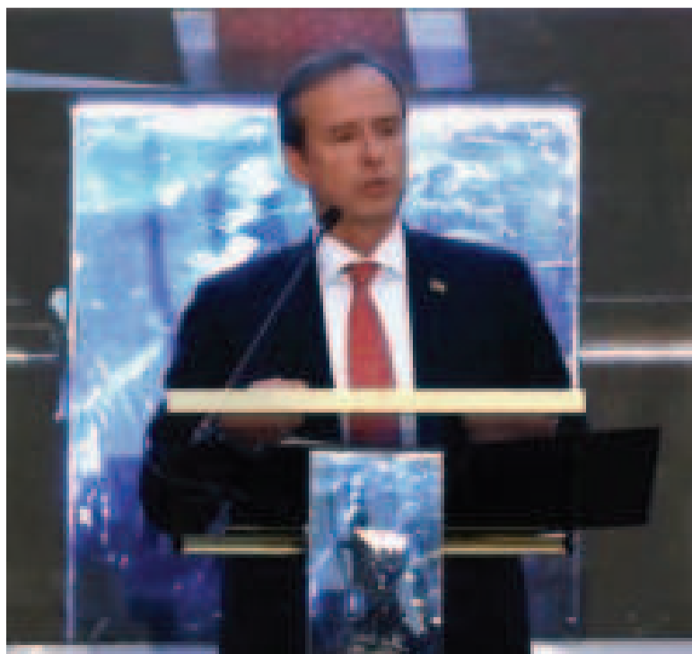
Quiroga en el acto de lanzamiento de su proyecto político.

Quiroga en las elecciones de 2020 retiró su candidatura presidencial.