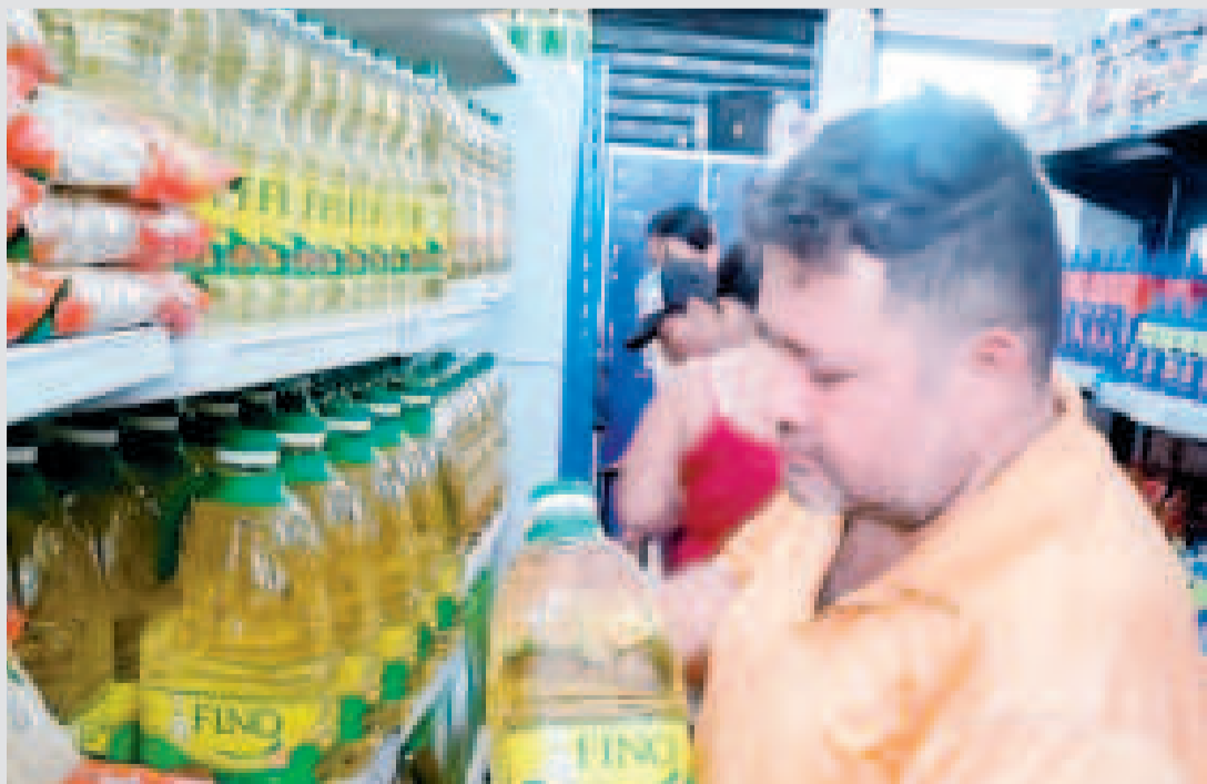
El aceite comestible ya se encuentra disponible en los mercados a precios relativamente estables.