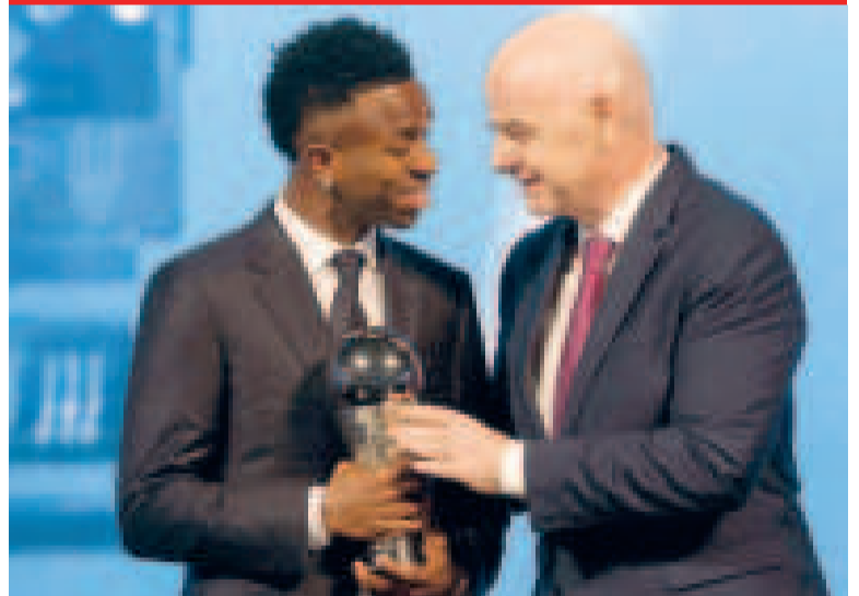
Vinicius recibe de Gianni Infantino de la FIFA el premio al mejor jugador del mundo.

The Best (femenino): Aitana Bonmatí (Bracelona). Entrenador (fútbol masculino): Carlo Ancelotti (Real Madrid). Entrenador (fútbol femenino): Emma Hayes (Estados Unidos). Portero: Emiliano 'Dibu' Martínez (Argentina). Portera: Alyssa Naeher (Chicago Red Stars). Premio Puskás: Alejandro Garnacho (Manchester United).