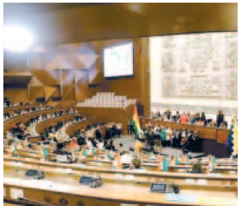
Diputados en una sesión.

En estas pasadas elecciones en cinco departamentos no se renovó a magistrados del Tribunal Constitucional Plurinacional y en dos regiones, además del TCP, tampoco del Tribunal Supremo de Justicia, debido a dos sentencias que declararon desiertas la preselección de candidatos.