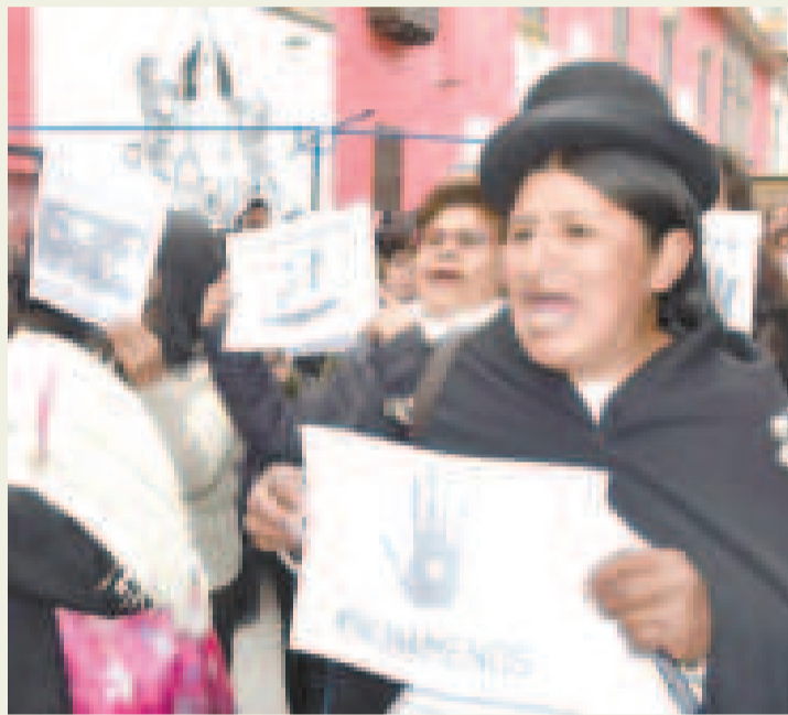
Marcha de protesta contra los feminicidios en Bolivia.

expareja, quienes antes de matarlas ejercen una brutal violencia contra ellas.