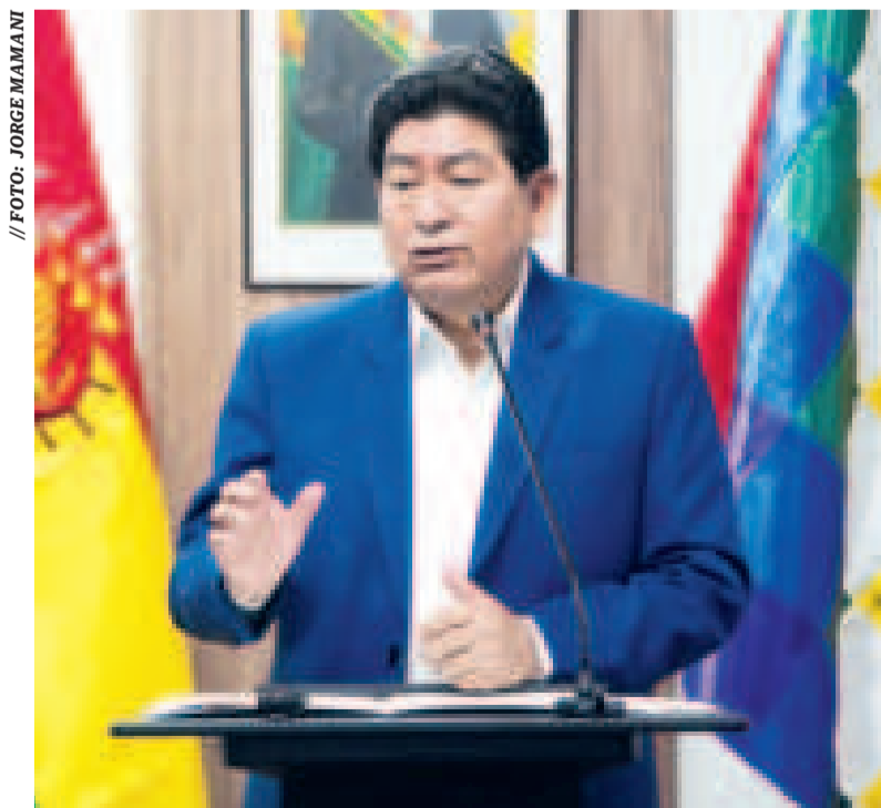
El ministro de Obras Públicas, Édgar Montaño.

Édgar Montaño, en referencia a un bloqueo de caminos que se desarrolló en el sector el lunes para oponerse al proyecto.