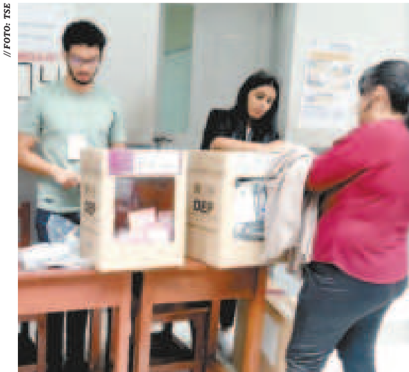
Una ciudadana emite su voto el 15 de diciembre.