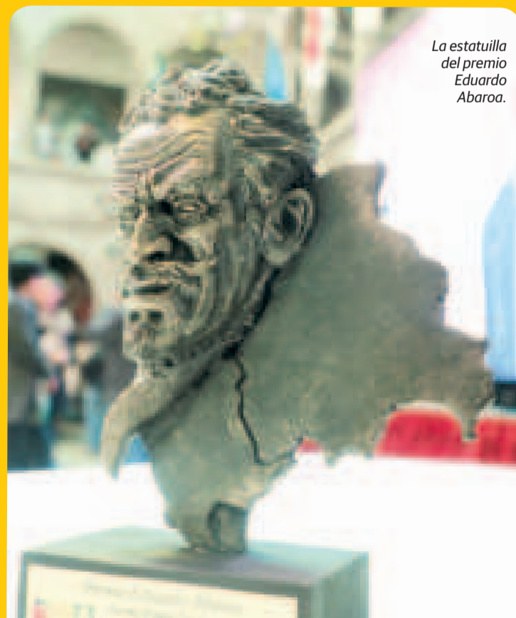
La estatuilla del premio Eduardo Abaroa.

Por otro lado, la temática Raíces y Horizontes: Bicentenario de Bolivia, que promueve la celebración de los 200 años de independencia de Bolivia, destaca la riqueza de su historia, diversidad cultural y el progreso alcanzado. Raíces representa el arraigo de Bolivia en sus tradiciones, valores y herencia cultural ancestral, mientras que Horizontes simboliza la visión de futuro del país y su potencial.