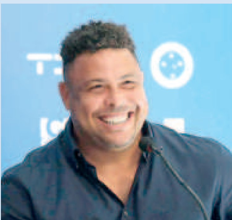
Ronaldo será candidato a la presidencia del fútbol brasileño.