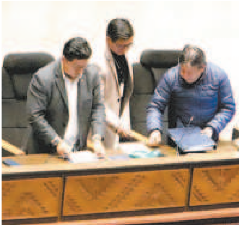
El presidente nato de la ALP, David Choquehuanca, en la testera del Legislativo.