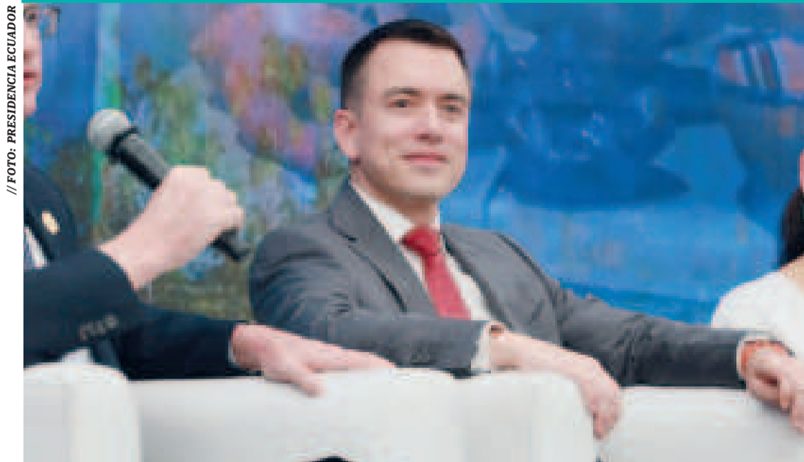
El mandatario ecuatoriano Daniel Noboa.