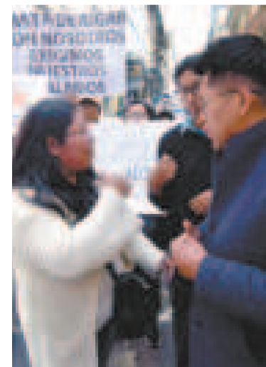
Protesta de trabajadores de Farmacias Bolivia.

Posteriormente trasladaron la protesta a puertas del Ministerio de Trabajo.