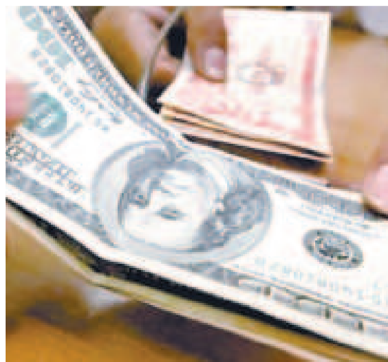
El tipo de cambio en Bolivia es estable desde hace más de una década.