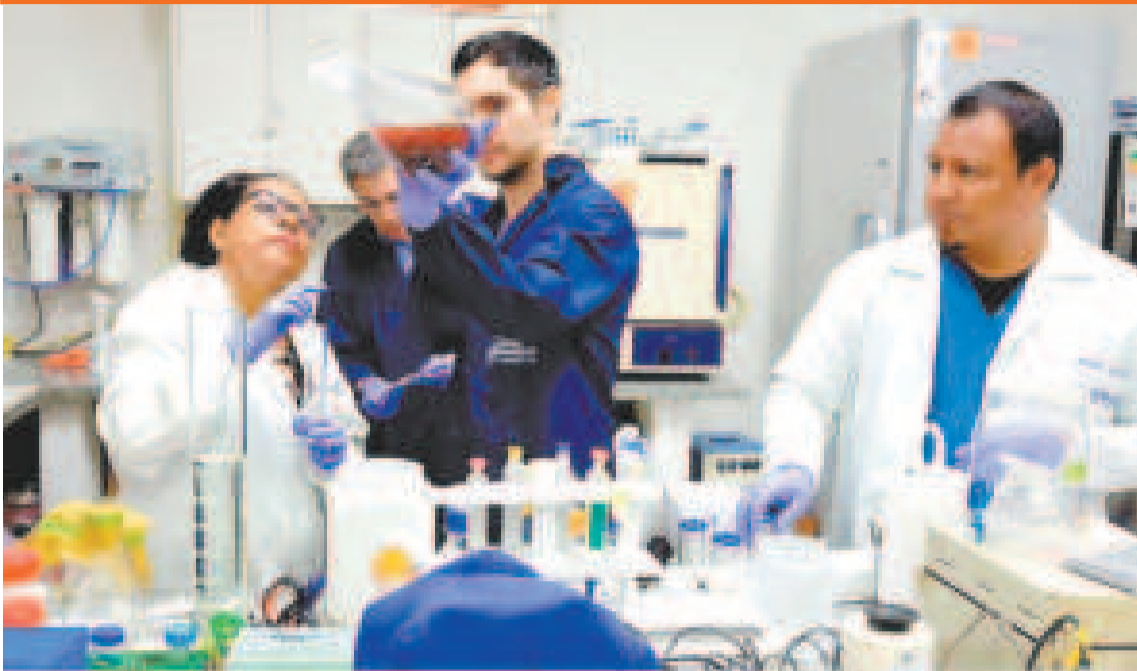
Personal de salud en el trabajo de diagnóstico de enfermedades.