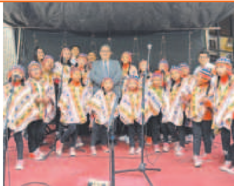
Inauguración del programa implementado por el BCB.