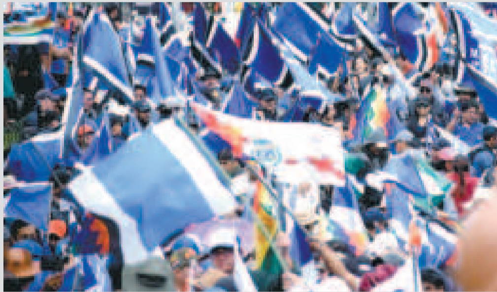
Militantes y simpatizantes hacen ondear las banderas del MAS-IPSP en La Paz.

Las organizaciones sociales de campesinos, indígenas e interculturales, además de otros sectores juveniles y urbanos, celebrarán el Día de la Revolución