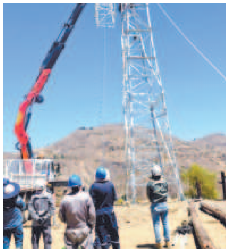
Personal de ENDE en los trabajos de mantenimiento.

“El trabajo fue ejecutado por equipos especializados de las regionales de Chuquisaca y Potosí, con el apoyo de una grúa de alta capacidad trasladada desde Cochabamba, destacando la capacidad técnica y operativa de ENDE Transmisión para enfrentar proyectos complejos, mediante la coordinación y el trabajo en equipo”, comunicó la empresa.