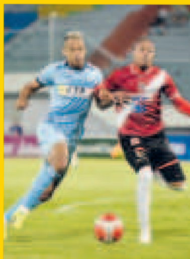
Una acción del cotejo que finalizó igualado.

Aurora y Nacional Potosí empataron a un gol y los dos equipos aseguraron su clasificación a la Copa Sudamericana, edición 2025. El cotejo de la fecha 29 se jugó ayer en el estadio Félix Capriles de Cochabamba.