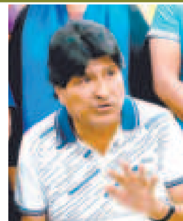
El expresidente Evo Morales.