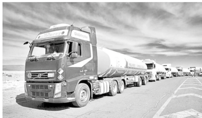
Cisternas transportan combustible importado por YPFB. YPFB

Permisos. A la fecha, 27 empresas de los sectores minero, agrícola, de la construcción y petrolero han recibido autorización