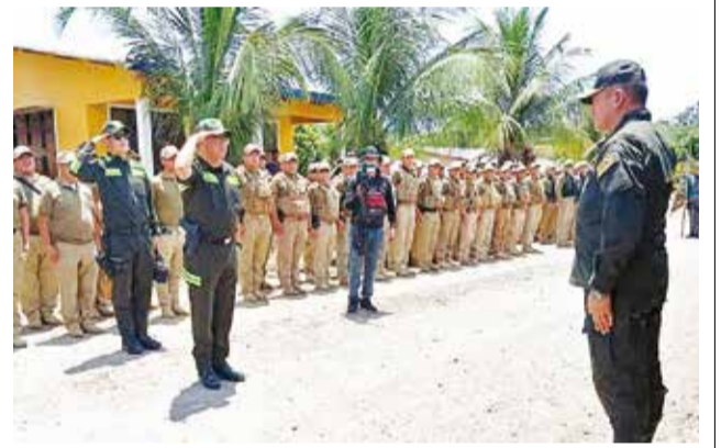
El acto de desagravio en el trópico, ayer.