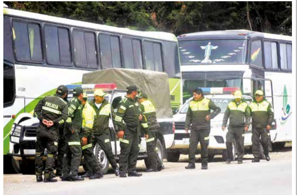
Los efectivos que retornaron a la ciudad por un incidente con los buses. JOSÉ ROCHA

“El personal policial destinado al Comando Regional del Trópico ingresó el sábado, un día antes de las elecciones judiciales; por ese motivo, hoy (ayer) por la mañana