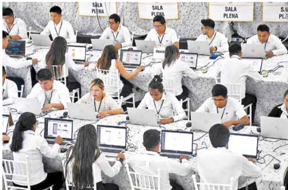
Funcionarios del Tribunal Electoral de Cochabamba en el conteo de votos, ayer.

Hassenteufel y Tahuichi Tahuichi explicaron que es suficiente tener siete magistrados por jurisprudencia, pues en 2011 se implementó el TCP con siete magistrados y “sería volver al origen”.