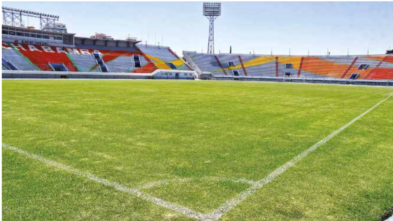
Una vista de la cancha principal del estadio Félix Capriles.

El Capriles vive un final de campeonato maratónico, ya que recibió hasta tres partidos por semana y ésta no será la excepción, debido a que desde un inicio tiene duelos martes (hoy), miércoles y sábado. Y es