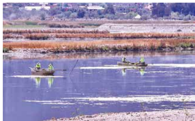
El nivel de la laguna Alalay tras las lluvias.