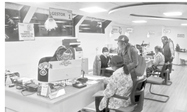
Jubilados hacen sus trámites en la Gestora, ayer.

El ajuste contempla retroactividad al 1 de octubre de 2024, lo que garantiza que los beneficiarios recibirán los montos correspondientes desde esa fecha, sin importar cuándo realicen el trámite.