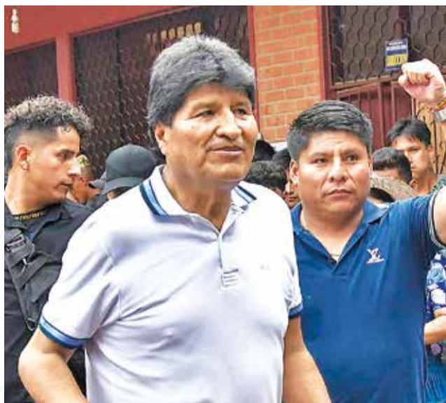
El expresidente del Estado Evo Morales.

El abogado de Morales, Nelson Cox, aseguró que la Fiscalía departamental de Ta-