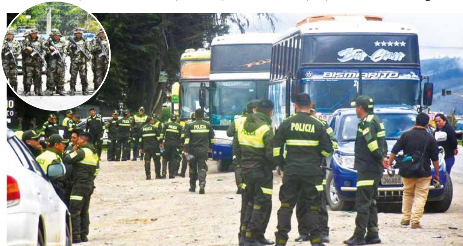
Los policías en la carretera por la prohibición de los buses de llevarlos al trópico. Luego, otros uniformados en el desagravio.

Servicio. Las entidades financieras normalizaron su atención con el retorno de los uniformados y también se incorporaron policías de Interpol para controles. Pág. 2