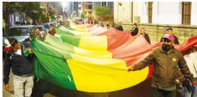
Vecinos del Distrito 2 protestan por alza de pasaje. H. ANDIA

Los movilizadost cuestionaron el impacto que tendrá la elevación de productos de la canasta familiar.