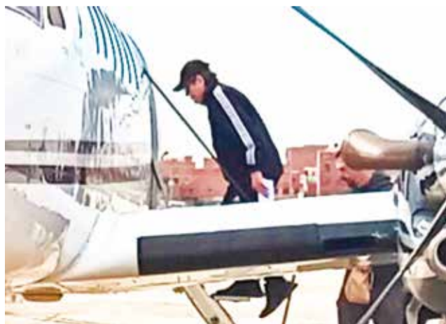
El exjefe antidrogas de Bolivia Maximiliano Dávila.

Respecto a la producción y distribución de cocaína, du-