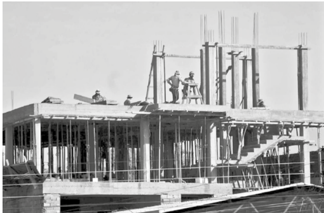
Un edificio en construcción en Cochabamba. CARLOS LÓPEZ

El informe destaca que entre el 60 y el 70 por ciento de los insumos para la construcción en Bolivia son importados. Esta dependencia