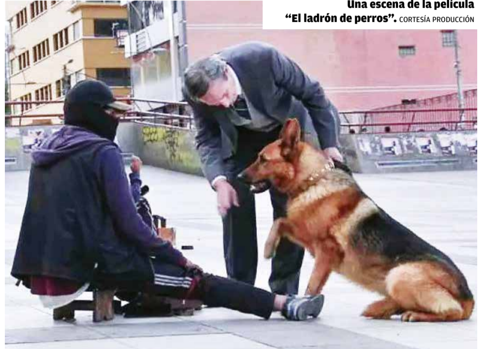
Una escena de la película “El ladrón de perros”.

Asimismo, dijo que recibieron una oferta para proyectar el filme en las comerciales de Argentina y añadió que para el próximo año tienen una agenda muy nutrida, con la posibilidad de cosechando más galardones en el contexto internacional.