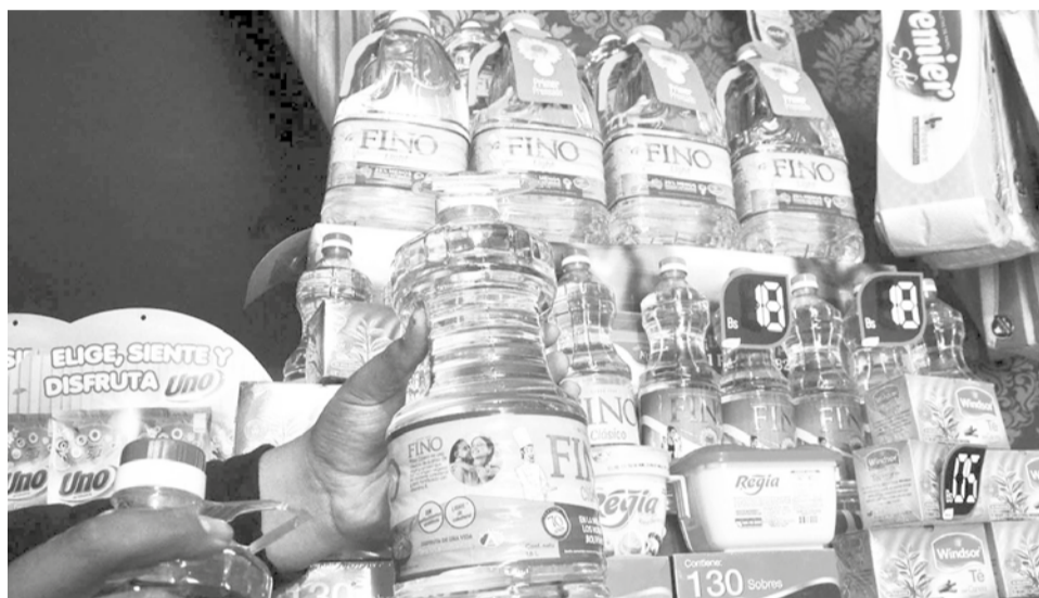
Venta de aceite comestible en una tienda de abarrotes en Cochabamba.

“Esta medida fue necesaria porque la distribución del producto cayó un 50 por ciento, lo que generó escasez y un aumento en los precios. La población reclamaba la falta de aceite en los mercados”, explicó Huanca en conferencia de prensa.