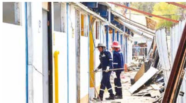
La inspección al avance de la plaza de comidas. HERNÁN ANDIA

Obras. Estiman concluir con las obras para la próxima versión de la feria. La inversión es compartida con los empresarios privados