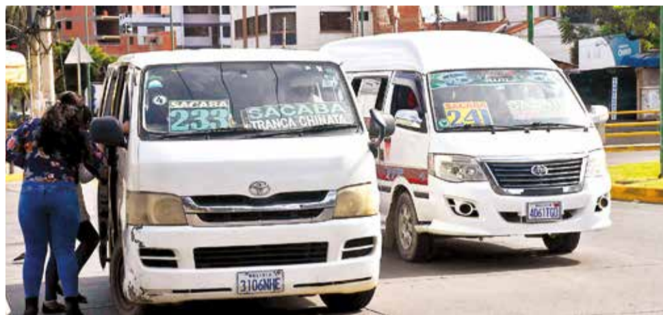
Los vehículos del transporte público que prestan servicio a Quillacollo, ayer.