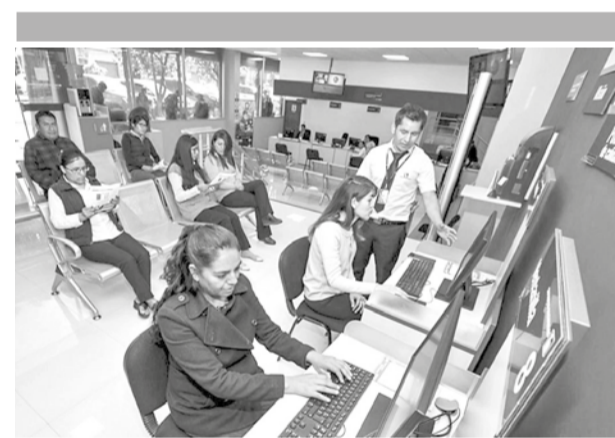
Contribuyentes realizan trámites en el SIN. SIN

“Estas iniciativas reflejan el compromiso del Gobierno con los sectores productivos del país, garantizando el suministro de combustibles, simplificando trámites y fortaleciendo la economía nacional”, destacó el MHE en un comunicado oficial.