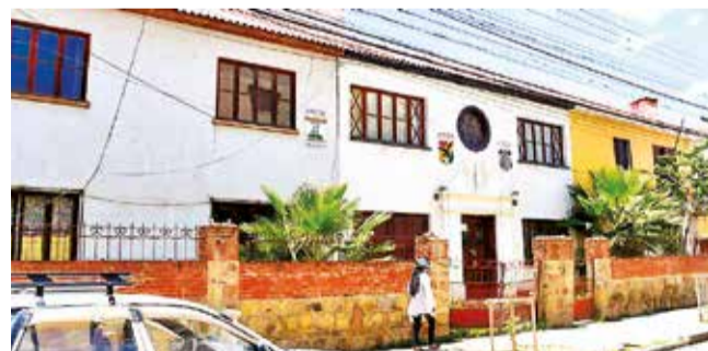
Frontis de la sede de la AFC, en la calle 16 de Julio. C.L.

Balance. Todas las categorías cumplen su calendario hasta antes de fin de año y la consolidación del complejo va por buen rumbo