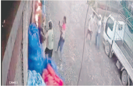
Supuestamente, Alanez es la persona con gorra y polera blanca del lado derecho de la imagen