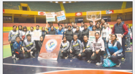
La Red Urbana es la anfitriona del evento deportivo

El campeonato se desarrolla en tres días de intensa competencia, donde los mejores serán acreedores a los premios en los primeros lugares, además de premios especiales a la mejor mascota y a la miss del campeonato.