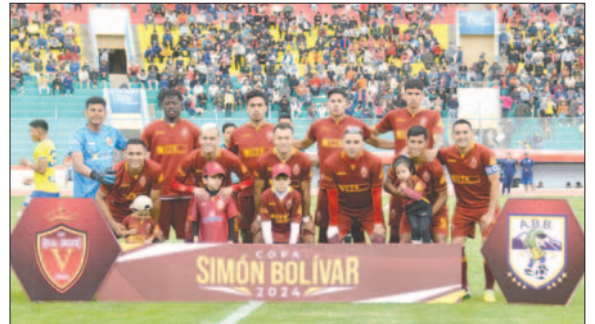
CDT Real Oruro pretende lograr el ascenso a costa de Royal Pari

CDT Real Oruro estuvo entrenando a conciencia en estos días, enfocados en el objetivo de lograr el ascenso a la División Profesional, deuda que tiene con su parcialidad luego de no poder alzar el título de campeón de la Copa "Simón Bolívar". Si bien la falta de ritmo futbolístico será un factor a tomar en cuenta, como ven-