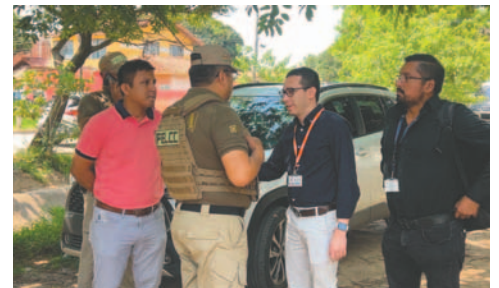
El implicado fue capturado tras un operativo conjunto

Por otra parte, una comisión de fiscales se trasladó al inmueble donde se encuentra la víctima para realizar las valoraciones correspondientes.