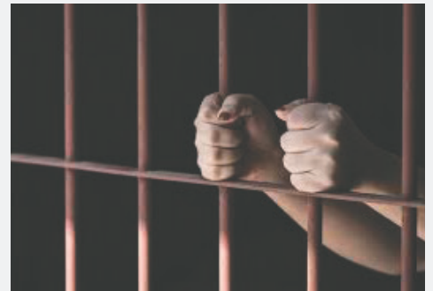
La justicia impuso 30 años de presidio luego de que la madre confesara el crimen /REFERENCIAL

Según el acta de autopsia elaborada por el Instituto de Investigaciones Forenses (IDIF), se reveló que el niño murió por anoxia anóxica debido a obstrucción intrínseca de orificios respiratorios por asfixia mecánica por sofocación.