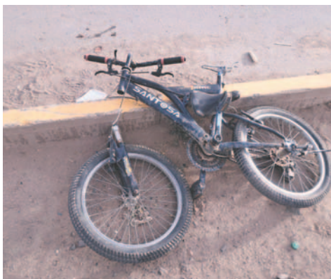
La bicicleta evidenció daños materiales y el niño también resultó herido