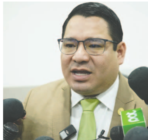
La cifra de feminicidios e infanticidios fue brindada por el Fiscal General del Estado, Roger Mariaca

do a toda la población a cuidar a nuestras niñas, niños y mujeres. Estos índices realmente llaman la atención, pero la prevención también tiene que ser un trabajo en conjunto con las diferentes instituciones e incluso dentro del mismo hogar”.