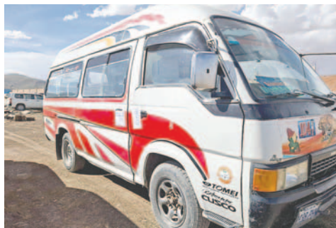
Las autoridades incautaron un minibús que fue utilizado por los implicados

Por el momento, se realizan las investigaciones para determinar si las personas aprehendidas tienen antecedentes criminales.