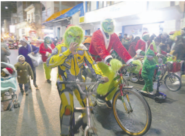
Niños, adolescentes y adultos disfrutaron de la caravana