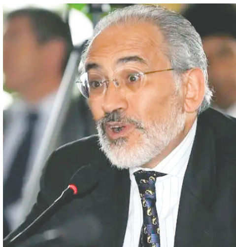
Carlos Mesa se sorprende por la ruptura entre Comunidad Ciudadana y el FRI

Tras la alianza del Frente Revolucionario de Izquierda (FRI) y el expresidente Jorge (Tuto) Quiroga,