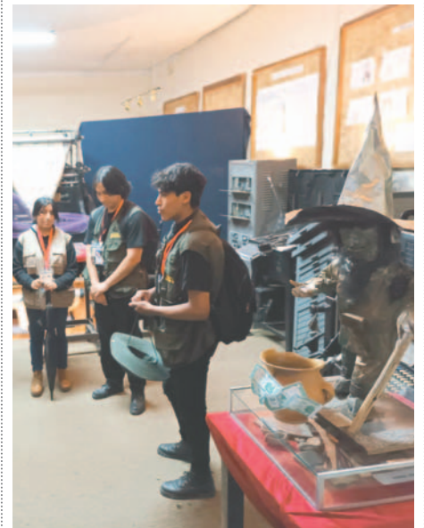
Los estudiantes en el museo de LA PATRIA junto al Duende del periódico

Un grupo de cuatro estudiantes realizó una pequeña ruta turística en un contexto académico. La elección del lugar se basó en un interés por conocer más sobre la historia y las leyendas asociadas al periódico y la ciudad.