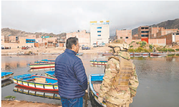
El Presidente del Estado, Luis Arce, en Desaguadero este martes

Asimismo, el Presidente enfatizó que el contrabando no es un problema reciente, pero aseguró que el Gobierno continuará intensificando las acciones necesarias para combatirlo y proteger el trabajo de los productores bolivianos.