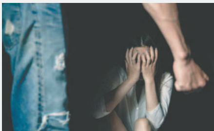
La víctima fue agredida sexualmente por su familiar tras asistir a una boda /REFERENCIAL