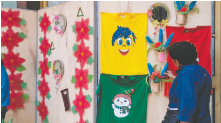
Variedad de artículos navideños fueron trabajados por los estudiantes en el año

La exposición navideña realizada por los estudiantes del centro, mostró el trabajo realizado en el año con tres educadoras que trabajaron paso a paso el desarrollo de los artículos que mostraron durante la jornada.