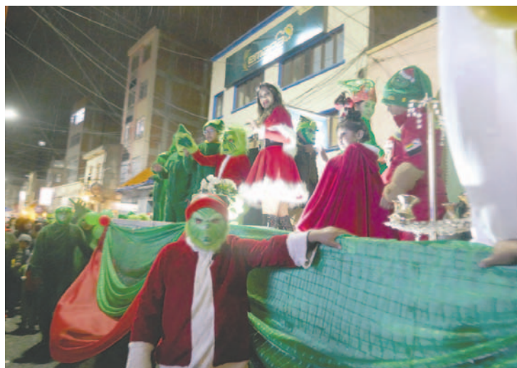
Los más pequeños disfrutaron de la Caravana Navideña