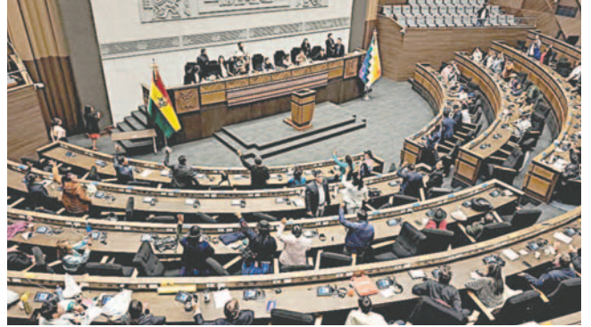
El receso legislativo comienza el 18 de diciembre y termina el 1 de enero de 2025 /FRSS

“El receso legislativo de fin de año inicia el 18 de diciembre de 2024 hasta el 1 de enero del 2025 y no contará con la comisión de la Asamblea al no haber sido conformada la misma en la tercera sesión ordinaria”, establece el comunicado.