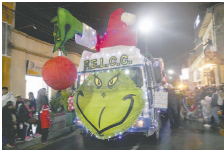
Los carros alegóricos fueron una de las distracciones de la noche