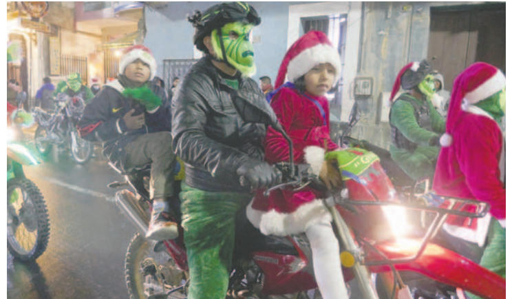
La caravana recorrió distintas calles de la ciudad