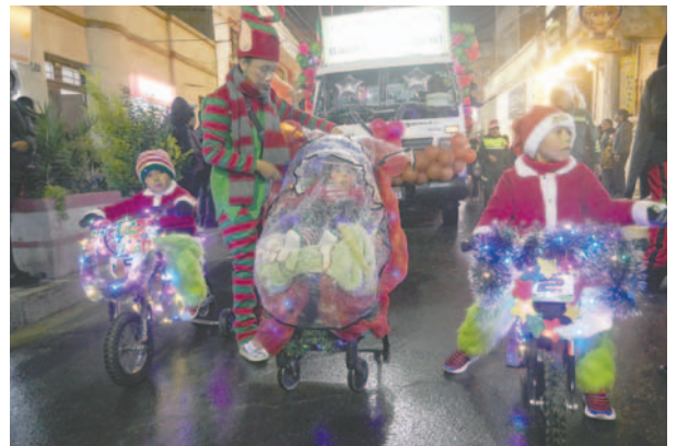
Lluvia no detiene la alegría navideña en Oruro