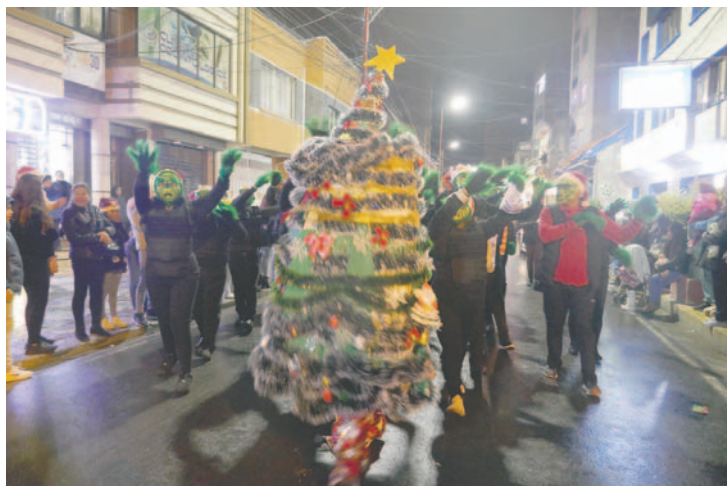
Derroche de alegría durante la Caravana Navideña policial