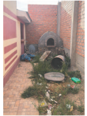
La droga fue hallada dentro del horno en una casa en Challapata

El Ministerio Público emitirá un requerimiento conclusivo con relación a estas personas al finalizar el periodo de detención pre-