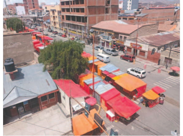
Feria Navideña ya se instaló en la Avenida 6 de Agosto /LA PATRIA

“Nosotros vamos a estar haciendo seguimiento a la presente ley porque Oruro quiere que esté vacía la 6 de Agosto para el beneficio del