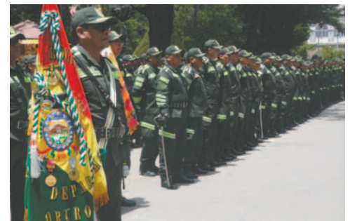
El acto se efectuó sobre la Adolfo Mier, en pleno centro de la ciudad de Oruro