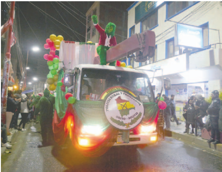
Carro alegórico de la Policía Rural y Fronteriza