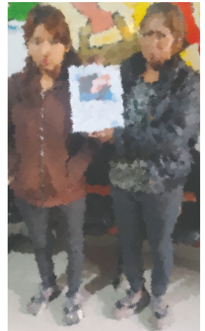
La mujer fue entregada a su madre en instalaciones de la Policía en Oruro

La joven indicó que tendría una relación amorosa con el sujeto que vive en Chile; sin embargo, no tenía certeza de los fines de su viaje a Chile, por lo que se evitó un presunto caso de trata de personas. Arequipa precisó que la madre de la joven llegó a Oruro el sábado 14 de diciembre y, aproximadamente a las 22:30 horas, mediante un acta se hizo la entrega de la dama.