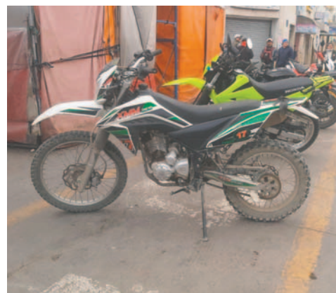
La motocicleta fue incautada por Tránsito

“Cuando el motociclista realizaba su recorrido por la avenida 24 de Junio a la altura del ingreso a la urbanización El Carmen, con sentido de circulación de Este a Oeste, y por la velocidad que estaba imprimiendo, impacta contra el