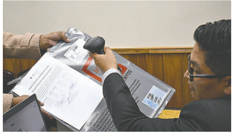
Conteo de votos llega casi a su conclusión / TED ORURO

De forma transparente y transmisión continua, a través de las redes sociales