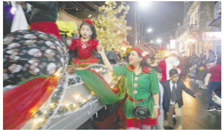
Familias orureñas disfrutaron de mágica noche navideña