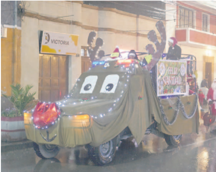
A pesar de la lluvia, la caravana policial siguió su trayecto hasta llegar a la plaza principal