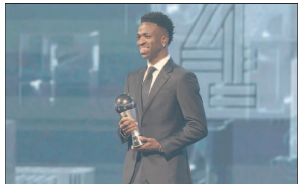
Vinicius ganó su primer The Best de la FIFA

Pieza clave en la conquista de la liga española, la Champions League y las Supercopas de Europa y de España, "Vini" protagonizó su campaña más goleadora, con 24 tantos. Títulos que también impulsaron al italiano Carlo Ancelotti a ser reconocido como el mejor entre-