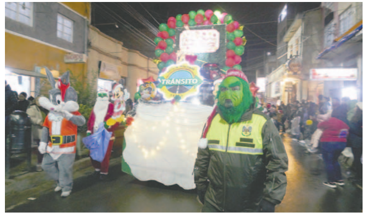
La caravana en su ingreso por la calle 6 de Octubre