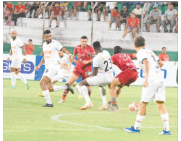
Una acción del empate entre Guabirá y Royal Pari