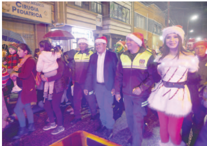
Autoridades de la Policía y el Gobierno fueron parte de la caravana