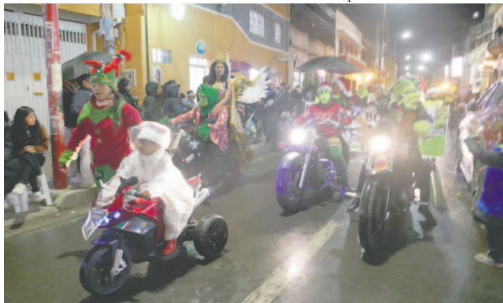
Pese a la lluvia, los niños se contagiaron de alegría y espíritu navideño

17 de diciembre. Las familias orureñas, y sobre todo los más pequeños, disfrutaron de los carros alegóricos y el júbilo de los uniformados, pese a la intensa lluvia.