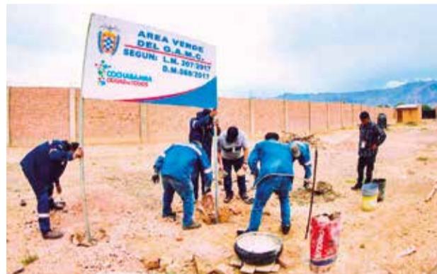
La intervención en el predio ocupado ilegalmente. GAMC

Varios compradores aprovecharon el operativo para quejarse.