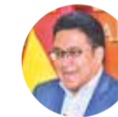
CÉSAR SILES Ministro de Justicia

El ministro Cesar Siles, a propósito de la extradición de Maximiliano Dávila, dijo que el narcotráfico es un delito que llegaría a socavar