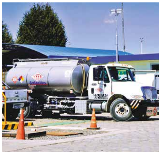
Una de las cisternas de YPFB Aviación. YPFB

YPFB Aviación también informó que en 2024 planea suministrar más de 217,5 millones de litros de combustible de aviación, asegurando el abastecimiento tanto para el mercado nacional como internacional.