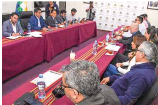
La reunión de autoridades y ejecutivos de Caniob, ayer.

cesita con celeridad y con toda tranquilidad consumir este producto. Entonces, lo que nosotros hemos acordado es que las industrias hagan un mayor esfuerzo para abastecer rápidamente este producto al mercado", señaló Huanca en conferencia de prensa en la ciudad de La Paz.