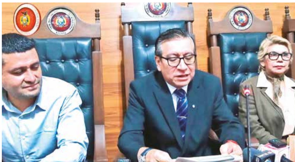
Integrantes del Tribunal Constitucional en conferencia de prensa.

“Tengan la certeza de que el Tribunal Constitucional Plurinacional va a seguir trabajando para que se cumpla la Constitución para garantizar los derechos de los y las bolivianas”, dice el documento.