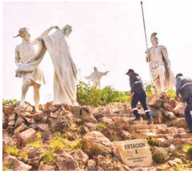
Las esculturas se encuentran en el cerro San Pedro.