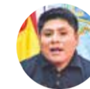
LEONARDO LOZA Senador evista del MAS

Leonardo Loza, senador del ala evista del Movimiento Al Socialismo (MAS), reprochó la decisión del Gobierno de ex-