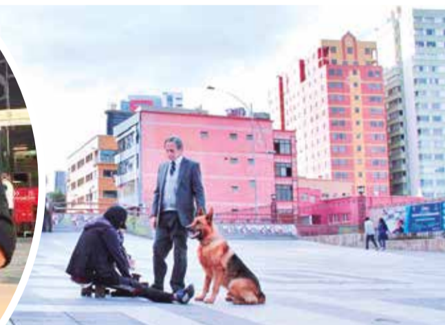
El rodaje de la película en La Paz.