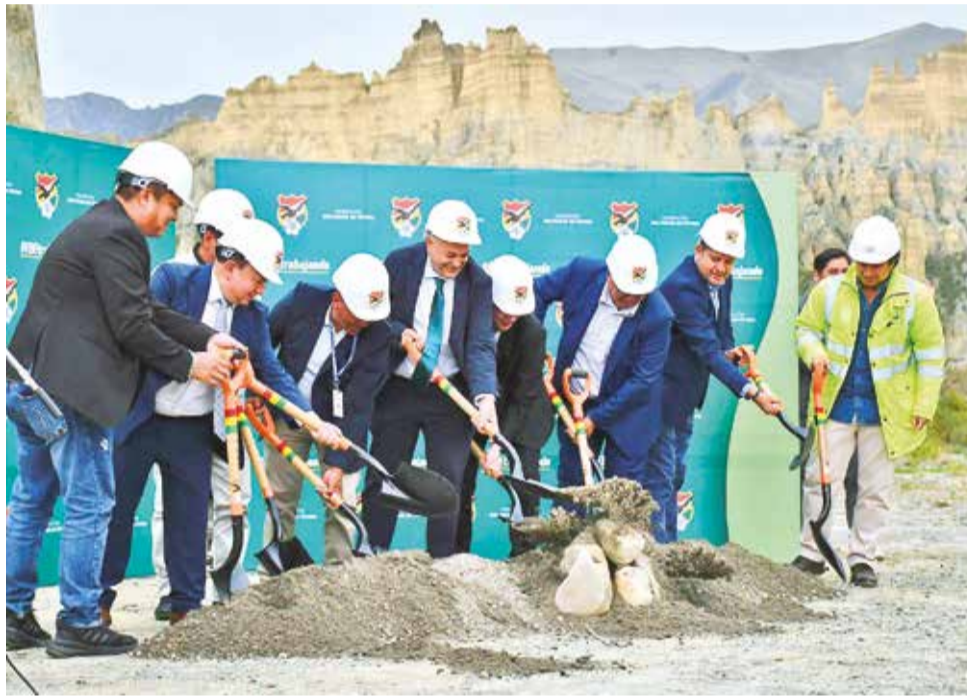
Dirigentes de la FBF dan inicio a la obras de la Casa de la Verde, ayer.

“La idea es mejorar siempre, para que los clubes puedan salir de esta crisis que tienen a nivel nacional. Esperemos hacer el mejor contrato con la empresa, que ofrezca más y tenga las