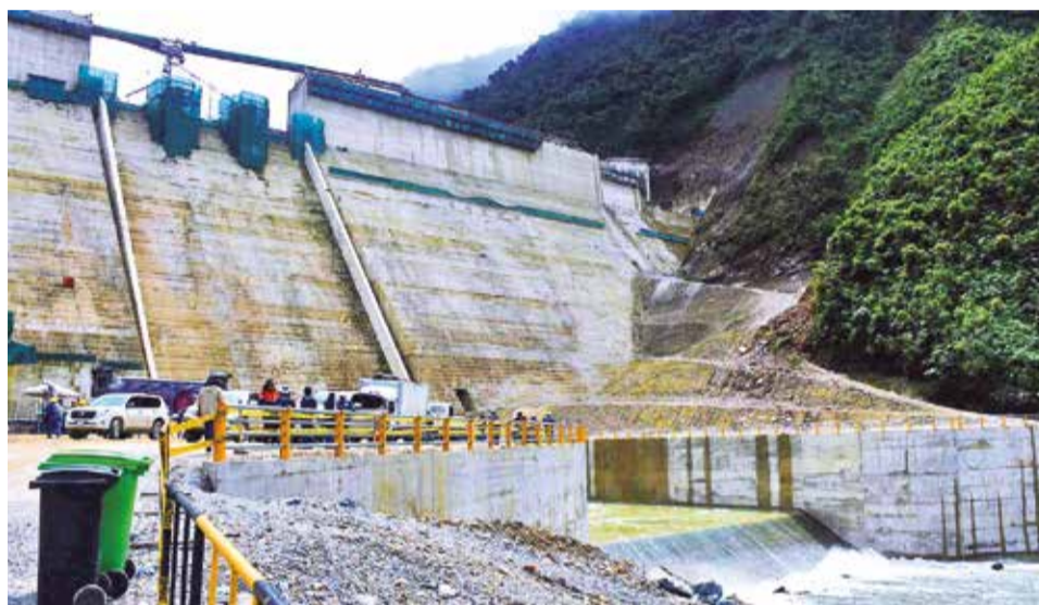
El embalse de Sehuenca que forma parte del proyecto hidroeléctrico Ivirizu.

Herbas destacó que el proyecto hidroeléctrico Ivirizu, con una capacidad proyectada de 290 megavatios y una inversión de 602 millones de dólares, ampliará la oferta eléctrica y potenciará las exportaciones. Esta obra contribuirá no sólo a satisfacer la creciente demanda interna, sino también a abastecer mercados como Argentina y Brasil.