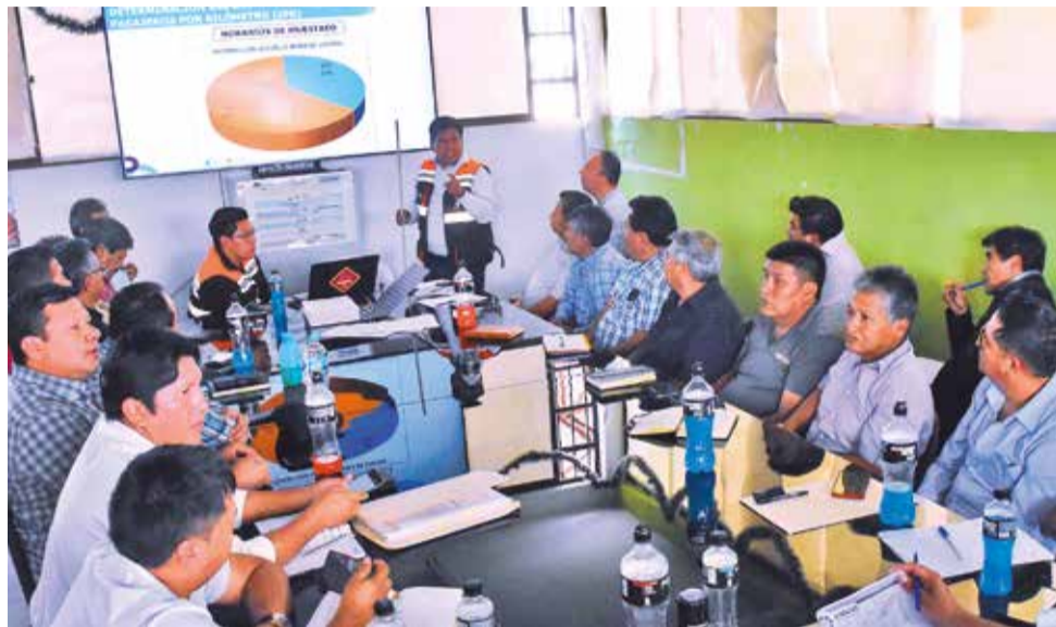
La socialización del estudio de costos en el Comité del Transporte, ayer.