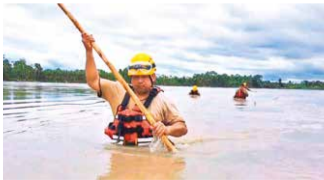
El rastillaje para rescatar a un desaparecido. GOBERNACIÓN

Búsqueda. Las tareas para rescatar los restos de una persona desaparecida en el río Chimoré persisten desde el pasado martes