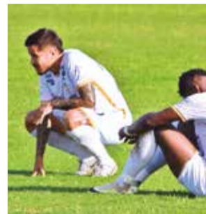
Jugadores de Real Santa Cruz, tras el descenso. APG

El primer descenso de categoría en Bolivia se consumó en el año 1954, cuando Always Ready perdió su cupo al cabo de la temporada, en años en los que el fút-