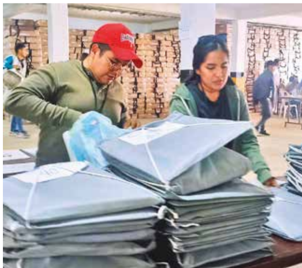
Traslado de maletas electorales a centros de votación. C.L.

A principios de noviembre, el Constitucional declaró desierta la convocatoria para elegir a los magistrados de ese tribunal y del TSJ en