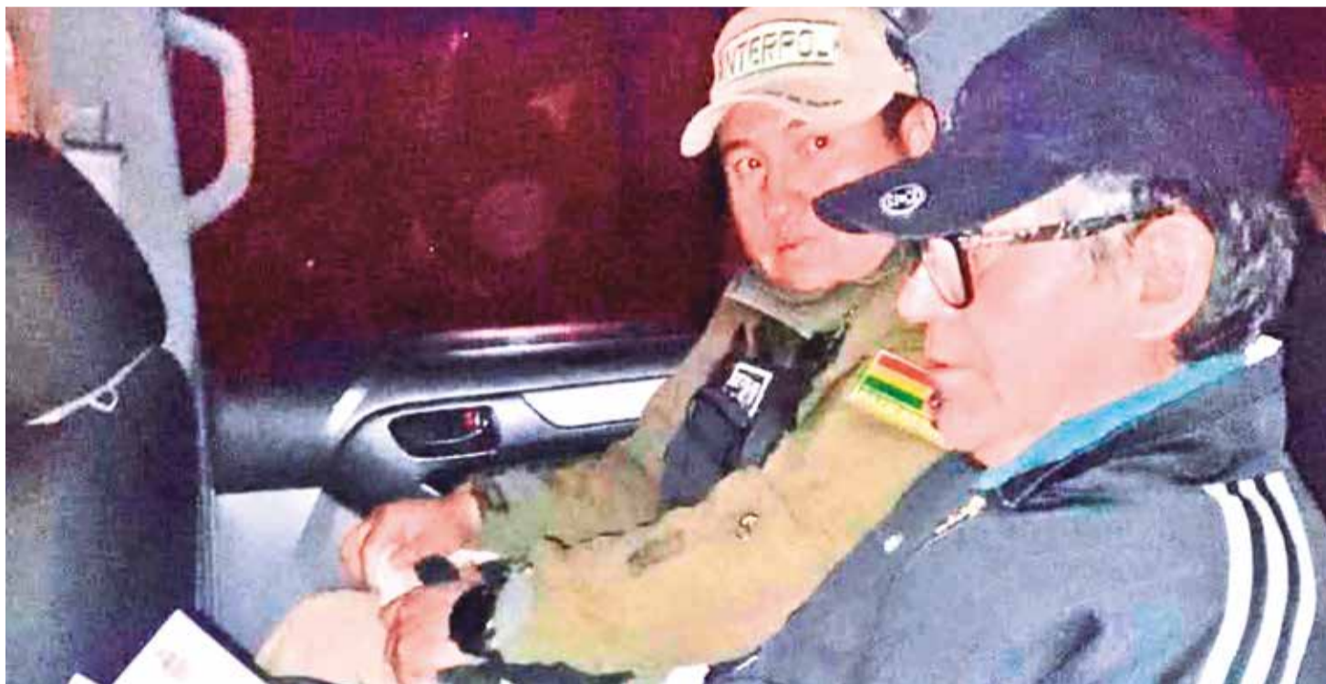
El momento en que el exjefe antidroga es trasladado al aeropuerto de El Alto para su extradición a EEUU, en un operativo fugaz, ayer.

Reacciones. El Ministro de Gobierno calificó el traslado de un “hito”. En tanto, Morales cuestionó y manifestó que el país volvió a ser una “colonia”. Págs. 8-9