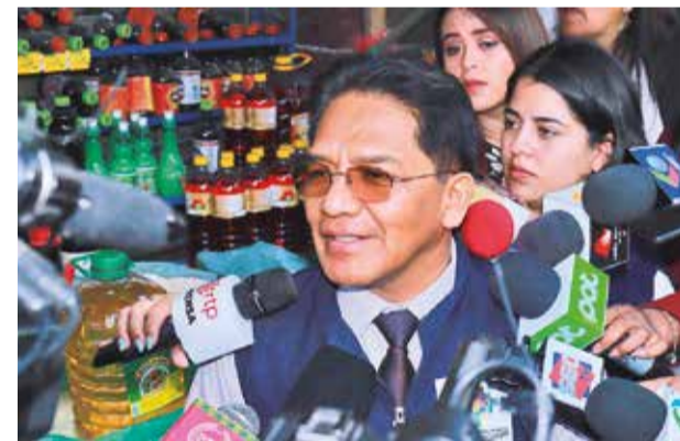
Jorge Silva, viceministro de Defensa del Consumidor.

El conflicto escaló esta semana con un paro de actividades organizado por los ingenios, quienes exigieron al Gobierno reconsiderar sus medidas. La tensión aumentó tras el hallazgo de arroz almacenado en cinco ingenios de Montero.