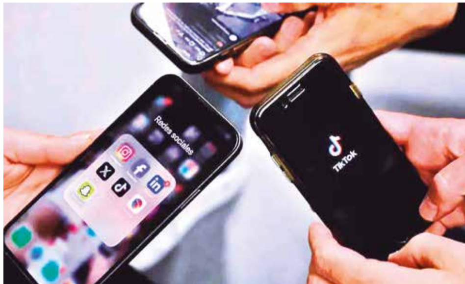
Los gigantes tecnológicos con mayor número de usuarios en Australia y el mundo.

Jones acotó que la medida refuerza el anterior código de negociación de los medios de