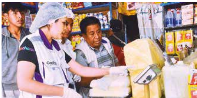
El control a la venta de productos en La Cancha. H. ANDÍA

Mercado. La venta de arroz, azúcar, aceite y carne de pollo fue controlada ayer en un operativo en La Cancha y vías adyacentes