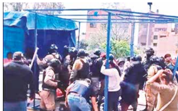
La disputa entre comerciantes y funcionarios. RR.SS.

“Esta persona estaba en un bote con su familia, pero se volcó y desde allí está desaparecido”, dijo.