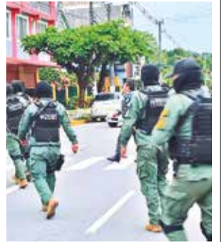
Un grupo de policías en el trópico. D. JAMES

“Los municipios se comprometieron a mejorar las