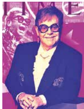
El cantante británico Elton John.

Después de realizar unos 4.500 conciertos a lo largo de medio siglo, se retiró de las giras a fines de 2023, aunque sigue su actividad en la producción cultural.