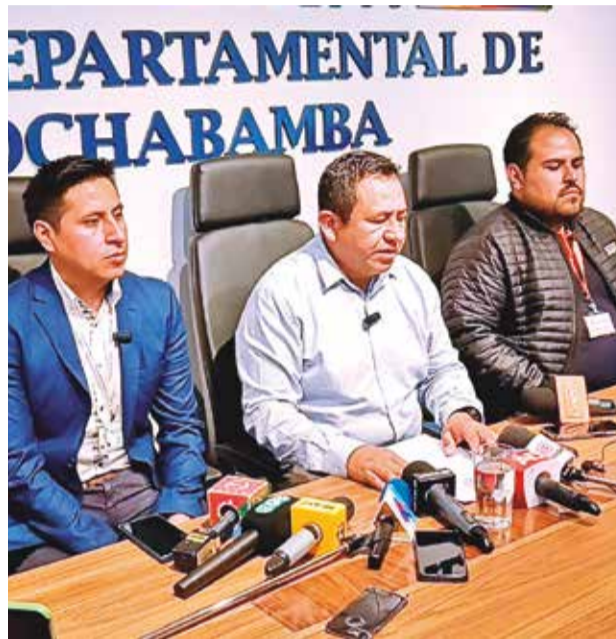
La comisión de fiscales de Sucre y Cochabamba.

Los familiares de las víctimas y del acusado prestarán su declaración informativa.