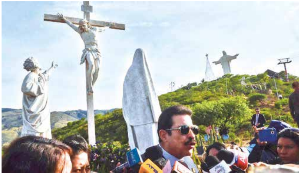
El alcalde Manfred Reyes Villa en la entrega de estaciones del viacrucis.