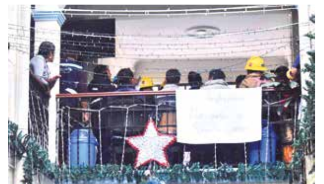
La protesta en el Concejo de Tiquipaya ayer.

Adelantó que más adelante podría reportarse un brote de un nuevo serotipo.