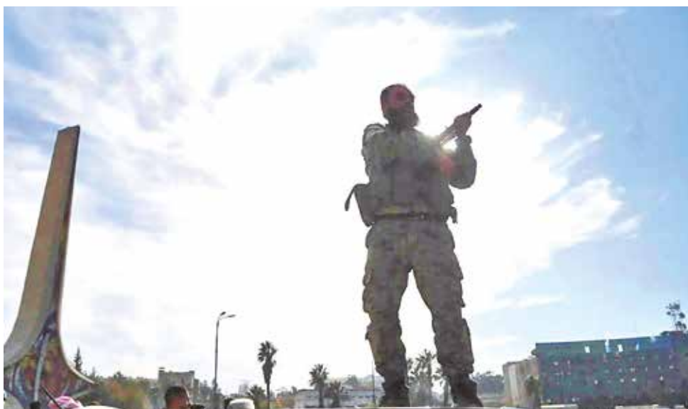
Rebeldes sirios en la plaza Omeya en Damasco, Siria.

Al Bashir fue nombrado el pasado enero como jefe del Gobierno de Salvación, una suerte de rama política que está vinculada al Organismo de Liberación del Levante (Hayat Tahrir al Sham o HTS, en árabe).