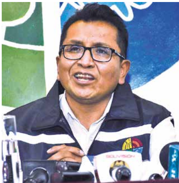
El defensor del pueblo, Pedro Callisaya.

El informe apunta a La Paz, donde se registran más casos,