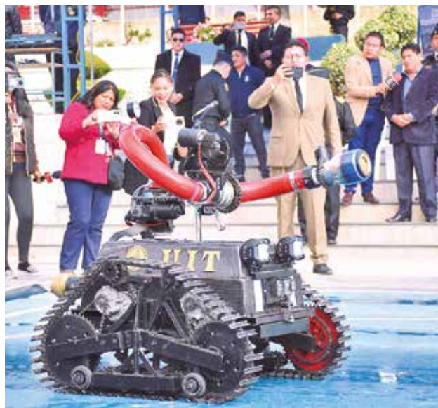
El robot Erizo servirá para combatir incendios.