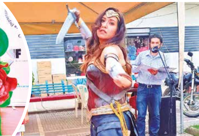
Una de las actividades que se desarrollaron en la octava versión del evento. CDLC