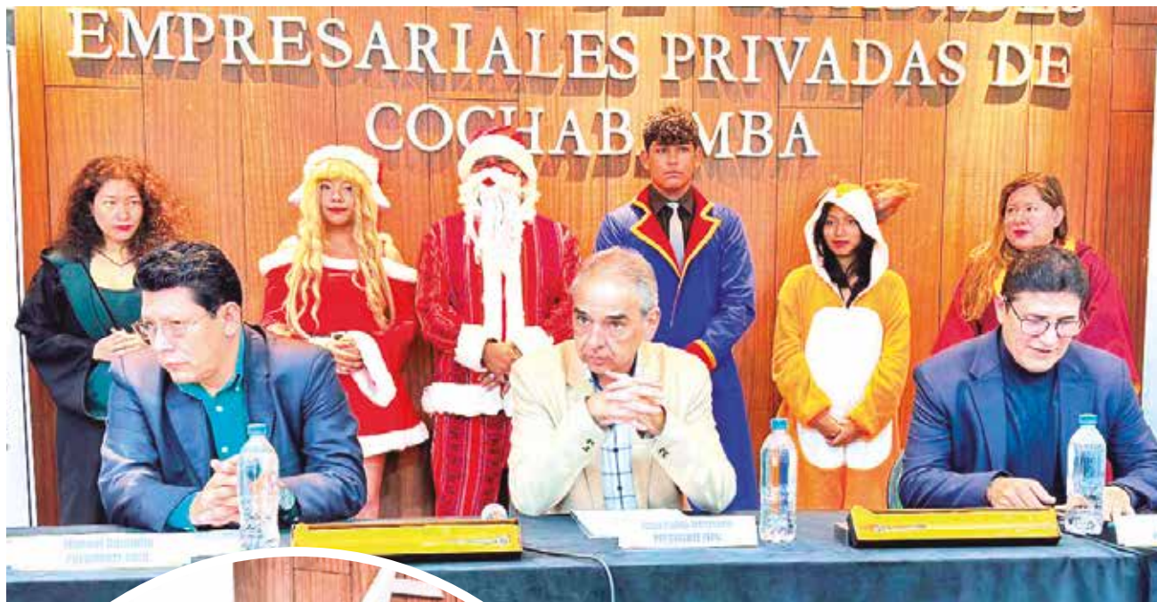
Los organizadores presentan la Expolibro Navideña 2024. CDLC

Los organizadores esperan alcanzar el éxito de las versiones anteriores pese a que este año estrenan escenario, puesto que hasta la octava versión la actividad cultural se desarrollaba en la plaza del Granado.