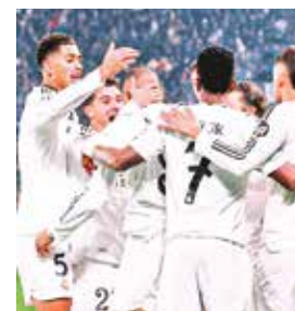
Festejo de jugadores de Real Madrid, ayer.