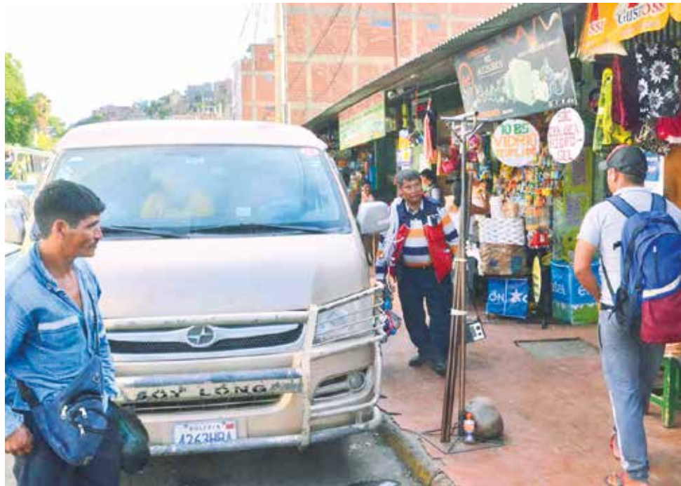
La parada de minibuses al trópico en la avenida Oquendo de la ciudad ayer.

El acta refiere que la subida se debe al aumento de los costos de los repuestos y el mantenimiento de los vehículos.