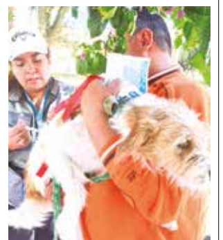
La vacunación contra la rabia en Cercado. H. ANDÍA

Precisó que los signos de alarma en una mascota son un comportamiento agresivo y que se esconden en lu-