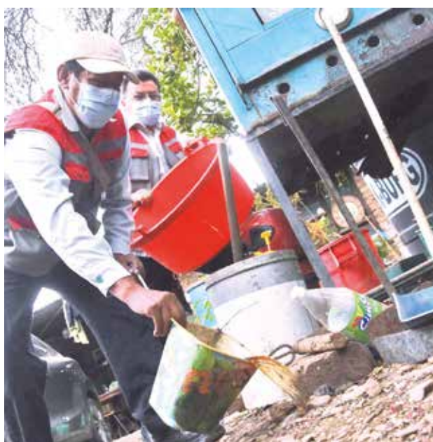
La destrucción de criaderos de Aedes aegypti . D. JAMES

“Nuestro equipo de técnicos vectores está haciendo el acompañamiento necesario, está haciendo la evaluación entomológica para identificar los índices de identificación de infestación vectorial,