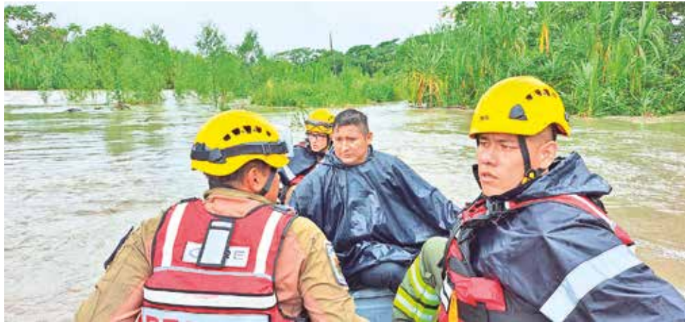
El rescate de personas aisladas por la crecida del río 24 en Villa Tunari.

Camacho remarcó que la refacción del cable de 180 metros es urgente y precisó que se requiere 150 mil bolivianos para