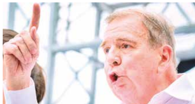
El líder opositor venezolano Edmundo González Urrutia.

Posición. Sobre los posibles riesgos de volver a su país para tomar el mando, afirmó que “con miedo no se va a la guerra”