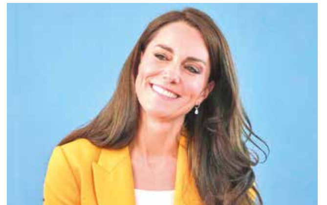
La princesa Catalina de Gales. LOS ÁNGELES TIMES

En la parte de los músicos, el artista que más curiosidad ha generado entre los usuarios de Google ha sido Diddy —cuyo nombre real es Sean Combs y que este año fue arrestado y acusado de extorsión, tráfico sexual y transporte para ejer-