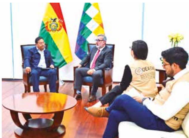
El presidente Luis Arce con la misión de observadores.

De acuerdo con una nota de prensa de la OEA, la misión está compuesta por 17 especialistas y observadores de 10 países, y analizará temas relacionados con la organización y tecnología electoral, justicia electoral, judicatura y partici-