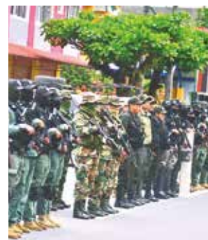
Efectivos en el trópico.

Además, adelantó que para las elecciones judiciales coordinaron con las Fuerzas Armadas, para que sean las