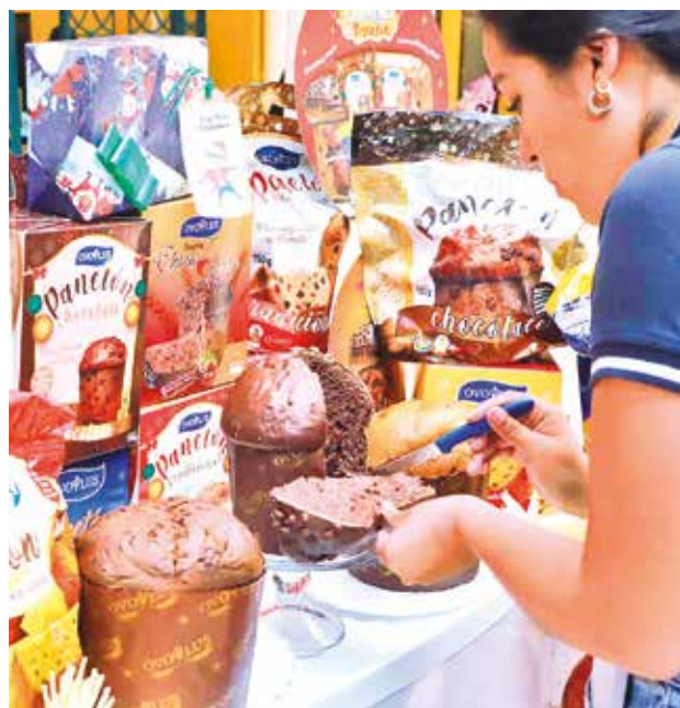
La oferta de panetones con registro sanitario.

“Si hay denuncia, vamos a la planta para tomar la muestra y llevarla a laboratorio. Si hay algún cuerpo extraño, se