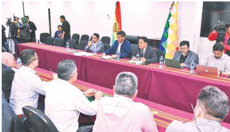
La reunión entre autoridades de Gobierno y productores de aceite, ayer.

1. Abastecimiento interno garantizado: Las empresas del sector oleaginoso se comprometieron a proveer aceite en cantidades suficientes para el mercado interno, manteniendo precios regulados. Se estableció que una botella de 900 mililitros tendrá un costo máximo de 11 bolivianos, mientras que