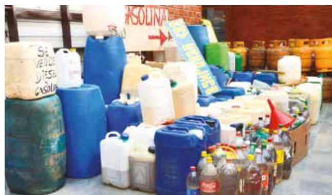
Combustible incautado por la ANH. HERNAN ANDIA

Decomisos. Entre los bienes incautados destacan 42 cisternas, 314 vehículos, 202 tanques adicionales y 53 depósitos improvisados