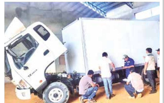
Uno de los camiones furgones entregados.

El FPS tiene en curso cinco procesos de licitación adicionales para ampliar la dotación de camiones furgones a otras plantas industriales. Entre los proyectos en espera destacan la planta de transformación de cebolla en Mizque y la planta de procesamiento de trigo en Raqaypampa, que prometen un impacto significativo en las economías locales.