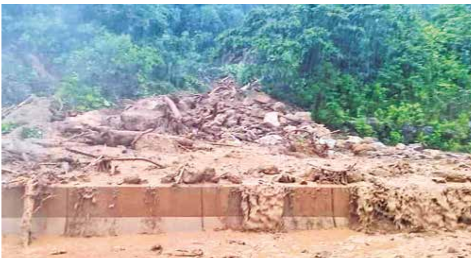
Las carreteras del país también fueron afectadas por las lluvias.

En regiones como Beni se cortaron las vías camineras y, en la carretera nueva desde Cochabamba al oriente, se registró un deslizamiento sobre la vía.