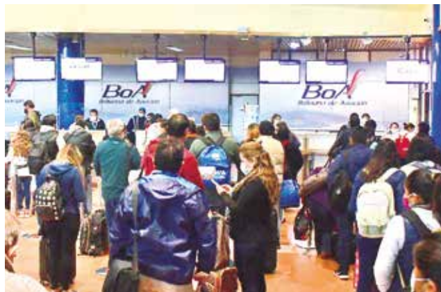
Los mostradores de BoA en el aeropuerto. CARLOS LÓPEZ

Uno de los aspectos más destacados del programa