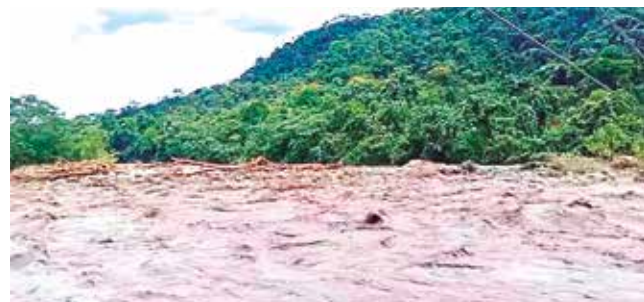
La crecida del río San Mateo en Shinahota.