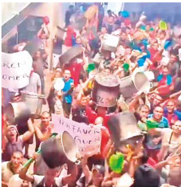
La protesta de reclusos en la cárcel de Palmasola.