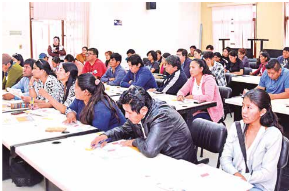
Capacitación de jurados por miembros del Tribunal Electoral Departamental. TED