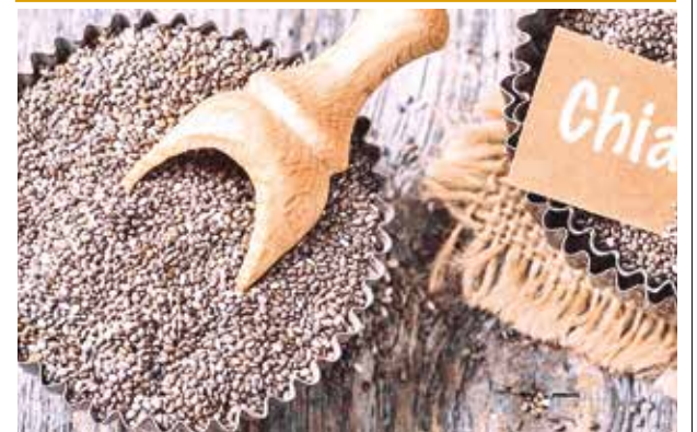
Chía boliviana que será exportada a China.

El viceministro de Defensa, Augusto García, destacó los logros alcanzados y exhortó a la ciudadanía en general a denunciar el contrabando de combustibles, enfatizando que este delito perjudica directamente a los recursos públicos destinados a la subvención de combustibles.