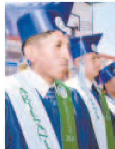
Técnicos egresados en Uyuni.

En Bolivia, los centros penitenciarios cuentan con programas educativos y de capacitación para los privados de libertad, tales como Centros de Apoyo Integral Pedagógico (CAIP), dirigidos a niños y niñas que viven en centros penitenciarios del Estado Plurinacional de Bolivia, entre otros.