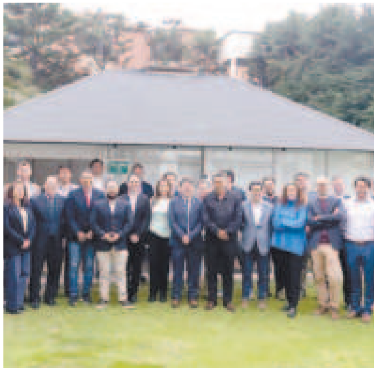
Miembros del Subgrupo de Socios para el Desarrollo Energético.