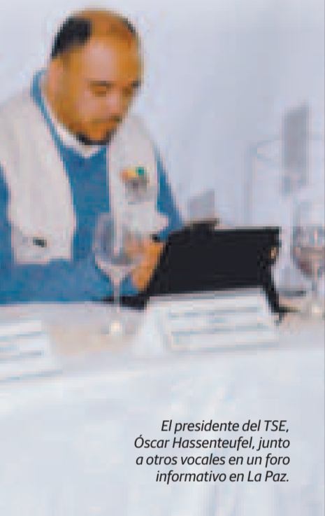
El presidente del TSE, Óscar Hassenteufel, junto a otros vocales en un foro informativo en La Paz.