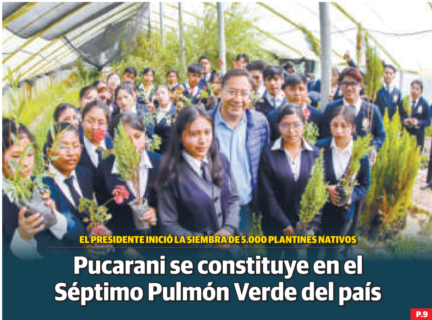
EL PRESIDENTE INICIÓ LA SIEMBRA DE 5.000 PLANTINES NATIVAS