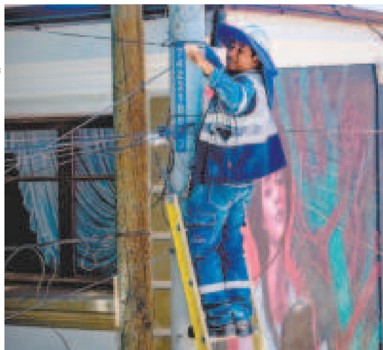
Un trabajador de Entel en la instalación de la fibra óptica.