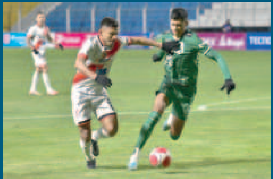
Una escena del partido que se disputó ayer en el estadio potosino.

En la próxima fecha, Nacional Potosí visitará al equipo de Aurora, en el estadio Capriles de Cochabamba.