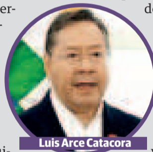
Luis Arce Catacora

A diferencia de los otros procesos, de 2011 y 2017, éste será parcial. Solo en Chuquisaca, La Paz, Oruro y Potosí se elegirá a las autoridades de las cuatro instancias, es decir, del Consejo de la Magistratura, del Tribunal Agroambiental, del Tribunal Supremo de Justicia y del TCP.