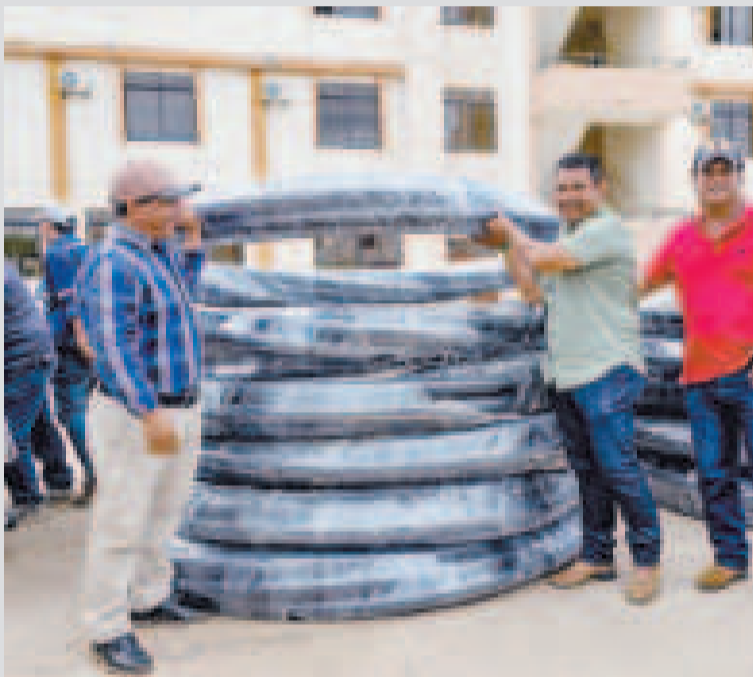
Parte de los insumos que entregó el Gobierno para la perforación de pozos.