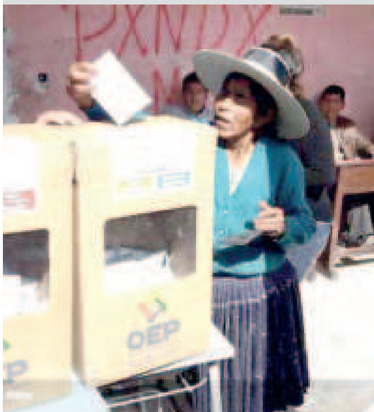
Elección judicial en Llallagua, en 2017.