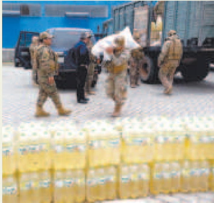
Militares incautaron mercadería de contrabando a la inversa.

Así lo informó ayer el viceministro de Lucha Contra el Contrabando, Luis Amílcar Velásquez, durante una conferencia de prensa.