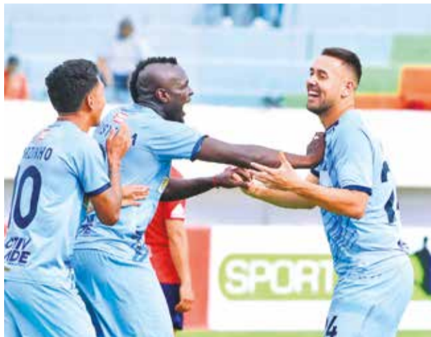
Festejo de los jugadores de Aurora, el domingo en el clásico valluno 159 ante Wilstermann. JOSE ROCHA

puntos más para ratificarlas. No obstante, la forma de repartir los premios generó mucha confusión, en especial porque el Torneo Apertura dio dos premios de manera prematura y esto generó un relajamiento de los elencos.