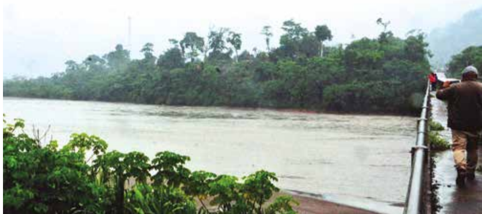
La crecida del caudal de un río en el municipio de Villa Tunari.