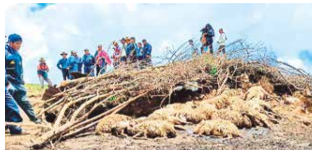
Las ovejas muertas por la caída de un rayo.