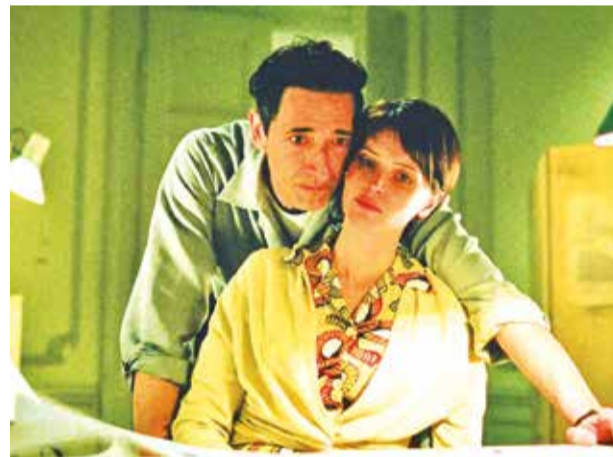
Imagen de la película The Brutalist