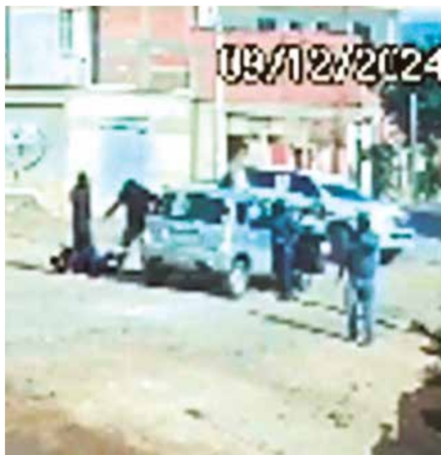
Imágenes del atraco en la zona sur.

“Todos estaban encapuchados y armados, me apun-