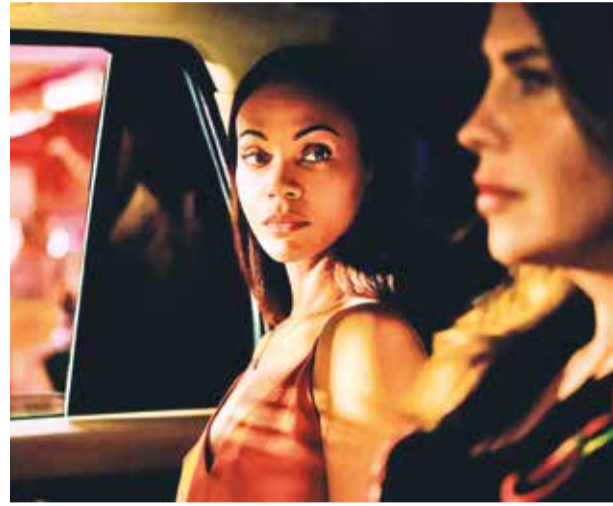
Una escena del filme Emilia Pérez.

También la colombiana Sofía Vergara, que ha estado nominada a estos premios en cuatro ocasiones, aspirará a su primera estatuilla por su papel en Griselda , la serie de Netflix en la que se convertía en "la reina de la coca" en mundo cri-