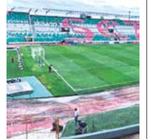
El estadio Ramón Aguilera Costas.