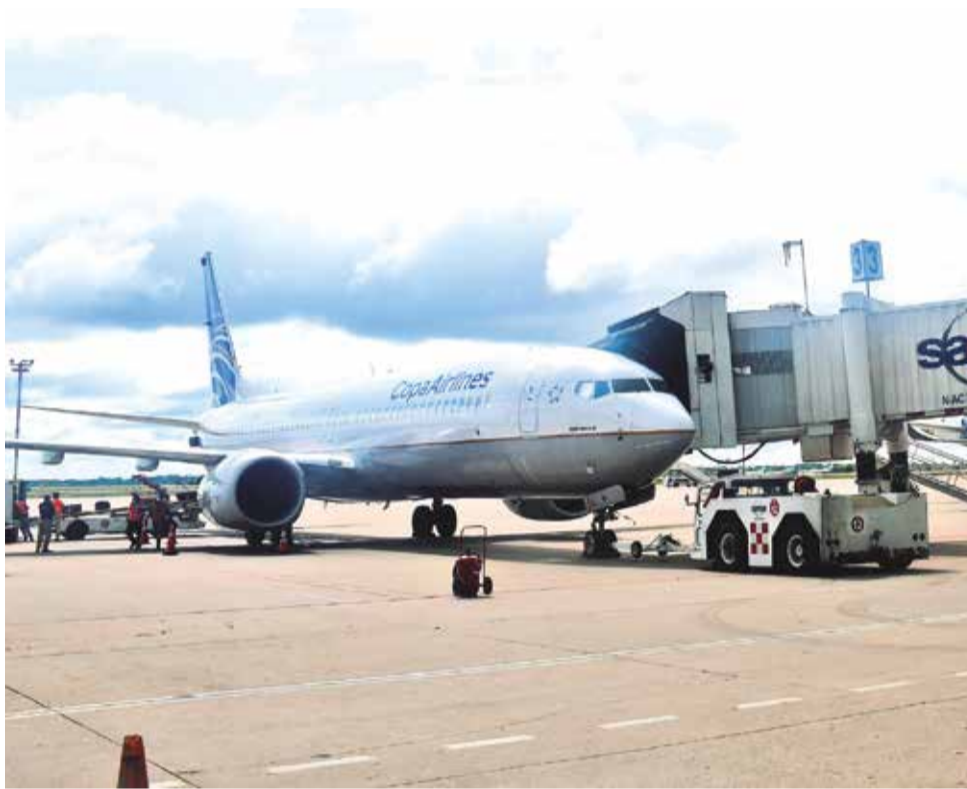
Un avión de Copa Airlines en el aeropuerto de Viru Viru. CARLOS LÓPEZ

La crisis afecta directamente al turismo receptivo y a la conectividad internacional del país. Linares advirtió que muchas aerolíneas están considerando seriamente abandonar el mercado boli-