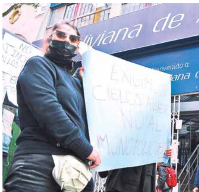
Protesta de dueños de agencias de viaje en La Paz, ayer. APG

Según expertos, el futuro de la conectividad aérea en Bolivia depende de una acción rápida y coordinada entre el Gobierno y las partes involucradas. Sin medidas concretas, el país corre el riesgo de quedar cada vez más aislado, con graves consecuencias para su desarrollo económico y social.