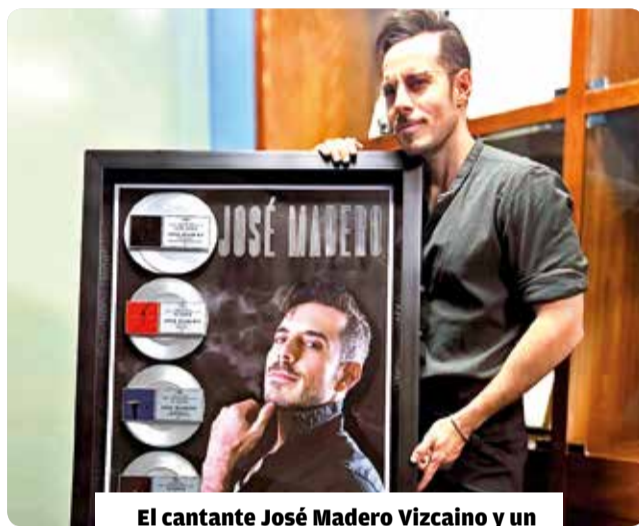
El cantante José Madero Vizcaino y un grupo de fans en La Paz.

El artista mexicano explicó que en su reciente lanzamiento explora nuevos horizontes y estilos, apoyándose