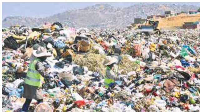
Disposición de basura en el relleno de K'ara K'ara. C. LÓPEZ

Cierre. La Alcaldía de Cochabamba busca empresas interesadas a pocos meses de que concluya el plazo para el cierre del botadero