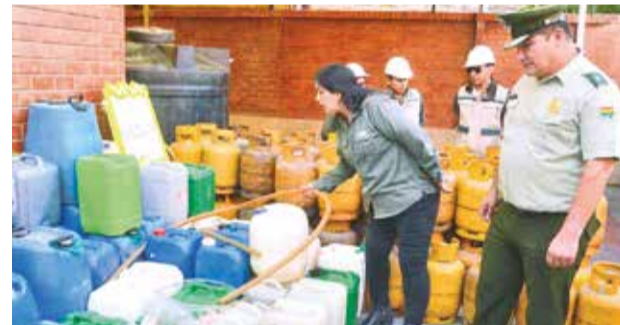
La ANH presenta el combustible incautado, ayer.

Destacó que los despachos de combustibles han mejorado significativamente en los primeros nueve días de di-