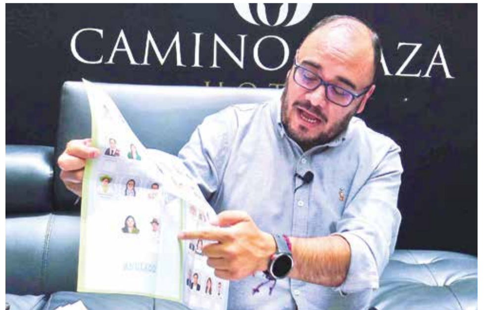
El vocal del TSE Gustavo Ávila, en una capacitación ayer en Cochabamba.

Ávila admitió las dificultades para concretar este proceso electoral que además es parcelado, pero convocó a la población a participar del proceso.