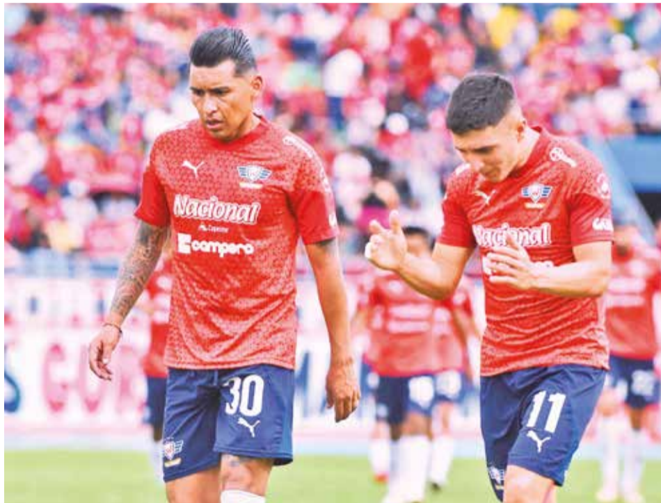
Los jugadores de Wilstermann tras la derrota ante Aurora, el domingo.

A Wilstermann le espera un 2025 más complicado que este año, ya que, aunque consiga clasificarse a un torneo internacional, su situación económica es muy complicada,