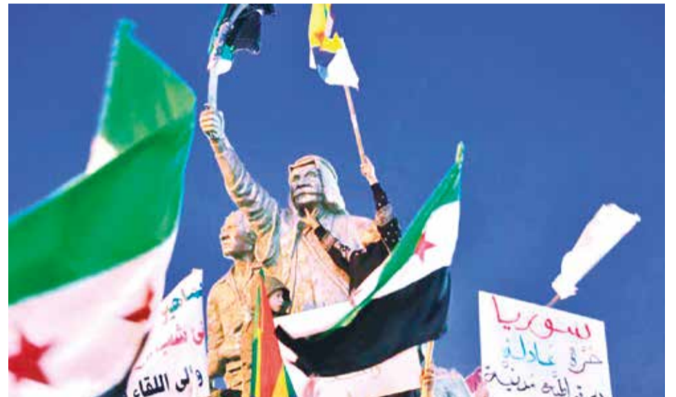
Partidarios de la oposición siria ondean su bandera y la bandera drusa.

El camino de la resolución 2254 de 2015 de la ONU ofrece una base para el escenario más deseable por la comunidad internacional.