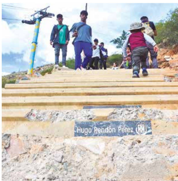
Las gradas dañadas en la subida al Cristo ayer. JOSÉ ROCHA

“Han destrozado el sistema de riego, han jalado las mangueritas que se conectan hacia los plantines y han robado dos reflectores más, entonces creo que esto no es coincidencia, ha sido bien planificado y lo han hecho durante el periodo que la guardia no estaba”, añadió.