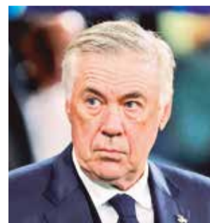
Carlo Ancelotti, DT de Real Madrid.

Por ahora, Real Madrid está en zona de play-off y en busca de revalidar la corona obtenida en la pasada edición. Es el equipo 24 de la tabla general con 6 puntos y esta tarde (16:00 HB) visitará a Atalanta (11 puntos, puesto 5) para tratar de