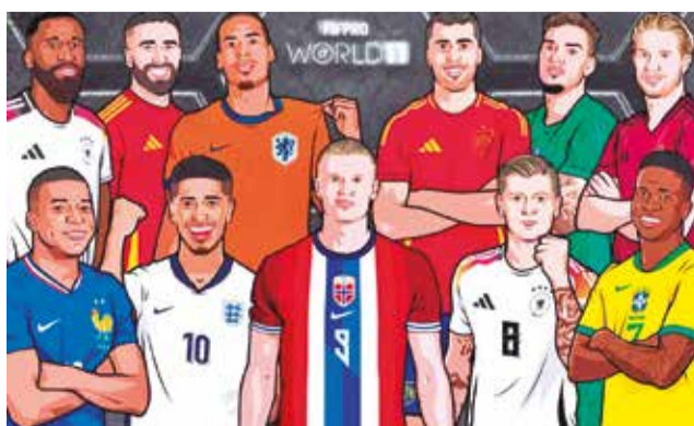
El once ideal de la FIFpro 2024. FIFPRO

En el once ideal también se encuentra el español Rodri