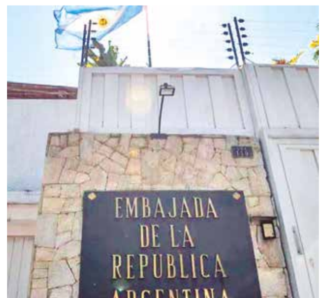
La residencia de la embajada argentina en Caracas, Venezuela.

El pasado sábado, el Gobierno de Argentina exigió a la Administración de Nicolás Maduro la "inmediata" entrega de los salvoconductos que garanticen la salida, sin ser detenidos, de los seis antichavistas, una solicitud que también han hecho otros países como Costa Rica, Uruguay y Estados Unidos en los últimos días. Desde agosto, la embajada está bajo la protección de Brasil —luego de la expulsión de los argentinos—.