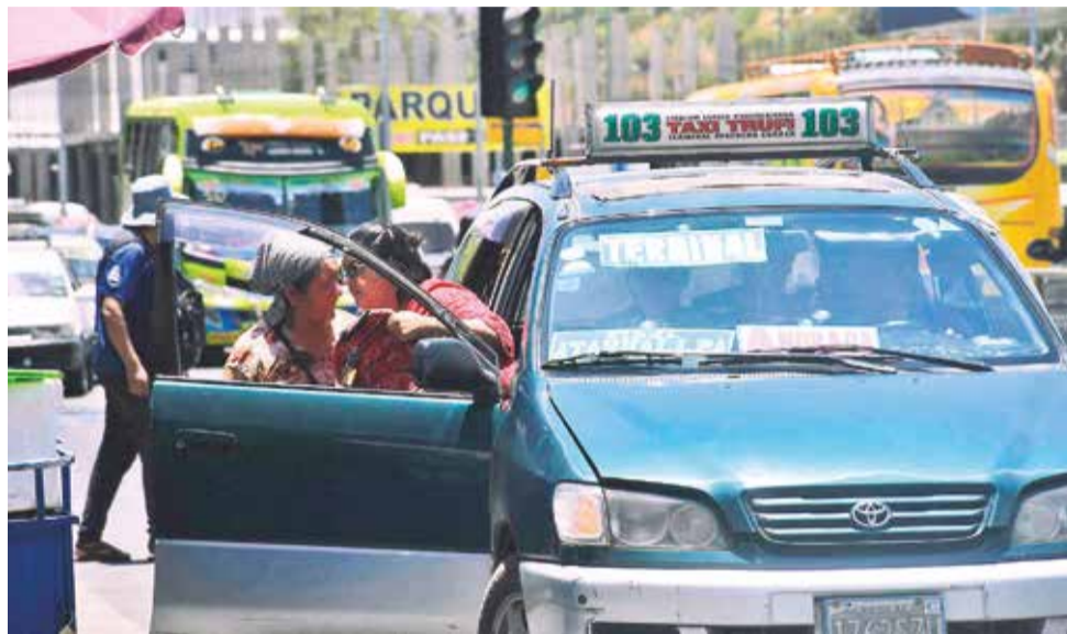
Algunas líneas del transporte público en el centro de la ciudad.

En junio, tras varias reuniones, el transporte y la Alcaldía de Cochabamba resolvieron congelar el costo del pasaje en 2 bolivianos con el compromiso de fijar una nueva en 2025. Tanto la Alcaldía como el Control Social señalan que hay un acuerdo.