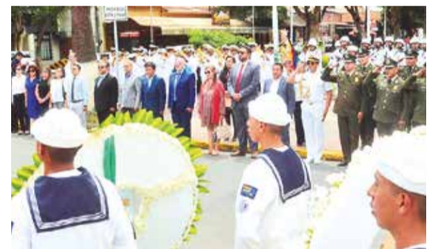
La ofrenda floral por la Independencia de Perú. H. A.

Remarcó que junto a la Policía se realiza la revisión de cámaras de seguridad para intentar ubicar a los responsables e iniciar un proceso legal en su contra.