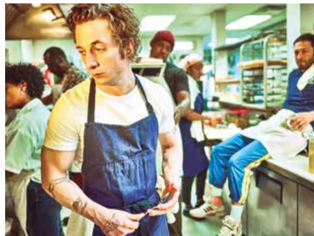
La serie televisiva The Bear .