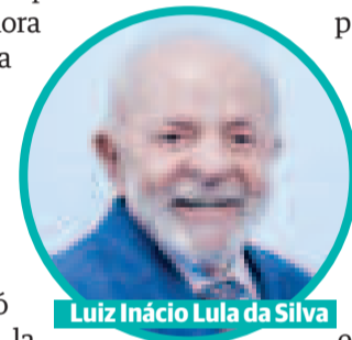
Luiz Inácio Lula da Silva

La operación de este 12 de diciembre fue un complemento de la primera intervención.