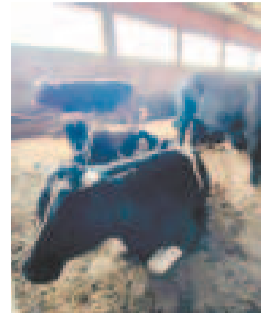
Ganado de contrabando.

El Penal de Morros Blancos se encuentra en la ciudad de Tarija, actualmente cuenta con más de 350 internos por diferentes causas.