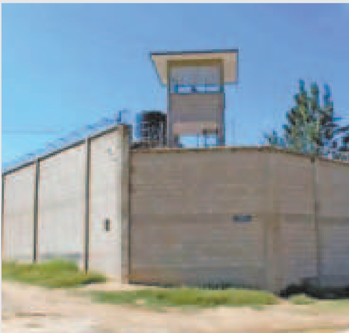
Fachada del penal de Morros Blancos, en la ciudad de Tarija.

Según la fiscal departamental Sandra Gutiérrez, el caso se investiga de oficio y ya se identificaron a dos sospechosos del crimen.