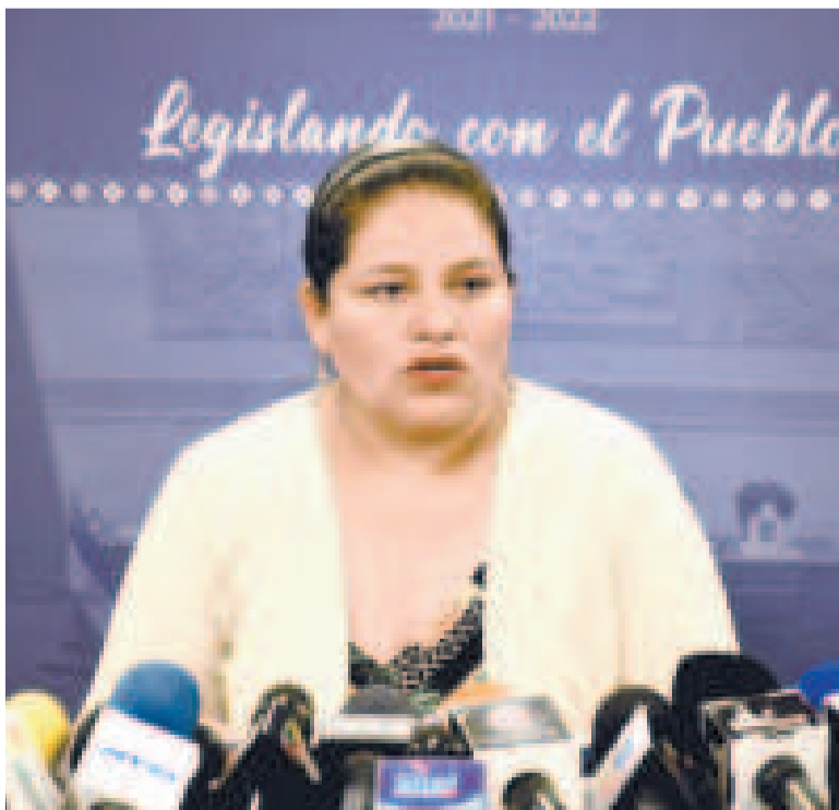
La diputada del MAS-IPSP Deisy Choque.