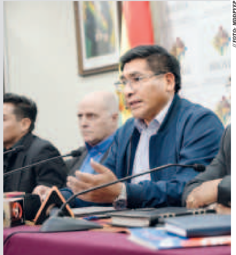
El ministro Néstor Huanca en conferencia de prensa, el martes 10 de diciembre.

El ministro Néstor Huanca afirmó que si se ve el normal abastecimiento de aceite, la suspensión de la exportación será considerada por el Ejecutivo.