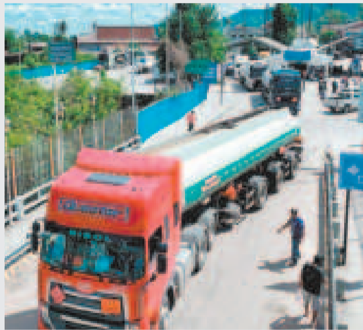
La subvención posibilita estabilizar los precios en el mercado interno.

“El Gobierno hace todos los esfuerzos para garantizar recursos para la subvención de hidrocarburos y alimentos en beneficio de las familias y productores bolivianos”, precisa el Ministerio de Economía y Finanzas Públicas en sus redes sociales.