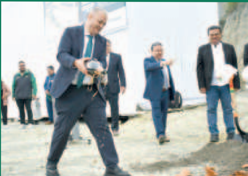
El presidente de la FBF, Fernando Costa, durante la ch'alla de la superficie donde se edificará el CAR.

"Pondremos todo nuestro esfuerzo y capacidad para terminar la obra en los términos del contrato que firmamos. Tenemos 56 años de vida, conocemos perfectamente todas las obras que se pueden hacer y la calidad en que deben ser ejecutadas", manifestó.