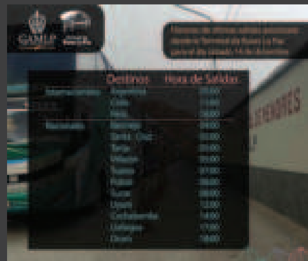
Aviso de salida de buses para el sábado en la terminal de La Paz.

En La Paz anticipó el miércoles la comunicación a los usuarios, indicando que el domingo cierra sus puertas, y retoma actividades el día lunes 16 de diciembre desde las 03.30.