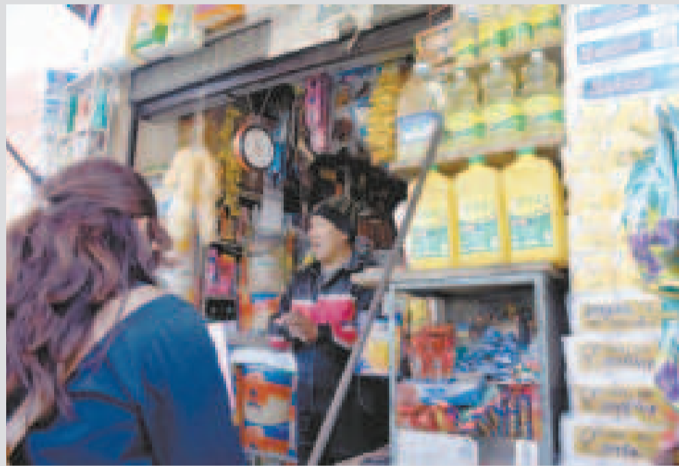
Los controles del Comité de Seguridad Alimentaria evidencian que se normaliza la venta del producto en los mercados.

El Comité de Seguridad Alimentaria continuará con las verificaciones en el mercado para garantizar que el producto llegue hasta los hogares de las familias bolivianas.