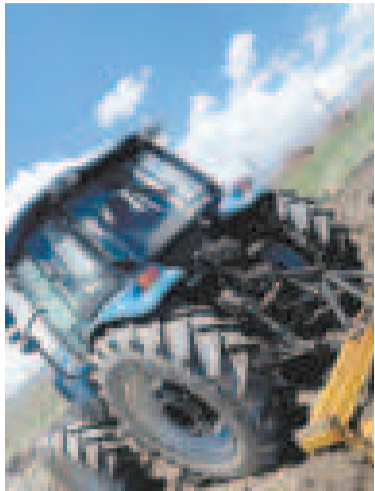
Uno de los proyectos productivos.